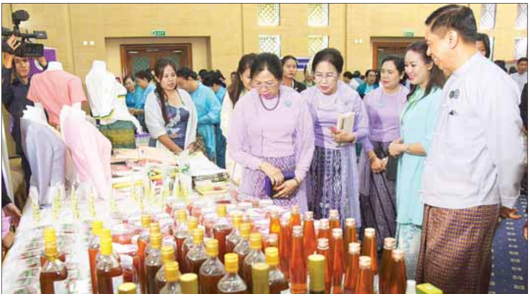
မြန်မာနိုင်ငံ အမျိုးသမီးရေးရာအဖွဲ့ချုပ် ဂုဏ်ထူးဆောင်နာယက နိုင်ငံတော်စီမံအုပ်ချုပ်ရေးကောင်စီဥက္ကဋ္ဌ နိုင်ငံတော်ဝန်ကြီးချုပ်၏ ဇနီး ဒေါ်ကြူကြူလှနှင့် အဖွဲ့ဝင်များ ၂၀၂၄ ခုနှစ် အပြည်ပြည်ဆိုင်ရာအမျိုးသမီးများနေ့ အထိမ်းအမှတ်အဖြစ် ခင်းကျင်းပြသထားသည့် ထုတ်ကုန်ပစ္စည်းများကို လှည့်လည်ကြည့်ရှုစဉ်။

ထို့နောက် မြန်မာနိုင်ငံ အမျိုးသမီးရေးရာအဖွဲ့ ချုပ် ဂုဏ်ထူးဆောင်နာယက ဒေါ်ခင်သက်ဌေး၊ နိုင်ငံ တော်စီမံအုပ်ချုပ်ရေးကောင်စီ အတွင်းရေးမှူး၏ ဇနီးနှင့် မြန်မာနိုင်ငံလုံးဆိုင်ရာ အမျိုးသမီးကော်မတီ ဥက္ကဋ္ဌ ပြည်ထောင်စုဝန်ကြီး ဒေါက်တာစိုးဝင်းတို့က ၂၀၂၄ ခုနှစ် အပြည်ပြည်ဆိုင်ရာအမျိုးသမီးများနေ့ အထိမ်းအမှတ် ဂုဏ်ပြုဆောင်းပါးပြိုင်ပွဲတွင်