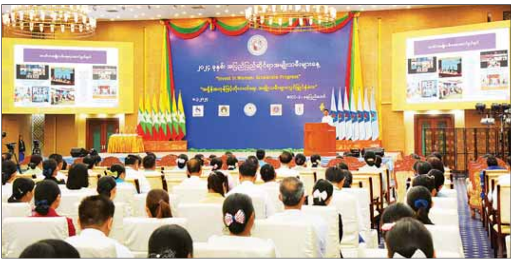
မြန်မာနိုင်ငံလုံးဆိုင်ရာ အမျိုးသမီးကော်မတီဥက္ကဋ္ဌ လှဝေဝေဝေ၊ ကယ်ဆယ်ရေးနှင့် ပြန်လည်နေရာချထားရေးဝန်ကြီးဌာန ပြည်ထောင်စုဝန်ကြီး ဒေါက်တာစိုးဝင်း ၂၀၂၄ ခုနှစ် အပြည်ပြည်ဆိုင်ရာအမျိုးသမီးများနေ့အခမ်းအနားတွင် အမှာစကားပြောကြားစဉ်။

အခမ်းအနားသို့ မြန်မာနိုင်ငံအမျိုးသမီးရေးရာ အဖွဲ့ချုပ် ဂုဏ်ထူးဆောင်နာယက ဒေါ်ခင်သက်ဌေး၊ နိုင်ငံတော်စီမံအုပ်ချုပ်ရေးကောင်စီအတွင်းရေးမှူး၏ဇနီး၊ တွဲဖက်အတွင်းရေးမှူး၏ ဇနီး၊ နိုင်ငံတော်စီမံအုပ်ချုပ်ရေးကောင်စီအဖွဲ့ဝင် ဒေါ်ခွဲသူ၊ ကောင်စီဝင်များ၏ ဇနီးများ၊ ပြည်ထောင်စုအဆင့်ပုဂ္ဂိုလ်များ၊ ပြည်ထောင်စုဝန်ကြီးများနှင့် ၎င်းတို့၏ ဇနီးများ၊ တပ်မတော်အဆင့်မြင့်အရာရှိကြီးများ၏ ဇနီးများ၊ နေပြည်တော်ကောင်စီဥက္ကဋ္ဌ မြန်မာနိုင်ငံတော်ပုဂ္ဂိုလ်