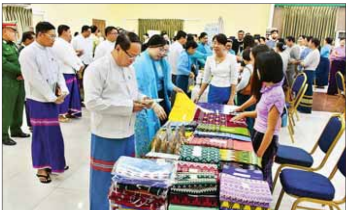
အမှတ် video Clip တို့ကို အတူတကွ ကြည့်ရှုကြသည်။

ပါဝင်ဆောင်ရွက်နေကြပြီး တွေ့ကြုံနေကြသည့် စိန်ခေါ်မှုများနှင့် အခက်အခဲများကို ရင်ဆိုင်ကျော်လွှား၍ အမျိုးသမီးများ၏ စွမ်းဆောင်ရည်ကို ပိုမိုမြှင့်တင်နိုင်ကြပါစေကြောင်း ပြောကြားသည်။