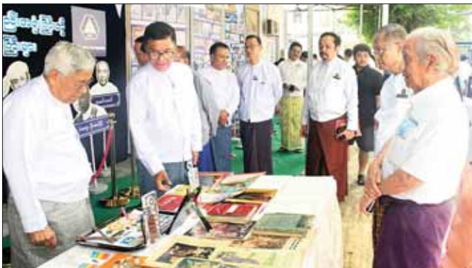
ဒုတိယဝန်ကြီး ဦးရဲတင် မြန်မာနိုင်ငံရုပ်ရှင်နှင့် ပြဇာတ်အစည်းအရုံးကြီးကို စတင်ဦးဆောင်ခဲ့ကြသည့် ပုဂ္ဂိုလ်ကြီးများ၏ မှတ်တမ်းနှင့် ဓာတ်ပုံများကြည့်ရှုစဉ်။

မြန်မာနိုင်ငံရုပ်ရှင်အစည်းအရုံး၏ (၇၈) နှစ်မြောက် နှစ်ပတ်လည်အခမ်းအနားကို ယနေ့ နံနက် ၁၁ နာရီက ရန်ကုန်မြို့ ဗဟန်းမြို့နယ် ဝက်ပါလမ်းရှိ မြန်မာနိုင်ငံရုပ်ရှင်အစည်းအရုံး၌ ကျင်းပရာ ပြန်ကြားရေးဝန်ကြီးဌာန ဒုတိယဝန်ကြီး ဦးရဲတင်၊ မြဝတီစင်တာမှ တာဝန်ရှိသူများ၊ မြန်မာနိုင်ငံရုပ်ရှင်အစည်းအရုံးဥက္ကဋ္ဌနှင့် အဖွဲ့ဝင်များ၊ အနုပညာရှင်များနှင့် ဖိတ်ကြားထားသော ဧည့်သည်တော်များ တက်ရောက်ကြသည်။