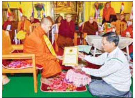
သီပေါမြို့နယ်လုံးဆိုင်ရာ ပရိယတ္တိစာအောင်သံဃာတော်များအား အောင်လက်မှတ် ဆက်ကပ်လှူဒါန်း

အတွက် အလှူရှင်များက အလှူငွေကျပ် ၅၅၅ သိန်းကို ပေးအပ်လှူဒါန်းပြီး မိုးသောက်ပန်းမြေနေရာ ပိုင်ဆိုင်မှု စာရွက်စာတမ်းများကို သက်ဆိုင်ရာ တာဝန်ရှိသူများထံ လွှဲပြောင်းပေးအပ်သည်။ ယင်းနောက် မေတ္တာတော်စံအိမ် မိဘမဲ့ဂေဟာ တည်ဆောက်နိုင်ရေးအတွက် အလှူငွေကျပ် ၄၄၅ သိန်းကို ပေးအပ်လှူဒါန်းပြီး လှူဒါန်းမှု အစုစုတို့အတွက် ရေစက်သွန်းချ အမျှပေးဝေကြသည်။