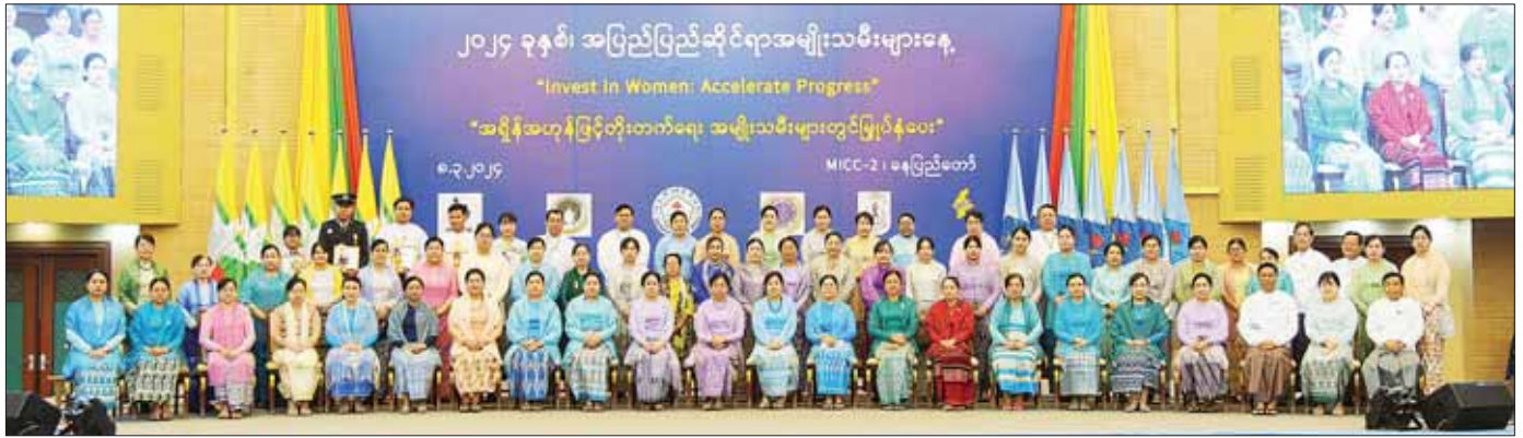
မြန်မာနိုင်ငံ အမျိုးသမီးရေးရာအဖွဲ့ချုပ် ဂုဏ်ထူးဆောင်နာယက နိုင်ငံတော် စီမံအုပ်ချုပ်ရေးကောင်စီဥက္ကဋ္ဌ နိုင်ငံတော်ဝန်ကြီးချုပ်၏ ဇနီး ဒေါ်ကြူကြူလှ ၂၀၂၄ ခုနှစ် အပြည်ပြည်ဆိုင်ရာအမျိုးသမီးများနေ့ အထိမ်းအမှတ်အခမ်းအနားသို့ တက်ရောက်လာကြသူများနှင့်အတူ စုပေါင်းမှတ်တမ်းတင်ဓာတ်ပုံရိုက်စဉ်။

စာမျက်နှာ ၄ မှ တိုင်းဒေသကြီး/ ပြည်နယ်များအထိ ဆောင်ရွက် လျက်ရှိပါကြောင်း၊ မိမိတို့ ဝန်ကြီးဌာနအနေဖြင့် ကျား၊ မ တန်းတူညီမျှရေးဆောင်ရွက်ချက်များ၊ အမျိုး သမီးများ ဖွံ့ဖြိုးတိုးတက်ရေးဆိုင်ရာ လုပ်ငန်းများနှင့် ကာကွယ်စောင့်ရှောက်ရေးဆိုင်ရာ လုပ်ငန်းများကို နိုင်ငံတော်၏မူဝါဒ၊ လမ်းညွှန်ချက်များနှင့်အညီ သက်ဆိုင်ရာဌာန / အဖွဲ့အစည်းများနှင့်အတူ ဆက်လက်ပူးပေါင်း ဆောင်ရွက်သွားမည်ဖြစ်ပါ ကြောင်း ပြောကြားသည်။