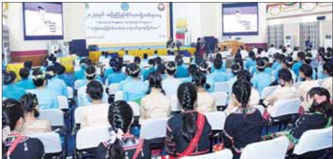
သည် အပြည်ပြည်ဆိုင်ရာအမျိုးသမီးများနေ့အထိမ်း သင်တန်းကျောင်း၊ ပြည်လုံးချမ်းသာပရဟိတဂေဟာ အမှတ်(U.N Message Video Clip)နှင့် အမျိုးသမီးများ နှင့် ဧရိပ်မွန်အမျိုးသမီးကလေးများကျောင်းတို့မှ ဖွံ့ဖြိုးတိုးတက်ရေးဆိုင်ရာ သမိုင်းမှတ်တိုင်များ ကျောင်းသူများက တေးသရုပ်ဖော်အကများဖြင့် (Video Clip)ပြသမှုများ၊ အမျိုးသမီးသက်မွေး ဂုဏ်ပြုတင်ဆက်မှုများကို ကြည့်ရှုအားပေးကြသည်။ အတတ်ပညာသင်ကျောင်း၊ အမျိုးသမီးကလေးများ သတင်းစဉ်

ပါကြောင်း၊ မြန်မာနိုင်ငံလူဦးရေ၏ ထက်ဝက်ကျော်ကို ကိုယ်စားပြုသည့်အမျိုးသမီးများသည် နိုင်ငံအတွက် အလွန်အဖိုးတန်သည့် လူသားအရင်းအမြစ်များဖြစ်ပါ ကြောင်း၊ နိုင်ငံတော်က အမျိုးသမီးများ၏ စွမ်းဆောင် ရည်မြင့်မားရေးနှင့် အမျိုးသမီးများဘဝဖွံ့ဖြိုးတိုးတက် စေရေး၊ ကဏ္ဍစုံတွင်အမျိုးသမီးများနှင့် အမျိုးသား များ တန်းတူပါဝင်ခွင့်ရရှိရေးတို့အတွက် နိုင်ငံတကာ၊ အာဆီယံနှင့် နိုင်ငံအဆင့် လုပ်ငန်းစဉ်မူဝါဒများနှင့် အညီ အမျိုးသမီးကဏ္ဍကို ကျယ်ပြန့်စွာ ဆောင်ရွက် နေပါကြောင်း၊ ကျေးလက်မြို့ပြ ကွာဟချက်နည်းပြီး ကဏ္ဍစုံတွင် အမျိုးသမီးများ၏စွမ်းရည်ကို အသုံးချ နိုင်ရန်နှင့် ယခုနှစ် အပြည်ပြည်ဆိုင်ရာ အမျိုးသမီး များနေ့ ဆောင်ပုဒ်ဖြစ်သည့် “အရှိန်အဟုန်ဖြင့် တိုးတက်ရေး အမျိုးသမီးများတွင် ဖြည့်စွမ်း” ဆောင်ပုဒ်နှင့်အညီ ဝိုင်းဝန်းပူးပေါင်း ကြိုးပမ်း ဆောင်ရွက်ကြရမည်ဖြစ်ကြောင်း ပြောကြားသည်။ ယင်းနောက် တိုင်းဒေသကြီးဝန်ကြီးချုပ်နှင့် အဖွဲ့