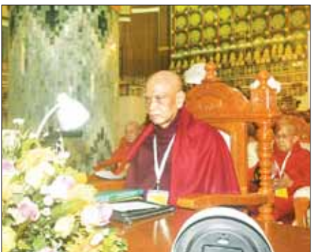
ဆွေအကြိမ်အထိ ရောက်ရှိခဲ့ရာ နှစ်ပေါင်း (၄၅) နှစ် တိုင်ရှိခဲ့ပြီဖြစ်ပါသည်ဘုရား။

မြတ်စွာဘုရားရှင်သည် သာသနာတော်မြတ်ကြီး အရှည်ခန့်၍ တည်တံ့နေစေရေးအတွက် လက်ဆင့်ကမ်း တာဝန်ထမ်းဆောင်တော်မူကြည့် ပဉ္စမဂိုဏ်းပေါ်တို့နှင့်တကွ အဂ္ဂသာဝက မဟာသာဝက စသောသာဝက တပည့်သားရဟန်းတော်တို့ကို ရှင်ရဟန်းပြုပေးတော်မူလျက် စည်းမျဉ်းစည်းကမ်းအဖြစ် ဓမ္မဝိနယတို့ကို ဟောကြားဆုံးမကာ သံယာဉ်အဖွဲ့အစည်းကြီးကို တည်ထောင်တော်မူခဲ့ပါသည်ဘုရား။ သက်တော်ထင်ရှား ဘုရားရှင်လက်ထက် တပည့်သာဝကအဆက်ဆက် မှယုဇုန်မြောက်မြောက်သော သာသနာ့တာဝန် ထမ်းဆောင်တော်မူကြသည့် သံယာဉ်တိုင်အောင် လက်ဆင့်ကမ်းထိန်းသိမ်းလာခဲ့ကြရာ နှစ်ပေါင်း (၂၅၆၅) နှစ်တိုင်ရောက်ရှိလာခဲ့ပြီဖြစ်ပါသည်ဘုရား။ တပည့်တော်တို့၏ တိုင်းဒေသကြီး/ပြည်နယ် အသီးသီး၊ ဂိုဏ်းအသီးသီးမှ သာသနာ့ဥပသတ် ဆရာဆရာ မထေရ်ကြီးများကလည်း ပြည်ထောင်စုသာမဏတ မြန်မာနိုင်ငံတော်အစိုးရများ၏ သာသနာ့ပြုကုသိုလ်အထောက်အပံ့ကို ရယူလျက် ဂိုဏ်းပေါင်းစုံသံယာဉ်အစည်းအဝေးကြီးများကို ကျင်းပကာ သံယာဉ်အဖွဲ့အစည်းအခြေခံစည်းမျဉ်းနှင့် လုပ်ထုံးလုပ်နည်းများ၊ ဝိနည်း၊ ဓမ္မက အဓိကရုဏ်းများ ဖြေရှင်းဆုံးဖြတ်ရေးဆိုင်ရာ လုပ်ထုံးလုပ်နည်းများ၊ သံယာဉ်ယာဉ်ကိစ္စ၊ ဝိနိစ္ဆယလက်စွဲ စသည်တို့ကို အတည်ပြုပြဋ္ဌာန်းတော်မူခဲ့ကြပါသည်။ ယင်းအခြေခံစည်းမျဉ်းလုပ်ထုံးလုပ်နည်းများနှင့်အညီ သံယာဉ်အဖွဲ့အစည်းအဆင့်ဆင့်ကို ဖွဲ့စည်း၍ ထေရဝါဒဗုဒ္ဓသာသနာတော်မြတ်ကြီး သန့်ရှင်းတည်တံ့ပြန့်ပွားရေးဟောသော ဦးတည်ချက်သုံးရပ်ကို ချမှတ်ကာ "သံယာဉ်စွဲ သံယာဉ်ဆောင်ရွက်" မှုအရ သာသနာတော်ကိစ္စရပ်တို့ကို ဆောင်ရွက်လာခဲ့ကြသည်မှာ ပထမအကြိမ် သံယာဉ်အဖွဲ့အစည်းအဆင့်ဆင့် သက်တမ်းမှ အဋ္ဌမအကြိမ် နိုင်ငံတော်ဗဟိုသံယာဉ်ဆောင်အဖွဲ့