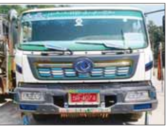
တရားမဝင်ကုန်သွယ်မှုတိုက်ဖျက်ရေးအဖွဲ့၏ စီမံခန့်ခွဲမှုဖြင့် တာဝန်ကျပေးပေါင်းအဖွဲ့များက စစ်ဆေးမှုများ ဆောင်ရွက်ခဲ့ရာ ရွာသာကြီး Dry Port ၌ တရားမဝင်စာရွက်စာတမ်းအထောက်အထား တင်ပြနိုင်ခြင်းမရှိသည့် အမျိုးသမီးတို့ အဝတ်အထည် ၂၈၅၀ အပါအဝင် ကုန်ပစ္စည်းခုနစ်မျိုး (ခန့်မှန်းတန်ဖိုးငွေကျပ် ၄၁၀၀၀၀၀) နှင့် Volvo Tractor Head တစ်စီးနှင့် နောက်တွဲယာဉ်တစ်စီး (ခန့်မှန်းတန်ဖိုးငွေကျပ် ၇၅၀၀၀၀၀) စုစုပေါင်း ခန့်မှန်းတန်ဖိုးငွေကျပ် ၁၁၆၀၀၀၀၀ ကို ဖမ်းဆီးရမိခဲ့ပြီး အကောက်ခွန် လုပ်ထုံးလုပ်နည်းများနှင့်အညီ အရေးယူဆောင်ရွက်လျက်ရှိသည်။

ထို့ပြင် မတ် ၇ ရက်တွင် မန္တလေးတိုင်းဒေသကြီး တရားမဝင်ကုန်သွယ်မှုတိုက်ဖျက်ရေး အဖွဲ့၏ စီမံခန့်ခွဲမှုဖြင့် တာဝန်ကျပေးပေါင်းအဖွဲ့များက စစ်ဆေးမှုများဆောင်ရွက်ခဲ့ရာ (၁၆)မြိုင် ကျောက်ချော စစ်ဆေးရေးစခန်း၌ မော်တော်ယာဉ်နှစ်စီးပေါ်မှ တရားဝင်စာရွက်စာတမ်းအထောက်အထား တင်ပြနိုင်ခြင်းမရှိသည့် Benzyl Cyanide ဟု ယူဆရသော အက်စစ်အရည် လီတာ ၇၂၀၊ Dichloromethane ဟု ယူဆရသော အက်စစ်အရည် လီတာ ၇၂၀၊ (ခန့်မှန်းတန်ဖိုးငွေကျပ် ၇၇၀၄၀၀၀) နှင့် အဆိုပါ ပစ္စည်းများ တင်ဆောင်လာသည့် Dong Feng Truck နှစ်စီး (ခန့်မှန်းတန်ဖိုးငွေကျပ် ၉၀၀၀၀၀၀) စုစုပေါင်း ခန့်မှန်းတန်ဖိုးငွေကျပ် ၁၆၇၀၄၀၀၀ ကို ဖမ်းဆီးရမိခဲ့ပြီး အကောက်ခွန်လုပ်ထုံးလုပ်နည်းများနှင့်အညီ အရေးယူဆောင်ရွက်လျက်ရှိသည်။ သို့ဖြစ်၍ မတ် ၆ ရက်နှင့် ၇ ရက်တို့တွင် ဖမ်းဆီးရမိမှုစုစုပေါင်းမှာ အမှုတွဲ (၁၃) မှု၊ (ခန့်မှန်းတန်ဖိုးငွေကျပ် ၁၀၂၇၀၀၉၆၃) ဖြစ်ကြောင်း တရားမဝင်ကုန်သွယ်မှုတိုက်ဖျက်ရေး ဦးဆောင်ကော်မတီမှ သိရသည်။