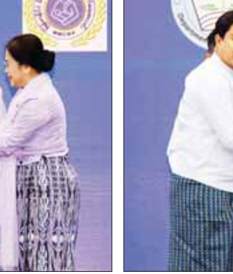
နိုင်ငံတော် စီမံအုပ်ချုပ်ရေးကောင်စီ အတွင်းရေးမှူး၏ ဇနီး ၂၀၂၄ ခုနှစ် အပြည်ပြည်ဆိုင်ရာအမျိုးသမီးများနေ့အထိမ်းအမှတ် ဂုဏ်ပြုဆောင်းပါးပြိုင်ပွဲတွင် တတိယဆုရရှိသူအား ဂုဏ်ပြုဆုတံဆိပ်၊ ဂုဏ်ပြုမှတ်တမ်းလွှာနှင့် ဂုဏ်ပြုဆုငွေများ ပေးအပ်ချီးမြှင့်စဉ်။