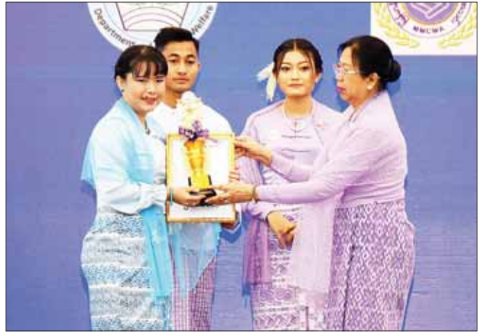
မြန်မာနိုင်ငံအမျိုးသမီးရေးရာအဖွဲ့ချုပ် ဂုဏ်ထူးဆောင်နာယက နိုင်ငံတော် စီမံအုပ်ချုပ်ရေးကောင်စီဥက္ကဋ္ဌ နိုင်ငံတော်ဝန်ကြီးချုပ်၏ ဇနီး ဒေါ်ကြူကြူလှ ၂၀၂၄ ခုနှစ် အပြည်ပြည်ဆိုင်ရာအမျိုးသမီးများနေ့ အထိမ်းအမှတ် ဂုဏ်ပြုဆောင်းပါးပြိုင်ပွဲတွင် ပထမဆုရရှိသူအား ဂုဏ်ပြုဆုတံဆိပ်၊ ဂုဏ်ပြုမှတ်တမ်းလွှာနှင့် ဂုဏ်ပြုဆုငွေ ပေးအပ်ချီးမြှင့်စဉ်။

ဘဏ်ဥက္ကဋ္ဌ၊ ပြည်ထောင်စုတရားလွှတ်တော်ချုပ် တရားသူကြီးများ၊ နိုင်ငံတော်ဖွဲ့စည်းပုံအခြေခံဥပဒေဆိုင်ရာခုံရုံးအဖွဲ့ဝင်များ၊ ဒုတိယဝန်ကြီးများနှင့် ဇနီးများ၊ နေပြည်တော်တိုင်းစစ်ဌာနချုပ်တိုင်းမှူး၏ဇနီး၊ ဒုတိယစာရင်းစစ်ချုပ်၊ ပြည်ထောင်စုရာထူးဝန်အဖွဲ့ဝင်များ၊ အဂတိလိုက်စားမှုတိုက်ဖျက်ရေးကော်မရှင်အဖွဲ့ဝင်များ၊ မြန်မာနိုင်ငံအမျိုးသားလူ့အခွင့်အရေးကော်မရှင်အဖွဲ့ဝင်များ၊ ဌာနဆိုင်ရာအကြီးအကဲများ၊ အမျိုးသမီးများဆိုင်ရာအသင်းအဖွဲ့များမှ ဥက္ကဋ္ဌများ၊ ဒုတိယဥက္ကဋ္ဌများနှင့် အဖွဲ့ဝင်များ၊ အထူးဖိတ်ကြားထားသူများနှင့် တာဝန်ရှိသူများ တက်ရောက်ကြသည်။