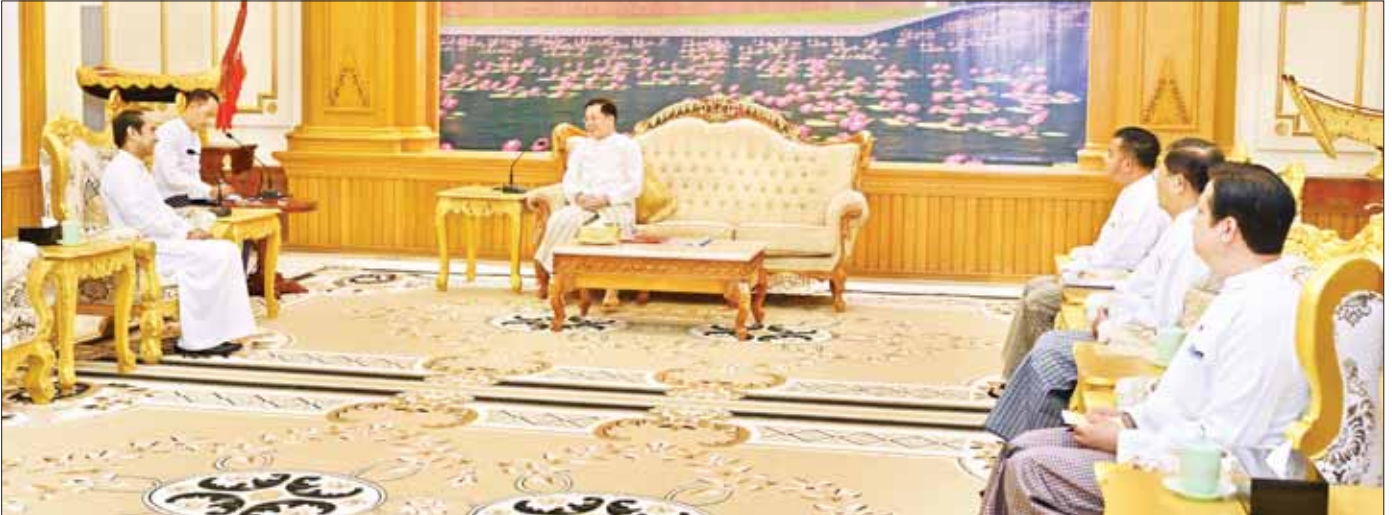
နိုင်ငံတော်စီမံအုပ်ချုပ်ရေးကောင်စီဥက္ကဋ္ဌ နိုင်ငံတော်ဝန်ကြီးချုပ် ဗိုလ်ချုပ်မှူးကြီး မင်းအောင်လှိုင် မြန်မာနိုင်ငံဆိုင်ရာ သီရိလင်္ကာနိုင်ငံ သံအမတ်ကြီး H.E. Mr. J.M.J.P. Bandara အား လက်ခံတွေ့ဆုံစဉ်။

“ခရီးသွားလုပ်ငန်းများ တိုးတက်ရေးအတွက် ပူးပေါင်းဆောင်ရွက် ရေးဆိုင်ရာ ကိစ္စရပ်များ၊ နှစ်နိုင်ငံအကြား ကုန်သွယ်မှုများ မြှင့်တင် ရေးနှင့် ရင်းနှီးမြှုပ်နှံမှုများတွင် ပူးပေါင်းဆောင်ရွက်ရေးဆိုင်ရာ ကိစ္စရပ်များ၊ ပညာရေးဆိုင်ရာများတွင် အပြန်အလှန် ပူးပေါင်း ဆောင်ရွက်ရေးဆိုင်ရာ ကိစ္စရပ်များနှင့်စပ်လျဉ်း၍ ရင်းနှီးပွင့်လင်းစွာ အမြင်ချင်းဖလှယ်ဆွေးနွေး ”