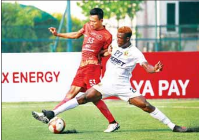
ရှမ်းယူနိုက်တက်အသင်းနှင့် Glory Goal အသင်း ယှဉ်ပြိုင်နေစဉ်။

၂၀၂၄ MNL Cup ပြိုင်ပွဲ အုပ်စု (က၊ ခ) ဒုတိယနေ့ ပွဲစဉ်များကို မတ် ၅ ရက်က ဆက်လက်ကျင်းပသည်။ YUSC ကွင်း၌ ကျင်းပသည့်ပွဲတွင် ရှမ်းယူနိုက်တက်အသင်းက Glory Goal အသင်းကို ငါးဂိုးပြတ်အနိုင်ရခဲ့သည်။ နာမည်ကြီး ရှမ်းယူနိုက်တက်အသင်းသည် နှစ်ပွဲဆက်တိုက် ပြတ်အနိုင်ရခဲ့ပြီး ယခုပွဲတွင်လည်း MNL-2 ကလပ် Glory Goal အသင်းကို ဂိုးပြတ်သွင်းယူခဲ့သည်။ ရှမ်းယူနိုက်တက်အသင်းသည် ပွဲထွက်လူစာရင်းကို အပြောင်းအလဲပြုလုပ်ခဲ့သော်လည်း ပြိုင်ဘက်အသင်းနှင့် ကစားသမားအင်အားရောအတွေ့အကြုံပိုင်းပါ ကွာခြားသဖြင့် ဂိုးပြတ် အနိုင်ရခဲ့ခြင်းဖြစ်သည်။ စာမျက်နှာ ၁၉ ကော်လံ ၁ ❖