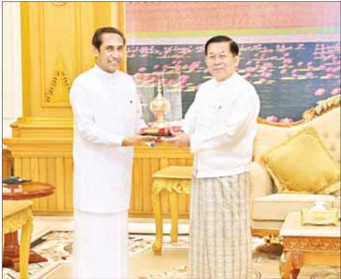
နိုင်ငံတော်စီမံအုပ်ချုပ်ရေးကောင်စီဥက္ကဋ္ဌ နိုင်ငံတော်ဝန်ကြီးချုပ် ဗိုလ်ချုပ်မှူးကြီး မင်းအောင်လှိုင်နှင့် မြန်မာနိုင်ငံဆိုင်ရာ သီရိလင်္ကာနိုင်ငံ သံအမတ်ကြီး H.E. Mr. J.M.J.P. Bandara တို့ အမှတ်တရလက်ဆောင် ပစ္စည်းများ အပြန်အလှန်ပေးအပ်စဉ်။

○ ရှေ့ဖို့မှ ဆောင်ရွက်လျက်ရှိသည့် အခြေ အနေများ၊ မြန်မာနိုင်ငံမှ ရဟန်း သံဃာများနှင့် သာသနာ့နယ်ဝင် သီလရှင်များ သီရိလင်္ကာနိုင်ငံတွင် ပညာ သင်ကြားလျက်ရှိမှုနှင့် သီရိလင်္ကာနိုင်ငံရှိထေရ်ကြီးဝါကြီး ဆရာတော်ကြီးများအား မြန်မာ နိုင်ငံမှ သာသနာတော်ဆိုင်ရာ ဘွဲ့တံဆိပ်တော်များ ဆက်ကပ်ခဲ့မှု အခြေအနေများ၊ ခရီးသွားလုပ်ငန်း များတိုးတက်ရေးအတွက် ပူးပေါင်း ဆောင်ရွက်ရေးဆိုင်ရာ ကိစ္စရပ် များ၊ နှစ်နိုင်ငံအကြား ကုန်သွယ်မှု များ မြှင့်တင်ရေးနှင့် ရင်းနှီးမြှုပ်နှံ မှုများတွင် ပူးပေါင်းဆောင်ရွက် ဆိုင်ရာများတွင် အပြန်အလှန် ပူးပေါင်း ဆောင်ရွက်ရေးဆိုင်ရာ လွတ်လပ်ပြီး တရားမျှတသည့် ရွေးကောက်ပွဲ ကျင်းပနိုင်ရေး ကြိုတင်ပြင်ဆင် ဆောင်ရွက်လျက် ရှိသည့် အခြေအနေများနှင့်