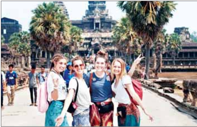
နိုင်ငံက ခရီးသွား ၁၆၃၆၆၀ ဦး၊ စီယက်နမ်နိုင်ငံက ၈၅၇၀၀ နှင့် တရုတ်နိုင်ငံက ၄၆၇၈၁ ဦးရှိသည့် အတွက် ၁၇ ရာခိုင်နှုန်း၊ ၃၃ ရာ ခိုင်နှုန်းနှင့် ၈၇ ရာခိုင်နှုန်း အသီး သီးမြင့်တက်လာကြောင်း သိရ သည်။ ခရီးသွားလုပ်ငန်းသည် ကမ္ဘော ဒီးယားနိုင်ငံ၏ စီးပွားရေးကို ထောက်ပံ့ပေးသော မဏ္ဍိုင်လေးခု အနက်တစ်ခုဖြစ်သည်။ ၂၀၂၃ ခုနှစ် တွင် ကမ္ဘောဒီးယားနိုင်ငံသို့ နိုင်ငံ တကာခရီးသွားဝင်ရောက်မှု ၅ ဒသမ ၄၅ သန်းရှိခဲ့ပြီး ဝင်ငွေ

ဖနောင်ပင် မတ် ၅ ကမ္ဘောဒီးယားနိုင်ငံသို့ ယခုနှစ် ဇန်နဝါရီလတွင် နိုင်ငံတကာခရီး သွား ၅၄၀၀၂၃ ဦး ဝင်ရောက်မှု ရှိခဲ့ကြောင်းနှင့် ယမန်နှစ် ဇန်န ဝါရီလက နိုင်ငံတကာခရီးသွား ဝင်ရောက်မှု ၄၀၂၉၄၃ ဦးရှိသည့် အတွက် ယခုနှစ်တွင် ၃၄ ရာခိုင် နှုန်းအထိ သိသိသာသာမြင့်တက် လာကြောင်း မတ် ၅ ရက်တွင် ခရီး သွားလုပ်ငန်းဝန်ကြီးဌာနက အစီ ရင်ခံဖော်ပြထားသည်။ ယခုနှစ် ဇန်နဝါရီလတွင် ကမ္ဘောဒီးယားနိုင်ငံသို့ ဝင်ရောက် သည့် နိုင်ငံတကာခရီးသွားများ အနက် ထိုင်းနိုင်ငံက အများဆုံး ဖြစ်ပြီး ယင်းနောက်တွင် စီယက် နမ်နှင့် တရုတ်နိုင်ငံတို့က အများ ဆုံးဖြစ်ကြောင်း အဆိုပါအစီရင် ခံစာတွင် ဖော်ပြထားသည်။ ထိုလအတွင်း ကမ္ဘောဒီးယား နိုင်ငံသို့ ဝင်ရောက်သည့် နိုင်ငံ တကာခရီးသွားများတွင် ထိုင်း