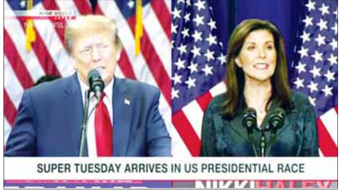
ပျမ်းမျှသဘောတူထောက်ခံနှုန်းတွင် ထရမ်သည် မဲများကို မတ် ၅ ရက် နောင်ပိုင်းတွင် စတင် ဟာလေးကို အမှတ် ၆၀ အသာဖြင့် ဦးဆောင်လျက် ရေတွက်မည်ဖြစ်သည်။ အင်န်အိတ်ချ်ကော

ရွေးကောက်ပွဲများကို မတ် ၅ ရက်တွင် ပြည်နယ်ပေါင်း ၁၅ ခု၌ ကျင်းပခဲ့သည်။ ရွေးကောက်ပွဲတွင် သမ္မတဟောင်း ဒေါ်နယ် ထရမ်သည် ရီပတ်ဘလီကင်ပါတီ၏ သမ္မတလောင်း အဖြစ် ဦးဆောင်လျက်ရှိသည်။ ယခုအချိန်အထိ ဒေါ်နယ်ထရမ်သည် ပြည်နယ်ရှစ်ခုနှင့် အမေရိကန် ဗဟိုကျွန်းဒေသတွင် အောင်မြင်မှုများရရှိလျက် ရှိသည်။ ကုလသမဂ္ဂပုံစံအမတ်ဟောင်း နစ်ကီဟာလေး သည် ကိုလံဘီယာဒေသ၌ ကျင်းပသော ပါတီကိုယ်စား လှယ်အကြံရွေးကောက်ပွဲ၌ အနိုင်ရရှိခဲ့သည်။ နိုင်ငံတစ်ဝန်း သဘောထားစစ်တမ်းကောက်ယူမှု