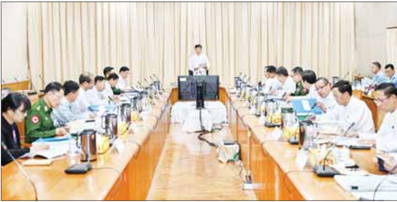
စက်သုံးဆီဆိုင်များနှင့်ပတ်သက်ပြီး အဆင်ပြေချောမွေ့စွာ ရောင်းချနေမှုများအား အချိန်နှင့်တစ်ပြေးညီသိရှိနိုင်ရန် ၂၀၂၃ ခုနှစ်၊ နိုဝင်ဘာလ ၁၄ ရက်နေ့မှ ၂၀၂၄ ခုနှစ်၊ ဖေဖော်ဝါရီလ ၂၉ ရက်နေ့အထိ ပြည်ထောင်စုနယ်မြေ၊ နေပြည်တော်အပါအဝင် တိုင်းဒေသကြီး/ ပြည်နယ်များရှိ စက်သုံးဆီ Terminal များနှင့် စက်သုံးဆီ အရောင်းဆိုင်များအား CCTV Link ချိတ်ဆက်ပြီးစီးမှုအနေဖြင့် စုစုပေါင်း Terminal (၈) ခုနှင့် စက်သုံးဆီဆိုင် (၅၉၃) ဆိုင်အား ချိတ်ဆက် ဆောင်ရွက်ပြီး ဖြစ်ပါကြောင်း။

နေပြည်တော် မတ် ၅ ကုန်သွယ်မှုနှင့် ကုန်စည်စီးဆင်းမှုများ မှန်ကန်မြန်ဆန်စေရေးပဟိုက်မတီ၏ (၂/၂၀၂၄) ကြိမ်မြောက် လုပ်ငန်းညှိနှိုင်း အစည်းအဝေးကို ၂၀၂၄ ခုနှစ်၊ မတ်လ ၅ ရက်နေ့ မွန်းလွဲ ၂ နာရီတွင် နေပြည်တော်ရှိ ပြည်ထောင်စုအစိုးရအဖွဲ့ရုံး၊ ရုံးအမှတ် (၁၈) ၌ ကျင်းပပြုလုပ်ခဲ့ရာ ကုန်သွယ်မှုနှင့် ကုန်စည်စီးဆင်းမှုများ မှန်ကန်မြန်ဆန်စေရေး ပဟိုက်မတီ ဥက္ကဋ္ဌ၊ နိုင်ငံတော်စီမံအုပ်ချုပ်ရေး ကောင်စီအဖွဲ့ဝင်၊ ဒုတိယဝန်ကြီးချုပ်နှင့် ပိုဆောင်ရေးနှင့် ဆက်သွယ်ရေးဝန်ကြီး ဌာန ပြည်ထောင်စုဝန်ကြီး ဗိုလ်ချုပ်ကြီး မြထွန်းဦး တက်ရောက် အမှာစကား ပြောကြားခဲ့သည်။ (ယာဝုံ)