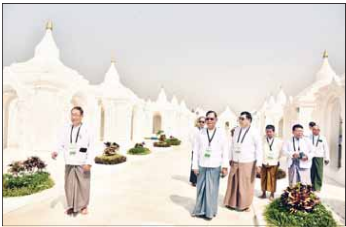
မာရဝိဇယဗုဒ္ဓရုပ်ပွားတော်မြတ်ကြီးနှင့် အခြားသာသနိကအဆောက်အဦများကို တနင်္သာရီတိုင်းဒေသကြီးအတွင်းရှိ ဂေါပကအဖွဲ့ဝင်များ ဖူးမြော်ကြည့်ညိကြစဉ်။