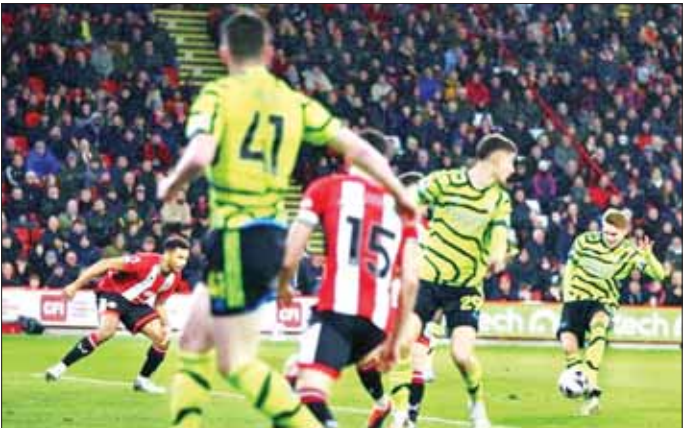
ရှက်ဖွေလိမ့်မည် အာဆင်နယ်အသင်းတို့ ယှဉ်ပြိုင်ကစားစဉ်။

မတ် ၅ ရက် နံနက် ၂ နာရီခွဲက ယှဉ်ပြိုင်ကစားခဲ့သော ပရီမီယာလိဂ်ပွဲစဉ် (၂၇) မှ ရှက်ဖွေလိမ့်မည် အာဆင်နယ်အသင်း ပွဲစဉ်တွင် အာဆင်နယ်အသင်းက တိုက်စစ်ခြေစွမ်းပြကာ ခြောက်ဂိုးပြတ် အနိုင်ရရှိပြီး ဦးဆောင်သူ လီဗာပူးအသင်းကို ဆက်လက်မိအားပေးနိုင်ခဲ့သည်။