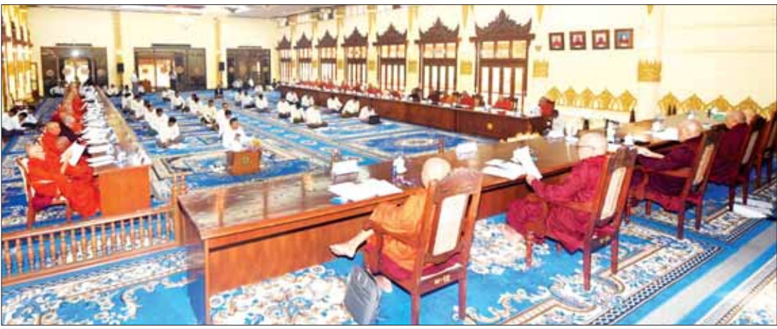
အဋ္ဌမအကြိမ် နိုင်ငံတော်သံဃမဟာနာယကအဖွဲ့ ၄၇ ပါးစုံညီ သောဠသမအစည်းအဝေး ပထမနေ့တွင် ပြည်ထောင်စုဝန်ကြီး ဦးတင်ဦးလွင် သာသနာရေးဆိုင်ရာများ လျှောက်ထားစဉ်။

ရန်ကုန် မတ် ၅ ပြည်ထောင်စုသမ္မတ မြန်မာနိုင်ငံတော် အဋ္ဌမအကြိမ် နိုင်ငံတော်သံဃမဟာနာယကအဖွဲ့ ၄၇ ပါးစုံညီ သောဠသမအစည်းအဝေး ပထမနေ့ကို ယနေ့နံနက် ၈ နာရီက ရန်ကုန်မြို့ သီရိမင်္ဂလာ ကမ္ဘာ့အေးကုန်းမြေ ဝိဇယမင်္ဂလာ ဓမ္မသင်္ဘော၌ ကျင်းပသည်။