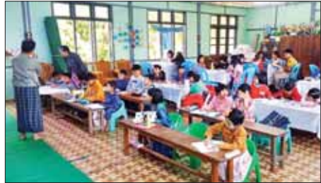
နေရာသီ ပန်းချီအခြေခံရေးဆွဲနည်းသင်တန်းဖွင့်လှစ်

သင်တန်းသား သင်တန်းသူ ၃၀ တက်ရောက် လျက်ရှိပြီး မတ် ၄ ရက်မှ ၁၅ ရက်အထိ အပတ်စဉ် တနင်္လာနေ့မှ သောကြာနေ့တိုင်း နံနက် ၉ နာရီခွဲမှ ၁၁နာရီခွဲအထိ Camera Setting, Composition, Lighting Theory & Direction of Light, Concept, Portrait, Model, Landscape, Family Photo စသည့် ကဏ္ဍများကို စာတွေ့လက်တွေ့ သင်ကြားပို့ချ ပေးမည်ဖြစ်ကြောင်း သိရသည်။ မျိုးသီဟ(ပြန်/ဆက်)