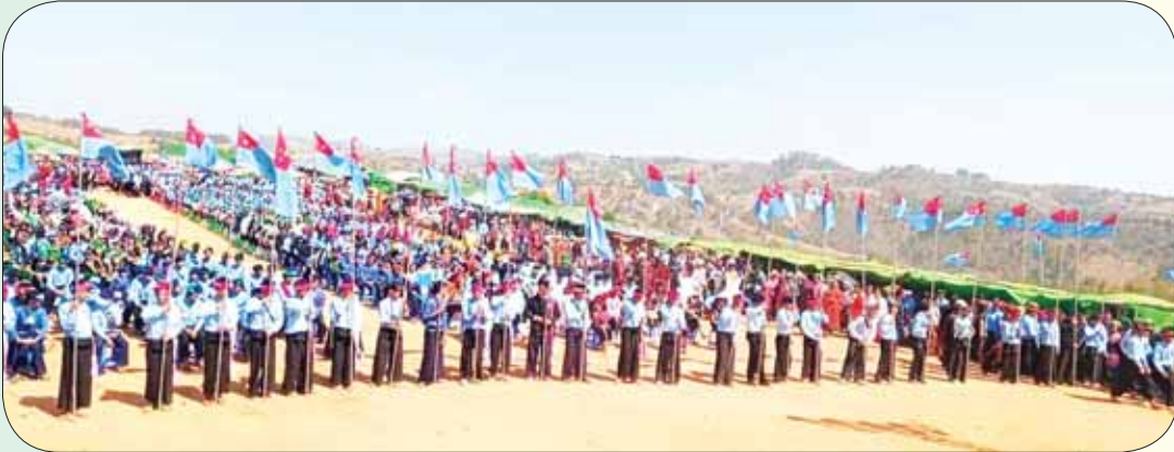
(၁၄)ကြိမ်မြောက် ကျင်းပခဲ့သည့် တောင်ရိုးအမျိုးသားနေ့ အခမ်းအနားမှ မြင်ကွင်းများ။