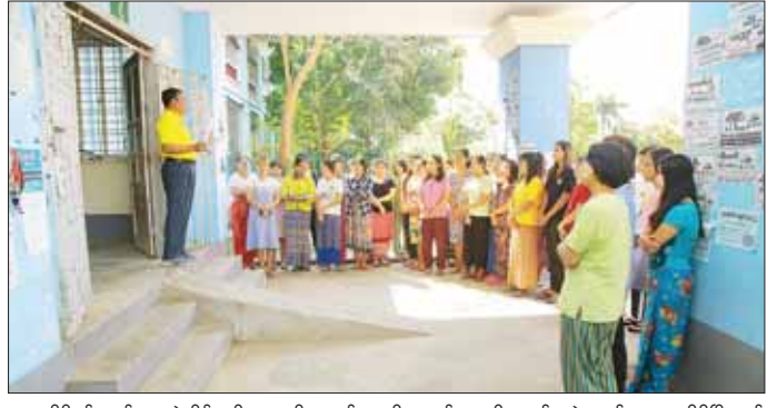
ဝဏ္ဏသိဒ္ဓိရပ်ကွက် ဘူးကွဲအိမ်ရာရှိ အမှုထမ်းအိမ်ရာများနှင့် ဇမ္ဗူသီရိမြို့နယ်ဘောကသိဒ္ဓိရပ်ကွက်ရှိ

နေပြည်တော် မတ် ၂ - အားကစားနှင့် လူငယ်ရေးရာဝန်ကြီးဌာန ဒုတိယဝန်ကြီး ဦးထိန်လင်းသည် တာဝန်ရှိသူများနှင့်အတူ ယနေ့နံနက်ပိုင်းတွင် အားကစားနှင့် လူငယ်ရေးရာဝန်ကြီးဌာန၌ တာဝန်ထမ်းဆောင်လျက်ရှိသည့် နေပြည်တော်ရှိ အရာထမ်း၊ အမှုထမ်းများနေထိုင်သည့် အိမ်ရာများနှင့် လူပျိုဆောင်၊ အပျိုဆောင်များကို လိုက်လံကြည့်ရှု စစ်ဆေးသည်။ (ယာဝုံ)