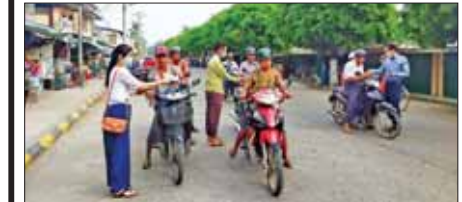
ကြိတ်ခင်းမြို့၌ ပြည်သူ့စစ်မှုထမ်းဥပဒေဆိုင်ရာ သိကောင်းစရာ သတင်းစကား လက်ကမ်းစာစောင်များကို မြို့နယ်ပြန်ကြားရေးနှင့် ပြည်သူ့ဆက်ဆံရေးဦးစီးဌာနနှင့် ဌာနဆိုင်ရာများ ပူးပေါင်းပြီး မတ် ၁ ရက်က လူစည်ကားရာနေရာများတွင် အခမဲ့ဖြန့်ဝေပေးစဉ်။ မြို့နယ်(ပြန်/ဆက်)