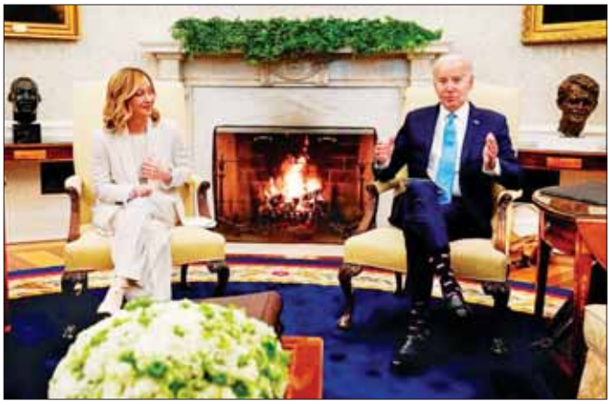
အီတလီဝန်ကြီးချုပ် ဂျော့ဂျီယာမယ်လိုနီနှင့် အမေရိကန်သမ္မတ ဂျိုးဘိုင်းဒင်တို့ တွေ့ဆုံဆွေးနွေးစဉ်။

သမ္မတ ဘိုင်းဒင်သည် သောကြာနေ့က အိမ်ဖြူတော်၌ အီတလီဝန်ကြီးချုပ် ဂျော့ဂျီယာ မယ်လိုနီနှင့် ပြုလုပ်သော ဆွေးနွေးပွဲအဖွင့်တွင် ထိုကဲ့သို့ မှတ်ချက်ပြု ပြောကြားလိုက်ခြင်း ဖြစ်သည်။ ကြောက်မက်ဖွယ် ကောင်းသော စစ်ပွဲအတွင်း ပိတ်မိနေသော အပြစ်မဲ့ပြည်သူ များသည် အလွန်စိုးရိမ်ထိတ်လန့် ကြောက်ရွံ့နေကြကြောင်း၊ ၎င်းတို့၏ မိသားစုများကို ကျွေးမွေးနိုင်ခြင်း မရှိတော့ကြောင်း၊ ဂါဇာကမ်းမြောင်သို့ ထောက်ပံ့မှုများ လာမည့်ရက်များအတွင်း နောက်