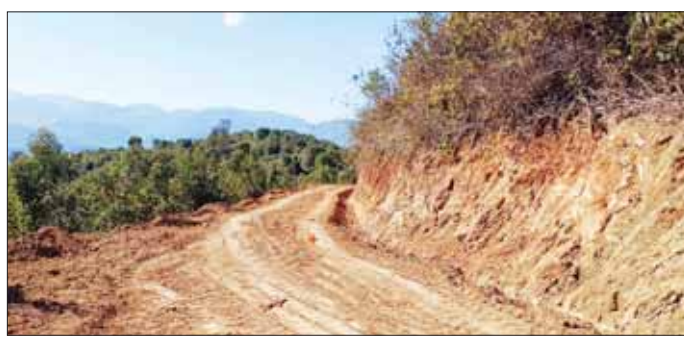
လွှာအင်အဲလ်ကျေးရွာကုန်ထုတ်လမ်း ဖောက်လုပ်နေမှုကို တွေ့ရစဉ်။

တွန်းဇံ မတ် ၂ ချင်းပြည်နယ် တွန်းဇံမြို့နယ် ဆိုင်ပီးရွာလ် ကျေးရွာအုပ်စု လွှာအင်အဲလ်ကျေးရွာ၌ ကျေးရွာ ကုန်ထုတ်လမ်း အကျယ် ၁၂ ပေ၊ အရှည်(၃/၄) မိုင်နှင့် လမ်းဘေး ရေမြောင်းဖောက်လုပ်မှု လုပ်ငန်း များကို မြို့နယ်ကျေးလက်ဒေသ ဖွံ့ဖြိုးတိုးတက်ရေး ဦးစီးဌာန ၏ ၂၀၂၃-၂၀၂၄ ဘဏ္ဍာနှစ် (ပြည်ထောင်စု) ငွေလုံးငွေရင်း ခွင့်ပြုရန်ပုံငွေကျပ် ၈၅ ဒသမ ၇၇ သန်းဖြင့် တင်ဒါအောင် ကုမ္ပဏီမှ ဆောင်ရွက်လျက်ရှိ သည်။ အဆိုပါ ကျေးရွာကုန်ထုတ် လမ်းနှင့် ရေမြောင်းဖောက်လုပ် ခြင်း လုပ်ငန်းများဆောင်ရွက်ပြီးစီး