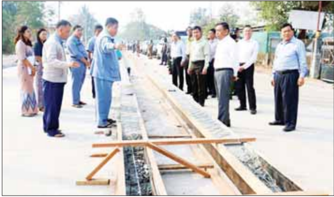
တိုင်းဒေသကြီးဝန်ကြီးချုပ် ဦးမြတ်ကို လမ်းအဆင့်မြှင့်တင်မှုလုပ်ငန်းများအား ကြည့်ရှုစစ်ဆေးစဉ်။

ထို့နောက် တိုင်းဒေသကြီးဝန်ကြီးချုပ်က ထားဝယ်တက္ကသိုလ် ပါမောက္ခချုပ်နှင့် ပါမောက္ခဌာနမှူးများအား သီးခြားတွေ့ဆုံ အားပေးစကားပြောကြားပြီး လိုအပ်သည်များကို ညှိနှိုင်းဆောင်ရွက်ပေးခဲ့ကြောင်း သိရသည်။ တိုင်းဒေသကြီး(ပြန်/ဆက်)