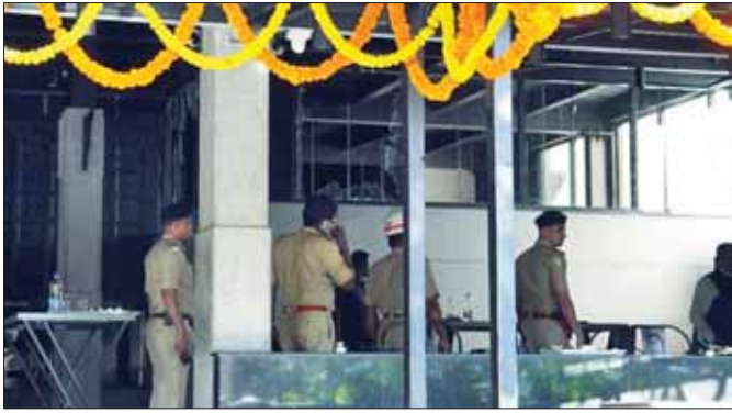
ပေါက်ကွဲမှုဖြစ်ပွားသည့်နေရာကို ရဲများစုံစမ်းစစ်ဆေးဆောင်ရွက်နေစဉ်။

နယူးဒေလီ မတ် ၂ အိန္ဒိယနိုင်ငံတောင်ပိုင်း ဘင်ဂလူရူ မြို့ရှိ ကော်ဖီဆိုင် တစ်ဆိုင်၌ ပေါက်ကွဲမှု ဖြစ်ပွားပြီးနောက် အိန္ဒိယနိုင်ငံမြို့တော် ဒေလီ တစ်ဝိုက်တွင် ရဲတပ်ဖွဲ့က လုံခြုံရေးတိုးမြှင့်ထားပြီး သတ်ပေးမှု များလည်း ထုတ်ပြန်ထားကြောင်း ဒေသတွင်းမီဒီယာများတွင် ဖော်ပြ ထားသည်။ အဆိုပါ ပေါက်ကွဲမှု ကြောင့် ၁၀ ဦးထက် မနည်း ဒဏ်ရာရရှိခဲ့သည်။