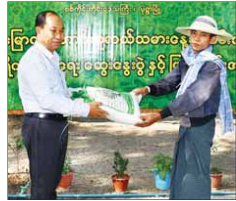
ပေးအပ်သည်။ (အပေါ်ပုံ) ထို့နောက် တိုင်းဒေသကြီး ဝန်ကြီးချုပ်နှင့် တာဝန်ရှိသူများက ဒေသခံတောင်သူများအား ဝါ၊ နေကြာသီးနှံမျိုးစေ့များ၊ ဓာတ်မြေဩဇာများနှင့် ပိုးသတ်ဆေးတူးများ ထောက်ပံ့

တောင်သူလယ်သမားများ၏ဘဝ တိုးတက်မြှင့်တင်ရေးကို အမြဲအလေးထား ဆောင်ရွက်ပေးသွားမည်ဖြစ်ကြောင်း ပြောကြားသည်။ ယင်းနောက် တိုင်းဒေသကြီးအဆင့် ဌာနဆိုင်ရာများက တိုင်းဒေသကြီးအတွင်း စားရေရိက္ခာဖူလုံရေးလုပ်ငန်းများ ဆောင်ရွက်နေမှု အခြေအနေများနှင့် ဆက်လက် ဆောင်ရွက်မည့် လုပ်ငန်း အခြေအနေများအား ရှင်းလင်းပြောကြားသည်။ ဆက်လက်ပြီး တိုင်းဒေသကြီး ဝန်ကြီးချုပ်နှင့် တာဝန်ရှိသူများက ဒေသခံတောင်သူများအား ဝါ၊ နေကြာသီးနှံမျိုးစေ့များ၊ ဓာတ်မြေဩဇာများနှင့် ပိုးသတ်ဆေးတူးများ ထောက်ပံ့