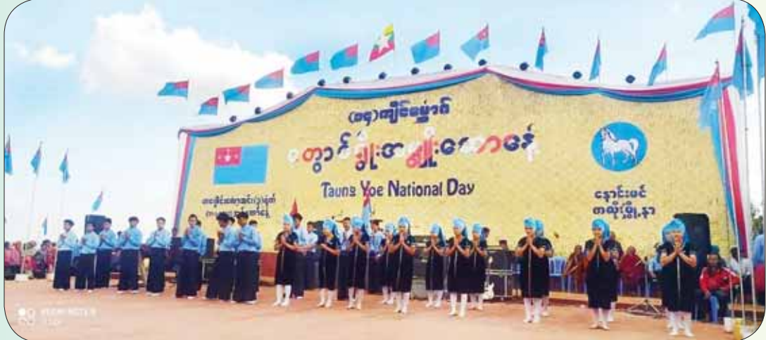
တောင်ရိုးတိုင်းရင်းသားတို့ရဲ့ ရိုးရာဓလေ့ပွဲတော်များ။

လက်ဆင့်ကမ်းကျင်းပနိုင်ဖို့ လိုအပ် ဒီဓလေ့တွေဟာ တောင်ရိုးတိုင်းရင်းသားတွေရဲ့ ရိုးရာဓလေ့ဖြစ်ပြီး ဟိုးအရင်ကတည်းက ရှိခဲ့ကြတာဖြစ်ပေမယ့် နောက်ပိုင်းကာလတွေမှာ ဒီရိုးရာဓလေ့ပွဲတွေကို သိပ်မကျင်းပတော့တာကြောင့် ရိုးရာဓလေ့တွေ မပျောက်ပျက်သွားအောင် လက်ဆင့်ကမ်းကျင်းပနိုင်ဖို့ လိုအပ်နေပါတယ်လို့ ဆည်ခေါင်းကျေးရွာမှာနေထိုင်သူ တောင်ရိုးတိုင်းရင်းသားတစ်ဦးကလည်း စာရေးသူကို ပြောပါတယ်။