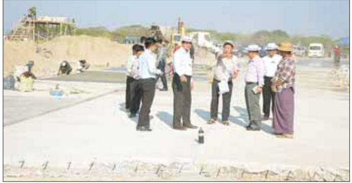
စစ်ဆေးပြီး တာဝန်ရှိသူများအား လိုအပ်သည်များ မှာကြားသည်။ အဆိုပါ ကုန်ထုတ်လမ်းတစ်ခုလုံးခင်းကျင်းပြီးစီးပါက တွဲတေး

ကွန်ကရစ်ခင်း တည်ဆောက်နေမှုကိုလည်းကောင်း ကြည့်ရှုစစ်ဆေးပြီး ညွှန်ကြားရေးမှူး ဦးသက်ဇော်နှင့်တာဝန်ရှိသူများက လုပ်ငန်းဆောင်ရွက်နေမှုများနှင့်ဆက်လက်ဆောင်ရွက်မည့် လုပ်ငန်းများကို ကဏ္ဍအလိုက်ရှင်းလင်းတင်ပြရာ တိုင်းဒေသကြီး ဝန်ကြီးချုပ်က လိုအပ်သည်များ မှာကြားသည်။ ထို့နောက် တိုင်းဒေသကြီးဝန်ကြီးချုပ်နှင့်အဖွဲ့သည် ကွင်းပေါက်ကျေးရွာထိပ်တွင် သောက်ရေကန်တူးဖော်နေမှုကို ကြည့်ရှု