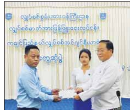
တင်လှူပေးပါကြောင်း ပြောကြားသည်။ ထို့နောက် SPIC ကုမ္ပဏီမှ

ဝန်ကြီး ဦးတိန်ဆောင်က ဒေသတစ်ခုစီ ဦးတိုးတက်ရေး အခြေခံကျသည့် လျှပ်စစ်မီးလင်းရေးအတွက် ယခုလို နေရောင်ခြည်စွမ်းအင်သုံး ဆိုလာစနစ်ဖြင့် လျှပ်စစ်မီးလင်းရေးသည် တောင်ပေါ်ဒေသရှိ ကျေးရွာနေပြည်သူများအတွက် များစွာအကျိုးဖြစ်ထွန်းပါကြောင်း၊ ရစ်ဂျော်ကျေးရွာအား အချိန်တိုကာလအတွင်း ဆိုလာလျှပ်စစ်မီး စံပြစီမံကိန်းဖြင့် မီးလင်းရေးကို ဆောင်ရွက်ပေးနိုင်ခဲ့သည့်အတွက် များစွာကျေးဇူး