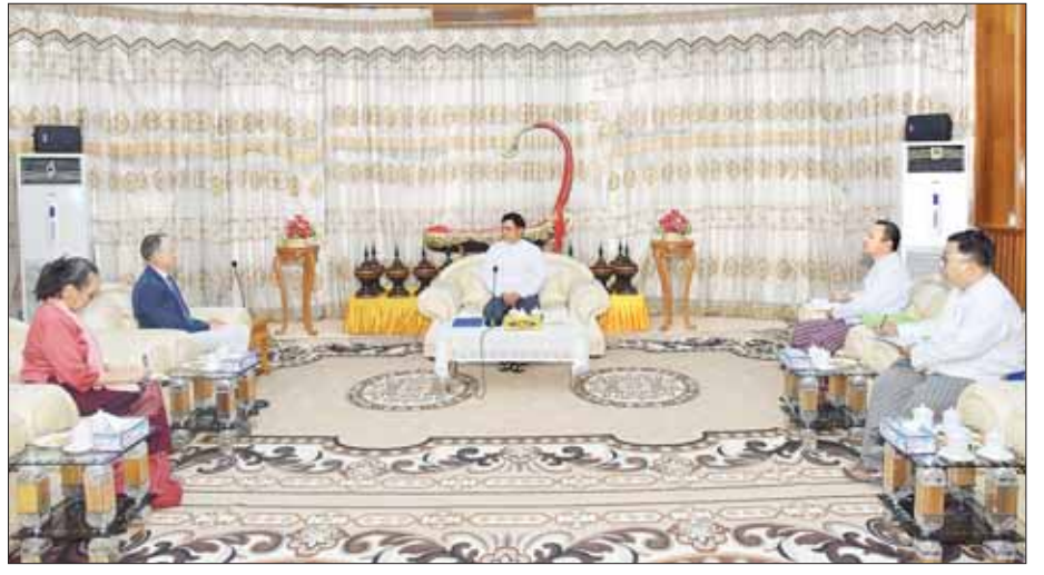
သတင်းစဉ်

တွေ့ဆုံပွဲသို့ ပြည်ထောင်စုဝန်ကြီးနှင့်အတူ တာဝန်ရှိသူများ တက်ရောက်ကြကြောင်း သိရသည်။