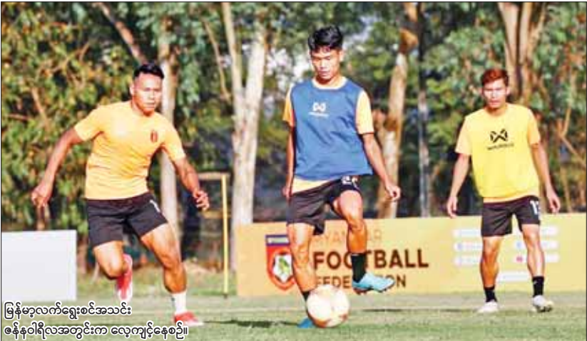
မြန်မာ့လက်ရွေးစင်အသင်း ဇွန်နိုဝါရီလအတွင်းက လေ့ကျင့်နေစဉ်။