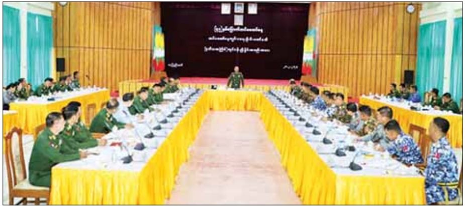
ကော်မတီများနှင့် လုပ်ငန်းအဖွဲ့ များက လုပ်ငန်းဆောင်ရွက်ထား ရှိမှု အခြေအနေများကို အသေး စိတ် ရှင်းလင်းတင်ပြကြရာ လေ့ကျင့်ရေး အရာရှိချုပ် ဒုတိယ ဆောင်ရွက်ပေးခဲ့ကြောင်း သတင်း ရရှိသည်။

တက်ရောက် တပ်မတော်လေ့ကျင့်ရေး အရာရှိ အစည်းအဝေးသို့ တပ်မတော် နေ့ကျင်းပရေး ဦးစီးကော်မတီ ဥက္ကဋ္ဌ တပ်မတော်လေ့ကျင့်ရေး အရာရှိချုပ် ဒုတိယဗိုလ်ချုပ်ကြီး ထိန်ဝင်း၊ ကာကွယ်ရေးဦးစီးချုပ် ရုံးကြည်းမှ တပ်မတော်အရာရှိ ကြီးများ၊ အဖွဲ့ဝင်များနှင့် မြန်မာ နိုင်ငံရဲတပ်ဖွဲ့မှ တာဝန်ရှိသူများ တက်ရောက်ကြသည်။ ဦးစွာ တပ်မတော်နေ့ကျင်းပ ရေး ဦးစီးကော်မတီဥက္ကဋ္ဌ