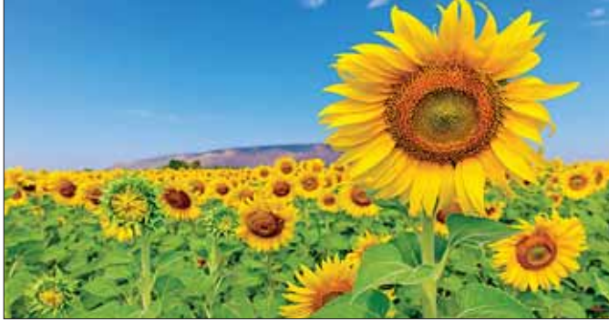
အောင်မြင်ဖြစ်ထွန်းနေသော နေကြာစိုက်ခင်းများကို တွေ့ရစဉ်။

တိုးတက်နေသောလူဦးရေနှင့် ဝင်ငွေတိုးပွားရေး ရည်မှန်းချက်တို့သည် ကမ္ဘာတစ်ဝန်းရှိ မြေယာနှင့် အခြားအရင်းအမြစ်များအပေါ်တွင် ဖိအားပေးလျက် ရှိပြီး စိုက်ပျိုးထုတ်လုပ်မှုသည် အစားအစာ ထောက်ပံ့ပေးနိုင်မှုနှင့် ဖူလုံမှုတို့ကို မြှင့်တင်နိုင်ရေး မှာ အရေးကြီးသော အခန်းကဏ္ဍမှ ပါဝင်နေသည်။ စိုက်ပျိုးရေးကို လုပ်ကိုင်နေကြသော တောင်သူ လယ်သမားတစ်ဦးချင်းစီ၏ လယ်ယာတစ်ဧက အတွင်းမှ ထုတ်လုပ်မှုမြှင့်တင်ရေးသည် အဓိက လိုအပ်ချက်တစ်ခု ဖြစ်လာသည်။