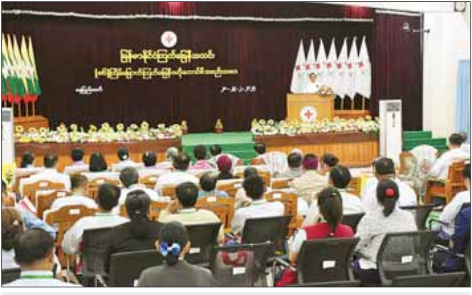
ပြည်ထောင်စုဝန်ကြီး ဒေါက်တာသက်ခိုင်ဝင်း၊ မြန်မာနိုင်ငံကြက်ခြေနီအသင်း (၈၆) ကြိမ်မြောက် ကြက်ခြေနီဗဟိုကောင်စီအစည်းအဝေးတွင် အမှာစကားပြောကြားစဉ်။

နေပြည်တော် ဖေဖော်ဝါရီ ၂၈ မြန်မာနိုင်ငံကြက်ခြေနီအသင်း (၈၆) ကြိမ်မြောက် ကြက်ခြေနီဗဟိုကောင်စီအစည်းအဝေးကို ယနေ့ မွန်းလွဲ ၁ နာရီတွင် နေပြည်တော်ရှိ မြန်မာနိုင်ငံ ကြက်ခြေနီအသင်းဌာနချုပ်၌ ကျင်းပပြုလုပ်သည်။ အစည်းအဝေးသို့ ကျန်းမာရေးဝန်ကြီးဌာန ပြည်ထောင်စုဝန်ကြီး ဒေါက်တာသက်ခိုင်ဝင်း၊ ဒုတိယဝန်ကြီး ဒေါက်တာအေးထွန်း၊ မြန်မာနိုင်ငံစစ်မှန်စစ်မေးဟောင်းအဖွဲ့ဥက္ကဋ္ဌ ဒုတိယဗိုလ်ချုပ်ကြီး စိန်ဝင်း (ငြိမ်း)၊ ကျန်းမာရေးဝန်ကြီးဌာနအောက်ရှိ ဦးစီးဌာနများမှ ညွှန်ကြားရေးမှူးချုပ်များ၊ မြန်မာနိုင်ငံ ကြက်ခြေနီအသင်းဥက္ကဋ္ဌ ပါမောက္ခဒေါက်တာမျိုးညွန့်နှင့် ဒုတိယဥက္ကဋ္ဌ အချိန်ပြည့် အချိန်ပိုင်း အလုပ်အမှုဆောင်များ၊ နီးနယ်ဝန်ကြီးဌာနများမှ ဖိတ်ကြားထားသူများ၊ ကြက်ခြေနီဗဟိုကောင်စီဝင် ပြည်နယ်နှင့် တိုင်းဒေသကြီးများမှ ကြက်ခြေနီ ကြီးကြပ်မှုကော်မတီဥက္ကဋ္ဌများနှင့် ကော်မတီဝင်များ၊ ကြက်ခြေနီတပ်ဖွဲ့မှူးများ၊ အပြည်ပြည်ဆိုင်ရာ ကြက်ခြေနီကော်မတီ၊ အပြည်ပြည်ဆိုင်ရာ ကြက်ခြေနီ နှင့် လခြမ်းနီအသင်းများ ဖက်ရေးရှင်းမှ တာဝန်ရှိသူများ၊ လူမှုရေးအသင်းအဖွဲ့များမှ တာဝန်ရှိသူများ တက်ရောက်ကြသည်။