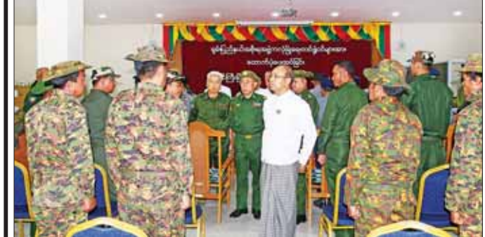
ပြည်နယ်ဝန်ကြီးချုပ် ဦးအောင်အောင်နှင့် တာဝန်ရှိသူများက တပ်ဖွဲ့ ဝင်များအား ရင်းရင်းနှီးနှီးနှုတ်ဆက်စဉ်။

တို့ကလည်းကောင်း၊ နိုင်ငံတော် ကာကွယ်ရေးနှင့် လုံခြုံရေးတာဝန် များ စွမ်းစွမ်းတစ် ထမ်းဆောင် လျက်ရှိသည့် ပြည်နယ်ရဲတပ်ဖွဲ့ ဝင်များအား အရှေ့ပိုင်းတိုင်း စစ်ဌာနချုပ် ဒုတိယတိုင်းမှူး ဗိုလ်မှူးချုပ် ဝင်းဇော်မိုးက ထောက်ပံ့ပစ္စည်းများ ပေးအပ် ရာ ပြည်နယ်ရဲတပ်ဖွဲ့ ဒုတိယ ရဲမှူးကြီး ကျော်ဝင်းလှိုင်က လည်းကောင်း လက်ခံရယူကြ သည်။ ထို့နောက် နိုင်ငံတော် ကာကွယ်ရေးနှင့် လုံခြုံရေး တာဝန်များကို စွမ်းစွမ်းတစ် ထမ်းဆောင်လျက်ရှိသည့် PNO အသွင်ပြောင်း ပြည်သူ့စစ်(ဌာန) အဖွဲ့နှင့် အင်းလေးပြည်သူ့စစ် (ဌာန)အဖွဲ့တို့ကို ပြည်နယ် လုံခြုံရေးနှင့် နယ်စပ်ရေးရာ ဝန်ကြီး၊ ပြည်နယ်စီးပွားရေးရာ ဝန်ကြီးတို့က စားသောက်ဖွယ်ရာ ပစ္စည်းနှင့် ထောက်ပံ့ငွေများ ပေးအပ်ရာ တာဝန်ရှိသူများက လက်ခံရယူကြပြီး ပြည်နယ် ဝန်ကြီးချုပ်နှင့် တာဝန်ရှိသူများ က တပ်ဖွဲ့ဝင်များအား ရင်းရင်း နှီးနှီး လိုက်လံနှုတ်ဆက်ကြ ကြောင်း သိရသည်။ မောင်မောင်သန်း(ပြန်/ဆက်)