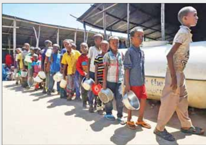
ဆိုမာလီယာနိုင်ငံ မိုဂါဒစ်ရှူးမြို့ အလယ်ပိုင်းရှိ အစားအစာဖြန့်ဖြူးရေးစင်တာတစ်ခု၌ ကလေးငယ်များ အစားအစာရရှိရေး တန်းစီစောင့်ဆိုင်းနေစဉ်။