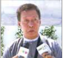
ကျွန်တော်ကတော့ ပဲခူးမြို့က လာတာပါ။ ပဲခူးတိုင်းဒေသကြီးရဲ့

အခြားသာသနိက အဆောက်အအုံများကို ဖူးမြော်လေ့လာကြည့်ပါကြပြီး အလှူငွေများ ပေးအပ်လှူဒါန်းကြသည်။ ထို့အတူ မာရဝိဇယဗုဒ္ဓရုပ်ပွားတော်မြတ်ကြီးအား အနယ်နယ်အရပ်ရပ်မှ ရဟန်းရှင်လူဘုရားဖူးပြည်သူများ လာရောက်ဖူးမြော်ကြည့်ပါလျက်ရှိသည်။ ယနေ့တွင် မာရဝိဇယဗုဒ္ဓ ရုပ်ပွားတော်မြတ်ကြီးအား လာရောက် ဖူးမြော်ခဲ့ကြသည့် အငြိမ်းစား နိုင်ငံဝန်ထမ်းများနှင့် အုပ်ချုပ်မှုအဖွဲ့ဝင်များ၏ ရင်တွင်းစကားသံများကို ယခုလို ကြားသိခဲ့ရသည် -