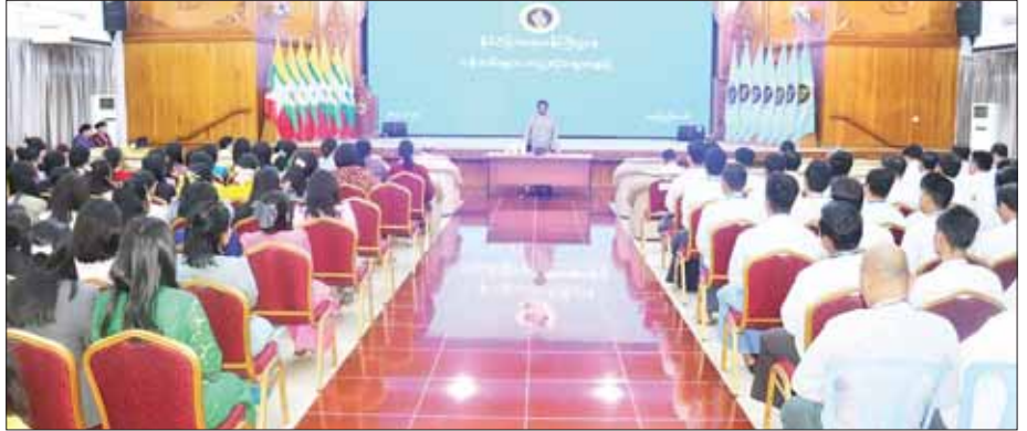
ရှင်းလင်းတင်ပြ

နေပြည်တော် ဖေဖော်ဝါရီ ၂၀ ဒုတိယဝန်ကြီးချုပ်နှင့် နိုင်ငံခြားရေးဝန်ကြီးဌာန ပြည်ထောင်စုဝန်ကြီး ဦးသန်းဆွေသည် သံအမတ်ကြီး၊ ညွှန်ကြားရေးမှူးချုပ်များ၊ မဟာဗျူဟာ လေ့လာရေးနှင့် လေ့ကျင့်ရေးဦးစီးဌာန၊ သံတမန်ရေးရာဦးစီးဌာန၊ ကောင်စစ်ရေးရာနှင့် ဥပဒေရေးရာဦးစီးဌာနနှင့် စီမံကိန်းနှင့် စီမံရေးရာ ဦးစီးဌာနများမှ အရာထမ်း၊ အမှုထမ်းနှင့် ယနေ့မွန်လုပ်ငန်းတွင် နိုင်ငံခြား ရေးဝန်ကြီးဌာန လောကနတ်ခန်းမ၌ တွေ့ဆုံအမှာစကားပြောကြား သည်။ (ယာဝု)