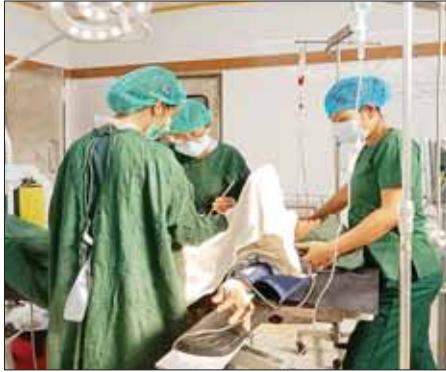
လောက်မောင်းရာမှာခိုခရီးလမ်းမှာ အန္တရာယ်ရှိနိုင်တယ်။ ဘေးလုံး ခွဲစိတ်ကုသဖို့အတွက် အတွေ့ အကြုံရှိတဲ့ စိန်ယာသုနာပြုကြို ခေါ်ပြီးမေးကြည့်ရတယ်။ ဒီလို

သွေးယိုစိမ့်မှုရှိနေသည်ဟု ယူဆ ခဲ့ကြောင်း သိရသည်။ ထို့ကြောင့် အရေးပေါ်သွေးသွင်း ရန် စီစဉ်ရာ လိုအပ်သော သွေးပမာဏ မရှိသည့်အတွက် ကျိုက်ထိုသွေးအလှူရှင်အသင်း ကို ဖုန်းဆက်အကူအညီတောင်းရာ အဆိုပါအသင်း၏ ကူညီမှုဖြင့် အဆင်ပြေခဲ့ကြောင်း သိရသည်။ “သွေးရပြီ လူနာကို ခွဲမလား၊ လွှဲမလားဆိုပြီး ဆွေးနွေးတွေ့ကို ရှင်းပြရတယ်။ ခရိုင်ဆေးရုံကို သွားဖို့ လူနာမတတ်နိုင်ပါဘူး။ လမ်းခရီးကအနည်းဆုံး တစ်နာရီ