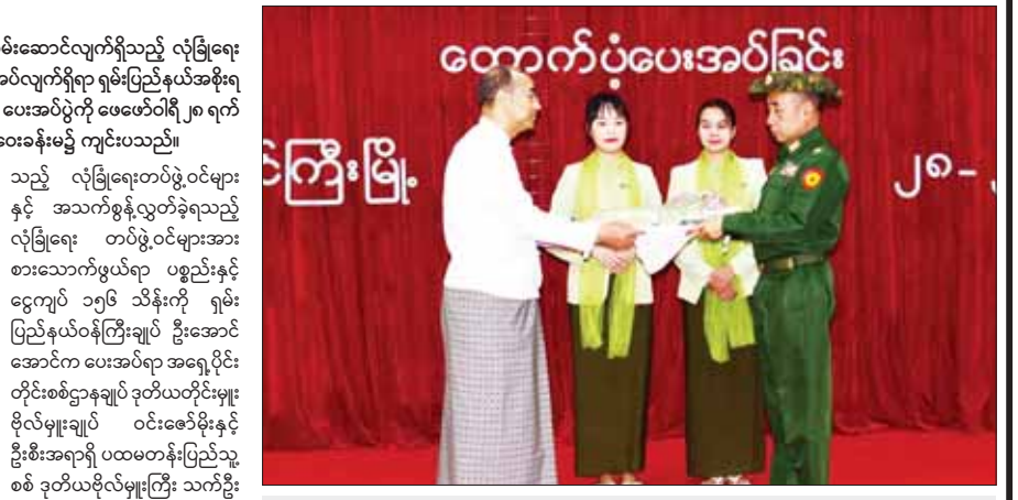
ရှမ်းပြည်နယ်ဝန်ကြီးချုပ် ဦးအောင်အောင် အရှေ့ပိုင်းတိုင်းစစ်ဌာနချုပ် ဒုတိယတိုင်းမှူး ဗိုလ်မှူးချုပ် ဝင်းဇော်မိုးထံ နိုင်ငံတော်ကာကွယ်ရေးနှင့် လုံခြုံရေးတာဝန်များကို စွမ်းစွမ်းတစ်ထမ်းဆောင်လျက် ရှိသည့် လုံခြုံရေးတပ်ဖွဲ့ဝင်များနှင့် အသက်စွန့်လွှတ်ခဲ့ရသည့် လုံခြုံရေးတပ်ဖွဲ့ဝင်များအတွက် စားသောက်ဖွယ်ရာပစ္စည်းနှင့် ငွေကျပ် ၁၅၆ သိန်း ထောက်ပံ့ပေးအပ်စဉ်။

နိုင်ငံတော်ကာကွယ်ရေးနှင့် လုံခြုံရေးတာဝန်များကို စွမ်းစွမ်းတစ်ထမ်းဆောင်လျက်ရှိသည့် လုံခြုံရေး တပ်ဖွဲ့ဝင်များအား စားသောက်ဖွယ်ရာများနှင့် ထောက်ပံ့ငွေများ ပေးအပ်လျက်ရှိရာ ရှမ်းပြည်နယ်အစိုးရ အဖွဲ့နှင့် ပြည်သူများက စားသောက်ဖွယ်ရာများနှင့် ထောက်ပံ့ငွေများ ပေးအပ်ပွဲကို ဖေဖော်ဝါရီ ၂၈ ရက် နံနက် ၉ နာရီခွဲက တောင်ကြီးမြို့ ရှမ်းပြည်နယ်အစိုးရရုံး အစည်းအဝေးခန်းမ၌ ကျင်းပသည်။ ထောက်ပံ့ပေးအပ်ခြင်း အခမ်း အစားတွင် ရှမ်းပြည်နယ်ဝန်ကြီး ချုပ် ဦးအောင်အောင်က နိုင်ငံ တော်၏ လုံခြုံရေးနှင့် ကာကွယ် ရေးတာဝန်များကို တပ်မတော်၊ မြန်မာနိုင်ငံရဲတပ်ဖွဲ့၊ ပြည်သူ့ စစ်တပ်ဖွဲ့များသည် အသက်ကို စောင့်ရှောက်ထားဘဲ တာဝန်ထမ်း ဆောင်နေသော အဖွဲ့များဖြစ် ကြောင်း၊ လိုအပ်သည့် ထောက်ပံ့ မှုမျိုးကိုလည်း ရှမ်းပြည်နယ်