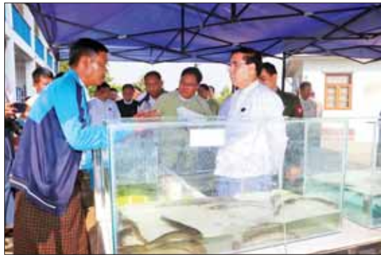
နှင့် ငါးသားဖောက်နည်း သင်တန်းကို ကျောင်းသူများ၊ ဌာနတွင်း ဝန်ထမ်းများ ဖေဖော်ဝါရီ ၂၇ ရက်မှ ၂၈ ရက်အထိ စုစုပေါင်း ၄၁ ဦး တက်ရောက်ကြောင်း ငါးလုပ်ငန်းရှင်များ၊ ပဲခူးတက္ကသိုလ် သိရသည်။ တိုင်းဒေသကြီး(ပြန်/ဆက်)

မရှိစေရေး ကြပ်မတ်ဆောင်ရွက်သွားရန် လိုကြောင်း ပြောကြားသည်။ ထို့နောက် သင်တန်းသား သင်တန်းသူ များနှင့် အမှတ်တရ စုပေါင်းမှတ်တမ်း တင် ဓာတ်ပုံရိုက်ကြပြီး သင်တန်း တက်ရောက်မည့် ငါးလုပ်ငန်းရှင်များ၊ ပဲခူးတက္ကသိုလ် သတ္တဗေဒနောက်ဆုံးနှစ် ကျောင်းသား ကျောင်းသူများ၊ ဌာနတွင်း ဝန်ထမ်းများကို ရင်းရင်းနှီးနှီး နှုတ်ဆက် ပြီး သဘာဝငါးမျိုးများ ပြန့်နှံ့တီးမှုမရှိ စေရေး မျိုးပွားထုတ်လုပ်လျက်ရှိသည့် မျိုးပွားကန်များကို လှည့်လည်ကြည့်ရှု သည်။ (ယာပုံ) အဆိုပါ အခြေခံ ငါးမွေးမြူရေး