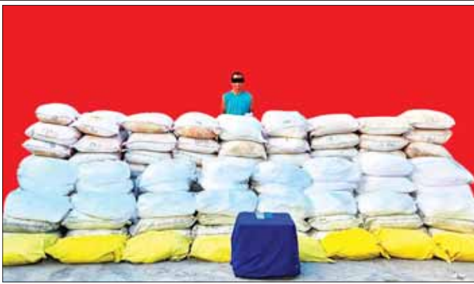
သိမ်းဆည်းရမိသည့် ထိန်းချုပ်စာတုပစ္စည်း ကဖင်းများနှင့်ဖြစ်မှုကျူးလွန်သူကို တွေ့ရစဉ်။

နေပြည်တော် ဖေဖော်ဝါရီ ၂၇ မန္တလေးတိုင်းဒေသကြီး ပြည်ကြီးတံခွန်မြို့နယ်၌ တရားမဝင်သိုလှောင်ထားသည့် ငွေကျပ် ၂ ဘီလီယံတန်ဖိုးရှိ ထိန်းချုပ်စာတုပစ္စည်း ကဖင်း ၅ တန် ဖမ်းဆီးရမိခဲ့ကြောင်း မြန်မာနိုင်ငံရဲတပ်ဖွဲ့မှ သိရသည်။ မူးယစ်ဆေးဝါး တားဆီးနှိမ်နင်းရေးရဲတပ်ဖွဲ့မှ တပ်ဖွဲ့ဝင်များ ပါဝင်သော ပူးပေါင်းအဖွဲ့သည် ဖေဖော်ဝါရီ ၂၇ ရက် ညနေ ၄ နာရီခွဲတွင် မန္တလေးတိုင်းဒေသကြီး ပြည်ကြီးတံခွန်မြို့နယ် ၅၂ လမ်း၊ ၁၃၉ လမ်းထောင့်ရှိ စာမျက်နှာ ၁၀ ကော်လံ ၁ ❖