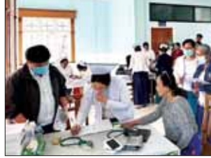
◆ကျော့ဖိုးမှ

ပွဲစဉ် (၁၆) တွင် လက်ရှိချန်ပီယံ VUC အသင်းက Winner Soccer အသင်းကို ငါးဂိုး-တစ်ဂိုး၊ ဖူဆယ်ချစ်သူအသင်းက Generations အသင်းကို သုံးဂိုး-နှစ်ဂိုး၊ Dream Team အသင်းက M2K အသင်းကို လေးဂိုး-နှစ်ဂိုး၊ MIU အသင်းက Futsal-19 အသင်းကို နှစ်ဂိုး-တစ်ဂိုး၊ လင်းလက်အသင်းက လက်ဝဲသွန်အသင်းကို ကိုးဂိုး-တစ်ဂိုးဖြင့် အနိုင် ရခဲ့သည်။ ချန်ပီယံဆုအတွက် Play-off ကစားရမည့် သုံးနေရာအတွက် VUC အသင်းသည် အဆင့် ၁ နေရာဖြင့် ဝင်ခွင့်ရရန် သေချာခဲ့ပြီး ကျန် နှစ်နေရာအတွက် MIU အသင်းသည် နိုင်ပွဲပြန်ရခဲ့သဖြင့် အခွင့်အရေး ပြန်ကောင်းလာသည်။ ပွဲစဉ် (၁၆)အပြီးတွင် VUC အသင်းက ရမှတ် ၄၈ မှတ်ဖြင့် ဆက်လက်ဦးဆောင်နေပြီး MIU အသင်းက ၃၄ မှတ်၊ Generations အသင်းက ၃၂ မှတ်၊ Winner Soccer အသင်းက ၂၉ မှတ်၊ ဖူဆယ်ချစ်သူအသင်းက ၁၉ မှတ်၊ Dream Team အသင်းက ၁၈ မှတ်၊ M2K အသင်းက ၁၇ မှတ်၊ Futsal-19 အသင်းက ၁၆ မှတ်၊ လင်းလက်အသင်းက ၁၄ မှတ်၊ လက်ဝဲသွန်အသင်းက ခုနစ်မှတ် ရရှိ ထားသည်။ ရဲရင့်လွင် ဓာတ်ပုံ-MFF