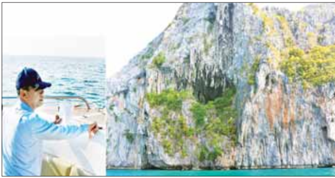
ယင်းနောက် ပြည်ထောင်စု ဝန်ကြီးသည် ကော့သောင်းမြို့နယ်ရှိ သစ်ပင်စိုက်ပျိုးပွဲများတွင် စိုက်ပျိုးခဲ့သော အပင်များ၏ ရှင်သန်အောင်မြင်မှု အခြေအနေနှင့် မြို့မသစ်တောပျိုးပွဲယာဉ်အတွင်း ၂၀၂၄ ခုနှစ်အတွက် လူထုပြန်စိုက်ပျိုးရန် ပျိုးထောင်ထားသောပင်များကို လှည့်လည်ကြည့်ရှုစစ်ဆေးခဲ့ကြောင်း သတင်းရရှိသည်။ သတင်းစဉ်

ထို့နောက် ပြည်ထောင်စု အမျိုးမျိုးသော ဇီဝမျိုးစုံမျိုးကွဲ ဝန်ကြီးက ဇီဝဇီဝမျိုးစေ့များ လာရောက်ကျက်စားနားခိုရာ ကျွန်းများ၏ ဂေဟစနစ်မပျက်အောင် ဆက်လက် ထိန်းသိမ်းသွားရန်လိုကြောင်း၊ တနင်္သာရီတိုင်းဒေသကြီး သည် သာယာလှပသောကျွန်းပေါင်းများစွာ တည်ရှိနေသည့် အတွက် သဘာဝအခြေခံခရီးသွား လုပ်ငန်းအတွက် များစွာအရေးပါသော နေရာတစ်ခုဖြစ်ကြောင်း၊ တည်ရှိနေသော ဂေဟစနစ်နှင့်