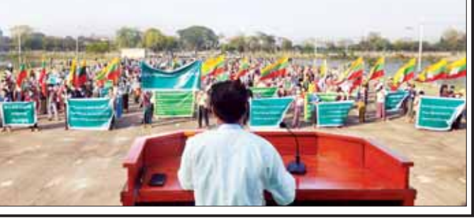
ခရိုင်(ပြန်/ဆက်)

မုံရွာ ဖေဖော်ဝါရီ ၂၇ ပြည်သူ့စစ်မှုထမ်းဥပဒေအား ကြိုဆိုထောက်ခံပွဲအခမ်းအနားကို စစ်ကိုင်းတိုင်းဒေသကြီး မုံရွာမြို့ ကန်သာယာပြည်ထောင်စုကျွန်းရင်ပြင်၌ ယနေ့ နံနက် ၈ နာရီက ကျင်းပရာ ကြိုဆိုထောက်ခံပွဲသို့ မုံရွာမြို့ပေါ်ရပ်ကွက်များနှင့် ကျေးရွာများမှ စုစုပေါင်းပြည်သူအင်အား ၇၅၀ ခန့် တက်ရောက်သည်။ အခမ်းအနားတွင် ပြည်သူ့စစ်မှုထမ်းဥပဒေ ကြိုဆိုထောက်ခံပွဲသို့ တက်ရောက်လာကြသူများက တိုင်းဒေသကြီး ပြည်သူ့အားကစားကွင်း စုရပ် နေရာမှ ဗိုလ်ချုပ်လမ်းအတိုင်း စတင်ထွက်ခွာ၍ လမ်းလျှောက်ဆန္ဒထုတ်ဖော်ကြပြီးနောက် အရှေ့ဘက်ကန်သာကန်ရှိ ပြည်ထောင်စုကျွန်းရင်ပြင် တွင် ပြည်သူ့စစ်မှုထမ်းဥပဒေကို ထောက်ခံပွဲ ကျင်းပရပြန်ပတ်သက်၍ ဆွေးနွေးဟောပြော ကြသည်။ ဆက်လက်ပြီး ပြည်သူ့စစ်မှုထမ်းဥပဒေနှင့် ပတ်သက်၍ အမျိုးသားတစ်ဦးက ထောက်ခံ ဆွေးနွေးပြီး ပြည်သူ့စစ်မှုထမ်းဥပဒေအား ကြိုဆို ထောက်ခံပွဲကို တက်ရောက်လာကြသည့် ရပ်ကွက်/ ကျေးရွာနေ ပြည်သူလူထုများက “ပြည်အင်အား သည် ပြည်တွင်းမှာသာရှိနေဖို့ စစ်ပညာကို သင်ကြ ဖို့” “တစ်မျိုးသားလုံး ကျန်းမာကြံ့ခိုင်ပြီး စစ်ပညာ တတ်မြောက်ရေးအတွက် ပြည်သူ့စစ်မှုထမ်းဥပဒေ ကို ကြိုဆိုထောက်ခံပါသည်” “ဒို့တာဝန်အရေး (၃)ပါး တည်တံ့ခိုင်မြဲဖို့ ပြည်သူ့စစ်မှုထမ်းဥပဒေအား ကြိုဆိုထောက်ခံကြပါမို့” စသည့် ကြွေးကြော်သံ ပုံစံတစ်ဦးဦးများကို ကိုင်ဆောင်ကြ၍ “ပြည်ထောင်စု မပြိုကွဲရေး (ဒို့အရေး)” “တိုင်းရင်းသားစည်းလုံး ညီညွတ်မှုမပြိုကွဲရေး (ဒို့အရေး)” “အချုပ်အခြာ အာဏာတည်တံ့ခိုင်မြဲရေး (ဒို့အရေး)” “ပြည်သူ့ စစ်မှုထမ်းဥပဒေကို (ထောက်ခံပါသည်)” ကြွေးကြော် သံများကို သံပြိုင်ကြွေးကြော်ကာ အခမ်းအနားကို ရုပ်သိမ်းခဲ့ကြောင်း သိရသည်။