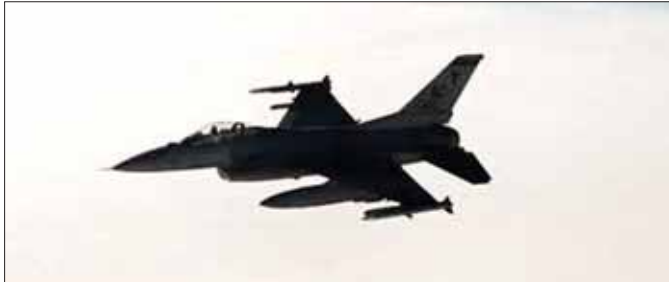
ထားကာ လေကြောင်းတိုက်ခိုက်မှု ဒါဇင်ချီ ပြုလုပ် နှောင်းပိုင်း၌ ယီမင်ပြည်တွင်းစစ်ဖြစ်ပွားပြီးကတည်း ခဲ့သည်။ က ယီမင်နိုင်ငံ မြောက်ပိုင်းဒေသအများအပြားကို လက်နက်ကိုင်ဟုသိအဖွဲ့သည် ၂၀၁၄ ခုနှစ် ထိန်းချုပ်ထားကြောင်း သိရသည်။ ဆင်ဟွာ

အဆိုပါ လေကြောင်းတိုက်ခိုက်မှုများကြောင့် အမေရိကန်နှင့် ဗြိတိန်မဟာမိတ်အဖွဲ့ကလည်း စစ်ဘက် အခြေစိုက်စခန်းတစ်ခုကို ထိခိုက်ခဲ့ကြောင်း နိုင်ငံတကာရေးကြောင်းကုန်သွယ်မှု လွတ်လပ်စွာ ဒေသခံများက ပြောသည်။ လက်နက်ကိုင်ဟုသိအဖွဲ့ သွားလာနိုင်ရေးအတွက် ဟာသီလျှောက်ခံပေးပစ် သည်အစွဲအစားထိုးစစ်ဆင်တိုက်ခိုက်မှုခံနေရသော လောင်ချာများနှင့် အသေခံဒရုန်းများကို ပစ်ခတ်