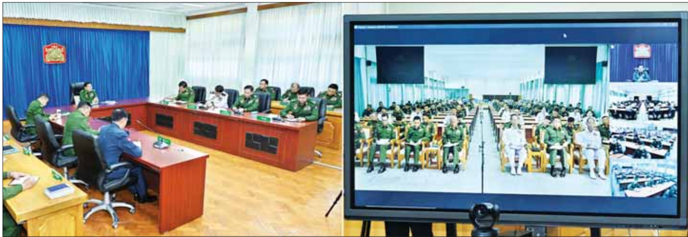
နိုင်ငံတော်စီမံအုပ်ချုပ်ရေးကောင်စီဥက္ကဋ္ဌ တပ်မတော်ကာကွယ်ရေးဦးစီးချုပ် ဗိုလ်ချုပ်မှူးကြီး မင်းအောင်လှိုင် နိုင်ငံတော်ကာကွယ်ရေးတက္ကသိုလ်မှ နည်းပြအရာရှိကြီးများနှင့် သင်တန်းသားအရာရှိကြီးများအား Video Conferencing ဖြင့် အမှာစကားပြောကြားစဉ်။