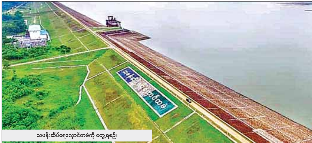
သမန်းဆိပ်ရေလှောင်တံခံကို တွေ့ရစဉ်။

မိုးခေါင်ခြင်း၊ မိုးရွာသွန်းမှု အပြောင်းအလဲများ ခြင်းစသည့် လွန်ကဲသော ရာသီဥတုဖြစ်ရပ်များ ကြောင့် စိုက်ပျိုးရေးမလုံလောက်မှုပြဿနာနှင့် ရေကြီးရေလျှံမှုကြောင့် စိုက်ပျိုးသီးနှံများ ပျက်စီး ဆုံးရှုံးမှုများ ကြုံတွေ့ရမှုကို ကျော်လွှားနိုင်ရန်၊ သီးနှံများအထွက်နှုန်းနှင့် အရည်အသွေး ကောင်းမွန် ရေးအတွက် အဓိကအရေးပါသည့် အချက်တစ်ခု ဖြစ်သော စိုက်ပျိုးရေး လုံလောက်စွာရရှိရန် စိုက်ပျိုး ရေး၊ မွေးမြူရေးနှင့်ဆည့်မြောင်းဝန်ကြီးဌာန အောက်ရှိ ဆည်မြောင်းနှင့်ရေအသုံးချမှုစီမံခန့်ခွဲ ရေးဦးစီးဌာနအနေဖြင့် ရေရှည်တည်တံ့သော စိုက်ပျိုးရေးဖြစ်စေရန် စိုက်ပျိုးရေးရရှိရေးလုပ်ငန်း၊ ရေဘေးကာကွယ်ရေးလုပ်ငန်းများကို ကြိုးပမ်း ဆောင်ရွက်လျက်ရှိပါသည်။