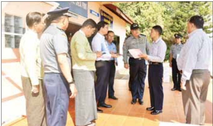
ကျိုင်းလပ်(မြန်မာ)-ကျိုင်းခတ်(လာအို) ချစ်ကြည် ရေးတံတားကိုအသုံးပြု၍ မြန်မာ-လာအိုနှစ်နိုင်ငံ နယ်စပ်ကုန်သွယ်မှု ဖွံ့ဖြိုးတိုးတက်ရေးနှင့်တစ်ဆင့် ဖြတ်သန်းကုန်သွယ်မှု (Transit Trade) တိုးတက်

နယ်စပ်ကုန်သွယ်မှု ဖွံ့ဖြိုးတိုးတက်ရေး ညွှန်ကြားရေးဌာန ပြည်ထောင်စုဝန်ကြီးသည် အဖွဲ့ဝင်များနှင့်အတူ ကျင်းလုပ်ကုန်သွယ်ရေးစခန်း နှင့် မြန်မာ-လာအို ချစ်ကြည်ရေးတံတားရှိ Border Control Facility (BCF) ဝိတ်ဦး ကုန်သွယ်မှုလုပ်ငန်း များ ဆောင်ရွက်နေမှုကို ကြည့်ရှုစစ်ဆေးပြီး