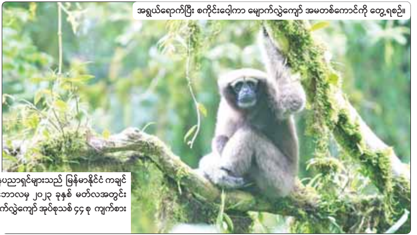
အရွယ်ရောက်ပြီး စကိုင်းဂေါ့ကာ မျောက်လွဲကျော် အမတစ်ကောင်ကို တွေ့ရစဉ်။

အပြည်ပြည်ဆိုင်ရာ တောရိုင်းတိရစ္ဆာန်နှင့် သဘာဝအပင်အဖွဲ့ (မြန်မာ)မှ သုတေသနပညာရှင်များသည် မြန်မာနိုင်ငံ ကချင်ပြည်နယ်ရှိ နေရာခြောက်ခုနှင့် ရှမ်းပြည်နယ်ရှိ နေရာသုံးခုတို့၌ ၂၀၂၁ ခုနှစ် ဒီဇင်ဘာလမှ ၂၀၂၃ ခုနှစ် မတ်လအတွင်း ကွင်းဆင်းလေ့လာစူးစမ်းမှုများ ပြုလုပ်ခဲ့ပြီးနောက် မြန်မာနိုင်ငံ၌ စကိုင်းဂေါ့ကာမျောက်လွဲကျော် အုပ်စုသစ် ၄၄ စု ကျက်စားလျက်ရှိသည်ကို အတည်ပြုနိုင်ခဲ့ကြောင်း သိရသည်။