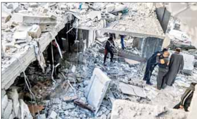
အစွဲရော့တိုက်ခိုက်မှုကြောင့် ထိခိုက်ပျက်စီးမှုများကို တွေ့ရစဉ်။

ကိုင်ရို ဖေဖော်ဝါရီ ၂၅ လက်ရှိတွင် အစွဲရော့တပ်ဖွဲ့၏ ဝိုင်းဝန်းပိတ်ဆို့ခံရမှုနှင့် ဖွဲ့ကြဲတိုက်ခိုက်မှုများ ခံနေရသော ဂါဇာကမ်းမြောက်၌ ပစ်ခတ်မှု ရပ်စဲရေးနှင့်ပတ်သက်ပြီး သဘောတူညီမှုရရှိရန် ကာတာနှင့်အီဂျစ်နိုင်ငံတို့၌ ဆွေးနွေးမှု နှစ်ကြိမ် ပြုလုပ်သွားမည်ဖြစ်ကြောင်း အီဂျစ်နိုင်ငံမှ Al-Qahera သတင်းဌာနက ဖေဖော်ဝါရီ ၂၅ ရက်တွင် အစီရင်ခံ ဖော်ပြခဲ့သည်။