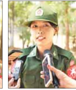
မအေးငြိမ်းသူ

ဒီသင်တန်းကို တက်ရောက်ပြီးတဲ့ နောက်ပိုင်းမှာ အများတကာနဲ့ ရင်ပေါင် တန်းပြီးတော့ ဘယ်အဖွဲ့ အစည်းမဆို ပါဝင်နိုင်တဲ့ စိတ်အားထက်သန်မှုကို လည်း ရရှိလာပါတယ်။ တိုင်းပြည်ရဲ့ အနာဂတ်အတွက် ကျောင်းသားလူငယ် တွေဟာ အလွန်ပုံစံအရေးကြီးပါတယ်။ ဥပမာအနေနဲ့ပြောရရင် တိုင်းပြည်ရဲ့ အနာဂတ်ဟာ လေ့တစ်စင်းဆိုရင် နိုင်ငံ တော်အကြီးအကဲတွေဟာ ပုံအနေနဲ့ ထိန်းပေးသူတွေပါ။ ရှေ့ဆက်ဖို့ဆိုတာ