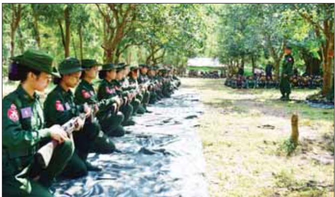
တက္ကသိုလ်လေ့ကျင့်ရေးတပ်(UTC) သင်တန်းသူများအား လက်နက်ငယ်ဘာသာရပ် သင်ကြားပေးစဉ်။