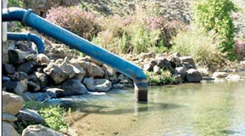
လက်ဘနွန်နိုင်ငံတောင်ပိုင်းရှိ အကြီးဆုံး မြစ်ရေတင်ရေးစီမံကိန်းဖြစ်သည့် ဝဇ်နီစမ်းချောင်း စီမံကိန်းမှ ရေစုပေါင်းမှုကို တွေ့ရစဉ်။

အစွမ်းတပ်ဖွဲ့လက်ဘနွန်တောင်ပိုင်းက ဟစ်ဇ်ဘိုလာ အုပ်စုတို့ကြားပဋိပက္ခတွေ ကြောင့် လတ်တလောမှာ ရေမရရှိနိုင်ဘဲ ရေရှားပါးမှုဒဏ်ကို ခံစားနေရတာ ကတော့ တောင်ပိုင်းနယ်စပ်ဒေသက ပြည်သူတွေပဲဖြစ်ပါတယ်။