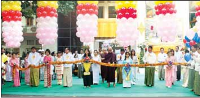
သန့်လျင်မြို့ မင်းကျောင်းပထမပြန်စာသင်တိုက် “အဂ္ဂမဟာရွှေမေတ္တာ” လေးထပ် ဆွမ်းစားကျောင်းတော်ကြီး ကျောင်းဆိုင်းဘုတ်နှင့် ကမ္ပည်းမော်ကွန်းတို့အား ဖွင့်လှစ်

ရုံပြည် သန့်ရှင်းသာယာရေးကို လည်း အမြဲမပြတ် အလေးထား ဆောင်ရွက်ကြရန်၊ မိမိတို့ ကျောင်းများရှိ ဆောက်လုပ်ဆဲ တည်ဆောက်ရေးလုပ်ငန်းများကို သတ်မှတ်အရည်အသွေး အပြည့်အဝဖြင့် သတ်မှတ်အချိန်ကာလ အတွင်း ပြီးစီးရန်နှင့် အန္တရာယ် ကင်း၍ ရေရှည်တည်တံ့အောင် ဆောင်ရွက်ကြရန် မှာကြားပြီး ဆရာ ဆရာမများ၏ တင်ပြချက် များအပေါ် ပေါင်းစပ်ညှိနှိုင်း ဖြည့်ဆည်း ဆောင်ရွက်ပေးခဲ့ ကြောင်း သိရသည်။ သတင်းစဉ်