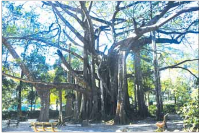
ပြင်ဦးလွင် ကော်ဖီဥယျာဉ်အတွင်းမှ သဘာဝရေထွက်နှင့် လည်ပတ်အနားယူနိုင်မည့် နေရာများ။