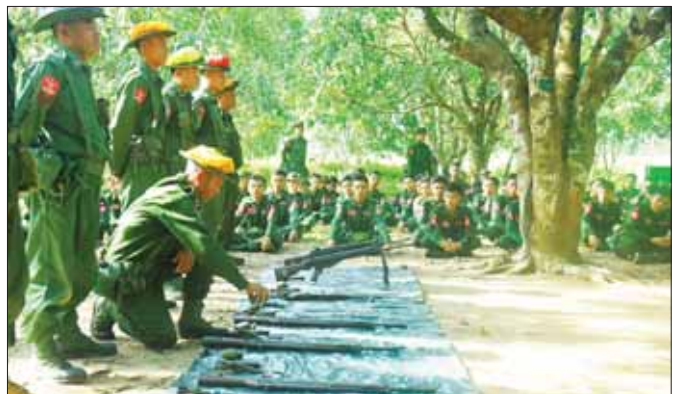
တက္ကသိုလ်လေ့ကျင့်ရေးတပ်(UTC) သင်တန်းသားများအား လက်နက်ငယ်ဘာသာရပ် သင်ကြားပေးစဉ်။