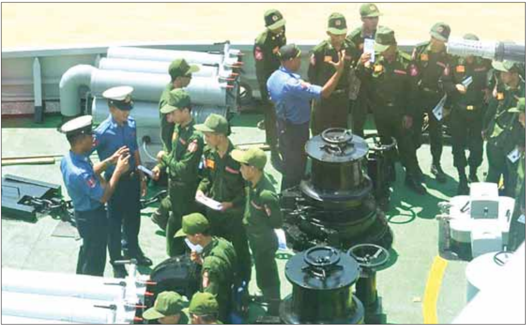
တက္ကသိုလ်လေ့ကျင့်ရေးတပ်(UTC) သင်တန်းသားများ တပ်မတော်(ရေ) စစ်သင်္ဘော၌ လေ့လာကြစဉ်။

အထူးသဖြင့် UTC တပ်ဖွဲ့ဝင်တွေဟာလည်း မျိုးချစ်စိတ်ထက်သန်ဖို့လိုပြီး UTC ကို ဝင်ရောက်လာသူများဟာလည်း မျိုးချစ်စိတ်ကိုအရင်းခံပြီး ဝင်ရောက်လာသူတွေပဲ ဖြစ်ပါတယ်။ နိုင်ငံတော်စီမံအုပ်ချုပ်ရေးကောင်စီဥက္ကဋ္ဌ နိုင်ငံအောင်ဝန်ကြီးချုပ် ဗိုလ်ချုပ်မှူးကြီး မင်းအောင်လှိုင်ဟာ UTC တက်ရောက်ပြီး စစ်တက္ကသိုလ် တက်ရောက်ခဲ့သူဖြစ်ပါတယ်။ ယခုအဆောက်အဦများမှာပဲ နည်းပြဆရာနဲ့ သင်တန်းတက် ကျောင်းသားတွေ စုပေါင်းမှတ်တမ်းတင်ထားတာလည်း ရှိပါတယ်။ ဧရာဝတီတိုင်းဒေသကြီး ဝန်ကြီးချုပ် ဒုတိယဗိုလ်ချုပ်ကြီး တင်မောင်ဝင်း၊ ဒုတိယဗိုလ်ချုပ်ကြီး ဝင်းဗိုလ်ရှိန်၊ ဒုတိယဗိုလ်ချုပ်ကြီးစိန်ဝင်း အပါအဝင် နယ်ဘက်တွေမှာလည်း တာဝန်ထမ်းဆောင်နေတဲ့ UTC ကျောင်းသားဟောင်း များစွာရှိနေပါတယ်။ နိုင်ငံတော်ကာကွယ်ရေးဟာ နိုင်ငံသူ၊ နိုင်ငံသားအားလုံးမှာ တာဝန်ရှိပါတယ်။ ကျောင်းသား ကျောင်းသူတွေဟာ နိုင်ငံသူ၊ နိုင်ငံသားတွေဖြစ်တဲ့အတွက် အမိနိုင်ငံကို ကာကွယ်ဖို့ မွေးရာပါ တာဝန်တစ်ခုလည်း ဖြစ်