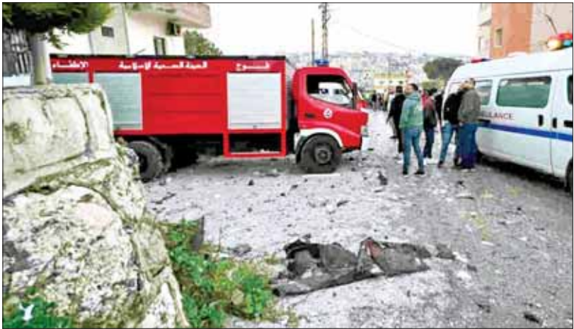
လက်ဘနွန်နိုင်ငံတောင်ပိုင်း ကျေးရွာတစ်ရွာတွင် အစွမ်းတပ်ဖွဲ့၏ ဒရုန်းဖြင့်တိုက်ခိုက်မှုကြောင့် အရေးပေါ်ကယ်ဆယ်ရေး လုပ်ဆောင်နေသည့်ကို တွေ့ရစဉ်။

အသက်စွန့်ပြီးကြိုးစားလာကြ ခေါင်မိုးပေါ်ကနေ ပိုက်တွေနဲ့ သွယ်တန်းပြီး မိုးရေကို စည်ပိုင်းထဲ ထည့်ကာစုဆောင်းလာပါတယ်။ လူအများစုကတော့ အများပိုင်ရေတွင်းနေကနေ