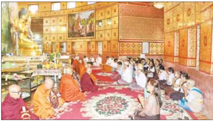
မြတ်ကြီးများ၊ ဩဝါဒါစရိယ ဆရာတော်ကြီးများ ပင့်သံယာတော် ၄၅ ပါးတို့အား ရန်ကုန်တိုင်းဒေသကြီးအတွင်းရှိ ခရိုင်၊ မြို့နယ်များမှ ဌာနဆိုင်ရာများ၊ ဂေါပကအဖွဲ့ဝင်များနှင့် အလှူရှင်များက ဆွမ်းဆန်စိမ်းလောင်းလှူခဲ့ကြသည်။