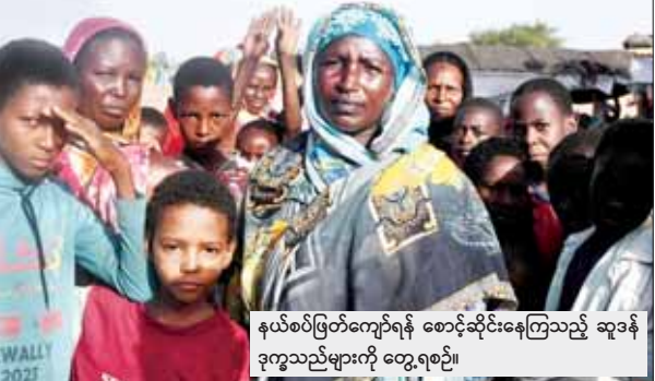
နယ်စပ်ဖြတ်ကျော်ရန် စောင့်ဆိုင်းနေကြသည့် ဆူဒန် ခုကွသည်များကို တွေ့ရစဉ်။

ပြည်ထောင်စုက ရှုတ်ချခဲ့သည်။ ဆူဒန်တပ်ဖွဲ့နှင့် RSF အဖွဲ့ တို့သည် ဆူဒန်နိုင်ငံရှိ အခြားသော ဒေသအများအပြား သို့ လူသားချင်း စာနာထောက်ထားမှုဆိုင်ရာ အကူအညီများ ဝင်ရောက်ခွင့်ကို ချက်ချင်းခွင့် ပြုပေးသင့်သည်ဟု အမေရိကန်က တောင်းဆို ခဲ့သည်။ RSF အဖွဲ့ ထိန်းချုပ်ထားသည့် ဒေသ များသို့ လူသားချင်း စာနာထောက်ထားမှု ဆိုင်ရာ အကူအညီများ ရောက်ရှိမည်ကို ဆူဒန် တပ်ဖွဲ့က အတားအဆီးများ ပြုလုပ်နေသည် ဟူသော သတင်းပို့မှုများအတွက် စိုးရိမ်မိ ကြောင်းနှင့် ချစ်ခင်ဘက်မှ ဝင်ရောက်လာမည့် အကူအညီများကို နယ်စပ်ဖြတ်ကျော်ရာတွင် တားဆီးမိန့်လတ်တလော ထုတ်ပြန်ထားသည့် အတွက်လည်း စိုးရိမ်မိကြောင်း အမေရိကန်က ပြောသည်။ ၂၀၂၃ ခုနှစ် ဧပြီ ၁၅ ရက်မှစတင်ကာ ဆူဒန် တပ်ဖွဲ့နှင့် RSF အဖွဲ့တို့ကြား ကြောက်မက် ဖွယ်တိုက်ပွဲများ စတင်ပေါ်ပေါက်ခဲ့သည်။ တိုက်ပွဲများ စတင်ဖြစ်ပွားသည့်အချိန်မှ စတင် ကာ လူပေါင်း ၁၃၀၀၀ ကျော် အသတ်ခံခဲ့ရ သည်ဟု ကုလသမဂ္ဂ လူသားချင်း စာနာ ထောက်ထားမှုဆိုင်ရာ ညှိနှိုင်းရေးမှူးရုံး၏ ခန့်မှန်းချက်များအရ သိရသည်။ ဆင်ဟွာ