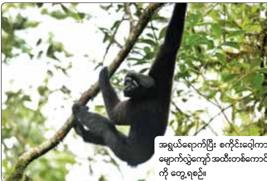
အရွယ်ရောက်ပြီး စကိုင်းဂေါ့ကာ မျောက်လွဲကျော် အထီးတစ်ကောင်ကို တွေ့ရစဉ်။

မျိုးသုဉ်းအန္တရာယ်ခြိမ်းခြောက်မှုကို ရင်ဆိုင်နေရသည့် စကိုင်းဂေါ့ကာ မျောက်လွဲကျော်မျိုးစိတ် Skywalker gibbons (သို့မဟုတ် - Hoolock tian-xin) ကောင်ရေ ၁၅၀ ခန့်ကို မြန်မာနိုင်ငံနှင့် နယ်နိမိတ်ချင်းထိစပ်လျက်ရှိသည့် တရုတ်နိုင်ငံ ယူနန်ပြည်နယ်အတွင်း ၂၀၁၇ ခုနှစ်က ပထမဆုံးအကြိမ် တွေ့ရှိမှတ်တမ်းတင်ခဲ့ပြီးနောက် ပထဝီဝင်အနေအထားအရ မြန်မာနိုင်ငံအတွင်းရှိ ကချင်ပြည်နယ်အတွင်း အင်မိုင်ခန့် ဧရာဝတီမြစ်အနောက်ဘက်ကြား၊ သံလွင်မြစ်အရှေ့ဘက်ခြမ်းအကြားတွင် အဆိုပါ စကိုင်းဂေါ့ကာ မျောက်လွဲကျော်များ ကျက်စားနေထိုင်နိုင်ကြောင်း လက်ခံကတည်းက ပညာရှင်များက လက်ခံယူဆခဲ့ကြသည်။ ယခုအခါ ၎င်းတို့ကည်ရှိနေကြောင်းကို မှတ်တမ်းတင်နိုင်ရန်အတွက် ကွင်းဆင်းလေ့လာရေးအဖွဲ့အနေဖြင့် ခေတ်မီဆန်းသစ်သော ထိန်းသိမ်းစောင့်ရှောက်ရေး နည်းပညာများဖြစ်သည့် အသံပိုင်းဆိုင်ရာ စောင့်ကြည့်ခြင်းဖြင့် မျောက်လွဲကျော်အုပ်စုများကို ခွဲခြားသတ်မှတ်သည့် နည်းလမ်းနှင့် ၎င်းတို့စားသောက်သည့် အသီးအနှံနှင့် အပင်များတွင် ကြွင်းကျန်သည့် DNA နမူနာများကိုရယူ၍ မျိုးရိုးဗီဇခြမ်းစိတ်ဖြာနည်းစနစ်အရ ၎င်းတို့ကျက်စားနေကြောင်း အထောက်အထား နိုင်ခိုင်မာမာဖြင့် မှတ်တမ်းတင်နိုင်ခဲ့ပြီဖြစ်ကြောင်း နိုင်ငံတကာပရိုင်းမိတ် သုတေ