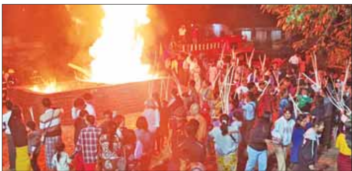
များကို ကိုင်ဆောင်ပစ်ထည့်ကာ လိုရာဆူတောင်း၍ စည်ကားခဲ့ပြီး စေတီတော်မြတ်ကြီးရှိ ကျားပျံမွှေးရုံ၌ မီးပူဇော်ပွဲကျင်းပခြင်းဖြစ်သည်။ (အပေါ်ပုံ) မြေပေါ်ပေါက် ၂၄ ရက် နံနက်ပိုင်းတွင် ပြည်မြို့ ရွှေဆံတော်စေတီတော်မြတ်ကြီး၌ ဉာဏ်ရိုးမီး ပူဇော်သူများ၊ ဘုရားဖူးလာပြည်သူများဖြင့် အထူး စည်ကားခဲ့ပြီး စေတီတော်မြတ်ကြီးရှိ ကျားပျံမွှေးရုံ၌ ရွှေဆံတော်ဘုရားဂေါပကအဖွဲ့များနှင့်ဘုရားဝေယျာဓွ အသင်းများက ဘုရားဖူးလာပြည်သူများအား ရာသီ စာ ထမနံများဖြင့် တည်ခင်းစေခဲ့၍ စတုဒိသာများ ကျွေးမွေးခဲ့ကြောင်း သိရသည်။ ကိုစိုး(ပြည်)

ကြီးဘုရားစောင်းတန်းရှေ့၌ ပြည်သူများ ကုသိုလ် ပွားများနိုင်ရေးအတွက် တောရွာများမှ ဉာဏ်ရိုး ဈေးသည်များက လာရောက်ရောင်းချကြကြောင်း သိရသည်။ ချမ်းအေးလွန်းလှသည့် တပို့လဆန်းဆောင်းရာသီ တွင် မြတ်စွာဘုရားကို အလင်းဓာတ်နှင့် အနွေးဓာတ် လှူဒါန်းသည့်အနေဖြင့် ဉာဏ်ရိုးမီးပူဇော်ပွဲကို ရွှေဆံတော်စေတီတော်မြတ်ကြီး၌ နှစ်စဉ်ကျင်းပ လာခဲ့သည်မှာ ယခုနှစ်ဆိုလျှင် အကြိမ်(၁၀၀) မြောက် ရှိပြီဖြစ်ကြောင်း သိရသည်။ မြတ်စွာဘုရားအား ဉာဏ်ရိုးမီးပူဇော်ခြင်း ကြောင့် ဉာဏ်အမြော်အမြင်ကြီးမားခြင်း၊ ထိုးထွင်း ဉာဏ်ကောင်းမွန်ခြင်း၊ ဆုတောင်းပြည့်စေခြင်း စသည့် အကျိုးကျေးဇူးများရရှိကြောင်း၊ ပြည်မြို့သူ မြို့သား များက လက်ခံယုံကြည်ကြပြီး ပြည်သူများက ဘုရားကြီးတောင်ဘက်စောင်းတန်းရှိ လေးထောင့် ကန်အတွင်းသို့ နံ့သာတုံးများနှင့် မီးမွှေးပြီး ဉာဏ်ရိုး