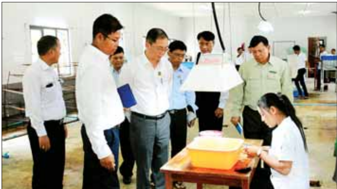
ကြရန်မှာကြားပြီး ဝန်ထမ်းများ၏ တင်ပြချက်များ အပေါ် ပေါင်းစပ်ညှိနှိုင်းဆောင်ရွက်ပေးသည်။

နေပြည်တော် ဖေဖော်ဝါရီ ၂၅ သယံဇာတနှင့် သဘာဝပတ်ဝန်းကျင်ထိန်းသိမ်းရေး ဝန်ကြီးဌာန ပြည်ထောင်စုဝန်ကြီး ဦးခင်မောင်ရီသည် တာဝန်ရှိသူများနှင့်အတူ ယမန်နေ့နံနက်ပိုင်းတွင် တနင်္လာရက်တွင်းဒေသကြီး မြိတ်မြို့ရှိ ခရိုင်သစ်တော ဦးစီးဌာနရုံးသို့ သွားရောက်၍ ဝန်ထမ်းများ၏ လုပ်ငန်းဆောင်ရွက်နေမှုကို ကြည့်ရှုစစ်ဆေးပြီး တိုင်း၊ ခရိုင်၊ မြို့နယ်အဆင့် ဌာနဆိုင်ရာများနှင့် တွေ့ဆုံသည်။