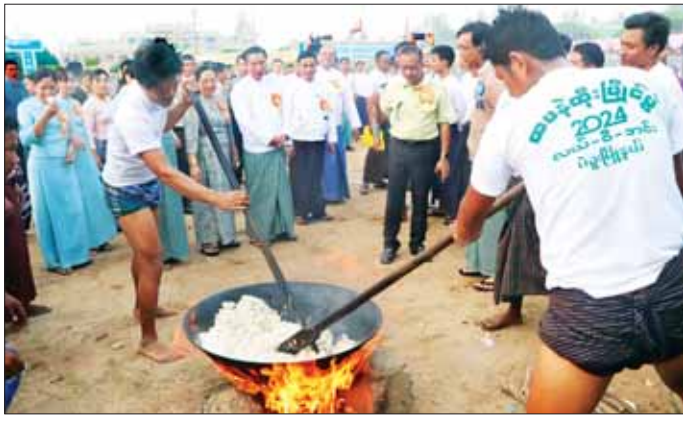
ပဲခူးတိုင်းဒေသကြီးအစိုးရအဖွဲ့က ကြီးမှူးကျင်းပ သည့် ၂၀၂၄ ခုနှစ် မြန်မာ့ရိုးရာထမနဲထိုးပွဲကို ဌာန ဆိုင်ရာများမှ ပြိုင်ပွဲဝင်အသင်း ၁၈ သင်း၊ လူမှုရေး အသင်းအဖွဲ့မှ နှစ်သင်း၊ ဘုရားဂေါပကအဖွဲ့များမှ

ယင်းနောက် ဆုပေးပွဲအခမ်းအနားကို ဆက်လက် ကျင်းပရာ ဂုဏ်ပြုအထူးဆုရရှိသော ပြိုင်ပွဲဝင် ခုနစ် သင်းအား ဆုငွေကျပ် နှစ်သိန်းစီနှင့် နှစ်သိမ့်ဆုရရှိ သည့် ပြိုင်ပွဲဝင်အသင်းအဖွဲ့ ၃၆ ဖွဲ့အား ဆုငွေကျပ် တစ်သိန်းစီတို့ကို တိုင်းဒေသကြီး ဝန်ကြီးများနှင့် ပဲခူးတက္ကသိုလ် ပါမောက္ခချုပ်နှင့် တိုင်းဒေသကြီး အဆင့် ဌာနဆိုင်ရာများကလည်းကောင်း၊ တတိယ ဆုရရှိသည့် တိုင်းဒေသကြီး လူမှုရေးရာဝန်ကြီးဌာန (ခ)အသင်းအတွက် ဂုဏ်ပြုဆုငွေကျပ် ငါးသိန်းကို တိုင်းဒေသကြီး တရားလွှတ်တော်တရားသူကြီးချုပ် ကလည်းကောင်း၊ ဒုတိယဆုရရှိသည့် တိုင်းဒေသကြီး သယံဇာတရေးရာဝန်ကြီးဌာန (ဃ) အသင်းအတွက် ဂုဏ်ပြုဆုငွေကျပ် ခုနစ်သိန်းကို တိုင်းဒေသကြီး ဝန်ကြီးချုပ်၏ ဇနီးကလည်းကောင်း၊ ပထမဆုရရှိ သည့် တိုင်းဒေသကြီး လမ်းပန်းဆက်သွယ်ရေးရာ ဝန်ကြီးဌာန(ခ)အသင်းအတွက် ဂုဏ်ပြုဆုငွေကျပ် ၁၀ သိန်းနှင့် ဒိုင်အေ့များအတွက် ဂုဏ်ပြုငွေကျပ် သုံးသိန်းတို့ကို တိုင်းဒေသကြီး ဝန်ကြီးချုပ်ကလည်း ကောင်း ပေးအပ်ချီးမြှင့်သည်။