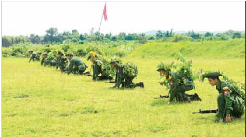
တက္ကသိုလ်လေ့ကျင့်ရေးတပ်(UTC) သင်တန်းသားများ တပ်ဖွဲ့ပုံစံ လေ့ကျင့်စဉ်။

“ နိုင်ငံတော်ကာကွယ်ရေးအတွက် စစ်ပညာဟာ နိုင်ငံသားတိုင်း တတ်ထားရင် ပိုကောင်းပါတယ်။ ဘာလို့လဲဆိုတော့ ဒါကို တတ်မြောက်ထားခြင်းအားဖြင့် မိမိကိုယ်ကို မိမိကာကွယ်နိုင်မယ်၊ မိမိရဲ့ရပ်ရွာ၊ မြို့နယ်ကို ကာကွယ်နိုင်မယ်။ ပြီးရင် နိုင်ငံတော်ကို ကာကွယ်စောင့်ရှောက်နိုင်တဲ့အဆင့်ထိ အရေးကြီးတဲ့ အခန်းကဏ္ဍမှာ ပါဝင်နေလို့ပါ ”