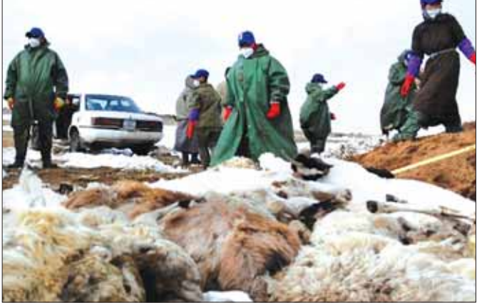
အေးခဲပြီး သေဆုံးနေသော တိရစ္ဆာန်များကို မွန်ဂိုလီးယားအစိုးရ တာဝန်ရှိသူများက ဖယ်ရှားရှင်းလင်းနေစဉ်။

✽ မွန်ဂိုလီးယားအစိုးရက သဘာဝဘေးဒဏ်ခံ လှည့်လည်သွားလာနေထိုင်သည့် တိရစ္ဆာန်ထိန်းကျောင်းသူများကို ကူညီပေးလျက်ရှိပြီး မြက်ခြောက်နှင့် တိရစ္ဆာန်စာ တန် ၂၀၀၀၀ ကိုလည်း အဆိုပါဒေသများသို့ ပေးပို့ခဲ့သည်။ ထို့ပြင် မွန်ဂိုလီးယားအနုပညာရှင်များကလည်း ၎င်းတို့ကို ကူညီရန် အလှူငွေကောက်ခံရေး လှုပ်ရှားမှုများကိုလည်း လုပ်ဆောင်လျက်ရှိ