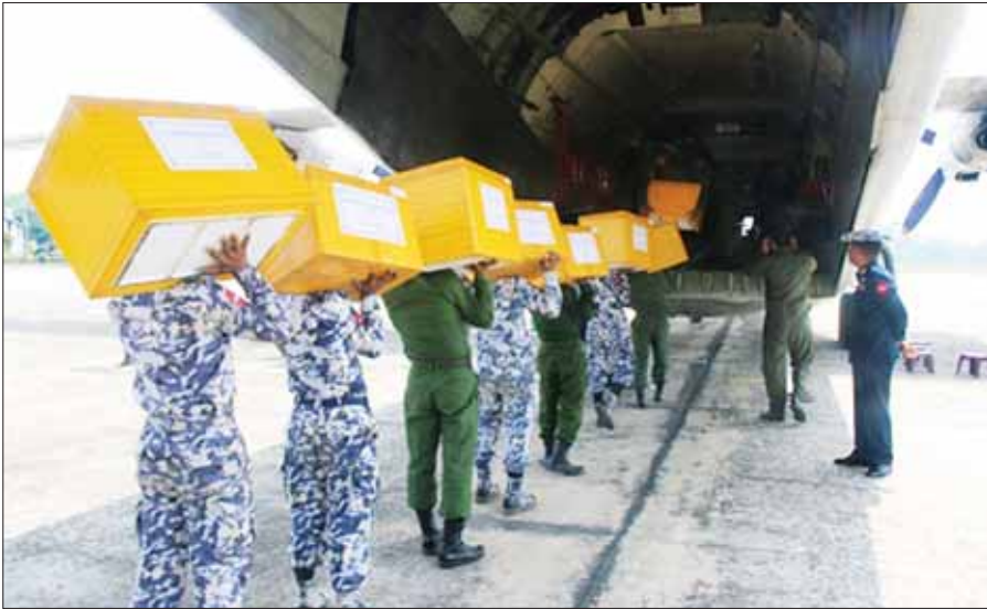
နိုင်ငံတော်ကာကွယ်ရေးနှင့် လုံခြုံရေးတာဝန်များကို စွမ်းစွမ်းတမ်း ထမ်းဆောင်လျက်ရှိသော လုံခြုံရေးတပ်ဖွဲ့ဝင်များအတွက် ဧရာဝတီတိုင်းဒေသကြီးမှ ပေးပို့လှူဒါန်းသည့် စားသောက်ဖွယ်ရာများကို ဌာနဆိုင်ရာနှင့် လုံခြုံရေးတပ်ဖွဲ့ဝင်များက သယ်ဆောင်ပေးစဉ်။ (ဝဲပုံ)

ထိုသို့ ပေးအပ်လျက်ရှိရာ ယနေ့နံနက်ပိုင်းတွင် ဧရာဝတီတိုင်းဒေသကြီးအစိုးရအဖွဲ့က တိုင်းဒေသကြီးအတွင်းရှိ ခရိုင်၊ မြို့နယ်များမှ ပေးပို့လှူဒါန်းသည့် ငါးနီတူခြောက်ကြော် အထုပ် ၆၆၂၀၊ ငါးပိကြော် အထုပ် ၅၄၅၀ နှင့် ငါးပြာရည်ကြော် အထုပ် ၄၀၀ တို့ကို ပုသိမ်မြို့မှတစ်ဆင့် ရခိုင်ပြည်နယ် စစ်တွေမြို့သို့ တပ်မတော် လေယာဉ်ဖြင့် ပို့ဆောင်ပေးပြီး လုံခြုံရေးတပ်ဖွဲ့ဝင်များ၏လက်ဝယ် အရောက် ဆက်လက်ပို့ဆောင်ပေးသွားမည်ဖြစ်ကြောင်း သတင်းရရှိသည်။