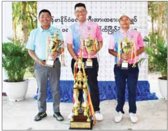
ဆုရရှိသူများကို ဆုတံဆိပ်များနှင့်အတူ တွေ့ရစဉ်။

ရန်ကုန် ဖေဖော်ဝါရီ ၂၂ ဒေသကြီး မင်္ဂလာဒုံမြို့နယ်ရှိ ရန်ကုန်မြန်မာနိုင်ငံဂေါက်သီးအားကစားအဖွဲ့ချုပ် ဂေါက်ကွင်း (တည်းကုန်း)၌ ဆက်လက်ကြီးပွဲများကျင်းပသော (President Cup) ကျင်းပသည်။ ဥက္ကဋ္ဌဖလား ဂေါက်သီးရိုက်ပြိုင်ပွဲ ဝါသနာရှင်အဆင့်ပြိုင်ပွဲနှင့် သက်ကြီးတန်းပြိုင်ပွဲအနား ဆက်လက်ကျင်းပရာ မြန်မာနောက်ဆုံးနေ့နှင့် ဆုပေးပွဲအခမ်းအနား နိုင်ငံ ဂေါက်သီးအားကစားအဖွဲ့ချုပ်ကို ဖေဖော်ဝါရီ ၂၂ ရက်က ရန်ကုန်တိုင်း စာမျက်နှာ ၇ ကော်လံ ၁ ၀