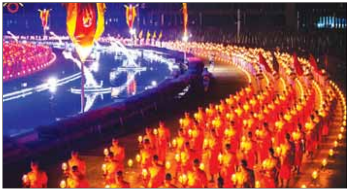
ယမန်နှစ်က ပြုလုပ်ခဲ့သော မာယုဇာနေ့ အခမ်းအနားမြင်ကွင်း။

အဆိုပါ အခမ်းအနားတွင် ဘုရားရှိခိုး၊ စုပေါင်းတရားထိုင်ခြင်းလည်း ပါဝင်မည်ဖြစ်ပြီး ကမ္ဘာပေါ်တွင် လူအများဆုံး စုပေါင်းတရားထိုင်ခြင်းအဖြစ် တင်နက်စိတ်တမ်းအဖွဲ့က ကြေညာခြင်း၊ အခမ်းအနားဦးဆောင်ဆရာတော်က မာယုဇာ အခမ်းအနားဂါထာကို ရွတ်ဖတ်ခြင်း၊ မာယုဇာဆီမီးကို ဦးဆောင်