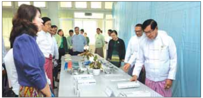
၉၄ ဦးအတွက် ဖန်တီးပေးနိုင်မည်ဖြစ်ကြောင်း၊ တင်ပြသည့် ကုမ္ပဏီရုပ်စုံ၏ တင်ပြချက်များကို အစည်းအဝေးတွင် မတည်ငွေရင်းပမာဏတိုးမြှင့်မည့် လည်း ဆွေးနွေးဆုံးဖြတ်ခဲ့ကြောင်း သိရသည်။ လုပ်ငန်းတစ်ခုအပါအဝင် အထွေထွေကိစ္စရပ်များ ဆန်းကျော်ဦး (ပြန်/ဆက်)

အဆိုပါရင်းနှီးမြှုပ်နှံမှုလုပ်ငန်းများ၏ မတည်ငွေရင်းပမာဏမှာ မြန်မာ့ငွေကျပ်သန်း ၉၅၁၀ ဒသမ ၈၀၀ နှင့် အမေရိကန်ဒေါ်လာ ၁ ဒသမ ၇၀၄ သန်း ဖြစ်ပြီး ပြည်တွင်းအလုပ်အကိုင်အခွင့်အလမ်း