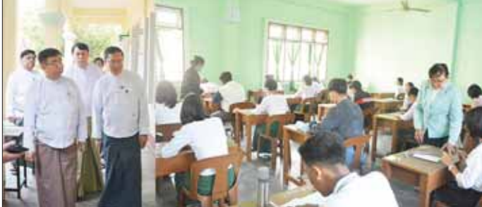
တန်း (Grade-9) နှစ်ဆုံးစာမေးပွဲတွင် ကျောင်းသား ကျောင်းသူများ အေးချမ်းစွာ ဖြေဆိုနေမှုများကို လှည့်လည်ကြည့်ရှု အားပေးကြသည်။ (အပေါ်ပုံ) ထိုသို့ကြည့်ရှုအားပေးရာတွင် ပြည်ထောင်စုဝန်ကြီးက စာမေးပွဲဖြေဆိုကြမည့် ကျောင်းသား

နေပြည်တော် ဖေဖော်ဝါရီ ၂၂ ပညာရေးဝန်ကြီးဌာန ပြည်ထောင်စုဝန်ကြီး ဒေါက်တာညွန့်ပေသည် အခြေခံပညာဦးစီးဌာန ညွှန်ကြားရေးမှူးချုပ် ဦးကျော်စွာသွင်၊ မြန်မာနိုင်ငံစာစစ်ဦးစီးဌာန ညွှန်ကြားရေးမှူးချုပ် ဒေါက်တာ မျိုးသန့်၊ နေပြည်တော် ကောင်စီနယ်မြေပညာရေးမှူး ဒေါက်တာကျော်လှိုင်ခရိုင်၊ မြို့နယ်ပညာရေးမှူးများနှင့်အတူ ယနေ့နံနက်ပိုင်းတွင် နေပြည်တော် ဇမ္ဗူသီရိမြို့နယ် အမှတ်(၆)အခြေခံပညာအထက်တန်းကျောင်းသို့ သွားရောက်၍ ၂၀၂၃-၂၀၂၄ ပညာသင်နှစ် အခြေခံပညာမူလတန်းဆင့် ပဉ္စမတန်း (Grade-5) နှင့် အခြေခံပညာအလယ်တန်းဆင့် နှစ်ဆန်း