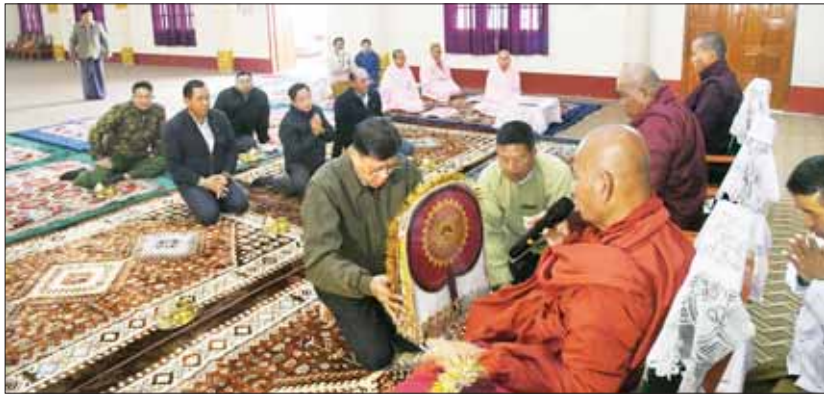
နိုင်ငံတော်စီမံအုပ်ချုပ်ရေးကောင်စီအဖွဲ့ဝင် ဒုတိယဝန်ကြီးချုပ်နှင့် ပို့ဆောင်ရေးနှင့်ဆက်သွယ်ရေးဝန်ကြီးဌာန ပြည်ထောင်စုဝန်ကြီး ဗိုလ်ချုပ်ကြီး မြထွန်းဦး ဟားခါး - ထန်တလန်မြို့နယ် သံဃာယကအဖွဲ့ဥက္ကဋ္ဌ ဟားခါးမြို့ ကျောဘုတ် သာသနာ့ပြုကျောင်း ဆရာတော် အဂ္ဂမဟာသဒ္ဓမ္မဇောတိကဓဇ ဘဒ္ဒန္တပညောဘာသ ထံ လှူဖွယ်ဝတ္ထုပစ္စည်းများ ဆက်ကပ်လှူဒါန်းစဉ်။

ဟားခါး ဖေဖော်ဝါရီ ၂၂ ဟားခါးမြို့၌ ရောက်ရှိနေသည့် နိုင်ငံတော်စီမံအုပ်ချုပ်ရေးကောင်စီအဖွဲ့ဝင် ဒုတိယဝန်ကြီးချုပ်နှင့် ပို့ဆောင်ရေးနှင့်ဆက်သွယ်ရေးဝန်ကြီးဌာန ပြည်ထောင်စုဝန်ကြီး ဗိုလ်ချုပ်ကြီး မြထွန်းဦးသည် ယမန်နေ့ နံနက်ပိုင်းတွင် ဟားခါးမြို့ မြို့ဦးကျောင်း တိုက်ရှိ အတုလူထုရည်သာသနာ့ဓနိသိက္ခာရောက်၍ (၇၆) နှစ်မြောက် ချင်းအမျိုးသား နေ့ အထိမ်းအမှတ်အဖြစ် ဆရာတော်၊ သံဃာတော် အရှင်သူမြတ်များအား လှူဖွယ်ဝတ္ထုပစ္စည်းများ ဆက်ကပ်လှူဒါန်းသည်။