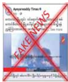
ကို တွေ့ရှိရသည်။

နေပြည်တော် ဖေဖော်ဝါရီ ၂၂ စစ်ကိုင်းတိုင်းဒေသကြီး ကောလင်း မြို့ပေါ်သို့ ဝင်ရောက်တပ်ဖွဲ့နေရာ ယူထားသည့် လုံခြုံရေးတပ်ဖွဲ့ဝင် များက ကောလင်းမြို့ရှိ ကျေးရွာ များကို မီးရှို့ရန်စေခိုင်းသည့် အသံ ပိုင်တစ်ခုထွက်ပေါ်လာကြောင်း၊ အဆိုပါအသံပိုင်တွင် ဆေးမင်းခုံ ကျေးရွာအား မီးရှို့ရန် လုံခြုံရေး တပ်ဖွဲ့ဝင်အရာရှိတစ်ဦးက ဆက် သွယ်ရေး စကားပြောစက်ဖြင့် အမိန့်ပေးစေခိုင်းသည့် ပုံစံမျိုး ထင်ယောင်ထင်မှား ဖြစ်စေရန် လုပ်ကြံထားသည့် အသံပိုင်တစ်ခု ကို တရားမဝင်ပြည်ပကုန်သွယ်ရေး ကိုယ်စားပြု အဖွဲ့ဝင်များက ရည်ရွယ်ချက်ရှိရှိ လှုံ့ဆော်ဝါဒဖြန့်ဝေလျက်ရှိသည်