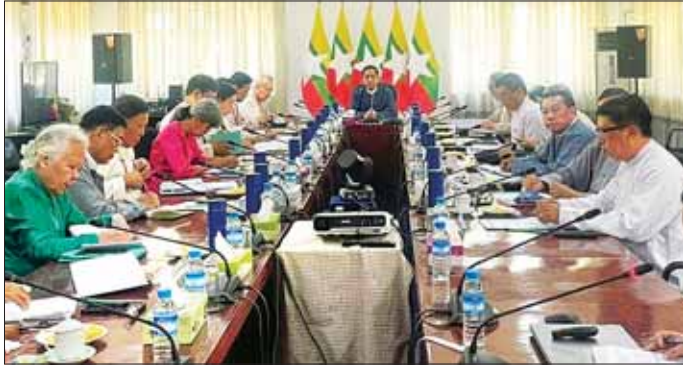
နိုင်ငံတော်စီမံအုပ်ချုပ်ရေးကောင်စီအဖွဲ့ဝင် ဒုတိယဝန်ကြီးချုပ်နှင့် ပို့ဆောင်ရေးနှင့်ဆက်သွယ်ရေးဝန်ကြီးဌာန ပြည်ထောင်စုဝန်ကြီး ဗိုလ်ချုပ်ကြီး မြထွန်းဦး ချင်းပြည်နယ် ထန်တလန်မြို့နှင့် ဟားခါးမြို့တို့မှ မြို့မိမြို့ဖများနှင့် တွေ့ဆုံဆွေးနွေးစဉ်။

နေပြည်တော် ဖေဖော်ဝါရီ ၂၂ ဝန်ကြီးက အစိုးရ၏ လက်ရှိ နိုင်ငံတော် စီမံအုပ်ချုပ်ရေး အကောင်အထည်ဖော် ဆောင် ကောင်စီဥက္ကဋ္ဌရုံးဝန်ကြီးဌာန(၁) ရွက်လျက်ရှိသည့် ကိစ္စရပ်များ၊ ပြည်ထောင်စုဝန်ကြီး ဦးကိုကိုလှိုင် ရေ့လုပ်ငန်းစဉ်များနှင့် စပ်လျဉ်း၍ သည် မြန်မာနိုင်ငံမဟာဗျူဟာနှင့် ရှင်းလင်းပြောကြားသည်။ ထို့ပြင် နိုင်ငံတကာ လေ့လာရေးအဖွဲ့မှ ဝါရင့်အကြံပေးအဖွဲ့ဝင်များ၊ အမှု ဆောင် အဖွဲ့ဝင်များနှင့် ယနေ့ မှန်းလွဲ ၁ နာရီတွင် ရန်ကုန်မြို့ရှိ မြန်မာနိုင်ငံ မဟာဗျူဟာနှင့် နိုင်ငံ ပညာများကို ထိရောက်စွာအသုံး ပြုလျက် ဒေသတွင်းနှင့် နိုင်ငံ တကာဆက်ဆံရေးကဏ္ဍပူးပေါင်း ဆောင်ရွက်မှုများ တိုးမြှင့်နိုင်ရေး အဝေးခန်းမ၌ တွေ့ဆုံသည်။ တွေ့ဆုံစဉ် ပြည်ထောင်စု ဆောင်ရွက်မှုများ တိုးမြှင့်နိုင်ရေး