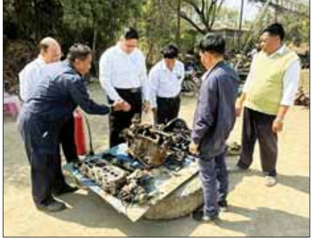
အချိန်မီပြီးစီးရေးကြပ်မတ်ဆောင်ရွက်ရန်နှင့် စက်ရုံ၌ တပ်ဆင်ပြီးစီးသည့် စက်ပစ္စည်းကိရိယာများ၊ စီမံကိန်းဝင် စက်ပစ္စည်း

ရွက်ပေးသည်။ ဆက်လက်၍ ဒုတိယဝန်ကြီး ဦးရင်မောင်ညွန့်သည် မန္တလေးတိုင်းဒေသကြီး မြင်းခြံမြို့ရှိ အမှတ်(၁) သံမဏိစက်ရုံ(မြင်းခြံ) သို့ သွားရောက်ကြည့်ရှုစစ်ဆေးပြီး ထုတ်လုပ်မှုလျာထားချက် ပြည့်မီရေးအတွက် ရေးဆွဲထားရှိသည့် စီမံချက်များအတိုင်း တိတိကျကျ လိုက်နာအကောင်အထည်ဖော် ဆောင်ရွက်ရန်၊ ဘဏ္ဍာရေးနှစ်အတွင်း လုပ်ငန်းအပ်နှံ ဆောင်ရွက်ထားသည့် စီမံကိန်းလုပ်ငန်းများ