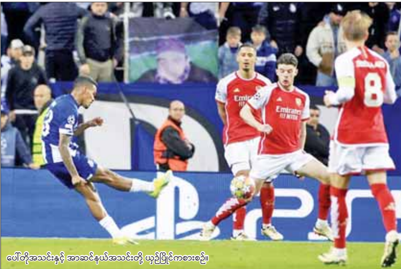
ပေါ်တိုအသင်းနှင့် အာဆင်နယ်အသင်းတို့ ယှဉ်ပြိုင်ကစားစဉ်။

(နိုင်ငံတော်စီမံအုပ်ချုပ်ရေးကောင်စီ ဥက္ကဋ္ဌ နိုင်ငံတော်ဝန်ကြီးချုပ် ဗိုလ်ချုပ်မှူးကြီး မင်းအောင်လှိုင်၏ ၂၀၂၃ ခုနှစ်၊ ဇူလိုင်လ ၁၅ ရက်နေ့တွင် ပြုလုပ်သော နိုင်ငံကုန်ထုတ်လုပ်မှုဖြင့်တင်ရေး အစည်းအဝေးမှ အမှာစကားကောက်နုတ်ချက်)