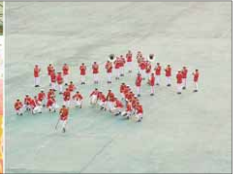
ဗိုလ်မှူးချုပ် ထွန်းမြတ်ရွှေ၊ တပ်မတော်အရာရှိကြီးများ၊ ဒိုင်အဖွဲ့ဝင်များ၊ ပြိုင်ပွဲဝင်အသင်းများနှင့် ဖိတ်ကြားထားသူများ ကြည့်ရှုအားပေးခဲ့ကြောင်း သတင်းရရှိသည်။