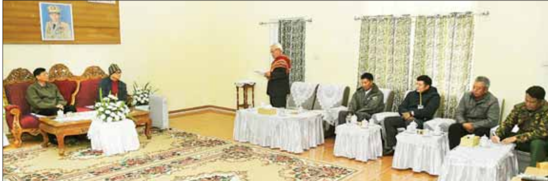
နိုင်ငံတော်စီမံအုပ်ချုပ်ရေးကောင်စီအဖွဲ့ဝင် ဒုတိယဝန်ကြီးချုပ်နှင့် ပို့ဆောင်ရေးနှင့်ဆက်သွယ်ရေးဝန်ကြီးဌာန ပြည်ထောင်စုဝန်ကြီး ဗိုလ်ချုပ်ကြီး မြထွန်းဦး ချင်းပြည်နယ် ထန်တလန်မြို့နှင့် ဟားခါးမြို့တို့မှ မြို့မိမြို့ဖများနှင့် တွေ့ဆုံဆွေးနွေးစဉ်။

ဦးစွာ နမောတဿ သုံးကြိမ် ရွတ်ဆို ထိုနောက် ဒုတိယဝန်ကြီးချုပ်နှင့် ဘုရားကန်တော့၍ ဟားခါး-ထန်တလန် ပြည်ထောင်စုဝန်ကြီး ဗိုလ်ချုပ်ကြီး မြို့နယ် သံဃာယကအဖွဲ့ဥက္ကဋ္ဌ ဟားခါး မြထွန်းဦးသည် ချင်းပြည်နယ် ထန်တလန် မြို့ ကျောဘုတ် သာသနာ့ပြုကျောင်း မြို့နှင့် ဟားခါးမြို့တို့မှ မြို့မိမြို့ဖများ ဆရာတော် အဂ္ဂမဟာသဒ္ဓမ္မဇောတိကဓဇ အား ဟားခါးမြို့ တောင်ဇလပ်ရိပ်သာ၌ ဘဒ္ဒန္တပညောဘာသ အရှင်သူမြတ်ထံမှ တွေ့ဆုံသည်။ ဦးစွာ ဒုတိယဝန်ကြီးချုပ်နှင့် ပြည် လှူဖွယ်ဝတ္ထုပစ္စည်းများ ဆက်ကပ်လှူဒါန်း ထောင်စုဝန်ကြီး ဗိုလ်ချုပ်ကြီး မြထွန်းဦးက ပြီး လှူဒါန်းမှုအစုစုအတွက် ရေစက် အမှာစကားပြောကြားပြီး မြို့မိမြို့ဖ များက ၎င်းတို့၏ လူမှုရေး၊ စီးပွားရေး၊