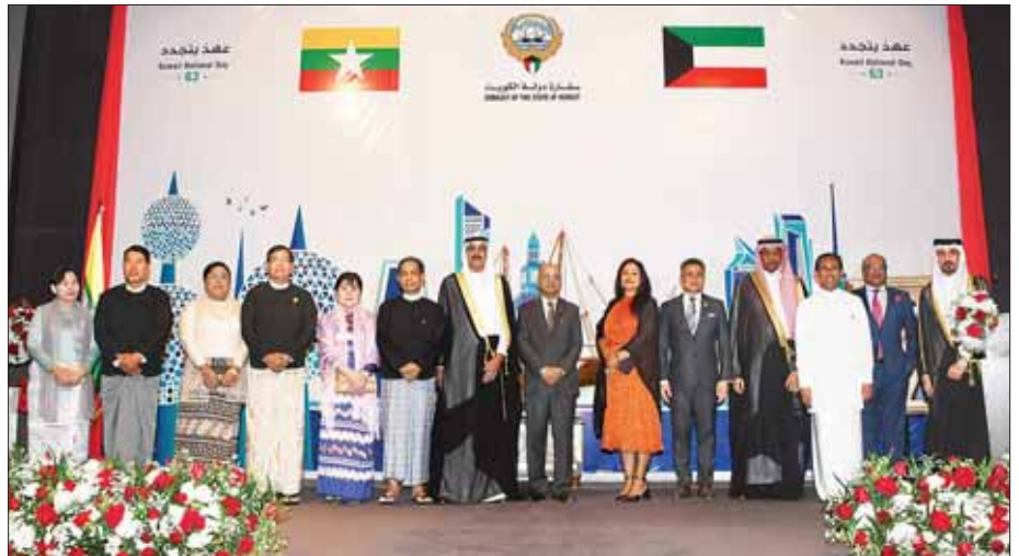
ဖြင့် တည်ခင်းဧည့်ခံသည်။ တက်ရောက် အဆိုပါ အခမ်းအနားသို့ ရန်ကုန်တိုင်းဒေသကြီးဝန်ကြီးချုပ်

နိုင်ငံဆိုင်ရာ ကူပိတ်နိုင်ငံ သံအမတ်ကြီး H.E.Mr. Mubarak Muhanna Eissa Aladwani တို့က ကူပိတ်နိုင်ငံ၏ (၆၃)နှစ်မြောက် အမျိုးသားနေ့နှင့် (၃၃) နှစ်မြောက် လွတ်လပ်ရေးနေ့ အထိမ်းအမှတ်ကိတ်ကို လှီးဖြတ်ပေးကြသည်။ ညစာစားပွဲဖြင့် တည်ခင်းဧည့်ခံ ဆက်လက်၍ ပြည်ထောင်စုဝန်ကြီးနှင့်ဇနီး၊ သံအမတ်ကြီးတို့သည် တက်ရောက်လာကြသူများနှင့်အတူ စုပေါင်းမှတ်တမ်းတင်ဓာတ်ပုံရိုက်ကြပြီး (ယာဝုံ) အခမ်းအနားသို့ တက်ရောက်ကြသူများကို သံအမတ်ကြီးက ညစာစားပွဲ