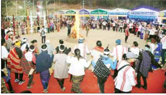
နိုင်ငံတော်စီမံအုပ်ချုပ်ရေးကောင်စီအဖွဲ့ဝင် ဒုတိယဝန်ကြီးချုပ်နှင့် ပို့ဆောင်ရေးနှင့် ဆက်သွယ်ရေးဝန်ကြီးဌာန ပြည်ထောင်စုဝန်ကြီး ဗိုလ်ချုပ်ကြီး မြထွန်းဦးနှင့်အဖွဲ့ဝင်များ ချင်းအမျိုးသားနေ့ပွဲတော်အထိမ်းအမှတ် စီးပွဲပွဲတော်အား ချင်းတိုင်းရင်းသားအကအဖွဲ့များနှင့်အတူ ပါဝင်ဆင်နွှဲစဉ်။