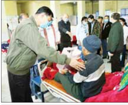
နိုင်ငံတော်စီမံအုပ်ချုပ်ရေးကောင်စီ အဖွဲ့ဝင် ဒုတိယဝန်ကြီးချုပ်နှင့် ပို့ဆောင်ရေးနှင့် ဆက်သွယ်ရေးဝန်ကြီးဌာန ပြည်ထောင်စုဝန်ကြီး ဗိုလ်ချုပ်ကြီး မြထွန်းဦး၊ ဟားခါးမြို့ ပြည်သူ့ဆေးရုံကြီး၌ ဆေးရုံတက်ရောက်ကုသမှုခံယူနေကြသော ဒေသခံပြည်သူများကို အားပေးစကားပြောကြားစဉ်။

စားသောက်ဖွယ်ရာများနှင့်စွဲညီများကို လည်းကောင်း၊ ဆေးရုံအုပ်ကြီးနှင့် ဝန်ထမ်းများကို စားသောက်ဖွယ်ရာများကို လည်းကောင်း ထောက်ပံ့ပေးအပ်သည်။ ပါဝင်ဆင်နွှဲ ထို့နောက် (၇၆)နှစ်မြောက် ချင်းအမျိုးသားနေ့အထိမ်းအမှတ် ဝင်းကျင်း ပြုသောသည့်ပြင် ချင်းရိုးရာအကအဖွဲ့များက ရိုးရာအကများဖြင့် ကပြဖျော်ဖြေမှုကို ကြည့်ရှုအားပေးကြသည်။ ယင်းနောက် ချင်းအမျိုးသားနေ့ပွဲတော် အထိမ်းအမှတ် စီးပွဲပွဲတော်အား ချင်းတိုင်းရင်းသားအကအဖွဲ့များနှင့်အတူ ပါဝင်ဆင်နွှဲကာ ချင်းအမျိုးသားနေ့ပွဲတော်ကို ဝိတ်သိမ်းခဲ့ကြောင်း သတင်းရရှိသည်။ သတင်းစဉ်