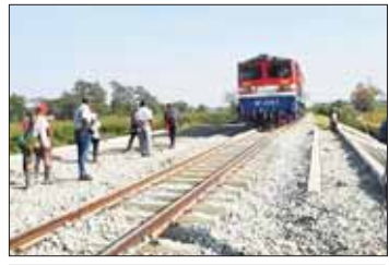
ရန်ကုန်-မန္တလေးရထားလမ်းပိုင်း ပိန်းစလုပ်နှင့် ကျောက်တံခါး ဘူတာအကြား ရထားလမ်းပျက်စီးမှုအား ပြန်လည်ပြုပြင်အမှတ်(၁၁) အဆနံ့ရထားဖြည့်သန့်စဉ်။