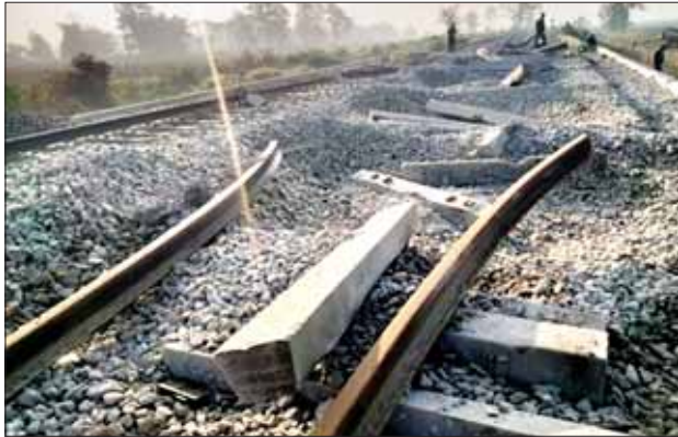
မိုင်းမောက်ခွဲခံရမှုကြောင့် ရန်ကုန်-မန္တလေးရထားလမ်းပိုင်း ပိန်းဇလုပ်နှင့် ကျောက်တံခါးဘူတာအကြား တံတားအမှတ် (၁၄၅)ပေါ်တွင် ရထားလမ်းပျက်စီးဆုံးရှုံးမှုအခြေအနေကို တွေ့ရစဉ်။

နေပြည်တော် ဖေဖော်ဝါရီ ၂၁ ပဲခူးတိုင်းဒေသကြီး ညောင်လေးပင်မြို့နယ် ကျောက်တံခါးဘူတာနှင့် ပိန်းဇလုပ်ဘူတာအကြား မိုင်တိုင်အမှတ်၊ ၁၀၃/၆-၇ ရှိ တံတားအမှတ် (၁၄၅) တွင် ယမန်နေ့ည ၉ နာရီက မိုင်းပေါက်ကွဲသံများကြားရသဖြင့် ကျောက်တံခါး-ပိန်းဇလုပ် ရထားလမ်းပိုင်းအား ခေတ္တစိတ်ထားခဲ့ရသည်။ အဆိုပါ မိုင်းခွဲဖျက်ဆီးခံရမှုကြောင့် ရန်ကုန်-မန္တလေးရထားလမ်းပိုင်းအတွင်း ပြေးဆွဲနေသည့် အမှတ်(၉၃၄)အစုန် ကုန်ရထားသည် ကညွတ်ကွင်းဘူတာသို့ ညနေ ၅ နာရီ ၅၅ မိနစ်တွင်လည်းကောင်း၊ အမှတ်(၉၂၄-A)အစုန် ကုန်ရထားသည် ပြေးဘူတာသို့ ညနေ ၆ နာရီတွင်လည်းကောင်း၊ အမှတ်(၉၂၄-B) အစုန်ကုန်ရထားသည် စာမျက်နှာ ၁၅ ကော်ပီ ၁ ◆