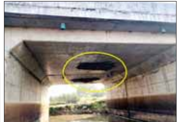
မိုင်းဖောက်ခွဲခံရမှုကြောင့် ရန်ကုန် - မန္တလေးရထားလမ်းပိုင်း ပိန်းစလုပ်နှင့် ကျောက်တံခါးဘူတာအကြား တံတားအမှတ်(၄၅) ကြမ်းခင်းပျက်စီးဆုံးရှုံးမှုအခြေအနေကို တွေ့ရစဉ်။

လုပ်ငန်းများကို ရည်မှန်းချက် ထားရှိ၍ စီမံဆောင်ရွက်ပေးလျက် ရှိသော်လည်း အကြမ်းဖက် သောင်းကျန်းသူများကမူ နိုင်ငံ တော်ပိုင် ရထားစက်ခေါင်းတွဲများ နှင့် ခရီးသည်များ၊ ကုန်စည်များ ထိခိုက်ပျက်စီးစေရေး၊ ပြည်သူ များ အသက်အန္တရာယ်ထိခိုက်ပြီး စိတ်မချမ်းမြေ့စေရေး ရထားဖြင့် ခရီးသွားလာမှု မပြုနိုင်အောင် ခြိမ်းခြောက်ခြင်းတို့ အပြင် ရန်ကုန်-မန္တလေး ရထားလမ်း အဆင့်မြှင့်တင်ရေး စီမံကိန်း လုပ်ငန်းများ အချိန်ပိုကြန့်ကြာ စေရေးတို့အတွက် လှတ်မာ ပတ်စက်သော ရည်ရွယ်ချက်များ ဖြင့် အကြိမ်ကြိမ်ကျူးလွန်နေကြ သောကြောင့် အဆိုပါအကြမ်းဖက် သောင်းကျန်းသူများ၏ ယုတ်မာ ပတ်စက်မှုများအပေါ် သေသံ ညံ့ညာသစ်ရပ်လုပ်က ပြင်းထန်စွာ အဆင့်မြှင့် ကန့်ကွက်ရုတ်ချလျက် ရှိကြောင်း မြန်မာ့မီးရထားမှ သတင်းရရှိသည်။