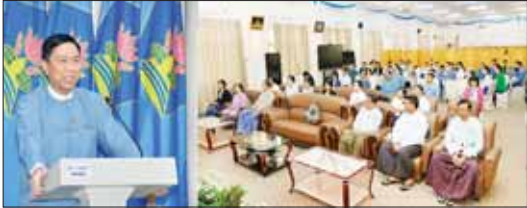
ဘေးအန္တရာယ်ဆိုင်ရာ ကြိုတင်သတိပေးချက်များကို လူတိုင်းရယူအသုံးချနိုင်ရေးဆောင်ရွက်ရမည်ဖြစ်ကြောင်း သိရသည်။

များမှ ညွှန်ကြားရေးမှူးချုပ်များ၊ ဒုတိယညွှန်ကြားရေးမှူးချုပ်များ၊ မိုးလေဝသနှင့် ဇလဗေဒဌာနကြားမှ ဦးစီးဌာနမှ သင်တန်းနည်းပြများ၊ သင်တန်းသား၊ သင်တန်းသူအရာရှိများနှင့် တာဝန်ရှိသူများ တက်ရောက်ကြသည်။ ဦးစီးဌာန ပြည်ထောင်စုဝန်ကြီးက ဝိဇ္ဇာပြည့်စုံသောကြောင့် ကြိုတင်သတိပေးချက်များသည် ဘေးကြောင့် ထိခိုက်ဆုံးရှုံးမှုများကို ဝှု ဝှု ရာခိုင်နှုန်း လျော့ချပေးနိုင်သည်ဟု ကမ္ဘာ့မိုးလေဝသအဖွဲ့ချုပ် (WMO) က အကြံပြုထားကြောင်း၊ ဘေးအန္တရာယ်ကြောင့် ထိခိုက်ဆုံးရှုံးနိုင်ခြေမြင့်တင်ရေးဆိုင်ရာ ဖူဆောင် (၂၀၁၅-၂၀၃၀) လိုအပ်သည့်အချက်များနှင့် ပတ်သက်၍ သဘာဝဘေးအန္တရာယ်ဆိုင်ရာ အစီအစဉ်အားလုံးအတွက် - Early Warning and Action For All” ဟူ၍ အသိပညာဖြန့်ဖြူးတင်ပို့ဆောင်ရွက်ခဲ့ခြင်းဖြစ်ကြောင်း၊ ကြိုတင်သတိပေးချက်များကို ရှင်းလင်းသော အချက်အလက်များကို လိုအပ်သောစီမံခန့်ခွဲမှုများကို လုပ်ဆောင်ခြင်းသည် ဝန်ကြီးဌာန၏ မူဝါဒ