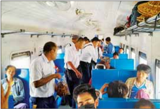
အမှတ်(၁၁)အဆနံ့ရထားဖြင့် လိုက်ပါလာသည့် ခရီးသည်များအား မြန်မာ့မီးရထား ဝန်ထမ်းများက သောက်ရေသန့်နှင့် စားသောက်ဖွယ်ရာများ ဝေငှပေးစဉ်။

နယ်မြေရှင်းလင်းစစ်ဆေး မိမိပေါက်ကွဲမှုဖြစ်ပေါ်ပြီးနောက် ရာဇဓနာသို့ နယ်မြေဒေသတာဝန် ရှိသူများ၊ နယ်မြေလုံခြုံရေး တပ်ဖွဲ့ဝင်တို့က အချိန်နှင့်တစ်ပြေး ညီ နယ်မြေရှင်းလင်းစစ်ဆေးခြင်း များ ဆောင်ရွက်ခဲ့ပြီး မြန်မာ မီးရထားဝန်ထမ်းများက ရထား လမ်းအား သွားရောက်စစ်ဆေးရာ တွင် တံတားအမှတ် (၁၄၅)ပေါ်ရှိ ရထားသံလမ်း နှစ်ဆောင်းမှာ ဝေ ၅၀ ခန့်စီ ပြတ်ထွက်ပျက်စီးခြင်း၊ ကွန်ကရစ်စီမံ ဖားတံ၊ ငွေ တံ၊ ပျက်စီးခြင်း၊ တံတားကွန်ကရစ် ကြမ်းခင်း၌ ငါးပေတော်လည် အပေါက် ငါးပေတော် မြစ်ပေါ်ပျက် စီးဆုံးရှုံးခဲ့ရပြီး လမ်းပိုင်းအား အချိန်ဆုံးဖြတ်လည်ပတ်နိုင်ရေး ရထားလမ်းပြုပြင်ခြင်းကို နံနက် ၁၁ နာရီမှစတင်ဆောင်ရွက်ခဲ့ရာ မွန်းလွဲ ၃ နာရီ ၂၅ မိနစ်တွင် ပြီးစီးသဖြင့် လမ်းပိုင်းအား မွန်းလွဲ ၃ နာရီခွဲတွင် ပြန်လည် မွင်လှည့်ခြင်း အမှတ်(၁၁)အဆနံ့