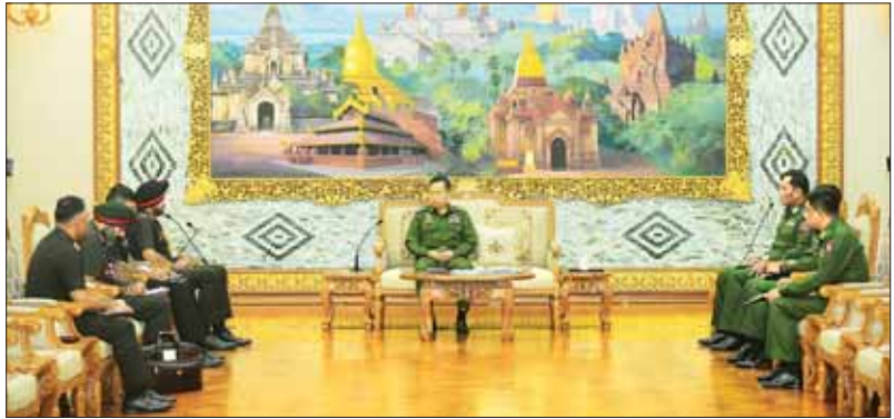
နိုင်ငံတော်စီမံအုပ်ချုပ်ရေးကောင်စီ ဒုတိယဥက္ကဋ္ဌ ဒုတိယတပ်မတော် ကာကွယ်ရေးဦးစီးချုပ် ကာကွယ်ရေးဦးစီးချုပ်(ကြည်း) ဒုတိယဗိုလ်ချုပ်မှူးကြီး ဖိုးဝင်း အိန္ဒိယတပ်မတော်၊ အမှတ်(၃)တပ်မကြီးမှူး ဒုတိယဗိုလ်ချုပ်ကြီး Harjeet Singh Sahi, UVSM, AVSM, YSM, SM ဦးဆောင်သောကိုယ်စားလှယ်အဖွဲ့အား လက်ခံတွေ့ဆုံစဉ်။

တွေ့ဆုံပွဲသို့ နိုင်ငံတော်စီမံအုပ်ချုပ်ရေးကောင်စီ ဒုတိယဥက္ကဋ္ဌ ဒုတိယတပ်မတော် ကာကွယ်ရေးဦးစီးချုပ် ကာကွယ်ရေးဦးစီးချုပ်(ကြည်း) ဒုတိယဗိုလ်ချုပ်မှူးကြီး ဖိုးဝင်းနှင့်အတူ အနောက်မြောက်တိုင်းစစ်ဌာနချုပ်တိုင်းမှူး ဗိုလ်ချုပ်သန်းထိုက်နှင့် ကာကွယ်ရေးဦးစီးချုပ်မှူး တပ်မတော်အရာရှိကြီးများ တက်ရောက်ကြပြီး အိန္ဒိယတပ်မတော်၊ အမှတ်(၃) တပ်မကြီးမှူး ဒုတိယဗိုလ်ချုပ်ကြီး Harjeet Singh Sahi, UVSM, AVSM, YSM, SM နှင့်အတူ အိန္ဒိယစစ်သံမှူး ဗိုလ်မှူးကြီး Jaswinder Singh Gill နှင့် တာဝန်ရှိသူများ တက်ရောက်ခဲ့ကြောင်း သတင်းရရှိသည်။ သတင်းစဉ်