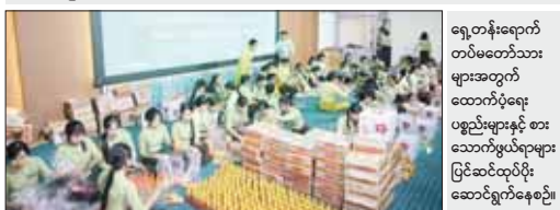
ရှေ့တန်းရောက် တပ်မတော်သားများအတွက် ထောက်ပံ့ရေးပစ္စည်းများနှင့် စားသောက်ဖွယ်ရာများ ပြင်ဆင်ထုပ်ပိုးဆောင်ရွက်နေစဉ်။