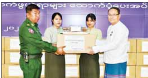
ကရင်ပြည်နယ်ဝန်ကြီးချုပ် ဦးစောမြင့်ဦး အရှေ့တောင်တိုင်းစစ်ဌာနချုပ် ဒုတိယတိုင်းမှူးထံ ရှေ့တန်းရောက် တပ်မတော်သားများအတွက် အသင့်စားသုံးနိုင်သောစားသောက်ကုန်များကို ထောက်ပံ့ပေးအပ်စဉ်။

ရက် နံနက် ၁၀ နာရီက ပြည်နယ်အစိုးရအဖွဲ့မှအစည်းအဝေးခန်းမ (၂)၌ ရှေ့တန်းရောက် တပ်မတော်သားများအတွက် စားသောက်ဖွယ်ရာများ ထောက်ပံ့ပေးအပ်သည်။ ထိုသို့ ထောက်ပံ့ပေးအပ်ရာတွင် ကရင်ပြည်နယ်ဝန်ကြီးချုပ် ဦးစောမြင့်ဦးက တပ်မတော်