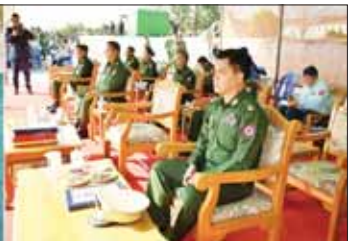
ချုပ်ကိုယ်စားပြု အမှတ်(၁)စစ်တီးဝိုင်းအသင်း၊ ကမ်းရိုးတန်းတိုင်းစစ်ဌာနချုပ်ကိုယ်စားပြု အမှတ်(၁)စစ်တီးဝိုင်းအသင်းနှင့် အရှေ့တိုင်းစစ်ဌာနချုပ်ကိုယ်စားပြု အမှတ်(၁)စစ်တီးဝိုင်းအသင်းတို့ ယှဉ်ပြိုင်နေမှုများကို နေပြည်တော်တိုင်းစစ်ဌာနချုပ် တိုင်းမှူး ဗိုလ်ချုပ်ကြီးအမှတ်(၁) စစ်တီးဝိုင်းအသင်း (ကြည်း၊ ရေ၊ လေ) စစ်တီးဝိုင်းတို့ ယှဉ်ပြိုင်ခဲ့ကြသည်။ အဆိုပါပြိုင်ပွဲ ယှဉ်ပြိုင်နေမှုများကို နေပြည်တော်တိုင်းစစ်ဌာနချုပ် တိုင်းမှူး ဗိုလ်ချုပ်ကြီးအမှတ်(၁) စစ်တီးဝိုင်းအသင်း၊ အရှေ့အလယ်ပိုင်းတိုင်းစစ်ဌာနချုပ်ကိုယ်စားပြု အမှတ်(၁) စစ်တီးဝိုင်းအသင်း၊ အရှေ့အလယ်ပိုင်းတိုင်းစစ်ဌာနချုပ်ကိုယ်စားပြု အမှတ်(၁) စစ်တီးဝိုင်းအသင်း၊ အရှေ့အလယ်ပိုင်းတိုင်းစစ်ဌာနချုပ်ကိုယ်စားပြု အမှတ်(၁) စစ်တီးဝိုင်းအသင်းတို့ ယှဉ်ပြိုင်ခဲ့ကြသည်။