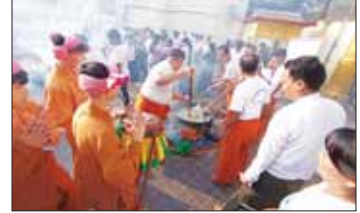
သာယာလှပနေရာတွင် ပထမဆု ရေတွက်ပါးသိန်း ချီးမြှင့်ပေးအပ်သည်။ ပိုလ်တထောင်ကျိုက်ဒေးအပ်ဆံတော်ဦးစေတီတော်မြတ်ကြီးတွင် လာမည့် မေဖော်ဝါရီ ၂၄ ရက် (တပို့ခင်ပတ်ပြည်နေ့)တွင် ဆဋ္ဌမအကြိမ်မြောက်နှစ်မဲဆွဲပွဲကျင်းပ၍ ပြိုင်ပွဲစတင်ပေးအပ်အား ကပ်လူပုဂံဖော်သွားမည်ဖြစ်ပြီး ဘုရားဖူးလာရဟန်းများလည်းကောင်း၊ နှစ်မဲမဲ စတင်သော ရွေးကောက်ပွဲများမည်ဖြစ်ကြောင်း သိရသည်။

ထမန်းထိုးပြိုင်ပွဲများ၏လှည့်ပြိုင်မှုကို တက်ရောက်လာကြသော လူကြီးမင်းများက အကဲဖြတ်အမှတ်ပေး၍ ပထမဆုရရှိသော ဝတ္ထုကခြေ