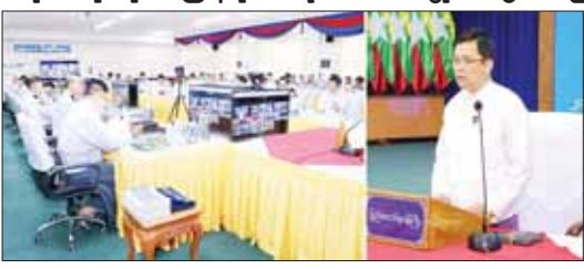
ကောက်ယူရေးလုပ်ငန်းကိုလည်း စီမံချက်များအတိုင်း ဦးစီးဆောင်ရွက်ရမည့်အတွက် ကြိုးပမ်းဆောင်ရွက်ကြရန်လိုအပ်ကြောင်း သန်းခေါင်စာရင်းနှင့်ပတ်သက်၍ ယခုနှစ်ဒီဇင်ဘာလအတွင်း ရှေ့ပြေးလူဦးရေစာရင်းကို ထုတ်ပြန်နိုင်ရေး ဆောင်ရွက်သွားမည်ဖြစ်ကြောင်း သက်ဆိုင်သူများက ပြောကြားခဲ့ကြောင်း သိရသည်။

နေပြည်တော် ဖေဖော်ဝါရီ ၂၁ လူဝင်မှုကြီးကြပ်ရေးနှင့် ပြည်သူ့အင်အားဝန်ကြီးဌာန၏ လက်ငင်းဦးစီးဌာနမှ ဆောင်ရွက်ရမည့် လုပ်ငန်းများနှင့်ပတ်သက်သည့် လုပ်ငန်းညှိနှိုင်းအဖွဲ့အစည်းကို ယနေ့နံနက် ၉ နာရီခွဲက အဆိုပါဝန်ကြီးဌာနအစည်းအဝေးခန်းမ၌ ကျင်းပရာ လူဝင်မှုကြီးကြပ်ရေးနှင့် ပြည်သူ့အင်အားဝန်ကြီးဌာန ပြည်ထောင်စုဝန်ကြီး ဦးမြင့်ကြိုင်၊ ဒုတိယဝန်ကြီးများ ဖြစ်ကြသည့် ဦးဌေးလှိုင်နှင့် ဒေါက်တာမျိုးသန့်၊ အမြဲတမ်းအတွင်းဝန် ဦးစိုးဝင်းတို့အား ဦးစီးဌာနများမှ ညွှန်ကြားရေးမှူးချုပ်များနှင့် ဒုတိယညွှန်ကြားရေးမှူးချုပ်များ တက်ရောက်ကြပြီး တိုင်းဒေသကြီးနှင့် ပြည်နယ်များရှိ တိုင်းဒေသကြီး၊ ပြည်နယ်ဦးစီးဌာနများက သက်ဆိုင်ရာဒေသများမှ အဖွဲ့လိုအပ်သည့် တက်ရောက်ကြည့်ရှုရမည့်