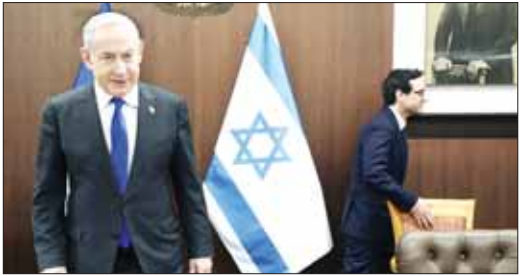
ကြောင်း၊ ကလေး ၄၀ မှ ၅၀ ရာခိုင်နှုန်းမှာ ကူးစက် ချော့များ ခံစားနေရကြောင်း ရာဇာဗြဲရှိ ဆရာဝန် တစ်ဦးက ပြောသည်။ ရာဇာဗြဲရှိ ဂါဇာရှိ အခြား သော နယ်မြေဒေသများမှ ပြောင်းရွှေ့လာသူများ အပါအဝင် လူပေါင်း ၁ ဒသမ ဂျပန်နန်းပေါ် နေထိုင် တစ်ဦးက ပြောသည်။ လျက်ရှိကြောင်း သိရသည်။ အင်အိတ်ချီက

ဟားမားစ်တို့၏ အဆိုပြုချက်ကို လက်ခံမိကြောင်း အစ္စရေး ဝန်ကြီးချုပ် ဘင်ဂျမင်နေတန့်ယာဟုက ၎င်း၏ရုပ်တည်ချက်ကို ထပ်လောင်း ပြောကြားခဲ့သည်။