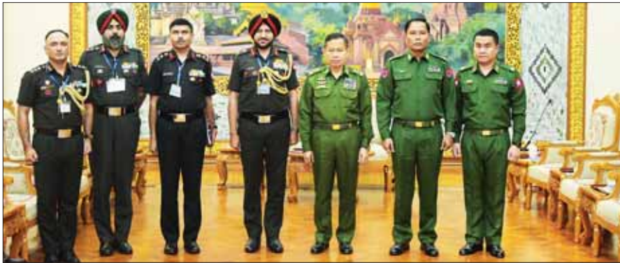
နိုင်ငံတော် စီမံအုပ်ချုပ်ရေးကောင်စီ ဒုတိယဥက္ကဋ္ဌ ဒုတိယတပ်မတော် ကာကွယ်ရေးဦးစီးချုပ် ကာကွယ်ရေးဦးစီးချုပ်(ကြည်း) ဒုတိယဗိုလ်ချုပ်မှူးကြီး ဖိုးဝင်းနှင့်အဖွဲ့ဝင်များ အိန္ဒိယတပ်မတော်၊ အမှတ်(၃) တပ်မကြီးမှူး ဒုတိယဗိုလ်ချုပ်ကြီး Harjeet Singh Sahi, UVSM, AVSM, YSM, SM ဦးဆောင်သောကိုယ်စားလှယ်အဖွဲ့နှင့်အတူ ဖုပေါင်းစာတံပုံရိုက်စဉ်။