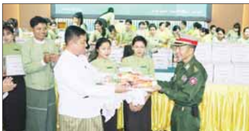
ဗမာ့ပြည်နယ်ဝန်ကြီးချုပ် ဦးအောင်ကြည်သိန်း ပြည်နယ်လုံခြုံရေးနှင့်နယ်စပ်ရေးရာဝန်ကြီးထံ ရှေ့တန်းရောက်တပ်မတော်သားများအတွက် ထောက်ပံ့ရေးပစ္စည်းများနှင့် စားသောက်ဖွယ်ရာများ ပေးအပ်စဉ်။