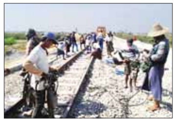
မိုင်းဖောက်ခွဲခံရမှုကြောင့် ရန်ကုန် - မန္တလေးရထားလမ်းပိုင်း ပိန်းစလုပ်နှင့် ကျောက်တံခါးဘူတာအကြား ရထားလမ်းပျက်စီးမှုအား ပြန်လည်ပြုပြင်နေစဉ်။