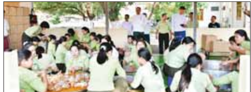
ကရင်ပြည်နယ်ဝန်ကြီးချုပ်နှင့် ပြည်နယ်အစိုးရအဖွဲ့ဝင်များ ရှေ့တန်းရောက်တပ်မတော်သားများအတွက် ပြည်နယ်အစိုးရအဖွဲ့ဝင်များ၏ဇနီးများနှင့် ဌာနဆိုင်ရာဝန်ထမ်းများက အသင့်စားသုံးနိုင်သော အစားအစာများ ကြော်ငြော့ချက်ပြုတ် ပြင်ဆင်ထုပ်ပိုးနေမှုများကို ကြည့်ရှုအားပေးစဉ်။