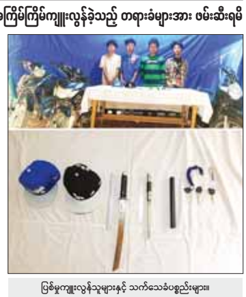
ဖြစ်မှုကျူးလွန်သူများနှင့် သက်သေခံပစ္စည်းများ

ဖြင့် ထိုး၍ ဆိုင်ကယ်ကို လှည့်ပေးနိုင်စွမ်းရရှိခဲ့ကြောင်း သိရှိရသည်။