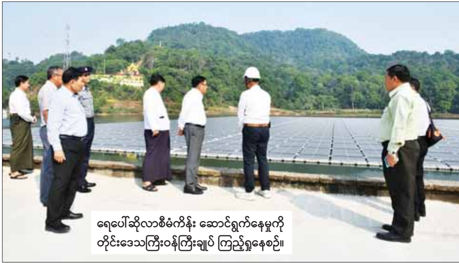
ရေပေါ်ဆိုလာစီမံကိန်း ဆောင်ရွက်နေမှုကို တိုင်းဒေသကြီးဝန်ကြီးချုပ် ကြည့်ရှုနေစဉ်။

ကျွန်းစု ဖေဖော်ဝါရီ ၁၇ တနင်္သာရီတိုင်းဒေသကြီး ကျွန်းစုမြို့နယ် ပထော်ကျေးရွာရှိ ပထော်ရေလှောင်တံခွန် ပြည့်ဖြိုးထွန်းအင်တာနေရှင်နယ် ကုမ္ပဏီလီမိတက်နှင့် မြန်မာဆိုလာပါဝါထရေဒင်း ကုမ္ပဏီလီမိတက်တို့က တပ်ဆင်ဆောင်ရွက်လျက်ရှိသည့် ဆိုလာစွမ်းအင် ၃ ဒသမ ၇၇ မီဂါဝပ် ထုတ်ပေးနိုင်မည့် ရေပေါ်ဆိုလာစနစ်လုပ်ငန်း စီမံကိန်းဆောင်ရွက်နေမှုကို တိုင်းဒေသကြီးဝန်ကြီးချုပ် ဦးမြတ်ကိုနှင့် တိုင်းဒေသကြီး သယံဇာတရေးရာဝန်ကြီးတို့က ဖေဖော်ဝါရီ ၁၆ ရက်တွင် သွားရောက်ကြည့်ရှုအားပေးသည်။