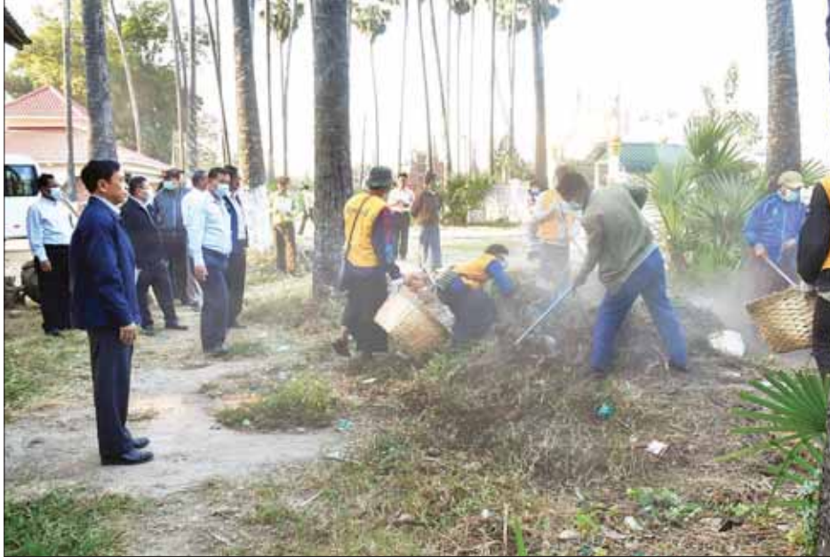
သည် ဇေယျသီရိမြို့နယ် သိဒ္ဓိ(၉)ရပ်ကွက်ရှိ ဝန်ထမ်း လှည့်လည်ကြည့်ရှုစစ်ဆေးပြီး လိုအပ်သည်များကို အိမ်ရာများ၊ စာသင်ကျောင်းများနှင့် ဈေးများ မှာကြားခဲ့ကြောင်း သိရသည်။ တွင် သန့်ရှင်းသာယာရေး ဆောင်ရွက်ထားရှိမှုကို သတင်းစဉ်

ပတ်ဝန်းကျင်တွင် ဌာနဆိုင်ရာဝန်ထမ်းများ၊ တပ်မ တော်သားများ၊ မြန်မာနိုင်ငံ ရဲတပ်ဖွဲ့၊ မီးသတ်တပ်ဖွဲ့ ဝင်များ၊ စည်ပင်သာယာရေးအဖွဲ့များ၊ ကြက်ခြေနီ တပ်ဖွဲ့ဝင်များ၊ ဆရာ၊ ဆရာမများနှင့် လူမှုရေး အသင်းအဖွဲ့များက ချို့နှယ်များ၊ ပေါင်းမြက်များ၊ အမှုကိစ္စများ ရှင်းလင်းကာ စုပေါင်းသန့်ရှင်းရေး ဆောင်ရွက်နေမှုကို ကြည့်ရှုအားပေးပြီး နေပြည်တော် ကောင်စီဥက္ကဋ္ဌက ဘုရားဖူးလာပြည်သူများ စိတ်ချမ်း မြေစွာဖြင့် ဖူးမြော်ကြည့်ညိနိုင်ရန်နှင့် ရှေးဟောင်း စေတီတော်များ၏ သမိုင်းအကျဉ်းကို ထင်သာ မြင်သာနေရာများတွင် စိုက်ထူထားရှိရန် မှာကြား သည်။ ယင်းနောက် နေပြည်တော်ကောင်စီဥက္ကဋ္ဌနှင့် အဖွဲ့