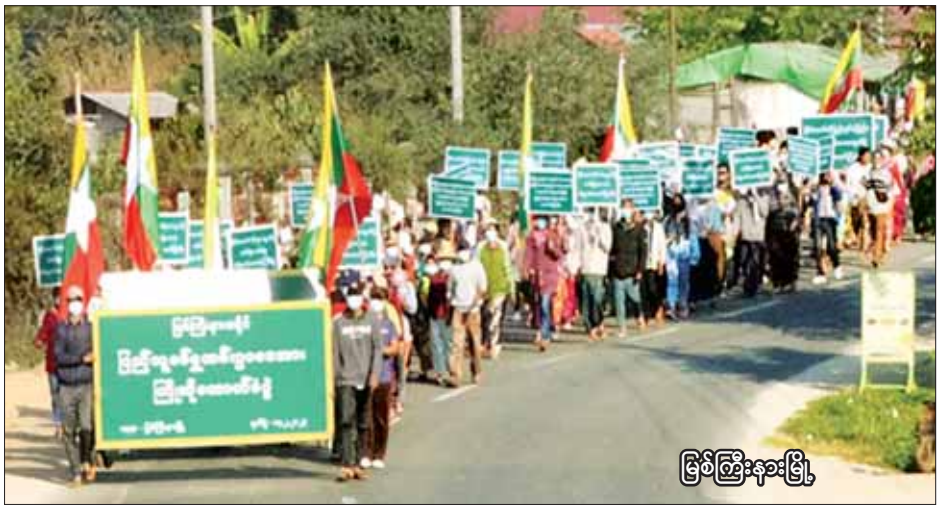
မြစ်ကြီးနားမြို့

ဦးစွာ သက်ဆိုင်ရာမြို့နယ်များမှ ဒေသခံတိုင်းရင်းသား မျိုးချစ်ပြည်သူများက သတ်မှတ်နေရာ အသီးသီး၌ စုဝေးကြပြီး ကျင်းပမည့်နေရာအသီးသီးသို့ ချီတက်ထောက်ခံကြသည်။ ချီတက်ရာလမ်းတစ်လျှောက်တွင် ဒေသခံမျိုးချစ်ပြည်သူများက “ဒို့တာဝန်အရေးသုံးပါးကို ထိန်းသိမ်းစောင့်ရှောက်ရန်အတွက် စစ်ပညာသင်ကြားရန်နှင့် နိုင်ငံတော်ကာကွယ်ရေးအတွက် စစ်မှုထမ်းဆောင်ရန် နိုင်ငံသားတိုင်းတွင် တာဝန်ရှိသည်၊ ပြည်သူ့စစ်မှုထမ်းဥပဒေကို အပြည့်အဝထောက်ခံကြိုဆိုပါသည်။ နိုင်ငံတော်ကို ကာကွယ်ဖို့ တစ်မျိုးသားလုံး စစ်မှုထမ်းဆောင်ကြပါစို့။ နိုင်ငံတော်ကို ပြည်တွင်း/ပြည်ပ အန္တရာယ်များက ကာကွယ်ဖို့ စစ်မှုထမ်းဆောင်ကြပါစို့။ နိုင်ငံတော်၏ လွတ်လပ်ရေး၊ အချုပ်အခြာအာဏာနှင့် နယ်မြေတည်တံ့ခိုင်မြဲရေးတို့ကို ကာကွယ်စောင့်ရှောက်ရေးသည် နိုင်ငံသားတိုင်း၏ တာဝန်