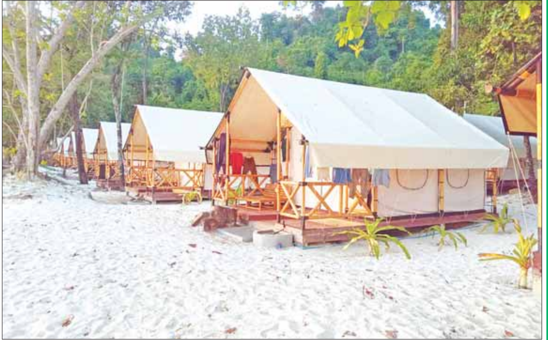
ကျွန်းပေါ်၌ ညအိပ်တည်းခိုအပန်းဖြေနိုင်ရန် ဆောက်ထားပေးသော အဆောက်အအုံများ။

ဆေးတံကျွန်းကနေတစ်ဆင့် နာမည် ကြီးတဲ့ အသည်းပုံကျွန်းနဲ့ ဇာဒက်အော် တို့ကိုလည်း အချိန်တိုအတွင်း အလွယ်တကူ သွားရောက်လည်ပတ် နိုင်ပါသေးတယ်။ ဒုတိယ ညွှန်ကြားရေးမှူး ဦးလွမ်းမိုးက “၂၀၁၅ မှာ နေ့ချင်းပြန် ခရီးစဉ်တွေကို စတင်ခွင့်ပြုပေးတုန်းက