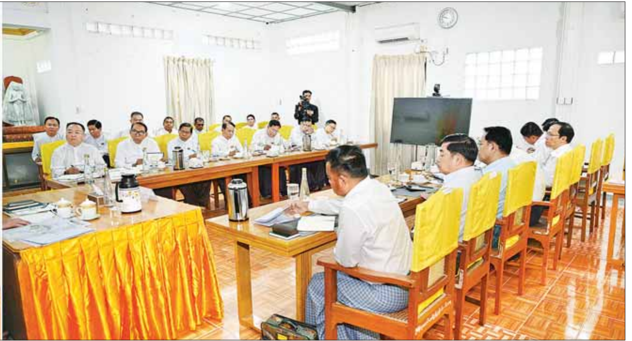
ဗုဒ္ဓဘာသာကလျာဏယုဝအသင်းကြီး (YMBA) ၏ ရာသက်ပန်ဂုဏ်ထူးဆောင်နာယက အဂ္ဂမဟာမင်္ဂလဓမ္မဇောတိကဇေ နိုင်ငံတော်စီမံအုပ်ချုပ်ရေးကောင်စီဥက္ကဋ္ဌ နိုင်ငံတော်ဝန်ကြီးချုပ် ဗိုလ်ချုပ်မှူးကြီး မင်းအောင်လှိုင် ဗုဒ္ဓဘာသာကလျာဏယုဝအသင်း (ဗဟို)မှ အဖွဲ့ဝင်များအား တွေ့ဆုံအမှာစကားပြောကြားစဉ်။

ရှေ့ဖို့မှ နာယကများ၊ ဒုတိယဥက္ကဋ္ဌနှင့် အဖွဲ့ဝင်များ တက်ရောက်ကြသည်။ ဦးစွာ ဗုဒ္ဓဘာသာကလျာဏယုဝအသင်းကြီး (YMBA) ၏ ရာသက်ပန် ဂုဏ်ထူးဆောင် နာယက အဂ္ဂမဟာမင်္ဂလဓမ္မဇောတိကဇေ နိုင်ငံတော်စီမံအုပ်ချုပ်ရေးကောင်စီဥက္ကဋ္ဌ နိုင်ငံတော်ဝန်ကြီးချုပ် ဗိုလ်ချုပ်မှူးကြီး မင်းအောင်လှိုင် အား ဗုဒ္ဓဘာသာကလျာဏယုဝအသင်းကြီး (YMBA) ဥက္ကဋ္ဌ ဦးရဲထွန်းနှင့် နာယကများ၊ ဒုတိယဥက္ကဋ္ဌနှင့် အဖွဲ့ဝင်များက ကြိုဆိုနှုတ်ဆက်ကြသည်။ ရှင်းလင်းတင်ပြ ထိုနောက် ဗုဒ္ဓဘာသာကလျာဏယုဝအသင်း(ဗဟို) ရုံးဧည့်ခန်းမဆောင်၌ YMBA အသင်းချုပ်ဥက္ကဋ္ဌ ဦးရဲထွန်းက ဗုဒ္ဓဘာသာကလျာဏယုဝအသင်းကြီးမှ တစ်နိုင်လုံးအတိုင်းအတာဖြင့် အဘိဓမ္မာနှင့် ယဉ်ကျေးလိမ္မာသင်တန်းများ၊ ဘာသာစကားသင်တန်းများ သင်ကြားပို့ချပေးလျက်ရှိမှု၊ ပြည်သူ့အကျိုးပြုလုပ်ငန်းများတွင် YMBA အသင်းသားများမှ ပါဝင်ဆောင်ရွက်ပေးလျက်ရှိမှု၊ သဘာဝဘေးအန္တရာယ် ကူညီကယ်ဆယ်ရေးအတွက် အစုအဖွဲ့များ စုဖွဲ့ထားရှိမှု၊ ဗုဒ္ဓဘာသာကလျာဏ ယုဝအသင်း(ဗဟို) ရုံးချုပ်အဆောက်အဦသစ် တည်ဆောက်ရန် လျာထားဆောင်ရွက်လျက်ရှိမှုနှင့် အဆိုပါအဆောက်အဦသစ်အတွင်း၌ YMBA အသင်းကြီး၏ သမိုင်းဝင် ပြခန်းအပါအဝင် အခန်းများ အလိုက်နေရာချထားရန်လျာထားမှုနှင့် လုပ်ငန်းဆောင်ရွက်မှုအခြေအနေများကို ရှင်းလင်းတင်ပြသည်။ ရှင်းလင်းတင်ပြမှုများအပေါ် ဗုဒ္ဓဘာသာကလျာဏယုဝအသင်းကြီး (YMBA) ၏ ရာသက်ပန် ဂုဏ်ထူးဆောင်နာယက အဂ္ဂမဟာမင်္ဂလဓမ္မဇောတိကဇေ နိုင်ငံတော်