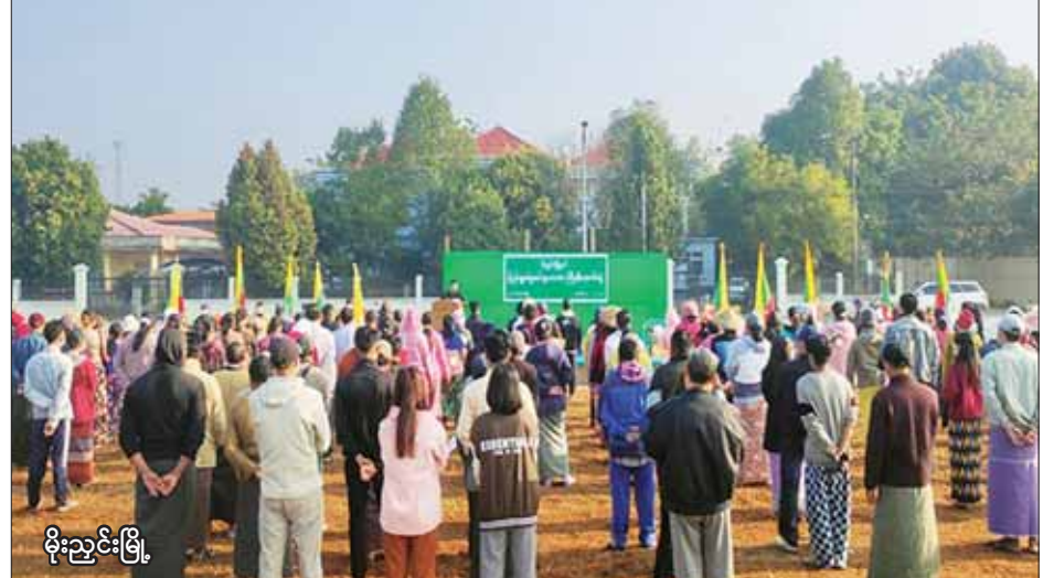
မိုးညှင်းမြို့

ဖြစ်သည်” စသည့် ကြွေးကြော်သံများကို သံပြိုင်ကြွေးကြော်ခဲ့ကြပြီး သတ်မှတ်နေရာအသီးသီးတွင် ပြည်သူ့စစ်မှုထမ်းဥပဒေအား ကြိုဆိုထောက်ခံပွဲပြုလုပ်ခဲ့ကြောင်း သတင်းရရှိသည်။ သတင်းစဉ်