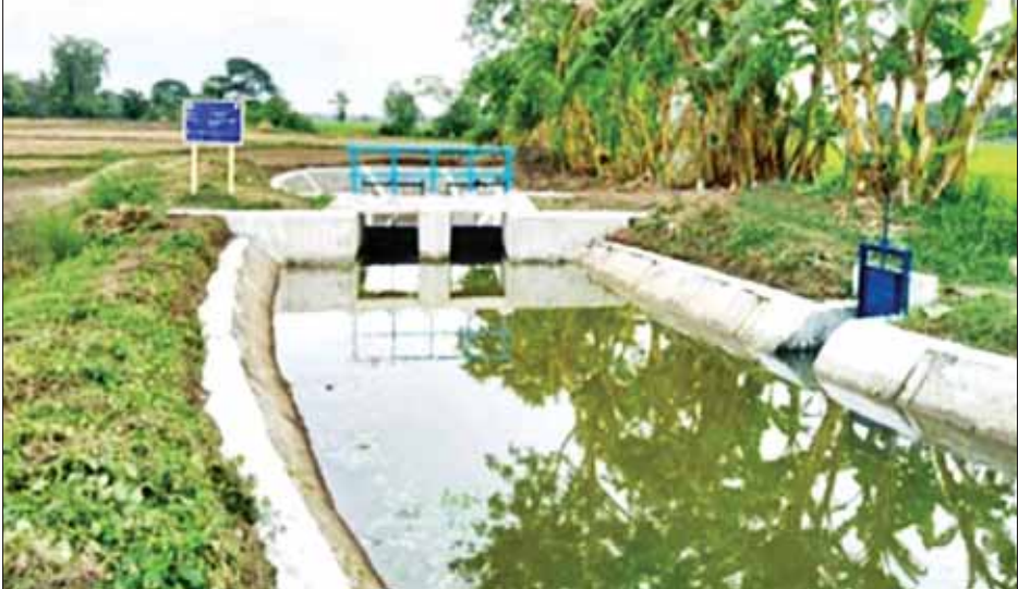
ပန်းတောင်းမြို့နယ် ညောင်ကိုင်းဆည်မှ ဆည်ရေပေးဝေမှု။

ညောင်ကိုင်းဆည်မှ ဧက ၄၅၀၊ ကန်ကြီးကုန်းဆည် မှ ၁၅၅ ဧကနှင့် ခဝါဆည်မှ ၂၇၇ ဧက ပေးဝေသွား မည်ဖြစ်ကြောင်း သိရသည်။ နတ်တလင်းခရိုင်တွင် ဆည်များဖြစ်သော ဝဲကြီး ဆည်ရေဖြင့် ၂၇၇၂ ဧက၊ မြောက်နဝင်းဆည်ရေဖြင့် ၂၂၅၅ ဧကနှင့် တောင်နဝင်းဆည်ရေဖြင့် ၈၀၆၇ ဧကကို စိုက်ပျိုးရေးပေးဝေသွားမည်ဖြစ်သည်။ ထို့ပြင် ပြည်ခရိုင်နှင့် နတ်တလင်းခရိုင်အတွင်းရှိ နွေစပါး စိုက်ပျိုးဧကများ ရေလုံလောက်စွာရရှိရေးအတွက် တံခါးပိတ် လျှပ်စစ်ရေတင်နှင့် ဆိုလာရေတင် စသည့် နည်းလမ်းများဖြင့်လည်း နွေစပါးစိုက်ဧက ၆၃၇၂ ဧက ကို စိုက်ပျိုးရေးပေးဝေသွားမည်ဖြစ်သဖြင့် စုစုပေါင်း နွေစပါးစိုက်ဧက ၆၆၆၁၂ ဧကကို ရေပေးဝေသွားမည် ဖြစ်သည်။ ယင်းသို့ နွေစပါးစိုက်ပျိုးရေး ဖူလုံပြည့်ဝစွာ ပေးဝေနိုင်ရေးအတွက် ပဲခူးတိုင်းဒေသကြီးအနောက် ပိုင်း ဆည်မြောင်းနှင့်ရေအသုံးချမှုစီမံခန့်ခွဲရေးဦးစီး ဌာန(ပြည်)ရုံးအနေဖြင့် ကျေးတောဆည် တည် ဆောက်ခြင်း၊ မင်းဆည်တည်ဆောက်ခြင်း၊ မြောင်းပေါင်များမြှင့်ပေးခြင်း၊ သဲနန်းများဆယ်ခြင်း၊ ရေကူးမြောင်းများပြုပြင်ခြင်း၊ ရေတံခါးများ ပြုပြင်