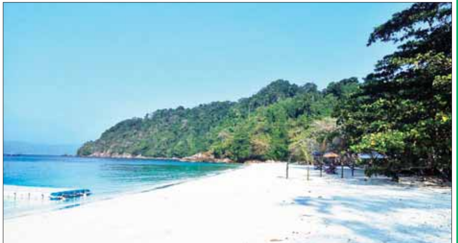
ဆေးတံကျွန်းကမ်းခြေ၌ အနားယူနိုင်ရန် ထားရှိပေးထားသော ခုံများနှင့် ကမ်းခြေ၏ သဘာဝအလှရှုခင်း။