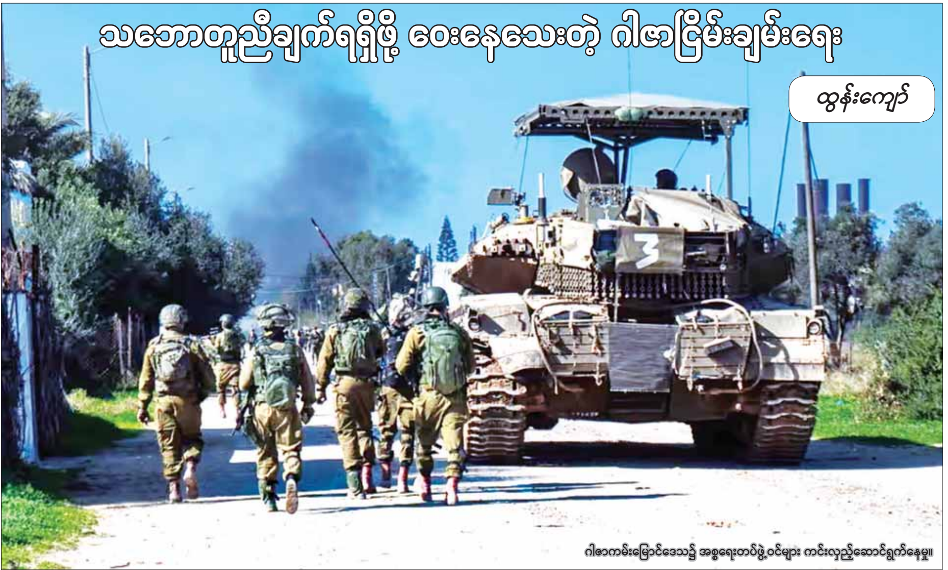
ဂါဇာကမ်းမြောက်ဒေသ၌ အစွဲရေတပ်ဖွဲ့ဝင်များ ကင်းလှည့်ဆောင်ရွက်နေမှု။

ဟားမားစ် ခေါင်းဆောင် အစွဲမေးလ် ဟာနီယာက ဂါဇာကမ်းမြောက် ဒေသမှာ ပစ်ခတ်တိုက်ခိုက်မှုရပ်စဲရေးသဘောတူညီချက်ရရှိအောင် ကြိုးစားတဲ့နေရာမှာ နောင်နှေးကြန့်ကြာအောင် လုပ်တယ်ဆိုပြီး အစွဲရေခေါင်းဆောင်ကို စွပ်စွဲလိုက်ပါတယ်။ မိမိတို့အပေါ် ရန်လို ကျူးကျော်တိုက်ခိုက်မှုတွေ ရပ်တန့်စေဖို့နဲ့ မတရားသိမ်းပိုက်မှု တွေ အဆုံးသတ်စေဖို့ အကူအညီအထောက်အပံ့များ စီးဆင်းရေးနဲ့ တည်ဆောက်ရေးလုပ်ငန်းများကို ခွင့်ပြုစေဖို့ အချိန်တိုင်း အပြုသဘောဆောင်စိတ်ဓာတ်နဲ့ တာဝန်ရှိရှိဖြင့် လုပ်ဆောင်လျက် ရှိတယ်ဆိုပြီး ဟားမားစ်ခေါင်းဆောင်ကတော့ ပြောခဲ့ပါတယ်။