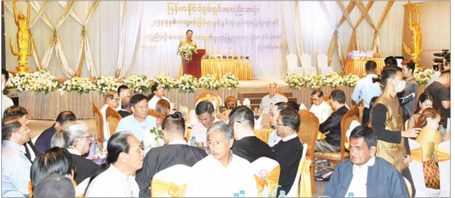
ပြည်ထောင်စုဝန်ကြီး ဦးမောင်မောင်အုန်း ၂၀၂၃ ခုနှစ်အတွက် မြန်မာ့ရုပ်ရှင်ထူးချွန်ဆုရရှိသူများနှင့် မြန်မာ့ရုပ်ရှင်ထူးချွန်ဆု ချီးမြှင့်ပွဲအခမ်းအနားဖြစ်မြောက်ရေးအတွက် ဝိုင်းဝန်းကူညီဆောင်ရွက်ခဲ့ကြသည့်အဖွဲ့အစည်းများ၊ လူပုဂ္ဂိုလ်များအား တည်ခင်းဧည့်ခံသည့် ဂုဏ်ပြုညစာစားပွဲတွင် အမှာစကားပြောကြားစဉ်။

ရန်ကုန် ဖေဖော်ဝါရီ ၁၇ ပြန်ကြားရေးဝန်ကြီးဌာန ပြည်ထောင်စုဝန်ကြီး ဦးမောင်မောင်အုန်းသည် ယနေ့ ညနေပိုင်းက ရန်ကုန်မြို့ ရန်ကင်းမြို့နယ် အမှတ်(၁၅) မိုးကောင်းလမ်းရှိ မြန်မာစီးပွားရေးကော်ပိုရေးရှင်း၊ သတင်းနှင့် မီဒီယာလုပ်ငန်း(မြဝတီ) (MWD Media Centre) ၌ ကျင်းပပြုလုပ်သည့် ၂၀၂၃ ခုနှစ်အတွက် မြန်မာ့ရုပ်ရှင်ထူးချွန်ဆု ရရှိသူများနှင့် မြန်မာ့ရုပ်ရှင်ထူးချွန်ဆု ချီးမြှင့်ပွဲအခမ်းအနား ဖြစ်မြောက်ရေးအတွက် ဝိုင်းဝန်းကူညီဆောင်ရွက်ခဲ့ကြသည့်အဖွဲ့အစည်းများ၊ လူပုဂ္ဂိုလ်များအား တည်ခင်းဧည့်ခံသည့် ဂုဏ်ပြုညစာစားပွဲသို့ တက်ရောက်ချီးမြှင့်သည်။