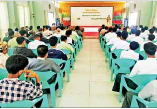
ခွင့်ပြုသည့် အချက်များ၊ ပြည်သူ့ များ၊ ပြစ်မှုပြစ်ဒဏ်များကို စစ်မှုထမ်းဥပဒေနှင့် ပတ်သက် ရှင်းလင်းပြောကြားသည်။ သည့်ဥပဒေ၊ လုပ်ထုံး လုပ်နည်း လှိုင်းလေး(ပွင့်ဖြူမြေ)

ပွင့်ဖြူ ဖေဖော်ဝါရီ ၁၇ ဆွေးနွေးပွဲတွင် ပွင့်ဖြူမြို့နယ် မကွေးတိုင်းဒေသကြီး ပွင့်ဖြူ မြို့နယ်အတွင်းရှိ ဒေသခံပြည်သူ များ ပြည်သူ့စစ်မှုထမ်းဥပဒေ အကြောင်းအရာများနှင့် စပ်လျဉ်း ၍ သိရှိနားလည်နိုင်စေရန်နှင့် ပူးပေါင်းပါဝင် ဆောင်ရွက်နိုင်စေ ရန်ရည်ရွယ်ချက်ဖြင့် ပြည်သူ့ စစ်မှုထမ်းဥပဒေဆိုင်ရာ အသိ ပညာပေး ဆွေးနွေးပွဲကို ဖေဖော်ဝါရီ ၁၇ ရက် နံနက် ၉ နာရီခွဲက မြို့နယ်အထွေထွေ အုပ်ချုပ်ရေးဦးစီးဌာနရုံး ဗိုလ်ဥက္ကဋ္ဌ ခန်းမဉ် ကျင်းပသည်။