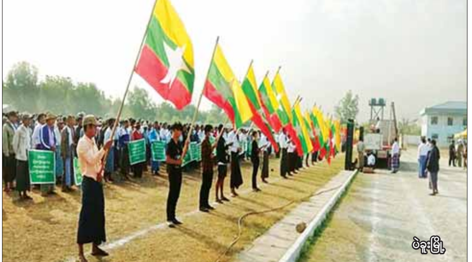
ပဲခူးမြို့