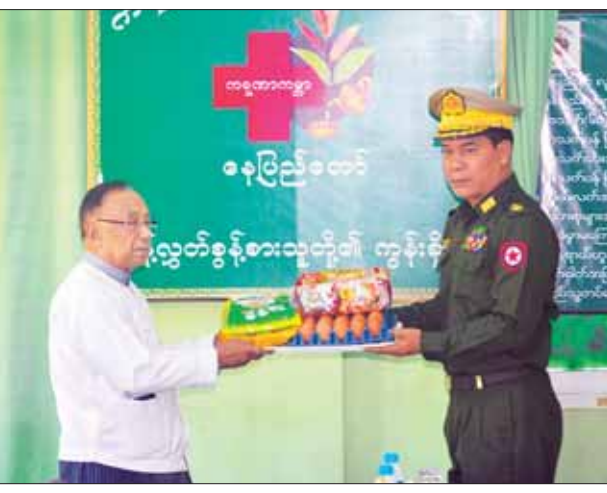
အိပ်ဆောင်များ၊ ကျန်းမာရေးစောင့်ရှောက် ပေးနေမှုများကို လှည့်လည်ကြည့်ရှုပြီး လိုအပ်သည်များ ညှိနှိုင်းဖြည့်ဆည်းဆောင်ရွက်ပေးခဲ့ကြောင်း သတင်းရရှိသည်။ သတင်းစဉ်

ဦးစွာ ကရုဏာကမ္ဘာ ဘိုးဘွားရိပ်သာမှ တာဝန်ရှိသူတစ်ဦးက စွန့်လွှတ်စွန့်စားသူတို့၏ ကွန်းခိုရာ ကရုဏာကမ္ဘာဘိုးဘွားရိပ်သာ(နေပြည်တော်)ရှိ အဘိုး၊ အဘွားများအား ပြုစုစောင့်ရှောက်ပေးနေမှုနှင့် ပတ်သက်၍ ရှင်းလင်းပြောကြားသည်။ ထို့နောက် တိုင်းမှူးက အဘိုး၊ အဘွားများအတွက် အလှူငွေများ၊ တိုင်းရင်းဆေးဝါးများနှင့် စားသောက်ဖွယ်ရာများ ပေးအပ်လှူဒါန်းရာတာဝန်ရှိသူတစ်ဦးက လက်ခံရယူသည်။ (ယာဝုံ) ယင်းနောက် တိုင်းမှူးနှင့် တာဝန်ရှိသူများက အဘိုး၊ အဘွားများ၏ ထမင်းစားဆောင်၊