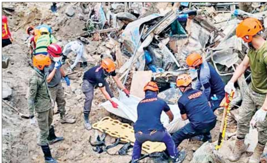
မြေပြိုမှုကြောင့် ကယ်ဆယ်ရေးလုပ်ငန်းများ လုပ်ဆောင်စဉ်။

ပစ်ဖိတ်မီးတောင်ရပ်ဝန်းတွင် တည်ရှိပြီး ကျွန်းစုဖြစ်သည့် ဖိလစ်ပိုင်နိုင်ငံသည် အင်အားပြင်းတိုင်ဖွန်းမုန်တိုင်း မကြာခဏ တိုက်ခတ်ခံရလေ့ရှိကြောင်း သိရသည်။