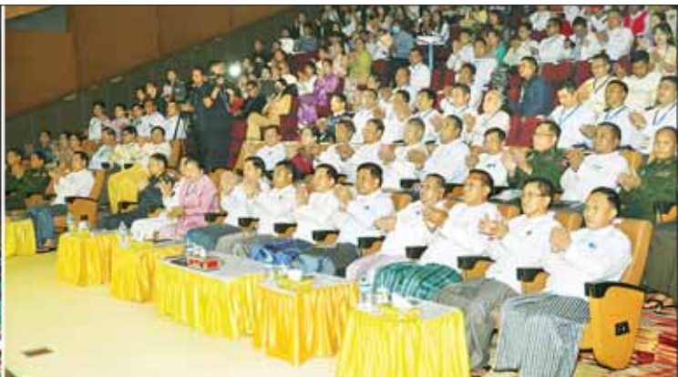
နိုင်ငံတော်စီမံအုပ်ချုပ်ရေးကောင်စီဥက္ကဋ္ဌ နိုင်ငံတော်ဝန်ကြီးချုပ် ဗိုလ်ချုပ်မှူးကြီး မင်းအောင်လှိုင်နှင့်အဖွဲ့ဝင်များ အနုပညာရှင်များ၏ ဖျော်ဖြေတင်ဆက်မှုကို ကြည့်ရှုအားပေးစဉ်။