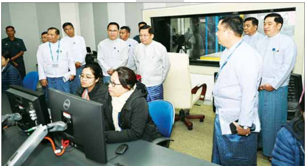
နိုင်ငံတော်စီမံအုပ်ချုပ်ရေးကောင်စီဥက္ကဋ္ဌ နိုင်ငံတော်ဝန်ကြီးချုပ် ဗိုလ်ချုပ်မှူးကြီး မင်းအောင်လှိုင်နှင့်အဖွဲ့ဝင်များ မြန်မာ့အသံနှင့် ရုပ်မြင်သံကြားအတွင်း ပြန်ကြားရေးနှင့် ထုတ်လွှင့်ရေးလုပ်ငန်းဆောင်ရွက်နေမှုများကို လိုက်လံကြည့်ရှုစဉ်။

သတင်းမှန်များကို ထုတ်လွှင့်ဖော်ပြပေး အားလုံးသိကြသည့်အတိုင်း ယနေ့နိုင်ငံတော် တွင် ပြည်တွင်းပြည်ပ သွေးထိုးမြှောက်ပင်ပေးနေခြင်း