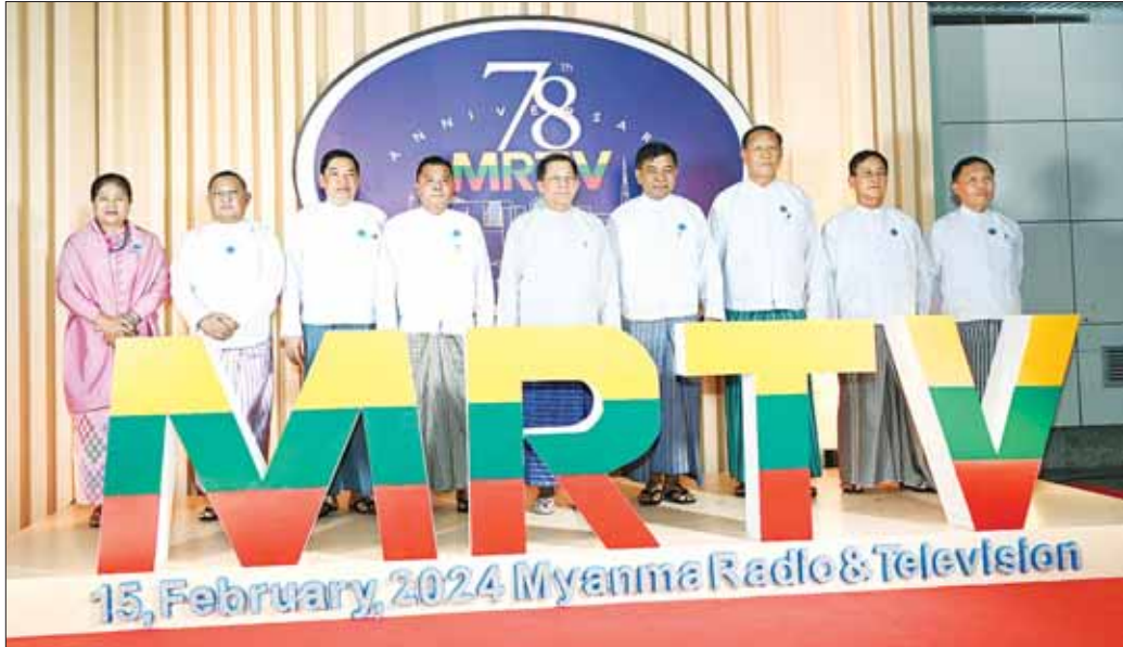
နိုင်ငံတော်စီမံအုပ်ချုပ်ရေးကောင်စီဥက္ကဋ္ဌ နိုင်ငံတော်ဝန်ကြီးချုပ် ဗိုလ်ချုပ်မှူးကြီး မင်းအောင်လှိုင် အခမ်းအနားတက်ရောက်လာကြသူများနှင့် စုပေါင်းမှတ်တမ်း တင်စာတံပုံရိုက်စဉ်။

၎င်းနောက် နိုင်ငံတော်စီမံအုပ်ချုပ်ရေးကောင်စီ