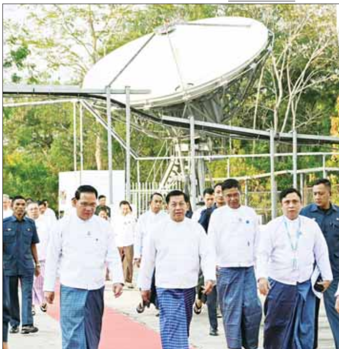
နိုင်ငံတော်စီမံအုပ်ချုပ်ရေးကောင်စီဥက္ကဋ္ဌ နိုင်ငံတော်ဝန်ကြီးချုပ် ဗိုလ်ချုပ်မှူးကြီး မင်းအောင်လှိုင်နှင့်အဖွဲ့ဝင် များ မြန်မာ့အသံနှင့် ရုပ်မြင်သံကြားအတွင်း ပြန်ကြားရေးနှင့် ထုတ်လွှင့်ရေးလုပ်ငန်းဆောင်ရွက်နေမှု များကို လိုက်လံကြည့်ရှုစဉ်။

□ မြန်မာ့အသံနှင့် ရုပ်မြင်သံကြားအနေဖြင့် နိုင်ငံတော်နှင့် ပြည်သူ့အကျိုးအတွက် ကြိုးပမ်းအကောင်အထည်ဖော်ဆောင်ရွက်ရာတွင် ခေတ်အဆက်ဆက်က MRTV ၏ ဝန်ထမ်းဟောင်းများ သူ့ခေတ်သူ့အခါအလိုက် တာဝန်ကျေပွန် ခဲ့ကြသကဲ့သို့ MRTV ၏ မျိုးဆက်သစ်ဝန်ထမ်းများကလည်း “ပြည်ထောင်စု မြန်မာနိုင်ငံတော်ကြီး ရေရှည်တည်တံ့ခိုင်မြဲစေရန်” သမိုင်းပေးတာဝန်များကို သစ္စာရှိရှိဖြင့် ဝန်ထမ်းကောင်းများပီသစွာ ကျေပွန်အောင် ဆက်လက်ထမ်းဆောင် ကြရမည်