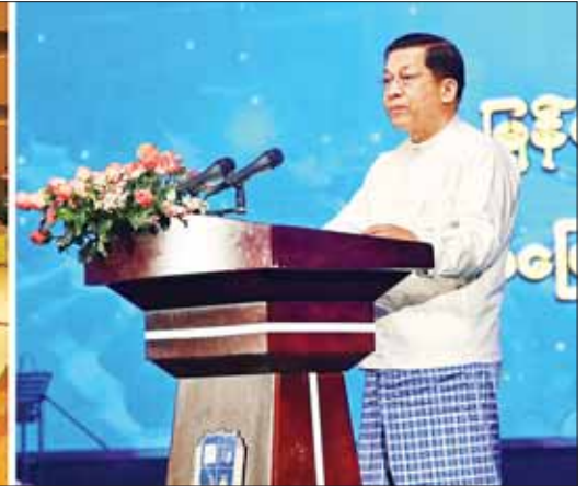
နိုင်ငံတော်စီမံအုပ်ချုပ်ရေးကောင်စီဥက္ကဋ္ဌ နိုင်ငံတော်ဝန်ကြီးချုပ် ဗိုလ်ချုပ်မှူးကြီး မင်းအောင်လှိုင် ပြန်ကြားရေးဝန်ကြီးဌာန၊ မြန်မာ့အသံနှင့် ရုပ်မြင်သံကြား၏ (၇၈) နှစ်မြောက် နှစ်ပတ်လည်နေ့အခမ်းအနားတွင် ဂုဏ်ပြုအမှာစကားပြောကြားစဉ်။

၂ ရှေ့မှ ဦးစွာ နိုင်ငံတော်စီမံအုပ်ချုပ်ရေးကောင်စီဥက္ကဋ္ဌ နိုင်ငံတော်ဝန်ကြီးချုပ်နှင့် အဖွဲ့ဝင်များအား ပြန်ကြားရေးဝန်ကြီးဌာန ပြည်ထောင်စုဝန်ကြီး ဦးမောင်မောင် အုန်းနှင့် အဖွဲ့ဝင်များ၊ မြန်မာ့အသံနှင့် ရုပ်မြင်သံကြားမှ တာဝန်ရှိသူများ၊ မြန်မာ့အသံနှင့် ရုပ်မြင်သံကြား၊ တိုင်းရင်းသားလူမျိုးများရုပ်သံလိုင်းမှ တိုင်းရင်းသားဝန်ထမ်းများက လှိုက်လှဲနွေးထွေးစွာ ကြိုဆိုနှုတ်ဆက်ကြသည်။