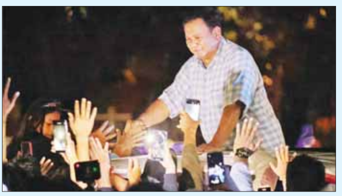
အင်ဒိုနီးရှား ကာကွယ်ရေးဝန်ကြီး ပရာဘိုဂူဆူဘီရန်တို့