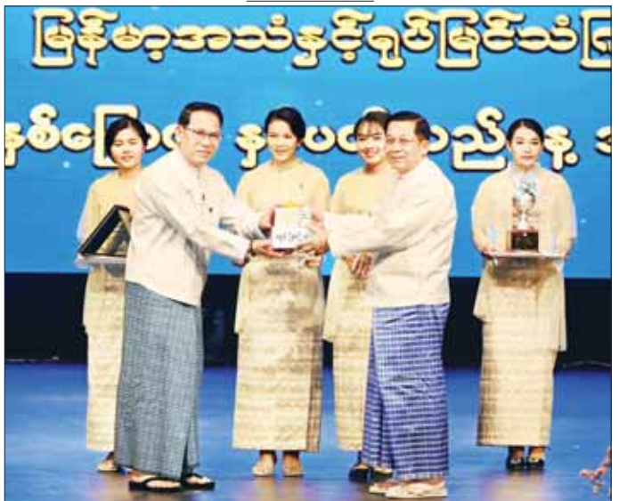
နိုင်ငံတော်စီမံအုပ်ချုပ်ရေးကောင်စီဥက္ကဋ္ဌ နိုင်ငံတော်ဝန်ကြီးချုပ် ဗိုလ်ချုပ်မှူးကြီး မင်းအောင်လှိုင် မြန်မာ့အသံနှင့် ရုပ်မြင်သံကြားအတွက် ဂုဏ်ပြုချီးမြှင့်ငွေများကို ချီးမြှင့်ပေးအပ်ရာ ပြန်ကြားရေးဝန်ကြီးဌာန ပြည်ထောင်စုဝန်ကြီး ဦးမောင်မောင်အုန်းက လက်ခံရယူစဉ်။

(၇၈) နှစ်ပြည့်မြောက်သည့် နှစ်ပတ်လည်နေ့အခမ်းအနားတွင် အာဆီယံနိုင်ငံများ၌ “Analogue Switch Off-ASO” ဟုခေါ်သည့် Analogue စနစ်နှင့် ရုပ်သံထုတ်လွှင့်မှုရပ်ဆိုင်းရန် သဘောတူညီထားကြသည့် အစီအစဉ်ထဲမှ Pilot Project တစ်ခုဖြစ်သည့် နေပြည်တော်၊ ရန်ကုန်နှင့် မန္တလေးမြို့ကြီး သုံးမြို့အတွက် ထုတ်လွှင့်နေသည့် ထပ်ဆင့်လွှင့်စက်ရုံသုံးရုံမှ Analogue စနစ် ထုတ်လွှင့်မှုကို စတင်ရပ်ဆိုင်းနိုင်ရန် ကြေညာပြီး အဆိုပါမြို့ကြီး သုံးမြို့တွင် ခေတ်မီတယ်စနစ်တစ်ခုဖြစ်သည့် Digital Video Broadcasting - Second Generation Terrestrial (DVB-T2)စနစ်ဖြင့် ထုတ်လွှင့်နေသည့်ရုပ်သံ (၁၈)လိုင်းထဲတွင် High Definition (HD) Quality နှင့် ရုပ်သံလိုင်း (၂)လိုင်းသာ ထုတ်လွှင့်နိုင်ရာမှ ယခုအခါ (၁၁)