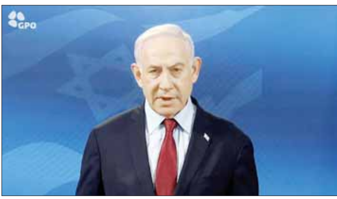
အစွဲရေးဝန်ကြီးချုပ် ဘင်ဂျမင် နေတန်ယာဟု

အတိုက်အခိုက်ရပ်စဲရေး သဘော တူညီချက် ကြန့်ကြာနေသည့် အတွက် အစွဲရေးဝန်ကြီးချုပ် ဘင်ဂျမင် နေတန်ယာဟု သည် ဂါဇာကမ်းခြေ တောင်ပိုင်းရှိ ရာဇာ၌ မြေပြင်ထိုးစစ်ဆင်နွှဲရန် ဆုံးဖြတ်ထားကြောင်း သိရသည်။ နိုင်ငံတကာ ပြစ်တင်ဝေဖန် မှုများ မြင့်တက်လာသည့်တိုင် နေတန်ယာဟုက အစွဲရေးသည် ဟားမားစ်တို့ကို အောင်မြင်မှုရရှိ သည့်အထိ တိုက်ခိုက်သွားမည်ဖြစ် ကြောင်း ပြောကြားခဲ့သည်။ ရာဇာ တွင် လူပေါင်း ၁ ဒသမ ၄ သန်း ကျော် ခိုလှုံလျက်ရှိသည်။ အစွဲရေး တပ်ဖွဲ့များသည် ဂါဇာအလယ်ပိုင်း နှင့် တောင်ပိုင်းရှိဒေသများတွင် ထိုးစစ်ကို အရှိန်မြှင့်တင် ဆင်နွှဲ လျက်ရှိသည်။ လူနာများနှင့် တခြားသူများ ကို ထွက်ခွာရန် အမိန့်ပေးပြီး နောက် ကြာသပတေးနေ့အထိ ခန့်ယွန်နစ်မြို့ တောင်ပိုင်းရှိ