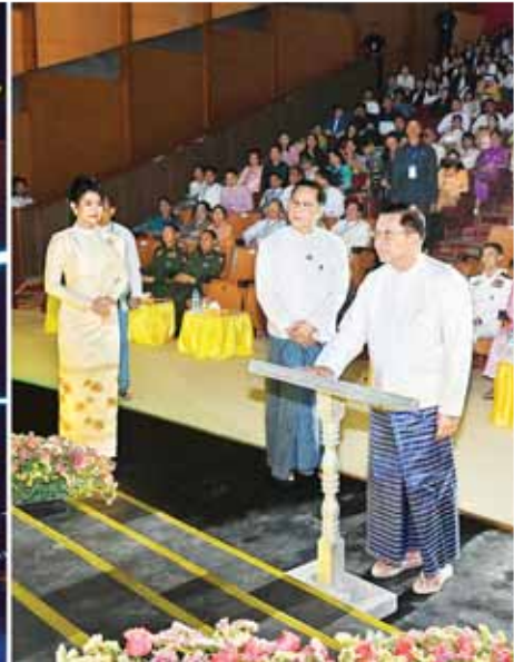
နိုင်ငံတော်စီမံအုပ်ချုပ်ရေးကောင်စီဥက္ကဋ္ဌ နိုင်ငံတော်ဝန်ကြီးချုပ် ဗိုလ်ချုပ်မှူးကြီး မင်းအောင်လှိုင် မြန်မာ့အသံနှင့် ရုပ်မြင်သံကြား DVB-T2 စနစ်တွင် HD Quality ရုပ်သံ(၂)လိုင်းမှ (၉) လိုင်းတိုးချဲ့၍ ရုပ်သံလိုင်း (၁၁)လိုင်းဖြင့် အဆင့်မြင့်တင်ထုတ်လွှင့်မှုနှင့် MRTV DTH Platform တွင် ရုပ်သံ (၇) လိုင်းမှ(၁၂) လိုင်းတိုးချဲ့၍ ရုပ်သံလိုင်း(၁၉)လိုင်း ထုတ်လွှင့်မှုတို့အား စက်ခလုတ်နှိပ်ဖွင့်လှစ်စေပစ်။