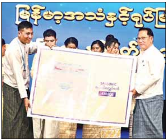
ပြည်ထောင်စုဝန်ကြီး ဦးမောင်မောင်အုန်း ကံစမ်းမဲပေါက်သူတစ်ဦးအား ဆုပေးအပ်ချီးမြှင့်စဉ်။

ထူးချွန်ဆုများချီးမြှင့် ဆက်လက်၍ အမြဲတမ်းအတွင်းဝန် ဦးမျိုးမြင့်မောင်၊ မြန်မာ့အသံနှင့်ရုပ်မြင်သံကြား ညွှန်ကြားရေးမှူးချုပ်ဦးရဲနိုင်နှင့် ဌာနဆိုင်ရာအကြီးအကဲများက အစီအစဉ်ထုတ်လုပ်မှုထူးချွန်ဆု၊ သတင်းတည်းဖြတ်ထုတ်လွှင့်မှုထူးချွန်ဆု၊ သတင်းတင်ဆက်မှုထူးချွန်ဆု၊ စက်မှုဆိုင်ရာထူးချွန်ဆု၊ ရိုက်ကူးထုတ်လုပ်မှုဆိုင်ရာထူးချွန်ဆု၊ လုပ်ငန်းစွမ်းဆောင်ရည်ထူးချွန်ဆုနှင့် သန့်ရှင်းသာယာလှပရေးဆောင်ရွက်မှု ထူးချွန်ဆု ရရှိကြသူများကို ဆုများပေးအပ်ချီးမြှင့်ကြသည်။