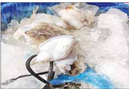
အမေရိကန်ဒေါ်လာ၊ တာဝမ် ၇၃၀ ဒသမ ၀၂ အမေရိကန်ဒေါ်လာနှင့် ပါကင် ၄၅၀ ဒသမ ၀၃ အမေရိကန်ဒေါ်လာ တို့ဖြစ်သည်။

ပို့ကုန်ပစ္စည်းများ တစ်တန် ဈေးနှုန်းအနေဖြင့် ငါးနီငယ် ၈၀၃ ဒသမ ၅၅ အမေရိကန်ဒေါ်လာ၊ ငါးပုလွေ အမေရိကန်ဒေါ်လာ ၁၀၁၂ ဒသမ ၅၀၊ ပလာတူးခက် အမေရိကန်ဒေါ်လာ ၈၁၀၊ ပလာလန်း အမေရိကန်ဒေါ်လာ ၁၀၀၀၊ လိုင်းဝါ အမေရိကန်ဒေါ်လာ ၉၀၀၊ ကင်းမွန်လိပ် ၂၁၀၉ ဒသမ ၂၈ အမေရိကန်ဒေါ်လာ၊ စက်ဟောက် ၇၅၃ ဒသမ ၇၆