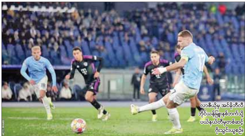
လာဇီယိုမှ အင်နိုဗိုလီ ဘိုင်ယန်မြူးနစ်ဘက်သို့ ပယ်နယ်တီမှတစ်ဆင့် ဂိုးသွင်းယူစဉ်။

လူဝင်မှုကြီးကြပ်ရေးနှင့် ပြည်သူ့အင်အားဝန်ကြီးဌာန