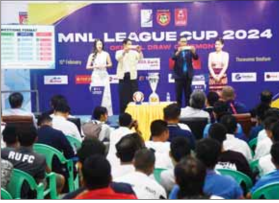
MNL Cup ပြိုင်ပွဲ အုပ်စုခွဲပွဲအခမ်းအနားကျင်းပစဉ်။

ရန်ကုန် ဖေဖော်ဝါရီ ၁၅ မတ် ၁ ရက်တွင် စတင်ကျင်းပမည့် Myanmar National League Cup 2024 ပြိုင်ပွဲတွင် အုပ်စုခွဲပွဲအခမ်းအနားကို ဖေဖော်ဝါရီ ၁၅ ရက်က သုဝဏ္ဏဘောလုံးကွင်းရှိ သတင်းစာရှင်းလင်းပွဲခန်းမ၌ ကျင်းပသည်။