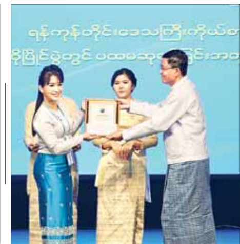
ဒုတိယဝန်ကြီး ဦးရဲတင် ကံစမ်းမဲပေါက်သူတစ်ဦးအား ဆုပေးအပ်ချီးမြှင့်စဉ်။

ကံစမ်းမဲများ ဖွင့်ဖောက် ထို့နောက် ပြည်ထောင်စုဝန်ကြီးနှင့် ဒုတိယဝန်ကြီးတို့က မြန်မာ့အသံနှင့်ရုပ်မြင်သံကြားဝန်ထမ်းများအတွက် ဗလားမပေါက်စမ်းမဲများ ဖွင့်ဖောက်၍ ဆုများပေးအပ်ချီးမြှင့်ကြပြီး မြန်မာ့အသံနှင့်ရုပ်မြင်သံကြားဝန်ထမ်းများက “MRTV နှင့် ကောင်းသောနေ့” တေးသီချင်းဖြင့် သီဆိုကြပြု ဖျော်ဖြေတင်ဆက်၍ အခမ်းအနားကို ရုပ်သိမ်းလိုက်သည်။