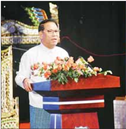
ပြည်ထောင်စုဝန်ကြီး ဦးမောင်မောင်အုန်း မြန်မာ့အသံနှင့်ရုပ်မြင်သံကြား (၇၈)နှစ်မြောက် နှစ်ပတ်လည်နေ့အထိမ်းအမှတ် ထူးချွန်ဆုရရှိသောဝန်ထမ်းများအား ဆုချီးမြှင့်ပွဲတွင် အမှာစကားပြောကြားစဉ်။

ဂုဏ်ပြုဆုများ ပေးအပ်ချီးမြှင့် ထို့နောက် ပြည်ထောင်စုဝန်ကြီး ဦးမောင်မောင်အုန်းက အမှာစကားပြောကြားပြီး ဝန်ထမ်းလုပ်သက် (၃၇) နှစ်ပြည့်မြောက်သည့် ဝန်ထမ်းများနှင့်