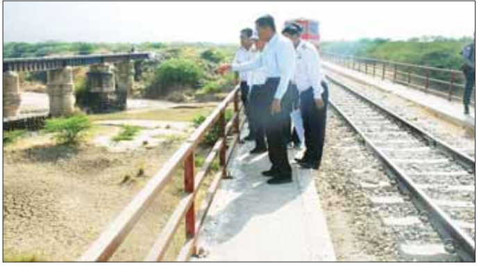
ရွက်သွားရန်ဆွေးနွေးမှာကြားသည်။ ထို့အပြင် ဒုတိယဝန်ကြီးသည် မန္တလေးရှိ ဝန်ထမ်းနေအိမ်လိုင်း ခန်းများ စစ်ဆေးပြီး ဝန်ထမ်း လိုင်းခန်းအတွင်း သောက်/သုံးရေ လုံလောက်စွာရရှိရေး စနစ်တကျ စီမံဆောင်ရွက်ရန်၊ မြန်မာ့မီးရထား ဖွဲ့စည်း၍ ပျက်စီးမှုများ ပြန်လည် ပြုပြင်ခြင်းများ ဆောင်ရွက်သွား မိသားစုများ ဆေးကုသနိုင်ရေး စီမံဆောင်ရွက်ပေးရန်၊ အိမ်ရာ သိရသည်။ သတင်းစဉ်

စစ်ဆေးပြီး ရထားလမ်းဘေး ဘယ်/ညာနှင့်ဘူတာယာဒ်ဝင်းရှိ အမှိုက်များရှင်းလင်းရန်၊ လမ်းပိုင်း အတွင်း ကျောက်နည်းသည့်နေရာ များတွင် ကျောက်ဖြည့်သွင်း၍ စနစ်တကျ ပက်ကင်ရိုက်ရန်၊ Alignmentနှင့် Super Elevations များမှန်ကန်မှုရှိစေရေး စနစ်တကျ စစ်ဆေး၍ ပြုပြင်ဆောင်ရွက်သွား ရန်၊ တံတားများတွင် ဆွေးမြည့် နေသည့် သစ်သားဇလီဖားများ လဲလှယ်သွားရန်၊ တံတားတစ်ခုစီ အလိုက် အောက်ခြေသံပေါင် အထိုင်ကောင်း/မကောင်း၊ တံတား ရေလယ်တိုင်နှင့် ကမ်းကပ်ခုံများ ကောင်း/မကောင်း စစ်ဆေးသွား ရန်တို့ကို ဆွေးနွေးမှာကြားသည်။ ဆက်လက်၍ ဒုတိယဝန်ကြီး သည် ဒီဇယ်စက်ခေါင်းပြင်စက်ရုံ