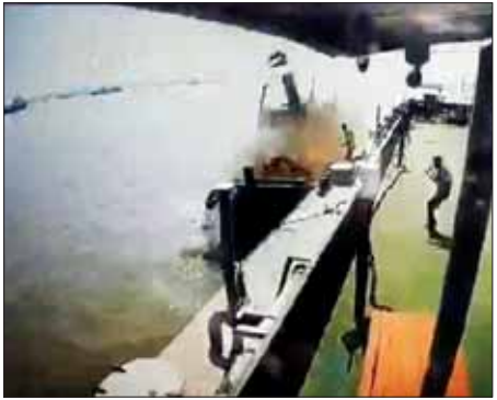
စက်လှေပေါက်ကွဲမှုဖြစ်ပွားသည်ကို စိစစ်တို့မှတ်တမ်းအရ တွေ့ရစဉ်။

ကျွန်းစု ဖေဖော်ဝါရီ ၁၄ တနင်္လာရက်ညပိုင်းဒေသကြီး ကျွန်းစု မြို့နယ် မအိုင်ကျေးရွာအုပ်စု ကဏန်းကျွန်းအရှေ့ဘက်ရေပြင်ရှိ ဆိတင်ဗောတွင် ကုန်တင်စက် လှေတစ်စင်းပေါက်ကွဲမှု ဖေဖော်ဝါရီ ၁၄ ရက် နံနက် ၁၀ နာရီ ၁၂ မိနစ်ခန့်က ဖြစ်ပွား၍ ငါးဦး မီးလောင် ဒဏ်ရာများ ရရှိခဲ့ကြောင်း သိရသည်။