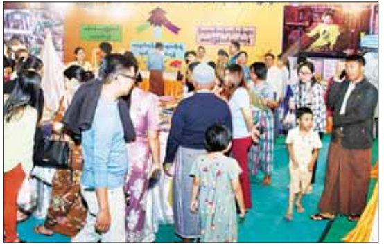
တိုင်းရင်းသားရိုးရာပြခန်းများ၌ ကြည့်ရှုလေ့လာကြသူများကို တွေ့ရစဉ်။

ဇာတိမာန်ကို တက်ကြွစေမည့်သီချင်း များဖြင့် ကပြဖော်ပြတင်ဆက်ကြရာ ပွဲတော်လာပြည်သူများကလည်း တိုင်းရင်း သားရိုးရာယဉ်ကျေးမှုအဖွဲ့ များနှင့်အတူ ပျော်ရွှင်စွာ သီဆိုကခုန်ပါဝင်ဆင်နွှဲကြ သည့် မြင်ကွင်းသည်လည်း တောင်ပေါ် မြေပြန့်မခွဲခြားဘဲ စည်းလုံးသည့်သွေးချင်း ညီအစ်ကို စိတ်ထားကို အထူးပေါ့လွင်စေ ခဲ့သည်။ ဈေးနှုန်းချိုသာစွာရောင်းချပေးလျက်ရှိ အလားတူ နေပြည်တော်ကောင်စီ အပါအဝင် တိုင်းဒေသကြီးနှင့် ပြည်နယ် များမှ ထွက်ရှိသည့် MSME ထုတ်ကုန်များ၊ တိုင်းရင်းသားရိုးရာ အမှတ်တရပစ္စည်း များနှင့် ရိုးရာဝတ်စုံများကို ပြည်သူ များ စိတ်ကြိုက်ဝယ်ယူနိုင်ရန်အတွက် ဈေးနှုန်းချိုသာစွာ ရောင်းချပေးလျက်ရှိပြီး သူစိမ်းနှစ်သက်မြတ်နိုးစွာဖြင့် ဝယ်ယူကြ သူများဖြင့်လည်း စည်ကားလျက်ရှိရာ ဒေသအလိုက် ဆောင်ရွက်နေသည့် MSMEလုပ်ငန်းများ ဖွံ့ဖြိုးတိုးတက်စေရန် မြင်ကွင်းတစ်ခုလည်း ဖြစ်သည်။