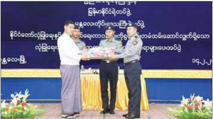
ချုပ် မန္တလေးတပ်ခွဲမှူးက လက်ခံရယူပြီး ဂုဏ်ပြု မှတ်တမ်းလွှာပြန်လည်ပေးအပ်၍ ကျေးဇူးတင်စကား ပြောကြားသည်။

နေပြည်တော် ဖေဖော်ဝါရီ ၁၄ မန္တလေးတိုင်းဒေသကြီးအတွင်းရှိ စေတနာရှင် အလှူရှင်ပြည်သူများ လှူဒါန်းသည့် စားသောက် ဖွယ်ရာများ ဂုဏ်ပြုပေးအပ်ခြင်းအခမ်းအနားများ ကို ယနေ့မွန်လွင်လွင်တွင် မန္တလေးတိုင်းဒေသကြီးရှိ အလယ်ပိုင်းတိုင်းစစ်ဌာနချုပ်နှင့် တိုင်းဒေသကြီး ရဲတပ်ဖွဲ့မှူးရုံးတို့တွင်ကျင်းပရာ မန္တလေးတိုင်း ဒေသကြီး အစိုးရအဖွဲ့ဝန်ကြီးချုပ် ဦးမျိုးအောင်၊ တိုင်းဒေသကြီး အစိုးရအဖွဲ့ဝင် ဝန်ကြီးများနှင့် တာဝန်ရှိသူများ တက်ရောက်ကြသည်။