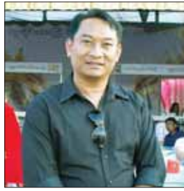
ဦးဇေယျာမင်း