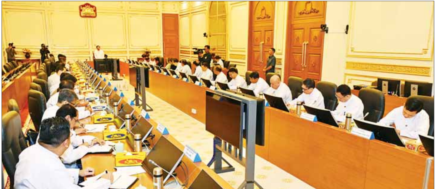
နိုင်ငံတော်စီမံအုပ်ချုပ်ရေးကောင်စီဥက္ကဋ္ဌ နိုင်ငံတော်ဝန်ကြီးချုပ် ဗိုလ်ချုပ်မှူးကြီး မင်းအောင်လှိုင် ပြည်ပနိုင်ငံများတွင် တာဝန်ထမ်းဆောင်လျက်ရှိသည့် သံအမတ်ကြီးများနှင့် သံရုံးယာယီတာဝန်ခံများအား တွေ့ဆုံအမှာစကားပြောကြားစဉ်။