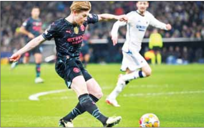
မန်စီးတီးကွင်းလယ်တိုက်စစ်ကစားသမား ဒီဘရိုင်း ကိုပင်ဟေဂင်အသင်းဘက်သို့ ဂိုးသွင်းယူရန် ကြိုးပမ်းစဉ်။

(နိုင်ငံတော်စီမံအုပ်ချုပ်ရေးကောင်စီဥက္ကဋ္ဌ နိုင်ငံတော်ဝန်ကြီးချုပ် ဗိုလ်ချုပ်မှူးကြီး မင်းအောင်လှိုင်၏ ၂၀၂၃ ခုနှစ်၊ အောက်တိုဘာလ ၁၅ ရက်နေ့တွင် ပြုလုပ်သော တစ်နိုင်ငံလုံး ပစ်ခတ်တိုက်ခိုက်မှုရပ်စဲရေးသဘောတူစာချုပ်(NCA) (၈)နှစ်မြောက်နှစ်ပတ်လည်နေ့အခမ်းအနားတွင် ပြောကြားသော မိန့်ခွန်းမှကောက်နုတ်ချက်)