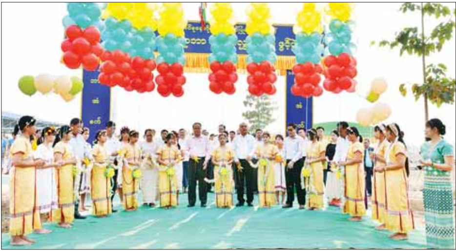
ဘားအံစက်မှုဇုန်သည် ၉၆၉ ဧက ကျယ်ဝန်းပြီး ရရှိရေး အစရှိသည့် Infrastructure ပိုင်းကိုလည်း လည်ပတ်နေသည့် စက်ရုံ ၂၇ ရုံနှင့် တည်ဆောက်ဆဲ ဖြည့်ဆည်း ဆောင်ရွက်ပေးထားကြောင်း သိရ စက်ရုံ ၁၄ ရုံရှိကာ ပြည်နယ်အစိုးရအဖွဲ့မှ လမ်းပန်း သည်။ ဆက်သွယ်ရေး၊ လျှပ်စစ်ဓာတ်အားရရှိရေး၊ ရေ ခရိုင်(ပြန်/ဆက်)

၏ မူဝါဒများနှင့်ကိုက်ညီပြီး ဆန်းသစ်တီထွင်မှုနှင့် နည်းပညာများကို ဆက်လက်တိုးမြှင့်သွားရန်လို ကြောင်း ပြောကြားသည်။ ထို့နောက် ဘားအံစက်မှုဇုန်ဒေသဆိုင်ရာ ကော်မတီဥက္ကဋ္ဌ ပြည်နယ်စီးပွားရေးရာဝန်ကြီး ဦးစောခင်မောင်မြင့်က ရော်ဘာသစ်ပါးလွှာစက်ရုံ ဆိုင်ရာများကို ရှင်းလင်းပြောကြားပြီး ရော်ဘာသစ်ပါး လွှာစက်ရုံလုပ်ငန်းရှင်က စက်ရုံတည်ဆောက်ခြင်း နှင့်ပတ်သက်၍ ရှင်းလင်းပြောကြားသည်။ ယင်းနောက် ပြည်နယ်ဝန်ကြီးချုပ်၊ ပြည်နယ် တရားလွှတ်တော်တရားသူကြီးချုပ်၊ ပြည်နယ်အစိုးရ အဖွဲ့ဝင်များနှင့် တာဝန်ရှိသူများက အဆိုပါစက်ရုံအား ဖဲကြိုးဖြတ်ဖွင့်လှစ်ပေးသည်။ (အပေါ်ယာပုံ)