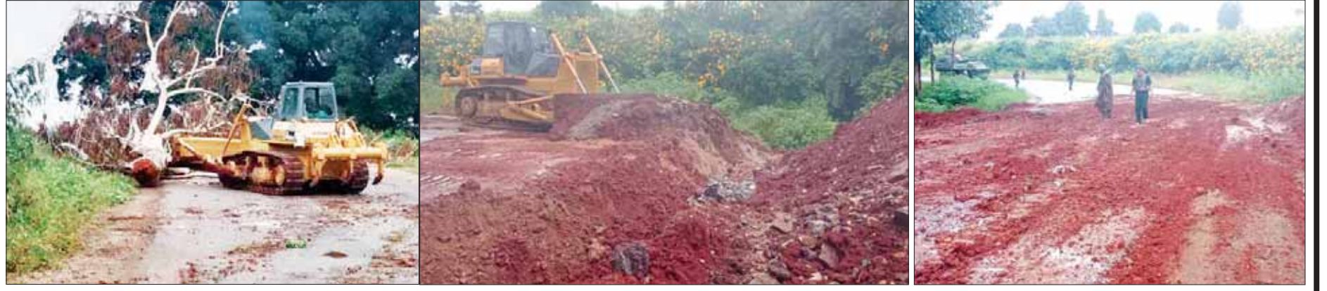
၂၀၂၃ ခုနှစ် နိုဝင်ဘာလက TNLA အဖွဲ့နှင့် PDF အမည်ခံ အကြမ်းဖက်သောင်းကျန်းသူများက ဒေသခံပြည်သူများ ကုန်စည်ကူးသန်းမှုနှင့် သွားလာရေးခက်ခဲစေရန် ဖျက်ဆီးထားသည့် နောင်ပစ်နှင့် နောင်ပိန်းကျေးရွာကြားတွင် သစ်ပင်ကြီးများ ခုတ်လှဲပိတ်ဆို့ထားခြင်းကို ဖယ်ရှားနေမှုနှင့် ဖြတ်မြောင်းကြီးများ ပြုလုပ်ထားမှုကို ပြန်လည်ပြုပြင်ပြီးနောက် တွေ့ရစဉ်။