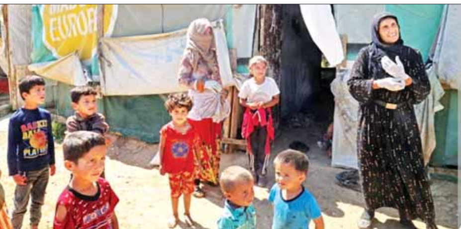
လက်ဘနွန်နိုင်ငံ ဒုက္ခသည်စခန်းမှ ဆီးရီးယားအမျိုးသမီးနှင့် ကလေးများကို တွေ့ရစဉ်။

တစ်ပြေးညီ လုပ်ဆောင်နေ ကြောင်း သိရသည်။ ပစ်ဖိတ်မီးတောင် ရပ်ဝန်း ကျွန်းစုတွင် တည်ရှိသည့် ဖိလစ် ပိုင်နိုင်ငံသည် အင်အားပြင်း တိုင်ဖွန်မုန်တိုင်းကြောင့် ရေကြီးမှု များ၊ မြေပြိုမှုများ၊ ငလျင်လှုပ် ခြင်းနှင့် မီးတောင်ပေါက်ကွဲမှုများ မကြာခဏဖြစ်ပွားလေ့ရှိကြောင်း သိရသည်။ ဆင်ဟွာ