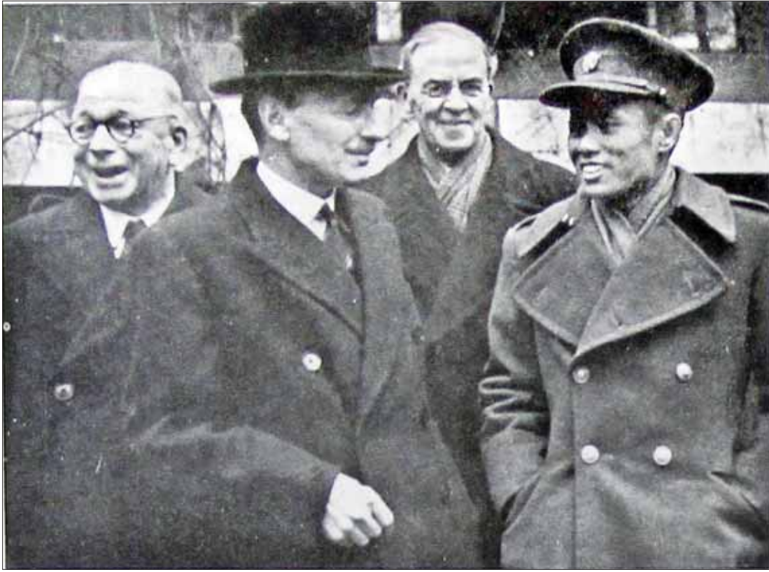
၁၉၄၇ ခုနှစ် ဇန်နဝါရီလက အောင်ဆန်း - အက်တလီ စာချုပ် ချုပ်ဆိုရန် အင်္ဂလန်သို့ သွားရောက်ခဲ့သည့် ဗိုလ်ချုပ်အောင်ဆန်းကို ဗြိတိသျှနန်းရင်းဝန် အက်တလီနှင့် တွေ့ရစဉ်။

လွတ်လပ်ရေး ရရှိပြီးနောက်တွင် လက်နက်ကိုင်ပဋိပက္ခများ ဖြစ်ပေါ်ခဲ့ သော်လည်း ပြည်ထောင်စုကြီးအတွင်း တိုင်းရင်းသားလူမျိုးများ တစ်စုတစ်ဝေး တည်း ပေါင်းစုနေထိုင်လာခဲ့ကြသည်။ မတူကွဲပြားသောလူမျိုးများ စုစည်း နေထိုင်နေကြခြင်းသည် ပြည်ထောင်စု၏ ကျက်သရေပင်ဖြစ်သည်။ ပြည်ထောင်စု ၏ ငြိမ်းချမ်းသာယာမှုပင် ဖြစ်သည်။ လူမျိုးအရ အမည်နာမ အခေါ်အဝေါ် သတ်မှတ်ထားသော်လည်း မတူကွဲပြား သော တိုင်းရင်းသားများ စုစည်းနေထိုင် ကြသည့် ပြည်ထောင်စုငယ်လေးများ ပင် ဖြစ်သည်။ ကချင်ပြည်နယ်တွင် ကချင်၊ ဂျိမ်းဖော၊ ရှမ်း၊ ပအိုဝ်း၊ ဗမာ၊ တိုင်းရင်းသားပေါင်းစုံ စုပေါင်းနေထိုင် ကြသည်။ ရှမ်းပြည်နယ်တွင် ရှမ်း၊ ပလောင်၊ ကယန်း၊ လီဆူ၊ 'ဝ'၊ ကချင်၊ ဗမာ တိုင်းရင်းသားပေါင်းစုံ စုစည်း နေထိုင်ကြသည်။ ကရင်ပြည်နယ်တွင် လည်းကောင်း၊ အခြား ပြည်နယ်နှင့်