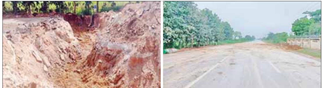
၂၀၂၃ ခုနှစ် နိုဝင်ဘာလက TNLA အဖွဲ့နှင့် PDF အမည်ခံ အကြမ်းဖက်သောင်းကျန်းသူများက ဒေသခံပြည်သူများ ကုန်စည် ကူးသန်းမှုနှင့် သွားလာရေးခက်ခဲစေရန် ဖျက်ဆီးထားသည့် နောင်ချိုမြို့နယ် ရွှေညောင်ပင်အနီး ဖြတ်မြောင်းကြီးများ ပြုလုပ်ထားမှုကို ပြန်လည်ပြုပြင်ပြီးနောက် တွေ့ရစဉ်။

တိုင်းရင်းသားလူမျိုးအချင်းချင်း ဖြစ်ပွား နေသော ပဋိပက္ခများမှာ တာရှည်လာ သည်နှင့်အမျှ တိုင်းပြည်အတွက် ထိခိုက် နစ်နာရသည်။ တိုင်းရင်းသားလူမျိုး အချင်းချင်း စည်းလုံးညီညွတ်ပြီး တိုင်း ပြည် အေးချမ်းအောင်၊ တိုင်းပြည် ဖွံ့ဖြိုး တိုးတက်အောင် လုပ်ဆောင်သင့်ပါသည်။ တိုင်းပြည်တွင် သယံဇာတများ ပေါများ ကြွယ်ဝပါလျက် မညီညွတ်သောကြောင့် တိုင်းပြည် အောက်ကျနောက်ကျ ဖြစ်နေ သည်မှာ စိတ်မကောင်းစရာဖြစ်