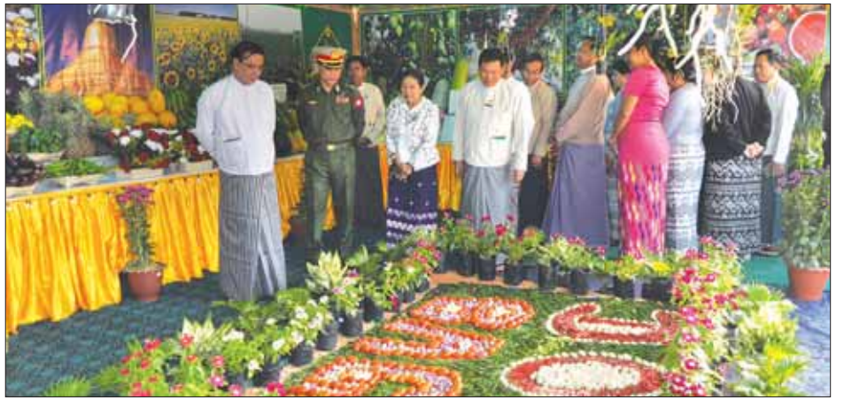
စားသောက်ကုန်များနှင့် စိုက်ပျိုးရေးကဏ္ဍဖွံ့ဖြိုး တိုးတက်စေရေး တောင်သူလယ်သမားများအတွက် တန်ဖိုးသင့် လက်ဆွဲကောက်စိုက်စက်များ၊ ဘက်စုံ သုံး စိုက်ပျိုးရေးကိရိယာ စုစုပေါင်း ဒေသထုတ်ကုန် အမျိုးပေါင်း ၅၀၀ ကျော် ထည့်သွင်းပြသထားရာ လာရောက်လေ့လာသူများ၊ ဈေးဝယ်သူများနှင့် စည်ကားလျက်ရှိကြောင်း သိရသည်။ တိုင်းဒေသကြီး(ပြန်/ဆက်)

ထို့နောက် တိုင်းဒေသကြီး ဝန်ကြီးချုပ်နှင့်အဖွဲ့ ဝင်များသည် ပဲခူးခရိုင်၊ ညောင်လေးပင်ခရိုင်၊ တောင်ငူခရိုင်၊ ပြည်ခရိုင်၊ နတ်တလင်းခရိုင်နှင့် သာယာဝတီခရိုင်အပါအဝင် စုစုပေါင်း ခရိုင်ခြောက်ခု တို့မှ ဒေသထုတ်ကုန် သစ်သီးဝလံပန်းမန်ပြပွဲဝင် သစ်သီးဝလံပန်းမန်များ ခင်းကျင်းပြသထားရှိမှု၊ ဌာနဆိုင်ရာ အသိပညာပေးပြခန်းနှင့် ဒေသထုတ်ကုန် အရောင်းပြခန်း စုစုပေါင်း ၄၅ ခန်းတို့အား လှည့်လည် ကြည့်ရှုအားပေးကာ ဒေသထုတ်ကုန်များကို နိုင်ငံ စီးပွားမြှင့်တင်ရေးရန်ပုံငွေဖြင့် တန်ဖိုးမြှင့်ထုတ်ကုန် အဖြစ် တိုးတက်ထုတ်လုပ်နိုင်ရေး၊ FDA ထောက်ခံ ချက်ရရှိနိုင်ရေးနှင့် ပြည်တွင်း/ပြည်ပ ဈေးကွက် ခိုင်မာမှုရှိစေရေး တာဝန်ရှိသူများနှင့် ပေါင်းစပ် ညှိနှိုင်းပေးသည်။ အဆိုပါပြခန်းများတွင် ဒေသထုတ်ကုန် ဝါး၊ သစ်သား လက်မှုပစ္စည်းများ၊ သံထည်ပစ္စည်းများ၊ တန်ဖိုးမြှင့်