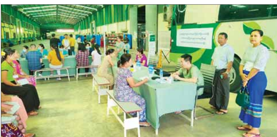
ရွေးစိမ့်ကိန်းကို အကောင်အထည်ဖော် ဆောင်ရွက်ရာ၌ ၂၀၂၄ ခုနှစ် ဇန်နဝါရီတွင် အကျိုးဝင်အာမခံ အလုပ်သမား ၁၂၃၅၅၈၉ ဦးရှိပြီး ကျန်းမာရေး စောင့်ရှောက်မှု အတွက် လူမှုဖူလုံရေးအဖွဲ့ပိုင် ဆေးခန်း ၉၆ ခန်း၊ ဌာနကြီးဆေးခန်း ၆၀၊ စာချုပ်ဆေးခန်း

နေပြည်တော် ဖေဖော်ဝါရီ ၁၁ အလုပ်သမားဝန်ကြီးဌာန လူမှုဖူလုံရေးအဖွဲ့သည် (၇၇) နှစ်မြောက် ပြည်ထောင်စုနေ့ကို ကြိုဆိုဂုဏ်ပြုသောအားဖြင့် လူမှုဖူလုံရေးအဖွဲ့မှ ရွှေ့လျားဆေးကုသယာဉ်များ (Mobile Medical Units) သုံးစီးဖြင့် ရန်ကုန်၊ မန္တလေးနှင့် ပဲခူးတိုင်းဒေသကြီးတို့ရှိ စက်မှုဇုန်များမှ လူမှုဖူလုံရေးအကျိုးဝင် အလုပ်သမားများအား ကွင်းဆင်းဆေးကုသမှုများ ဆောင်ရွက်ပေးလျက်ရှိသည်။