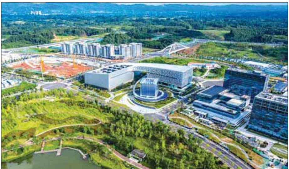
၂၀၂၀ ပြည့်နှစ် စက်တင်ဘာလတွင် စတင်ဖွင့်လှစ်ခဲ့သည့် တရုတ်နိုင်ငံ ချန်ဒူးမြို့ရှိ National Super Computing Center သည် ကမ္ဘာ့ထိပ်တန်းစင်တာ ၁၀ ခုတွင် တစ်ခုအဖြစ် ပါဝင်လျက်ရှိသည်။

အဆင့်မြင့်နည်းပညာကဏ္ဍ သုတေသနလုပ်ငန်းရပ်တွေမှာ တရုတ်နိုင်ငံနဲ့ အမေရိကန်နိုင်ငံတို့ဟာ နောက်တစ်ဆင့်မှာရှိနေကြတဲ့ အိန္ဒိယ၊ ဗြိတိန်၊ တောင်ကိုရီးယား၊ ဂျပန်၊ ဩစတြေးလျ၊ အီတလီနဲ့ ဂျပန်နိုင်ငံတို့ထက်စာရင် ရှေ့ကိုအတော်လေး ခရီးရောက်နေကြတဲ့နိုင်ငံတွေ ဖြစ်ပါတယ်။ ASPI ရဲ့ သုတေသနစစ်တမ်းမှာ တက္ကသိုလ်တွေ၊ အဆင့်မြင့်ပညာရေး သုတေသနအဖွဲ့အစည်းတွေကိုလည်း