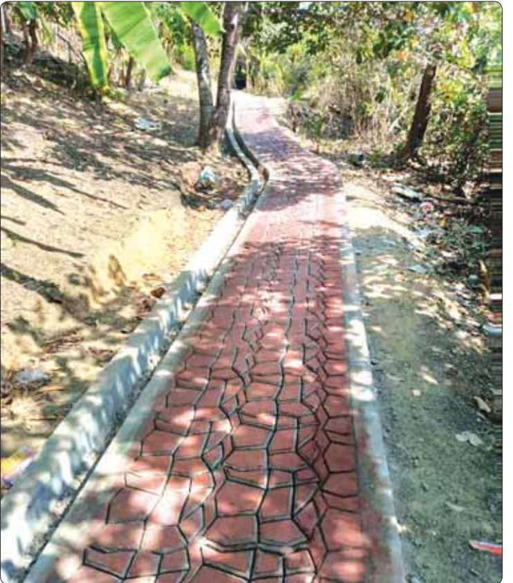
ကျွန်းပေါ်တွင် အလှဆင်တည်ဆောက်ထားသည့် တောင်ပေါ်တက်လမ်းနှင့် ကျွန်းပတ်လမ်း။