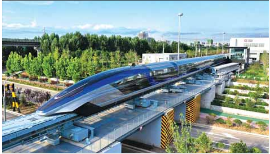
တရုတ်နိုင်ငံ၏ သံလိုက်စွမ်းအားဖြင့် မောင်းနှင်သည့် မြန်နှုန်းမြင့်ရထားသည် တစ်နာရီလျှင် ၂၆၈ မိုင်အထိ မောင်းနှင်နိုင်သည်။

ရှေ့တန်းက ဦးဆောင်လာနိုင် ASPI က ရေးသားထုတ်ပြန်ခဲ့တဲ့ အစီရင်ခံစာနဲ့ ပတ်သက်ပြီး တရုတ်နိုင်ငံမှာထုတ်ဝေတဲ့ China Daily သတင်းစာမှာ ဆောင်းပါးရှင် Zhang Xi က အခုလို ပြန်လည်ရေးသားခဲ့ပါတယ်။ Zhang Xi က နည်းပညာဖွံ့ဖြိုးတိုးတက်ရေးကဏ္ဍမှာ တရုတ်နိုင်ငံက သိသာထင်ရှားစွာ ရှေ့တန်းက ဦးဆောင်လာနိုင်တဲ့အနေအထားမျိုးအထိ ရောက်ရှိလာတာဟာ ချီးကျူးဂုဏ်ယူဖွယ်ရာ ဖြစ်ပါတယ်။ ဘာကြောင့်လဲဆိုတော့ တရုတ်နိုင်ငံဟာ နောက်ဆုံးပေါ်ထွက်လာတဲ့ နည်းပညာကဏ္ဍတွေမှာ အင်အားကြီးနိုင်ငံတစ်နိုင်ငံဖြစ်လာစေဖို့နဲ့ တီထွင်ဖန်တီးမှုကို အသားပေးတဲ့ စီးပွားရေးဖွံ့ဖြိုးတိုးတက်မှုရရှိလာစေဖို့ ကြိုးပမ်းဆောင်ရွက်နေလို့ ဖြစ်ပါတယ်။ သို့သော်လည်း ASPI က ထုတ်ပြန်ခဲ့တဲ့ အစီရင်ခံစာဟာ တရုတ်နိုင်ငံရဲ့ နည်းပညာကဏ္ဍအောင်မြင်မှုတွေကို ချီးကျူးဖို့ စာမျက်နှာ ၁၇ သို့