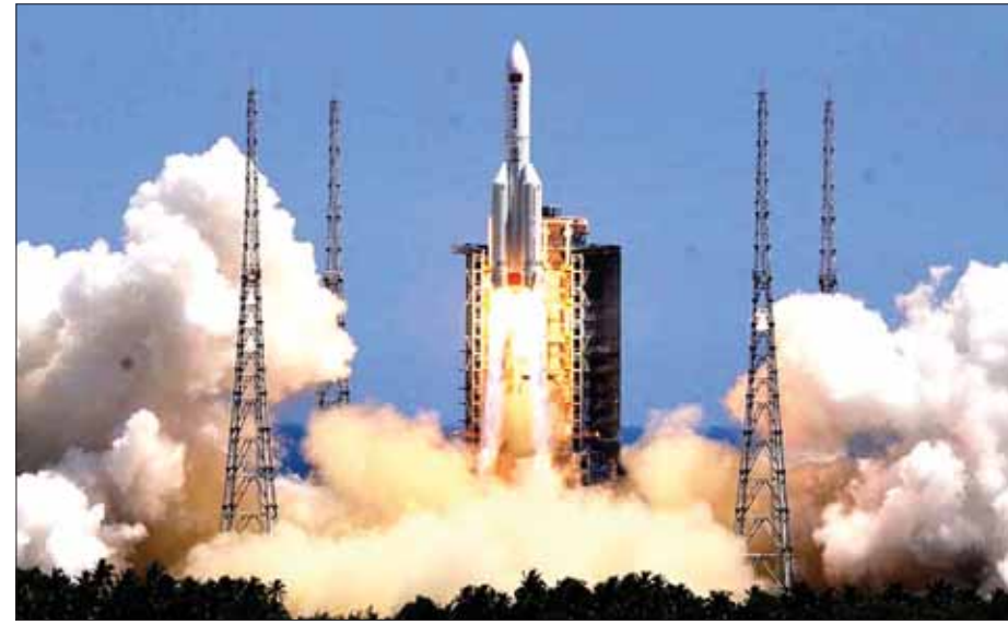
တရုတ်နိုင်ငံ၏ အာကာသစခန်းအတွက် ဂြိုဟ်တုတစ်စင်းကို ၂၀၂၂ ခုနှစ် ဇူလိုင်လအတွင်း ဟိုင်နန်ကျွန်း Wenchang ဂြိုဟ်တုလွှတ်တင်ရေးစခန်းမှ လွှတ်တင်ခဲ့စဉ်။

စာမျက်နှာ ၁၆ မှ အသားပေးဖော်ပြလိုတာမဟုတ်ဘဲ တရုတ်နိုင်ငံရဲ့ အင်အားကြီးမားလာမှုဟာ မြိမ်းခြောက်မှုဖြစ်လာ နိုင်ပြီး ဒါကိုတန်ပြန်နိုင်ဖို့ အနောက်နိုင်ငံတွေအနေ နဲ့ လက်တွဲပူးပေါင်းလုပ်ဆောင်သွားကြဖို့ တိုက်တွန်း ချင်တာသာ ဖြစ်တယ်လို့ ဖော်ပြခဲ့ပါတယ်။ တီထွင်ဖန်တီးမှုကို အသားပေးတဲ့ စီးပွားရေး တရုတ်နိုင်ငံအနေနဲ့ နိုင်ငံရဲ့ စီးပွားရေးကို ကာလတိုနဲ့ ကာလလယ်အချိန်အတွင်းမှာ တီထွင် ဖန်တီးမှုကို အသားပေးတဲ့ စီးပွားရေး ဖွံ့ဖြိုးတိုးတက် မှု ရရှိလာစေဖို့ သိပ္ပံနည်းနည်းပညာဖွံ့ဖြိုးတိုးတက်မှု ရရှိရေးကို နိုင်ငံရဲ့ ငါးနှစ်စီမံကိန်းတွေမှာ ထည့်သွင်း ဖော်ပြလာခဲ့ပါတယ်။ ၂၀၂၁ ခုနှစ်ကနေ ၂၀၂၅ ခုနှစ် အထိ (၁၄)ကြိမ်မြောက် ငါးနှစ်စီမံကိန်းမှာဆိုရင် သုတေသနနဲ့ဖွံ့ဖြိုးတိုးတက်ရေး (Research and Development) အတွက် အသုံးစရိတ်ကို နှစ်စဉ် နိုင်ငံ့ဂီဒီပီရဲ့ အနည်းဆုံး ခုနစ်ရာခိုင်နှုန်းသုံးစွဲဖို့ ဖော်ပြထားပါတယ်။ ဒီ ငါးနှစ်စီမံကိန်းမှာ တရုတ်နိုင်ငံဟာ ကွမ်တမ် သတင်း အချက်အလက်နည်းပညာကဏ္ဍ၊ ဖိုတွန်နဲ့ မိုက်ခရိုနက်ဆီလက်ထရောနစ်ကဏ္ဍ၊ ကွန်ရက် ဆက်သွယ်မှုနည်းပညာကဏ္ဍ၊ ဉာဏ်ရည်တု နည်းပညာကဏ္ဍ (Artificial Intelligence)၊ ဇီဝ ဆေးဝါးကဏ္ဍနဲ့ စွမ်းအင်သစ်နည်းပညာကဏ္ဍတွေ