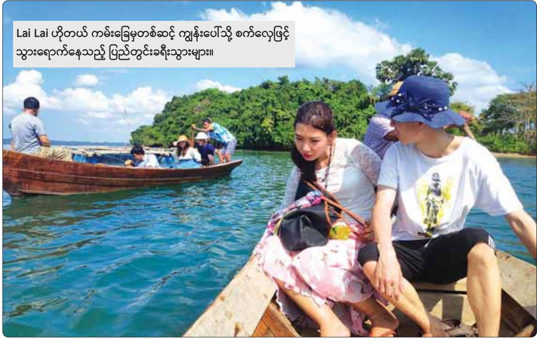
Lai Lai ဟိုတယ် ကမ်းခြေမှတစ်ဆင့် ကျွန်းပေါ်သို့ စက်လှေဖြင့် သွားရောက်နေသည့် ပြည်တွင်းခရီးသွားများ။