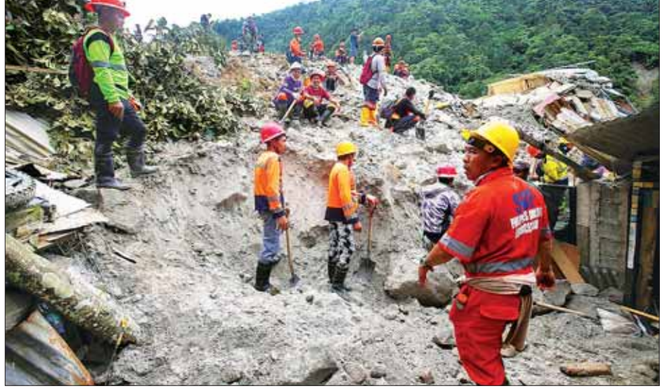
ဖိလစ်ပိုင်နိုင်ငံ မာကိုမြို့ မာဆာရာကျေးရွာ၌ မြေပြိုမှုဖြစ်ပွားပြီးနောက် ရှာဖွေရေးနှင့် ကယ်ဆယ်ရေး လုပ်ငန်းများ လုပ်ဆောင်စဉ်။

၂၀၂၂ ခုနှစ်တွင် လစဉ်လတိုင်း ဆီးရီးယားဒုက္ခ သည် ၂၀၂၂ ခုနှစ်တွင် လစဉ်လတိုင်း ဆီးရီးယားဒုက္ခ