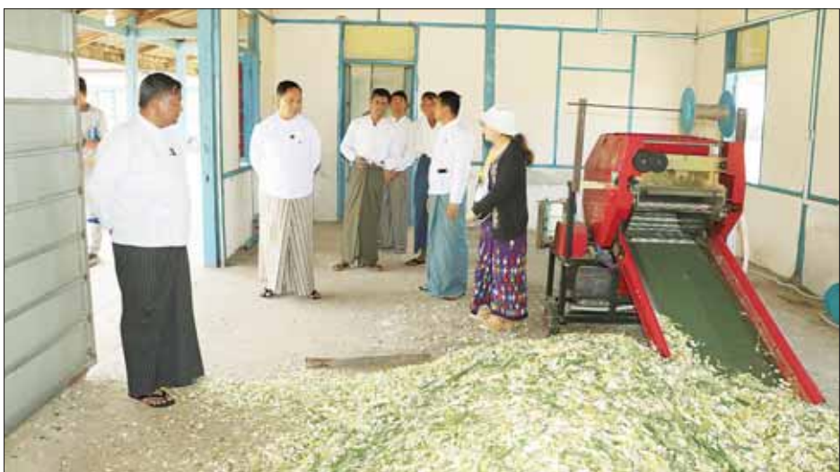
စိုက်ပေးနိုင်ရေးနှင့် စိုက်ပျိုးသီးနှံများ အထွက်နှုန်း တိုးစေရေးအတွက် စံချိန်စံညွှန်းပြည့်ဝသည့် ဓာတ်မြေဩဇာနှင့် ပိုးသတ်ဆေးများကို ဈေးနှုန်းသက်သာစွာ ဖြင့် ရာသီချိန်မီ ပြန့်ဖြူးရောင်းချပေးနိုင်ရေးကို စီစဉ်ဆောင်ရွက်ပေးလျက်ရှိကြောင်း ပြောကြားကာ လုပ်ငန်းလိုအပ်ချက်များအပေါ် ပေါင်းစပ်ဖြည့်ဆည်းဆောင်ရွက်ပေးခဲ့ကြောင်း သိရသည်။

ဆက်လက်၍ ပြည်ထောင်စုဝန်ကြီးသည် မြို့နယ်သမဝါယမအသင်းစုမှ အသင်းအမှုဆောင်များ၊ အသင်းသူ အသင်းသားများနှင့် တွေ့ဆုံကာ ကျေးလက်နေပြည်သူများ ဝင်ငွေတိုးပွားရေးနှင့် တောင်သူများ၏ လူမှုစီးပွားဘဝမြှင့်တင်ရေးအတွက် စိုက်ပျိုးရေး၊ မွေးမြူရေးလုပ်ငန်းများကို ပိုမိုလုပ်ကိုင်နိုင်ပြီး အထွက်တိုးရေး ကူညီဆောင်ရွက်ပေးလျက်ရှိကြောင်း၊ စိုက်ပျိုးရေးလုပ်ငန်းများ အောင်မြင်ရေးအတွက် သမဝါယမအသင်းစု တာဝန်ရှိသူများနှင့် အသင်းသားများကိုယ်တိုင်ကလည်း ပူးပေါင်းပါဝင်ဆောင်ရွက်ကြရန်လိုအပ်ကြောင်း၊ ထို့ပြင်သမဝါယမအသင်းအဖွဲ့စနစ်ဖြင့် တောင်သူများ လိုအပ်သည့် မျိုးကောင်းမျိုးသန့်၊ သွင်းအားစုများကို စိုက်ပျိုးချိန် အစီရရှိရေး ပေါင်းစပ်ဆောင်ရွက်ပေးလျက်ရှိကြောင်း၊ ပန်းတိုင်အထွက်နှုန်းရရှိရေး ဆောင်ရွက်ရမည့် စိုက်ပျိုးရေးနည်းစနစ်များအတိုင်း လိုက်နာဆောင်ရွက်ရန် လိုအပ်ကြောင်း၊ စိုက်ပျိုးရေးကဏ္ဍတွင် တောင်သူများ၏ အခက်အခဲများကို ဖြေရှင်းဆောင်ရွက်ပေးနိုင်ရေးနှင့် စိုက်ပျိုးသီးနှံများ အထွက်နှုန်း တိုးစေရေးအတွက် စံချိန်စံညွှန်းပြည့်ဝသည့် ဓာတ်မြေဩဇာနှင့် ပိုးသတ်ဆေးများကို ဈေးနှုန်းသက်သာစွာ ဖြင့် ရာသီချိန်မီ ပြန့်ဖြူးရောင်းချပေးနိုင်ရေးကို