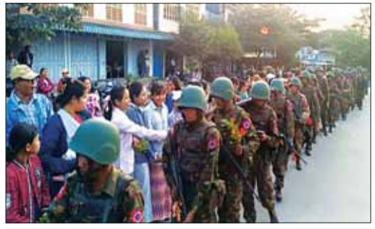
ကာနီဘုလုမြို့နယ်သို့ ရောက်ရှိလာသည့် လုံခြုံရေးတပ်ဖွဲ့ဝင်များအား ဒေသခံပြည်သူများက သောင်းသောင်းမြေဖြူဆိုထောက်ခံအားပေး

တကျ ဆက်လက်ဆောင်ရွက် လျက်ရှိသည်။ ပြန်လည်ထူထောင်ရေးလုပ်ငန်း စီမံဆောင်ရွက်လျက်ရှိ လုံခြုံရေးတပ်ဖွဲ့ဝင်များအနေ ဖြင့် ကောလင်းမြို့မှ နေရပ်စွန့်ခွာ ဒေသခံပြည်သူများ ပြန်လည်ဝင် ရောက်နေထိုင်နိုင်ရေးနှင့် အကြမ်း ဖက်သမားများကြောင့် ယိုယွင်း ပျက်စီးခဲ့ရသည့် အပျက်အစီးများ ပေးရင်း ရှင်းလင်းပေးခြင်း၊ မိုင်းရှင်းလင်းပေးခြင်း စသည့် ပွဲသည် မိုင်းများကြောင့် အများ များကို သေဆုံးပြည်သူများနှင့် အတူ အမြန်ဆုံးဆက်လက် ဆောင်ရွက်ပေးနိုင်ရေး စီမံဆောင် ရွက်လျက်ရှိကြောင်း သတင်း ရရှိသည်။ သတင်းစဉ်