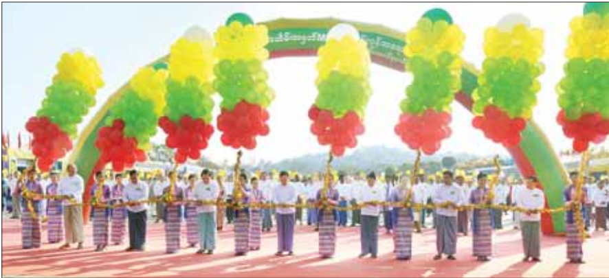
နိုင်ငံတော်စီမံအုပ်ချုပ်ရေးကောင်စီ ဒုတိယဥက္ကဋ္ဌ ဒုတိယဝန်ကြီးချုပ် ဒုတိယဗိုလ်ချုပ်မှူးကြီး စိုးဝင်း၊ ပြည်ထောင်စုဝန်ကြီးများဖြစ်ကြသည့် ဦးမောင်မောင်အိန်၊ ဦးစီးနေနောင်၊ ဦးလှစိုး၊ ဒေါက်တာညွန့်ဖေ၊ Jeng Phang နော်တောင်နှင့် နေပြည်တော်ကောင်စီဥက္ကဋ္ဌ ဦးသန်းလွန်းဦးတို့က အခမ်းအနားကို ဖဲကြိုးဖြတ်ဖွင့်လှစ်ပေးကြစဉ်။

ဖဲကြိုးဖြတ်ဖွင့်လှစ်ပေး ဦးစွာ နိုင်ငံတော်စီမံအုပ်ချုပ်ရေးကောင်စီ ဒုတိယဥက္ကဋ္ဌ ဒုတိယဝန်ကြီးချုပ် ဒုတိယဗိုလ်ချုပ်မှူးကြီး စိုးဝင်း၊ ပြည်ထောင်စုဝန်ကြီးများ ဖြစ်ကြသည့် ဦးမောင်မောင်အိန်၊ ဦးစီးနေနောင်၊ ဦးလှစိုး၊ ဒေါက်တာညွန့်ဖေ၊ Jeng Phang နော်တောင်နှင့် နေပြည်တော်ကောင်စီဥက္ကဋ္ဌ ဦးသန်းလွန်းဦး