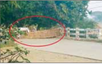
KIA အဖွဲ့နှင့် PDF အမည်ခံအကြမ်းဖက်သမားများက ကောလင်းမြို့အဝင်