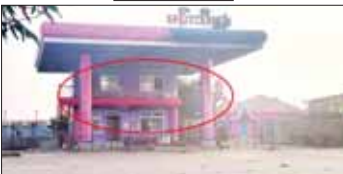
ဆောက်လုပ်ထားရှိမှု။ KIA အဖွဲ့နှင့် PDF အမည်ခံအကြမ်းဖက်သမားများက ရှေးဆိုင်များ၊ လူနေအဆောက်အဦများအား ဖျက်ဆီးထားရှိမှု။