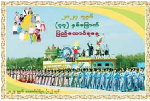
ပြည်ထောင်စုနေ့ တိုင်းရင်းသားတို့ တွဲတွဲသွားလက်များ ခိုင်မြဲစွာ