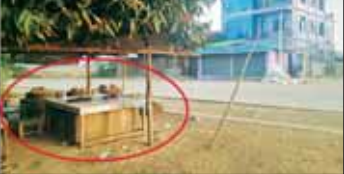
လမ်းအား ပိတ်ဆို့ထားပုံနှင့် ရှေးဆိုင်များအား ဘန်ကာဆောက်လုပ်ထားရှိမှု။