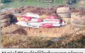
KIA အဖွဲ့နှင့် PDF အမည်ခံအကြမ်းဖက်သမားများက ဘန်ကာများ