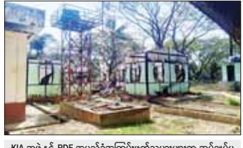
KIA အဖွဲ့နှင့် PDF အမည်ခံအကြမ်းဖက်သမားများက အုပ်ချုပ်မှု