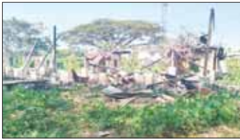
KIA အဖွဲ့နှင့် PDF အမည်ခံအကြမ်းဖက်သမားများက လူနေ

တွင် ထီးချိုင့်မြို့အား အကြမ်းဖက်သမားများ၏ လက်အောက်သို့ မကျရောက်ရေး အတွက်လည်း အင်အားဖြန့်ဖြူး၍ စစ်ကူပစ်ကူပေးခဲ့ခြင်းကြောင့် ကောလင်းမြို့အား တပ်မတော်နှင့် မြန်မာနိုင်ငံရဲတပ်ဖွဲ့များမှ သင့်တင့်သော အင်အားအသုံးပြု၍ ဝိုင်းပတ်ပိတ်ဆို့ထားရှိခဲ့သည်။ တစ်ချိန်တည်းကောလင်းမြို့ခံ ဝန်ထမ်းများ၊ အရပ်သားများ အနေဖြင့် အကြောင်းမဲ့ရန်ဒင် ချစ်ချစ်အောင်ကောလင်းမြို့အတွက် ပေးအကူအညီပေးခဲ့ခြင်းကြောင့် အင်အားလုံခြုံရေးနှင့် ဝိုင်းပတ်ပိတ်ဆို့ထားပုံနှင့် ရှေးဆိုင်များအား ဘန်ကာဆောက်လုပ်ထားရှိမှု။