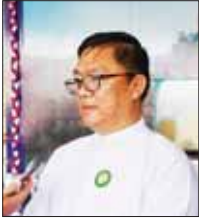
ဦးစန်းကို