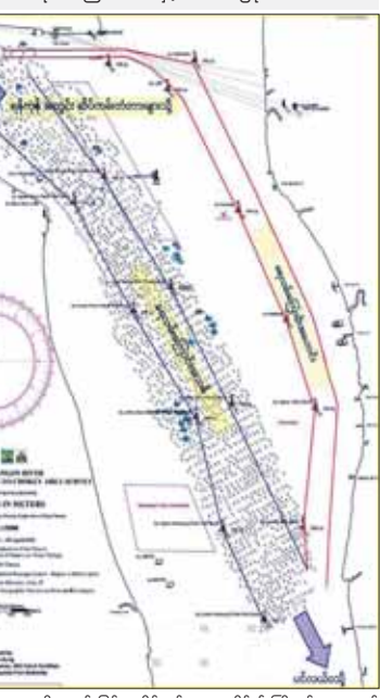
ရေလမ်းကြောင်းအသစ်နှင့် အဟောင်းပြပုံ

သို့ရာတွင် မြန်မာ့ဆိပ်ကမ်းအာဏာပိုင်၏ ကြိုးပမ်းရှာဖွေမှုနှင့် သောင်တွေးပေး ဆောင်ရွက်နိုင်ခဲ့ခြင်းကြောင့် ရေလမ်းကြောင်းအပတ် King's Bank Channel ကို ဖော်ထုတ်နိုင်ခဲ့ပြီး စဉ်ဆက်မပြတ် တိုးထွား၍ သောင်တွေးပေး ထိန်းသိမ်းထားနိုင်ခြင်း (Maintenance Dredging) နှင့် လိုအပ်သည့်နေရာများတွင် စဉ်ဆက်မပြတ်သောင် ဆောင်ရွက်လျက်ရှိနေပါသည်။ King's Bank Channel ရေလမ်းကြောင်းအသစ်သည် ရေယာဉ်ကြီး နှစ်စင်း ကောင်းစွာခေတ်တိမ်းသွားလာနိုင်သည့် (Two-Lane Traffic) အတွက် လိုလောက်သည့် ရေလမ်းအကျယ် ၄၅၀ မီတာရှိသဖြင့် သင်္ဘောကြီးများ နေ့/ည ၂၄ နာရီ အချိန်မရွေး ဝင်ထွက်နိုင်လာပါသည်။ ရေလမ်းကြောင်းအသစ် ဖော်ထုတ်နိုင်မှုကြောင့် လက်ရှိအချိန်တွင် သီလပင်ဆိပ်ကမ်း၊ ဇရိယာဉ် ရေရေ ၁၀ ဒဿမ ၅ မီတာ၊ အလျား ၃၀၀ မီတာနှင့် တန်ချိန် ၅၀၀၀၊ ရန်ကုန်အတွင်းဆိပ်ကမ်း၊ ဇရိယာဉ် ရေရေ ၉ ဒဿမ ၆ မီတာ၊ အလျား ၂၀၀ မီတာနှင့် တန်ချိန် ၃၀၀၀ အထိ တင်ဆောင်နိုင်သည့် သင်္ဘောကြီးများကို လက်ခံဝန်ဆောင်မှုများ ပေးလာနိုင်ပြီဖြစ်သည့်အပြင် ပိုမိုဘေးကင်းလုံခြုံစွာဖြင့်လည်း ဝန်ဆောင်မှုများ ပေးနေနိုင်ပြီဖြစ်ပါသည်။