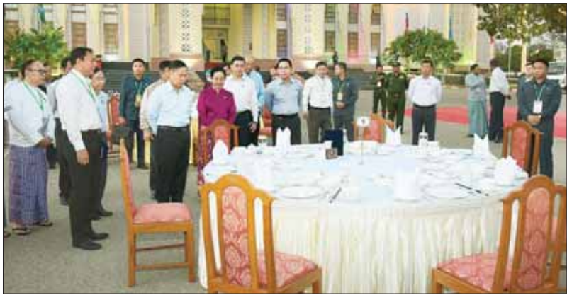
နိုင်ငံတော်စီမံအုပ်ချုပ်ရေးကောင်စီ ဒုတိယဥက္ကဋ္ဌ ဒုတိယဝန်ကြီးချုပ် ဒုတိယဗိုလ်ချုပ်မှူးကြီး စိုးဝင်း (၇၇)နှစ်မြောက် ပြည်ထောင်စုနေ့ ဂုဏ်ပြုညစာစားပွဲအခမ်းအနား ခင်းကျင်းပြင်ဆင်ထားမှုကို ကြည့်ရှုစစ်ဆေးစဉ်။

ထို့နောက် နိုင်ငံတော်စီမံအုပ်ချုပ်ရေးကောင်စီ ဒုတိယဥက္ကဋ္ဌ ဒုတိယဝန်ကြီးချုပ်သည် ၂၀၂၄ ခုနှစ် (၇၇)နှစ်မြောက် ပြည်ထောင်စုနေ့ ဂုဏ်ပြုညစာစားပွဲအခမ်းအနားအပြီးတွင် နေပြည်တော် မြို့တော်ခန်းမ လဟာပြင်ကဇာတ်ရုံ၌ သီဆိုကပြ ဇော်မြေတင်ဆက်ကြမည့် တိုင်းရင်းသား တိုင်းရင်းသားများ၏ဝတ်စုံပြည့်အစမ်းလေ့ကျင့်နေမှုများကို ကြည့်ရှုအားပေးပြီး အဆိုပါ ကပြဇော်မြေကြသည့်အဖွဲ့များအား ဂုဏ်ပြုပန်ခြင်းများပေးအပ်ကာ ရင်းရင်းနှီးနှီး လိုက်လံနွှတ်ဆက်ကြသည်။ ထိုသို့ လေ့ကျင့်ပြင်ဆင်ဆောင်ရွက်နေမှုများကို (၇၇) နှစ်မြောက် ပြည်ထောင်စုနေ့ကျင်းပရေးဗဟိုကော်မတီဥက္ကဋ္ဌ နိုင်ငံတော်စီမံအုပ်ချုပ်ရေးကောင်စီ ဒုတိယဥက္ကဋ္ဌ ဒုတိယဝန်ကြီးချုပ်နှင့်အတူ အခမ်းအနားကျင်းပရေးဗဟိုကော်မတီဝင် ပြည်ထောင်စုဝန်ကြီးများ၊ နေပြည်တော်ကောင်စီဥက္ကဋ္ဌ နေပြည်တော် တိုင်းစစ်ဌာနချုပ်တိုင်းမှူး၊ ဆပ်ကော်မတီဥက္ကဋ္ဌများဖြစ်ကြသည့် ဒုတိယဝန်ကြီးများနှင့်တာဝန်ရှိသူများက ကြည့်ရှုခဲ့ကြပြီး လိုအပ်သည်များ သိရှိနိုင်ဆောင်ရွက်ပေးခဲ့ကြောင်း သတင်းရရှိသည်။