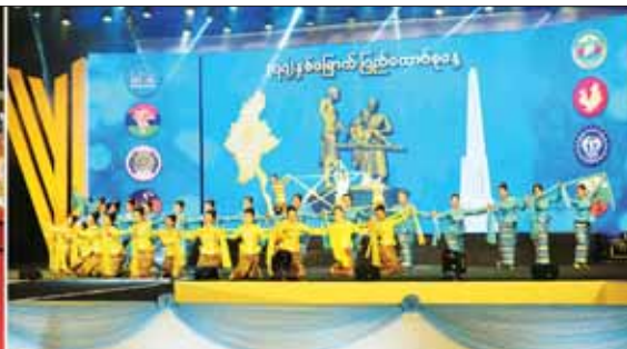
နိုင်ငံတော်စီမံအုပ်ချုပ်ရေးကောင်စီ ဒုတိယဥက္ကဋ္ဌ ဒုတိယဝန်ကြီးချုပ် ဒုတိယဗိုလ်ချုပ်မှူးကြီး စိုးဝင်း နေပြည်တော်မြို့တော်ခန်းမ လဟာပြင်ကဇာတ်ရုံ၌ သီဆိုကပြဇော်မြေတင်ဆက်ကြမည့် တိုင်းရင်းသား တိုင်းရင်းသားများ၏ဝတ်စုံပြည့်အစမ်းလေ့ကျင့်နေမှုများကို ကြည့်ရှုအေးပေးစဉ်။