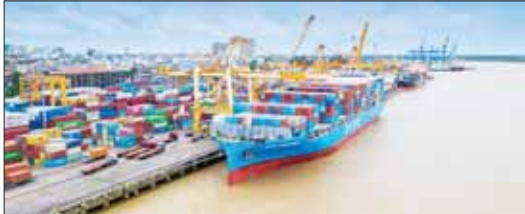
ကုန်သွယ်ရေး TEU ၂၅၀၀ ခန့် တင်ဆောင်နိုင်သည့် သင်္ဘောကြီး

အလားတူပင် ရန်ကုန်မြစ်ဝှမ်း Offshore Fixed Pilot Station တစ်ခုကို တည်ဆောက်အသုံးပြုနိုင်ခဲ့ခြင်းကြောင့်လည်း အဝင်အထွက် သင်္ဘောကြီးများကို နေ့စဉ်တက်ရောက်ရေလမ်းကြောင်း အထောက်အကူများ ပေးလာနိုင်ပြီး ရေကြောင်းပြုမူကြီးများနှင့် ရေကြောင်းဆိုင်ရာ ဝန်ထမ်းများသည်လည်း ယခင်ကကဲ့သို့ Pilot Vessel သဘောမျိုး အနေအထား ဆင်းရဲကျပ်တည်းစွာဖြင့် နေထိုင်ရန် မလုပ်အပ်တော့သည့် အပြင် ပိုမိုဘေးကင်းလုံခြုံစွာနဲ့ တာဝန်ထမ်းဆောင်နိုင်ကြပြီ ဖြစ်ပါသည်။ ထို့အပြင် ရန်ကုန်မြစ် ရေလမ်းကြောင်းတစ်လျှောက်တွင် ရေလမ်းကြောင်း အချက်ပြအမှတ်အသားများ (Navigation Aids) ကို ပြုပြင်/အစားထိုးလုပ်လုပ်တင်ဆင်ခြင်းနှင့် အဆင့်မြှင့်တင်ခြင်း တို့ကိုလည်း အလေးထားပြီး ဆောင်ရွက်လျက်ရှိပါသည်။