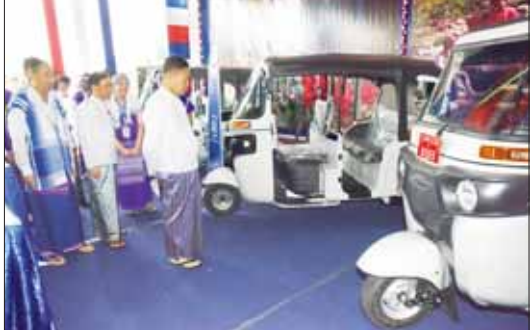
နိုင်ငံတော်စီမံအုပ်ချုပ်ရေးကောင်စီ ဒုတိယဥက္ကဋ္ဌ ဒုတိယဝန်ကြီးချုပ် ဒုတိယဗိုလ်ချုပ်မှူးကြီး စိုးဝင်း (၇၇) နှစ်မြောက် ပြည်ထောင်စုနေ့အထိမ်းအမှတ် MSME ထုတ်ကုန်ပြခန်းများနှင့် ရိုးရာအစားအစာပြခန်းများခင်းကျင်းပြသထုတ်ကုန် ကြည့်ရှုအားပေးစဉ်။

MSME ထုတ်ကုန်အရောင်းပြခန်းများအနေဖြင့် သမဝါယမနှင့် ကျေးလက်ဒေသဖွံ့ဖြိုးရေးဝန်ကြီးဌာန ထုတ်ကုန်အရောင်းပြခန်း၊ စက်မှုဝန်ကြီးဌာန ထုတ်ကုန်အရောင်းပြခန်း၊ နေပြည်တော်ကောင်စီနယ်မြေ ထုတ်ကုန်အရောင်းပြခန်း၊ တိုင်းဒေသကြီးနှင့် ပြည်နယ် ထုတ်ကုန်အရောင်းပြခန်း ၁၄ ခန်း၊ မြန်မာစီးပွားရေးကော်ပိုရေးရှင်း(MEC) ထုတ်ကုန်အရောင်းပြခန်းများအပြင် တိုင်းရင်းသားရိုးရာ အစားအသောက်အရောင်းပြခန်းများ အနေဖြင့် နေပြည်တော်ကောင်စီ အပါအဝင် တိုင်းဒေသကြီးနှင့် ပြည်နယ်များမှ ရိုးရာအစားအသောက်ပြခန်း ၁၉ ခန်းတို့ကို ဖေဖော်ဝါရီ ၁၀ ရက်မှ ၁၄ ရက်အထိ နေ့စဉ်နံနက် ၈ နာရီမှ ၂ ည ၀၀ နာရီထိ ဖျော်ဖြေရေးအစီအစဉ်များဖြင့် စည်ကားသိုက်မြိုက်စွာ ရောင်းချဖွင့်လှစ်ပေးသွားမည်ဖြစ်ကြောင်း သတင်းရရှိသည်။ သတင်းစဉ်