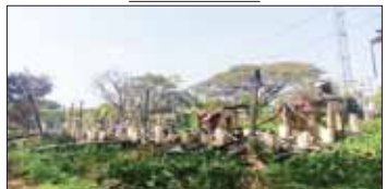
အဆောက်အဦများအား မီးရှို့ဖျက်ဆီးထားရှိမှု။

၆ ကျောပုံမှ ဒေသခံများ၏ နေထိုင်မှုအခြေအနေအထားကို စစ်ကောင်စီက ဖောက်ဖျက်ခြင်း၊ ဖျက်ဆီးခြင်း စသည့် အကြမ်းဖက် အဖျက်အမှောင် လုပ်ငန်းများကို လုပ်ဆောင်ခဲ့ပါသည်။ အကြမ်းဖက်သမားများ အနေဖြင့် ကောလင်းမြို့အား စစ်ကောင်စီက တိုင်းဒေသကြီး၏ တောင်ဘက်နှင့် မြောက်ဘက်ဆက်သွယ်မှုအရ အရေးကြီးသော မြို့ဖြစ်ခြင်း၊ ကောလင်းမြို့အနီးရှိ သမန်းခါပိတ်ဆို့ထားပုံနှင့် ရှေးဆိုင်များအား ဘန်ကာဆောက်လုပ်ထားရှိမှု။