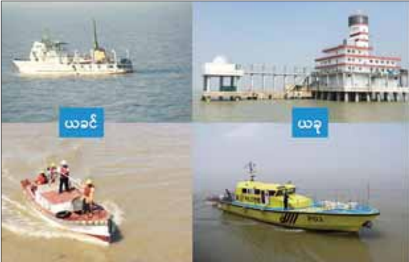
ရေယာဉ်အသစ် ရှစ်စင်းအနက် ၆၀ မီတာ ဘက်စုံသုံးဗော်ယာ မ/ချ ရေယာဉ် (Multipurpose Buoy Handling Vessel) MV. Ganda ကို တရုတ်နိုင်ငံ ကွမ်ကျိုးမြို့ရှိ Guangzhou Hangtong သင်္ဘောကျင်းတွင် တည်ဆောက်ခဲ့ပြီး ရန်ကုန်မြစ် ရေလမ်းကြောင်းတစ်လျှောက် နိုင်ငံတကာ ကုန်သွယ်သင်္ဘောကြီးများ ဘေးကင်းလုံခြုံစွာ ဝင်ထွက်သွားလာနိုင်ရန်နှင့် မြန်မာ့ကမ်းရိုးတန်း တစ်လျှောက်ရှိ ဆိပ်ကမ်းများ၏ ရေလမ်းကြောင်းများအတွင်း ဘေးအန္တရာယ်ကင်းစေရန်အတွက် ရေလမ်းကြောင်း အထောက်အကူပြု အချက်ပြ ဗော်ယာများ မ/ချ ပြုပြင်တပ်ဆင်ခြင်းလုပ်ငန်းများ၊ ကမ်းရိုးတန်း တစ်လျှောက် မီးပြတိုက်များ ပြုပြင်ထိန်းသိမ်းရေးလုပ်ငန်းများ၊ သင်္ဘောကြီးများကို တွန်း/ဆွဲခြင်းလုပ်ငန်းများ၊ မီးဘတ်

ထို့အပြင် ဝိုင်းဆောင်ရေးနှင့်ဆက်သွယ်ရေးဝန်ကြီးဌာန၊ မြန်မာ့ဆိပ်ကမ်းအာထောပိုင်သည် (၇၇)နှစ်မြောက် ပြည်ထောင်စုနေ့ကို ကြိုဆိုထုတ်ပြန်သည့်အနေဖြင့် ဆိပ်ကမ်းလုပ်ငန်းကဏ္ဍ ဖွံ့ဖြိုးတိုးတက်၍ ရေရှည်တည်တံ့ပြီး စဉ်ဆက်မပြတ်ဖွံ့ဖြိုးတိုးတက်လာ နိုင်ငံလူမှုစီးပွားရေးဖွံ့ဖြိုးမှုကို အထောက်အကူပြုနိုင်ရန်အတွက် ဆိပ်ကမ်း ဝန်ဆောင်မှုလုပ်ငန်းများ ဆောင်ရွက်ရာတွင် ပိုမိုဘေးကင်းလုံခြုံသည့် ဝန်ဆောင်မှုကောင်းများပေးနိုင်စေရန် ပြင်ဆင်ခြင်း၊ ပြည်ပမှ ဗဟုတည်ဆောက်ခဲ့သည့် စုစုပေါင်း အမေရိကန်ဒေါ်လာ ၃၁၀ မီဂရသန်း တန်ဖိုးရှိသော ရေယာဉ်အသစ် ရှစ်စင်း၊ လုပ်ငန်းခွင်စတင်ဝင်ရောက်ခြင်း အခမ်းအနားကို ၂၀၂၄ ခုနှစ် ဖေဖော်ဝါရီ ၁၀ ရက်တွင် အောင်မြင်စွာ ကျင်းပပြုလုပ်၍ အားသာလေးစားနိုင်ခဲ့ပါသည်။