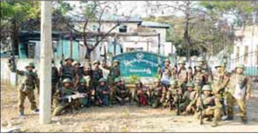
ကောလင်းမြို့အား လုံခြုံရေးတပ်ဖွဲ့ဝင်များက ပြန်လည်ထိန်းချုပ်ထားနိုင်မှုကို တွေ့မြင်ရစဉ်။