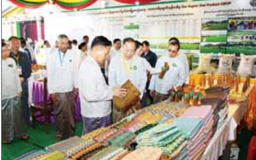
နိုင်ငံတော်စီမံအုပ်ချုပ်ရေးကောင်စီ ဒုတိယဥက္ကဋ္ဌ ဒုတိယဝန်ကြီးချုပ် ဒုတိယဗိုလ်ချုပ်မှူးကြီး စိုးဝင်း (၇၇) နှစ်မြောက် ပြည်ထောင်စုနေ့အထိမ်းအမှတ် MSME ထုတ်ကုန်ပြခန်းများနှင့် ရိုးရာအစားအစာပြခန်းများခင်းကျင်းပြသထုတ်ကုန် ကြည့်ရှုအားပေးစဉ်။