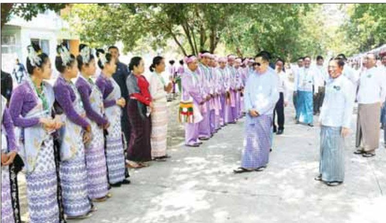
နိုင်ငံတော်စီမံအုပ်ချုပ်ရေးကောင်စီ ဒုတိယဥက္ကဋ္ဌ ဒုတိယဝန်ကြီးချုပ် ဒုတိယဗိုလ်ချုပ်မှူးကြီး စိုးဝင်း (၇၇)နှစ်မြောက် ပြည်ထောင်စုနေ့ဂုဏ်ပြုအခမ်းအနား၌ ပါဝင်ဆင်နွှဲကြမည့် တိုင်းဒေသကြီးနှင့် ပြည်နယ်များမှ တိုင်းရင်းသားရိုးရာယဉ်ကျေးမှုအဖွဲ့များအား ရင်းရင်းနှီးနှီး တွေ့ဆုံအားပေးစကားပြောကြားစဉ်။

နေပြည်တော် ဖေဖော်ဝါရီ ၁၀ (၇၇)နှစ်မြောက် ပြည်ထောင်စုနေ့ကျင်းပရေးဗဟိုကော်မတီဥက္ကဋ္ဌ နိုင်ငံတော်စီမံအုပ်ချုပ်ရေးကောင်စီ ဒုတိယဥက္ကဋ္ဌ ဒုတိယဝန်ကြီးချုပ် ဒုတိယဗိုလ်ချုပ်မှူးကြီး စိုးဝင်းသည် ယနေ့တွင် ၂၀၂၄ ခုနှစ် (၇၇)နှစ်မြောက် ပြည်ထောင်စုနေ့အခမ်းအနား အောင်မြင်စွာကျင်းပနိုင်ရေး ကြိုတင်ပြင်ဆင် ဆောင်ရွက်ထားရှိမှုများကို ကြည့်ရှုစစ်ဆေးသည်။ ဦးစွာ နိုင်ငံတော်စီမံအုပ်ချုပ်ရေးကောင်စီ ဒုတိယဥက္ကဋ္ဌ ဒုတိယဝန်ကြီးချုပ် ဒုတိယဗိုလ်ချုပ်မှူးကြီး စိုးဝင်းသည် တာဝန်ရှိသူများနှင့်အတူ ယနေ့ ဖွန်းလွှဲပိုင်းတွင် (၇၇)နှစ်မြောက် ပြည်ထောင်စုနေ့ ဂုဏ်ပြုအခမ်းအနား၌ ပါဝင်ဆင်နွှဲကြမည့် တိုင်းဒေသကြီးနှင့် ပြည်နယ်များမှ တိုင်းရင်းသားရိုးရာယဉ်ကျေးမှုအဖွဲ့များအား ၎င်းတို့ တည်းခိုနေထိုင်ကြသည့် နေပြည်တော်အားကစားရုံသို့ သွားရောက်၍ ရင်းရင်းနှီးနှီး တွေ့ဆုံအားပေးစကားပြောကြားသည်။ ညနေပိုင်းတွင် နိုင်ငံတော်စီမံအုပ်ချုပ်ရေးကောင်စီ ဒုတိယဥက္ကဋ္ဌ ဒုတိယဝန်ကြီးချုပ်သည် နေပြည်တော် မြို့တော်ခန်းမ ဥပစာရင်ပြင်၌ ကျင်းပမည့် ၂၀၂၄ ခုနှစ် (၇၇)နှစ်မြောက် ပြည်ထောင်စုနေ့ ဂုဏ်ပြုညစာစားပွဲအခမ်းအနား ခင်းကျင်းပြင်ဆင်ထားရှိမှုများကို ကြည့်ရှုစစ်ဆေးရာ တာဝန်ရှိသူများက လိုက်လံရှင်းလင်းပြသကြသည်။