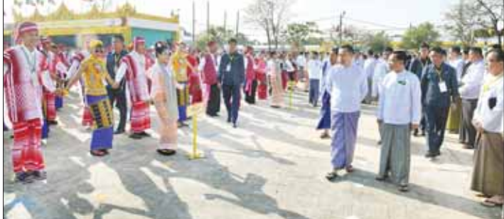
နိုင်ငံတော်စီမံအုပ်ချုပ်ရေးကောင်စီ ဒုတိယဥက္ကဋ္ဌ ဒုတိယဝန်ကြီးချုပ် ဒုတိယဗိုလ်ချုပ်မှူးကြီး စိုးဝင်း တိုင်းရင်းသားရိုးရာယမ်းအဖွဲ့များ၏ ပြည်ထောင်စုရဲ့ ထာဝရအလှူ တေးသီချင်းဖြင့် ကပြဖျော်ဖြေတင်ဆက်မှုကို ကြည့်ရှုအားပေးစဉ်။

တို့က အခမ်းအနားကို ဖဲကြိုးဖြတ်ဖွင့်လှစ်ပေးကြသည်။ မြန်မာ့အသံနှင့် ရုပ်မြင်သံကြားမှ ဝန်ထမ်းများ၊ နေပြည်တော်ကောင်စီ တိုင်းဒေသကြီးနှင့် ပြည်နယ်များမှ တိုင်းရင်းသားရိုးရာယမ်းအဖွဲ့များ၏ ပြည်ထောင်စုရဲ့ ထာဝရအလှူ တေးသီချင်းဖြင့် ကပြဖျော်ဖြေ တင်ဆက်မှုကို အဖွဲ့ဝင်များသည် သာသနာရေးနှင့် ယဉ်ကျေးမှုဝန်ကြီးဌာန အနုပညာဦးစီးဌာနမှ အနုပညာရှင်များ၊ ပြန်ကြားရေးဝန်ကြီးဌာန