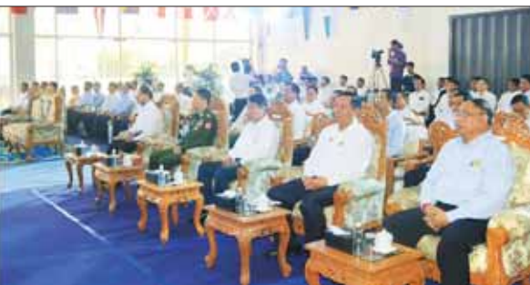
နိုင်ငံတော်စီမံအုပ်ချုပ်ရေးကော်မတီအဖွဲ့ဝင် ဒုတိယဝန်ကြီးချုပ်နှင့် ပြည်ထောင်စုဝန်ကြီး ဝန်ကြီးဌာနမှ အဖွဲ့ဝင် ဝန်ကြီးများ၊ ရန်ကုန်မြို့တော်ဝန်၊ ပို့ဆောင်ရေးနှင့် ဆက်သွယ်ရေး ဝန်ကြီးဌာန ဒုတိယဝန်ကြီး၊ ရန်ကုန်တိုင်းဒေသကြီးအစိုးရ အဖွဲ့ဝင် ဝန်ကြီးများ၊ ရန်ကုန်မြို့တော်ဝန်၊ ပို့ဆောင်ရေးနှင့် ဆက်သွယ်ရေး ဝန်ကြီးဌာနရှိ ဌာန၊ အဖွဲ့အစည်းများမှ ဌာနအကြီးအမှူးများနှင့် ဖိတ်ကြားထားသူများ တက်ရောက်ကြသည်။

ရေကြောင်း ပို့ဆောင်ရေးကွန်ရက်နှင့် ကောင်းမွန်စွာဆက်ဆံဆောင်ရွက်ပေးနိုင်သော ပင်လယ်ထွက်ပေါက် ပိုင်ဆိုင်ထားသည့် ကမ်းရိုးတန်းနိုင်ငံ (Rimland Country)၊ တစ်နည်းအားဖြင့် ပင်လယ်ရေကြောင်းပိုင်နိုင်ငံ (Maritime State) တစ်နိုင်ငံလည်း ဖြစ်ကြောင်း၊ ပင်လယ်ရေကြောင်း ပို့ဆောင်ရေးကဏ္ဍသည် နိုင်ငံ၏ အပြည်ပြည်ဆိုင်ရာ ကုန်သွယ်မှု ချိတ်ဆက်မှုရှိစေပြီး နိုင်ငံလူမှုစီးပွားတွင် လူမှုအရေးပါကြောင်းကို တွေ့ရမည်ဖြစ်ကြောင်း၊ ကုန်သွယ်မှု နည်းလမ်းများအနက် ပင်လယ်ရေကြောင်းဖြင့် ကုန်သွယ်မှုသည် ကမ္ဘာ့ကုန်သွယ်မှုတန်ဖိုး၏ ၇၀ ရာခိုင်နှုန်းနှင့် ကမ္ဘာ့ကုန်သွယ်မှုမဟုတ်မီ ၈၀ ရာခိုင်နှုန်းရှိကြောင်းကို United Nation Conference on Trade and Development (UNCTAD) က နှစ်စဉ်ထုတ်ပြန်သည့် Review of Maritime Transport အရ သိရှိရကြောင်း၊ စီးပွားရေးနှင့် ကုန်သွယ်ရေးဝယ်ရေး ဝန်ကြီးဌာနမှ ထုတ်ပြန်ထားသည့် စာရင်းများအရ ၂၀၂၂-၂၀၂၃ ဘဏ္ဍာရေးနှစ်