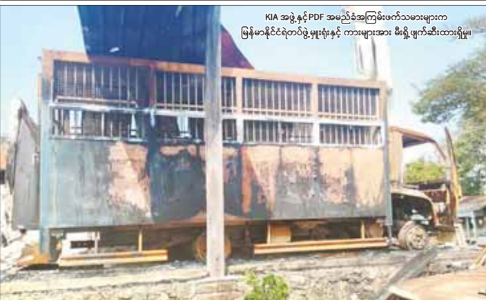
KIA အဖွဲ့နှင့် PDF အမည်ခံအကြမ်းဖက်သမားများက မြန်မာနိုင်ငံရဲတပ်ဖွဲ့မှူးရုံးနှင့် ကားများအား စီးရီးဖျက်ဆီးထားရှိမှု။