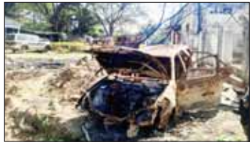
KIA အဖွဲ့နှင့် PDF အမည်ခံအကြမ်းဖက်သမားများက အဆောက်အဦ

အဆောက်အဦများအား မီးရှို့ဖျက်ဆီးထားရှိမှု။ ကောင်း ပြင်ဆင်လေ့ကျင့်ခြင်းနှင့် လိုအပ်သည့် စုစည်းမှုများကို ဆောင်ရွက်ခဲ့သည်။ ထိုကဲ့သို့ အင်အားစုဖွဲ့ပြီးနောက် တပ်မတော်စစ်ကူပစ်ကူပေးခြင်းများ အနေဖြင့် ကောလင်းမြို့အတွင်းနှင့် အနီးပတ်ဝန်းကျင်ရှိ KIA အဖွဲ့နှင့် PDF အမည်ခံအကြမ်းဖက်သမားများအား အကြမ်းဖက်ချေမှုန်းရေး စစ်ဆင်ရေး (Counter-Terrorism Operation) ဆောင်ရွက်ရန်အတွက် ဇန်နဝါရီ ၂၇ ရက်တွင် စစ်ကိုင်းတိုင်းဒေသကြီးကန်ဘလူမြို့သို့ ရောက်ရှိကြရာ မြို့မ၊ မြို့ဖျား၊ ဒေသခံပြည်သူများက သောင်းသောင်းပြုဖြူဆိုအားပေးခဲ့ကြသည်။ ထိုမှ