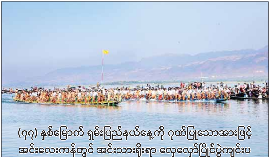
(၇၇) နှစ်မြောက် ရှမ်းပြည်နယ်နေ့ကို ဂုဏ်ပြုသောအားဖြင့် အင်းလေးကန်တွင် အင်းသားရိုးရာ လှေလှော်ပြိုင်ပွဲကျင်းပ

ညောင်ရွှေ ဖေဖော်ဝါရီ ၆ (၇၇)နှစ်မြောက် ရှမ်းပြည်နယ်နေ့ကို ဂုဏ်ပြုသောအားဖြင့် အင်းသားရိုးရာလှေလှော်ပြိုင်ပွဲကို ယမန်နေ့က ညောင်ရွှေမြို့နယ် အင်းလေးကန်၌ ကျင်းပပြုလုပ်ရာ နိုင်ငံတော်စီမံအုပ်ချုပ်ရေးကောင်စီအဖွဲ့ဝင်များဖြစ်ကြသည့် ဒေါက်တာဘရွှေနှင့် ခွန်စိလွင်၊ ပြည်ထောင်စုဝန်ကြီးများဖြစ်ကြသည့် ဦးမင်းသိန်း၊ ဒေါက်တာစိုးဝင်း၊ Jeng Phang နော်တောင်၊ စာမျက်နှာ ၄ ကော်လံ ၁ *