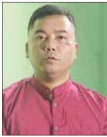
လှဝင်း(ခ)သားကြီး

အဲဒီဖုန်းကိုဆက်ပြီးတော့ ပစ္စည်းလာယူခိုင်းတယ်။ ဒုတိယကုန်းလမ်းဆိုတာ ပေါ့။ နောင်တရတယ်။ အိမ်က မိသားစုတွေ သိသွားတော့ ပိုဆိုးတာပေါ့။ အခုလိုမျိုးဖြစ်သွားတော့ နောင်တအလွန်ရတယ်။