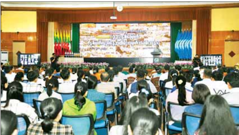
ပြည်ထောင်စုဝန်ကြီး ဦးမောင်မောင်အုန်း ပြန်ကြားရေးနှင့် ပြည်သူ့ဆက်ဆံရေးဦးစီးဌာန၏ (၃၃)နှစ်မြောက် နှစ်ပတ်လည်နေ့ အခမ်းအနားတွင် အမှာစကားပြောကြားစဉ်။

ပြန်ကြားရေးနှင့် ပြည်သူ့ဆက်ဆံရေးဦးစီးဌာနသည် တိုင်းဒေသကြီး၊ ပြည်နယ်၊ ခရိုင်၊ မြို့နယ်နှင့် မြို့ရုံးပေါင်း ၄၅၇ ရုံးနှင့်