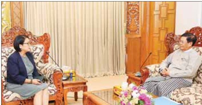
ဒုတိယဝန်ကြီးချုပ်နှင့် နိုင်ငံခြားရေးဝန်ကြီးဌာန ပြည်ထောင်စုဝန်ကြီး ဦးသန်းဆွေ ကုလသမဂ္ဂဒုက္ခသည်များဆိုင်ရာ မဟာမင်းကြီးရုံး၏ မြန်မာနိုင်ငံဆိုင်ရာ ကိုယ်စားလှယ် Ms. Noriko Takagi အား လက်ခံတွေ့ဆုံစဉ်။

ဒုက္ခသည်များဆိုင်ရာ မဟာမင်းကြီးရုံး၏ မြန်မာနိုင်ငံဆိုင်ရာ ကိုယ်စားလှယ် Ms. Noriko Takagi အား ယနေ့နံနက် ၁၀ နာရီတွင် နေပြည်တော်ရှိ အဆိုပါဝန်ကြီးဌာန၌ လက်ခံတွေ့ဆုံပြီး မြန်မာနိုင်ငံ၌ UNHCR က လက်ရှိဆောင်ရွက်လျက်ရှိသည့် လုပ်ငန်းများနှင့် မြန်မာနိုင်ငံနှင့် UNHCR အကြား အနာဂတ်တွင် ပူးပေါင်းဆောင်ရွက်နိုင်မည့် နည်းလမ်းများနှင့်ပတ်သက်၍ ဆွေးနွေးခဲ့ကြသည်။ ယင်းတွေ့ဆုံပွဲသို့ နိုင်ငံခြားရေးဝန်ကြီးဌာနမှ အဆင့်မြင့်အရာရှိများ တက်ရောက်ခဲ့ကြကြောင်း သတင်းရရှိသည်။ သတင်းစဉ်