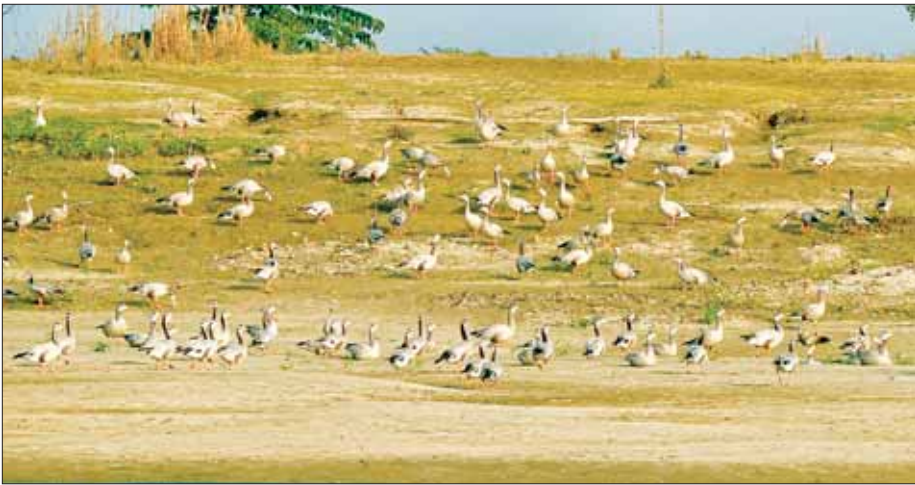
ရောဂါတစ်ခုအတွင်းရှိ သဲသောင်ခုံပေါ်တွင် လာရောက်ကျက်စားလျက်ရှိသည့် တောငန်းခေါင်းကြားငှက်များကို တွေ့ရစဉ်။

ကချင်ပြည်နယ် မြစ်ကြီးနားမြို့ ရောဂါတစ်ခုအတွင်းရှိ ရေလယ်ကျွန်းသဲသောင်ပေါ်တွင် ဖေဖော်ဝါရီ ၄ ရက် ညနေပိုင်းမှစတင်ပြီး ဆောင်းခိုငှက်မျိုးစိတ်တစ်ခုဖြစ်သည့် တောငန်းခေါင်းကြားငှက်များ ကောင်ရေ ၄၀၀ ခန့် အုပ်စုလိုက် ထူးခြားစွာလာရောက်ကျက်စားနေထိုင်လျက်ရှိသည်ကို တွေ့ရှိရသည်။ ယခုကဲ့သို့ ရောဂါတစ်ခုအတွင်း သောင်ခုံပေါ်တွင် လာရောက်ကျက်စားနေထိုင်မှုသည် နှစ်စဉ်နှစ်တိုင်း လာရောက်ခြင်းဖြစ်ပြီး အခြားငှက်မျိုးစိတ်များပါ နေထိုင်လေ့ရှိကာ လူများပြားပါက ယခုလို လာရောက်နေထိုင်ကျက်စားခြင်း မရှိကြောင်း၊ ယခုနှစ်သည် ရောဂါတစ်ခုအတွင်း သဲသောင်ခုံတွင် လူများနေထိုင်လာရောက် လုပ်ကိုင်ခြင်း မရှိသဖြင့် ယခုလို အုပ်စုလိုက် နေထိုင်ခြင်းဖြစ်ကြောင်းနှင့် ကချင်ပြည်နယ်အပါအဝင် မြန်မာနိုင်ငံအနေဖြင့် ကမ္ဘာပေါ်ရှိ ဆောင်းခိုငှက်များ စာမျက်နှာ ၁၇ ကော်လံ ၅ ❖