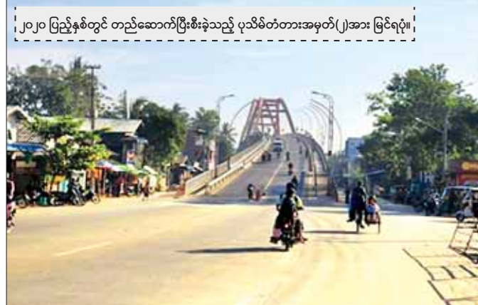
၂၀၂၀ ပြည့်နှစ်တွင် တည်ဆောက်ပြီးစီးခဲ့သည့် ပုသိမ်တံတားအမှတ်(၂)အား မြင်ရပုံ။