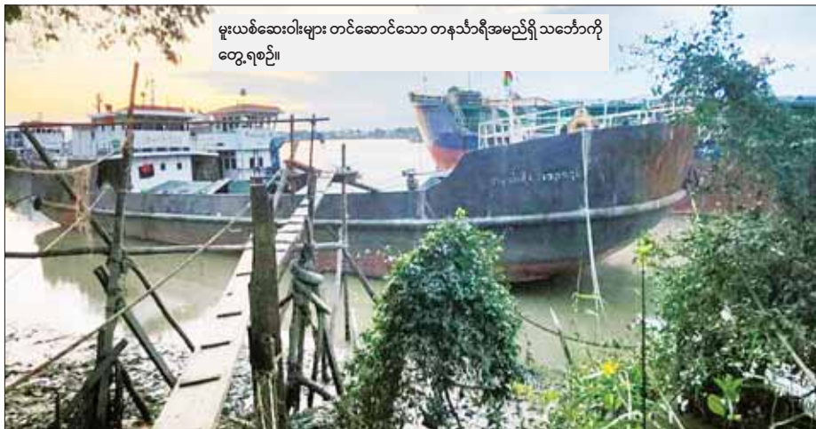
မူးယစ်ဆေးဝါးများ တင်ဆောင်သော တနင်္သာရီအမည်ရှိ သင်္ဘောကို တွေ့ရစဉ်။