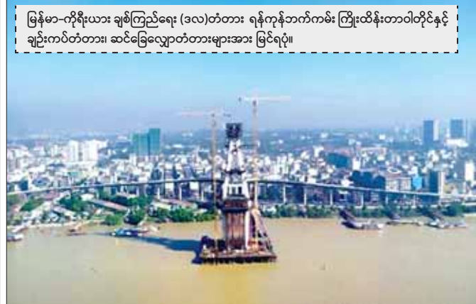
မြန်မာ-ကိုရီးယား ချစ်ကြည်ရေး (ဒလ) တံတား ရန်ကုန်ဘက်ကမ်း ကြိုးထိန်းတာဝါတိုင်နှင့် ချဉ်းကပ်တံတား၊ ဆင်ခြေလျှောတံတားများအား မြင်ရပုံ။