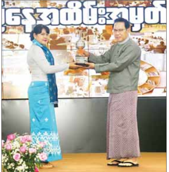
ပြည်ထောင်စုဝန်ကြီး ဦးမောင်မောင်အုန်း ဆုရရှိသူတစ်ဦးအား ဆုပေးအပ်ချီးမြှင့်စဉ်။

ထို့နောက် ပြည်ထောင်စုဝန်ကြီးသည် တက်ရောက်လာကြသူများနှင့် အတူ နေ့လယ်စာကို အတူတကွ သုံးဆောင်ခဲ့ကြသည်။ သတင်းစဉ်