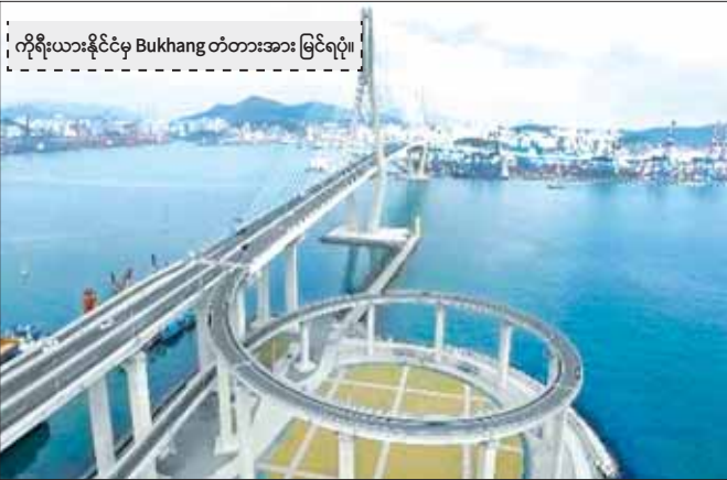
ကိုရီးယားနိုင်ငံမှ Bukhang တံတားအား မြင်ရပုံ။