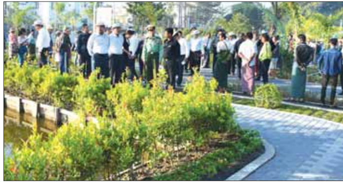
လှုပ်ရှားအားကစားပြုလုပ်နိုင်ရန် အားကစားပစ္စည်း အပန်းမြေ အနားယူနိုင်ရန် ယနေ့တွင် များ တပ်ဆင်ပေးထားခြင်းနှင့် အိမ်သာများ အောင်မြင်စွာ ဖွင့်လှစ်နိုင်ခဲ့ခြင်းဖြစ်ကြောင်း သိရ ဆောင်ရွက်ခဲ့ပြီး အများပြည်သူများ လွတ်လပ်စွာ သန်းကျော်ဦး(ပြန်/ဆက်)

ယခု ၂၀၂၃-၂၀၂၄ ဘဏ္ဍာနှစ်တွင် နဝရတ်ပန်းခြံ အတွင်း လှည့်လည်ပေးစားရန်အတွက် ၁၁ တိုင် စိုက်ထူခြင်း၊ မြင်းကောင်ရေသုံးကောင်အား အလှူပေးပေးတစ်ခု တပ်ဆင်ခြင်း၊ ပန်းခြံအတွင်း အရှည် ၁၄၂ ပေ ရှိ Interlock လျှောက်လမ်း ဖောက်လုပ်ခြင်း၊ စိမ်းလန်း သာယာဖွဲ့ပြည်စေရေးအတွက် အရိပ်ရပန်းပင်ကြီး များ ၁၆၅ ပင်၊ အရွက်လှနွယ်ပန်းပင် ၇၀၈၁ ပင်၊ ရာသီပန်းပင် ၃၄၀၀ တို့ကို စိုက်ပျိုးခြင်းနှင့် မြေယာ ရှုခင်းဆောင်ရွက်ခြင်း၊ ပန်းခြံအတွင်း ကိုယ်လက်