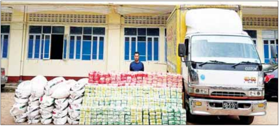
ဖမ်းဆီးရမိသည့်မူးယစ်ဆေးဝါးများ