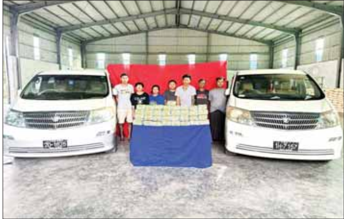
ဖမ်းဆီးရမိသည့် မူးယစ်ဆေးဝါးများနှင့် ဖြစ်မှုကျူးလွန်သူများ။