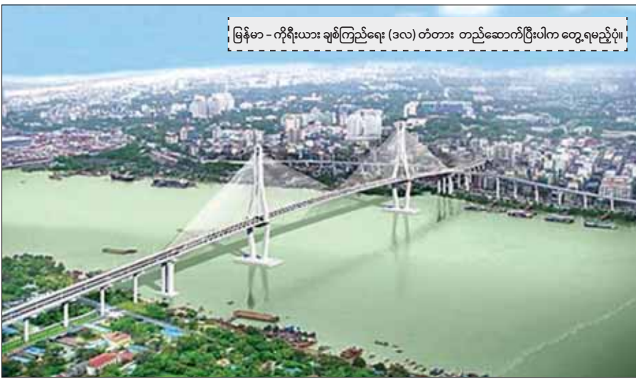
မြန်မာ - ကိုရီးယား ချစ်ကြည်ရေး (ဒလ) တံတား တည်ဆောက်ပြီးပါက တွေ့ရမည့်ပုံ။

ရန်ကုန်ဘက်ကမ်း ဘုန်းကြီးလမ်းမှ ချဉ်းကပ်တံတားအရည်ကို