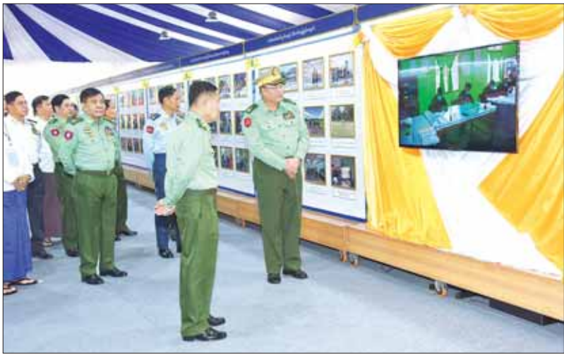
နိုင်ငံတော်စီမံအုပ်ချုပ်ရေးကောင်စီ ဒုတိယဥက္ကဋ္ဌ ဒုတိယတပ်မတော်ကာကွယ်ရေးဦးစီးချုပ် ကာကွယ်ရေးဦးစီးချုပ်(ကြည်း) ဒုတိယဗိုလ်ချုပ်မှူးကြီး စိုးဝင်းနှင့်အဖွဲ့ဝင်များ (၇၅)နှစ်မြောက် စိန်ရတနာဆုတံဆိပ်ပေးအပ်ခြင်း အထိမ်းအမှတ်ပြခန်းများအတွင်း လှည့်လည်ကြည့်ရှုစဉ်။

ထို့နောက် နိုင်ငံတော်စီမံအုပ်ချုပ်ရေးကောင်စီ ဒုတိယဥက္ကဋ္ဌ ဒုတိယတပ်မတော်ကာကွယ်ရေးဦးစီးချုပ် ကာကွယ်ရေးဦးစီးချုပ် (ကြည်း) က တက်ရောက်လာကြသည့် အငြိမ်းစားဆက်သွယ်ရေးတပ်ဖွဲ့ဝင် အရာရှိကြီးများအား ရင်းရင်းနှီးနှီးနှင့် နှုတ်ဆက်ပြီး တက်ရောက်လာကြသူများနှင့်အတူ (၇၅)နှစ်မြောက် စိန်ရတနာဆုတံဆိပ်ပေးအပ်ခြင်း အထိမ်းအမှတ်ခြေနန်းများအတွင်း လှည့်လည်ကြည့်ရှုခဲ့ကြကြောင်း သတင်းရရှိသည်။