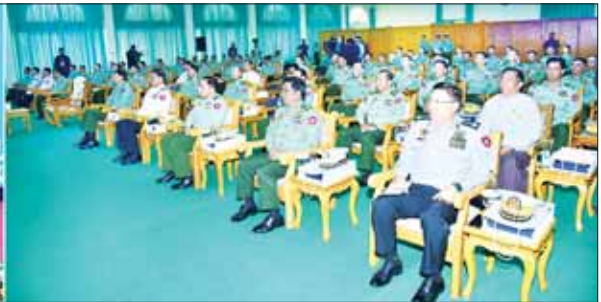
နိုင်ငံတော်စီမံအုပ်ချုပ်ရေးကောင်စီ ဒုတိယဥက္ကဋ္ဌ ဒုတိယတပ်မတော်ကာကွယ်ရေးဦးစီးချုပ် ကာကွယ်ရေးဦးစီးချုပ်ကြီး(ကြည်း) ဒုတိယဗိုလ်ချုပ်မှူးကြီး စိုးဝင်း (၇၅)နှစ်မြောက် စီနီရတာဆက်သွယ်ရေးတပ်ဖွဲ့နေ့ အထိမ်းအမှတ် ဂုဏ်ပြုအမှာစကားပြောကြားစဉ်။

❖ ရှေးမှီမှ အဆိုပါ (၇၅) နှစ်မြောက် စီနီရတာဆက်သွယ်ရေး တပ်ဖွဲ့နေ့အခမ်းအနားသို့ နိုင်ငံတော်စီမံအုပ်ချုပ်ရေး ကောင်စီဒုတိယဥက္ကဋ္ဌ ဒုတိယတပ်မတော်ကာကွယ် ရေးဦးစီးချုပ် ကာကွယ်ရေးဦးစီးချုပ်ကြီး(ကြည်း)နှင့် အတူ နိုင်ငံတော်စီမံအုပ်ချုပ်ရေးကောင်စီအဖွဲ့ဝင် များ၊ ပြည်ထောင်စုဝန်ကြီးများ၊ ကာကွယ်ရေးဦးစီး ချုပ်မှူးမှ အဆင့်မြင့်တပ်မတော်အရာရှိကြီးများ၊ နေပြည်တော်တိုင်းစစ်ဌာနချုပ် တိုင်းမှူး၊ အခြားစား ဆက်သွယ်ရေးတပ်ဖွဲ့ဝင် အရာရှိကြီးများ၊ တာဝန်ရှိသူ များနှင့်မိတ်ကြားထားသူများ တက်ရောက်ကြသည်။