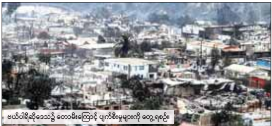
ဗယ်လီနိုင်းအလယ်ပိုင်း တောင်မီးလောင်ကြောင့် ဖျက်စီးမှုများကို တွေ့ရစဉ်။

တလော စီးပွားရေးနှင့် လူမှုစွန့်လှူရေးမူဝါဒများသည် လုံလောက်မှုမရှိကြောင်း အနီနီနှင့် ဂန်ဂျာက ပြောကြားခဲ့သည်။ နိုင်ငံတော်ရင်ဆိုင်နေရသည့် အကြီးဆုံး ကိစ္စရပ်များသည် ကွာဟချက်၊ မည်မျှချက်နှင့် တရားမျှတမှု မရှိခြင်းတို့ဖြစ်ကြောင်း အနီနီက ပြောသည်။ ဂန်ဂျာက မိခင်တိုင်း၊ ကလေးတိုင်း၊ သက်ကြီး စွယ်ဆိုတိုင်း၊ မသန်စွမ်းသူတိုင်းနှင့် ဒေသခံ အငိုင်း အငိုင်းတို့၏ ညီမျှသည့် ကျန်းမာရေးစောင့်ရှောက်မှု ရသင့်ကြောင်း ဖော်ပြခဲ့သည်။ လွန်ခဲ့သောလက ကောက်ယူခဲ့သော အခြေခံစစ်စစ်က ပရာဘိုဝိုသည် ထောက်ခံနှုန်း ၄၇ ရာခိုင်နှုန်းရရှိပြီး ၎င်း၏ပြိုင်ဘက် နှစ်ဦးထက် ထောက်ခံမဲ များကြောင်း သိရသည်။ အင်နီအိတ်ချ်က