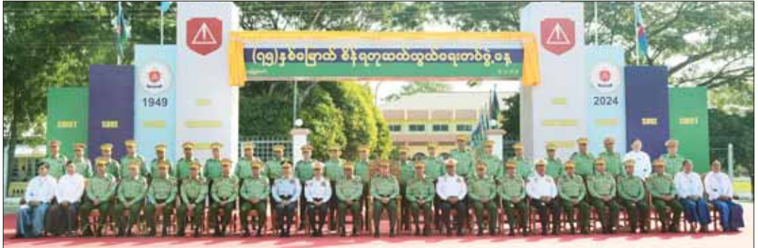
နိုင်ငံတော်စီမံအုပ်ချုပ်ရေးကောင်စီ ဒုတိယဥက္ကဋ္ဌ ဒုတိယတပ်မတော်ကာကွယ်ရေးဦးစီးချုပ် ကာကွယ်ရေးဦးစီးချုပ်(ကြည်း) ဒုတိယဗိုလ်ချုပ်မှူးကြီး စိုးဝင်း (၇၅)နှစ်မြောက် စိန်ရတနာဆုတံဆိပ်ပေးအပ်ခြင်းအခမ်းအနားသို့ တက်ရောက်လာကြသူများနှင့်အတူ စုပေါင်းမှတ်တမ်းတင်ဓာတ်ပုံရိုက်ခင်း။