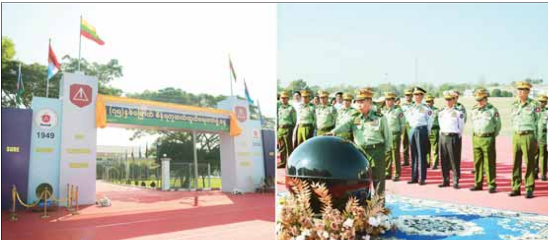
နိုင်ငံတော်စီမံအုပ်ချုပ်ရေးကောင်စီ ဒုတိယဥက္ကဋ္ဌ ဒုတိယတပ်မတော်ကာကွယ်ရေးဦးစီးချုပ် ကာကွယ်ရေးဦးစီးချုပ်(ကြည်း) ဒုတိယဗိုလ်ချုပ်မှူးကြီး စိုးဝင်း (၇၅)နှစ်မြောက် စိန်ရတုဆက်သွယ်ရေးတပ်ဖွဲ့ဧနု အထိမ်းအမှတ်ဆိုင်းဘုတ်အား စက်လေ့တိုက်ခိုက်လှုံ့ငွေပေးစဉ်။