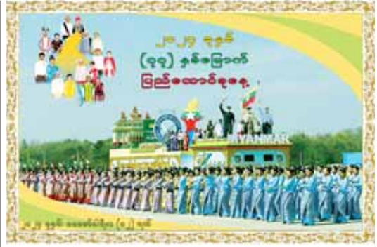
တစ်လှေတည်းစီး၊ တစ်ခရီးတည်းသွား ပြည်ထောင်စုသား သွေးချင်းများ တွဲထားလက်များ ခိုင်စေသား