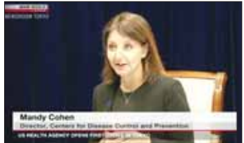
အမေရိကန် ရောဂါထိန်းချုပ်ရေးနှင့် ကာကွယ်ရေးစင်တာဒီစီမူညွှန်ကြားရေးမှူး မန်နီကိုဟန်။

ညီညီ တုံ့ပြန်ခြင်းနှင့် အမျိုးအမည် သတ်မှတ်ခြင်းတွင် အလွန်အရေးကြီးကြောင်း ကိုဟန်က ဆက်လက်ပြောကြားသည်။ ကမ္ဘာ့ကျန်းမာရေးကို ကာကွယ်ရန် မိမိတို့သည် မိမိတို့တွင်ရှိသည့် အကောင်းဆုံး စွမ်းအားများကို စုပေါင်းယူဆောင်လာကြရန် လိုကြောင်း ၎င်းက ဆက်လက် ပြောကြားသည်။ အင်နီအိတ်ချ်က