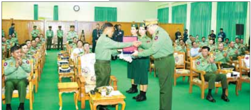
နိုင်ငံတော်စီမံအုပ်ချုပ်ရေးကောင်စီ ဒုတိယဥက္ကဋ္ဌ ဒုတိယတပ်မတော်ကာကွယ်ရေးဦးစီးချုပ် ကာကွယ်ရေးဦးစီးချုပ်(ကြည်း) ဒုတိယဗိုလ်ချုပ်မှူးကြီး စိုးဝင်းထံ ဆက်သွယ်ရေးညွှန်ကြားရေးမှူးက (၇၅)နှစ်မြောက် စိန်ရတနာဆုတံဆိပ်ပေးအပ်ခြင်းအမှတ်လက်ဆောင်ကို နေရာအရောက် ဂါရဝပြုပေးအပ်စဉ်။

ဆက်သွယ်ရေးတပ်ဖွဲ့သည် လွတ်လပ်ရေးကြိုးပမ်းမှုကာလကပင် တပ်မတော်နှင့်အတူ ပေါက်ဖွားလာသည့် တပ်ဖွဲ့တစ်ခုဖြစ်ပြီး ခေတ်အဆက်ဆက်တွင်လည်း တိုင်းပြည်နှင့်လူမျိုးအကျိုး၊ တပ်မတော်