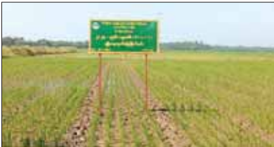
ကျိုက်လတ်မြို့နယ် ပန်းဘဲစု မြို့မရပ်ကွက်ပေါ်ရှိ စိုက်ပျိုးထားသော နွေစပါးမျိုးစေ့ထုတ် စံပြုစိုက်ခင်းများ။