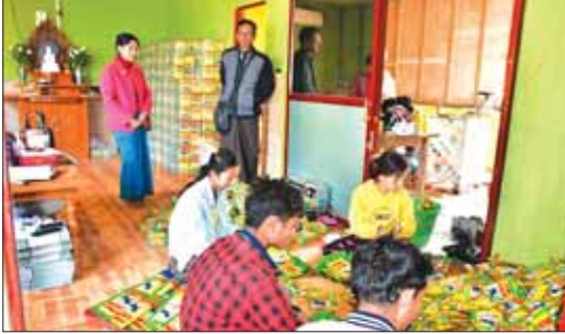
ပုံးရည်ကြီးများကို တံဆိပ်ပါ ပါကင်ထုပ်များ ထုပ်နေစဉ်။