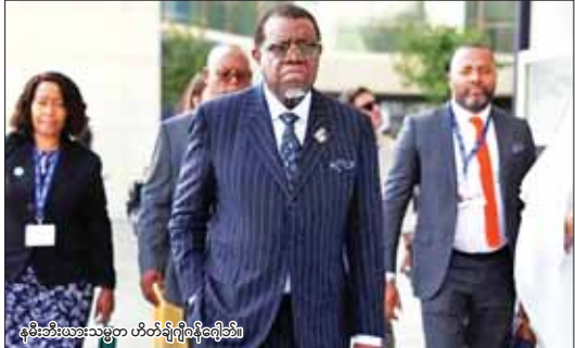
နမီးဘီးယားသမ္မတ ဟိတ်ချ်ဂျီဂန်ဂျော်၏

သမ္မတ ပြန်လည်ကျွန်းမလာစေ ရန် အစွမ်းကုန်ကြိုးစားခဲ့ကြောင်း ၎င်း၏ဆေးဘက်ဆိုင်ရာအဖွဲ့က ထုတ်ပြန်ချက်တွင် ဖော်ပြထားသည်။ ဂန်ဂျော်သည် မြို့တော် ဝင်းချော်ရှိ လေဒီပီမာတိဘာဆေးရုံ တွင် ကင်ဆာရောဂါအတွက် ဓာတုကုသမှုကို ကုသမှုခံယူပြီး နောက် ရိုးရိုးရသော်လည်း တည်ငြိမ်သော အခြေအနေ တွင် ရှိကြောင်း ဖေဖော်ဝါရီ ၃ ရက်က နမီးဘီးယား ဒုတိယ သမ္မတ အစ်တွတ်က ပြောကြား