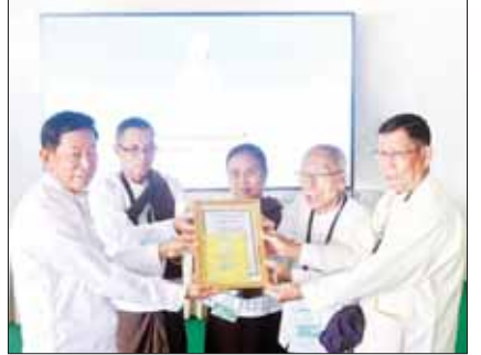
ဘုရားကြီးဘက်စုံဖြည့်မြင်မွမ်းမံရန်အတွက် အလှူငွေများ ပေးအပ်လျှင်ခံကြရာ ဘုရားဂေါပကအဖွဲ့ တာဝန်ရှိသူများက ဂုဏ်မြှောက်တမ်းလွှာ ပြန်လည်ပေးအပ်ခဲ့ပါ။

ဘုရားခါယကာကြီး အကြီးအကဲတို့ကနေပြီး ဘုန်းဘုန်းတို့ကို ဒီမာရဝိဇယဗုဒ္ဓရုပ်ပွားတော်မြတ်ကြီးကိုလည်း ထိန်းသိမ်းစောင့်ရှောက်ရင်း ဘုန်းဘုန်းတို့ကို ဒီမှာရွှေကျောင်းတော်ကြီးမှာ သီတင်းသုံးပြီးတော့ ကုသိုလ်ယူသာသနာပြုဖို့ လျှောက်ထားပါတယ်။ အဲဒီတော့ ဒီမှာ သီတင်းသုံးနေတဲ့ အခိုက်အတန့်မှာ ဘုန်းဘုန်းရဲ့ သင်တန်းကျောင်းက သင်တန်းသားတွေကို ဘုန်းဘုန်းက လာရောက်ပြီး ဖူးစေချင်တယ်။ ရုပ်ပွားတော်မြတ်ကြီးကို ဖူးမြော်ကြည့်ညိရင်းနဲ့ ဘုန်းဘုန်းကို ဖူးရင်းပေါ့။ သူတို့လည်း ဘုန်းဘုန်းတို့ရဲ့ ဂူတန်း၊ ဖူးမြော်ခွင့်ရတဲ့နံ့ ဖူးမြော်ဖို့ ဆိုပြီး အခုလို စီစဉ်ဆောင်ရွက်တာပါ။ ဒီအတွက် အလှူငွေနဲ့ မြောက်တမ်းသာရှိတယ်။ ကမ္ဘာပေါ်မှာလည်း အကြီးဆုံး၊