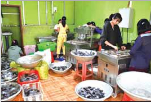
ပုံးရည်ကြီးထုပ်များကို လေထုတ်၍ အိတ်ပိတ်နေစဉ်။

မြင်းနက်ပုံးရည်ကြီး စားသောက်ကုန်လုပ်ငန်း အနေဖြင့် ပေါင်းအိုး(ဘွိုင်လား) စနစ်ဖြင့် ခေတ်မီ စက်ရိယာများ အသုံးပြုထုတ်လုပ်သဖြင့် တစ်ရက်လျှင် ပုံးရည်ကြီး ပိသော ၅၀၀ အထိ ထုတ်လုပ်နိုင်ပြီး ဈေးကွက်အပေါ် မူတည်၍ ထုတ်လုပ်လျက်ရှိသည်ဟု သိရသည်။ မြင်းနက်ပုံးရည်ကြီး လုပ်ငန်းအနေဖြင့် ဒေသပြည်သူများ အလုပ်အကိုင်အခွင့်အလမ်း