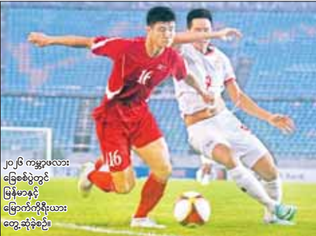
၂၀၂၆ ကမ္ဘာ့ပလားခြေစစ်ပွဲတွင် မြန်မာနှင့် မြောက်ကိုရီးယား တွေ့ဆုံခဲ့စဉ်။

ရပ်ကွက်၌ လိုင်စင်မဲ့ Suzuki Pick Up မော်တော်ယာဉ် တစ်စီး (ခန့်မှန်းတန်ဖိုးငွေကျပ် ၂၈၀၀၀၀) ကို ပို့ကုန်သွင်းကုန် ဥပဒေအရ လည်းကောင်း၊ စုစုပေါင်း ခန့်မှန်းတန်ဖိုးငွေကျပ် ၂၉၁၅၉၆၆ ကို ဖမ်းဆီးအရေးယူ ဆောင်ရွက်လျက်ရှိသည်။ စာမျက်နှာ ၁၅ ကော်လံ ၅ ဝ