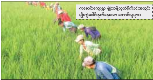
ကစောင်းကျေးရွာ မျိုးသန့်ထုတ်စိုက်ခင်းအတွင်း မျိုးကွဲပေါင်းနှုတ်နေသော တောင်သူများ။

ကစောင်းကျေးရွာ မျိုးသန့်ထုတ်စိုက်ခင်းတွင် ဒေသခံတောင်သူများက စိုက်ခင်းအတွင်းသို့ ဝင်ရောက်ပြီး မျိုးကွဲပေါင်းနှုတ်နေကြသည်။ တစ်နည်းလျှင် မျိုးကွဲပေါင်းနှုတ်နေသည်မှာ ကြည့်ရှုပင်ကောင်းလှသည်။ မျိုးသန့်ထုတ်စိုက်ခင်းများအတွင်း ဤသို့ မျိုးကွဲပေါင်းနှုတ်ခြင်းက