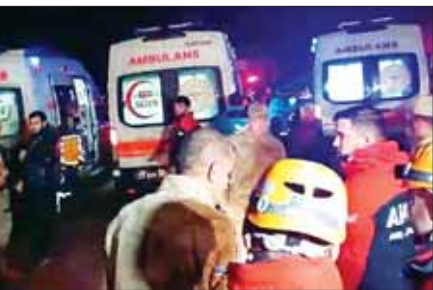
အဆိုပါရဟတ်ယာဉ်ပျက်ကျရာနေရာတွင် ရောက်ရှိနေသည့် အင်္ဂါနဂါ

လေကြောင်း လုံခြုံစိတ်ချမှု ဆိုင်ရာ အထူးထွေညွှန်ကြားရေး များစွာတွင် မှတ်ပုံတင်ထားသည့် အဆိုပါရဟတ်ယာဉ်သည် နှုတ်ခွင့် မရဘဲ ကာတယ်ကျေးရွာတွင် ပျက်ကျခဲ့ကြောင်း ယာလီ ကာရက လူမှုကွန်ရက်မီဒီယာ ပလက်ဖောင်း X တွင် ပြောကြား သည်။