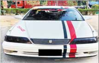
ရစ်ပြည်နယ်၌ ဖမ်းဆီးရမိ။

ယနေ့ သတင်း အညွှန်း အနုပညာလောကမှာ ကိုယ်ဝါသနာပါတဲ့ အလုပ်ကို ယုံယုံကြည်ကြည်လုပ်မယ်ဆိုရင် စိတ်ရောကုယ်ပါထည့်ပြီး ကြိုးစား အလုပ်လုပ်ပါ။ လူငယ်တွေအားလုံး ပိုပြီးတော်လာမှာပါ။ ဒီလိုပဲ လူငယ်တွေကို တော်စေချင်ပါတယ်။ တွေ့ဆုံမေးမြန်း စာ ၉