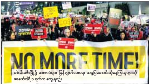
တံလဲအစိုးရမြို့၌ ဓားစာခံများ ပြန်လွှတ်ပေးရေး ဆန္ဒပြတောင်းဆိုနေကြသူများကို ဖေဖော်ဝါရီ ၃ ရက်က တွေ့ရပုံ။ ကမူ ယင်းအဆိုပြုချက်ကို ပယ်ချခဲ့သည်။ အမေ အရေအလွယ်ပိုင်းဒေသသို့ ခရီးထွက်ရန် စီစဉ်ထား ရီကန် နိုင်ငံခြားရေးဝန်ကြီး အဖွဲ့တို့နားလင်ကန် သည် အစွဲရေနှင့် ကာတာနိုင်ငံတို့အပါအဝင် အင်န်အိတ်ချ်ကေ

တစ်ကျောင်း ထိမှန်ကာ ကလေးနှစ်ဦးထက်မနည်း သေဆုံးကာ ဒဏ်ရာရရှိသူလည်း များပြားကြောင်း ပါလက်စတိုင်းမီဒီယာများတွင် ဖော်ပြကြသည်။ အစွဲရေတပ်ဖွဲ့၏ တိုက်ခိုက်မှုကြောင့် သေဆုံး သူဦးရေမှာ ၂၇၂၀၀ ခန့်ရှိပြီဟု ဂါဇာကျွန်းမာရေး အာဇာတင်ပိုင်များက ပြောသည်။ ကာတာနှင့် အီဂျစ် နိုင်ငံတို့၏ ကြားဝင်ဆောင်ရွက်ပေးမှုဖြင့် အခတ်ရပ်စဲရေးနှင့် ဓားစာခံများ ပြန်လွှတ်ပေးရေး ဆွေးနွေးမှုများကို ဇန်နဝါရီလနည်းပိုင်းမှစတင်ကာ ပြုလုပ်လျက်ရှိသည်။ ဟားမားစ်တို့ဘက်မှ လုံ့လအဖမ်းအတံ့ရပ်စဲ ရေး တောင်းဆိုလျက်ရှိသော်လည်း အစွဲရေဘက်