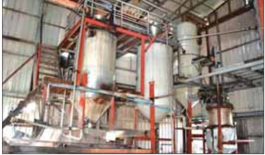
ပုံးရည်ကြီးထုတ်လုပ်ရန် ပဲခူးမြို့နယ်၊ သာဝတ္တိမြို့၊ ရေတာပည်မြို့နယ်၊ မြင်းနက် (ဘွိုင်လား) များ။

FDA အသိအမှတ်ပြုလက်မှတ်ရရှိပြီး စက်မှု ကြီးကြပ်ရေးနှင့် စစ်ဆေးရေးဦးစီးဌာနမှ တွေ့ကြုံရသည့် မှတ်ပုံတင်ထားရှိသဖြင့် နိုင်ငံတော်မှ MSME ဖွံ့ဖြိုးတိုးတက်ရေး ချေးငွေကူပံ့သိန်း ၅၀၀ ကို ၂၀၂၃ ခုနှစ်အတွင်း ရရှိခဲ့ကြောင်း သိရသည်။ နိုင်ငံတော်၏ ပံ့ပိုးမှုများနှင့်ပတ်သက်၍ “အသေးစား အလတ်စား စီးပွားရေးလုပ်ငန်းများ ဖွံ့ဖြိုးတိုးတက်ရေးအတွက် ထောက်ပံ့ငွေ (ချေးငွေ)