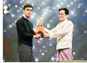
အကောင်းဆုံးရုပ်ရှင်ဇာတ်ကားဆုရ ခတ္တိယရုပ်ရှင်ထုတ်လုပ်ရေး အကယ်ဒမီရွှေစင်ရုပ်တု လက်ခံယူစဉ်။