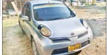
၂၀၂၄ ခုနှစ် ဖေဖော်ဝါရီ ၂ ရက်တွင် ပဲခူးမြို့နယ် ကမာနတ်ကျေးရွာအနီး ပဲခူး-သနပိုင်လမ်းဆုံတွင် ၁၀၇ မမ ရှော့တိုက်ခန်း ၁၀ လုံးနှင့်အတူ ဖမ်းဆီးရမိသည့် တရားခံ ခြောက်ဦးစီးခင်းလားသည့် ဖော်တော်ယာဉ်၏ မှတ်တမ်းဓာတ်ပုံ။