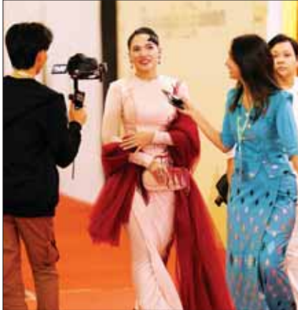
သရုပ်ဆောင် အကယ်ဒမီ အေးမြတ်သူ