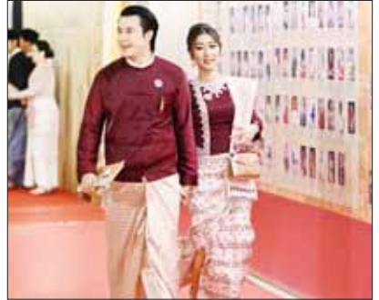
သရုပ်ဆောင် အကယ်ဒမီ နေတိုးနှင့်စန်း