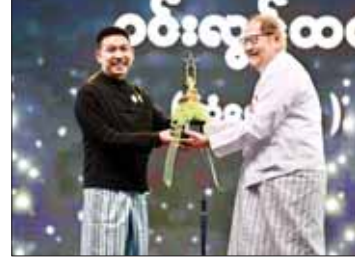
အကောင်းဆုံးရုပ်ရှင်ဇာတ်ပို့ဆုရ ဝင်းလွင်ထက် အကယ်ဒမီရွှေစင်ရုပ်တု လက်ခံယူစဉ်။