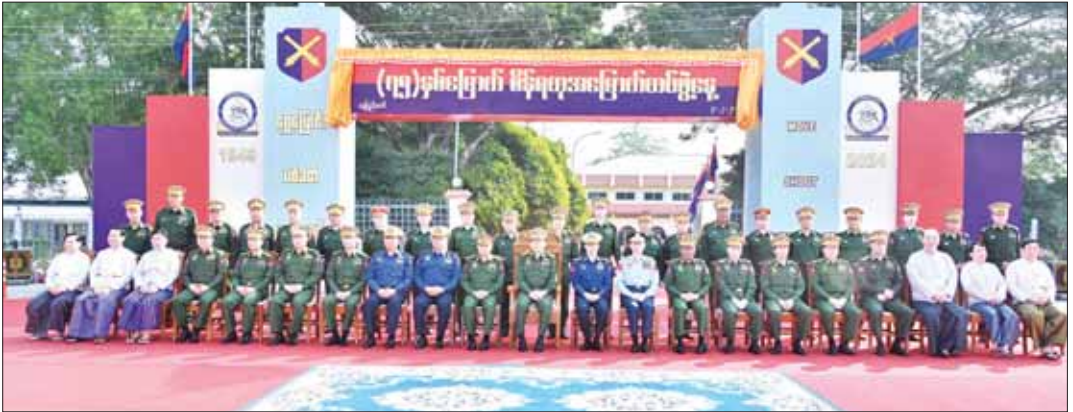
နိုင်ငံတော်စီမံအုပ်ချုပ်ရေးကောင်စီဥက္ကဋ္ဌ တပ်မတော်ကာကွယ်ရေးဦးစီးချုပ် ဗိုလ်ချုပ်မှူးကြီး မင်းအောင်လှိုင်နှင့် အခမ်းအနားတက်ရောက်လာကြသူများ စုပေါင်းမှတ်တမ်းတင်ဓာတ်ပုံရိုက်စဉ်။