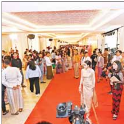
၂၀၂၃ ခုနှစ် မြန်မာ့ရုပ်ရှင်ထူးချွန်ဆုချီးမြှင့်ပွဲအခမ်းအနားသို့ တက်ရောက်လာကြသူများကို တွေ့ရစဉ်။