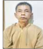
ကော့ကော့