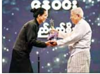
အကောင်းဆုံးအမျိုးသားဇာတ်ပို့ဆုရ နေဝင်း အကယ်ဒမီရွှေစင်ရုပ်တု လက်ခံယူစဉ်။