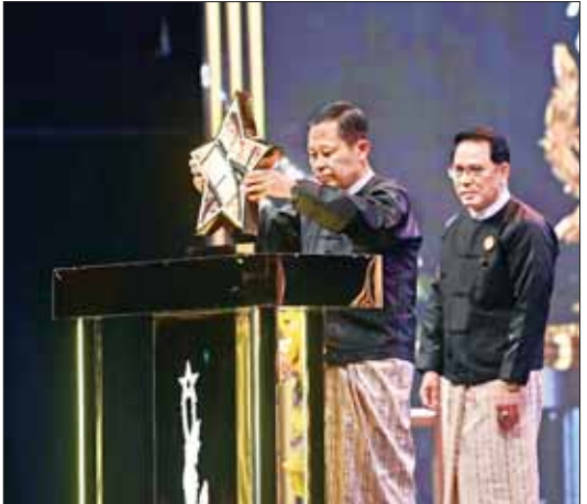
နိုင်ငံတော်စီမံအုပ်ချုပ်ရေးကောင်စီ ဒုတိယဥက္ကဋ္ဌ ဒုတိယဝန်ကြီးချုပ် ဒုတိယဗိုလ်ချုပ်မှူးကြီး စိုးဝင်း၊ အကယ်ဒမီရွှေကြယ်ကို စိုက်ထူ၍ ၂၀၂၃ ခုနှစ်အတွက် မြန်မာ့ရုပ်ရှင်ထူးချွန်ဆု ချီးမြှင့်ပေးအပ်ခြင်းအခမ်းအနား ဖွင့်လှစ်ပေးစဉ်။

စက်ခလုတ်ခုံတွင် အကယ်ဒမီရွှေကြယ်ကို စိုက်ထူ၍ ၂၀၂၃ ခုနှစ်အတွက် မြန်မာ့ရုပ်ရှင်ထူးချွန်ဆု ချီးမြှင့်ပေးအပ်ခြင်းအခမ်းအနားကို ဖွင့်လှစ်ပေးသည်။ ဆက်လက်၍ မြန်မာ့အသံနှင့် ရုပ်မြင်သံကြားနှင့် မြန်ကြားရေးနှင့် ပြည်သူ့ဆက်ဆံရေး ဦးစီးဌာနတို့က ဂုဏ်ပြုစီစဉ် တင်ဆက်သည့် "ရာပြည့်နှစ်အလွန် အကျိုးဆက် ရှာဖွေ မြန်မာ့ရုပ်ရှင် တိုးတက်ပါစေ" မှတ်တမ်း Video Clip ကို ပြသသည်။ ထို့နောက် နိုင်ငံတော်စီမံအုပ်ချုပ်ရေးကောင်စီ ဒုတိယဥက္ကဋ္ဌ ဒုတိယဝန်ကြီးချုပ်က အဖွင့်အမှာစကား ပြောကြားရာတွင် ယခုကဲ့သို့ မင်္ဂလာရှိသည့် အချိန်အခါမဟုတ်ဘဲ ရုပ်ရှင်ထူးချွန် အနုပညာရှင်ကြီးများ