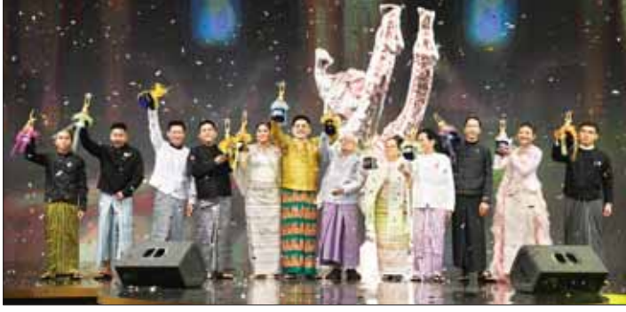
မြန်မာ့ရုပ်ရှင်ထူးချွန်ဆုဖျော်ဖြေပွဲတွင် မြန်မာ့ရုပ်ရှင်တစ်သက်တာဆုရရှိကြသူများနှင့် အကယ်ဒမီဆုရရှိကြသူများကို တွေ့ရစဉ်။

အမျိုးသားရေးစိတ်ဓာတ် အလားတူ ထူးချွန်ဆု မရရှိသေးသည့် အနုပညာရှင်များအနေဖြင့်လည်း လာမည့်နှစ်ကာလများတွင် မိမိတို့၏အနုပညာစွမ်းမာတားကို မြှင့်တင်ပြီး ထူးချွန်ဆုများ ဆွတ်ခမ်းကြပါဟု တိုက်တွန်းလိုပါကြောင်း။ အထူးမောဟရုပ်ပုံလုံသည်ဟု မြန်မာ့ဓလေ့စရိုက်များ မမှန်မကန်ပျောက်ရှက်ရေရန်နှင့် တိုင်းတစ်ပါးယဉ်ကျေးမှုဓလေ့စရိုက်များ လွှမ်းမိုးပြီး အရိုးပေါ်အရက်မရစေရန် ပြောင်းလဲနေသည့် ခေတ်ရေစီးကြောင်းပေါ်တွင် လိုက်လျောညီထွေစွာလိုက်ပါပြီး နိုင်ငံနှင့်လူမျိုးအကျိုးကို မိမိတို့တတ်ကျွမ်းသည့် အနုပညာကို အမြဲမြတ်နိုးပြီး အမျိုးသားရေးစိတ်ဓာတ်နှင့် ဖော်ဆောင်ပေးကြပါဟု တိုက်တွန်းပါကြောင်းဖြင့်ပြောကြားသည်။ မြန်မာနိုင်ငံ ရုပ်ရှင်အစည်းအရုံး၊ ဥက္ကဋ္ဌ အကယ်ဒမီများရုံးကြည့်စိုးထွန်းက ဝမ်းမြောက်စကားပြောကြားသည်။ ဆက်လက်၍ အခမ်းအနားမှူးက ၂၀၂၃ ခုနှစ်အတွက် မြန်မာ့ရုပ်ရှင် ထူးချွန်ဆုအဖွဲ့ကို အခမ်းအနားအတွင်း ပါဝင်ကူညီပေးကြောင်း ရွှေကြိုမောင်/မယ်အားပါ။