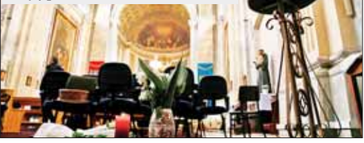
အစ္စတန်ဘူလ် ဘာသာရေးအဆောက်အအုံတိုက်ခိုက်ခံရမှုနှင့်

တာဝာရေးအဆောက်အအုံ အခင်းဖြစ်ပွားမှုကို စနစ်တကျ ၂၈ ရက်က တွေ့ရစဉ်။