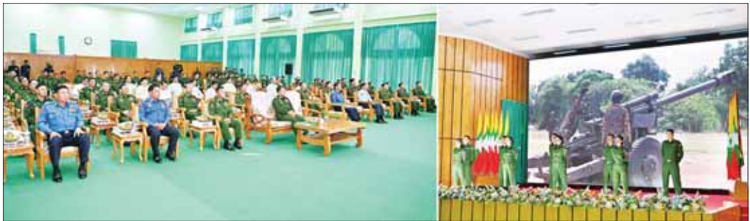
နိုင်ငံတော်စီမံအုပ်ချုပ်ရေးကောင်စီဥက္ကဋ္ဌ တပ်မတော်ကာကွယ်ရေးဦးစီးချုပ် ဗိုလ်ချုပ်မှူးကြီး မင်းအောင်လှိုင်နှင့် အခမ်းအနားတက်ရောက်လာကြသူများ (၇၇)နှစ်မြောက် မိန့်ရတုအခြောက်တပ်ဖွဲ့နေ့ ဂုဏ်ပြုသီချင်း ဖြစ်သည့် "မိန့်ရတုမှသည် ရတုအဆက်ဆက်ချီ" သီချင်းဖြင့် ဖျော်ဖြေတင်ဆက်မှုကို ကြည့်ရှုအားပေးကြစဉ်။

စာမျက်နှာ ၄ မှ အကြိမ်ကြိမ်သက်သေပြနိုင်ခဲ့ကြပြီး ဘွဲ့ထူး၊ ဂုဏ်ထူးများ ရရှိသူ အရာရှိ၊ စစ်သည်၊ ရဲမေများ ပေါ်ထွက်ခဲ့သည့် အတွက်လည်း အသိအမှတ်ပြု ဂုဏ်ယူသည်ကို ပြောကြားလိုကြောင်း။