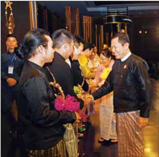
နိုင်ငံတော်စီမံအုပ်ချုပ်ရေးကော်မရှင် ဒုတိယဥက္ကဋ္ဌ ဒုတိယဝန်ကြီးချုပ် ဒုတိယဗိုလ်ချုပ်မှူးကြီး ဖိုးဝင်းနှင့် ဇနီး ဒေါ်သန်းသန်းနွယ် မြန်မာ့ရုပ်ရှင်ထူးချွန်ဆုရရှိသူများအား ရင်းရင်းနှီးနှီးနှုတ်ဆက်စဉ်။

စာပေ ရုပ်ရှင် ဂီတ၊ သဘင်စသည့် နယ်ပယ်ကဏ္ဍအသီးသီး ဖွံ့ဖြိုးတိုးတက်လာရန် အတွက် ဖြစ်သင့်ဖြစ်ထိုက်သည့် ကူညီပံ့ပိုးမှုများကို ဆက်လက်ဆောင်ရွက်ပေးသွားမည်ဖြစ်ပါကြောင်း၊ ရုပ်ရှင်အနုပညာရှင်များကလည်း ပြည့်သူများကို ဖော်ဖြေပေးသက်သက်သာမက နိုင်ငံ၏ ယဉ်ကျေးမှုနှင့် ချစ်စဖွယ် မြန်မာ့စလေ မြန်မာ့စရိုက် မြန်မာ့ဓလေ့ပြတောတောင် သဘာဝအလှအပများကို ဖော်ညွှန်းပြီး နိုင်ငံဖွံ့ဖြိုးတိုးတက်ရေးကို ရှေးရှုရှိုက်ကူတင်ဆက်ရေးနှင့် အမျိုးသားရေးနှင့်ယှဉ်ပြီး တိုင်းချစ်ပြည်ချစ်စိတ် ထွန်းကားရေး၊ ပြည်သူများ အသိပညာတိုးတက်ရေး၊ နိုင်ငံတော်၏ ဦးတည်ချက်များ အောင်မြင်စေရေးတို့အတွက် ရိုက်ကူတင်ဆက်ပေးကြပါရန် တပ်လောင်း တိုက်တွန်းပြောကြားလိုပါကြောင်း။