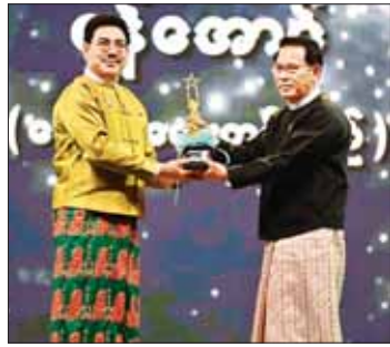
ပြည်ထောင်စုဝန်ကြီး ဦးမောင်မောင်အုန်း အကောင်းဆုံးအမျိုးသား ဇာတ်ဆောင်ဆုရ အကယ်ဒမီများရှင် ရန်အောင်ကို အကယ်ဒမီ ရွှေစင်ရုပ်တု ချီးမြှင့်စဉ်။

အာရုံ၊ အကြားအာရုံ စိတ်ခံစားမှု ရုံသာမက လူများ၏ စိတ်ခံစားမှု တို့နှင့် ပေါင်းစပ်ပြီး လူတို့၏ ကို ပြောင်းလဲစေနိုင်သည်အထိ နှလုံးသားကို ရိုက်ခတ်သွားစေနိုင် စာမျက်နှာ ၉ သို့