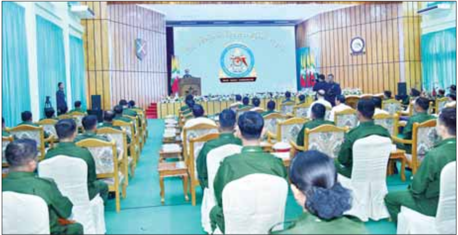
နိုင်ငံတော်စီမံအုပ်ချုပ်ရေးကောင်စီဥက္ကဋ္ဌ တပ်မတော်ကာကွယ်ရေးဦးစီးချုပ် ဗိုလ်ချုပ်မှူးကြီး မင်းအောင်လှိုင် (၇၇) နှစ်မြောက် စိန်ရတုအမြောက် တပ်ဖွဲ့ နေ့အခမ်းအနားတွင် ဂုဏ်ပြုအမှာစကား ပြောကြားစဉ်။

စာမျက်နှာ ၃ မှ စွမ်းစွမ်းတမ်း ဆောင်ရွက်နိုင်ခဲ့သည်ကို တွေ့ရှိရသည့်အတွက် ဂုဏ်ယူကြောင်း။ အမြောက် တပ်ဖွဲ့ဝင်များ အနေဖြင့် တပ်ဖွဲ့၏မူလတာဝန်များကိုသာမက တပ်မတော်၏ ပြည်သူ့အကျိုးပြု လုပ်ငန်းများ၊ ၂၀၀၈ ခုနှစ်က ဖြစ်ပွားခဲ့သည့် နာဂစ်မုန်တိုင်း၊ ၂၀၂၃ ခုနှစ်က ဖြစ်ပွားခဲ့သည့် မိုခါမုန်တိုင်းများ အပြင် နိုင်ငံအတွင်းဖြစ်ပွားခဲ့သည့် အခြား သဘာဝဘေးအန္တရာယ် ဆိုင်ရာ ကူညီကယ်ဆယ်ရေး လုပ်ငန်းများတွင်လည်း တက်တက်ကြွကြွ ပါဝင်ဆောင်ရွက်ခဲ့ကြသည်ကို တွေ့ရှိရကြောင်း။ ဂုဏ်ယူအသိအမှတ်ပြု ထိုပြင် ယနေ့ နိုင်ငံတော် စီမံအုပ်ချုပ်ရေး ကောင်စီအဖွဲ့ချုပ် လက်ထက်တွင် နိုင်ငံတော်ကို ဘက်ပေါင်းစုံက အမျက်အမှောင့် လှုပ်ငန်းမျိုးစုံ ဆောင်ရွက်နေသည့် အကြမ်းဖက် သောင်းကျန်းသူ