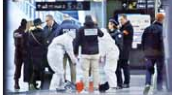
နဂါး ဖေဖော်ဝါရီ ၃ ရက်က စားထိုးမှုဖြစ်ပွားရာ လူသုံးဦး ဒဏ်ရာရရှိခဲ့သည်ဟု ပြည်ထောင်စုစီဒီယာများတွင် ဖော်ပြထားသည်။ နံနက် ၈ နာရီ ဝန်းကျင်က စားထိုးမှုဖြစ်ပွားခဲ့ခြင်းဖြစ်သည်။ ဒဏ်ရာရရှိသူသုံးဦးအနက် တစ်ဦးမှာ ဒဏ်ရာအလွန်ပြင်းထန်ပြီး ကျန်နှစ်ဦးမှာ အသေးစားဒဏ်ရာများသာ ရရှိခဲ့သည်ဟု ရဲတပ်ဖွဲ့သတင်းအချက်အလက်များဖြင့် သိရသည်။ စားထိုးမှုပြုလုပ်စဉ် ဖြစ်ပွားမှုကြား လူနာသုံးဦး ပြန်လည်ရောက်ရှိကာ အိမ်ရာအတည်တကျဖြစ်နေကြပြီဟု ၎င်းက ဆက်လက်ပြောကြားခဲ့သည်။ ဆင်ဟွာ

နဂါး ဖေဖော်ဝါရီ ၃ ပါရီ အရှေ့တောင်ပိုင်းရှိ ဂရိဒီလ်ယွန်ဘူတာရုံတွင် ဖေဖော်ဝါရီ ၃ ရက်က စားထိုးမှုဖြစ်ပွားရာ လူသုံးဦး ဒဏ်ရာရရှိခဲ့သည်ဟု ပြည်ထောင်စုစီဒီယာများတွင် ဖော်ပြထားသည်။ နံနက် ၈ နာရီ ဝန်းကျင်က စားထိုးမှုဖြစ်ပွားခဲ့ခြင်းဖြစ်သည်။ ဒဏ်ရာရရှိသူသုံးဦးအနက် တစ်ဦးမှာ ဒဏ်ရာအလွန်ပြင်းထန်ပြီး ကျန်နှစ်ဦးမှာ အသေးစားဒဏ်ရာများသာ ရရှိခဲ့သည်ဟု ရဲတပ်ဖွဲ့သတင်းအချက်အလက်များဖြင့် သိရသည်။ စားထိုးမှုပြုလုပ်စဉ် ဖြစ်ပွားမှုကြား လူနာသုံးဦး ပြန်လည်ရောက်ရှိကာ အိမ်ရာအတည်တကျဖြစ်နေကြပြီဟု ၎င်းက ဆက်လက်ပြောကြားခဲ့သည်။ ဆင်ဟွာ