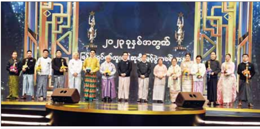
နိုင်ငံတော်စီမံအုပ်ချုပ်ရေးကောင်စီ ဒုတိယဥက္ကဋ္ဌ ဒုတိယဝန်ကြီးချုပ် ဒုတိယဗိုလ်ချုပ်မှူးကြီး စိုးဝင်းနှင့် ဇနီး ဒေါ်သန်းသန်းနွယ် ၂၀၂၃ ခုနှစ်အတွက် မြန်မာ့ရုပ်ရှင်ထူးချွန်ဆုချီးမြှင့်ပွဲအခမ်းအနားတွင် ဖေဖော်ဝါရီ ၃၊ ၂၀၂၄

နေပြည်တော် ဖေဖော်ဝါရီ ၃ ၂၀၂၃ ခုနှစ်အတွက် မြန်မာ့ရုပ်ရှင် ထူးချွန်ဆုချီးမြှင့်ပွဲ အခမ်းအနားကို ယနေ့ ညနေပိုင်းတွင် နေပြည်တော်ရှိ မြန်မာ့အပြည်ပြည်ဆိုင်ရာ ကွန်ဗင်းရှင်းဗဟိုဌာန - ၁ (MICC-1)၌ ကျင်းပရာ နိုင်ငံတော်စီမံအုပ်ချုပ်ရေးကောင်စီ ဒုတိယဥက္ကဋ္ဌ ဒုတိယဝန်ကြီးချုပ် ဒုတိယဗိုလ်ချုပ်မှူးကြီး စိုးဝင်း တက်ရောက်ချီးမြှင့်ပြီး အမှာစကားပြောကြားသည်။ အခမ်းအနားသို့ နိုင်ငံတော်စီမံအုပ်ချုပ်ရေးကောင်စီ ဒုတိယဥက္ကဋ္ဌ ဒုတိယဝန်ကြီးချုပ်၏ ဇနီး ဒေါ်သန်းသန်းနွယ်၊ ကောင်စီအဖွဲ့ဝင်များနှင့် ဇနီးများ၊ ပြည်ထောင်စုအဆင့် ပုဂ္ဂိုလ်များနှင့် ဇနီးများ၊ ပြည်ထောင်စုဝန်ကြီးများနှင့် ဇနီးများ၊ နေပြည်တော်ကောင်စီ ဥက္ကဋ္ဌနှင့် ဇနီး၊ စာမျက်နှာ ၆ ကော်လံ ၁ ❖