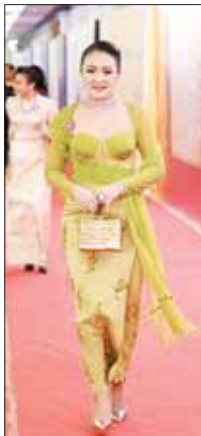
သရုပ်ဆောင် ဝိုင်းစုခိုင်သိန်း