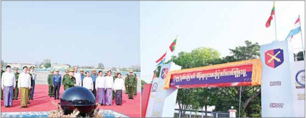
နိုင်ငံတော်စစ်အုပ်ချုပ်ရေးကောင်စီဥက္ကဋ္ဌ တပ်မတော်ကာကွယ်ရေးဦးစီးချုပ် ဗိုလ်ချုပ်မှူးကြီး မင်းအောင်လှိုင် (၇၇)နှစ်မြောက် စိန်ရတုအမြောက်တပ်ဖွဲ့နေ့အထိမ်းအမှတ်ဆိုင်ခဲးဘုတ်ကို စက်လှေတံနှိပ်ဖွင့်လှစ်ပေးစဉ်။

* ရွှေဖွဲ့မှု ဦးစွာ နိုင်ငံတော်စစ်အုပ်ချုပ်ရေးကောင်စီဥက္ကဋ္ဌ တပ်မတော်ကာကွယ်ရေး ဦးစီးချုပ်သည် အခမ်းအနားကျင်းပမည့်နေရာသို့ ရောက်ရှိရာ တာဝန်ရှိသူများက ကြိုဆိုနှုတ်ဆက်ကြသည်။ ဖဲကြိုးဖြတ်ဖွင့်လှစ်ပေး ထို့နောက် အခမ်းအနားအစီအစဉ် ပထမပိုင်းအဖြစ် စစ်ရေးချုပ် ဒုတိယဗိုလ်ချုပ်ကြီး ဦးမင်းဦး၊ တိုင်းမှူး ဗိုလ်ချုပ် စောသန်းလှိုင်နှင့် အမြောက်တပ်ဖွဲ့ ညွှန်ကြားရေးမှူး ဗိုလ်ချုပ်သက်အောင်တို့က (၇၇) နှစ်မြောက် စိန်ရတုအမြောက်တပ်ဖွဲ့ နေ့အခမ်းအနားကို ဖဲကြိုးဖြတ်ဖွင့်လှစ်ပေးကြသည်။ ယင်းနောက် နိုင်ငံတော်စစ်အုပ်ချုပ်ရေးကောင်စီဥက္ကဋ္ဌ တပ်မတော်ကာကွယ်ရေးဦးစီးချုပ်က (၇၇)နှစ်မြောက် စိန်ရတုအမြောက်တပ်ဖွဲ့နေ့ အထိမ်းအမှတ် ဆိုင်ခဲးဘုတ်ကို စက်လှေတံနှိပ်ဖွင့်လှစ်ပေးပြီး တက်ရောက်လာကြသူများနှင့်အတူ စုပေါင်းမှတ်တမ်းတင်ဓာတ်ပုံရိုက်ကြသည်။ ထို့နောက် အခမ်းအနားအစီအစဉ် ဒုတိယပိုင်းကို ဆင်ဖြူရှင်ခန်းမတွင်း၌ ဆက်လက်ကျင်းပပြုလုပ်ရာ နိုင်ငံတော်စစ်အုပ်ချုပ်ရေးကောင်စီဥက္ကဋ္ဌ တပ်မတော်ကာကွယ်ရေးဦးစီးချုပ်နှင့် အခမ်းအနားတက်ရောက်လာကြသူများသည် (၇၇)နှစ်မြောက် စိန်ရတုအမြောက်တပ်ဖွဲ့နေ့ ဂုဏ်ပြုသီချင်းဖြစ်သည့် "စိန်ရတုမှသည် ရတုအဆက်ဆက်ချီ" သီချင်းဖြင့် ဖျော်ဖြေတင်ဆက်မှုကို ကြည့်ရှုအားပေးကြသည်။ ဂုဏ်ပြုအမှာစကားပြောကြားဆက်လက်၍ နိုင်ငံတော်စစ်အုပ်ချုပ်ရေးကောင်စီဥက္ကဋ္ဌ တပ်မတော်ကာကွယ်ရေး ဦးစီးချုပ်က (၇၇)နှစ်မြောက် စိန်ရတုအမြောက်တပ်ဖွဲ့နေ့ အထိမ်းအမှတ်ဂုဏ်ပြု