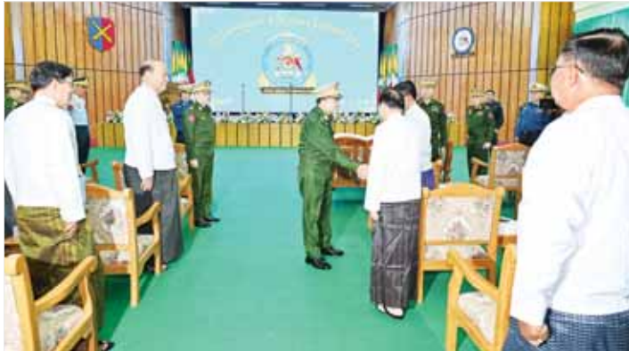
နိုင်ငံတော်စီမံအုပ်ချုပ်ရေးကောင်စီဥက္ကဋ္ဌ တပ်မတော်ကာကွယ်ရေးဦးစီးချုပ် ဗိုလ်ချုပ်မှူးကြီး မင်းအောင်လှိုင် အခမ်းအနားတက်ရောက် လာကြသည့် အငြိမ်းစားဆက်သွယ်ရေး အမြောက်တပ်ဖွဲ့ ဝင် အရာရှိကြီးများအား ရင်းရင်းနှီးနှီး နှုတ်ဆက်စဉ်။

အရာရှိ၊ စစ်သည်များကို ပိုမိုသိရှိ နားလည်အောင် သင်တန်းများ ဖွင့်လှစ်ပြီး ပြန်လည်သင်ကြား လေ့ကျင့်ပေးလျက်ရှိကြောင်း။ လေ့ကျင့်ရေးပိုင်းတွင်လည်း တပ်မတော်တွင် ပြုလုပ်ခဲ့သည့် တပ်မတော် (ကြည်း၊ ရေ လေ) ပူးပေါင်းစစ်ဆင်ရေးများ၊ (ကြည်း၊ လေ၊ အမြောက်၊ သံချပ်ကာ) ပူးပေါင်းစစ်ဆင်ရေး လေ့ကျင့်ခန်း များတွင်လည်း အခြားတပ်ဖွဲ့များ နှင့်အတူ ပူးပေါင်းပါဝင်လေ့ကျင့် ဆောင်ရွက်နိုင်ခဲ့ပြီး အမြောက် တပ်ဖွဲ့၏ အဓိကဆောင်ရွက်ရမည့် တာဝန်များကို အောင်မြင်အောင် လေ့ကျင့်နိုင်ခဲ့သည်ကို တွေ့ရ ကြောင်း။ ဝင်ကြားထည့်ဝါစွာရပ်တည်နိုင် မြန်မာ့လွတ်လပ်ရေးနှင့်အတူ ပေါ်ပေါက်လာခဲ့သည့် အမြောက် တပ်ဖွဲ့သည် နိုင်ငံတော်၏ လွတ်လပ်ရေးနှင့် အချုပ်အခြာ အာဏာကို ပိုင်ခံကန့်ကာကွယ်ရင်း ယနေ့တွင် နိုင်ငံတကာနှင့် ရင်ပေါင်တန်းနိုင်သည့် ခေတ်မီ အမြောက်တပ်ဖွဲ့ တစ်ခုအဖြစ် ဝင်ကြားထည့်ဝါစွာ ရပ်တည်နိုင် ခဲ့ပြီဖြစ်ကြောင်း၊ ထို့ကြောင့် စွမ်းရည်ရှိသည့်တပ်၊ စွမ်းအားရှိ သည့်တပ်၊ နိုင်ငံတော်ကာကွယ် ရေးအတွက် အားထားရသည့် လက်ရုံးတပ် အမြဲတမ်းဖြစ်နေစေ ရေးတပ်ဖွဲ့ဝင်အားလုံးက အားသွန် ခွန်ရှိကြပြီးပမ်းကြရန် မှာကြား လျှံကြောင်း။ အမြောက်တပ်ဖွဲ့မှ အရာရှိ၊ စစ်သည်များအနေဖြင့် နိုင်ငံတော် နှင့် တပ်မတော်က ဖေးအပ်လာ သည့်တာဝန်များအပေါ် ဦးလည် မသွန် ထမ်းရွက်နိုင်ကြသည်ကို လည်း (၇၇)နှစ်တာ ခရီးတွင် စာမျက်နှာ ၅ သို့