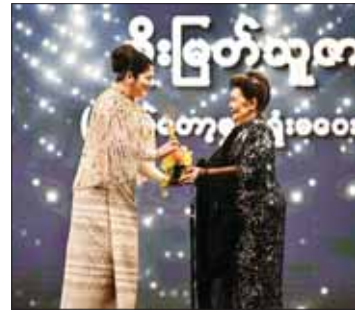
အကောင်းဆုံးအမျိုးသမီးဇာတ်ဆောင်ဆုရ အကယ်ဒမီများရှင် စိုးမြတ်သူစာ အကယ်ဒမီရွှေစင်ရုပ်တု လက်ခံယူစဉ်။