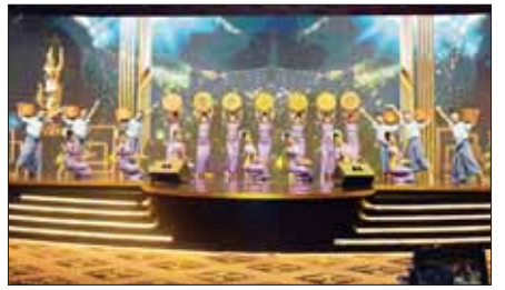
မြန်မာ့ရုပ်ရှင်ထူးချွန်ဆုဖျော်ဖြေပွဲအခမ်းအနားတွင် ဖျော်ဖြေတင်ဆက်မှုကို တွေ့ရစဉ်။

သည် ရွှေကြိုမောင်/မယ်များကို တစ်ဦးချင်း မိတ်ဆက်ပေးသည်။ ထို့နောက် ၂၀၂၃ ခုနှစ်အတွက် မြန်မာ့ရုပ်ရှင်ထူးချွန်ဆုချီးမြှင့်ပွဲ အခမ်းအနားသို့ တက်ရောက်လာကြသည့် အနုပညာရှင်များထံမှ ရွေးချယ်ပေးအပ်သော အကောင်းဆုံး ဝတ်စားဆင်ယင်မှုဆုများ (Myanmar Academy Fashion Awards) ကို ပေးအပ်ချီးမြှင့်ရာ အကောင်းဆုံး အမျိုးသားဝတ်စားဆင်ယင်မှု အကြီးတန်းဆုကို အကယ်ဒမီခန့်စည်သူ၊ အကောင်းဆုံး အမျိုးသမီး ဝတ်စားဆင်ယင်မှု