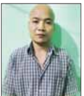
ဥှားသောဘောနီ(ခ)သာကော့ဇော်