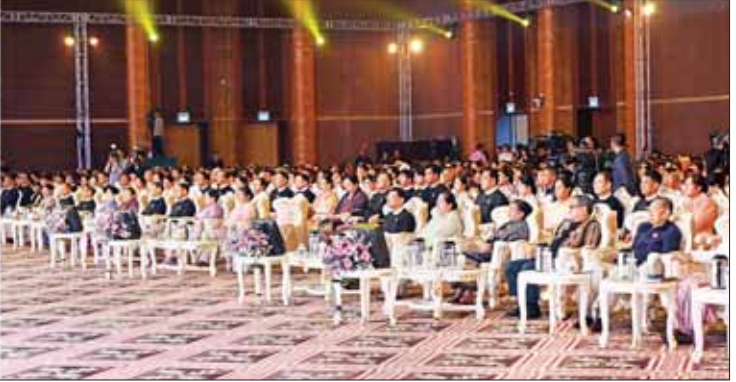
နိုင်ငံတော်စီမံအုပ်ချုပ်ရေးကောင်စီ ဒုတိယဥက္ကဋ္ဌ ဒုတိယဝန်ကြီးချုပ် ဒုတိယဗိုလ်ချုပ်မှူးကြီး စိုးဝင်း၊ ၂၀၂၃ ခုနှစ်အတွက် မြန်မာ့ရုပ်ရှင်ထူးချွန်ဆု ချီးမြှင့်ပေးအပ်ခြင်းအခမ်းအနားတွင် အမှာစကားပြောကြားစဉ်။

ကျော်မှူးမှ ဦးစီးချုပ်ရုံးမှ အဆင့်မြင့်တပ်မတော် အရာရှိကြီးများနှင့် ဇနီးများ၊ နေပြည်တော် တိုင်း စစ်ဌာနချုပ် တိုင်းမှူးနှင့် ဇနီး၊ ဒုတိယဝန်ကြီးများ၊ မြန်မာနိုင်ငံ ရုပ်ရှင်အစည်းအရုံး နာယကများ၊ ဥက္ကဋ္ဌနှင့်အဖွဲ့ဝင်များ၊ မြန်မာနိုင်ငံ သတင်းမီဒီယာကောင်စီ ဥက္ကဋ္ဌ၊ မြန်မာနိုင်ငံသတင်း၊ ဂီတအစည်းအရုံး၊ ဥက္ကဋ္ဌများနှင့်အဖွဲ့ဝင်များ၊ မြန်မာ့ရုပ်ရှင်ထူးချွန်ဆု စီစစ်အကဲဖြတ်ရေးအဖွဲ့ အဖွဲ့ဝင်များ၊ ရုပ်ရှင် စာပေ သဘာဝ၊ ဂီတနယ်ပယ်အသင်းသီးမှ အသိပညာရှင်၊ အတတ်ပညာရှင်များနှင့် အနုပညာရှင်များ တာဝန်ရှိသူများနှင့် အထူးမိတ်ကြားထားသည့် ဧည့်သည်တော်များ တက်ရောက်ကြသည်။