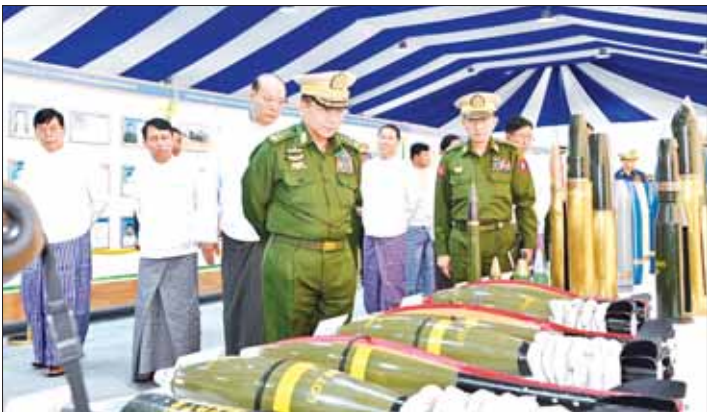
နိုင်ငံတော်စီမံအုပ်ချုပ်ရေးကောင်စီဥက္ကဋ္ဌ တပ်မတော်ကာကွယ်ရေးဦးစီးချုပ် ဗိုလ်ချုပ်မှူးကြီး မင်းအောင်လှိုင် (၇၇)နှစ်မြောက် စိန်ရတု အမြောက်တပ်ဖွဲ့ နေ့ အခမ်းအမှတ်ပြုခန်းများအတွင်း လှည့်လည်ကြည့်ရှုလေ့လာစဉ်။

များကို ချေမှုန်းရာတွင်လည်း အမြောက်တပ်ဖွဲ့ဝင်များ၏ ပြောင်မြောက်သည့် စွမ်းဆောင်ရည်များကို တွေ့ရှိခဲ့ခြင်းကြောင့် အမြောက်တပ်ဖွဲ့၏ တိုးတက်မှုကို ဂုဏ်ယူအသိ အမှတ်ပြုသည်ကို ပြောကြား လျှံကြောင်း။ အမြောက်တပ်ဖွဲ့ အနေဖြင့် နိုင်ငံတကာနှင့် ရင်ပေါင်တန်းနိုင် ရန် ခေတ်မီအမြောက်လက်နက် များ၊ ခဲယမ်းများနှင့် အမြောက် တပ်ဖွဲ့သုံးကိရိယာများကို တပ်ဆင် ပေးနေသကဲ့သို့ ကျွမ်းကျင်ပိုင်နိုင် စွာ အသုံးပြုနိုင်စေရေးအတွက် ပြည်ပနိုင်ငံများကို ပညာတော် သင်များ စေလွှတ်ပေးခြင်းတို့ လည်း ဆောင်ရွက်လျက်ရှိပါ ကြောင်း၊ ပြည်ပမှ လေ့လာသင်ယူ ခဲ့သည့်ပညာရှင်များကို မိမိတို့တွင် ရှိပြီး အမြောက်ပညာရှင်များနှင့် ပေါင်းစပ်ပြီး အမြောက်တပ်ဖွဲ့မှ