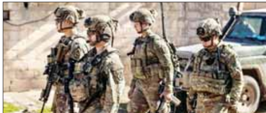
ဆီးရီးယားနိုင်ငံ တယ်လ်ဟာမစ်မြို့တွင် ကင်းလှည့်နေသည့် အမေရိကန်တပ်ဖွဲ့ဝင်များကို စစ်နဂါရီ ၂၄ ရက်က တွေ့ရစဉ်။

အမေရိကန် ဗဟိုကွပ်ကဲရေးဌာနက ပြောသည်။ ပြည်သူ့စစ် အုပ်စုများ၏ စစ်ဆင်ရေးကွပ်ကဲသည့် နေရာများနှင့် ယိုးဒယားနိုင်ငံရှိ နေရာများကို ပစ်မှတ်ထားကာ တိုက်ခိုက်ခဲ့ခြင်းဖြစ်ပြီး ချီးကျူးမှုနှင့် ဒုက္ခရောက်အောင် တိုက်ခိုက်ခဲ့သည်ဟု သိရသည်။ ဖြီးခဲ့သည့် တနင်္ဂနွေနေ့က ကျော်ဒီအီအီအီရန် အမေရိကန် စစ်ဆေးရေး ဝန်ထမ်းများဖြင့် တိုက်ခိုက်မှုကြောင့် အမေရိကန် တပ်ဖွဲ့ဝင် သုံးဦးသေဆုံးသွားခဲ့ပြီး ယင်းဖြစ်ရပ်ကို လက်တွေ့မြင်ခဲ့သည့် အမေရိကန် ယခုကဲ့သို့ မြန်လည်