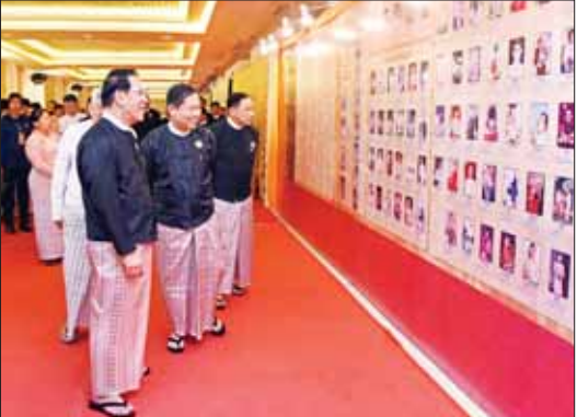
နိုင်ငံတော်စီမံအုပ်ချုပ်ရေးကောင်စီ ဒုတိယဥက္ကဋ္ဌ ဒုတိယဝန်ကြီးချုပ် ဒုတိယဗိုလ်ချုပ်မှူးကြီး စိုးဝင်း၊ ၂၀၂၃ ခုနှစ်အထိ မြန်မာ့ရုပ်ရှင်ထူးချွန်ဆု ရရှိသူများ၊ ထူးချွန်ဆုရဇာတ်ကားများ၊ ထူးချွန်ဆုရ အနုပညာရှင်များနှင့် အတတ်ပညာရှင်များ၏ မှတ်တမ်းဓာတ်ပုံများကို ကြည့်ရှုစဉ်။

အခမ်းအနား မစတင်မီ Group မှ အနုပညာရှင်များက တေးသံရှည်များနှင့် အနုပညာရှင်များက တေးသံသံများဖြင့် ဖျော်ဖြေတင်ဆက်ကြသည်။ ဦးစွာ နိုင်ငံတော်စီမံအုပ်ချုပ်ရေးကောင်စီ ဒုတိယဥက္ကဋ္ဌ ဒုတိယ