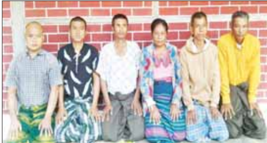
၂၀၂၄ ခုနှစ် ဖေဖော်ဝါရီ ၂ ရက်တွင် ပဲခူးမြို့နယ် ကမာနတ်ကျေးရွာ အနီး ပဲခူး-သနပိုင်လမ်းဆုံတွင် တရားခံ ခြောက်ဦးနှင့်အတူ ဖမ်းဆီးရမိသည့် KIA ထုတ် ရှော့တိုက်ခန်း ၁၀ လုံး၏ မှတ်တမ်းဓာတ်ပုံ။

အကြမ်းဖက် အုပ်စုအဖြစ် ကြေညာထားသော NUG လက်အောက်ခံ Dark Side Revolution Burma-DSRB အမည်ခံ အကြမ်းဖက်အဖွဲ့သည် အများပြည်သူများ ပျော်ရွှင်စွာ