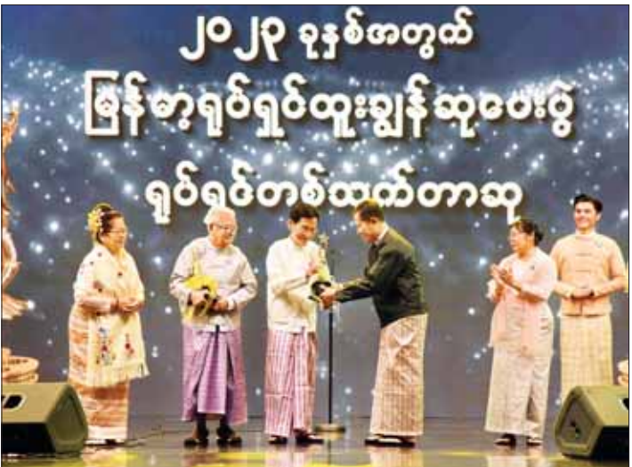
နိုင်ငံတော်စီမံအုပ်ချုပ်ရေးကောင်စီ ဒုတိယဥက္ကဋ္ဌ ဒုတိယဝန်ကြီးချုပ် ဒုတိယဗိုလ်ချုပ်မှူးကြီး စိုးဝင်း၊ ရုပ်ရှင်တစ်သက်တာထူးချွန်ဆုရအကယ်ဒမီ ဒါရိုက်တာပန်းချီစိုးမိုးကို ဆုပေးအပ်ချီးမြှင့်စဉ်။

မိုးခါးမုန်တိုင်းကြောင့် ထိခိုက်ခဲ့ရသည့် ဒေသခံတိုင်းရင်းသားပြည်သူများကို ရုပ်ရှင် ဂီတ၊ သဘင်၊ ဟာသပညာရှင် အစည်းအရုံးများမှ အနုပညာရှင်များ ဧပေါင်းပြီး တတ်နိုင်သမျှထောက်ပံ့ကူညီပေးခဲ့ခြင်း။ ကိုယ်တိုင် ကိုယ်ကျ သွားရောက်အားပေးဆောင်ရွက်ခဲ့ခြင်းများ၊ ရန်ပုံငွေ ရရှိရေးအတွက် ပဒေသာကပ္ပ၊ နားလည်သည့် အနုပညာနှင့် တာဝန်ကျေပွန်စွာ ဆောင်ရွက်ပေးနိုင်ခဲ့ပြီဟုလည်း ထပ်လောင်းပြောကြားလိုပါကြောင်း။