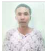
အောင်ခိုင်မျိုး