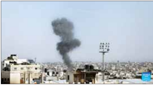
ဂါဗာ ဖေဖော်ဝါရီ ၃ ရက်တွင် ဝန်ကြီးဌာန၏ ပြောရေးဆိုခွင့်ရှိသူ အရာရှိက အယ်ဒါဂါဗာ ထုတ်ပြန်ချက်တွင် ပြောကြားသည်။ ထို့ပြင်

လွန်ခဲ့သည့် ၂၄ နာရီအတွင်း အစုရေတပ်ဖွဲ့၏ တိုက်ခိုက်မှုကြောင့် ပါလက်စတိုင်း ၁၀၇ ဦး သေဆုံးပြီး ၁၆၅ ဦး ဒဏ်ရာရရှိကြောင်း အယ်-တိုဒါက ထုတ်ပြန်ထားသည်။ ဖေဖော်ဝါရီ ၃ ရက်အစောပိုင်းတွင် ဒီရာ အယ်-ဘာလာနှင့် ရာဇာမြို့တို့ကို အစုရေက လေကြောင်းတိုက်ခိုက်မှုများ အမြောက်များဖြင့် ဝင်ကြမ်းမှုများ ၂၅၂၃ ခုနှစ် အောက်တိုဘာ ၇ ရက်မှ စတင် အမျိုးသမီးများ အပါအဝင် ပါလက်စတိုင်း ၂၄ ဦးထက်မနည်း သေဆုံးကြောင်း တရားဝင်ပါလက်စတိုင်းသတင်းအချက်အလက်အစုအဖွဲ့က ဖော်ပြထားသည်။ ဆင်ဟွာ