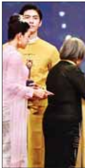
အကယ်ဒမီဆုများရှင် ဆွေဇင်ထိုက် အကောင်းဆုံးအမျိုးသား ဝတ်စားဆင်ယင်မှုဆုရ အံ့ဇော်အား ဆုပေးအပ်ချီးမြှင့်စဉ်။

ရေး အသိ၊ အမျိုးသားရေး သတိရှိနေကြရန် လိုအပ်ပါကြောင်း။