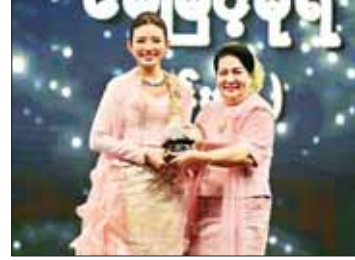
အကောင်းဆုံးအမျိုးသမီးဇာတ်ပို့ဆုရ မေမြင့်စိုရ အကယ်ဒမီရွှေစင်ရုပ်တု လက်ခံယူစဉ်။