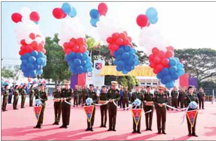
စစ်ရေးချုပ် ဒုတိယဗိုလ်ချုပ်ကြီး ဦးမင်းဦး၊ တိုင်းမှူး ဗိုလ်ချုပ် စောသန်းလှိုင်နှင့် အမြောက်တပ်ဖွဲ့ ညွှန်ကြားရေးမှူး ဗိုလ်ချုပ် သက်အောင် (၇၇) နှစ်မြောက် စိန်ရတုအမြောက်တပ်ဖွဲ့နေ့အခမ်းအနားကို ဖဲကြိုးဖြတ်ဖွင့်လှစ်ပေးကြစဉ်။

အမြောက်တပ်ဖွဲ့၏ သေ့အဖြစ် သတ်မှတ်ခဲ့ခြင်းဖြစ်ခြင်းကြောင့် ယနေ့ဆိုပါက (၇၇)နှစ်ဆိုသည့် စိန်ရတုကာလကို ရောက်ရှိခဲ့ပြီဖြစ်ကြောင်း၊ အမြောက်တပ်ဖွဲ့ အနေဖြင့် စတင်ဖွဲ့စည်းစဉ်ကတည်းက အမိန့်နာခံပြီး စစ်စဉ်ကမ်းကောင်းမှုနှင့် အစဉ်အလာကောင်းများ ပိုင်ဆိုင်ထားသည့် အဖွဲ့အစည်း တစ်ခုအဖြစ် တွေ့မြင်ရမည်ဖြစ်ပြီး ပေးအပ်သည့် အမိန့်အတိုင်း သုံးရက်အတွင်း ဖွဲ့စည်းပြင်ဆင်ကာ သမိုင်းဝင်အင်္ဂါစိန် တိုက်ပွဲတွင် ထူးချွန်ပြောင်မြောက်ရာ ပစ်ကူပေး တိုက်ပွဲဝင်နိုင်ခဲ့သည်ကို ဂုဏ်ယူဖွယ်ရာ တွေ့ရှိရမည်ဖြစ်ကြောင်း။