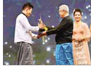
အကောင်းဆုံးရုပ်ရှင်ဇာတ်ညွှန်းဆုရ အကယ်ဒမီ ဒါရိုက်တာ ညိုဖင်းလွင် အကယ်ဒမီရွှေစင်ရုပ်တု လက်ခံယူစဉ်။