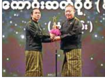
အကောင်းဆုံးရုပ်ရှင်တေးဂီတဆုရ ကောင်းစိတ်ပိုင် (ဂီတမြို့) အကယ်ဒမီရွှေစင်ရုပ်တု လက်ခံယူစဉ်။