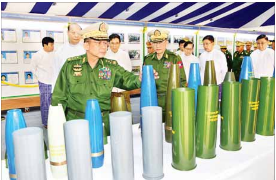
နိုင်ငံတော်စီမံအုပ်ချုပ်ရေးကောင်စီဥက္ကဋ္ဌ တပ်မတော်ကာကွယ်ရေးဦးစီးချုပ် ဝိုင်းလှိုင်အောင် (၇၅)နှစ်မြောက် စိန်ရတုအမြောက်တပ်ဖွဲ့နေ့ အထိမ်းအမှတ်ပြခန်းများအတွင်း လှည့်လည်ကြည့်ရှုလေ့လာစဉ်။

နေပြည်တော် ဖေဖော်ဝါရီ ၃ (၇၅)နှစ်မြောက် စိန်ရတုအမြောက်တပ်ဖွဲ့နေ့ အခမ်းအနားကို ယနေ့နံနက်ပိုင်းတွင် နေပြည်တော်၊ စစ်ကြောရေးနှင့် တည်ဆဲရေးစခန်းရှိ ဆင်ဖြူရဲခန်းမ၌ ကျင်းပပြုလုပ်ရာ နိုင်ငံတော်စီမံအုပ်ချုပ်ရေးကောင်စီဥက္ကဋ္ဌ တပ်မတော်ကာကွယ်ရေး ဦးစီးချုပ် ဝိုင်းလှိုင်အောင်နှင့် တပ်မတော်ကာကွယ်ရေးဦးစီးချုပ်(ရေ) ဝိုင်းလှိုင်အောင်တို့ ပါဝင်တက်ရောက် ချီးမြှင့်သည်။ အဆိုပါ (၇၅) နှစ်မြောက် စိန်ရတု အမြောက်တပ်ဖွဲ့နေ့ အခမ်းအနားသို့ နိုင်ငံတော်စီမံအုပ်ချုပ်ရေးကောင်စီဥက္ကဋ္ဌ တပ်မတော်ကာကွယ်ရေးဦးစီးချုပ်နှင့် အတွဲ ကာကွယ်ရေးဦးစီးချုပ်(ရေ) ဒုတိယဗိုလ်ချုပ်ကြီး ဇွဲဝင်းမြင့်၊ ကာကွယ်ရေးဦးစီးချုပ် (လေ) ဗိုလ်ချုပ်ကြီး ထွန်းအောင်၊ ကာကွယ်ရေးဦးစီးချုပ်ရုံးမှ အဆင့်မြင့် တပ်မတော်အရာရှိကြီးများ၊ ပြည်ထောင်စုအဆင့်ပုဂ္ဂိုလ်များ၊ နေပြည်တော်တိုင်း စစ်ဌာနချုပ်တိုင်းမှူး၊ အငြိမ်းစားအမြောက်တပ်ဖွဲ့ဝင်အရာရှိကြီးများ၊ တာဝန်ရှိသူများနှင့် ဖိတ်ကြားထားသူများ တက်ရောက်ကြသည်။ စာမျက်နှာ ၃ ကော်လံ ၁ *