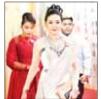
သရုပ်ဆောင် မြူးလေး