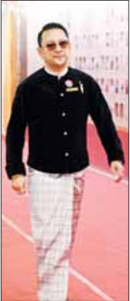
သရုပ်ဆောင် အကယ်ဒမီ ခန့်စည်သူ