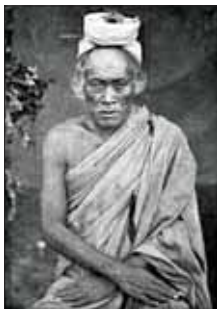
ဗိုလ်ဆွန်ပက်(ခေါ်) ဗိုလ်ကြွန့်ဘိ