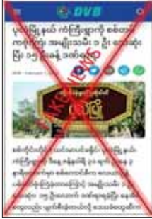
PDF အမည်ခံ အကြမ်းဖက်သောင်းကျန်းသူများသည် စစ်ကိုင်းတိုင်းဒေသကြီးအတွင်းရှိ ကျေးရွာများကို အဓိကထား၍ အကြမ်းဖက်လုပ်ကြံမှုများကို လုပ်ဆောင်လျက်ရှိပြီး နေအိမ်များကို မီးရှို့ဖျက်ဆီးခြင်း၊ Drone များဖြင့် ပုံးကြဲခြင်း၊ လက်လုပ်ပုံးသီး၊ လက်လုပ်စိန်ပြောင်းများဖြင့် ကျေးရွာများအတွင်း ပစ်ခတ်ခြင်းများကြောင့် ပြည်သူများသေဆုံးခြင်း၊ ထိခိုက်ဒဏ်ရာရရှိခြင်းများနှင့် နေအိမ်များမီးလောင်ခိုင်းဆုံးရှုံးမှုများ ဖြစ်ပွားလျက်ရှိသည်။

နေပြည်တော် ဖေဖော်ဝါရီ ၁ - စစ်ကိုင်းတိုင်းဒေသကြီး ပုလဲမြို့နယ် ကံကြီးရွာကို ဇန်နဝါရီ ၃၁ ရက်က တပ်မတော်မှ လေယာဉ်ဖြင့် ပုံးကြဲတိုက်ခိုက်ခဲ့ခြင်းကြောင့် အမျိုးသမီးတစ်ဦး သေဆုံးခဲ့ပြီး ၁၅ ဦးခန့် ထိခိုက်ဒဏ်ရာရရှိခဲ့ကာ နေအိမ်များလည်း ပျက်စီးသွားခဲ့ကြောင်း သတင်းတု၊ သတင်းမှားများကို တရားမဝင်ပြည်ဖျက်မီဒီယာ DVB က လူမှုကွန်ရက်တွင် မဟုတ်မမှန် ရေးသားဖြန့်ဝေနေသည်ကို ဝမ်းနည်းဖွယ်ရာ တွေ့ရှိရသည်။