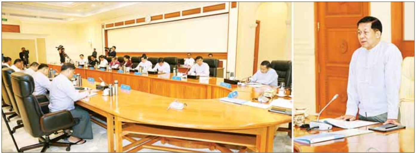
နိုင်ငံတော်စီမံအုပ်ချုပ်ရေးကောင်စီဥက္ကဋ္ဌ နိုင်ငံတော်ဝန်ကြီးချုပ် ဗိုလ်ချုပ်မှူးကြီး မင်းအောင်လှိုင် နိုင်ငံတော်စီမံအုပ်ချုပ်ရေးကောင်စီ အစည်းအဝေး (၁/၂၀၂၄) တွင် အမှာစကား ပြောကြားစဉ်။