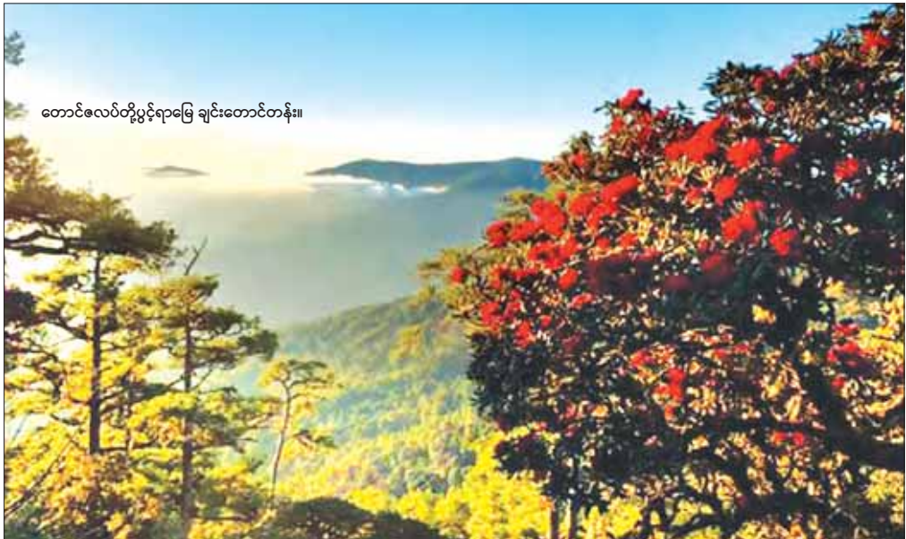
တောင်လေပ်တို့ပွင့်ရာမြေ ချင်းတောင်တန်း။

ဖောင်ကြီးမှာ ကျွန်တော်သင်တန်းတက်ခဲ့ချိန်