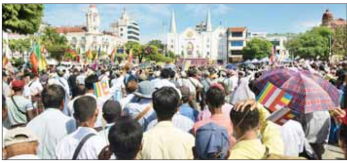
အားစော်ကားဖျက်ဆီးသူ (ဒိုရန်သူ) ဘုရား၊ စေတီ၊ ဆင်းတုတော်များကို ဖျက်ဆီးနေသော ပြည်ဖျက် မိစ္ဆာသောင်းကျန်သူများ (ကျရှုံး ငြိမ်းချမ်းစွာ ဆန္ဒထုတ်ဖော်ကြပါစေ)" စသည့် ကြွေးကြော်သံများ၊ ကြောင်း သတင်းရရှိသည်။ ဆိုင်းဘုတ်များ ကိုင်ဆောင်၍ သတင်းစဉ်

အကြမ်းဖက်အားပေး လောက်ကောင်မှန်သမျှ (ဆန့်ကျင်ကြ)၊ ဗုဒ္ဓသာသနာကို ဖျက်ဆီးစော်ကားနေသည့် အကြမ်းဖက်သမားများ (အလိုမရှိ)၊ ဒို့ဘာသာကို စော်ကားနေသည့် သာသနာဖျက်လောက်ကောင်များ (အလိုမရှိ)၊ သာသနာဖျက် အကြမ်းဖက်များအား အမြစ်ဖြတ်သုတ်သင်ရေး (ဒို့အရေး)၊ လူသတ်အကြမ်းဖက်မှန်သမျှ (ဆန့်ကျင်ကြ)၊ မြန်မာနိုင်ငံသား ဗုဒ္ဓဘာသာဝင်တိုင်းရင်းသားများ ကိုးကွယ်ယုံကြည်သည့် ဘုရား၊ စေတီ၊ ဆင်းတုတော်များကို ဖျက်ဆီးနေသော ပြည်ဖျက်