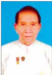
ဦးဝမ်းကိုဟော