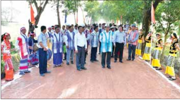
ကရင်ပြည်နယ်ဝန်ကြီးချုပ် ဦးစောမြင့်ဦးနှင့် တာဝန်ရှိသူများ ထောင်ဝိကွင်း ကုန်ထုတ်လမ်းအား ကြည့်ရှုစစ်ဆေးစဉ်။

ဘားအံ ဖေဖော်ဝါရီ ၁ ဘားအံမြို့နယ် ကျေးလက်ဒေသ ဖွံ့ဖြိုးတိုးတက်ရေး ဦးစီးဌာန၏ ၂၀၂၃-၂၀၂၄ ဘဏ္ဍာနှစ် ပြည်နယ် အစိုးရအဖွဲ့ရန်ပုံငွေဖြင့် တင်ဒါအောင်ကုမ္ပဏီက တာဝန်ယူဆောင်ရွက်သော ဘားအံမြို့ အမှတ်(၈) ရပ်ကွက် ထောင်ဝိကွင်း အမှတ် (၁၁၈၄) ကုန်ထုတ်လမ်းဖွင့်ပွဲကို ဇန်နဝါရီ ၃၁ ရက်က ကျင်းပသည်။ ကုန်ထုတ်လမ်းဖွင့်ပွဲတွင် ကရင်ပြည်နယ်ဝန်ကြီးချုပ် ဦးစောမြင့်ဦးက ထောင်ဝိကွင်း ကုန်ထုတ်လမ်းကို ကရင်ပြည်နယ် အစိုးရအဖွဲ့နှင့် ကျေးလက်ဒေသဖွံ့ဖြိုးတိုးတက်ရေး ဦးစီးဌာနက အကောင်အထည်ဖော်ဆောင်ရွက်ပေးခြင်းဖြစ်ကြောင်း၊ ပြည်သူများအနေဖြင့် ဆောင်ရွက်ပေးရန် လိုအပ်သည့် ဖွံ့ဖြိုးရေးလုပ်ငန်းများကို ပေါင်းစပ်တင်ပြခြင်းဖြင့် မိမိဒေသဖွံ့ဖြိုးအောင်၊ ခေတ်မီသည့် စံပြုကျေးရွာများဖြစ်အောင် ဆောင်ရွက်သွားကြစေလိုကြောင်း ပြောကြားသည်။ ထို့နောက် ပြည်နယ်ကျေးလက်ဒေသဖွံ့ဖြိုးတိုးတက်ရေးဦးစီးဌာန