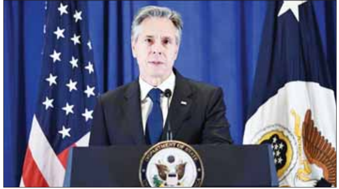
အမေရိကန်နိုင်ငံခြားရေးဝန်ကြီး အန်တိုနီဘလင်ကန်။

သွားဖွယ်ရှိသည်။ နောက်ထပ်ဆွေးနွေးရမည့် အကြောင်းအရာတစ်ခုမှာ ဇန်နဝါရီလနှောင်းပိုင်းအတွင်း ကျော်ဒန်ရို အမေရိကန်စစ်ဓနန်းတစ်ခု တိုက်ခိုက်ခံရကာ အမေရိကန်တပ်ဖွဲ့ဝင်များ သေဆုံးစေသည့်အကြောင်းအရာပင်ဖြစ်သည်။ ပင်လယ်နီတွင် ယီမင်အစိုးရဆန့်ကျင်ရေးသူပုန်များဖြစ်သည့် ဟူဒီတို့က ကုန်တင်သင်္ဘောကြီးများကို အကြိမ်ကြိမ်တိုက်ခိုက်မှုပြုလုပ်ခဲ့ရာ ဒေသတွင်း တင်းမာမှုများဖြစ်ပွားစေရေး ဘလင်ကန်က အခြားသောနိုင်ငံများကို တိုက်တွန်းသွားမည်ဖြစ်သည်။ ပြီးခဲ့သည့်နှစ် အောက်တိုဘာလအတွင်း အစွဲရေးနှင့် ဟားမားစ်တိုက်ပွဲများ စတင်ဖြစ်ပွားသည့် အချိန်မှစတင်ကာ အမေရိကန်နိုင်ငံခြားရေးဝန်ကြီး အနေဖြင့် အရှေ့အလယ်ပိုင်းဒေသသို့ ငါးကြိမ်မြောက် ခရီးသွားခြင်းလည်း ဖြစ်သည်။ အင်န်အိတ်ချီက