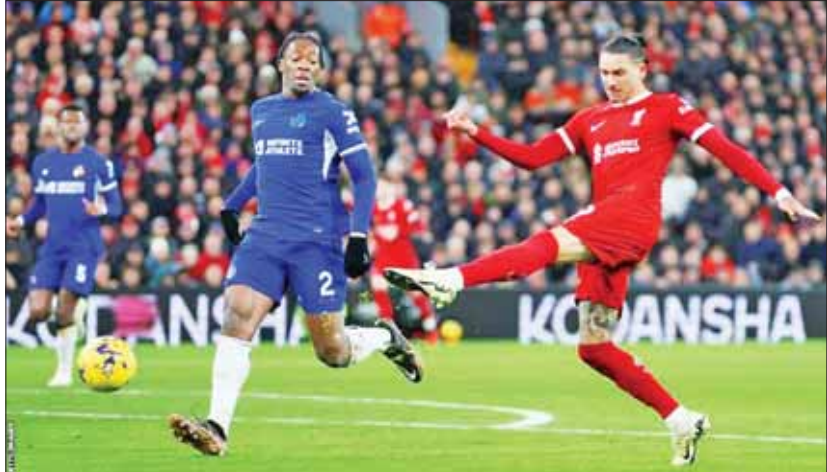
လီဗာပူးအသင်းနှင့် ချယ်ဆီးအသင်းတို့ ယှဉ်ပြိုင်ကစားစဉ်။