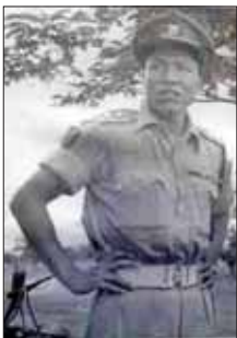
ဗိုလ်ကြီးတိုက်ချွန်း

ကနံနက်စောစော လေ့ကျင့်ခန်းလုပ်ရတဲ့ ကွင်းဘေးမှာရှိနေတဲ့ ထင်းရှူးပင် (ပင်လယ်ကဗွီးပင်ပါ) ကို လေတိုးနေတဲ့အသံကို နားထောင်ပြီး အရသာခံနေမိခဲ့တယ်။ အဲဒီအချိန်မှာ ချင်းတောင်မှာ တာဝန်ကျနေတဲ့ သွားဆရာဝန်လေးက ထင်းရှူးရွက်တွေကို လေတိုးသံတွေသာ နာခံနေရလို့တော့ ချင်းတောင်မှာ ရှားသွားနိုင်တယ်လို့ မှတ်ချက်ပေးတယ်။ နက်နက်တေးကြည့်ရင် ပညာတတ်လူငယ်လေးတွေအတွက် ချင်းတောင်မှာ ဘဝရည်မှန်းချက်တွေ ရှာဖွေရခက်လှတာကိုလည်း သဘောပေါက်မိစရာပါပဲ။