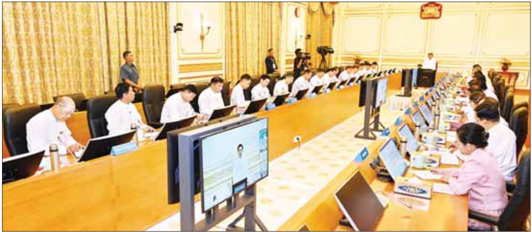
နိုင်ငံတော်စီမံအုပ်ချုပ်ရေးကောင်စီဥက္ကဋ္ဌ နိုင်ငံတော်ဝန်ကြီးချုပ် ဗိုလ်ချုပ်မှူးကြီး မင်းအောင်လှိုင် ပြည်ထောင်စုအစိုးရအဖွဲ့အစည်းအဝေးအမှတ်စဉ်(၁/၂၀၂၄) တွင် အမှာစကားပြောကြားစဉ်။

နေပြည်တော် ဇန်နဝါရီ ၂၉ အဝေးခန်းမ၌ ကျင်းပရာ နိုင်ငံတော်စီမံအုပ်ချုပ်ရေး အစည်းအဝေးသို့ နိုင်ငံတော်စီမံအုပ်ချုပ်ရေး ကောင်စီဥက္ကဋ္ဌ တိုင်းဒေသကြီးနှင့်ပြည်နယ်ဝန်ကြီး ပြည်ထောင်စုအစိုးရအဖွဲ့အစည်းအဝေး အမှတ် ကောင်စီဥက္ကဋ္ဌ ဒုတိယဝန်ကြီးချုပ် ဒုတိယ ခုတ်(၁/၂၀၂၄)ကို ယနေ့နံနက်ပိုင်းတွင် နေပြည်တော်ရှိ များကြီး မင်းအောင်လှိုင် တက်ရောက်အမှာစကား ဗိုလ်ချုပ်မှူးကြီး ဖိုးဝင်း၊ ပြည်ထောင်စုဝန်ကြီးများနှင့် တာဝန်ရှိသူများ တက်ရောက်ကြပြီး နေပြည်တော် ကြားသည်။