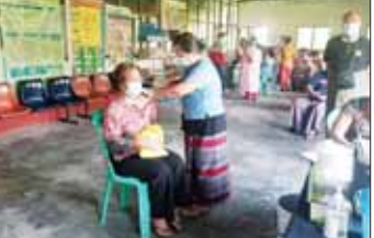
ရန်ကုန်မြို့နှင့် မန္တလေးမြို့အတွက် ရည်ညွှန်းလက်ကားဈေးနှုန်းများနှင့် ပြည်ထောင်စုနယ်မြေ နေပြည်တော်၊ တိုင်းဒေသကြီး/ ပြည်နယ် မြို့တော်များအတွက် ရည်ညွှန်းလက်လီဈေးနှုန်းများ

မရမ်းကုန်း ဇန်နဝါရီ ၂၉ ရက်နေ့တွင် ဒေသကြီး မရမ်းကုန်းမြို့နယ်ရှိ ပြည်သူများ ကိုဗစ်-၁၉ ရောဂါကြိုတင်ကာကွယ်ဆေးထိုးနှံရန်အတွက် ထပ်ဆောင်းကာကွယ်ဆေးများ ထိုးနှံပေးလျက်ရှိရာ ဇန်နဝါရီ ၂၉ ရက် နံနက်ပိုင်းက မရမ်းကုန်းမြို့နယ် ဆေးရုံဝင်းအတွင်းရှိ မြို့နယ်ပြည်သူ့ကျန်းမာရေးဦးစီးဌာန၊ မိခင်နှင့် ကလေးကျန်းမာရေးဌာန အမျိုးသမီးကျန်းမာရေးဆရာမများ ဦးဆောင်သော ကျန်းမာရေးဝန်ထမ်းများက အသက် ၁၈ နှစ်အထက် ၁၄ ဦး၊ အသက် ၅၀ နှစ်အထက် နိုင်ငံ့ဝန်ထမ်း ၄၆ ဦး၊ အသက် ၆၅ နှစ်အထက် ၄၆ ဦး စုစုပေါင်း ၁၀၆ ဦးကို ကိုဗစ်-၁၉ ကာကွယ်ဆေးများ ထိုးနှံပေးခဲ့ကြောင်း သိရသည်။ မျိုးမင်းသိန်း(မရမ်းကုန်း)