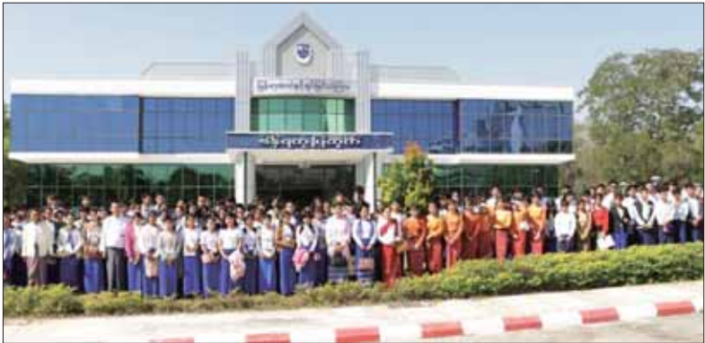
မြန်မာ့အသံနှင့် ရုပ်မြင်သံကြား စီနီရူပာပြတိုက်သို့ ရောက်ရှိလေ့လာစဉ်။

သမဝါယမစာရင်းရေး စာရင်းကိုင် သက်မွေပညာ သင်တန်းကျောင်းများ သားတိုသမီးတို့ မျှော်ကြိုလား။ “ပျော်ပါတယ်” “နောက်တစ်ခေါက်လာချင်သေးလား” “လာချင်ပါတယ်”