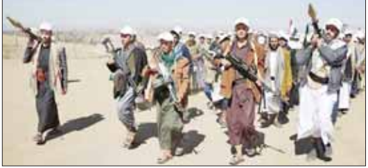
ယီမင်နီ ဟူသီများကို တွေ့ရစဉ်။

ဆာဗား ဇန်နဝါရီ ၂၉ အေဒင်ပင်လယ်ကျွေ့ အမေရိကန် စစ်သင်္ဘော တစ်စင်းကို ခိုးကျွတ် ဖြင့် တိုက်ခိုက်ခဲ့ကြောင်း ယီမင်နီ ဟူသီအုပ်စုက ဇန်နဝါရီ ၂၉ ရက် တွင် ပြောကြားသည်။ ဟူသီအုပ်စုက ဖြစ်တော်ဆား အပါအဝင် ယီမင်နီမြေကပ်ပိုင်း ဒေသအများအပြားကို ထိန်းချုပ် ထားကြောင်း အဆိုပါအဖွဲ့က စူးစမ်းလေ့လာရေး မိန့်တိုင် အခြေခံကို ရေယာဉ်ဖြင့်လည်ပတ် လှူအက်စ် အက်စ် လူးဝစ် ဘီ ပုလလသင်္ဘောကို ပစ်မှတ်ထား တိုက်ခိုက်ခဲ့ကြောင်း သိရသည်။ သွားလာနေသည့် ရေယာဉ်များကို ဆက်လက် တိုက်ခိုက်သွားမည် ဖြစ်ကြောင်း ၎င်းက ပြောသည်။ သင်္ဘောပေါ်၌ နောက်ထပ် တိုက်ခိုက်မှုများကို တားဆီးရန်နှင့် ကမ္ဘာလုံးဆိုင်ရာ ကုန်သွယ်ရေး ကာကွယ်ရန် ရည်ရွယ်ပြီး အမေရိကန်နှင့် ဗြိတိန်တို့က မကြာသေးမီ သီတင်းပတ်များ အတွင်း ဟူသီတို့ တာဠိရိုရာနေရာ များကို လက်တွဲဖြိုခွဲသည့်အစ ဖြင့် လေကြောင်းတိုက်ခိုက်မှု သည်အထိ အစွဲရေသင်္ဘောများ သို့မဟုတ် အစွဲရေသင်္ဘော နှီးတည် သိရသည်။ ဆင်ဟွာ