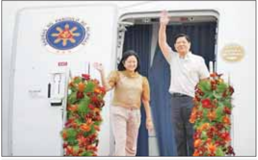
ဖိလစ်ပိုင်သမ္မတနှင့် ၎င်း၏ဇနီး။

မနိုလာ ဇန်နဝါရီ ၂၉ ဖိလစ်ပိုင်သမ္မတ မာဒီနို ရိုမီဒက်စ် မာကိုစ်သည် ဖူးပေါင်းဆောင်ရွက်မှုဖြင့်တင်ရန် နှစ်ရက်ကြာ နိုင်ငံတော်ခရီးစဉ်အဖြစ် ဝီယက်နမ်နိုင်ငံသို့ ဇန်နဝါရီ ၂၉ ရက်က ထွက်ခွာသွားသည်။ ဖိလစ်ပိုင်သမ္မတ မာကိုစ်သည် ကုန်သွယ်ရေး၊ လွှတ်တော်ဥက္ကဋ္ဌနှင့်လည်း ဝေ့ ဆုံရန် ရင်းနှီးမြုပ်နှံမှု ပညာရေးနှင့် ခရီးသွားလာရေးကွင်းဆင်းစဉ်အတွင်း သိရသည်။ သော ဒေသတွင်းနှင့် အပြန်အလှန် စီးပွားရေးလုပ်ငန်းများ ဆိုင်ရာ ဖူးပေါင်းဆောင်ရွက်မှုများကို ဖိလစ်ပိုင်နှင့် ဝီယက်နမ်နိုင်ငံတို့သည် လာမည့် နှစ်အတွင်း အမေရိကန်ဒေါ်လာ ၁၀ ဘီလီယံ အထိ နှစ်နိုင်ငံကုန်သွယ်ရေးဖြင့်တင်ရန် ရည်ရွယ်ထားကြောင်း သိရသည်။ ဝီယက်နမ်နိုင်ငံသည် အာဆီယံဒေသအတွင်း ဖိလစ်ပိုင်နိုင်ငံ၏ တစ်ခုတည်းသော မဟာဗျူဟာမိတ်ဖက်နိုင်ငံဖြစ်ကြောင်း သိရသည်။ ဆင်ဟွာ