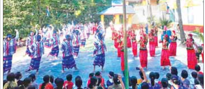
ကျေးဇူးတင်စွာ (ပြန်/ဆက်)

ကရင်သက္ကရာဇ် ၂၇၆၄ ခုနှစ် ပြာသိုလဆန်း ၁ ရက်နေ့၌ ကျရောက်သည့် (၈၆) နှစ်မြောက် ကရင်နှစ်သစ်ကူးပွဲတော်ကို စွန့်ပြည်နယ် ပေါင်မြို့နယ် မုကျိကျေးရွာရှိမုကျိတိုက်ကျောင်းဘုန်းတော်ကြီးကျောင်းတွင် ဇန်နဝါရီ ၁၁ ရက်က ကျင်းပစဉ်။ မွန်မလေး (ပြန်/ဆက်)