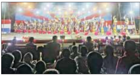
ကရင်ပြည်နယ် လှိုင်းဘွဲ့မြို့နယ် ကွမ်ဘီကျေးရွာ၌ ကရင်သက္ကရာဇ် ၂၇၆၃ ခုနှစ် ပြာသိုလဆန်း ၁ ရက်နေ့တွင် ကျရောက်သည့် ကရင်နှစ်သစ်ကူးနေ့ထူးနေ့ကြိုအခမ်းအနားကို ဇန်နဝါရီ ၁၁ ရက်က ကျင်းပစဉ်။ စောဖိုးခွေး(ပြန်/ဆက်)