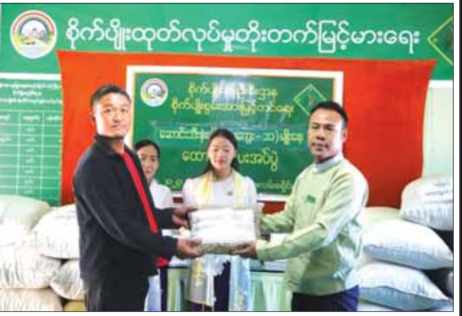
ချင်းပြည်နယ် ဖလမ်းခရိုင် ဖလမ်းမြို့နယ်အတွင်း ၂၀၂၃ ခုနှစ် အောက်တိုဘာ ၂၆ ရက် ဆောင်းသီးနှံ မြေပဲ (မကျေး-၁၁) မျိုးစေ့ ထောက်ပံ့ပေးအပ်စဉ်။

နိုင်ငံစီးပွား မြှင့်တင်ရေး မြန်မာနိုင်ငံ စီမံကိန်းနှင့် ဘဏ္ဍာရေးဝန်ကြီးဌာန အမျိုးသားသဘာဝဘေးအန္တရာယ်ဆိုင်ရာ စီမံခန့်ခွဲမှုရန်ပုံငွေမှ ကျပ်ဘီလီယံ ၄၀၀ ကို နိုင်ငံစီးပွားရေး ဖွံ့ဖြိုးတိုးတက်ရေးအတွက် သီးသန့်ရန်ပုံငွေတစ်ရပ်ထူထောင်ပြီး နိုင်ငံစီးပွားရေး မြှင့်တင်နိုင်ရေးအတွက် အသုံးပြုနိုင်ရန် စီမံဆောင်ရွက်လျက်ရှိ၍ ထိုသို့ဆောင်ရွက်ရာတွင် လယ်ယာစီးပွားမြှင့်တင်ရေးနှင့် ပြည်နယ်နှင့် တိုင်းဒေသကြီး၊ ကိုယ်ပိုင်အုပ်ချုပ်ခွင့်ရဒေသများ၏ စီးပွားရေးမြှင့်တင်ရေးဟူ၍ နှစ်မျိုးခွဲခြားခြင်းဖြင့် နိုင်ငံစီးပွားရေးမြှင့်တင်ရေးအတွက် စိုက်ပျိုးရေးကဏ္ဍကို ဖွံ့ဖြိုးတိုးတက်အောင် ကြိုးစားကြရာတွင် တစ်ဧကအထက်နှုန်းနှင့် တောင်သူလယ်သမားတစ်ဦးချင်းစီ၏ ထုတ်လုပ်နိုင်မှု စွမ်းအားကို တိုးတက်အောင်ကြိုးစားကြပါသည်။ စိုက်ပျိုးထုတ်လုပ်မှုစွမ်းအား တိုးတက်စေရန် စဉ်းစားရာတွင် ထုတ်လုပ်မှုစွမ်းအားသုံးမျိုးကို ဦးစွာ စဉ်းစားသင့်ပါသည်။ ၎င်းတို့မှာ လုပ်သားတစ်ဦးချင်းစီ၏ ထုတ်လုပ်မှုစွမ်းအား (Labor Productivity)၊ မြေယာ၏ထုတ်လုပ်မှုစွမ်းအား (Land