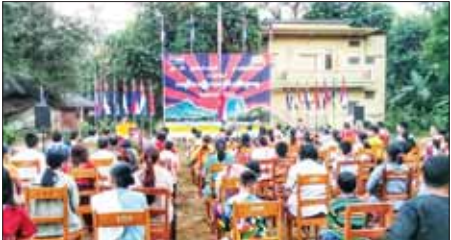
မွန်ပြည်နယ် မုဒုံမြို့နယ် မြို့မ(၄) ရပ်ကွက်ရှိ ဂျိုးဂျိုးဂျိုးတောရ ပရိယတ္တိသာသနာ့တိုက်၌ (၈၆) ကြိမ်မြောက် ကရင်အမျိုးသားနှစ်သစ်ကူးနေ့ အထိမ်းအမှတ် အလံတင်အခမ်းအနားကို ဇန်နဝါရီ ၁၁ ရက်က ကျင်းပစဉ်။ သာသနာ့ (ပြန်/ဆက်)