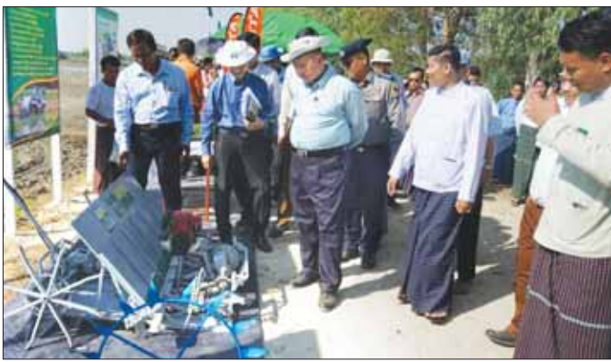
မွန်ပြည်နယ်ဝန်ကြီးချုပ် လယ်ယာသုံးစက်ကိရိယာများ ခင်းကျင်းပြသထားမှု ကြည့်ရှုစဉ်။

မော်လမြိုင် ဇန်နဝါရီ ၁၁ နေ့စပါးသီးနှံကို ကောက်စိုက် စက်၊ မျိုးစေ့ချက်ရိယာများဖြင့် စိုက်ပျိုးပြသခြင်း ကွင်းသရုပ်ပြပွဲ နှင့် မြေဩဇာထောက်ပံ့ပေးအပ်ပွဲ အခမ်းအနားကို ဇန်နဝါရီ ၁၀ ရက် က ရွာတန်းရှည်ကျေးရွာအုပ်စု တောင်သူ ဦးဟန်ဝင်းအောင် လယ်မြေ၌ ကျင်းပရာ ပြည်နယ် ဝန်ကြီးချုပ် ဦးအောင်ကြည်သိန်း နှင့်တာဝန်ရှိသူများ တက်ရောက် ကြသည်။ ဦးစွာ စိုက်ပျိုးရေးဦးစီးဌာန ပေါင်မြို့နယ် ဦးစီးမှူးက ပေါင်မြို့နယ်၏ ဆောင်သီးနှံ/ နေ့စပါးစိုက်ပျိုးထားရှိမှု အခြေ အနေများကို လည်းကောင်း၊ မြို့နယ် စက်မှုလယ်ယာဦးစီးဌာန ဦးစီးမှူးက နေ့စပါးသီးနှံကို ကောက်စိုက်စက်ဖြင့် စိုက်ပျိုးခြင်း နှင့်မျိုးစေ့ချက်ရိယာဖြင့် စိုက်ပျိုး ခြင်း၏ အကျိုးကျေးဇူးများကို လည်းကောင်း၊ ပြည်နယ် ဆည်မြောင်းနှင့် ရေအသုံးချမှု စီမံ ခန့်ခွဲရေးဦးစီးဌာန ညွှန်ကြားရေး မှူးက ကတိုက်ရေလျှောင့်တစ်ခုနှင့် ရင်းငြိမ်ရေထိန်းတံခါးတို့မှ ဆည်ရေ ပေးဝေမှုနှင့် ရေထိန်းတံခါးမှ ရေသိုလှောင်ထားရှိမှု အခြေအနေ တို့နှင့် စပ်လျဉ်း၍လည်းကောင်း ရှင်းလင်းတင်ပြသည်။ ထို့နောက် ပြည်နယ်ဝန်ကြီး ချုပ်က လုပ်သားအင်အားရားပါး မှုကို ကျော်လွှားနိုင်ရန်အတွက် မိရိုးဖလာ စိုက်ပျိုးခြင်းထက် လယ်ယာသုံး စက်ကိရိယာများ တွင်ကျယ်စွာ အစားထိုး အသုံးပြု