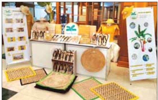
ငှက်ပျောလျှော်မှ ထွက်ရှိသော ဒေသထွက်လက်မှုပစ္စည်းများကို တွေ့ရစဉ်။

ကို ထုတ်လုပ်လျက်ရှိသည်။ နိုင်ငံတကာ တွင် အသုံးပြုလျက်ရှိသည့် စက္ကူကို ပါးပင်မှ အများဆုံးထုတ်လုပ်လျက်ရှိရာ ငှက်ပျောပင်မှလည်း ထုတ်လုပ်ရုံမျှ မတူပစ္စည်းထုတ်ကုန်များ လျှော့ချမှုနှင့် သဘာဝပတ်ဝန်းကျင် ထိန်းသိမ်းမှုတို့ တွင် စွန့်ပစ်ပစ္စည်းမှ လူသုံးကုန်ပစ္စည်း ထုတ်လုပ်မှုသည် တစ်ချိန်တွင် ကမ္ဘာ့နိုင်ငံ တို့တွင် လိုအပ်လာမည့် လူသုံးကုန်ပစ္စည်း ထုတ်ကုန်အဖြစ် သုံးစွဲမှုများလာနိုင် ကြောင်း စွန့်ပစ်ပစ္စည်းမှ တန်ဖိုးမြင့် ကုန်ချောထုတ်လုပ်သည့် လုပ်ငန်းရှင် များက ခန့်မှန်းထားကြသည်။ ညိုမိုးသူ (သတင်းစဉ်)