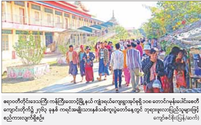
ရာဇဝတီတိုင်းဒေသကြီး ကန်ကြီးထောင့်မြို့နယ် ကျိုဒရယ်ကျေးရွာအုပ်စုရှိ ၁၀၈ တောင်ကုန်းပေါင်းစေတီကျောင်းတိုက်၌ ၂၇၆၄ ခုနှစ် ကရင်အမျိုးသားနှစ်သစ်ကူးပွဲတော်နေ့တွင် ဘုရားဖူးလှူပြည်သူများဖြင့် စည်ကားလျက်ရှိစဉ်။