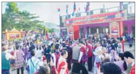
ကရင်သက္ကရာဇ် ၂၇၆၃ ခုနှစ် ပြာသိုလဆန်း ၁ ရက်နေ့တွင် ကျရောက်သည့် (၈၆)နှစ်မြောက် ကရင်နှစ်သစ်ကူးပွဲတော်ကို မွန်ပြည်နယ် သထုံမြို့ သစ်ကုန်းရပ်ကွက်ရှိ ကရင်အမျိုးသားသာသနာ့စိမ္မံတော်၌ ဇန်နဝါရီ ၁၁ ရက်က ကြိုဆိုအဆင့်အနေဖြင့် ကျင်းပစဉ်။ ခရိုင်(ပြန်/ဆက်)