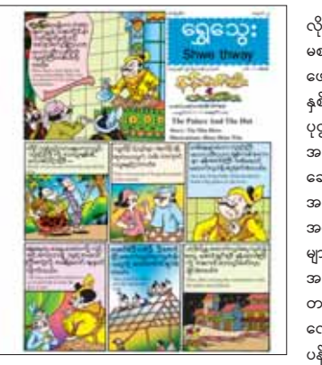
“ခုနစ်ထွေအကဝန်အက” သုတဆောင်းပါးကဏ္ဍ၊ သူငယ်ချင်းများနှင့်အတူ ကူညီပိုင်းဝန်းဆောင်ရွက်

နေပြည်တော် ဇန်နဝါရီ ၂၁ ပြန်ကြားရေးဝန်ကြီးဌာန ပုံနှိပ်ရေးနှင့်ထုတ်ဝေရေး ဦးစီးဌာန စာပေဗိမာန်ရုံးက အပတ်စဉ် စနေ နေ့တိုင်း ရွှေသွေးဂျာနယ်ကို ထုတ်ဝေဖြန့်ချိလျက် ရှိသည်။ ၁၃-၁-၂၀၂၄ ရက်(စနေနေ့) တွင် ထွက်ရှိမည့် ရွှေသွေးဂျာနယ် အတွဲ (၅၆)၊ အမှတ် (၂) တွင် အချို့ သူများအတွက် ရုပ်ဆိုးသည်ဟု ထင်ရသောအရာ သည် အခြားတစ်စုံတစ်ယောက်အတွက် အဖိုး ထိုက်တန်သောအရာ ဖြစ်နေတတ်သည့်အတွက် အရာရာကို ကိုယ်ချင်းစာစိတ်ဖြင့် ဆုံးဖြတ် ဆောင်ရွက်သင့်ကြောင်း တင်ဆက်ထားသည့် “နန်းတော်ကြီးနဲ့ တဲငယ်လေး” မျက်နှာဖုံး ဇာတ်လမ်း၊ ခုနစ်ထွေအကတွင် ပါဝင်သောဝန်အက အကြောင်းကို ဗဟုသုတရဖွယ် တင်ဆက်ထားသည့်