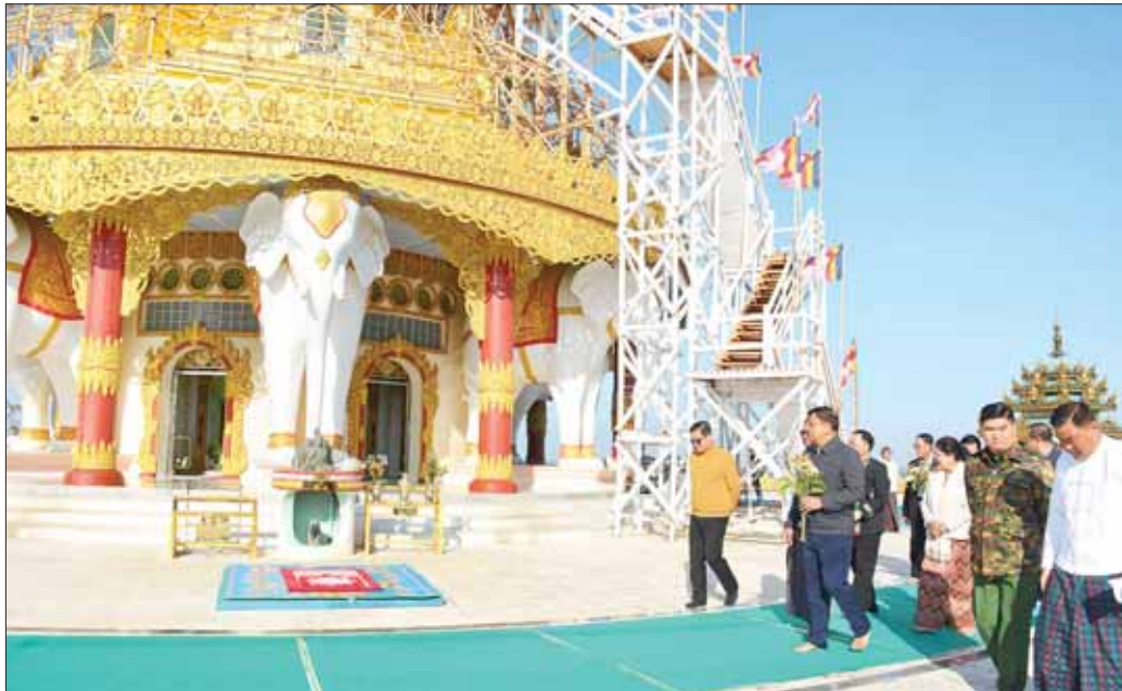
နိုင်ငံတော်စီမံအုပ်ချုပ်ရေးကောင်စီအဖွဲ့ဝင်၊ ဒုတိယဝန်ကြီးချုပ်နှင့် ကာကွယ်ရေးဝန်ကြီးဌာန ပြည်ထောင်စုဝန်ကြီး ဗိုလ်ချုပ်ကြီးတင်အောင်စန်းနှင့်အဖွဲ့ဝင် များ ဝိုင်းမော်မြို့နယ် မိုင်းနားကျေးရွာအုပ်စုအတွင်း ရောဝတီမြစ်ကမ်းဘေး ရွှေမိုးတောင်ပေါ်၌ တည်ထားကိုးကွယ်တော်မူသည့် ရဟန္တာတစ်ထောင် ရှင်ပင်မြတ်စွာဆုတောင်းပြည့်စေတီတော်ကြီးအား လက်ယာရစ်ပတ်ပူဇော်စဉ်။

လှူဒါန်းကြသည်။ အလှူငွေများဆက်ကပ်လှူဒါန်း ထိုမှတစ်ဆင့် နိုင်ငံတော်စီမံအုပ်ချုပ်ရေးကောင်စီ အဖွဲ့ဝင်၊ ဒုတိယဝန်ကြီးချုပ်နှင့် ပြည်ထောင်စုဝန်ကြီးနှင့် အဖွဲ့ဝင်များ၊ ပြည်ထောင်စုဝန်ကြီးများ သည် ဝိုင်းမော်မြို့နယ် မိုင်းနားကျေးရွာအုပ်စုအတွင်း ရောဝတီမြစ်ကမ်းဘေး ရွှေမိုးတောင်ပေါ်၌ တည်ထား ကိုးကွယ်တော်မူသည့် ရဟန္တာတစ်ထောင်ရှင်ပင် မြတ်စွာဆုတောင်းပြည့်စေတီတော်သို့ သွားရောက် ပြီး စေတီတော်ကြီးကို လက်ယာရစ်ပတ်ပူဇော်ကာ ပန်း၊ ရေချမ်း၊ ဆီစီးများကပ်လှူပူဇော်ပြီး စေတီတော် ဘက်ရှိပြင်ပွန်းမံနိုင်ရေးအတွက် အလှူငွေများ