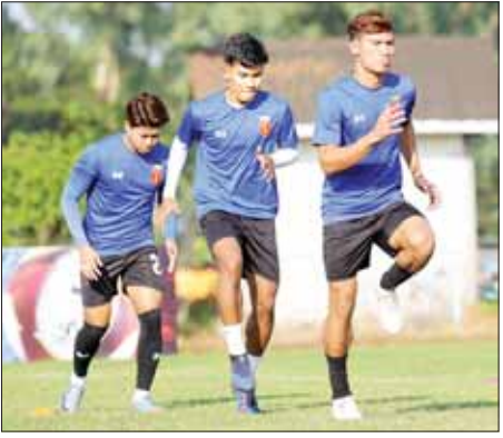
စာမျက်နှာ ၁၄ ကော်လံ ၁ ▼

နေပြည်တော် ဇန်နဝါရီ ၁၁ မြန်မာ့လက်ရွေးစင်အသင်းသည် မတ်လတွင် ယှဉ်ပြိုင်ရမည့် ဆီးရီးယားအသင်းနှင့် ၂၀၂၆ ကမ္ဘာ့ဖလားအာရှဇုန် ဒုတိယအဆင့် ခြေစစ်ပွဲအတွက် ပထမအကြိမ် လေ့ကျင့်မှုများ စတင်ပြုလုပ်လျက် ရှိသည်။