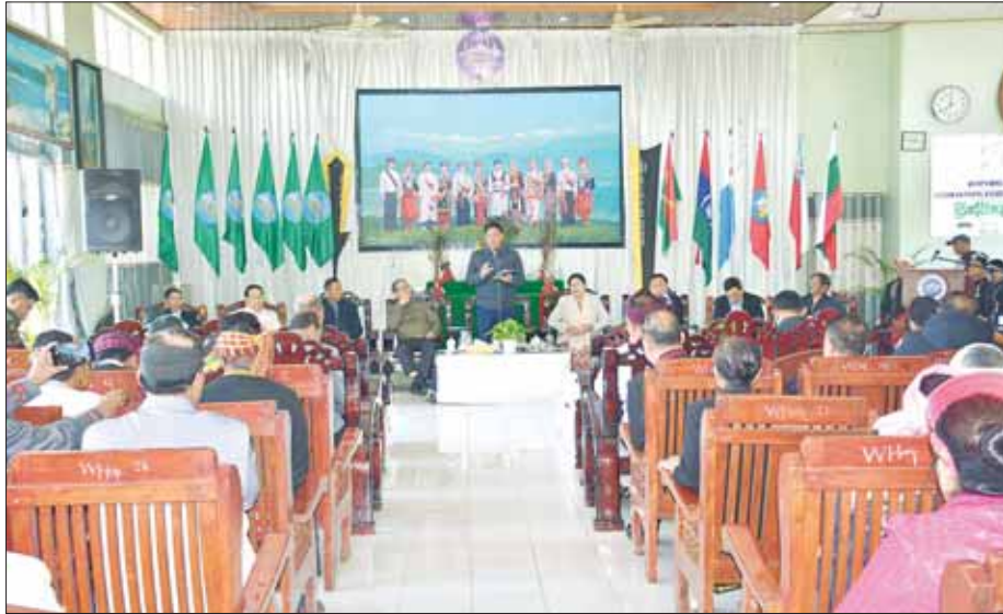
နိုင်ငံတော်စီမံအုပ်ချုပ်ရေးကောင်စီအဖွဲ့ဝင်၊ ဒုတိယဝန်ကြီးချုပ်နှင့် ကာကွယ်ရေးဝန်ကြီးဌာန ပြည်ထောင်စုဝန်ကြီး ဗိုလ်ချုပ်ကြီးတင်အောင်စန်း မြစ်ကြီးနားမြို့ စီတာပူရပ်ကွက် မနောကွင်းအတွင်း မနောအိမ်တော်၌ ပြည်နယ်အတွင်းရှိ တိုင်းရင်းသားစာပေယဉ်ကျေးမှုအသင်းအဖွဲ့များနှင့် တွေ့ဆုံအမှာစကားပြောကြားစဉ်။