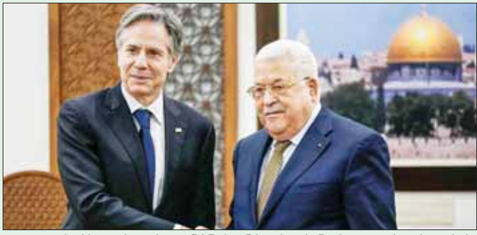
ဟားမားစ်ခေါင်းဆောင်များကို အမြစ်ဖြတ် ပြန်လည်လွှတ်မြောက်ရေးအတွက် လုပ်ဆောင်ရန် ရှင်းလင်းရန်နှင့် အောက်ဘက်ဘလင်အတွင်းက ဖမ်းဆီး ဆုံးဖြတ်ထားကြောင်း ၎င်းတို့က ပြောသည်။ ခေါ်ဆောင်သွားခံရသည့် စားစာခံများ အားလုံး အင်န်အိတ်ချ်ကေ

တို့ပါဝင်သည့် တိုင်းပြည်ထူထောင်ရန်အရေးပါသည့် ခြေလှမ်းများကို အမေရိကန်အရာရှိများက ထောက်ခံကြောင်း ဘလင်ကန်က ပြောသည်။ ပါလက်စတိုင်းအာဏာပိုင်အဖွဲ့ ပြန်လည်ဖွဲ့စည်း မည့်အကြောင်းကိုလည်း အဘတ်စ်နှင့်ဆွေးနွေး ခဲ့ကြောင်း အဆိုပါအဖွဲ့သည် ဂါဇာဒေသအတွက် တာဝန်ယူနိုင်မည့်ဖြစ်ကြောင်း အမေရိကန် နိုင်ငံခြားရေးဝန်ကြီးက ပြောသည်။ အဘတ်စ်သည် ဒေသတွင်း အခြားသော ခေါင်းဆောင်များနှင့်တွေ့ဆုံကာ တိုက်ပွဲများ ချက်ချင်းရပ်တန့်ရန် အရေးထားဆောင်ရွက်ခဲ့ သည်။ ပြီးခဲ့သည့်ရက်ပိုင်းအတွင်း ဂါဇာတောင်ပိုင်းရှိ ဟားမားစ်ပစ်မှတ် ၁၅၀ ကျော်ကို တိုက်ခိုက်ခဲ့ ကြောင်း အစုရှေးကာကွယ်ရေးအရာရှိများက ပြော သည်။