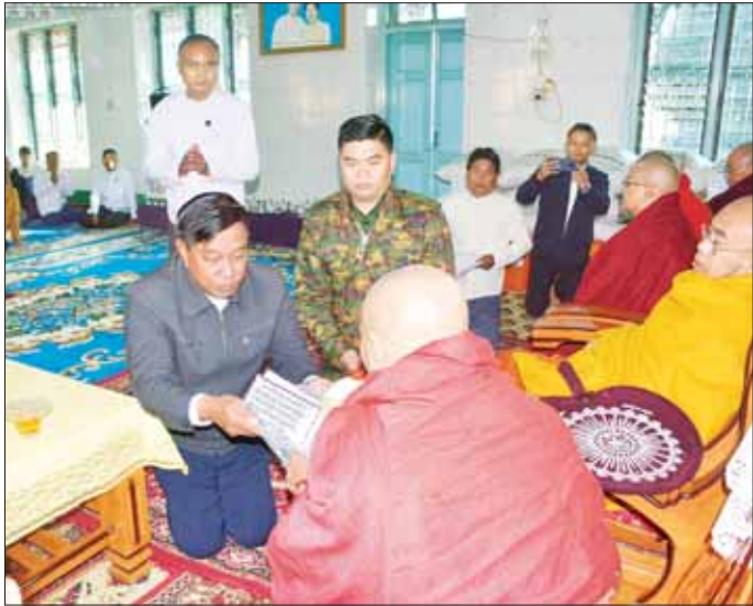
နိုင်ငံတော်စီမံအုပ်ချုပ်ရေးကောင်စီအဖွဲ့ဝင်၊ ဒုတိယဝန်ကြီးချုပ်နှင့် ကာကွယ်ရေးဝန်ကြီးဌာန ပြည်ထောင်စုဝန်ကြီး ဗိုလ်ချုပ်ကြီး တင်အောင်စန်း ဆရာတော်ထံ ဆန်၊ ဆီများ ဆက်ကပ်လှူဒါန်းစဉ်။

ဆက်ကပ်လှူဒါန်းကြသည်။ ယင်းနောက် မြစ်ကြီးနားမြို့ စိတာပူရပ်ကွက် မနောကွင်းအတွင်း မနောအိမ်တော်၌ ပြည်နယ် အတွင်းရှိ တိုင်းရင်းသားစာပေယဉ်ကျေးမှုအသင်း အဖွဲ့များနှင့် တွေ့ဆုံပွဲသို့ တက်ရောက်ခဲ့ကြရာ တိုင်းရင်းသားစာပေ ယဉ်ကျေးမှုအသင်းအဖွဲ့ ခေါင်းဆောင်များက ရိုးရာဓပုနန်းလစ်ဖြင့် ဂါရဝပြု လက်ဆောင်ပေးအပ်ကြသည်။ တွေ့ဆုံပွဲတွင် နိုင်ငံတော်စီမံအုပ်ချုပ်ရေးကောင်စီ အဖွဲ့ဝင်၊ ဒုတိယဝန်ကြီးချုပ်နှင့် ပြည်ထောင်စုဝန်ကြီး ဗိုလ်ချုပ်ကြီး တင်အောင်စန်းက ကချင်ပြည်နယ် အနေဖြင့် တိုင်းရင်းသားရေးရာကိစ္စရပ်များကို အကောင်အထည်ဖော်ဆောင်ရွက်ရာတွင် တိုင်းရင်း သားလူမျိုးများ၏ ဒေသအတွင်း အသိပညာဖွံ့ဖြိုး တိုးတက်ပြီး အလုပ်အကိုင်အခွင့်အလမ်းများ ပိုမိုရရှိ မှသာ လူမှုစီးပွားဘဝတိုးတက်မြှင့်တင်ပေးမည် ဖြစ်ပါ