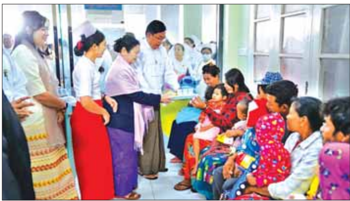
ခံတွင်းခွဲစိတ်ကုသဆောင်ကို ယခုကဲ့သို့ ဖွင့်လှစ်ပေး မကွေးပြည်သူ့ဆေးရုံကြီးရှိ သွားနှင့်ခံတွင်းဌာနကို ခွဲပြီး တိုင်းဒေသကြီးအတွင်းရှိ ပြည်သူများအနေဖြင့် လာရောက်ပြသနိုင်ကြောင်း သိရသည်။ နှုတ်ခမ်းကွဲ၊ အာခေါင်ကွဲကလေးငယ်များ တွေ့ရှိပါက အောင်ကို (ပြန်/ဆက်)

လူနာများအား တိုင်းဒေသကြီးဝန်ကြီးချုပ်နှင့် တာဝန်ရှိသူများက လှည့်လည်ကြည့်ရှု၍ အာဟာရ ပစ္စည်းများ ထောက်ပံ့ပေးခြင်းနှင့် လက်ဆောင် ပစ္စည်းများ ပေးအပ်ခဲ့ပြီး သွားနှင့်ခံတွင်းဌာနသို့ ကျန်းမာရေးဝန်ကြီးဌာန ကုသရေးဦးစီးဌာနမှ ထောက်ပံ့ပေးထားသော Dental Chair ကို ကြည့်ရှုသည်။ မကွေးပြည်သူ့ဆေးရုံကြီးတွင် ဇန်နဝါရီ ၈ ရက် မှစတင်ပြီး နေပြည်တော်မှ သွားနှင့်ခံတွင်း အထူးကုဆရာဝန်ကြီးများအပြင် ရန်ကုန်၊ မော်လမြိုင်၊ လှိုင်လင်နှင့် မကွေးမြို့တို့မှ အထူးကု ဆရာဝန်ကြီးများ ပူးပေါင်းကာ တိုင်းဒေသကြီးအတွင်း ရှိ နှုတ်ခမ်းကွဲ၊ အာခေါင်ကွဲ ကလေးငယ် ၁၂၄ ဦး အနက် ၄၆ ဦးကို ခွဲစိတ်ကုသပေးနိုင်ခဲ့ပြီး ကျန်ရှိ သည့် ကလေးငယ်များကိုလည်း အပတ်စဉ် ခွဲစိတ် ကုသပေးမည်ဖြစ်ကာ ခွဲစိတ်ကုသသည့်လူနာများ အဆင်ပြေစေရန်အတွက် ၃တင် (၅၀)ဆံ့ မေးရိုးနှင့်