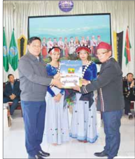
နိုင်ငံတော်စီမံအုပ်ချုပ်ရေးကောင်စီအဖွဲ့ဝင်၊ ဒုတိယဝန်ကြီးချုပ်နှင့် ကာကွယ်ရေးဝန်ကြီးဌာန ပြည်ထောင်စုဝန်ကြီး ဗိုလ်ချုပ်ကြီး တင်အောင်စန်း တိုင်းရင်းသားစာပေယဉ်ကျေးမှုအဖွဲ့အား ငွေကျပ် ၁၀ သိန်း ထောက်ပံ့ပေးစဉ်။