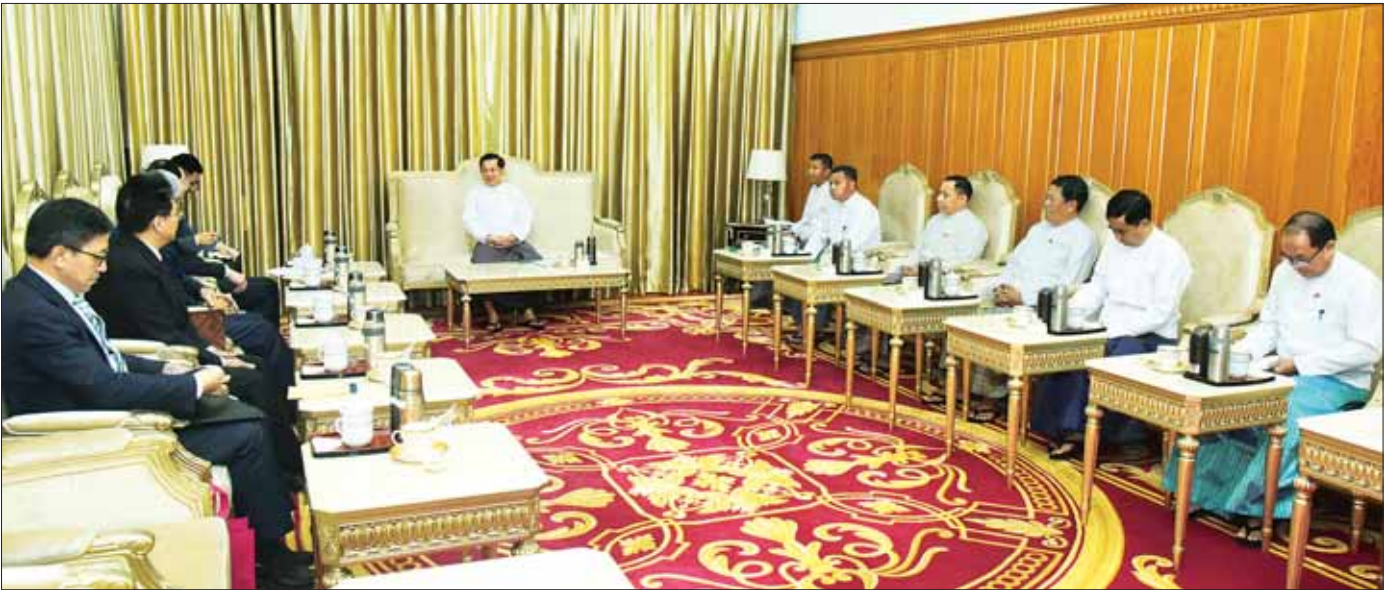
နိုင်ငံတော်စီမံအုပ်ချုပ်ရေးကောင်စီဥက္ကဋ္ဌ နိုင်ငံတော်ဝန်ကြီးချုပ် ဗိုလ်ချုပ်မှူးကြီး မင်းအောင်လှိုင် တရုတ်နိုင်ငံ နိုင်ငံခြားရေးဝန်ကြီးဌာန ဒုတိယဝန်ကြီး Mr. Sun Weidong အား လက်ခံတွေ့ဆုံစဉ်။

❖ ရှေ့ဖွဲ့မှု ထိုသို့တွေ့ဆုံရာတွင် နှစ်နိုင်ငံ ဆွေမျိုးပေါက်ဖော် ရင်းနှီးချစ်ကြည်စွာ ပူးပေါင်းဆောင်ရွက်လျက်ရှိသည့် အခြေအနေများ၊ နှစ်နိုင်ငံ ပူးပေါင်းဆောင်ရွက်မှုများ ဆက်လက်တိုးမြှင့်ဆောင်ရွက်သွားမည့် ကိစ္စရပ်များ၊ နှစ်နိုင်ငံ နယ်စပ်ဒေသတည်ငြိမ်အေးချမ်းရေးအတွက် ဆောင်ရွက်လျက်ရှိမှုနှင့် ဆက်လက်ဆောင်ရွက်မည့်ကိစ္စရပ်များနှင့် ပတ်သက်၍ ရင်းနှီးပွင့်လင်းစွာ အမြင်ချင်းဖလှယ်ဆွေးနွေးခဲ့ကြသည်။ တွေ့ဆုံပွဲအပြီးတွင် နိုင်ငံတော်စီမံအုပ်ချုပ်ရေးကောင်စီဥက္ကဋ္ဌ နိုင်ငံတော်ဝန်ကြီးချုပ်နှင့် တရုတ်နိုင်ငံ နိုင်ငံခြားရေးဝန်ကြီးဌာန ဒုတိယဝန်ကြီး Mr. Sun Weidong တို့သည် အမှတ်တရလက်ဆောင်ပစ္စည်းများ အပြန်အလှန်ပေးအပ်ကြပြီး မှတ်တမ်းတင်ဓာတ်ပုံရိုက်ခဲ့ကြကြောင်း သတင်းရရှိသည်။