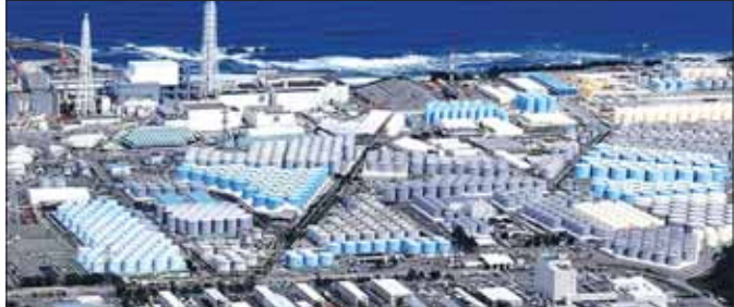
၂၀၁၁ ခုနှစ် မြေငလျင်နှင့် ဆူနာမီကြောင့် ပျက်စီးခဲ့သည့် ဖူကူရီးမားအဏုမြူဓာတ်ပေါင်းဖို့နေရာတွင် ဂျပန်အစိုးရက ရေဒီယိုသတ္တိကြွရေများအား ပြန်လည်သန့်စင်ပြီး ရေများကို ရေလှောင်ကန်ကြီးများဖြင့် စနစ်တကျသိုလှောင်ထားသည်ကို တွေ့ရစဉ်။

“ဝန်ကြီးချုပ် ကီရိုဒါက မြေငလျင်လှုပ်ခတ်ခဲ့တဲ့ဒေသမှာ အပျက်အစီးတွေ များပြားကြောင်း၊ အဆောက်အအုံပြိုကျပျက်စီးမှုတွေရှိကြောင်း၊ အသက် ဆုံးရှုံးမှုတွေနဲ့ ထိခိုက်ဒဏ်ရာရရှိမှုတွေရှိကြောင်း၊ သတင်းရရှိတဲ့အတွက် ၎င်းအနေနဲ့ သက်ဆိုင်ရာဒေသအာဏာပိုင်တွေဆီက အကူအညီတောင်းခံမှု တွေကို စောင့်ဆိုင်းမနေဘဲ လုပ်ပေးစရာရှိတဲ့ အကူအညီတွေကို ချက်ချင်း ဆောင်ရွက်ပေးဖို့ push-type assistance ပုံစံနဲ့ ဆောင်ရွက်ပေးခဲ့ ကြောင်း ပြောကြား”