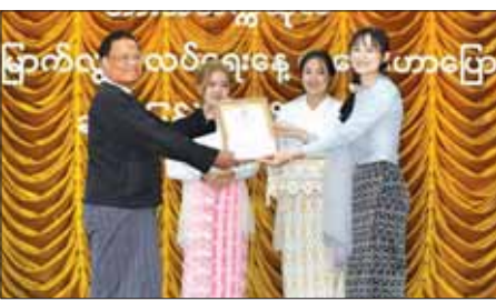
ဘားအံတက္ကသိုလ်၌ စာပေဟောပြောပွဲနှင့် ဆုချီးမြှင့်ပွဲအခမ်းအနားကျင်းပ

ယာဉ် (Mobile Medical Units) သုံးစီးဖြင့် လူမှုဖူလုံရေးအကျုံးဝင် အလုပ်သမားများကို အလုပ်ဌာနများအရောက်ကွင်းဆင်းဆေးကုသပေးလျက်ရှိပါသည်။ လူမှုဖူလုံရေးအဖွဲ့မှ လူမှုဖူလုံရေးစီမံကိန်းကို အကောင်အထည်ဖော်ဆောင်ရွက်ရာ၌ အကျုံးဝင် အာမခံအလုပ်သမား ၁ ဒသမ ၂ သန်းကျော်ရှိပြီး ကျန်းမာရေးစောင့်ရှောက်မှုအတွက် လူမှုဖူလုံရေးအဖွဲ့ပိုင် ဆေးရုံကြီး သုံးရုံ၊ မြို့နယ်လူမှုဖူလုံရေးဆေးခန်း ၉၆ ခန်း၊ ဌာနကြီးဆေးခန်း ၆၀၊ စာချုပ်ဆေးခန်း ၅၄ ခန်း၊ သားဖွားမီးယပ်ပြင်ပလူနာကုသမှု (Specialist OG OPD) ဆောင်ရွက်သည့်စာချုပ်ဆေးခန်း ၂၃ ခန်း၊ မီးဖွားဝန်ဆောင်မှုဆောင်ရွက်လျက်ရှိသော စာချုပ်ဆေးရုံ ၁၂ ခန်း၊ တိုင်းရင်းဆေးခန်း တစ်ခန်းတို့ဖြင့် ဝန်ဆောင်မှုဆောင်ရွက်ပေး