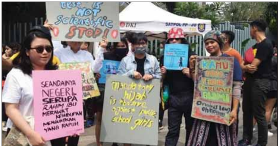
အမျိုးသမီးအစုအဝေးအပေါ် ဖိနှိပ်မှုများနှင့်ပတ်သက်၍ အင်ဒိုနီးရှားအမျိုးသမီးများက ၂၀၂၀ ပြည့်နှစ်အတွင်း ဂျာတာမြို့၌ ဆန္ဒပြခဲ့ကြစဉ်။

စကားအသွားအလာကြည့်ရတာ အခုမှမဟုတ်ပါဘူး။ ၂၀၂၂ ခုနှစ် ကလည်း မြန်မာနိုင်ငံ တပ်မတော်အကြီးအကဲတွေကို သူ့နိုင်ငံမှာ ခုံရုံးတင်ဖို့ ကြိုးစားခဲ့ခြင်းအပါအဝင် အင်ဒိုနီးရှားခေါင်းဆောင်တွေဟာ မြန်မာအစိုးရအပေါ် အကြိမ်ကြိမ် မဟုတ်တမ်းတရမ်းတွေ ပြောဆို လုပ်ဆောင်နေခဲ့တာပါ။ ပြန်ကြည့်ရင် မြန်မာနိုင်ငံအင်ဒိုဟာ သမိုင်း ကြောင်းကောင်းတဲ့ဆက်ခံရေးတွေ ရှိခဲ့ဖူးပါတယ်။ အခက်အခဲ မျိုးစုံနဲ့အင်ဒို ခုကွဲရောက်ခဲ့တုန်းကတောင် မြန်မာတွေ ကူညီခဲ့ဖူးပါ တယ်။ အင်ဒိုနီးရှားနိုင်ငံခေတ်ဆိုးမှာ ရှိခဲ့ဖူးတဲ့ မြန်မာကျေးဇူးကို ယနေ့အင်ဒိုခေါင်းဆောင်တွေ မေ့နေပုံရပြီး ယနေ့အင်ဒိုနီးရှားနိုင်ငံကြီး စင်ပေါ်ရောက်တဲ့အချိန် သူတို့ကိုယ်သူတို့ စိတ်ကြီးဝင် သွေးနားထင် ရောက်နေပုံရပါတယ်။