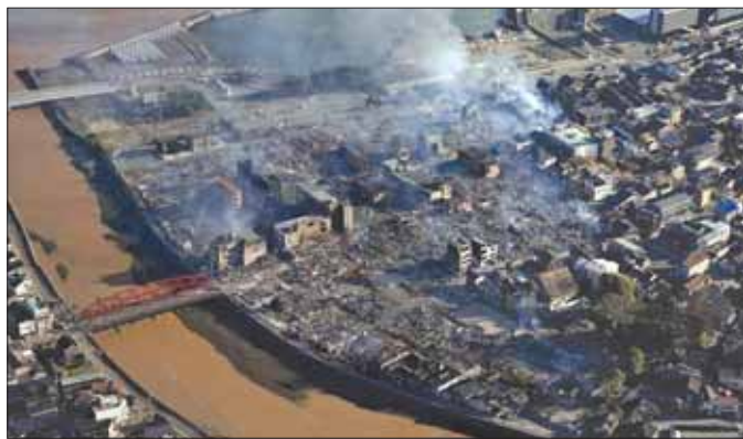
အိရှီကာဝါပြည်နယ် ဝါဂျီးမားမြို့တွင် မြေငလျင်ကြောင့် ဖြစ်ပွားခဲ့သည့် ပျက်စီးမှုများကို တွေ့ရစဉ်။

အစိုးရအဖွဲ့၊ အတွင်းရေးမှူးချုပ် ယိုရိုမာဆာ ဟာယာရှိကလည်း အစိုးရအနေနဲ့ လူပေါင်း ၅၇၄၆၀ ကို ကယ်ဆယ်ရေးစခန်း ၉၅၅ ခုမှာ စောင့်ရှောက် ထားပြီး လိုအပ်တဲ့အကူအညီတွေ ပေးအပ်နေကြောင်း၊ ကိုယ်ပိုင်ကာကွယ်ရေးတပ်ဖွဲ့ တပ်ဖွဲ့ဝင် ၁၀၃၀၊ ရဲတပ်ဖွဲ့ဝင် ၆၃၄ ဦး၊ မီးသတ်တပ်ဖွဲ့ဝင် ၂၀၄၇ ဦးနဲ့ ကမ်းခြေစောင့်တပ်ဖွဲ့ဝင် ၂၂၅၀ ကို ရှာဖွေကယ်ဆယ် ရေးလုပ်ငန်းများ ဆောင်ရွက်ရန် စေလွှတ်ထား ကြောင်း ပြောကြားခဲ့ပါတယ်။ သို့သော်လည်း မော်တော်ကားလမ်းတွေ အက်ကျဲပြိုကျမှု၊ တံတား အချိုးပြိုကျမှုတွေကြောင့် ရှာဖွေကယ်ဆယ်ရေး လုပ်ငန်းတွေအတွက် အခက်အခဲအချို့ကြုံတွေ့ရ ကြောင်းလည်း သိရှိရပါတယ်။ ဒါ့အပြင် မြေငလျင်