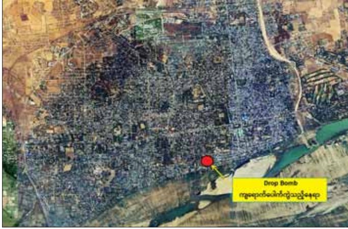
ပခုက္ကူမြို့ အမှတ်(၈)ရပ်ကွက်အတွင်းသို့ PDF အမည်ခံအကြမ်းဖက်သမားများ Drop Bomb ပစ်ချတိုက်ခိုက်ခဲ့သည့်နေရာပြပုံ။

PDF အမည်ခံ အကြမ်းဖက်သမားများသည် ယခုကဲ့သို့ စစ်ရေးနှင့်မသက်ဆိုင်သော မြို့/ရွာများအတွင်းသို့ လက်နက်ကြီးများဖြင့် ပစ်ခတ်ခြင်း၊ Drop Bomb များဖြင့် ပစ်ခတ်ခြင်း စသည့် အကြမ်းဖက်လုပ်ရပ်များ ဆောင်ရွက်လျက်ရှိသည့်အတွက် လုံခြုံရေးတပ်ဖွဲ့ဝင်များက နယ်မြေတည်ငြိမ်အေးချမ်းရေးအတွက် လိုအပ်သည့် လုံခြုံရေးလုပ်ငန်းများ ဆက်လက် ဆောင်ရွက်လျက်ရှိကြောင်း သတင်းရရှိသည်။