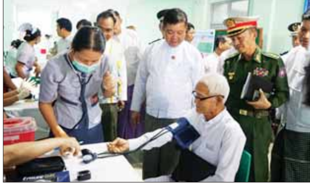
သက်နိုင် (မော်လမြိုင်)

အနေဖြင့် မော်လမြိုင်မြို့နယ်ရှိ အငြိမ်းစားနိုင်ငံဝန်ထမ်း ၃၀၀ ကို အခြေခံစားသောက်ကုန် အာဟာရဖြည့်စွက်စာနှင့် ကျန်းမာရေးစောင့်ရှောက်မှုကို ပထမအကြိမ် ထောက်ပံ့