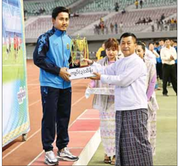
နိုင်ငံတော်စီမံအုပ်ချုပ်ရေးကောင်စီအဖွဲ့ဝင် ခွန်စုံလွင် အကောင်းဆုံး ကစားသမားဆုရရှိသူတစ်ဦးအား ဆုတံဆိပ်နှင့်ချီးမြှင့်ငွေများ ပေးအပ် ချီးမြှင့်စဉ်။