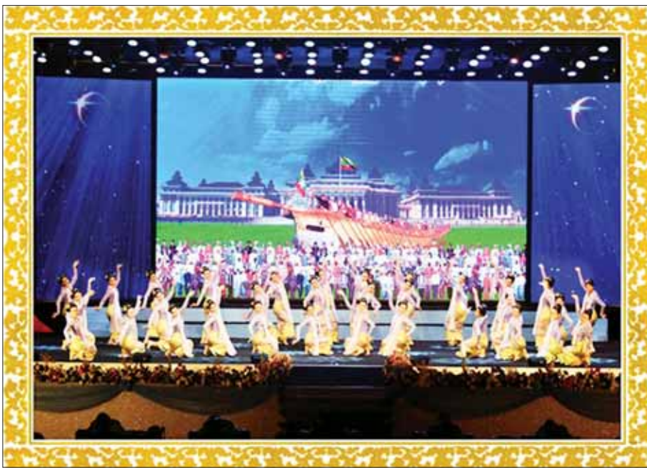
မြန်မာ့ယဉ်ကျေးမှုအကအလှ