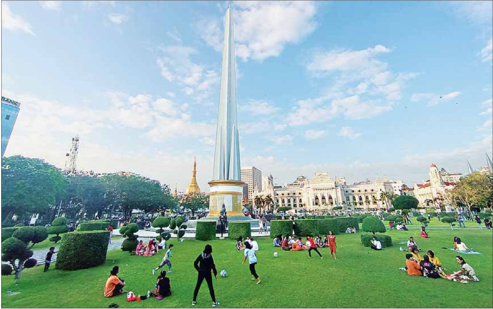
ရန်ကုန်မြို့၊ မဟာဗန္ဓုလ ပန်းခြံ၌ လွတ်လပ် ပျော်ရွှင်စွာ အပန်းဖြေ နေကြသော ပြည်သူများကို တွေ့ရစဉ်။

လွတ်မြောက်ခဲ့ပြီး ကိုယ့်ထီးကိုယ့်နန်းဖြင့် နေထိုင်ခဲ့ကြသည်မှာ ၁၉ ရာစုအလယ်ပိုင်း အချုပ်ပိုင် (ခ) သို့