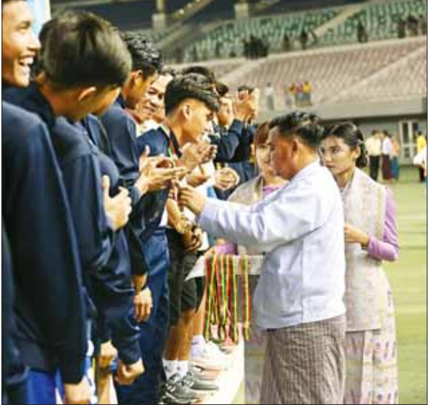
နိုင်ငံတော်စီမံအုပ်ချုပ်ရေးကောင်စီ တွဲဖက်အတွင်းရေးမှူး ဒုတိယ ဗိုလ်ချုပ်ကြီး ရဲဝင်းဦး ပထမဆုရရှိသည့် အားကစားနှင့်လူငယ်ရေးရာ ဝန်ကြီးဌာနအသင်းအား တစ်ဦးချင်းဆုတံဆိပ်များ ပေးအပ်ချီးမြှင့်စဉ်။