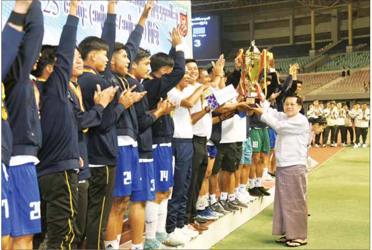
နိုင်ငံတော်စီမံအုပ်ချုပ်ရေးကောင်စီဥက္ကဋ္ဌ နိုင်ငံတော်ဝန်ကြီးချုပ် ဗိုလ်ချုပ်မှူးကြီး မင်းအောင်လှိုင် ပထမဆုရရှိသည့် အားကစားနှင့်လူငယ် ရေးရာဝန်ကြီးဌာနအသင်းအား ဂုဏ်ပြုချီးမြှင့်ငွေနှင့် တံခွန်စိုက်ဖလားတို့ကို ပေးအပ်ချီးမြှင့်စဉ်။

အကြိတ်အနယ်ယှဉ်ပြိုင် (၇၆)နှစ်မြောက် လွတ်လပ် ရေးနေ့အထိမ်းအမှတ် ဝန်ကြီး ဌာနပေါင်းစုံ ဘောလုံးပြိုင်ပွဲ (အမျိုးသား)ဗိုလ်လုပွဲတွင်စီမံကိန်း နှင့်ဘဏ္ဍာရေးဝန်ကြီးဌာနအသင်း နှင့်အားကစားနှင့် လူငယ်ရေးရာ ဝန်ကြီးဌာနအသင်းတို့ ယှဉ်ပြိုင် ကစားကြရာ အဆိုပါအသင်းများ သည် ဗိုလ်လုပွဲသို့ တက်ရောက် လာကြသည့် အသင်းများဖြစ်သည် နှင့်အညီ တစ်ဖက်နှင့်တစ်ဖက် အပြန်အလှန် အကြိတ်အနယ် ဖိအားပေး ယှဉ်ပြိုင်ကြပြီး ပွဲကစားချိန် ၈ မိနစ်တွင် စီမံကိန်း နှင့် စာမျက်နှာ ၇ သို့