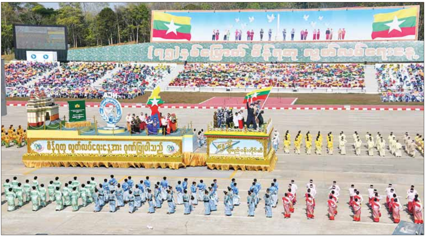
၂၀၂၃ ခုနှစ် (၇၅) နှစ်မြောက် စိန်ရတုလွတ်လပ်ရေးနေ့ စည်ကားသိုက်မြိုက်စွာ ကျင်းပမှုကို တွေ့ရစဉ်။

ပြင်သစ်ကိုလိုနီအဖြစ် သိမ်းပိုက်ခြင်း မခံရမီအချိန်အထိဖြစ်သည်။ ထို့နောက် ဂျပန်တို့ကျူးကျော်ခြင်း၊ ပြင်သစ်တို့ ပြန်လည်ကျူးကျော်ခြင်း၊ အမေရိကန်တို့ ကျူးကျော်ခြင်း၊ နိုင်ငံနှစ်ခြမ်းကွဲခြင်း စသည်တို့ဖြင့် ၁၉၇၅ ခုနှစ်မှာမှ ဗီယက်နမ် စစ်မီးငြိမ်းခဲ့ရသည်။ ၁၉၈၆ ခုနှစ်တွင် စီးပွားရေးနှင့် နိုင်ငံရေး ပြုပြင် ပြောင်းလဲမှုများ စတင်ခဲ့ပြီး ၂၀၀၀ ပြည့် နှစ်တွင် ကမ္ဘာ့စီးပွားရေးတိုးတက်မှုနှုန်း အမြင့်ဆုံးနိုင်ငံစာရင်းတွင် ပါဝင်ကာ ၂၀၁၁ ခုနှစ်တွင် ကမ္ဘာ့စီးပွားရေး တိုးတက်မှုနှုန်း အဖော်ဆောင်နိုင်ဆုံး နိုင်ငံအဖြစ် ထိပ်ဆုံးမှရပ်တည်လာနိုင် ခဲ့သည်။