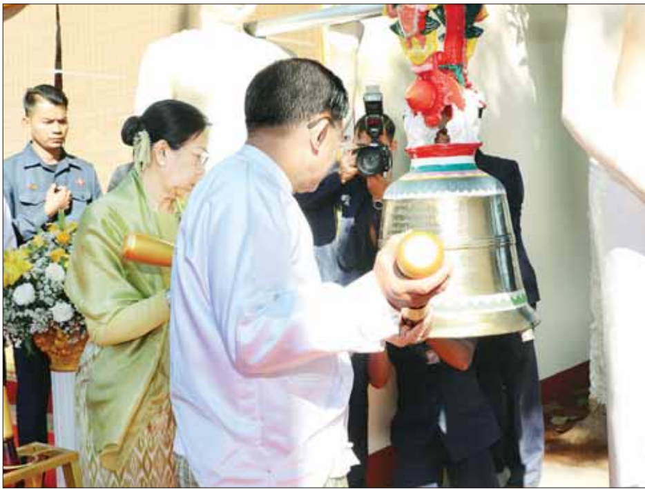
နိုင်ငံတော်စီမံအုပ်ချုပ်ရေးကောင်စီဥက္ကဋ္ဌ နိုင်ငံတော်ဝန်ကြီးချုပ် ဗိုလ်ချုပ်မှူးကြီး မင်းအောင်လှိုင်နှင့် ဇနီး ဒေါ်ကြူကြူလှ မင်္ဂလာမော်ကွန်းကမ္ဘည်းကျောက်စာတော်ကို အမွှေးနံ့သာရည်များ ပက်ဖျန်းဖွင့်လှစ်၍ ရတနာရွှေခေါင်းလောင်းတော်ကို ထိုးခတ်ပူဇော်စဉ်။