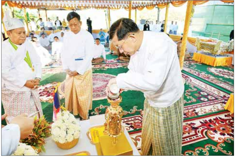
နိုင်ငံတော်စီမံအုပ်ချုပ်ရေးကောင်စီဥက္ကဋ္ဌ နိုင်ငံတော်ဝန်ကြီးချုပ် ဗိုလ်ချုပ်မှူးကြီး မင်းအောင်လှိုင် ရတနာစိန်ဖူးတော်မြတ်အတွင်းသို့ ဌာပနာတော်များကို ထည့်သွင်းပူဇော်စဉ်။