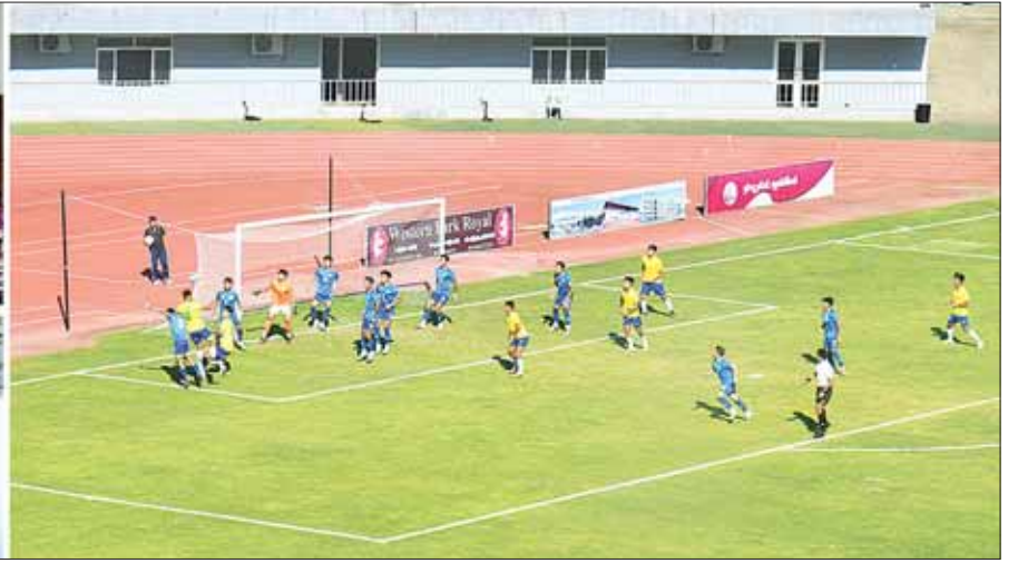
နိုင်ငံတော်စီမံအုပ်ချုပ်ရေးကောင်စီဥက္ကဋ္ဌ နိုင်ငံတော်ဝန်ကြီးချုပ် ဗိုလ်ချုပ်မှူးကြီး မင်းအောင်လှိုင်နှင့်အဖွဲ့ဝင်များ (၇၆)နှစ်မြောက် လွတ်လပ်ရေးနေ့အထိမ်းအမှတ် ဝန်ကြီးဌာနပေါင်းစုံ ဘောလုံးပြိုင်ပွဲ(အမျိုးသား) ဗိုလ်လုပွဲအဖြစ် စီမံကိန်းနှင့်ဘဏ္ဍာရေးဝန်ကြီးဌာနအသင်းနှင့် အားကစားနှင့် လူငယ်ရေးရာဝန်ကြီးဌာနအသင်းတို့ ယှဉ်ပြိုင်ကစားနေမှုကို ကြည့်ရှုအားပေးစဉ်။