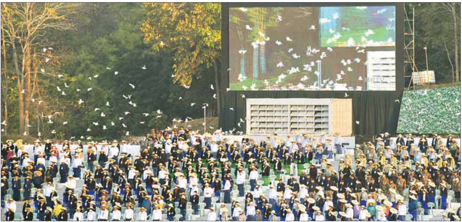
၂၀၂၃ ခုနှစ် (၇၅) နှစ်မြောက် စိန်ရတုလွတ်လပ်ရေးနေ့ကို ဂုဏ်ပြုသည့်အနေဖြင့် ငြိမ်းချမ်းရေးချိုးဖြူငှက် ၇၅၀ ကို လွှတ်တင်စဉ်။

မိမိတို့နိုင်ငံမှာတော့ ဘိုးဘွားတို့ ကျေးဇူးကြောင့် သင့်တင့်သည့် နိုင်ငံ အကျယ်အဝန်း နယ်နိမိတ်ကို ပိုင်ဆိုင် ခဲ့ကြရပြီး လွတ်လပ်ရေးရရှိသည်မှာလည်း (၇၆)နှစ်သို့ တိုင်ခဲ့ပါပြီ။ သို့သော် လွတ်လပ် ခြင်း၏ အနှစ်သာရကိုမူ တင်းပြည့် ကျပ်ပြည့် မခံစားနိုင်သေး။ လွတ်လပ်ခြင်း မှသည် သာလွန်သော အေးချမ်းသာယာ ဝပြောခြင်းကို မဆိုထားဘိ မူလအေးချမ်း ခဲ့သည့် ဒေသအချို့ပင် မီးဟုန်းဟုန်း တောက်လောင်လျက်ရှိကာ ဒေသခံတို့မှာ ယာယီနေရပ်စွန့်ခွာ စခန်းများတွင် တည်ရှိနေကြရဆဲ။ အပြစ်မဲ့ပြည်သူအချို့