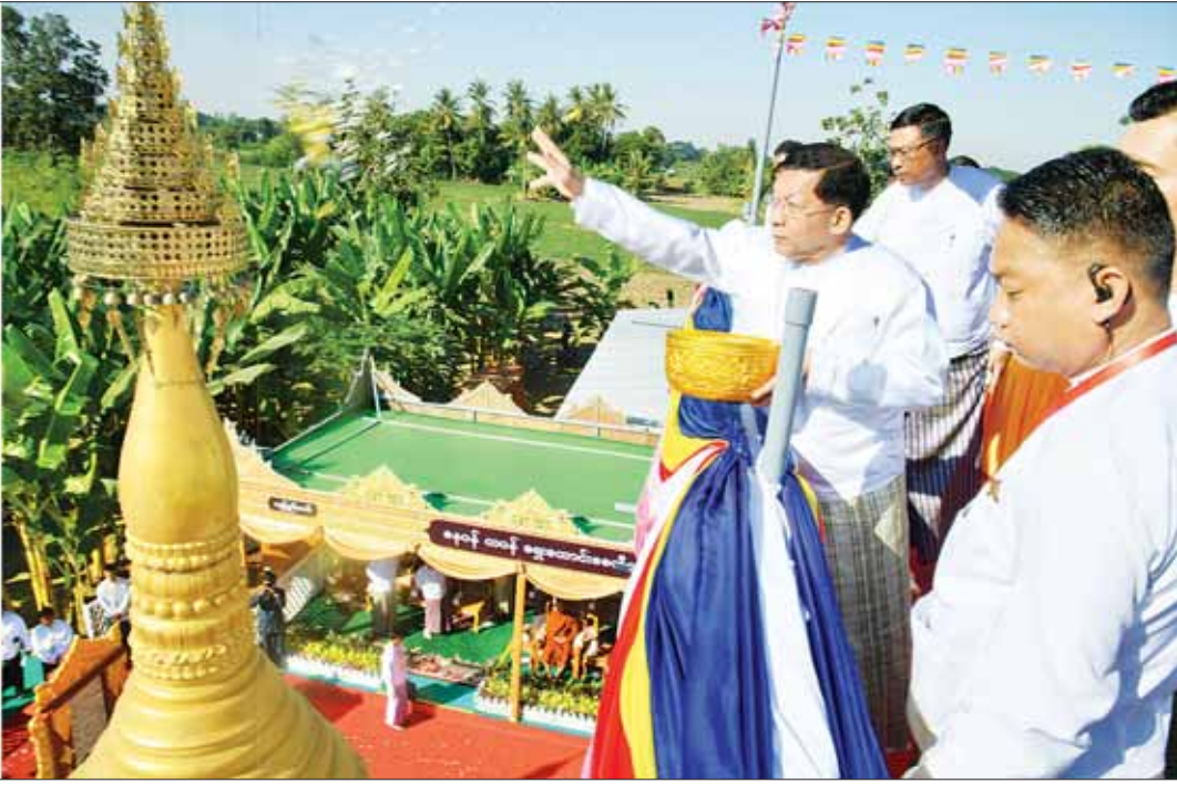
နိုင်ငံတော်စီမံအုပ်ချုပ်ရေးကောင်စီဥက္ကဋ္ဌ နိုင်ငံတော်ဝန်ကြီးချုပ် ဗိုလ်ချုပ်မှူးကြီး မင်းအောင်လှိုင် မဟာမင်္ဂလာအခမ်းအနား အောင်မြင်ခြင်းအထိမ်းအမှတ်အဖြစ် ရတနာရွှေခေါင်းလောင်း၊ ငွေမိုးများ ရွာသွန်းပြီးစဉ်။