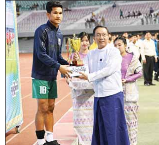
ဒုတိယဝန်ကြီးချုပ်နှင့် ပြည်ထောင်စုဝန်ကြီး ဦးဝင်းရှိန် အကောင်းဆုံးကစားသမားဆုရရှိသူတစ်ဦးအား ဆုတံဆိပ်နှင့် ချီးမြှင့်ငွေများ ပေးအပ်ချီးမြှင့်စဉ်။

ငွေများ ပေးအပ်ချီးမြှင့်သည်။ ဆက်လက်၍ အသင်းလိုက် စတုတ္ထဆုရရှိသည့် ဆောက်လုပ်ရေးဝန်ကြီးဌာန အသင်းအား ကောင်စီဝင် ဒုတိယဗိုလ်ချုပ်ကြီး ညိုစောက လည်းကောင်း၊ တတိယဆုရရှိသည့် ပြည်ထဲရေးဝန်ကြီးဌာနအသင်းအား ကောင်စီဝင် ဒုတိယဗိုလ်ချုပ်ကြီး ရာပြည့်က လည်းကောင်း၊ ဒုတိယဆုရရှိသည့် စီမံကိန်းနှင့်ဘဏ္ဍာရေးဝန်ကြီးဌာန အသင်းအား ကောင်စီဝင်ဗိုလ်ချုပ်ကြီး မြထွန်းဦးက လည်းကောင်း တစ်ဦးချင်းဆုတံဆိပ်၊ ဂုဏ်ပြုဆုနှင့် ချီးမြှင့်ငွေများကို အသီးသီး ပေးအပ်ချီးမြှင့်ကြသည်။