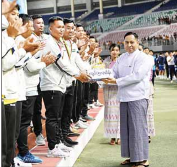
နိုင်ငံတော်စီမံအုပ်ချုပ်ရေးကောင်စီအဖွဲ့ဝင် ဒုတိယဗိုလ်ချုပ်ကြီး ရာပြည့် တတိယဆုရရှိသည့် ပြည်ထဲရေးဝန်ကြီးဌာနအသင်းအား ချီးမြှင့်ငွေ များ ပေးအပ်ချီးမြှင့်စဉ်။