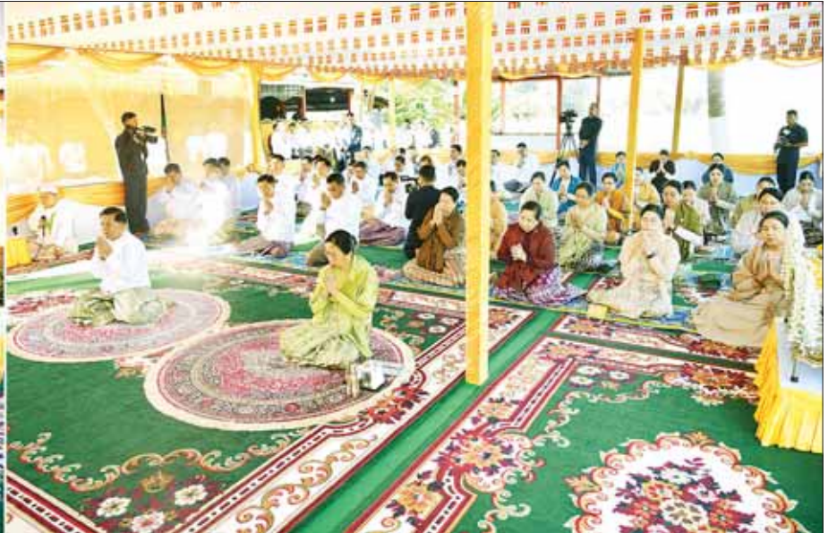
နိုင်ငံတော်စီမံအုပ်ချုပ်ရေးကောင်စီဥက္ကဋ္ဌ နိုင်ငံတော်ဝန်ကြီးချုပ် ဗိုလ်ချုပ်မှူးကြီး မင်းအောင်လှိုင်နှင့်ဇနီး ဒေါ်ကြူကြူလှ၊ အခမ်းအနားတက်ရောက်လာကြသူများ ပါဠိဆရာတော်ကြီးထံမှ ကိုးပါးသီလ ခံယူဆောက်တည်ကြစဉ်။