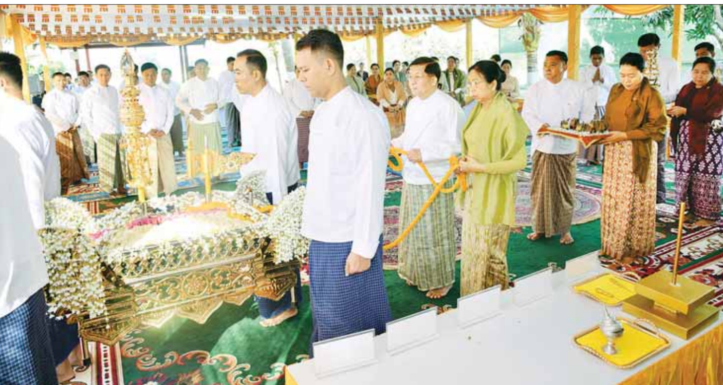
နိုင်ငံတော်စီမံအုပ်ချုပ်ရေးကောင်စီဥက္ကဋ္ဌ နိုင်ငံတော်ဝန်ကြီးချုပ် ဗိုလ်ချုပ်မှူးကြီး မင်းအောင်လှိုင်နှင့်ဇနီး ဒေါ်ကြူကြူလှ၊ အဖွဲ့ဝင်များ ရွှေထီးတော်၊ ငှက်မြတ်နားတော်၊ ရတနာစိန်ဖူးတော်တို့ကို မင်္ဂလာဝေါယာဉ်တော်ဖြင့် ပင့်ဆောင်၍ စေတီတော်မြတ်ကြီးအား လက်ယာရစ်လှည့်လည်ပူဇော်စဉ်။

ပူဇော်ပြီး လှူဖွယ်ပစ္စည်းများ ဆက်ကပ်လှူဒါန်းသည်။ ဆက်လက်ပြီး ကောင်စီတွဲဖက်အတွင်းရေးမှူးနှင့် ကောင်စီဝင်များက သံဃာတော်အရှင်သူမြတ်များထံ လှူဖွယ်ပစ္စည်းများကို ဆက်ကပ်လှူဒါန်းကြသည်။ ယင်းနောက် နိုင်ငံတော်စီမံအုပ်ချုပ်ရေးကောင်စီဥက္ကဋ္ဌ နိုင်ငံတော်ဝန်ကြီးချုပ်နှင့် ဇနီး၊ အဖွဲ့ဝင်များသည် ပါဠိဆရာတော်ကြီးထံမှ အနုမောဒနာတရားနာယူ၍ လှူဒါန်းမှုအစုစုအတွက် ရေစက်သွန်းချအမျှပေးဝေကြသည်။ လက်ယာရစ်လှည့်လည်ပူဇော် ဆက်လက်၍ နိုင်ငံတော်စီမံအုပ်ချုပ်ရေးကောင်စီဥက္ကဋ္ဌ နိုင်ငံတော်ဝန်ကြီးချုပ်နှင့် ဇနီး၊ အဖွဲ့ဝင်များသည် ရွှေထီးတော်၊ ငှက်မြတ်နားတော်၊ ရတနာစိန်ဖူးတော်တို့ကို မင်္ဂလာဝေါယာဉ်တော်ဖြင့် ပင့်ဆောင်၍ စေတီတော်မြတ်ကြီးအား လက်ယာရစ်လှည့်လည်ပူဇော်ကြသည်။ ထို့နောက် နိုင်ငံတော်စီမံအုပ်ချုပ်ရေးကောင်စီဥက္ကဋ္ဌ နိုင်ငံတော်ဝန်ကြီးချုပ်နှင့် အဖွဲ့ဝင်များက ရတနာစိန်ဖူးတော်၊ ငှက်မြတ်နားတော်နှင့် ရွှေထီးတော်ဘုံအဆင့်တို့ကို မင်္ဂလာအချိန်တွင် စေတီတော်အတွင်း၌ တင်လှူပူဇော်ကာ ပရိတ်နံ့သာရည်များ ပက်ဖျန်းပူဇော်ကြသည်။ စာမျက်နှာ ၅ သို့