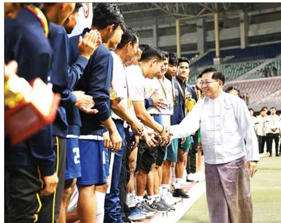
နိုင်ငံတော်စီမံအုပ်ချုပ်ရေးကောင်စီဥက္ကဋ္ဌ၊ နိုင်ငံတော်ဝန်ကြီးချုပ် ဗိုလ်ချုပ်မှူးကြီး မင်းအောင်လှိုင် အားကစားသမားများအား ရင်းရင်းနှီးနှီးနှုတ်ဆက်စဉ်။

အချိန်ပို မိနစ် ၃၀ ကို ဆက်လက် ယှဉ်ပြိုင်ကစားခဲ့ရာ အချိန်ပို ၁၈ မိနစ်တွင် အားကစားနှင့် လူငယ်ရေးရာဝန်ကြီးဌာန အသင်းက ၁၈ ကိုက်စည်းအပြင် ဘက်မှ အပြင်းကန်သွင်းချက်ဖြင့် ဦးဆောင်ရိုးရရှိခဲ့ပြီး ချေပဂိုး ပြန်လည်သွင်းယူနိုင်ခြင်း မရှိသဖြင့် ပွဲကစားချိန်များ ပြီးဆုံးချိန်တွင် အားကစားနှင့် လူငယ်ရေးရာ ဝန်ကြီးဌာနအသင်းက စီမံကိန်းနှင့် ဘဏ္ဍာရေးဝန်ကြီးဌာနအသင်း အား လေးဂိုး - သုံးဂိုးဖြင့် ထိုက်တန်စွာ အနိုင်ရပိုလ်စွဲခဲ့သည်။ ထို့နောက် ဆုချီးမြှင့်ခြင်း အခမ်းအနားကို ဆက်လက်ကျင်းပရာ အကောင်းဆုံး အားကစားသမားဆု ရရှိခဲ့ကြသည့် အားကစားသမားများကို ဒုတိယဝန်ကြီးချုပ်နှင့် စီမံကိန်းနှင့် ဘဏ္ဍာရေးဝန်ကြီးဌာန ပြည်ထောင်စုဝန်ကြီး ဦးဝင်းရှိန်၊ ကောင်စီဝင်များ ဖြစ်ကြသည့် ခွန်စံလွင်၊ ဒေါက်တာဘရွှေ၊ ဒေါက်တာမူထန်နှင့် မန်းငြိမ်းမောင်တို့က ဂုဏ်ပြုဆုတံဆိပ်နှင့် ချီးမြှင့်