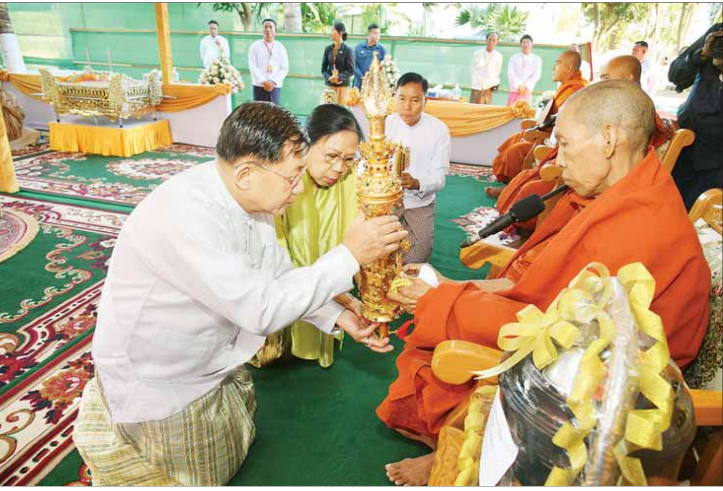
နိုင်ငံတော်စီမံအုပ်ချုပ်ရေးကောင်စီဥက္ကဋ္ဌ နိုင်ငံတော်ဝန်ကြီးချုပ် ဗိုလ်ချုပ်မှူးကြီး မင်းအောင်လှိုင်နှင့်ဇနီးဒေါ်ကြူကြူလှ သဗ္ဗညုဘုရားရှင်အား ရည်မှန်းထား၍ ရွှေထီးတော်၊ ငှက်မြတ်နားတော်၊ ရတနာစိန်ဖူးတော်တို့ကို ပါဠိဆရာတော်ကြီးထံ သာဟတ္ထိကဒါနမြောက် ဆက်ကပ်ပူဇော်စဉ်။

နေပြည်တော် ဇန်နဝါရီ ၃ ပြည်ထောင်စုနယ်မြေနေပြည်တော် ဇေယျာသီရိမြို့နယ် စိမ်းစားပင်ကျေးရွာရှိ နေပန်လပန်ရွေးဟောင်းစေတီတော် ရွှေထီးတော်၊ ငှက်မြတ်နားတော်၊ ရတနာစိန်ဖူးတော် တင်လှူပူဇော်ပွဲနှင့် ဗုဒ္ဓါဘိသေကအနေကဇာတင် မဟာမင်္ဂလာအခမ်းအနားကို ယနေ့နံနက်ပိုင်းတွင် ကျင်းပပြုလုပ်ရာ ပါဠိတက္ကသိုလ် မင်္ဂလာဇေယျကျောင်းတိုက် ပဓာနနာယက အဂ္ဂမဟာပဏ္ဍိတ၊ အဂ္ဂမဟာသဒ္ဓမ္မဇောတိကဓဇ ဘဒ္ဒန္တဝိမလဗုဒ္ဓိ အမှူးပြုသည့် ဆရာတော်၊ သံဃာတော်အရှင်သူမြတ်များ ကြွရောက်ချီးမြှင့်တော်မူကြသည်။ တက်ရောက်ပူဇော် အဆိုပါ အခမ်းအနားသို့ နိုင်ငံတော်စီမံအုပ်ချုပ်ရေးကောင်စီဥက္ကဋ္ဌ နိုင်ငံတော်ဝန်ကြီးချုပ် ဗိုလ်ချုပ်မှူးကြီး မင်းအောင်လှိုင်နှင့် ဇနီးဒေါ်ကြူကြူလှ၊ ကောင်စီတွဲဖက်အတွင်းရေးမှူး ဒုတိယဗိုလ်ချုပ်ကြီး ရဲဝင်းဦးနှင့် ဇနီး၊ ကောင်စီဝင်များနှင့် ဇနီးများ၊ ပြည်ထောင်စုအဆင့်ပုဂ္ဂိုလ်များ၊ ပြည်ထောင်စုဝန်ကြီးများနှင့်ဇနီးများ၊ နေပြည်တော်ကောင်စီဥက္ကဋ္ဌနှင့် ဇနီး၊ ကာကွယ်ရေးဦးစီးချုပ်ရုံးမှ အဆင့်မြင့် တပ်မတော်အရာရှိကြီးများနှင့် ဇနီးများ၊ နေပြည်တော်တိုင်းစစ်ဌာနချုပ်တိုင်းမှူး၊ အလှူရှင်များနှင့် ဖိတ်ကြားထားသည့် ဧည့်သည်တော်များ၊ ဝတ်အသင်းအဖွဲ့များနှင့်ဒေသခံပြည်သူများ တက်ရောက်ပူဇော်ကြသည်။ စာမျက်နှာ ၄ ကော်လံ ၁ ❖