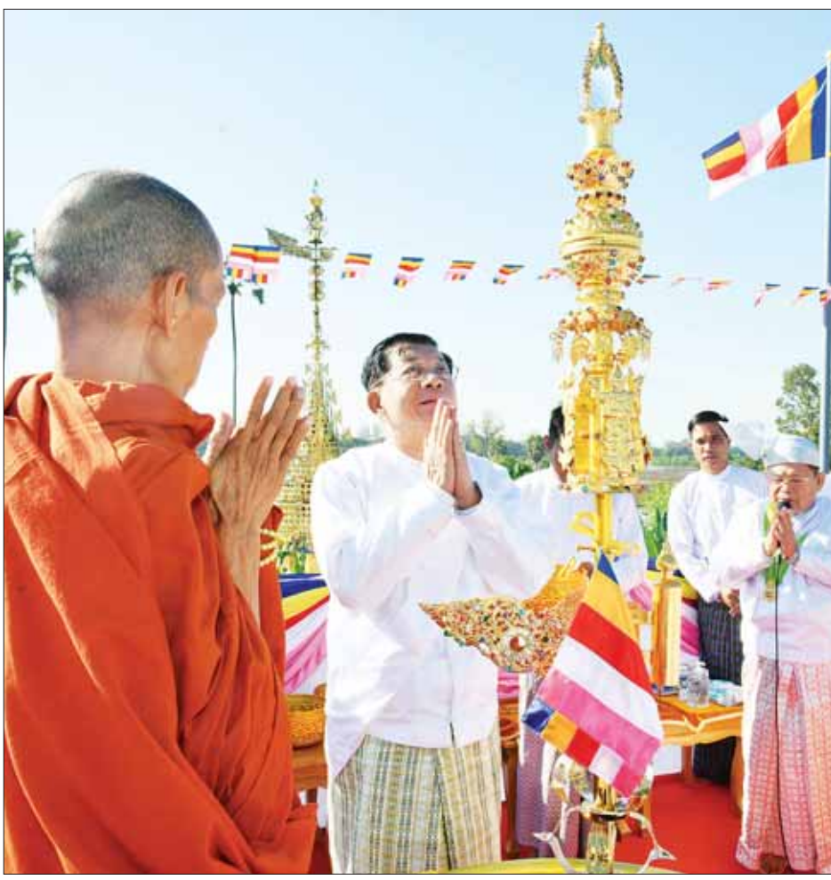
နိုင်ငံတော်စီမံအုပ်ချုပ်ရေးကောင်စီဥက္ကဋ္ဌ နိုင်ငံတော်ဝန်ကြီးချုပ် ဗိုလ်ချုပ်မှူးကြီး မင်းအောင်လှိုင် ရတနာစိန်ဖူးတော်၊ ငှက်မြတ်နားတော်နှင့် ရွှေထီးတော်တို့အဆင့်ဆင့်တို့ကို မင်္ဂလာအချိန်တွင် စေတီတော်အတွက်၌ တင်လှူပူဇော်စဉ်။

ခန့် ညောင်ရမ်းခေတ်တွင် တည်ထားခဲ့သောစေတီတော်ဖြစ်ကြောင်း၊ ၂၀၀၅ ခုနှစ်တွင် လက်ရှိ သုခရတနာကျောင်းတိုက် ကျောင်းထိုင်ဆရာတော်ဘဒ္ဒန္တအာလောက၏ ခမည်းတော်ဖြစ်သူနှင့် ဦးရီးတော်ဖြစ်သူတို့မှ တွေ့ရှိခဲ့ပြီး ပြန်လည်ဖော်ဆောင်ခဲ့ခြင်းဖြစ်ကြောင်း၊ နေပန်လပန် ရှေးဟောင်းစေတီတော်မြတ်လေးဆူကို ဗုဒ္ဓသာသနာတော် အမွှေရရှိတည်တံ့ခိုင်မြဲရေး၊ သာသနာတော် ထွန်းကားပြန့်ပွားရေးနှင့် ရှေးဟောင်းယဉ်ကျေးမှု အမွှေအနစ်များ မပျောက်ပျက်အောင် ထိန်းသိမ်းစောင့်ရှောက်နိုင်ရေး စသည့် ရည်ရွယ်ချက်များဖြင့် နိုင်ငံတော်စီမံအုပ်ချုပ်ရေးကောင်စီဥက္ကဋ္ဌ နိုင်ငံတော်ဝန်ကြီးချုပ် ဗိုလ်ချုပ်မှူးကြီး မင်းအောင်လှိုင်နှင့် ဇနီး ဒေါ်ကြူကြူလှတို့ အများပြုသည့် တပ်မတော် (ကြည်း၊ ရေ၊ လေ) မိသားစုများ၊ စေတနာရှင်ပြည်သူများ၏ စုပေါင်းလှူဒါန်းမှုဖြင့် ပြန်လည်ပြုပြင်မွမ်းမံ တည်ထားပူဇော်ပြီးစီးခဲ့ပြီး ရွှေထီးတော်၊ ငှက်မြတ်နားတော်၊ ရတနာစိန်ဖူးတော် တင်လှူပူဇော်ခြင်းနှင့် ဗုဒ္ဓါဘိသေက အနေကဇာတင် မဟာမင်္ဂလာအခမ်းအနားကို ယနေ့တွင် အောင်မြင်စွာ ကျင်းပပြုလုပ်ခဲ့ခြင်းဖြစ်ကြောင်း သတင်းရရှိသည်။