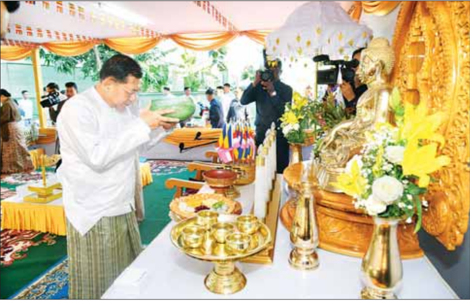
နိုင်ငံတော်စီမံအုပ်ချုပ်ရေးကောင်စီဥက္ကဋ္ဌ နိုင်ငံတော်ဝန်ကြီးချုပ် ဗိုလ်ချုပ်မှူးကြီး မင်းအောင်လှိုင် မဟာမင်္ဂလာမဏ္ဍပ်တော်အတွင်းရှိ ဗုဒ္ဓရုပ်ပွားတော်မြတ်အား မြသပိတ်ဆွမ်းတော်၊ သစ်သီးဆွမ်း၊ ပန်း၊ ရေချမ်း၊ ဆီမီးတို့ကို ကပ်လှူပူဇော်စဉ်။