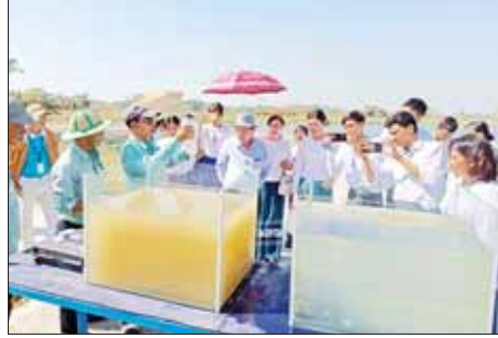
ထို့နေ့က သင်တန်းကျောင်း ပစ္စည်းများ ပေးအပ်ခဲ့ကြောင်း ကျောင်းအုပ်ကြီးက ကုမ္ပဏီဥက္ကဋ္ဌ ထံသို့ အမှတ်တရ လက်ဆောင် သိရသည်။ သတင်းစဉ်

ပုသိမ် ဇန်နဝါရီ ၁ - ရော့ဘတ်တိုင်းဒေသကြီး သမဝါယမ စာရင်းရေး စာရင်းကိုင် သက်မွေးပညာသင်တန်းကျောင်း (ပုသိမ်) မှ သင်တန်းသား ၉၀ တိုင်းဒေသကြီး သမဝါယမဦးစီးဌာန တိုင်းဒေသကြီး ဦးစီးဌာနနှင့် တာဝန်ရှိသူများ တိုင်းဒေသကြီး သမဝါယမအသင်းစုချုပ်မှ တာဝန် ရှိသူများ၊ သင်တန်းကျောင်း ကျောင်းအုပ်ကြီးနှင့် တာဝန်ရှိ ကြီးကြပ်သူများ ၂၅ ဦး စုစုပေါင်း ၁၁၅ ဦးတို့သည် ပန်းတနော် မြို့နယ် Global Earth Agro & Aqua Industry Public Company Limited သို့ သွားရောက် လေ့လာသည်။ အဆိုပါ လေ့လာရေးခရီးစဉ် တွင် ကုမ္ပဏီဥက္ကဋ္ဌ ဦးဌေးမြင့်နှင့် တာဝန်ရှိသူများက ကုမ္ပဏီ၏ ရည်မှန်းချက်များ၊ ပါဝင်သည့် လုပ်ငန်းစဉ်များ၊ လုပ်ငန်း၏ အကျိုးကျေးဇူးများကို Power Point ဖြင့် ရှင်းလင်းပြောကြား ပြီး ဆောင်ရွက်လျက်ရှိသည့် လုပ်ငန်းစဉ်များနှင့် ရှေ့လုပ်ငန်း စဉ်များကို လေ့လာသူများအား ရှင်းလင်း ပြသသည်။