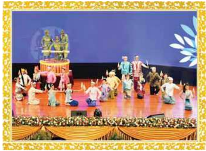
ပြည်ထောင်စုတိုင်းရင်းသားများ

နိုင်ငံတော်စီမံအုပ်ချုပ်ရေးကောင်စီဥက္ကဋ္ဌ၊ နိုင်ငံတော်ဝန်ကြီးချုပ် ဗိုလ်ချုပ်မှူးကြီး မင်းအောင်လှိုင်၏ (၃-၃-၂၀၂၁) ရက်တွင် အမျိုးသားစည်းလုံးညီညွတ်ရေးနှင့်ငြိမ်းချမ်းရေးဖော်ဆောင်မှုဟုတ်ကော်မတီ အစည်းအဝေး (၁/၂၀၂၁) တွင် ပြောကြားသည့်အမှာစကားမှ ကောက်နုတ်ချက်]