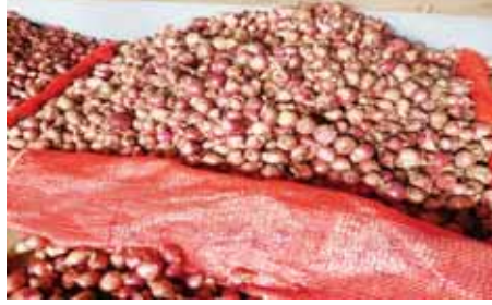
မြင်းခြံခရိုင်တွင် မိုးကြက်သွန်နီများ စတင်ထွက်ပေါ်

မန္တလေးတိုင်းဒေသကြီး မြင်းခြံခရိုင်တွင် မိုးကြက်သွန်နီများကို ၂၀၂၃ ခုနှစ် ဩဂုတ်လနှင့် စက်တင်ဘာလများတွင် စတင်စိုက်ပျိုးကြပြီး ဒီဇင်ဘာလ၊ ဇန်နဝါရီလနှင့် ဖေဖော်ဝါရီလများတွင် တူးဖော်လေ့ရှိကြောင်း မြင်းခြံခရိုင်၌ ၂၀၂၂ ခုနှစ်တွင် မိုးကြက်သွန်နီ ၁၆၃၃ ဧက စိုက်ပျိုးနိုင်ခဲ့ပြီး ၂၀၂၃ ခုနှစ်၌ မိုးကြက်သွန်နီ ၁၇၉၄ ဧက စိုက်ပျိုးနိုင်ခဲ့သည့်အတွက် ယခင်နှစ်ထက် ၁၆၁ ဧက ပိုမိုစိုက်ပျိုးနိုင်ခဲ့ကြောင်း သိရသည်။