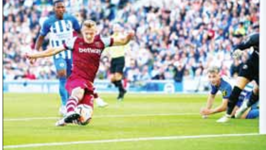
ဘရိုက်တန်နှင့် ဝက်စ်ဟမ်း ပထမအကျော့ တွေ့ဆုံယှဉ်ပြိုင်မှု။ စာမျက်နှာ ၁၂ ကော်လံ ၅

ပရီမီယာလိဂ်ပွဲစဉ် (၂၀) မှ ဝက်စ်ဟမ်းနှင့် ဘရိုက်တန်အသင်းပွဲစဉ်ကို ဇန်နဝါရီ ၃ ရက် နံနက် ၂ နာရီတွင် ယှဉ်ပြိုင်ကစား သွားမှာ ဖြစ်ပါတယ်။ လက်ရှိ ပရီမီယာလိဂ်ပွဲစဉ် (၁၉) ကစားပြီးချိန်မှာ ဝက်စ်ဟမ်းအသင်းက ဘရိုက်တန်အသင်းထက် သုံးမှတ်အသာနဲ့ ရပ်တည်ထားနိုင် တယ်ဆိုပေမယ့် ဘရိုက်တန်အသင်းက တိုက်စစ်စွမ်းဆောင်ရည်ပိုင်း သာလွန်မှု ရှိတယ်။ စာမျက်နှာ ၁၂ ကော်လံ ၅