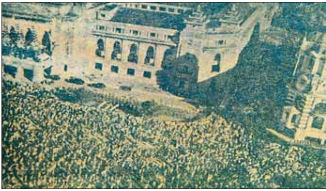
မြန်မာနိုင်ငံလွတ်လပ်ရေးရရှိပြီးနောက် ၁၉၄၇ ခုနှစ်က ရန်ကုန်မြို့၊ ဖြူတော်ခန်းမရှေ့၌ ကျင်းပခဲ့သည့် လွတ်လပ်ရေးနေ့ အခမ်းအနားမြင်ကွင်း မှတ်တမ်းဓာတ်ပုံ။

နယ်ချဲ့သမားများ၏ သိမ်းပိုက်ခြင်းကို ခံခဲ့ရသည့် ဌာနေတိုင်းရင်းသားများသည် သူ့ကျွန်မခံလိုသည့်စိတ်ဖြင့် တွန်းလှန်တိုက်ခိုက်မှုများ ရှိခဲ့သည်။ ထိုတိုက်ပွဲများကား တိုင်းရင်းသားပြည်သူများ၏ သူ့ကျွန်မခံလိုသော မျိုးချစ်စိတ်ဓာတ်၏ အမျိုးသားရေးစိတ်ဓာတ်ဖြင့် တွန်းလှန်ခဲ့ကြခြင်းဖြစ်သည်။ မြန်မာ့လွတ်လပ်ရေးအတွက် အရေးဆို တိုက်ပွဲဝင်လာကြသည့် ကာလတစ်လျှောက်လုံး မြန်မာပြည်သူများ၏စိတ်တွင် တူညီသောမျိုးချစ်စိတ်ဓာတ်ကို တွေ့မြင်ခဲ့ကြရသည်။ တိုင်းရင်းသားပြည်သူများ အားလုံး မြန်မာနိုင်ငံသူ၊ နိုင်ငံသားများဖြစ်သည်ဟူသော အတွေးအမြင် ခံယူချက်များဖြင့် တစ်စိတ်တစ်ပိုင်း တစ်ဝမ်းတည်း ရှိခဲ့ကြကာ စုစည်းညီညွတ်စွာဖြင့် တိုက်ပွဲဝင်ခဲ့ကြခြင်းဖြစ်သည်။