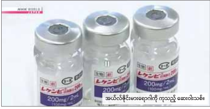
အယ်လ်ဇိုင်းမားဆေးကို ကုသည့် ဆေးဝါးသစ်။

အဆိုပါဆေးဝါးသည် ဒီဇင်ဘာ ၂၀ ရက်က ဆေးဝါးသည် အပျော့စားမှတ်ဥာဏ် ချို့ယွင်း သူများနှင့် ဦးနှောက်ထိခိုက် ခံစားရသူများ