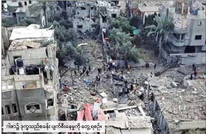
ဂါဇာ၌ ဒုက္ခသည်စခန်း ပျက်စီးနေမှုကို တွေ့ရစဉ်။

ဂါဇာကမ်းမြောက် အလယ်ပိုင်းရှိ အယ်လ်မက်ဂါဇီ ဒုက္ခသည်စခန်း ကို ဒီဇင်ဘာ ၂၄ ရက်က ပြုလုပ် သည့် အစွရေး လေကြောင်း တိုက်ခိုက်မှုအတွင်း ပါလက် စတိုင်း ၇၀ ထက်မနည်း သေဆုံးခဲ့ ကြောင်း အစိုးရပိုင် ပါလက်စတိုင်း ရုပ်သံက ဖော်ပြသည်။ အစွရေးတပ်ဖွဲ့ဝင်များသည် ဒုက္ခသည်စခန်းများကြားရှိအလယ် ပိုင်းဒေသ၏ အဓိကလမ်းမများ ပေါ်သို့ ဗုံးကြဲတိုက်ခိုက်နေပြီး လူထုထပ်သည့် နေရာများသို့ ကျရောက်မှုကြောင့် သေဆုံးသူ ဦးရေ တိုးလာဖွယ်ရှိကြောင်း၊ အဆိုပါနေရာသို့ လူနာတင်ယာဉ် များနှင့် အရပ်ဘက်ယာဉ်များ သွားရောက်ရန် အခက်အခဲ ဖြစ်ပေါ်နေကြောင်း ဂါဇာအခြေ စိုက် ကျန်းမာရေးဝန်ကြီးဌာနမှ ပြောရေးဆိုခွင့်ရှိသူ အက်ရှာရက်စ် အယ်လ်ကီဒရာ က ပြောသည်။