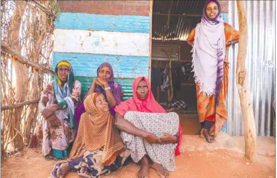
အိသိယိုးပီးယားနိုင်ငံအတွင်း တိုက်ပွဲဖြစ်ပွားမှုကြောင့် နေရပ်စွန့်ခွာလာကြသူများ။

လူသားချင်းစာနာ ထောက်ထားမှု အကူအညီလိုအပ် လူသားချင်း စာနာထောက်ထားမှု ဆိုင်ရာ ကုလသမဂ္ဂညွှန်နှိုင်းရေးရာရုံးက