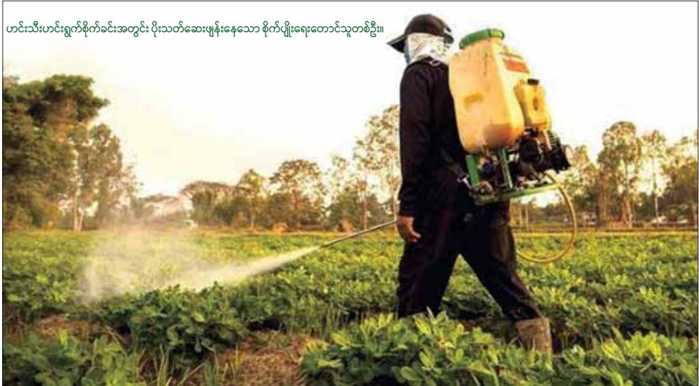
ဟင်းသီးဟင်းရွက်စိုက်ခင်းအတွင်း ပိုးသတ်ဆေးပန်းနေသော စိုက်ပျိုးရေးတောင်သူတစ်ဦး။

တရုတ်နိုင်ငံတွင် ဟင်းသီးဟင်းရွက်များကို အဆင့်သုံးဆင့် ခွဲခြားထားပါသည်။ ပထမအဆင့်မှာ ညစ်ညမ်းမှုကင်းသော ဟင်းသီးဟင်းရွက်များ (Non-polluted vegetables)၊ ဒုတိယအဆင့်မှာ သန့်ရှင်းသော ဟင်းသီးဟင်းရွက်များ (Green vegetables) နှင့် တတိယအဆင့်မှာ အော်ဂဲနစ် ဟင်းသီးဟင်းရွက်များ (Organic vegetables) ဟူ၍ ခွဲခြားထားသည်။ မိန်းမလောနည်းဖြင့် စိုက်ပျိုးထားသော ဟင်းသီးဟင်းရွက်များကို ဤအဆင့် သုံးဆင့်တွင် ထည့်သွင်းမထားပါ။ မိန်းမလော စိုက်ပျိုးနည်းတွင် ဓာတုဆေးများကို အတိုင်းအဆ မရှိအသုံးပြုနေသောကြောင့် ၎င်းဟင်းသီးဟင်းရွက်များကို ညစ်ညမ်းသောဟင်းသီးဟင်းရွက် (Polluted vegetables) များအဖြစ် ယူဆသောကြောင့် ထည့်သွင်းမထားခြင်းဖြစ်သည်။ တောင်သူများ စိုက်ပျိုးထားသော စိုက်ခင်းများကို မည်သည့် အဆင့်တွင်ပါဝင်ကြောင်း ဆုံးဖြတ်ပေးသူများမှာ အစိုးရဝန်ထမ်း စိုက်ပျိုးရေးပညာရှင်များပင် ဖြစ်သည်။ စိုက်ပျိုးရေးပညာရှင်များသည် ကွင်းဆင်း လေ့လာကြည့်ရှုစစ်ဆေးပြီး အဆင့်များကို ဆုံးဖြတ်ပေးရပါသည်။ စိုက်ပျိုးထွက်ရှိလာသည့် သီးနှံများကို တံဆိပ်နှိပ်ပြီး ဈေးကွက်သို့ တင်ပို့ရောင်းချပါသည်။ အဆင့်အတန်းအလိုက် ဈေးနှုန်းသတ်မှတ်ပေးပါသည်။ ဤနည်းလမ်းဖြင့် စားသုံးသူများအား ပိုးသတ်ဆေးဓာတ်ကြွင်းများပါသောသီးနှံများကို စားသုံးမိခြင်းမှ ကာကွယ်ပေးထားကြောင်း ၂၀၁၇ ခုနှစ်