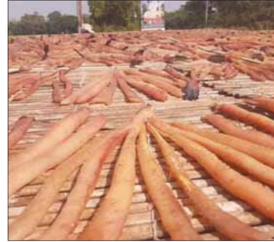
ငါးခြောက်လုပ်ငန်းတစ်ခု၌ ငါးရဲ့ ငါးခြောက်နှင့် အခြားငါးခြောက်များ နေလှန်းထားစဉ်။