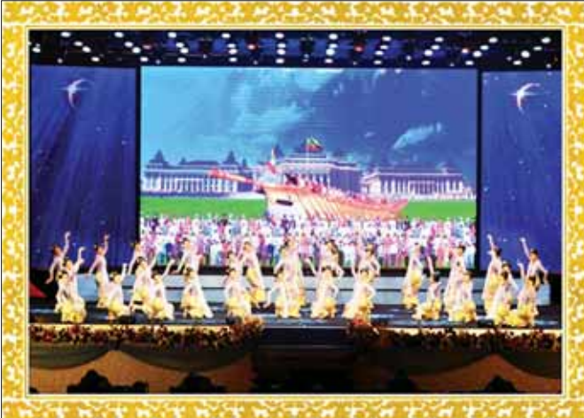
မြန်မာ့ယဉ်ကျေးမှုအကအလှ

[ နိုင်ငံတော်စီမံအုပ်ချုပ်ရေးကောင်စီဥက္ကဋ္ဌ၊ နိုင်ငံတော်ဝန်ကြီးချုပ် ဗိုလ်ချုပ်မှူးကြီး သတိုးမဟာသရေစည်သူ သတိုးသီရိသုဓမ္မ မင်းအောင်လှိုင်ထံမှ ၁၀-၁-၂၀၂၃ ရက်နေ့တွင် (၇၅)နှစ်မြောက် စိန်ရတနာချင်ပြည်နယ်နေ့ အခမ်းအနားသို့ ပေးပို့သည့်သဝဏ်လွှာမှ ကောက်နုတ်ချက် ]