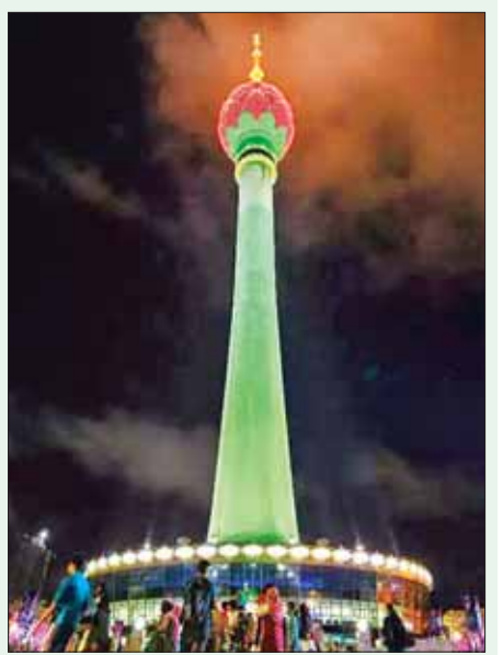
ပြည်တွင်းပြည်ပခရီးသွားများကို ဆွဲဆောင်သည့် သီရိလင်္ကာနိုင်ငံ ကိုလံဘိုမြို့ရှိ ကြာပန်းမျှော်စင်ကို တွေ့ရစဉ်။

သီရိလင်္ကာနှင့် တရုတ်နိုင်ငံတို့သည် ၂၀၁၂ ခုနှစ်တွင် တောင် အာရှ၌ အမြင့်ဆုံးဖြစ်လာမည့် ထိုကြာပန်းမျှော်စင်ကို တည်ဆောက် ရန်အတွက် သဘောတူညီချက်တစ်ခု လက်မှတ်ရေးထိုးခဲ့ ကြသည်။ ဆင်ဟွာ