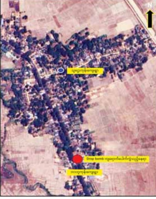
ကျောက်တံခါးမြို့နယ်၊ ဘာဘူကုန်းကျေးရွာအတွင်းသို့ PDF အမည်ခံ အကြမ်းဖက်သမားများ Drop Bomb ချခဲ့သည့်နေရာပြပုံ

ဟိုပုံး၊ လျှိုင်လင်နှင့် ပင်လောင်းမြို့နယ်တို့၌ ဘိန်းခင်းများပျက်ဆီး နေပြည်တော် ဒီဇင်ဘာ ၂၅ ဒေသ ဟိုပုံးမြို့နယ် ဗန်းစောက် ရှမ်းပြည်နယ်(တောင်ပိုင်း) ဟိုပုံး မြို့နယ်၌ ဒီဇင်ဘာ၂၄ ရက် နံနက် ၉ နာရီ မိနစ်၅၀ ခန့်က ဟိုပုံး မြို့နယ် ရဲတပ်ဖွဲ့မှ တပ်ဖွဲ့ဝင်များ၊ နယ်မြေခံ တပ်မတော်သားများ ပါဝင်သည့် ပူးပေါင်းအဖွဲ့သည် ဟိုပုံး၊ လျှိုင်လင်နှင့် ပင်လောင်းမြို့နယ် ကျွင်းခမ်း ပစ်ခတ်မှုများ ပြုလုပ်ခဲ့ရာ ဟိုပုံး၊ လျှိုင်လင်နှင့် ပင်လောင်းမြို့နယ် တို့၌ ဘိန်းခင်းများ ပျက်ဆီးခဲ့ကြောင်း သိရသည်။ အလားတူ နံနက် ၈ နာရီတွင် လျှိုင်လင်ခရိုင်ရဲတပ်ဖွဲ့မှ တပ်ဖွဲ့ ဝင်များပါဝင်သော ပူးပေါင်းအဖွဲ့ သည် လျှိုင်လင်မြို့နယ် ကျွင်းခမ်း ကျေးရွာအနီးရှိ ဘိန်းခင်း ၆၈ ဧက ခန့် ကို အသီးသီးဖျက်ဆီးခဲ့ကြောင်း သတင်းရရှိပါသည်။ သတင်းစဉ်