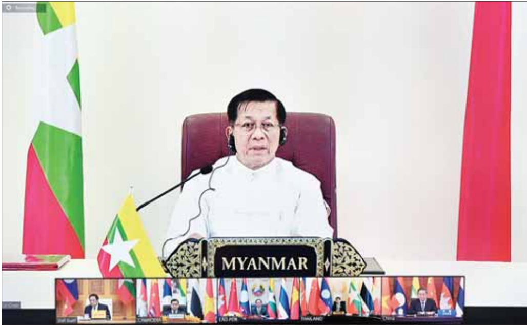
နိုင်ငံတော်စီမံအုပ်ချုပ်ရေးကောင်စီဥက္ကဋ္ဌ နိုင်ငံတော်ဝန်ကြီးချုပ် ဗိုလ်ချုပ်မှူးကြီး မင်းအောင်လှိုင် (၄) ကြိမ်မြောက် မဲခေါင် - လန်ချန်း ပူးပေါင်းဆောင်ရွက်မှု နိုင်ငံခေါင်းဆောင်များ အစည်းအဝေးတွင် ဝိဒီယိုကွန်ဖရင့်ဖြင့် ပါဝင်တက်ရောက်ဆွေးနွေးစဉ်။

ထို့ပြင် နိုင်ငံတော်စီမံအုပ်ချုပ်ရေးကောင်စီဥက္ကဋ္ဌ