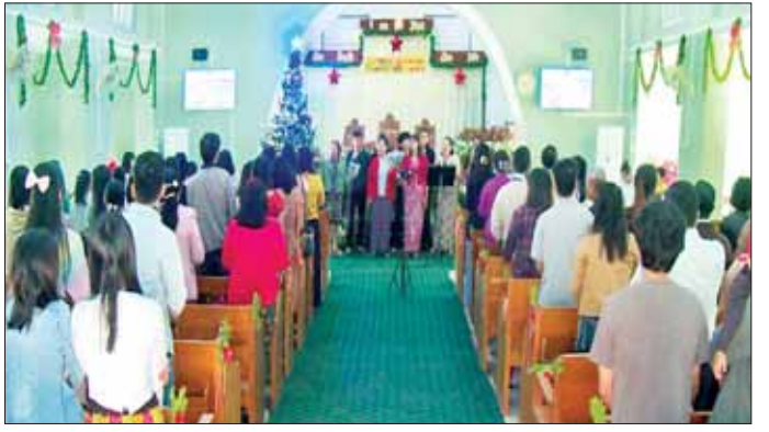
ကျောင်းများ၌ ခရစ္စမတ်နေ့အထိမ်းအမှတ် ပျော်ပွဲရွှင်ပွဲ အဖြစ် ဓမ္မတေးသီဆိုမှုများ၊ အပြန်အလှန်လက်ဆောင်ပေးခြင်း အစီအစဉ်များ ဆောင်ရွက်ကြပြီး ညပိုင်းတွင် စာဖြင့် ဂုဏ်ပြုကြိုဆိုခဲ့ကြကြောင်း သိရသည်။ အောင်ရဲသွင်

အခြား ခရစ်ယာန်ဘုရားကျောင်းများ၌ ခရစ်ယာန်ဘာသာဝင်များသည် ခရစ္စမတ်နေ့ အခါသမယအခမ်းအနားကို အဖွင့်မေတ္တာပို့ဆုတောင်း၍ ဖွင့်လှစ်ပေးကာ ဓမ္မသီချင်းများကို စုပေါင်းသီဆိုချီးမွမ်းကြသည်။ ထို့နောက် ခရစ်ယာန်ဘုန်းတော်ကြီးများ၊ သိက္ခာတော်ရဆရာတော်များနှင့်အတူ ခရစ်ယာန်ဘာသာဝင်များသည် သမ္မာကျမ်းစာဖတ်ကြားပြီး မေတ္တာပို့ဆုတောင်းခြင်းများ ဆောင်ရွက်ကြကာ ကျေးဇူးတော်ချီးမွမ်းခြင်းအထိမ်းအမှတ် မိတ်ဆုံစားခြင်းနှင့် ပျော်ပွဲရွှင်ပွဲများကို စိတ်အေးချမ်းသာစွာ ဆောင်ရွက်ကြသည်။ ထို့ပြင် ခရစ်ယာန်ဘုရား