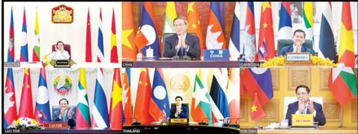
နိုင်ငံတော်စီမံအုပ်ချုပ်ရေး ကောင်စီဥက္ကဋ္ဌ နိုင်ငံတော်ဝန်ကြီးချုပ် ဗိုလ်ချုပ်မျိုးကြီး မင်းအောင်လှိုင် မဲခေါင် - လန်ချန်း ပူးပေါင်းဆောင်ရွက်မှု အလှည့်ကျပူးတွဲဥက္ကဋ္ဌ တာဝန်ကို ထိုင်းနိုင်ငံသို့ လွှဲပြောင်းပေးအပ်စဉ်။

စားအုန်းဆီ အခြေခံလက်ကားရည်ညွှန်းဈေးနှုန်း တစ်ပိဿာ ၄၉၅၅ ကျပ် ဖြစ်ကြောင်း ထုတ်ပြန်ကြေညာ နေပြည်တော် ဒီဇင်ဘာ ၂၅ စီးပွားရေးနှင့် ကူးသန်းရောင်းဝယ်ရေးဝန်ကြီးဌာန၊ စားသုံးဆီ တင်သွင်းသိုလှောင် ဖြန့်ဖြူးခြင်းလုပ်ငန်းကြီးကြပ်ရေးကော်မတီ အနေဖြင့် စားအုန်းဆီ ကမ္ဘာ့ဈေးနှုန်း ဖြစ်ပေါ်ပြောင်းလဲမှုနှင့် အညီ ပြည်တွင်း၌ ဖြစ်သင့်ဖြစ်ထိုက်သည့် ဈေးနှုန်းများ ဖြစ်ပေါ်စေရေး ထိန်းကျောင်းဆောင်ရွက်လျက်ရှိပြီး စားအုန်းဆီ အဓိက ထုတ်လုပ်တင်ပို့သည့် မလေးရှားနိုင်ငံတွင် ဖြစ်ပေါ်နေသည့် FOB ဈေးနှုန်းများကို နေ့စဉ်စောင့်ကြည့်ကာ သယ်ယူပို့ဆောင်ခ ကုန်ကျ စရိတ်များ၊ ဘဏ်စရိတ်များ၊ အခွန်အခများ ထည့်သွင်းတွက်ချက်၍ ပြည်တွင်းဈေးကွက်၌ ရောင်းဝယ်ဖောက်ကားရမည့် အခြေခံ လက်ကားရည်ညွှန်းဈေးနှုန်းကို ထုတ်ပြန်ပေးလျက်ရှိသည်။ ယခုအပတ်အတွင်း ကမ္ဘာ့စားအုန်းဆီထုတ်လုပ်တင်ပို့သည့် နိုင်ငံများတွင် ဈေးကွက်နှင့် ဈေးနှုန်းဖြစ်ပေါ်မှုများအရ ဒီဇင်ဘာ ၂၆ ရက်မှ ဒီဇင်ဘာ ၃၁ ရက်အထိ ရန်ကုန်အထိုင်ဈေး အခြေခံ လက်ကားရည်ညွှန်းဈေးနှုန်းမှာ စားအုန်းဆီ တစ်ပိဿာလျှင် ၄၉၅၅ ကျပ် ဖြစ်ကြောင်း ထုတ်ပြန်ကြေညာထားသည်။ ထို့အပြင် ပြည်တွင်းဈေးကွက်အတွင်း ဈေးနှုန်းမြင့်တင်ရောင်းချခြင်း၊ ဈေးကစားရန်ရည်ရွယ်ချက်ဖြင့် သိုလှောင်ခြင်းနှင့် မသမာသည့် လုပ်ဆောင်မှုများပြုလုပ်ပါက အရေးကြီးကုန်စည်နှင့် ဝန်ဆောင်မှုဥပဒေအရ အရေးယူဆောင်ရွက်သွားမည်ဖြစ်ကြောင်း အသိပေးထုတ်ပြန်ထားသည်။ အခြေခံလက်ကားရည်ညွှန်းဈေးနှုန်းများကို စားသုံးသူရေးရာ ဦးစီးဌာန ၏ Website: www.doca.gov.mm၊ Facebook Page နှင့် မြန်မာနိုင်ငံ ဆီကုန်သည်နှင့် ဆီလုပ်ငန်းရှင်များ အသင်း၏ Facebook Page တွင် ဝင်ရောက်ကြည့်ရှုနိုင်ကြောင်း သိရသည်။ သတင်းစဉ်