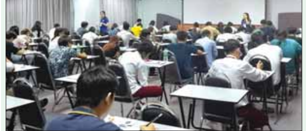
အောက်တိုဘာလကကျင်းပသည့် ITPEC စာမေးပွဲတွင် ဝင်ရောက်ဖြေဆိုနေသောလူငယ်များ။

c6-gD2Ns_cS1QDFJ0_gxg0 8WGX D712CxLh EtBzU8YYht2pjj/viewform?pli=1 သို့ ဝင်ရောက်ပြီး အခမ်းအနား တက်ရောက်ရန် မှတ်ပုံတင်ခြင်းကို ဒီဇင်ဘာ ၃၁ ရက် နောက်ဆုံးထား၍ ပြုလုပ်ရမည်ဖြစ်ကာ သင်တန်းကျောင်းများမှ အောင်မြင်သူများအနေဖြင့် မိမိတို့သက်ဆိုင်ရာ သင်တန်းကျောင်းများမှတစ်ဆင့် တက်ရောက်ရန် သတင်းပေးပို့ရမည်ဖြစ်သည်။ အခမ်းအနားတွင် အောင်လက်မှတ် တက်ရောက်မယူဖြစ်သူများအနေဖြင့်မူ ဇန်နဝါရီ ၈ ရက်မှစတင်ပြီး MICT Park အဆောင် (၁၄) ရှိ ရန်ကုန်တိုင်းဒေသကြီး ကွန်ပျူတာ ပညာရှင်အသင်းရုံးခန်း ဖုန်း-၀၁-၉၃၃၂၂၀၀ သို့မဟုတ် သက်ဆိုင်ရာသင်တန်းကျောင်းများတွင် လာရောက်ထုတ်ယူနိုင်ကြောင်း၊ အခြားပြည်နယ်/တိုင်းများမှ အောင်မြင်သူများအတွက် သက်ဆိုင်ရာ ပြည်နယ်/တိုင်းများရှိ အသင်းရုံးများသို့ ဆက်သွယ်ပြီး အောင်လက်မှတ်များ ထုတ်ယူနိုင်ကြောင်း သိရသည်။ ITPEC စာမေးပွဲများကို မြန်မာနိုင်ငံအတွင်း သတင်းအချက်အလက်နှင့်ဆက်သွယ်ရေးနည်းပညာ ဖွံ့ဖြိုးတိုးတက်ရေးအတွက် မြန်မာနိုင်ငံ ကွန်ပျူတာအသင်းချုပ်၏ ဦးဆောင်မှုဖြင့် မြန်မာနိုင်ငံကွန်ပျူတာပညာရှင်အသင်းက ကြီးမှူး၍ တစ်နှစ်လျှင် နှစ်ကြိမ် ဧပြီလနှင့် အောက်တိုဘာလတွင် ကျင်းပလျက်ရှိပြီး ၇၀ နှစ်နိုင်ငံအပါအဝင် နိုင်ငံခုနှစ်ခုက အသိအမှတ်ပြုသည့် စာမေးပွဲဖြစ်သောကြောင့် စိတ်ဝင်စား ဖြေဆိုသူများပြားသည့် စာမေးပွဲဖြစ်သည်။ အောက်တိုဘာလက စာမေးပွဲများကို ရန်ကုန်တိုင်းဒေသကြီး၊ မန္တလေးတိုင်းဒေသကြီး၊ မကွေးတိုင်းဒေသကြီးနှင့် ကရင်ပြည်နယ်တို့တွင် ကျင်းပခဲ့ရာ IT Passport စာမေးပွဲတွင် ၇၅၁ ဦး၊ FE စာမေးပွဲတွင် ၇၃၈ ဦးနှင့် AP စာမေးပွဲတွင် ၄၆၆ ဦး ဝင်ရောက်ဖြေဆိုခဲ့ကြောင်း သိရသည်။