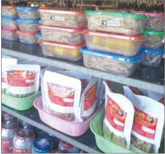
မိုးယွန်းကြီး ငါးပိငါးခြောက်လုပ်ငန်းမှ ထုတ်လုပ်ထားသော စားသောက်ကုန်များ။

နည်းပညာပေးသင်တန်းများဖွင့်လှစ် တိုင်းဒေသကြီး စားသုံးသူရေးရာဦးစီး ဌာနသည် သက်ဆိုင်ရာဌာန၊ အဖွဲ့အစည်း များနှင့် ပူးပေါင်းကာ တိုင်းဒေသကြီး အတွင်းရှိ အသေးစား၊ အလတ်စား စီးပွားရေးလုပ်ငန်းများကို အသိပညာ ပေးဆွေးနွေးပွဲများ၊ ဟောပြောပွဲများ ဆောင်ရွက်ခဲ့သည့်အပြင် လုပ်ငန်းများ ထုပ်ပိုးစနစ် တိုးတက်စေရေးအတွက် လည်း နည်းပညာပေးသင်တန်းများဖြင့်