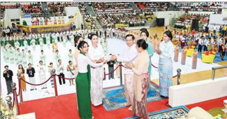
နိုင်ငံတော်စီမံအုပ်ချုပ်ရေးကောင်စီဥက္ကဋ္ဌ နိုင်ငံတော်ဝန်ကြီးချုပ် ဗိုလ်ချုပ်မှူးကြီး မင်းအောင်လှိုင်နှင့်စနီး ဒေါ်ကြူကြူလှ ကပြပေးနေကြသည့် ကျောင်းသားကျောင်းသူများအား ချီးမြှင့်ငွေများ ပေးအပ်ချီးမြှင့်စဉ်

စာမတ်နှာ ၃ မှ ကမ္ဘာကြီး၏ မျက်မှောက်အခြေအနေအရပင် ဖြစ်စေ၊ မိမိတို့နိုင်ငံ၏ ပကတိအရိတ်တရားအရဖြစ်စေ ပြည်ထောင်စုမပြိုကွဲရေး၊ တိုင်းရင်းသားစည်းလုံးညီညွတ်မှုမပြိုကွဲရေးနှင့် အချုပ်အခြာအာဏာ တည်တံ့ခိုင်မြဲရေးသည် အလိုအပ်ဆုံးနှင့် အဖြစ်သင့်ဆုံး အမျိုးသားရေးတော်ဝင်ပင် ဖြစ်ပါကြောင်း။ နည်းလမ်းပေါင်းစုံဖြင့် ချဉ်းကပ်ဆောင်ရွက်နေစေအေးဆေးနှောင့်ယှက်နိုင်ကာလများတွင် အင်အားကြီးသည့်နိုင်ငံကြီးများသည် အင်အားနည်းသည့် နိုင်ငံငယ်များအပေါ် ထိန်းချုပ်မြယ်လုပ်နိုင်ရေးနှင့် သို့မဟုတ် ဩဇာလွှမ်းမိုးနိုင်စေရန် နိုင်ငံရေး၊ စီးပွားရေး၊ ယဉ်ကျေးမှု၊ ကမ္ဘာ့ဗဟိုဗဟိုဗဟိုဗဟိုဗဟို နည်းလမ်းပေါင်းစုံဖြင့် ချဉ်းကပ်ဆောင်ရွက်နေကြသည်ကို အားလုံးအသိပင် ဖြစ်ပါကြောင်း။