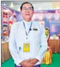
ဦးအောင်ဆန်းဦး(ပါမောက္ခချုပ်)

(၇၆)နှစ်မြောက် လွတ်လပ်ရေးနေ့ကြို ဆိုက်ပီပြသည့်အနေဖြင့် ကျင်းပသည့် လူငယ်နှင့်စာပေအနုပညာပွဲတော်ကို နေပြည်တော် ဝဏ္ဏသိဒ္ဓါကားစခန်း(၉)၅ ယနေ့ စည်ကားသိုက်မြိုက်စွာဖြင့် ဖွင့်လှစ်လိုက်ပြီဖြစ်သည်။ ကျောင်းသား ကျောင်းသူလူငယ်များ အသိပညာဗဟုသုတတိုးပွားလာစေရန်၊ စာပေတန်ဖိုးဖြင့် ဘက်စုံဖွံ့ဖြိုးသည့် လူငယ်လူရွယ်များ ပေါ်ထွက်လာစေရန်အတွက် ရည်ရွယ်ချက်ပေးသည့် အဆိုပါပွဲတော်ကြီးတွင် ဝန်ကြီးဌာန၊ တက္ကသိုလ်၊ အခြေခံပညာကျောင်းများအလိုက် ပြခန်းများကို ခင်းကျင်းပြသထားရာ ကျောင်းသား ကျောင်းသူလူငယ်များ စိတ်ပါဝင်စားစွာ လာရောက်လေ့လာနေကြည့်သလိုမျိုး တွေ့ရသည်။ ထိုသို့ ပြခန်းများပြသဆောင်ရွက်မှုများနှင့် ပတ်သက်၍ သက်ဆိုင်ရာပြခန်းများ စာပေတန်ဖိုးရှိသူများနှင့် လာရောက်လေ့လာကြည့်သည့် ကျောင်းသားလူငယ်များ၏ စကားသံများကို စုစည်းဖော်ပြအပ်ပါသည်။