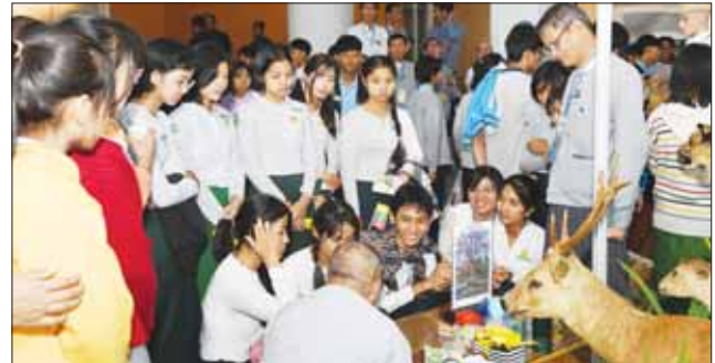
သယံဇာတနှင့် သဘာဝပတ်ဝန်းကျင်ထိန်းသိမ်းရေးဝန်ကြီးဌာန ပြခန်း၌ ကျောင်းသား ကျောင်းသူ လူငယ်များ စိတ်ဝင်တမ်းစွာကြည့်ရှုလေ့လာနေကြသည်ကို တွေ့ရစဉ်။

နှင့် ကျောက်စာများပြခန်း၊ အမျိုးသားစာကြည့်တိုက်ပြခန်း၊ စီမံရေးရာဌာန၊ ထိန်းသိမ်းကာကွယ်ခြင်းနှင့် မြန်မာ့နိုင်ငံ၏ အဓိကဂေဟစနစ်ကြီးများပြခန်း၊ သစ်တောသစ်ပင်ဆိုင်ရာ အသိပညာပေးပြခန်း၊ နိုင်ငံအတွင်းနေထိုင်သူ အသက် ၁၀ နှစ်အထက်ရှိ နိုင်ငံသားများအား ကိုယ်ရေးအချက်အလက်စိစစ်ဆက်သွယ်မှုပြခန်း၊ နိုင်ငံအတွင်းနေထိုင်သူ အသက် ၁၀ နှစ်အထက်ရှိ နိုင်ငံသားများအား ကိုယ်ရေးအချက်အလက်စိစစ်ဆက်သွယ်မှုပြခန်း၊ အခြေခံပညာနှင့် အဆင့်မြင့်ပညာကဏ္ဍပြခန်း၊ လူပုဂ္ဂိုလ်စီကားနှင့်ပညာဆိုင်ရာပြခန်း၊ ရွှေလူငယ်သိပ္ပံနှင့် နည်းပညာပြခန်း၊ နည်းပညာတက္ကသိုလ်များ၏ ကဏ္ဍအလိုက် ဆုသစ်တီထွင်မှုပြခန်း၊ ကျန်းမာရေးလူစွမ်းအားအရင်းအမြစ်ဦးစီးဌာန တက္ကသိုလ်နှင့် သင်တန်းကျောင်းများမှ လူငယ်ဆိုင်ရာ လှုပ်ရှားပုံစံပြခန်း၊ လူငယ်များ သိသင့်သိထိုက်သည့်အားကစားနှင့်လူငယ်ရေးရာပြခန်းနှင့် E-Sports ပြခန်း၊ ဟိုတယ်နှင့် ခရီးသွားလာရေးလုပ်ငန်းကဏ္ဍ တိုးတက်ကျယ်ပြန့်စေရန် ဆောင်ရွက်ထားရှိမှု စတင်တမ်းစာတစ်ခုများပြခန်းနှင့် တိုင်းရင်းသားစာပေနှင့် ယဉ်ကျေးမှုပြခန်းတို့ကို စင်ကျင်းပြသထားသည်။