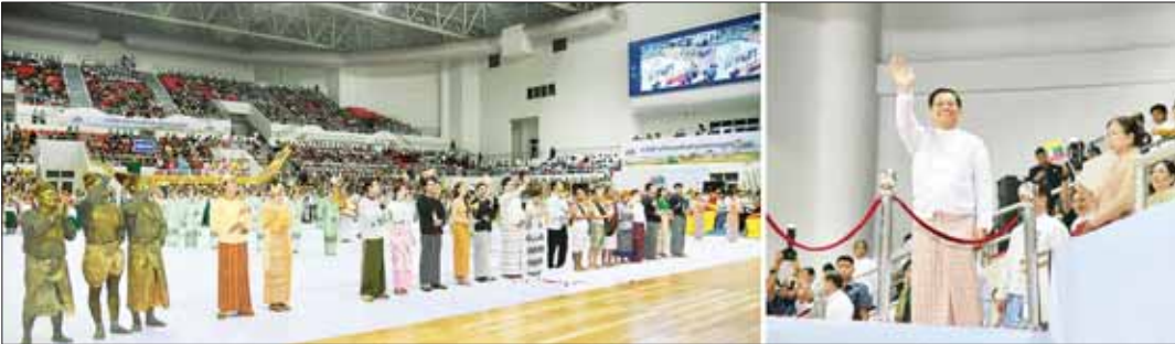
နိုင်ငံတော်စီမံအုပ်ချုပ်ရေးကောင်စီဥက္ကဋ္ဌ နိုင်ငံတော်ဝန်ကြီးချုပ် ဗိုလ်ချုပ်မှူးကြီး မင်းအောင်လှိုင် (၇၆)နှစ်မြောက် လွတ်လပ်ရေးနေ့အထိမ်းအမှတ် လူငယ်နှင့်စာပေအနုပညာပွဲတော်ပွင့်ပွဲအခမ်းအနားတွင် သီချင်းကပြပေးနေကြသူများအား ရင်းရင်းနှီးနှီးနှုတ်နှုတ်အားပေးခြင်း

စာမတ်နှာ ၃ မှ ကမ္ဘာကြီး၏ မျက်မှောက်အခြေအနေအရပင် ဖြစ်စေ၊ မိမိတို့နိုင်ငံ၏ ပကတိအရိတ်တရားအရဖြစ်စေ ပြည်ထောင်စုမပြိုကွဲရေး၊ တိုင်းရင်းသားစည်းလုံးညီညွတ်မှုမပြိုကွဲရေးနှင့် အချုပ်အခြာအာဏာ တည်တံ့ခိုင်မြဲရေးသည် အလိုအပ်ဆုံးနှင့် အဖြစ်သင့်ဆုံး အမျိုးသားရေးတော်ဝင်ပင် ဖြစ်ပါကြောင်း။ နည်းလမ်းပေါင်းစုံဖြင့် ချဉ်းကပ်ဆောင်ရွက်နေစေအေးဆေးနှောင့်ယှက်နိုင်ကာလများတွင် အင်အားကြီးသည့်နိုင်ငံကြီးများသည် အင်အားနည်းသည့် နိုင်ငံငယ်များအပေါ် ထိန်းချုပ်မြယ်လုပ်နိုင်ရေးနှင့် သို့မဟုတ် ဩဇာလွှမ်းမိုးနိုင်စေရန် နိုင်ငံရေး၊ စီးပွားရေး၊ ယဉ်ကျေးမှု၊ ကမ္ဘာ့ဗဟိုဗဟိုဗဟိုဗဟိုဗဟို နည်းလမ်းပေါင်းစုံဖြင့် ချဉ်းကပ်ဆောင်ရွက်နေကြသည်ကို အားလုံးအသိပင် ဖြစ်ပါကြောင်း။