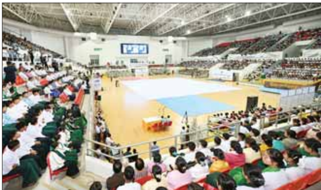
နိုင်ငံတော်စီမံအုပ်ချုပ်ရေးကောင်စီဥက္ကဋ္ဌ နိုင်ငံတော်ဝန်ကြီးချုပ် ဗိုလ်ချုပ်မှူးကြီး မင်းအောင်လှိုင် (၇၆)နှစ်မြောက် လွတ်လပ်ရေးနေ့အထိမ်းအမှတ် လူငယ်နှင့်စာပေအနုပညာပွဲတော်ဖွင့်ပွဲအခမ်းအနားတွင် အမှာစကား ပြောကြားစဉ်။

✦ ရှေးမှီမှ လူငယ်နှင့်စာပေအနုပညာပွဲတော်ကို စက်ဝလတ်နှိပ်ဖွင့်လှစ်ပေးပြီး သာသနာရေးနှင့် ယဉ်ကျေးမှုဝန်ကြီးဌာန အပညာဒီဇိုင်းဌာနမှ အနုပညာရှင်ကလေး လူငယ်နှင့်စာပေအနုပညာ တေးသီချင်းဖြင့် စုပေါင်းကပြဖော်ပြောအား ကြည့်ရှုအားပေးသည်။ အထိမ်းအမှတ်အခမ်းအနားကြီးဖြစ် ယင်းနေ့က နိုင်ငံတော်စီမံအုပ်ချုပ်ရေးကောင်စီဥက္ကဋ္ဌ နိုင်ငံတော်ဝန်ကြီးချုပ်က အမှာစကား ပြောကြားရာတွင် ယနေ့အခမ်းအနားသည် မိမိတို့နိုင်ငံ၏အထွတ်အမြတ်ဖြစ်သည့် လွတ်လပ်ရေးနေ့ကို ကြိုဆိုရုံမက ပြည်သူ့အခမ်းအနားဖြစ်သကဲ့သို့ လွတ်လပ်ရေးရရှိအောင် ကြံစည်ကြိုးပမ်းအားထုတ်ခဲ့ကြသည့် မိမိတို့၏ တိုးတိုးမီဘာများကို ပြန်လည်အမှတ်ရရုတ်ပြုသည့် အထိမ်းအမှတ်အခမ်းအနားကြီးဖြစ်သဖြင့် အင်မတန်ကျက်သရေရမာန်ရှိသည့် အခမ်းအနားကြီးတစ်ခု ဖြစ်သည်ကို ဂုဏ်ယူပြောကြားလိုပါကြောင်း။ အားလုံးသိကြသည့်အတိုင်း မြန်မာနိုင်ငံလံးမိုင်းဖြစ်ရပ်မှန်များကို ဆန်းစစ်လိုက်ပါက နယ်ချဲ့တို့၏