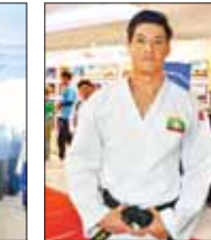
မောင်လရောင်

ဦးအောင်ဆန်းဦး(ပါမောက္ခချုပ်) ယဉ်ကျေးမှုနှင့် အနုပညာတက္ကသိုလ်(ဓမ္မလေး) (၇၆) နှစ်မြောက် လွတ်လပ်ရေးနေ့အကြို လူငယ်နှင့် စာပေအနုပညာပွဲတော်ကို နိုင်ငံတော် အဆင့် စည်စည်ကားကား သိုက်သိုက်မြိုက်မြိုက်နဲ့ ကျင်းပဆောင်ရွက်လာတာ လူငယ်တွေအတွက် အင်မတန်မှ ဝမ်းမြောက်စရာပဲလို့လည်းကောင်း၊ မြန်မာနိုင်ငံတော်ရှိ အနာဂတ်မျိုးဆက်သစ် လူငယ်တွေကို ရည်ရွယ်ပြီးတွေ့ ရွာနဲ့ဆိုင်ရာအသိပညာပေးပြီး တော့ပြခန်းတွေပြသပေးတယ်၊ ပညာပေးအစီအစဉ် တွေ ဆောင်ရွက်ပေးတယ်။ ဒါတွေက ကျွန်တော်တို့ နိုင်ငံအနာဂတ်မှာ ခေါင်းဆောင်ကြမယ့် လူငယ်တွေအတွက် အင်မတန်ကောင်းမွန်တဲ့ အစီအစဉ်တွေ ဖြစ်ပါတယ်။ လူငယ်တွေအနေနဲ့လည်း ယနေ့ လူငယ် နေထိုင်ပုံစံအတိုင်းကို ကိုယ့်နိုင်ငံရဲ့ သမိုင်းကြောင်းတွေ၊ ဖြစ်ပေါ်တိုင်းတွေကို အသိပညာ အတတ်ပညာတွေကို ပြသတဲ့ ဒီပြခန်းတွေကို ကြည့်ရှုလေ့လာရခြင်းအားဖြင့် ကိုယ့်တိုင်းပြည်ကို ပိုမိုတိုးတက်ကောင်းမွန်အောင် ဘယ်လိုဆောင်ရွက် ရမယ်ဆိုတဲ့ စိတ်ကူးစိတ်သန်းကောင်းတွေရှိတဲ့ နိုင်ငံတော်ကြီး၊ တည်ဆောက်မှုအတွက် အားအင် တစ်ခုဖြစ်လာမယ့်လို့ မြင်ပါတယ်။ အခုလို ပွဲတော် တွေမှာ ဓမ္မလေးယဉ်ကျေးမှုနှင့် အနုပညာတက္ကသိုလ် အနေနဲ့ ပါဝင်ပြသခွင့်ရတာကိုလည်း ကျန်းမာစွာ တာဝန်ယူ ပြခန်းတော်တို့ ပြခန်းမှာ တက္ကသိုလ်မှာ သင်ကြားပေးနေတဲ့ ဂီတပညာ၊ သာဓကပညာ၊ ယဉ်ကျေးမှု ပညာစနစ်ပညာ၊ ရုပ်ရှင်နဲ့ ပြဇာတ်ပညာတာဝန် ရှိတဲ့ တက္ကသိုလ် ပြခန်းတော် ပြသထားပါတယ်။ နိုင်ငံတစ်နိုင်ငံမှာ ယဉ်ကျေးမှု ချော့ရစ် လူမျိုးများကတော့ အထူးအထူး ပါ။ ယဉ်ကျေးမှုနိမ့်ပါးစဉ် လူမျိုးနိမ့်ပါးတာပါ။ ဒါကြောင့်မို့ အနာဂတ်မျိုးဆက်သစ်တွေကို