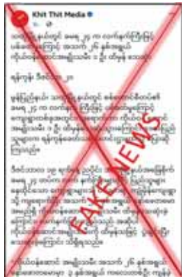
ရည်ရွယ်၍ လူမှုကွန်ရက်တွင် မဟုတ်မမှန် ရေးသားဖြန့်ဝေနေခြင်းသာဖြစ်ကြောင်း သတင်းရရှိသည်။ သတင်းစဉ်

အဆိုပါသတင်းနှင့် ပတ်သက်၍ သက်ဆိုင်ရာ နယ်မြေလုံခြုံရေး တာဝန်ရှိသူတစ်ဦးနှင့် ဒေသခံများ၏ ပြောကြားချက်များအရ ဒီဇင်ဘာ ၁၉ ရက်တွင် တပ်မတော်မှ မည်သည့်ပစ်ခတ်မှုမရှိခဲ့ဘဲ အကြမ်းဖက်သောင်းကျန်းသူများက လက်နက်ကြီးပစ်ခတ်မှုများရှိခဲ့ကြောင်း သိရှိရသည်။ တပ်မတော်အနေဖြင့် ပြည်သူများနေထိုင်သော ကျေးရွာများသို့ မည်သည့်အခါမှ လက်နက်ကြီးဖြင့် ပစ်ခတ်မှုမရှိကြောင်း တရားမဝင် ပြည်ပျက်မီဒီယာ Khit Thit က တပ်မတော်သားများနှင့် ဒေသခံတိုင်းရင်းသားများအကြား အထင်အမြင်လွှဲယောင်းစေရန်