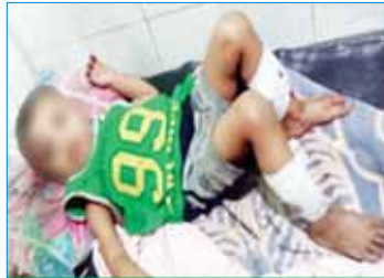
ကျောက်ခဲမြို့နယ် သူ့အဖွဲ့ကကျော့စားအတွင်းသို့ PDF အမည်ခံ အကြမ်းဖက်သမားများက Drone အသုံးပြု၍ Drop Bomb များ ဖန်ဖျက်ခိုက်ခတ်ခဲ့မှုကြောင့် ထိခိုက်ဒဏ်ရာရရှိခဲ့သည့် ကလေးငယ်။

Drop Bomb တစ်လုံး ကျရောက်ပေါက်ကွဲခဲ့ရာ အဆိုပါကျော့စား