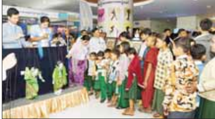
သာသနာရေးနှင့် ယဉ်ကျေးမှုဝန်ကြီးဌာန ပြခန်း၌ ကျောင်းသား ကျောင်းသူ လူငယ်များ စိတ်ဝင်တမ်းစွာ ကြည့်ရှုလေ့လာနေကြသည်ကို တွေ့ရစဉ်။

ဉာဏ်ရည်ဉာဏ်ဆွေးနွေး အယူအဆများ ထက်မြက်လာစေရေးအတွက် စာအုပ်စာပေများကို တန်ဖိုးထားဖတ်ရှုလိုစိတ် ပြစေပါလိမ့်မည်နှင့် လူငယ်များ စာပေနှင့် ရင်းနှီးပြီး စာပေ၏အကျိုးကျေးဇူးကို သိရှိနိုင်စေရန်၊ စာပေနှင့်အနုပညာမှတ်တမ်းစာတစ်ခုနှင့်အမျိုးမျိုး၏ စာတိုလက်ဖြင့်မားမောပြီး လွတ်လပ်ရေးကြိုးပမ်းမှု သမိုင်းကြောင်းများကို လိုလက်အောင်ဆောင်ရွက်ပေးရန်အတွက် တွေ့ကြုံခံစားရမှုများကို သိမြင်စေကာ မိမိတို့နိုင်ငံ၏ လွတ်လပ်ရေးကို လေးစားတန်ဖိုးထား တတ်စေရန်၊ စာတတ်အနုပညာပြပွဲမှ တစ်ဆင့် မြန်မာနိုင်ငံ၏ အေးချမ်းသာယာခြင်း မှု သာယာလှပမှုနှင့် ဖွံ့ဖြိုးတိုးတက်မှုများ ချစ်စဖွယ် ကျေးလက်ဒေသအယူအဆများကို သိမြင်စေပြီး မိမိတို့၏ တိုင်းဒေသကြီး/ပြည်နယ်များအပေါ် မြတ်နိုးတန်ဖိုးထား စိတ်များ ပြစ်ပေါ်လာစေရန်နှင့် ပြခန်းများ ခင်းကျင်းပြသမှုများမှတစ်ဆင့် ဝန်ကြီးဌာနအသီးသီးက ဆောင်ရွက်လျက်ရှိသော လုပ်ငန်းများကို အလွယ်တကူ သိမြင်နိုင်စေရန် ရည်ရွယ်ချက်များဖြင့် ကျင်းပခြင်း ပြုခဲ့ပါသည်။