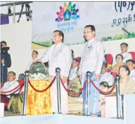
နိုင်ငံတော်စီမံအုပ်ချုပ်ရေးကောင်စီဥက္ကဋ္ဌ နိုင်ငံတော်ဝန်ကြီးချုပ် ဗိုလ်ချုပ်မှူးကြီးမင်းအောင်လှိုင် (၇၆)နှစ်မြောက် လွတ်လပ်ရေးနေ့အထိမ်းအမှတ် လူငယ်နှင့်စာပေအနုပညာပွဲတော်ကို စက်ဝလှတ်နှိပ် ဖွင့်လှစ်ပေးစဉ်။