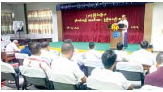
ကုန်စည်နှင့်အဖွဲ့အစည်းတက်သက်စာအုပ်အဖွဲ့အစည်းအဖွဲ့ဝင်များသည် ကုန်စည်စီးဆင်းမှု မှန်ကန်မြန်ဆန်မှုသာလျှင် ကုန်ဈေးနှုန်းတိုးမြှင့်ကာ ထိုက်သင့်သော ဈေးနှုန်း ရရှိမည်ဖြစ်ကြောင်း ကုန်စည်စီးဆင်းမှု မှန်ကန်အောင် လုပ်ဆောင်စေလိုကြောင်း ပြောကြားသည်။ အသင်းသူ အသင်းသားများအနေဖြင့် ပဲခူး၊ မြို့ကို ပြည်ပသို့ တင်ပို့နေသူများဖြစ်ကြောင်း၊ ဘုရင့်နောင်ကုန်စည်နှင့်အဖွဲ့အစည်းသည် ကုန်စည်စီးဆင်းရာတွင် အဓိကနေရာမှ တာဝန်ယူဆောင်ရွက်နေသည့် အသင်းဝင်ကုန်စည်နှင့်အဖွဲ့အစည်းဖြစ်ကြောင်း၊ လယ်ယာထွက်ကုန်စည်များကို အဓိကထား ရောင်းဝယ်ရာတွင် စိုက်ပျိုးထုတ်လုပ်သူ တောင်သူ လယ်သမားများ၏ အကျိုးစီးပွားဖြစ်ထွန်းရေးကို ရှေးရှုကာ ရောင်းဝယ်ကြပါရန် မေတ္တာရပ်ခံလို ကြောင်း၊ ကုန်စည်စီးဆင်းမှု မှန်ကန်မြန်ဆန်မှုသာလျှင် ကုန်ဈေးနှုန်းတိုးမြှင့်ကာ ထိုက်သင့်သော ဈေးနှုန်း ရရှိမည်ဖြစ်ကြောင်း ကုန်စည်စီးဆင်းမှု မှန်ကန်အောင် လုပ်ဆောင်စေလိုကြောင်း ပြောကြားသည်။ ကျွန်ုပ်တို့အဖွဲ့အစည်းသည် ကုန်စည်စီးဆင်းမှု မှန်ကန်မြန်ဆန်မှုသာလျှင် ကုန်ဈေးနှုန်းတိုးမြှင့်ကာ ထိုက်သင့်သော ဈေးနှုန်း ရရှိမည်ဖြစ်ကြောင်း ကုန်စည်စီးဆင်းမှု မှန်ကန်အောင် လုပ်ဆောင်စေလိုကြောင်း ပြောကြားသည်။ ကျွန်ုပ်တို့အဖွဲ့အစည်းသည် ကုန်စည်စီးဆင်းမှု မှန်ကန်မြန်ဆန်မှုသာလျှင် ကုန်ဈေးနှုန်းတိုးမြှင့်ကာ ထိုက်သင့်သော ဈေးနှုန်း ရရှိမည်ဖြစ်ကြောင်း ကုန်စည်စီးဆင်းမှု မှန်ကန်အောင် လုပ်ဆောင်စေလိုကြောင်း ပြောကြားသည်။

အသင်းဝင် ကုန်သည်ကြီးများသည်လည်း ပဲခူး၊ မြို့ကို ပြည်ပသို့ တင်ပို့နေသူများဖြစ်ကြောင်း၊ ဘုရင့်နောင်ကုန်စည်နှင့်အဖွဲ့သည် ကုန်စည်စီးဆင်းရာတွင် အဓိကနေရာမှ တာဝန်ယူဆောင်ရွက်နေသည့် အသင်းဝင်ကုန်စည်နှင့်အဖွဲ့အစည်းဖြစ်ကြောင်း၊ လယ်ယာထွက်ကုန်စည်များကို အဓိကထား ရောင်းဝယ်ရာတွင် စိုက်ပျိုးထုတ်လုပ်သူ တောင်သူ လယ်သမားများ၏ အကျိုးစီးပွားဖြစ်ထွန်းရေးကို ရှေးရှုကာ ရောင်းဝယ်ကြပါရန် မေတ္တာရပ်ခံလို ကြောင်း၊ ကုန်စည်စီးဆင်းမှု မှန်ကန်မြန်ဆန်မှုသာလျှင် ကုန်ဈေးနှုန်းတိုးမြှင့်ကာ ထိုက်သင့်သော ဈေးနှုန်း ရရှိမည်ဖြစ်ကြောင်း ကုန်စည်စီးဆင်းမှု မှန်ကန်အောင် လုပ်ဆောင်စေလိုကြောင်း ပြောကြားသည်။ ထို့နောက် ၂၀၂၂ ခုနှစ် ဗဟိုအလုပ်အမှုဆောင် အဖွဲ့၏အစီရင်ခံစာနှင့် ငွေစာရင်းရှင်းတမ်းကို ဖတ်ကြားတင်ပြပြီး အတည်ပြုချက်ရယူကာ အသင်း ဥက္ကဋ္ဌက နိဂုံးချုပ်အမှာစကား ပြောကြားသည်။ ဘုရင့်နောင်ကုန်စည်နှင့်အဖွဲ့ ဖြည့်တွင်းရှိ