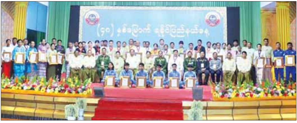
၂၀၂၂ ခုနှစ်က ကျင်းပခဲ့သည့် (၄၈)နှစ်မြောက် ရခိုင်ပြည်နယ်နေ့အခမ်းအနား။

ခေတ်ကာလတစ်လျှောက်လုံး လွှတ်တော်မှနေ၍ ဥပဒေဘောင်အတွင်းမှ အရေးဆို တောင်းဆိုခဲ့ကြသော်လည်း ပြည်နယ်ရရှိခဲ့။ တော်လှန်ရေးကောင်စီအစိုးရလက်ထက် မြန်မာ့ဆိုရှယ်လစ်လမ်းစဉ်ပါတီ၏ ဦးဆောင်မှုဖြင့် ရေးဆွဲခဲ့သော ၁၉၇၄ ခုနှစ် အခြေခံဥပဒေပြဋ္ဌာန်းချက်အရ ရခိုင်ပြည်နယ်ဖြစ်ပေါ်လာခဲ့ခြင်း ဖြစ်သည်။ ၁၉၇၄ ခုနှစ် ဖွဲ့စည်းပုံအခြေခံဥပဒေပြဋ္ဌာန်းချက်အရ ရခိုင်တိုင်းကို ရခိုင်ပြည်နယ်အဖြစ် သတ်မှတ်ခဲ့ရာမှ ရခိုင်ပြည်နယ်ဟု ဖြစ်ပေါ်လာခဲ့ခြင်း ဖြစ်သည်။ ၁၉၇၄ ခုနှစ်တွင် စတင်ဖွဲ့စည်းခဲ့သော ပထမအကြိမ် ရခိုင်ပြည်နယ် ပြည်သူ့ကောင်စီသည် ၁၉၇၄ ခုနှစ်