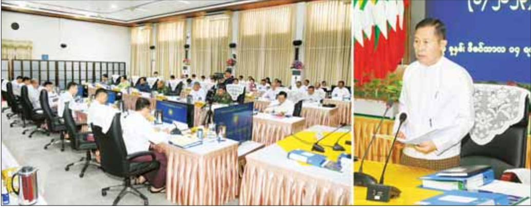
နိုင်ငံတော်စီမံအုပ်ချုပ်ရေးကောင်စီ ဒုတိယဥက္ကဋ္ဌ ဒုတိယဝန်ကြီးချုပ် ဒုတိယဗိုလ်ချုပ်မှူးကြီးစိုးဝင်း တရားမဝင်ကုန်သွယ်မှုတိုက်ဖျက်ရေးဦးဆောင်ကော်မတီ လုပ်ငန်းညှိနှိုင်းအစည်းအဝေး (၆/၂၀၂၃) တွင် အမှာစကားပြောကြားစဉ်။

နေပြည်တော် ဒီဇင်ဘာ ၁၄ တရားမဝင်ကုန်သွယ်မှုတိုက်ဖျက်ရေး ဦးဆောင် ကော်မတီ လုပ်ငန်းညှိနှိုင်းအစည်းအဝေး (၆/၂၀၂၃) ကို ယနေ့မွန်လွဲပိုင်းတွင် နေပြည်တော်ရှိ စီးပွားရေး နှင့် ကူးသန်းရောင်းဝယ်ရေးဝန်ကြီးဌာန ညီလာခံ ခန်းမ၌ကျင်းပရာ တရားမဝင်ကုန်သွယ်မှုတိုက်ဖျက် ရေး ဦးဆောင်ကော်မတီဥက္ကဋ္ဌ နိုင်ငံတော်စီမံအုပ်ချုပ် ရေးကောင်စီ ဒုတိယဥက္ကဋ္ဌ ဒုတိယဝန်ကြီးချုပ် ဒုတိယ ဗိုလ်ချုပ်မှူးကြီးစိုးဝင်း တက်ရောက်အမှာစကား ပြောကြားသည်။ အစည်းအဝေးသို့ ပြည်ထောင်စုဝန်ကြီးများ ဖြစ်ကြသည့် ဦးဝင်းရှိန်၊ ဒုတိယဗိုလ်ချုပ်ကြီး ရာပြည့် နှင့် ဦးထွန်းအံ့ ၊ ဒုတိယဝန်ကြီးများ၊ နေပြည်တော် ကောင်စီဝင်၊ အခွန်အယူခံခံအဖွဲ့ဥက္ကဋ္ဌ၊ အမြဲတမ်း အတွင်းဝန်များ၊ ညွှန်ကြားရေးမှူးချုပ်များနှင့် အသင်း အဖွဲ့များမှဥက္ကဋ္ဌများနှင့် တာဝန်ရှိသူများ တက်ရောက် ကြပြီး စာမျက်နှာ ၄ ကော်လံ ၁ ✨