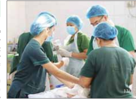
များကြောင်း၊ ကလေးကို မဖြစ်မနေဆံပင်ရိတ်မည်ဆိုပါက ကလေး မတ်မတ်ထိုင်သည့်အရွယ်ရောက်မှ ရိတ်စေလိုကြောင်းလည်း အကြံပြု ထားသည်။ MT

တော့သည့် အခြေအနေဖြစ်လာခဲ့ကြောင်း ဆေးရုံမှ သိရသည်။ ကလေးကို မွေးဆံပင်နှင့်မထားကောင်း၍ ဆံပင်ရိတ်စပ်ရမည်၊ ကလေးငယ်ဆံပင်ပါးနေ၍ ခေါင်းရိတ်ပေးရမည်ဟူသော အယူအဆ သည် မမှန်ကန်ကြောင်း၊ ကလေးကိုမြေခဲမနေ မွေးဆံပင်ရိတ်ပေးရမည် ဆိုသည့် အယူအဆက အများလက်ခံထားသည့်အယူအဆတစ်ရပ်သာ ဖြစ်ပြီး ကျန်းမာရေးအတွက် လိုအပ်သည့်အချက်တစ်ခုမဟုတ်ကြောင်း လည်း ဆေးရုံက အသိပေးထားသည်။ ကလေးငယ်များတွင် ၎င်းတို့၏အခွာကိုယ်အပူချိန်ကို ဦးခေါင်း ကနေ တစ်ဆင့်ထိန်းချုပ်ခြင်းကြောင့် မွေးဆံပင်ရိတ်လိုက်ချိန်တွင် ကလေးငယ်အနေဖြင့် အအေးမိ၊ နှာစေး၊ နှာပိတ်သည့်လက္ခဏာ များ အလွယ်တကူခံစားရနိုင်ကြောင်းလည်း ယင်းဆေးရုံက အသိပေး သည်။ ဇက်မခိုင်သေးသောကလေးကို ဆံပင်ရိတ်ခြင်းသည် ထိခိုက်နိုင်ခြေ