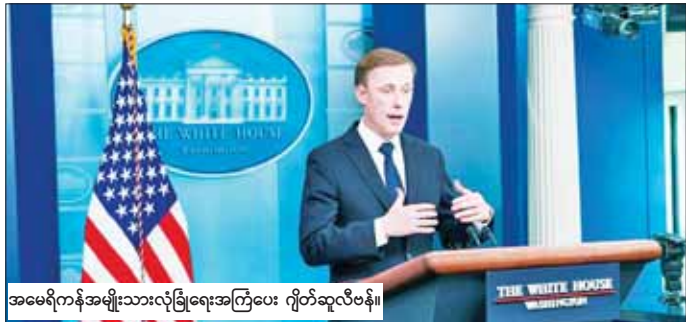
အမေရိကန်အမျိုးသားလုံခြုံရေးအကြံပေး ဂျိတ်ဆူလီဗန်။

ရက် နှစ်ရက်ကြာသွားရောက်မည်ဟု အမေရိကန် အဆင့်မြင့်အရာရှိတစ်ဦးက ပြောသည်။ ဂါဇာကမ်းမြောင်ဒေသနှင့် အစွဲရေးတို့တွင်