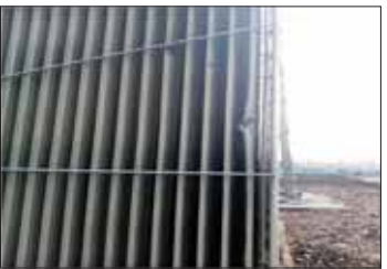
50 MVA အအေးခံကိရိယာ ပေါက်ပြဲမှု မှတ်တမ်းဓာတ်ပုံ။