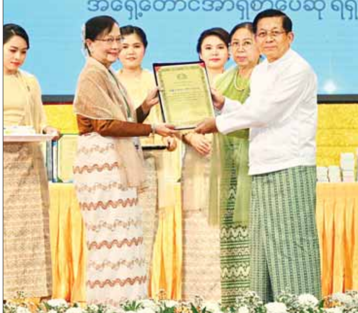
နိုင်ငံတော်စီမံအုပ်ချုပ်ရေးကောင်စီဥက္ကဋ္ဌ နိုင်ငံတော်ဝန်ကြီးချုပ် ဗိုလ်ချုပ်မှူးကြီး မင်းအောင်လှိုင်နှင့် ဇနီး ဒေါ်ကြူကြူလှ ၂၀၂၂ ခုနှစ်၊ အမျိုးသားစာပေတစ်သက်တာဆုရရှိသူ စာပေပညာရှင် ဆရာမကြီး ဒေါ်ခင်သန်းဝင်း (ကြူကြူသင်း) အား ဆုတံဆိပ် ပေးအပ်ချီးမြှင့်စဉ်။

မြန်မာစာပေလောကသည် ရှည်လျားသည့် မြန်မာ့သမိုင်းကြောင်းအဆက်ဆက်တွင် ထွန်းပြောင်ခိုင်မြဲခဲ့ပြီး နိုင်ငံနှင့်ပြည်သူကို အစဉ်ထာဝရ အကျိုးပြုလျက်ရှိ စာဆိုတော်တို့၏ ကလောင်သွားများသည် မြန်မာနိုင်ငံသမိုင်းတွင် တိုင်းပြည်၏ စစ်မှန်သည့် ခွန်အားများဖြစ်ခဲ့