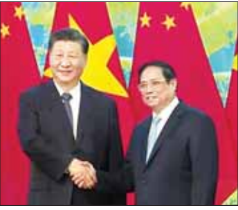
အမေရိကန်နိုင်ငံတို့သည် ပြီးပြည့်နေသော မဟာဗျူဟာမြောက်စိတ်ဓာတ်ဆက်ဆံရေးနှစ်နိုင်ငံဆက်ဆံရေးများ ဖြင့်တင်ရန် သဘောတူခဲ့ကြောင်း သိရသည်။ အင်နီအိတ်ချီကော

ဟန့်ရှင်း ဒီဇင်ဘာ ၁၃ တရုတ်နှင့် ဗီယက်နမ်နိုင်ငံတို့သည် နှစ်နိုင်ငံဆက်ဆံရေး ခိုင်မာအားကောင်းစေရန်အတွက် သဘောတူညီချက်များကို လက်မှတ်ရေးထိုးခဲ့ကြောင်း နိုင်ငံတကာသတင်းတစ်ရပ်တွင် ဖော်ပြထားသည်။ တရုတ်သမ္မတ ဂျီကျင်ဖိုင်သည် မြောက်နယ်အတွင်း ဗီယက်နမ်နိုင်ငံသို့ ပထမဆုံးအကြိမ် သွားရောက်လည်ပတ်ကာ ဗီယက်နမ်ခေါင်းဆောင်များနှင့် တွေ့ဆုံပြီး ခါဇင်နှင့်ချီသော သဘောတူညီချက်များကို ရယူနိုင်ခဲ့သည်။ ဂျီကျင်ဖိုင်သည် ၎င်း၏ဗီယက်နမ်နိုင်ငံခရီးစဉ် ဒုတိယမြောက်နေ့တွင် ဗီယက်နမ်ဝန်ကြီးချုပ် ဖန်မင်းချင်း၊ သမ္မတ ဗိုဗန်သောင်းတို့နှင့် တွေ့ဆုံခဲ့ကြောင်း သိရသည်။ တရုတ်နှင့် ဗီယက်နမ်နိုင်ငံတို့သည် သဘောတူညီချက် ၁၆ ချက်ကို လက်မှတ်ရေးထိုးခဲ့ကြောင်း ဗီယက်နမ်နိုင်ငံပိုင်မီဒီယာက ပြောသည်။ အဆိုပါသဘောတူညီချက်များထဲတွင် ဖူးတွဲစစ်ရေးကင်းလင်းညီညွတ်စွာ ဖွဲ့စည်းပေးပို့ပေးသော လက်မှတ်ရေးထိုးမှုများတွင် ပူးပေါင်းဆောင်ရွက်မှုအားကောင်းစေရန်နှင့် နယ်စပ်ဖြတ်ကျော် ရထားလမ်းများ တိုးတက်ဖြစ်ထွန်းရေးအစီအစဉ်များ ပါဝင်သည်။ တရုတ်သမ္မတ ဂျီကျင်ဖိုင်၏ ဗီယက်နမ်ခရီးစဉ်သည် စက်တင်ဘာလ အတွင်းက ဗီယက်နမ်နိုင်ငံသို့ အမေရိကန်သမ္မတ ဂျိုးဘိုင်ဒင်သွားရောက် လည်ပတ်ပြီးနောက် ထွက်ပေါ်လာခြင်း ဖြစ်သည်။ ဗီယက်နမ်နှင့်