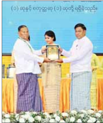
နိုင်ငံတော်စီမံအုပ်ချုပ်ရေးကောင်စီအဖွဲ့ဝင် ဗိုလ်ချုပ်ကြီး တင်အောင်စန်း စာပေဓါမာန်စာမူဆု ရရှိသူတစ်ဦးအား ဆုပေးအပ်ချီးမြှင့်စဉ်။