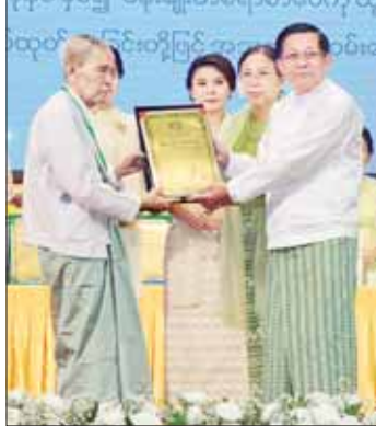
နိုင်ငံတော်စီမံအုပ်ချုပ်ရေးကောင်စီဥက္ကဋ္ဌ နိုင်ငံတော်ဝန်ကြီးချုပ် ဗိုလ်ချုပ်မှူးကြီး မင်းအောင်လှိုင်နှင့် ဇနီး ဒေါ်ကြာကြာလှ ၂၀၂၂ ခုနှစ်၊ အမျိုးသားစာပေတစ်သက်တာဆု ရရှိသူ စာပေပညာရှင် ဆရာကြီး ဒေါက်တာ ချစ်စံ (ချစ်စံဝင်း) အား ဆုတံဆိပ် ပေးအပ်ချီးမြှင့်စဉ်။