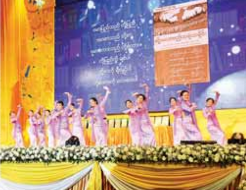
နိုင်ငံတော်စီမံအုပ်ချုပ်ရေးကောင်စီဥက္ကဋ္ဌ နိုင်ငံတော်ဝန်ကြီးချုပ် ဗိုလ်ချုပ်မှူးကြီး မင်းအောင်လှိုင်နှင့် ဇနီး ဒေါ်ကြူကြူလှ၊ အခမ်းအနားတက်ရောက်လာကြသူများ မြန်မာ့အသံနှင့် ရုပ်မြင်သံကြားမှ ဝန်ထမ်းများက “အမျိုးသားစာပေ ယဉ်ကျေးမှုအမွေ” စာပေဆုနှင့်သဘင် ဂုဏ်ပြုသီချင်းဖြင့် မျော်ဖြေတင်ဆက်မှုကို ကြည့်ရှုအားပေးစဉ်။