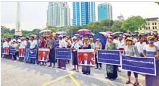
NUG၊ PDF (အလုံမရှိ)၊ မြန်မာ့ ကြေးကြော်သံများကို ပြည်တွင်းရေး (ဝင်မစွက်နဲ့)၊ ပြည် ကြေးကြော်ကြသည်။ တွင်းရေး စွက်ဖက်သူ (ဒီရန်သူ)၊ ယင်းနောက် အမျိုးသား မြန်မာနိုင်ငံ၏ အချုပ်အခြာ အာဏာနှင့် ပြည်တွင်းရေးကို ဝင်ရောက် စွက်ဖက်နေသော တီမောလက်စ်တေနိုင်ငံနှင့် ပြည်ပ နိုင်ငံများအား (ဆန့်ကျင်) ကြေးကြော်သံများကို သံဖြိုင် အဆိုပါ ဆန့်ကျင်ရှုတ်ချပွဲကို အမျိုးသားရေး တက်ကြွလှုပ်ရှား သူများအဖွဲ့က ဦးဆောင်ပြီး နိုင်ငံ ရေးပေးဖော်စပ်ထားသော အကြမ်းဖက် လုပ်ရပ်များအား ဆန့်ကျင်ကြ သည့် ပြည်သူများ ပူးပေါင်းပါဝင် ပြုလုပ်ခြင်းဖြစ်ကြောင်း သိရ သည်။ အောင်မြင်(မြန်/ဆက်)

ရေးဆွေးသည့်။ ထို့နောက် အခမ်းအနား တက်ရောက်လာကြသူများက နိုင်ငံတော် အချုပ်အခြာအာဏာ တည်တံ့ခိုင်မြဲရေး (ဒီအေရေး)၊ သာသနာ့ဖျက်အားပေး တီမော (အလုံမရှိ)၊ အကြမ်းဖက် တီမော (အလုံမရှိ)၊ အကြမ်းဖက်