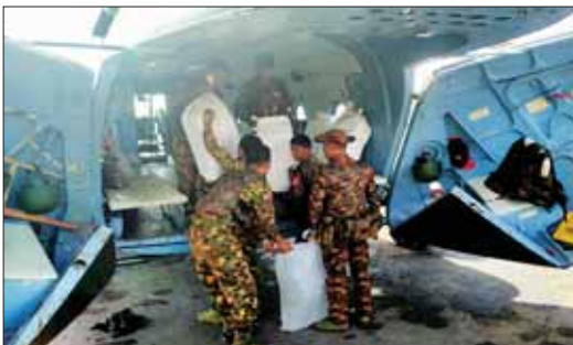
ထမင်းဘူးများကို ပေးအပ်လှူဒါန်း ကြရာ တာဝန်ရှိသူများက လက်ခံ ရဟတ်ယာဉ်များဖြင့် လုံခြုံရေး တပ်ဖွဲ့ဝင်များ၏ လက်ဝယ် သတင်းဆိုင်

ယနေ့တွင်လည်း စေတနာရှင် အလှူရှင် ပြည်သူများက အရှေ့ မြောက်တိုင်း စစ်ဌာနချုပ်နယ်မြေ အတွင်း နိုင်ငံတော်ကာကွယ် ရေးနှင့် လုံခြုံရေးတာဝန်များ ထမ်းဆောင်နေသည့် လုံခြုံရေး တပ်ဖွဲ့ဝင်များအတွက် ဒံပေါက်