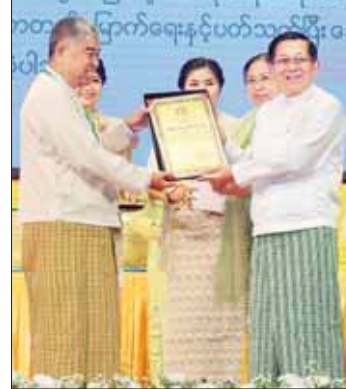
နိုင်ငံတော်စီမံအုပ်ချုပ်ရေးကောင်စီဥက္ကဋ္ဌ နိုင်ငံတော်ဝန်ကြီးချုပ် ဗိုလ်ချုပ်မှူးကြီး မင်းအောင်လှိုင်နှင့် ဇနီး ဒေါ်ကြာကြာလှ ၂၀၂၂ ခုနှစ်၊ အမျိုးသားစာပေတစ်သက်တာဆုရရှိသူ စာပေပညာရှင်ဆရာကြီး ဒေါက်တာ သန်းဦး (ပြည်စိုးမင်း) ကိုလည်း သန်းဦးဗိမာန်အေးအတွင်းရေးမှူး ဦးအေးကြိုင် အား ဆုတံဆိပ် ပေးအပ်ချီးမြှင့်စဉ်။