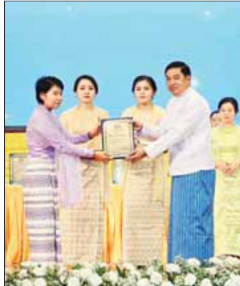
နိုင်ငံတော်စီမံအုပ်ချုပ်ရေးကောင်စီအဖွဲ့ဝင် ဒုတိယဗိုလ်ချုပ်ကြီး ညိုစော စာပေဓါမာန်စာမူဆု ရရှိသူတစ်ဦးအား ဆုပေးအပ်ချီးမြှင့်စဉ်။