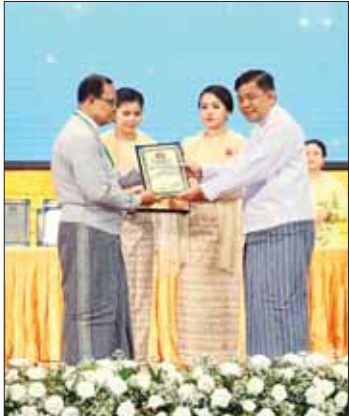
နိုင်ငံတော်စီမံအုပ်ချုပ်ရေးကောင်စီအဖွဲ့ဝင် ဗိုလ်ချုပ်ကြီး မောင်မောင်အေး စာပေဓါမာန်စာမူဆု ရရှိသူတစ်ဦးအား ဆုပေးအပ်ချီးမြှင့်စဉ်။