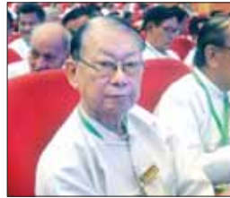
မောင်ငြိမ်းသူ (ကြိုလင်ကောက်)