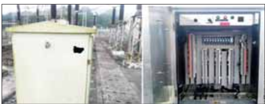
50 MVA Generator Circuit Breaker ပျက်စီးမှု မှတ်တမ်းဓာတ်ပုံ။

တွင် KNLA နှင့် PDF အမည်ခံ အကြမ်းဖက်သောင်းကျန်းသူများသည် မြဝတီမြို့နယ် သက်နီးညီနောင်ရှိ 230 KV ဓာတ်အားခွဲရုံကို Drone ဖြင့် Drop Bomb ပစ်ချတိုက်ခိုက်ခဲ့သည်။ ယင်းသို့