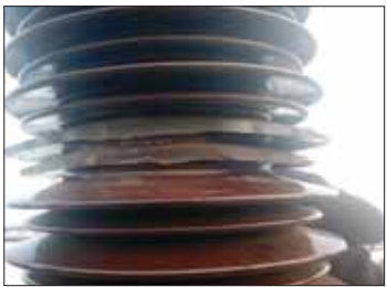
50 MVA ကြေးသီး နှစ်လုံးပျက်စီးမှု မှတ်တမ်းဓာတ်ပုံ။

နေပြည်တော် ဒီဇင်ဘာ ၁၃ အကြမ်းဖက်သောင်းကျန်းသူများသည် ပြည်သူလူထု၏ လူမှုစီးပွားဘဝထိခိုက်စေရန်နှင့် ဒေသတွင်း တည်ငြိမ်အေးချမ်းမှု ပျက်ပြားစေရန်အတွက် စစ်ရေးပစ်မှတ်မဟုတ်သည့် ဒီဇင်ဘာပိုင်အဆောက်အဦများ၊ အရပ်သားများ နေထိုင်ရာ ရပ်ကွက်များ၊ မြို့ရွာများ၊ ပညာရေးကျောင်းများ၊ သာသနာ့အဆောက်အဦများကို ရည်ရွယ်ချက်ရှိရှိဖြင့် တိုက်ခိုက်ဖျက်ဆီးခြင်းများ ပြုလုပ်လျက်ရှိသည့်အပြင် ဆက်သွယ်ရေး တာဝါတိုင်များနှင့် လျှပ်စစ်ဓာတ်အားပေးတာဝါတိုင်များ၊ စက်ရုံများကို ဖျက်ဆီးခြင်းများ ပြုလုပ်လျက်ရှိသည်။ ထိုသို့ လုပ်ဆောင်လျက်ရှိရာ ယနေ့ နံနက် ၆ နာရီ ၁၅ မိနစ်ခန့်