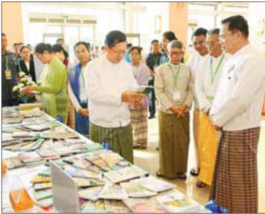
နိုင်ငံတော်စီမံအုပ်ချုပ်ရေးကောင်စီဥက္ကဋ္ဌ နိုင်ငံတော်ဝန်ကြီးချုပ် ဗိုလ်ချုပ်မှူးကြီး မင်းအောင်လှိုင်နှင့် ဇနီး ဒေါ်ကြူကြူလှ၊ အဖွဲ့ဝင်များ ခင်းကျင်းပြသထားသည့် ဆုရရှိသူများ၏ အတ္ထုပ္ပတ္တိ၊ ဓာတ်ပုံ၊ ဆုရတနာအုပ်များနှင့် စာအုပ်စာစောင်များကို လှည့်လည်ကြည့်ရှုစဉ်။

စာပေသည် အနုပညာအားလုံး၏ ကိန်းဝပ်ရာ၊ ဂီတ၊ ရုပ်ရှင်၊ သဘင်စသည့် အနုပညာနယ်ပယ်များ ပြာထွက်ရာ ပင်းခင်းနယ်ပယ်ကြီးဖြစ်သည့်အတွက် အမျိုးသားယဉ်ကျေးမှုအစုတို့ ပုံရိပ်ထင်ရာ အရင်းအမြစ်လည်းဖြစ်ပါကြောင်း၊ မြန်မာ့သမိုင်း၊ မြန်မာ့စိတ်ထားတို့ကို နိုင်ငံတကာသိအောင် ဖော်ပြနိုင်သည့် ဆက်သွယ်ရေးကြားခံတစ်ခုလည်း ဖြစ်ပါကြောင်း။