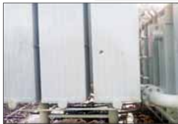
20 MVA အအေးခံကိရိယာ ပျက်စီးမှု မှတ်တမ်းဓာတ်ပုံ။

ယခုကဲ့သို့ အကြမ်းဖက်လုပ်ရပ်များကြောင့် ဒေသပြည်သူလူထု၏ လူမှုစီးပွားဘဝများစွာ ထိခိုက်စွာ ဖြစ်ပေါ်ခဲ့ကြောင်းနှင့် လုံခြုံရေးတပ်ဖွဲ့ဝင်များအနေဖြင့် ဒေသတည်ငြိမ် အေးချမ်းရေးအတွက် စစ်ဆင်ရေးကို ပြည်သူလူထုနှင့် ပူးပေါင်း၍ ဆက်လက်ဆောင်ရွက်သွားမည်ဖြစ်ကြောင်း သတင်းရရှိသည်။ သတင်းစဉ်