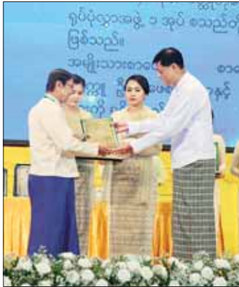
နိုင်ငံတော်စီမံအုပ်ချုပ်ရေးကောင်စီအဖွဲ့ဝင် ဗိုလ်ချုပ်ကြီး မြထွန်းဦး အမျိုးသားစာပေဆု ရရှိသူတစ်ဦးအား ဆုပေးအပ်ချီးမြှင့်စဉ်။