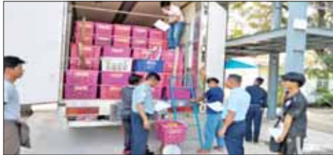
များ အဓိကတင်သွင်းလျက်ရှိပြီး ဒီဇင်ဘာ ၁၂ ခြင်းနှင့် ဆပ်ပြာတို့ တင်သွင်းခဲ့သည်။ ရက်တွင် ဓာတ်ဆီ၊ ဒီဇယ်၊ မီးခံအုတ်၊ ကျွန်ုပ်တို့ ထိုင်းနိုင်ငံသုံး ဘတ်ငွေလဲနှုန်းအနေဖြင့် အနီးပြား၊ ဘီလပ်မြေ၊ မျက်နှာကြက်ပြား၊ ဒီဇင်ဘာ ၁၂ ရက်တွင် ကျပ်တစ်သိန်းလျှင် ဘဝဂျာတစ်ဖြစ်ပေါ်ခဲ့သည်။ (DOT တာချီလိတ်)

တာချီလိတ် ကုန်သွယ်ရေးစခန်းအနေဖြင့် ထိုင်းနိုင်ငံ၊ တရုတ်နိုင်ငံများနှင့် ကုန်သွယ်မှု လုပ်ငန်းများ ဆောင်ရွက်လျက်ရှိရာ ၂၀၂၃-၂၀၂၄ ဘဏ္ဍာနှစ် (ဒီဇင်ဘာ ၁ ရက်မှ ၁၂ ရက် ထိ) ပို့ကုန် ကန်ဒေါ်လာ ၀ ဒသမ ၈၀၈ သန်း၊ သွင်းကုန် ကန်ဒေါ်လာ ၃ ဒသမ ၀၅၇ သန်း၊ ကုန်သွယ်မှုပမာဏကန်ဒေါ်လာ ၃ ဒသမ ၈၆၅ သန်း ဆောင်ရွက်နိုင်ခဲ့သည်။