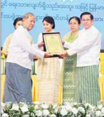
နိုင်ငံတော်စီမံအုပ်ချုပ်ရေးကောင်စီဥက္ကဋ္ဌ နိုင်ငံတော်ဝန်ကြီးချုပ် ဗိုလ်ချုပ်မှူးကြီး မင်းအောင်လှိုင်နှင့် ဇနီး ဒေါ်ကြာကြာလှ ၂၀၂၂ ခုနှစ်၊ အမျိုးသားစာပေတစ်သက်တာဆု ရရှိသူ စာပေပညာရှင် ဆရာကြီး ဒေါက်တာ ထွန်းတင့် (ဒေါက်တာထွန်းတင့်-မြန်မာစာ) အား ဆုတံဆိပ် ပေးအပ်ချီးမြှင့်စဉ်။

တစ်သက်တာလုံး စာပေကို တချိန်မတ်မတ် အားထုတ်ရေးသားပြုစုခဲ့သည့် စာပေပညာရှင်ကြီးများကိုလည်း အသိအမှတ်ပြုသည့် အနေဖြင့် အမျိုးသားစာပေ တစ်သက်တာဆု” ကို ၂၀၀၁ ခုနှစ်မှစပြီး နှစ်စဉ်ချီးမြှင့် ပေးအပ်လျက်ရှိပါကြောင်း၊ စာပေပညာရှင်များကို ချီးမြှင့်သည့် ဆုငွေများကိုလည်း တစ်နှစ်ထက်တစ်နှစ် ပိုမိုတိုးတက်ချိုးမြှင့်နိုင်ခဲ့ပါကြောင်း။ အမှန်တကယ် ထိုကဲ့သို့သော စာအုပ်၊ စာမူများကို ရွေးချယ်ချီးမြှင့်နိုင်ရေးအတွက် ပဏာမရွေးချယ်မှုအဆင့်၊ ဆန်ခါတင်ရွေးချယ်မှုအဆင့်၊ အတည်ပြုရွေးချယ်မှုအဆင့်ဟူ၍ အဆင့်သုံးဆင့်ဖြင့် ပညာရှင်များက စီစစ်ရွေးချယ်ခဲ့သည်ကို တွေ့ရပါကြောင်း။ ၂၀၂၂ ခုနှစ်အတွင်း ပထမအကြိမ် ပုံနှိပ်ထုတ်ဝေခဲ့သည့် စာအုပ်ပေါင်း ၇၇၅ အုပ်ထဲမှ အများစုစာပေစာပေဆုအတွက် စာဖတ်နာ ၅ သို့