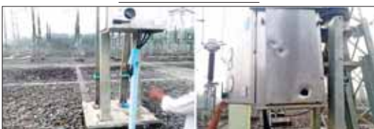
20 MVA အအေးခံကိရိယာ ပျက်စီးမှု မှတ်တမ်းဓာတ်ပုံ။