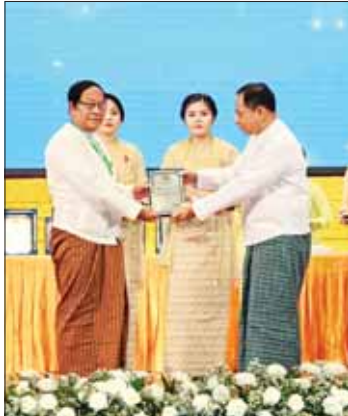
နိုင်ငံတော်စီမံအုပ်ချုပ်ရေးကောင်စီအဖွဲ့ဝင် ဒုတိယဗိုလ်ချုပ်ကြီး ရာပြည့် စာပေဓါမာန်စာမူဆု ရရှိသူတစ်ဦးအား ဆုပေးအပ်ချီးမြှင့်စဉ်။