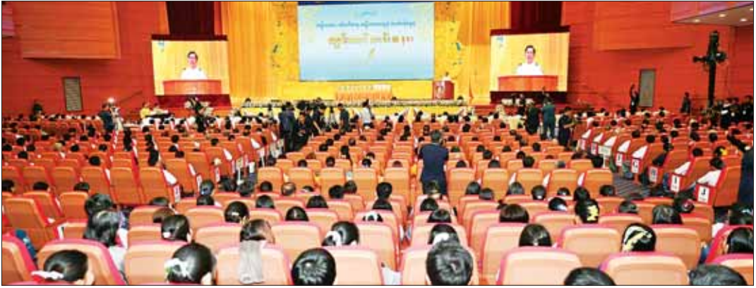
နိုင်ငံတော်စီမံအုပ်ချုပ်ရေးကောင်စီဥက္ကဋ္ဌ နိုင်ငံတော်ဝန်ကြီးချုပ် ဗိုလ်ချုပ်မှူးကြီး မင်းအောင်လှိုင် ၂၀၂၂ ခုနှစ်အတွက် အမျိုးသားစာပေ တစ်သက်တာဆု၊ အမျိုးသားစာပေဆုနှင့် စာပေဗိမာန်စာမူဆု ဆုနှင်းသဘင် အခမ်းအနားတွင် အမှာစကားပြောကြားစဉ်။

စာဖတ်နာ ၃ မှ ခေတ်အက်ဆက်စာဆိုတော်ကြီးများ၏ စာပေလက်ရာများသည် ဖတ်ရှုလေ့လာသူတို့အတွက် အမြဲအဖိုးတန် အကျိုးရှိနေသည့် အမွေအနှစ်များပင်ဖြစ်ပါကြောင်း။ နိုင်ငံတော်၏ လွတ်လပ်ရေးရပ်တည်ရေးအတွက် အောင်ဆန်း၏ လမ်းညွှန်မှုဖြင့် ၁၉၄၇ ခုနှစ်၊ ဩဂုတ်လတွင် တည်ထောင်ခဲ့သည့် စာပေဗိမာန်သည် တိုင်းရင်းသားပြည်သူများ နိုင်ငံတကာ ဗဟုသုတ တိုးပွားရန်အတွက် ဘာသာပြန်စာပေများ ထုတ်ဝေခဲ့သကဲ့သို့ မြန်မာစာပေဖွံ့ဖြိုးရေးအတွက် ၁၉၄၈ ခုနှစ်တွင် “စာပေဗိမာန် ကာလပေါ် ဝတ္ထုဆု” ကို တောင်ချီမြင့်ခဲ့ပါကြောင်း။ ဆုငွေများကိုလည်း တိုးတက်ချိုးမြှင့်ခဲ့ “စာပေဗိမာန်ကာလပေါ် ဝတ္ထုဆု” ကို “စာပေဗိမာန်ဆု” အနုပညာဆိုင်ရာ စာပေဆု၊ အမျိုးသား