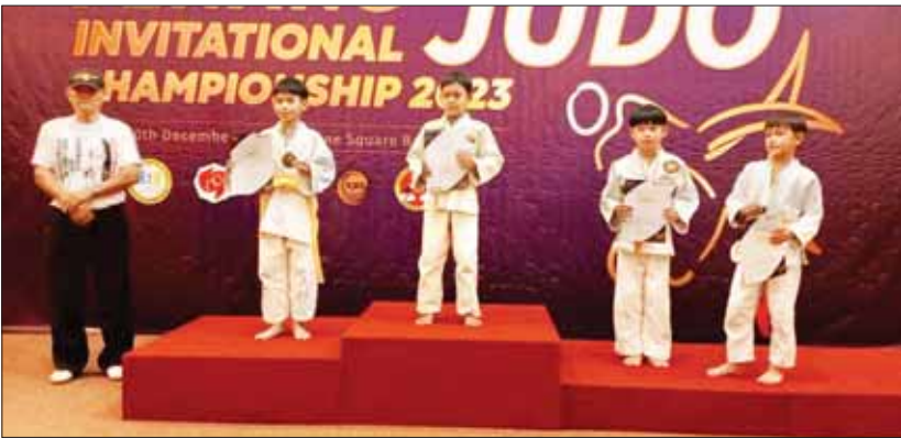
PENANG INVITATIONAL JUDO CHAMPIONSHIP

2023 ပြိုင်ပွဲတွင် မြန်မာကျူဒိုအားကစားအဖွဲ့ ရွှေတံဆိပ်လေးခု၊