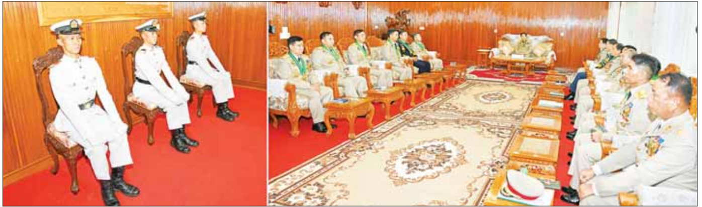
နိုင်ငံတော်စီမံအုပ်ချုပ်ရေးကောင်စီဥက္ကဋ္ဌ တပ်မတော်ကာကွယ်ရေးဦးစီးချုပ် ဗိုလ်ချုပ်မှူးကြီး သတိုးမဟာသရေစည်သူ သတိုးသီရိသုဓမ္မ မင်းအောင်လှိုင် တပ်မတော်နည်းပညာတက္ကသိုလ်ကျောင်း ဌာနချုပ် ဧည့်ခန်းမ၌ ထူးချွန်ဆုရရှိကြသည့် ဗိုလ်လောင်းသုံးဦးကို တွေ့ဆုံ၍ ဂုဏ်ပြုအမှာစကားပြောကြားစဉ်။

စာမျက်နှာ ၄ မှ ဗုဒ္ဓရုပ်ပွားတော်မြတ်ကြီး ထုဆစ်မည့် စကွင်ကျောက်တုံးတော်ကြီးကို ရေကြောင်း၊ ကုန်းကြောင်း တို့ဖြင့် နေပြည်တော်သို့ သယ်ယူပို့ဆောင်ရာတွင် တူးမြောင်းဖောက်လုပ်ခြင်း၊ လိုအပ်သည့်လမ်းမများ ဖောက်လုပ်ခြင်းနှင့် အဆင့်မြှင့်တင်ခြင်း၊ ပလွင်အောက်ခံ Foundation တည်ဆောက်ခြင်း၊ မြေငလျင်ဒဏ်၊ လေပြင်းမုန်တိုင်းနှင့် လျှပ်စစ်မိုးကြိုးဒဏ်ခံနိုင်ရေးတို့အတွက် အင်ဂျင်နီယာပညာရပ်ဆိုင်ရာ ရှုထောင့်မျိုးစုံက တွေးစားသုံးသပ်ပြီး စနစ်တကျ တွက်ချက်တည်ဆောက်ခဲ့ခြင်းဖြစ်ကြောင်း၊ ခေတ်မီအဆင့်မြင့်နည်းပညာသုံး CNC စက်ကြီးများအသုံးပြုပြီး ရုပ်ပွားတော်မြတ်ကြီးကို ထုဆစ်ပုံဖော်ခြင်းအပေါ်အင်ဂျင်နီယာပညာရပ်ဆိုင်ရာ သို့မဟုတ် အင်ဂျင်နီယာပညာရပ်ဆိုင်ရာ သို့မဟုတ် အင်ဂျင်နီယာပညာရပ်ဆိုင်ရာ သို့မဟုတ် အင်ဂျင်နီယာပညာရပ်ဆိုင်ရာ တည်ဆောက်အသုံးပြုခြင်းများကို ပြည်ပမှ အတတ်ပညာရှင်များမဟာဝံ တပ်မတော်သား အင်ဂျင်နီယာများက မြန်မာနိုင်ငံအင်ဂျင်နီယာကောင်စီမှ ပညာရှင်များနှင့်အတူ ပူးပေါင်းဆောင်ရွက်ခဲ့ခြင်းဖြစ်ကြောင်း၊ ထိုသို့ဆောင်ရွက်နိုင်မှုအပေါ် နိုင်ငံတကာအင်ဂျင်နီယာအဖွဲ့အစည်းများကပါ အသိအမှတ်ပြုမှုရရှိခဲ့ခြင်းကြောင့် စွမ်းရည်ပြည့်ဝသည့် တပ်မတော်သားအင်ဂျင်နီယာများအတွက် များစွာဂုဏ်ထူးလမ်းခြောက်မိသည့်ကို အသိအမှတ်ပြုပြောကြားလိုကြောင်း။