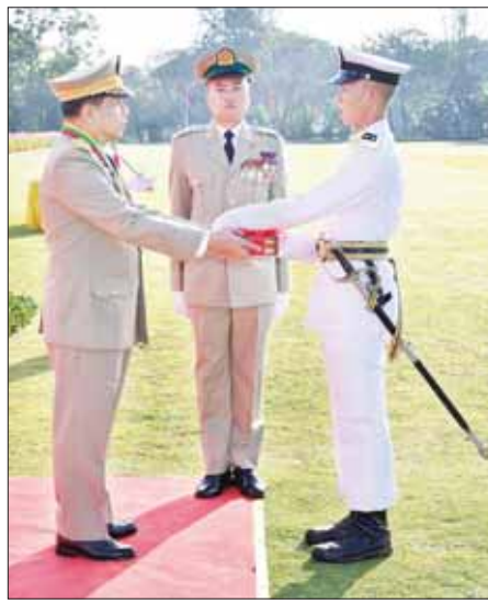
နိုင်ငံတော်စီမံအုပ်ချုပ်ရေးကောင်စီဥက္ကဋ္ဌ တပ်မတော်ကာကွယ်ရေး ဦးစီးချုပ် ဗိုလ်ချုပ်မှူးကြီး သတိုးမဟာသရေစည်သူ သတိုးသီရိသုဓမ္မ မင်းအောင်လှိုင် လေ့ကျင့်ရေးထူးချွန်ဆုရရှိသူ ဗိုလ်လောင်းအမှတ် ၅၂၂ ဗိုလ်လောင်း ဘုန်းမြင့်ကျော်အား ဆုပေးအပ်ချီးမြှင့်စဉ်။