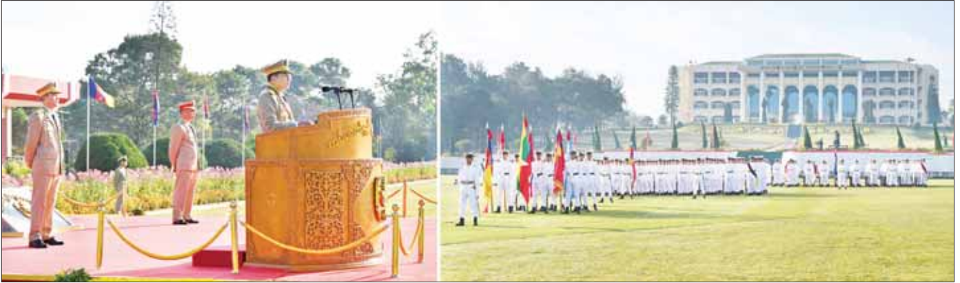
နိုင်ငံတော်စီမံအုပ်ချုပ်ရေးကောင်စီဥက္ကဋ္ဌ တပ်မတော်ကာကွယ်ရေးဦးစီးချုပ် ဗိုလ်ချုပ်မှူးကြီး သတိုးမဟာသရေစည်သူ သတိုးသိရီသုဓမ္မ မင်းအောင်လှိုင် တပ်မတော်နည်းပညာတက္ကသိုလ် ဗိုလ်လောင်းသင်တန်း အမှတ်စဉ်(၂၅) သင်တန်းဆင်းဂုဏ်ပြုစစ်ရေးပြအခမ်းအနားတွင် မိန့်ခွန်းပြောကြားစဉ်။

❖ အမိတက္ကသိုလ်ကြီးက အရည်အချင်းပြည့်ဝသည့်အင်ဂျင်နီယာများအဖြစ် မွေးထုတ်ပေးရာ တွင် အခြေခံကျသည့် အင်ဂျင်နီယာပညာရပ်များအပြင် သက်ဆိုင်ရာပညာရပ်နယ်ပယ် အလိုက် အင်ဂျင်နီယာဒဿနအမြင်နှင့် အင်ဂျင်နီယာကျင့်ဝတ်များကို သိရှိလိုက်နာနိုင် စေရန် ဖြည့်စွက်သင်ကြားပေးခဲ့ပြီးဖြစ်။ အင်ဂျင်နီယာပညာရပ်ဆိုင်ရာ အခြေခံကျင့်ဝတ် များဖြစ်သည့် တိကျခိုင်မာမှု၊ ရိုးသားဖြောင့်မတ်မှု၊ တာဝန်ယူမှု၊ တာဝန်ခံမှု စသည့်အခြေခံ အုတ်မြစ်ကောင်းများ ရရှိပြီးဖြစ်သဖြင့် လက်တွေ့နယ်ပယ်တွင် အင်ဂျင်နီယာလုပ်ငန်းများ ဆောင်ရွက်သည့်အခါ အင်ဂျင်နီယာပညာရပ်ဆိုင်ရာ အခြေခံကျင့်ဝတ်များကို တိကျစွာ လိုက်နာကျင့်ကြံလုပ်ဆောင်