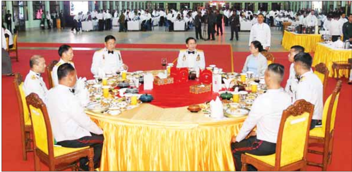
နိုင်ငံတော်စီမံအုပ်ချုပ်ရေးကောင်စီဥက္ကဋ္ဌ တပ်မတော်ကာကွယ်ရေးဦးစီးချုပ် ဗိုလ်ချုပ်မှူးကြီး မင်းအောင်လှိုင်နှင့် ဇနီး ဒေါ်ကြူကြူလှ သင်တန်းဆင်းအရာရှိများ၊ ညစာစားပွဲ တက်ရောက်လာကြသူများနှင့်အတူ ဂုဏ်ပြုညစာကို အတူတကွ သုံးဆောင်စဉ်။

ညစာအတူတကွသုံးဆောင် ဦးစွာ နိုင်ငံတော်စီမံအုပ်ချုပ် ရေးကောင်စီဥက္ကဋ္ဌ တပ်မတော်