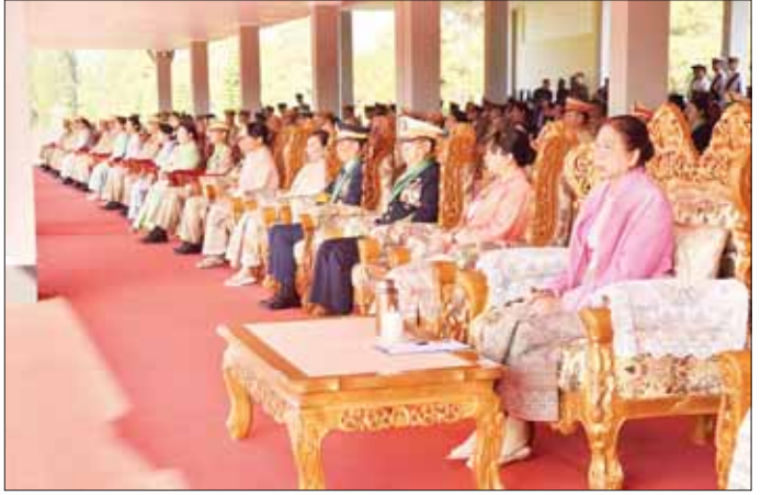
အလေးပြုခြင်းကို ခံယူပြီး ကျောင်းဆင်းဗိုလ်လောင်း တပ်ခွဲကို စစ်ဆေးသည်။ ယင်းနောက် နိုင်ငံတော်စီမံ အုပ်ချုပ်ရေးကောင်စီဥက္ကဋ္ဌ တပ်မတော်ကာကွယ်ရေး ဦးစီးချုပ် ဗိုလ်ချုပ်မှူးကြီး သတိုးမဟာသရေစည်သူ သတိုးသိရီသုဓမ္မ မင်းအောင်လှိုင်အား ဗိုလ်လောင်း တပ်ခွဲများက အနှေးလျှောက်၊ အမြန်လျှောက်ဖြင့် ချီတက်အလေးပြုကြ ပြီးစွာ နိုင်ငံတော်စီမံအုပ်ချုပ်ရေးကောင်စီဥက္ကဋ္ဌ တပ်မတော်ကာကွယ်ရေးဦးစီးချုပ် ဗိုလ်ချုပ်မှူးကြီး သတိုးမဟာသရေစည်သူ သတိုးသိရီသုဓမ္မ မင်းအောင်လှိုင်သည် ဗိုလ်လောင်းတပ်ခွဲများ၏ မျူးကြီး သတိုးမဟာသရေစည်သူ သတိုးသိရီသုဓမ္မ မင်းအောင်လှိုင်က တပ်မတော်နည်းပညာတက္ကသိုလ် ဗိုလ်လောင်းအမှတ်စဉ်(၂၅)မှ အောင်စစ်သည်ဆု ရရှိသူ ဗိုလ်လောင်း အမှတ် ၈၁၉၇၊ ဗိုလ်လောင်း ကောင်းခန့်ဇော်၊ လေ့ကျင့်ရေးထူးချွန်ဆုရရှိသူ ဗိုလ်လောင်းအမှတ် ၈၂၆၂၊ ဗိုလ်လောင်း ဘုန်းမြင့် ကျော်၊ စာပေထူးချွန်ဆုရရှိသူ ဗိုလ်လောင်းအမှတ် ၈၂၂၄၊ ဗိုလ်လောင်း ဦးမင်းသန့်တို့ကို ဆုများ ပေးအပ်ချီးမြှင့်သည်။ စာမျက်နှာ ၄ သို့

❖ အမိတက္ကသိုလ်ကြီးက အရည်အချင်းပြည့်ဝသည့်အင်ဂျင်နီယာများအဖြစ် မွေးထုတ်ပေးရာ တွင် အခြေခံကျသည့် အင်ဂျင်နီယာပညာရပ်များအပြင် သက်ဆိုင်ရာပညာရပ်နယ်ပယ် အလိုက် အင်ဂျင်နီယာဒဿနအမြင်နှင့် အင်ဂျင်နီယာကျင့်ဝတ်များကို သိရှိလိုက်နာနိုင် စေရန် ဖြည့်စွက်သင်ကြားပေးခဲ့ပြီးဖြစ်။ အင်ဂျင်နီယာပညာရပ်ဆိုင်ရာ အခြေခံကျင့်ဝတ် များဖြစ်သည့် တိကျခိုင်မာမှု၊ ရိုးသားဖြောင့်မတ်မှု၊ တာဝန်ယူမှု၊ တာဝန်ခံမှု စသည့်အခြေခံ အုတ်မြစ်ကောင်းများ ရရှိပြီးဖြစ်သဖြင့် လက်တွေ့နယ်ပယ်တွင် အင်ဂျင်နီယာလုပ်ငန်းများ ဆောင်ရွက်သည့်အခါ အင်ဂျင်နီယာပညာရပ်ဆိုင်ရာ အခြေခံကျင့်ဝတ်များကို တိကျစွာ လိုက်နာကျင့်ကြံလုပ်ဆောင်