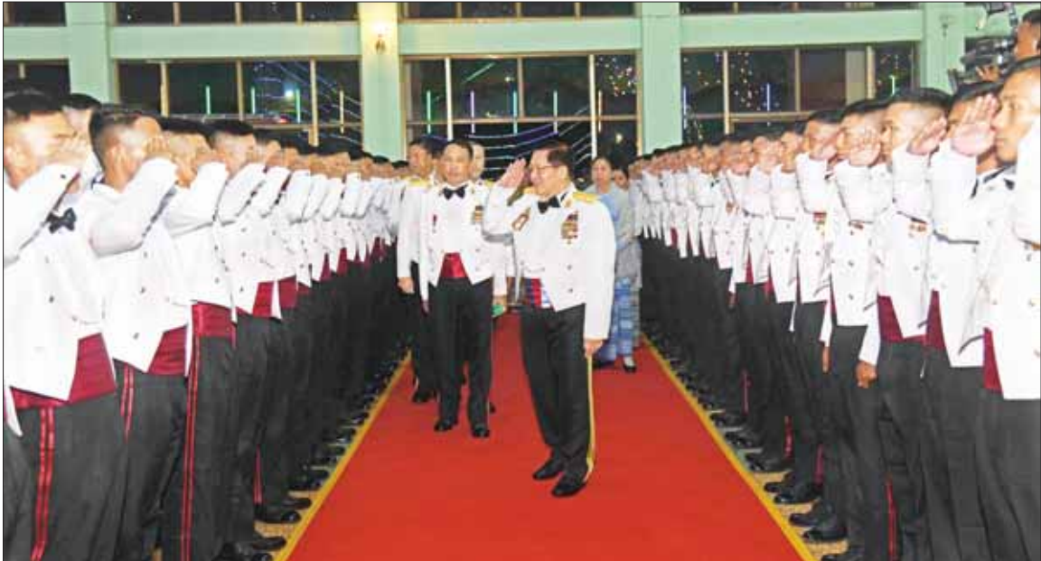
နိုင်ငံတော်စီမံအုပ်ချုပ်ရေးကောင်စီဥက္ကဋ္ဌ တပ်မတော်ကာကွယ်ရေးဦးစီးချုပ် ဗိုလ်ချုပ်မှူးကြီး မင်းအောင်လှိုင် သင်တန်းဆင်း အရာရှိများအား တစ်ဦးချင်း ရင်းရင်းနှီးနှီးလိုက်လံ နှုတ်ဆက်စဉ်။

နေပြည်တော် ဒီဇင်ဘာ ၁၁ တပ်မတော်နည်းပညာတက္ကသိုလ် ဗိုလ်လောင်းသင်တန်းအမှတ်စဉ် (၂၅) သင်တန်းဆင်း ဂုဏ်ပြုညစာ စားပွဲအခမ်းအနားကို ယနေ့ည နေပိုင်းတွင် ပြင်ဦးလွင်မြို့ တပ်မတော်နည်းပညာတက္ကသိုလ် ဗိုလ်လောင်းစားရိပ်သာ၌ ကျင်းပ ပြုလုပ်ရာ နိုင်ငံတော်စီမံအုပ်ချုပ် ရေးကောင်စီဥက္ကဋ္ဌ တပ်မတော် ကာကွယ်ရေးဦးစီးချုပ် ဗိုလ်ချုပ် မှူးကြီး မင်းအောင်လှိုင် တက်ရောက်ချီးမြှင့်သည်။