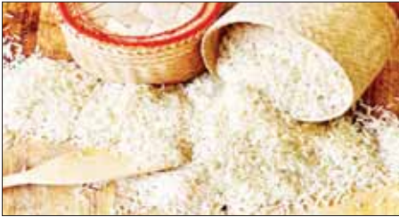
DOCA (စစ်ကိုင်း)

စစ်ကိုင်းတိုင်းဒေသကြီး ကန့်သတ်ချက်အောက်တွင် ၂၀၂၃ ခုနှစ် ဒီဇင်ဘာလ ဒုတိယပတ်အတွင်း ဖြစ်ပေါ်နေသော စပါး၊ ဆန် ဈေးနှုန်းများမှာ ရွှေဘို ပေါင်းစည်း စပါးတင်း ၁၀၀ လျှင် ငွေကျပ် ၃၅၅၀၀၀၀၊ ဧရာမင်းစပါး တင်း ၁၀၀ လျှင် ငွေကျပ် ၂၉၀၀၀၀၀ နှင့် နွေစပါး (ရွှေဝါထွန်း) တင်း ၁၀၀ လျှင် ငွေကျပ် ၁၆၀၀၀၀၀၊ ရွှေဘိုပေါင်းစည်း ဆန် ၂၄ ပြည်ပါ တစ်အိတ်လျှင် ငွေကျပ် ၁၅၅၀၀၀၊ ဧရာမင်း ဆန် ၂၄ ပြည်ပါ တစ်အိတ်လျှင် ငွေကျပ် ၁၅၅၀၀၀ နှင့် ရွှေဝါထွန်းဆန် ၂၄ ပြည်ပါ တစ်အိတ်လျှင် ငွေကျပ် ၆၉၀၀၀ ဖြင့် အရောင်းအဝယ်ဖြစ်လျက်ရှိကြောင်း ဒေသခံ ဆန်စက် လုပ်ငန်းရှင်ထံမှ သိရသည်။