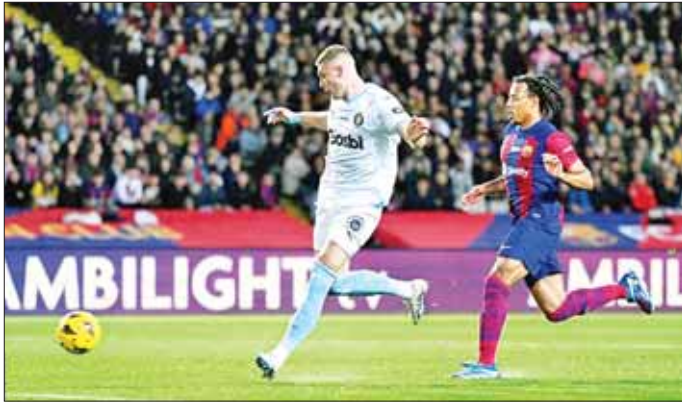
ဂျီရိုနာအသင်းတိုက်စစ်မှူး ဘာစီလိုနာအသင်းဘက်သို့ ထိုးဖောက်ကစားစဉ်။

ဒီဇင်ဘာ ၁၁ ရက် နံနက် ၂ နာရီခွဲက ယှဉ်ပြိုင်ကစားခဲ့သည့် စပိန်လာလီဂါပြိုင်ပွဲ (၁၆) မှ အကောင်းဆုံးပွဲတစ်ပွဲဖြစ်သည့် ဘာစီလိုနာနှင့် ဂျီရိုနာအသင်းပွဲစဉ်တွင် ဂျီရိုနာအသင်းက လေးဂိုး-နှစ်ဂိုးဖြင့် အနိုင်ရရှိပြီး အမှတ်ပေးဇယားကို နှစ်မှတ်အသာဖြင့် ဦးဆောင်နိုင်ခဲ့သည်။ ယခုနှစ်ရာသီတွင် ခြေစွမ်းထက်မြက်ပြီး ပုံစံကောင်းရရှိနေသည့် ဂျီရိုနာအသင်းသည် ယခုပွဲစဉ်တွင်လည်း အသင်းကြီးဘာစီလိုနာအသင်းကို ခြေရည်တူကစားနိုင်ခဲ့ကာ အရေးပါသည့် စာမျက်နှာ ၁၇ ကော်လံ ၅ *