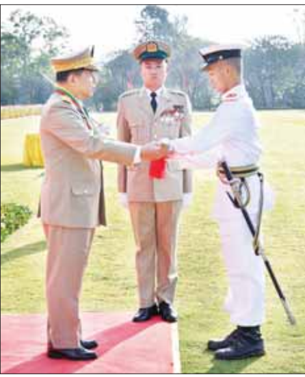
နိုင်ငံတော်စီမံအုပ်ချုပ်ရေးကောင်စီဥက္ကဋ္ဌ တပ်မတော်ကာကွယ်ရေး ဦးစီးချုပ် ဗိုလ်ချုပ်မှူးကြီး သတိုးမဟာသရေစည်သူ သတိုးသီရိသုဓမ္မ မင်းအောင်လှိုင် အောင်စစ်သည်ဆုရရှိသူ ဗိုလ်လောင်း အမှတ်စာဂဏ ၇၂၄ ဗိုလ်လောင်း ကောင်းခန့်ဇော်အား ဆုပေးအပ်ချီးမြှင့်စဉ်။