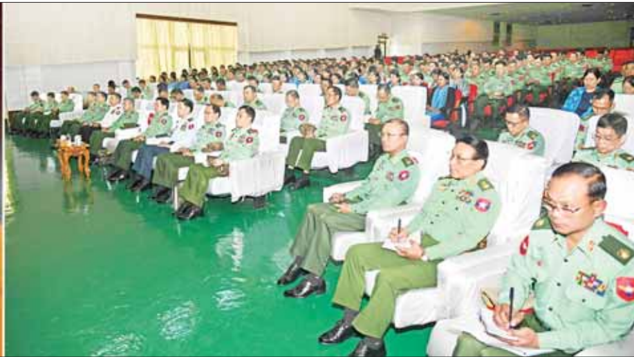
နိုင်ငံတော်စီမံအုပ်ချုပ်ရေးကောင်စီဥက္ကဋ္ဌ တပ်မတော်ကာကွယ်ရေးဦးစီးချုပ် ဗိုလ်ချုပ်မှူးကြီး မင်းအောင်လှိုင် ပြင်ဦးလွင်တပ်နယ်ရှိ နည်းပြအရာရှိကြီးများနှင့် ဆရာ ဆရာမများအား တွေ့ဆုံပွဲတွင်အမှာစကား ပြောကြားစဉ်။