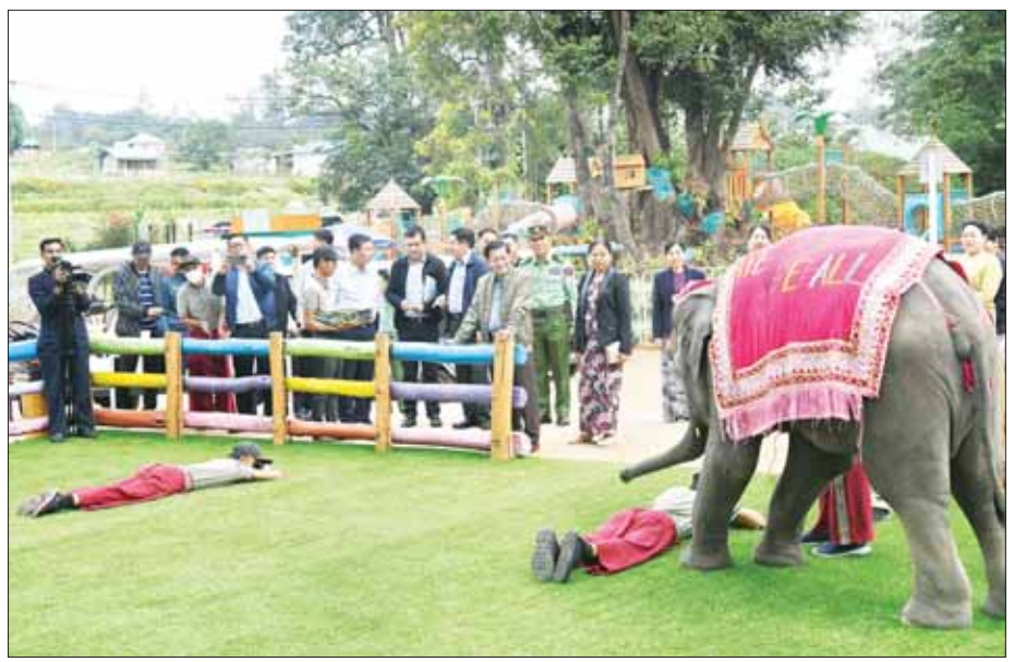
နိုင်ငံတော်စီမံအုပ်ချုပ်ရေးကောင်စီဥက္ကဋ္ဌ နိုင်ငံတော်ဝန်ကြီးချုပ် ဗိုလ်ချုပ်မှူးကြီး မင်းအောင်လှိုင် ဇနီး ဒေါ်ကြူကြူလှ ဆင်ကလေးများ၏ ကျွမ်းကျင်မှုနှင့် အလှပြကြွက်များကို ကြည့်ရှုအားပေးစဉ်။

လှည့်လည်ကြည့်ရှု ယင်းနောက် နိုင်ငံတော်စီမံအုပ်ချုပ်ရေးကောင်စီဥက္ကဋ္ဌ နိုင်ငံတော်ဝန်ကြီးချုပ်နှင့် အဖွဲ့ဝင်များသည် ပွဲကောက်ရေတံခွန်အပန်းဖြေစခန်း (B.E FALLS) အတွင်းရှိ မှန်တံတားကို ဖြတ်သန်းပြီး ဆင်ကလေးများ၏ ကျွမ်းကျင်မှုနှင့် အလှပြကြွက်များကို ကြည့်ရှုအားပေး၍ အစာကျွေးကြကာ Sky Cable Car ဖြင့် လိုက်ပါစီးနင်းပြီး ပွဲကောက်ရေတံခွန်အပန်းဖြေစခန်းအတွင်း လှည့်လည်ကြည့်ရှုစစ်ဆေးကြသည်။ လမ်းညွှန်မှာကြား လှည့်လည်ကြည့်ရှု စစ်ဆေးစဉ် တာဝန်ရှိသူများ၏ တင်ပြချက်များအပေါ် နိုင်ငံတော်စီမံအုပ်ချုပ်ရေးကောင်စီဥက္ကဋ္ဌ နိုင်ငံတော်ဝန်ကြီးချုပ်က ပွဲကောက်ရေတံခွန်အပန်းဖြေစခန်း (B.E FALLS) အတွင်း ပြည်သူများအပန်းဖြေအနားယူနိုင်ရေးအတွက် အမြဲသန့်ရှင်းသာယာလှပပြီး စိမ်းလန်းစိုပြည်မှုရှိအောင် ဆောင်ရွက်ရန်၊ သစ်ပင်ပန်းမန်များကို စနစ်တကျ စိုက်ပျိုးရန်၊ လျှောက်လမ်းများနှင့် တံတားများ ကောင်းမွန်စေရေး ဆောင်ရွက်ရန်၊ ချောင်းရိုးတစ်လျှောက်သန့်ရှင်းသာယာရေးနှင့် ရေများ သန့်ရှင်းကြည်လင်မှု