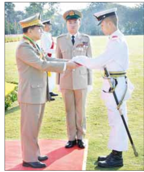
နိုင်ငံတော်စီမံအုပ်ချုပ်ရေးကောင်စီဥက္ကဋ္ဌ တပ်မတော်ကာကွယ်ရေး ဦးစီးချုပ် ဗိုလ်ချုပ်မှူးကြီး သတိုးမဟာသရေစည်သူ သတိုးသီရိသုဓမ္မ မင်းအောင်လှိုင် စာပေထူးချွန်ဆုရရှိသူ ဗိုလ်လောင်းအမှတ် ၈၂၂ ဗိုလ်လောင်း စိုင်းမင်းသန့်အား ဆုပေးအပ်ချီးမြှင့်စဉ်။

စာမျက်နှာ ၃ မှ ဆက်လက်၍ နိုင်ငံတော်စီမံအုပ်ချုပ်ရေးကောင်စီ ဥက္ကဋ္ဌ တပ်မတော်ကာကွယ်ရေးဦးစီးချုပ် ဗိုလ်ချုပ်မှူးကြီး သတိုးမဟာသရေစည်သူ သတိုးသီရိသုဓမ္မ မင်းအောင်လှိုင်က သင်တန်းဆင်းမိန့်ခွန်းပြောကြားရာတွင် အင်ဂျင်နီယာပညာရပ်သည် သင်္ချာပညာရပ်နှင့် သိပ္ပံပညာရပ်များကို သင်ယူမှု၊ လေ့လာမှု၊ လက်တွေ့ဆောင်ရွက်မှုများမှတစ်ဆင့် သဘာဝပတ်ဝန်းကျင်ကို ပြုပြင်ဖန်တီးခြင်းဖြစ်ပြီး လူမှုအဖွဲ့အစည်း တိုးတက်ဖွံ့ဖြိုးစေရန်အတွက် လိုအပ်သည့် အခြေခံအဆောက်အအုံများ၊ စက်ပစ္စည်းနှင့်ယာဉ်ယန္တရားများ၊ အခြားခေတ်မီ ရုပ်ဝတ္ထုပစ္စည်းများကို တီထွင်ထုတ်လုပ်မှုအတွက် အသုံးချရသည့်ပညာရပ်ဖြစ်ကြောင်း။