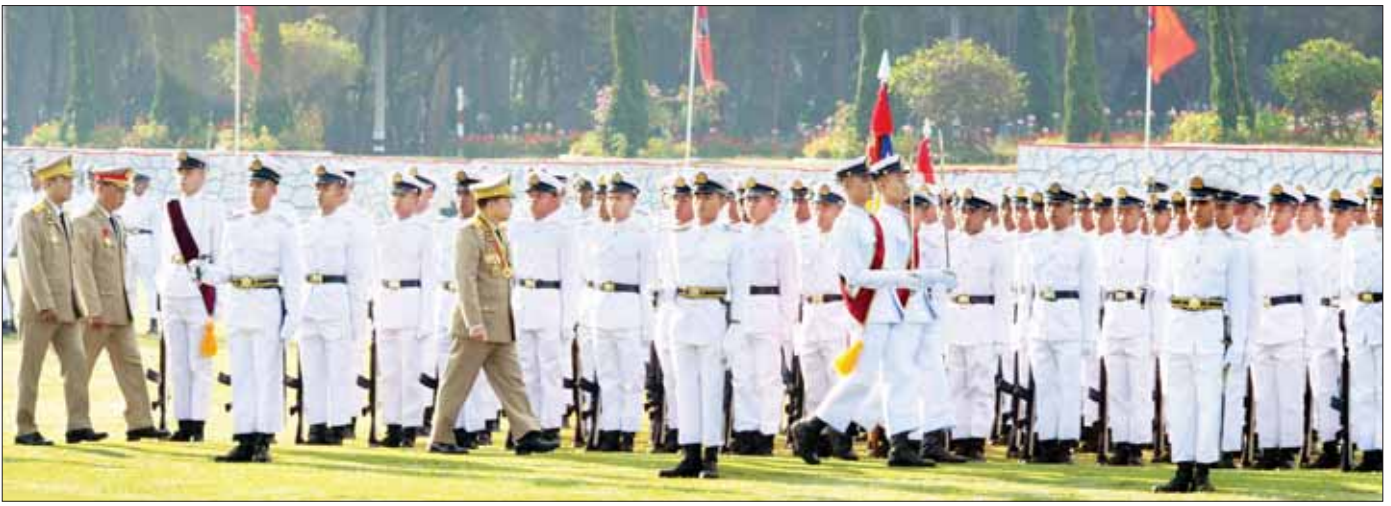
နိုင်ငံတော်စီမံအုပ်ချုပ်ရေးကောင်စီဥက္ကဋ္ဌ တပ်မတော်ကာကွယ်ရေးဦးစီးချုပ် ဗိုလ်ချုပ်မှူးကြီး သတိုးမဟာသရေစည်သူ သတိုးသီရိသုဓမ္မ မင်းအောင်လှိုင် ကျောင်းဆင်းဗိုလ်လောင်းတပ်ခွဲကို စစ်ဆေးစဉ်။