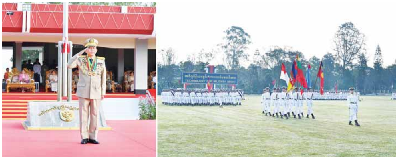
နိုင်ငံတော်စီမံအုပ်ချုပ်ရေးကောင်စီဥက္ကဋ္ဌ တပ်မတော်ကာကွယ်ရေးဦးစီးချုပ် ဗိုလ်ချုပ်မှူးကြီး သတိုးမဟာသရေစည်သူ သတိုးသီရိသုဓမ္မ မင်းအောင်လှိုင်အား ဗိုလ်လောင်းတပ်ခွဲများက အနှေးလျှောက်၊ အမြန်လျှောက်ဖြင့် ချီတက်အလေးပြုစဉ်။

စစ်မြေပြင်အတွက် မိမိတို့တတ်ကျွမ်းသည့် အင်ဂျင်နီယာအတတ်ပညာများကို အသုံးချရမည်ဖြစ်သကဲ့သို့ သင်ကြားပေးလိုက်သည့် စစ်နည်းဗျူဟာ ဘာသာရပ်များကိုလည်း အသုံးချပြီး ခြေလျင်တပ်ဖွဲ့များကဲ့သို့ တိုက်ပွဲဝင်နိုင်ရေး ကြိုးစားလုပ်ဆောင်