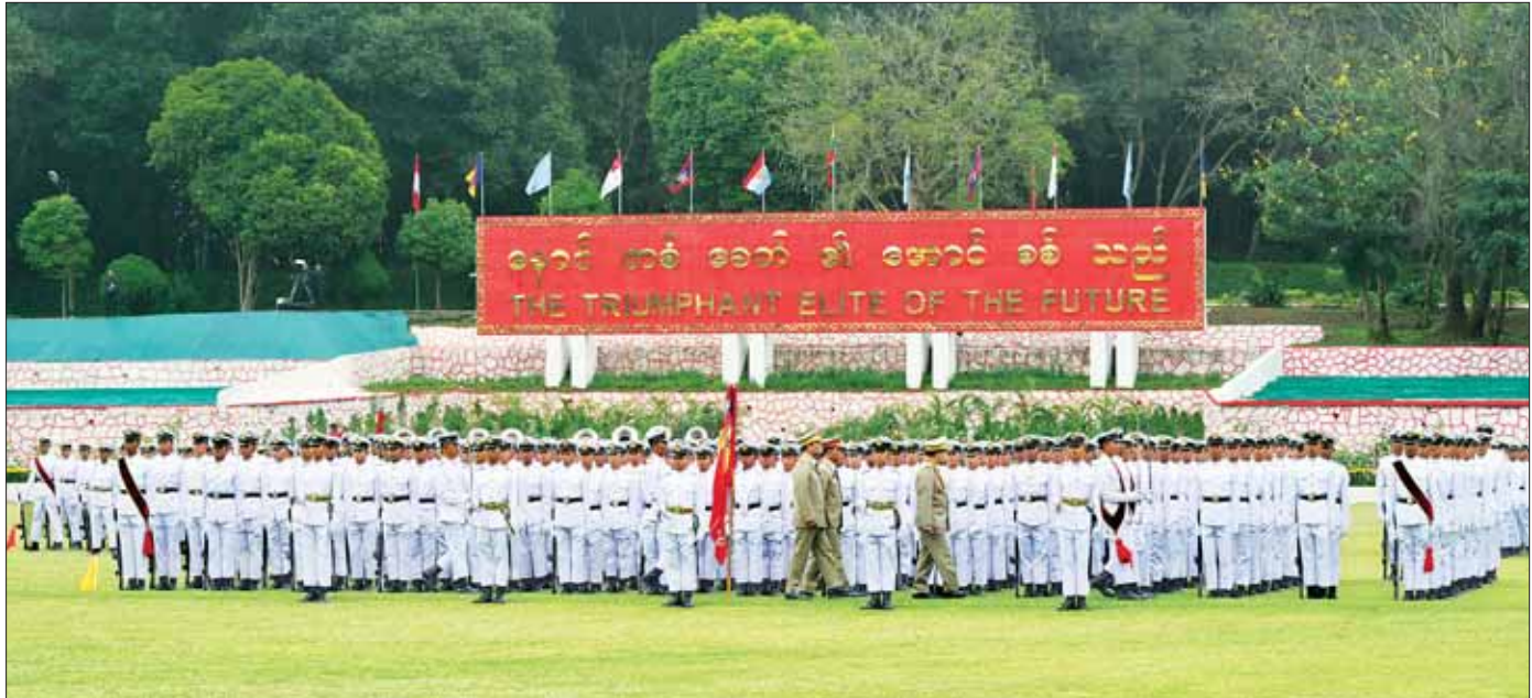
နိုင်ငံတော်စီမံအုပ်ချုပ်ရေးကောင်စီဥက္ကဋ္ဌ တပ်မတော်ကာကွယ်ရေးဦးစီးချုပ် ဗိုလ်ချုပ်မှူးကြီး သတိုးမဟာသရေစည်သူ သတိုးသီရိသုဓမ္မ မင်းအောင်လှိုင် သင်တန်းဆင်းပိုလ်လောင်းတပ်ခွဲများအား စစ်ဆေးစဉ်။