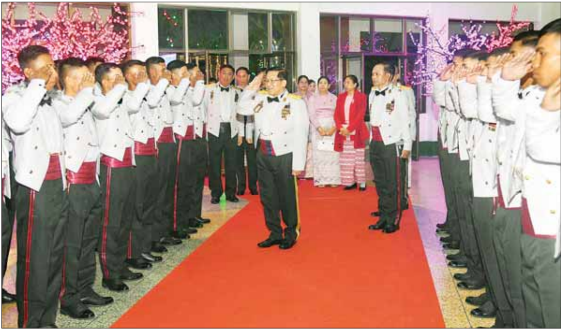
နိုင်ငံတော်စီမံအုပ်ချုပ်ရေးကောင်စီဥက္ကဋ္ဌ တပ်မတော်ကာကွယ်ရေးဦးစီးချုပ် ဗိုလ်ချုပ်မှူးကြီး မင်းအောင်လှိုင် စစ်တက္ကသိုလ် ဗိုလ်လောင်းသင်တန်း အမှတ်စဉ် (၆၅) သင်တန်းဆင်း ဂုဏ်ပြုညစာစားပွဲအခမ်းအနားသို့ တက်ရောက်စဉ်။

နေပြည်တော် ဒီဇင်ဘာ ၈ စစ်တက္ကသိုလ် ဗိုလ်လောင်း သင်တန်း အမှတ်စဉ် (၆၅) သင်တန်းဆင်း ဂုဏ်ပြုညစာ စားပွဲအခမ်းအနားကို ယနေ့ညနေ ပိုင်းတွင် ပြင်ဦးလွင်မြို့ စစ် တက္ကသိုလ် အနေ့ရထားတပ်ရင်း ဗိုလ်လောင်းစားရိပ်သာ၌ ကျင်းပ ပြုလုပ်ရာ နိုင်ငံတော်စီမံအုပ်ချုပ် ရေးကောင်စီဥက္ကဋ္ဌ တပ်မတော် ကာကွယ်ရေးဦးစီးချုပ် ဗိုလ်ချုပ် မှူးကြီး မင်းအောင်လှိုင် တက်ရောက်ချီးမြှင့်သည်။