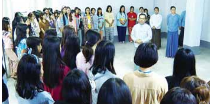
အကူပြုမည့် သုတေသနများ ဆောင်ရွက်ကြရန် မှာကြားကာ မိုးလုံလေလုံ အားကစားရုံ၌ ဘတ်စကက်ဘောကစားနေသော ကျောင်းသားများကို ကြည့်ရှုအားပေးသည်။ ညနေပိုင်းတွင် ဒုတိယဝန်ကြီးသည် ကွန်ပျူတာတက္ကသိုလ် (မန္တလေး) သို့ ရောက်ရှိပြီး ဝန်ထမ်းများနှင့် တွေ့ဆုံ၍ မွန်မြတ်သော အနန္တဂိုဏ်းဝင် ဆရာများအဖြစ် ခံယူချက်၊ ယုံကြည်ချက်များ မှန်ကန်မြင့်မားသော နိုင်ငံဝန်ထမ်းကောင်းများ ဖြစ်စေရေးလိုက်နာဆောင်ရွက်ရန် မှာကြားပြီး အတွင်းအဆောင်နေ ကျောင်းသား ကျောင်းသူများနှင့် တွေ့ဆုံ၍ (ဝဲပုံ) နိုင်ငံ့ဖွံ့ဖြိုးရေး လုပ်ငန်းစဉ်များ၌ အရည်အသွေး ပြည့်ဝသော အိုင်တီပညာရှင်များအဖြစ် ပါဝင်နိုင်ရေး ရည်မှန်းဆောင်ရွက်ကြရန်၊ စာကောင်းပေမွန်များ ဖတ်ရှုရေး၊ အားကစားလှုပ်ရှားမှုများ ဆောင်ရွက်ရေး မှာကြားပြီး အခက်အခဲတင်ပြမှုများအပေါ်ဖြည့်ဆည်းဆောင်ရွက်ပေးသည်။ ထိုနေ့က ဒုတိယဝန်ကြီးသည် အစိုးရစက်မှုလက်မှုသိပ္ပံ (ကျောက်ဆည်)သို့ ရောက်ရှိပြီး အင်ဂျင်နီယာဌာနရှိ အလုပ်ရုံများနှင့် ကျောင်းတွင်းအဆောင်များကို ကြည့်ရှုစစ်ဆေးကာ ပြည်သူ့အကျိုးပြု လူကောင်းလူတော် အိုင်တီနည်းပညာရှင်များ ဖြစ်စေရေး ကြိုးပမ်းစွမ်းဆောင်ကြရန် မှာကြားကြောင်း သိရသည်။ သတင်းစဉ်

ပြည့်ဝသော အိုင်တီပညာရှင်များအဖြစ် ပါဝင်နိုင်ရေး ရည်မှန်းဆောင်ရွက်ကြရန်၊ စာကောင်းပေမွန်များ ဖတ်ရှုရေး၊ အားကစားလှုပ်ရှားမှုများ ဆောင်ရွက်ရေး မှာကြားပြီး အခက်အခဲတင်ပြမှုများအပေါ်ဖြည့်ဆည်းဆောင်ရွက်ပေးသည်။ ထိုနေ့က ဒုတိယဝန်ကြီးသည် အစိုးရစက်မှုလက်မှုသိပ္ပံ (ကျောက်ဆည်)သို့ ရောက်ရှိပြီး အင်ဂျင်နီယာဌာနရှိ အလုပ်ရုံများနှင့် ကျောင်းတွင်းအဆောင်များကို ကြည့်ရှုစစ်ဆေးကာ ပြည်သူ့အကျိုးပြု လူကောင်းလူတော် အိုင်တီနည်းပညာရှင်များ ဖြစ်စေရေး ကြိုးပမ်းစွမ်းဆောင်ကြရန် မှာကြားကြောင်း သိရသည်။ သတင်းစဉ်