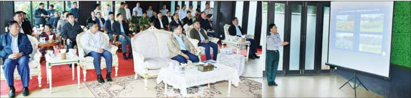
နိုင်ငံတော်စီမံအုပ်ချုပ်ရေးကောင်စီဥက္ကဋ္ဌ နိုင်ငံတော်ဝန်ကြီးချုပ် ဗိုလ်ချုပ်မှူးကြီး မင်းအောင်လှိုင် အား သစ်တောဦးစီးဌာန ညွှန်ကြားရေးမှူးချုပ် ဒေါက်တာသောင်းနိုင်ဦးက အမျိုးသားကန်တော်ကြီးဥယျာဉ်၌ ဆောင်ရွက်ထားမှုများကို ရှင်းလင်းတင်ပြစဉ်။