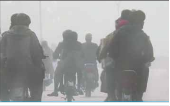
ပါကစ္စတန်နိုင်ငံ၌ လေထုညစ်ညမ်းနေမှုကို တွေ့ရစဉ်။

အရာရှိများက ခန့်မှန်းထားသည်။ မီးခိုးမြို့များက အထူးသဖြင့် ကျောင်းနေအရွယ်ကလေးများ၏ ကျန်းမာရေးကို ပိုမိုထိခိုက်စေ သည်ဟု ဆာဂမ်ဂါရမ်ဆေးရုံမှ တာဝန်ရှိသူက ပြောသည်။