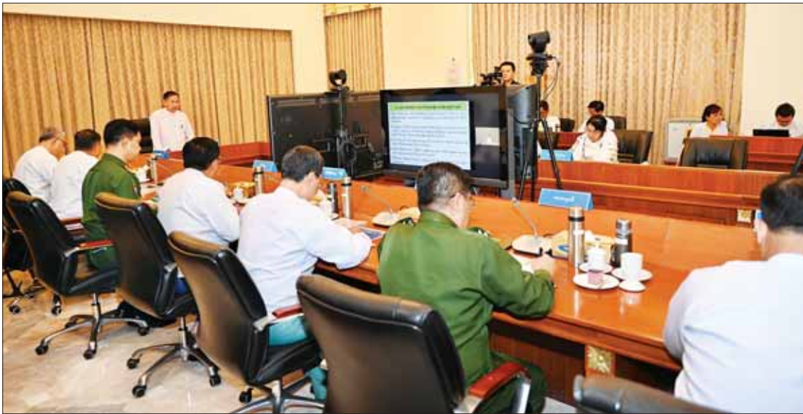
နိုင်ငံတော်စီမံအုပ်ချုပ်ရေးကောင်စီ ဒုတိယဥက္ကဋ္ဌ ဒုတိယဝန်ကြီးချုပ် ဒုတိယဗိုလ်ချုပ်မှူးကြီးစိုးဝင်း (၇၆) နှစ်မြောက် လွတ်လပ်ရေးနေ့ကျင်းပရေး ဗဟိုကော်မတီဒုတိယအကြိမ် ညှိနှိုင်းအစည်းအဝေးတွင် အမှာစကားပြောကြားစဉ်။

နေပြည်တော် ဒီဇင်ဘာ ၈ ၂၀၂၄ ခုနှစ်၊ (၇၆) နှစ်မြောက် လွတ်လပ်ရေးနေ့ ကျင်းပရေးဗဟိုကော်မတီ ဒုတိယအကြိမ် ညှိနှိုင်းအစည်းအဝေးကို ယနေ့ မွန်းလွဲ ၂ နာရီခွဲတွင် နေပြည်တော်ရှိ နိုင်ငံတော်စီမံအုပ်ချုပ်ရေးကောင်စီဥက္ကဋ္ဌရုံး အစည်းအဝေးခန်းမ၌ ကျင်းပရာ ၂၀၂၄ ခုနှစ်၊ (၇၆)နှစ်မြောက် လွတ်လပ်ရေးနေ့ကျင်းပရေး ဗဟိုကော်မတီဥက္ကဋ္ဌ နိုင်ငံတော် စီမံအုပ်ချုပ်ရေးကောင်စီဒုတိယဥက္ကဋ္ဌ ဒုတိယဝန်ကြီးချုပ် ဒုတိယဗိုလ်ချုပ်မှူးကြီးစိုးဝင်း တက်ရောက်အမှာစကားပြောကြားသည်။