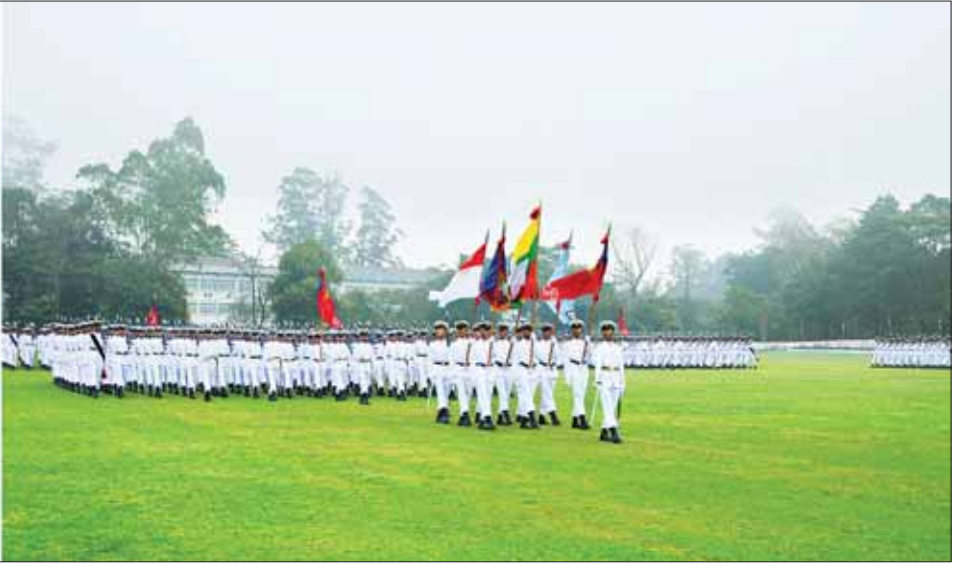
နိုင်ငံတော်စီမံအုပ်ချုပ်ရေးကောင်စီဥက္ကဋ္ဌ တပ်မတော်ကာကွယ်ရေးဦးစီးချုပ် ဗိုလ်ချုပ်မှူးကြီး သတိုးမဟာသရေစည်သူ သတိုးသီရိသုဓမ္မ မင်းအောင်လှိုင် အား ဗိုလ်လောင်းတပ်ခွဲများက အနှေးလျှောက်၊ အမြန်လျှောက်ဖြင့် ချီတက်အလေးပြုကြစဉ်။