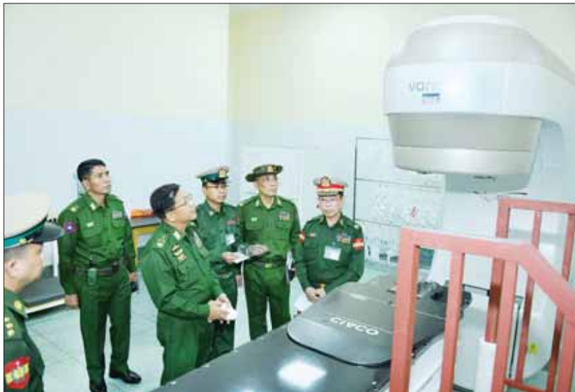
နိုင်ငံတော်စီမံအုပ်ချုပ်ရေးကောင်စီဥက္ကဋ္ဌ တပ်မတော်ကာကွယ်ရေးဦးစီးချုပ် ဗိုလ်ချုပ်မှူးကြီး မင်းအောင်လှိုင် ဓာတ်ရောင်ခြည်ကုသစက်တပ်ဆင်သုံးစွဲထားမှု ကြည့်ရှုစစ်ဆေးစဉ်။