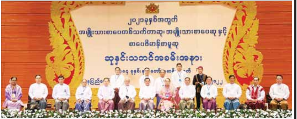
နိုင်ငံတော်စီမံအုပ်ချုပ်ရေးကောင်စီဥက္ကဋ္ဌ နိုင်ငံတော်ဝန်ကြီးချုပ် ဗိုလ်ချုပ်မှူးကြီး မင်းအောင်လှိုင်နှင့် အဖွဲ့ဝင်များ ၂၀၂၃ ခုနှစ်အတွက် အမျိုးသားစာပေ တစ်သက်တာဆု၊ အမျိုးသားစာပေဆုနှင့် စာပေပိမာန်စာပေဆုရှင်ကြသူများနှင့်အတူ မှတ်တမ်းတင်ဓာတ်ပုံရိုက်စဉ်။ (၂၃-၁၁-၂၀၂၂)

ပျို့စာပေများကြောင့် ဗုဒ္ဓ၏သာသနာ၌ ပို၍ ကြည်ညိုသူများ တိုးပွားလာခဲ့သည်။ ဗုဒ္ဓ၏ တရား တော်များနှင့်အညီ ယဉ်ကျေးသိမ်မွေ့စွာ နေထိုင် တတ်ရန် ပျို့စာပေများ ဆုံးမစာများမှာ လမ်းပြခဲ့ သည်။ အင်းဝခေတ်စာပေများသည် မြန်မာတို့အား ယဉ်ကျေးလွယ်စေခဲ့သည်။ မော်ကွန်းစာပေများက အင်းဝခေတ် မြန်မာမင်းတို့အကြောင်းကို ဂုဏ်ယူဖွယ်မှတ်တမ်းတင်နိုင်ခဲ့သည်။ ညောင်ရမ်း ခေတ်တွင် ဗုဒ္ဓ၏ဇာတ်တော်များကို ရဟန်းစာဆို တို့ကပင် စကားပြေနှင့် ရေးဖွဲ့ခဲ့ကြသည်။ ဝန်ကြီး ပဒေသာရာဇာက ညောင်ရမ်းခေတ်၏ ဆင်းရဲသား လူတန်းစားများဖြစ်ကြသော လယ်သမား၊