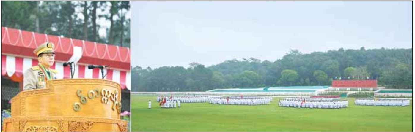
နိုင်ငံတော်စီမံအုပ်ချုပ်ရေးကောင်စီဥက္ကဋ္ဌ တပ်မတော်ကာကွယ်ရေးဦးစီးချုပ် ဗိုလ်ချုပ်မှူးကြီး သတိုးမဟာသရေစည်သူ သတိုးသိရီသုဓမ္မ မင်းအောင်လှိုင် စစ်တက္ကသိုလ် ဗိုလ်လောင်းသင်တန်းအမှတ်စဉ် (၆၅) သင်တန်းဆင်းဂုဏ်ပြု စစ်ရေးပြအခမ်းအနားတွင် မိန့်ခွန်းပြောကြားစဉ်။

စာမျက်နှာ ၃ မှ အထက်ကယုံကြည်အားကိုးပြီး လက်အောက်က လေးစားရသည့် အရာရှိကောင်းများဖြစ်အောင် ကြိုးစားသွားကြရန် မှာကြားလိုကြောင်း။