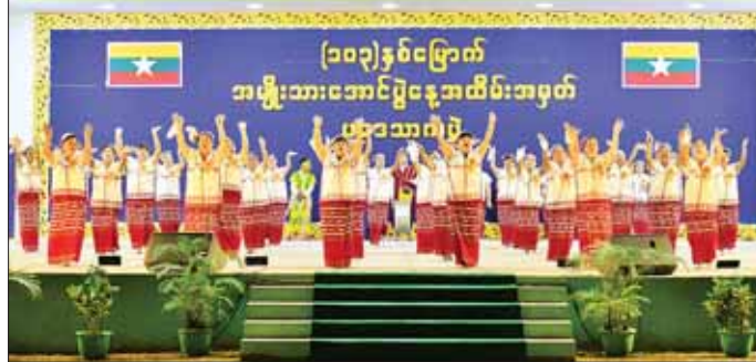
ပြည်ထောင်စုဝန်ကြီး ဦးမောင်မောင်အုန်း၊ ပြည်နယ်ဝန်ကြီးချုပ် ဦးစောမြင့်ဦးနှင့် ဇနီး ဘားအံမြို့၌ ကျင်းပသည့် (၁၀၃)နှစ်မြောက် အမျိုးသားအောင်ပွဲနေ့ အထိမ်းအမှတ် ပဒေသာကပွဲ ဖျော်ဖြေမှုကို ကြည့်ရှုအားပေးစဉ်။

အဆိုပါ ပဒေသာကပွဲကို ပြည်သူများ စိတ်ကြည်နူးချမ်းမြေ့စေရန်နှင့် အမျိုးသားအောင်ပွဲနေ့၏ အနှစ်သာရများ ရရှိခံစားနိုင်စေရန် ရည်ရွယ်ချက်ဖြင့် ပြင်ဆင်ပေးသော ပဒေသာကပွဲတွင် ဘားအံမြို့ပေါ်ရှိ အခြေခံပညာကျောင်းများမှ ကျောင်းသား ကျောင်းသူများက ငြိမ်းချမ်းတဲ့ မြန်မာပြည်၊ သွေးချင်းတို့ရဲ့ဌာနေ၊ အလှကမ္ဘာမြေ၊ ပင်လုံသက်သေချစ်သောမြေ၊ လတ်တီး တေးသီချင်းများဖြင့် တေးသရုပ်ဖော် သီဆိုကပြ ဖျော်ဖြေတင်ဆက်ကြပြီး ကရင်၊ မွန်၊ ဗမာ၊ ပအိုဝ်း၊ ရှမ်းယဉ်ကျေးမှု အဖွဲ့များက သက်ဆိုင်ရာတိုင်းရင်းသားတို့၏ ရိုးရာယဉ်ကျေးမှု အကအလှများဖြင့်လည်းကောင်း၊ Unplugged တီးဝိုင်းနှင့်တွဲဖက်၍ တေးသံရင် ဇင်ကြီး၊ ကရင်တေးသံ