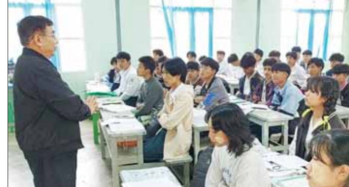
မှာကြား၍ လိုအပ်သည်များကို ဖြည့်ဆည်းဆောင်ရွက်ပေးသည်။ ထိုနေ့က ပြည်ထောင်စုဝန်ကြီးသည် စာသင်ခန်းတွင် အေးချမ်းပျော်ရွှင်စွာ ပညာသင်ကြားနေသည့် ကျောင်းသားကျောင်းသူများနှင့် တွေ့ဆုံ၍ (အပေါ့ပျံ့)ပညာကို ကြိုးစားသင်ယူကြရန်နှင့် ပညာကို အမှန်တကယ် တတ်မြောက်မှသာ မိမိတို့ရည်မှန်းချက်များကို အောင်မြင်အောင် ဆောင်ရွက်နိုင်မည် ဖြစ်ကြောင်း အားပေးစကား ပြောကြားသည်။ ထိုအတူ ယမန်နေ့က ပြည်ထောင်စုဝန်ကြီးသည် ပြင်ဦးလွင်မြို့ အမှတ် (၁) အခြေခံပညာ အထက်တန်းကျောင်း၊ အမှတ်(၃) အခြေခံပညာ အထက်တန်းကျောင်းများ သို့ သွားရောက်ကြည့်ရှုစစ်ဆေးပြီး လိုအပ်သည်များကို ဖြည့်ဆည်းဆောင်ရွက်ပေးခဲ့ကြောင်း သိရသည်။ သတင်းစဉ်

(မိုးကြိုးစံပြ) သို့ ရောက်ရှိပြီး ကျောင်းအတွင်း လည်လည်ကြည့်ရှုစစ်ဆေးကာ ကျောင်းဥပမိရပ်ကောင်းမွန်ရေး၊ ကျောင်းနှင့် ဝန်းကျင် သန့်ရှင်းသာယာရေး ဆောင်ရွက်ကြရန် ဆရာ ဆရာမများအနေဖြင့် ကျောင်းသားကျောင်းသူများကို အမှန်တကယ် ပညာတတ်၍ နိုင်ငံတော်က အားထားရသည့် ဗလင်းတန်နှင့် ပြည့်စုံသည့် လူတော်လူကောင်းများဖြစ်အောင် ပြုစုပျိုးထောင်သင်ကြားပေးကြရန်နှင့် ကျောင်းသား ကျောင်းသူများ၏ ပညာသင်ယူမှု အခွင့်အလမ်း အပြည့်အဝရရှိစေရန် ဆရာ ဆရာမများအားလုံးက ပိုင်းဝန်းလက်တွဲဆောင်ရွက်ပေးကြစေလိုကြောင်း