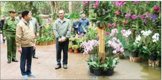
နိုင်ငံတော်စီမံအုပ်ချုပ်ရေးကောင်စီဥက္ကဋ္ဌ နိုင်ငံတော်ဝန်ကြီးချုပ် ဗိုလ်ချုပ်မှူးကြီး မင်းအောင်လှိုင် အမျိုးသားကန်တော်ကြီးဥယျာဉ် သစ်ခွေဥယျာဉ်၌ ပြသထားရှိမှုများကို ကြည့်ရှုစဉ်။

ယင်းနောက် နိုင်ငံတော်စီမံအုပ်ချုပ်ရေးကောင်စီဥက္ကဋ္ဌ နိုင်ငံတော်ဝန်ကြီးချုပ်နှင့် အဖွဲ့ဝင်များသည် အမျိုးသားကန်တော်ကြီးဥယျာဉ်အတွင်း မော်တော်ယာဉ်များဖြင့် လှည့်လည်ကြည့်ရှု၍ လိပ်ပြာပြတိုက်၊ သစ်ခွေဥယျာဉ်တို့၌ ပြသထားရှိမှုများ၊ ဒေသပန်းမျိုးများ သုတေသနစင်တာနှင့် စမ်းသပ်စိုက်ခင်းအတွင်း သုတေသနပြုစိုက်ပျိုးစမ်းသပ်ထားရှိမှုများ၊ တီကွပ်မြေဥပဒေထုတ်လုပ်ထားရှိမှုအခြေအနေများကို စစ်ဆေးပြီး (အောက်ပုံ) တာဝန်ရှိသူများ၏ တင်ပြချက်များအပေါ် လိုအပ်သည်များ ဆွေးနွေးမှာကြားသည်။