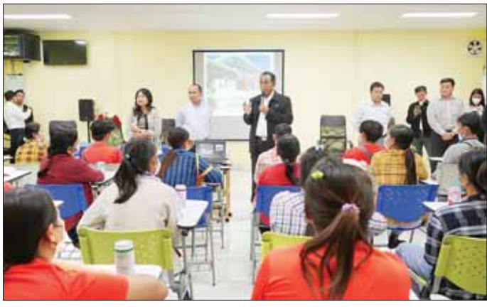
ပေးအပ်သည်။ ရှင်းလင်းတင်ပြထိုနေ့က ပြည်ထောင်စုဝန်ကြီး၊ မြန်မာသံအမတ်ကြီးနှင့် မြန်မာကိုယ်စားလှယ်အဖွဲ့တို့သည် ထိုင်းဘက် ၅ သန်း ကုမ္ပဏီ The First Good Man Group Co., Ltd မှ တာဝန်ရှိသူများနှင့် တွေ့ဆုံဆွေးနွေးရာ တာဝန်ရှိသူများက ထိုင်းဘက်ခြမ်းတွင် MoU စနစ်အရ လုပ်ငန်းစဉ်ဆောင်ရွက်နေမှုများနှင့် စပ်လျဉ်း၍ ရှင်းလင်းတင်ပြပြီး ပြည်ထောင်စုဝန်ကြီးက သိရှိလိုသည်များကို မေးမြန်းခဲ့ကာ ဘက် ၅ သန်း အေဂျင်စီအနေဖြင့် ဥပဒေ၊ စည်းမျဉ်း၊ စည်းကမ်း၊ လုပ်ထုံးလုပ်နည်းများနှင့် အညီ အလုပ်ရှင်၊ အလုပ်သမားပြသနာများကို မျှမျှတတ ဝန်ဆောင်မှုပေးရန် ပြောကြားသည်။ သတင်းစဉ်

ကို တွေ့ဆုံ၍ Remittance Management System Mobile Application ဖြင့် တရားဝင်လမ်းကြောင်းမှ ငွေလွှဲစနစ် အကြောင်းကို ရှင်းလင်းပြောကြား၍ လက်တွေ့သရုပ်ပြသပြီး မြန်မာလုပ်သားများအနေဖြင့် လုပ်ငန်းခွင် စည်းမျဉ်းစည်းကမ်းများ လိုက်နာရေးနှင့် အလုပ်သမားဥပဒေပါရပိုင်ခွင့်များ ပြည့်ပြည့်ဝဝရရှိရေး အခြေခံပဟူသောအခက်အခဲများနှင့် လုပ်ငန်းခွင် အခက်အခဲဖြည့်ဆည်းပေးအပ်နိုင်ရန် အကျိုးဆောင်လိုစင်စင် မြန်မာအေဂျင်စီများထံ ဆက်သွယ်ရန်၊ အလုပ်သမား သံအရာရှိရုံးနှင့် ဝန်ကြီးဌာနသို့ အချိန်မရွေး ဆက်သွယ် အကူအညီတောင်းခံရန် ပြောကြားပြီး ပြည်ထောင်စုဝန်ကြီးသည် အလုပ်သမားတစ်ဦးချင်းအား ထောက်ပံ့ငွေများ