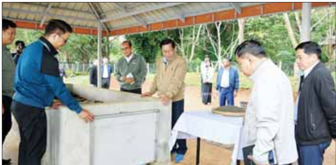
နိုင်ငံတော်စီမံအုပ်ချုပ်ရေးကောင်စီဥက္ကဋ္ဌ နိုင်ငံတော်ဝန်ကြီးချုပ် ဗိုလ်ချုပ်မှူးကြီး မင်းအောင်လှိုင် အမျိုးသားကန်တော်ကြီးဥယျာဉ် သစ်ခွေဥယျာဉ်၌ ပြသထားရှိမှုများကို ကြည့်ရှုစဉ်။