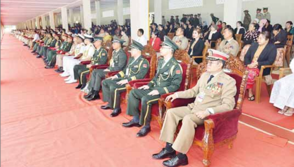
စစ်တက္ကသိုလ် ဗိုလ်လောင်းသင်တန်းအမှတ်စဉ် (၆၅) သင်တန်းဆင်းဂုဏ်ပြု စစ်ရေးပြအခမ်းအနားတွင် တက်ရောက်လာကြသူများကို တွေ့ရစဉ်။