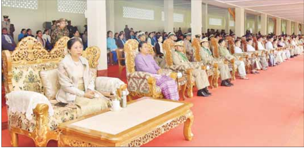
စစ်တက္ကသိုလ် ဗိုလ်လောင်းသင်တန်းအမှတ်စဉ် (၆၅) သင်တန်းဆင်းဂုဏ်ပြု စစ်ရေးပြအခမ်းအနားတွင် တက်ရောက်လာကြသူများကို တွေ့ရစဉ်။

ထို့အပြင် တပ်မတော်သားများ ဖြစ်ရုံသာမက နိုင်ငံသားတစ်ဦးလည်းဖြစ်သည့်အတွက် တပ်မတော် က ချမှတ်ထားသည့် အမိန့်နှင့်ညွှန်ကြားချက်များ အပါအဝင် နိုင်ငံတော်ကပြဋ္ဌာန်းထားသည့် ဥပဒေနှင့် စည်းကမ်းများကိုလည်း စံနမူနာပြုလေးစားလိုက်နာ ကျင့်သုံးပြီး လက်အောက်ငယ်သားများကိုပါ လိုက်နာ မှုရှိစေရေး ကြပ်မတ်ဆောင်ရွက်သွားကြရန်လိုအပ် ကြောင်း၊ ပေးအပ်လာသည့်တာဝန်များကို ထမ်း ဆောင်ရာတွင် မိမိကိုယ်ကိုသစ္စာရှိရန်၊ မိမိအလုပ်