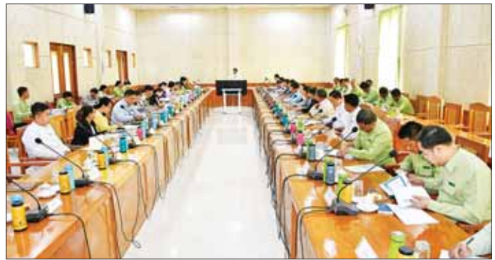
ထို့နောက် တက်ရောက်လာကြသည့် တာဝန် ရှိသူများက ကုန်ဈေးနှုန်းတည်ငြိမ်ရေးအတွက် ဆောင်ရွက်ချက်များ မူဝါဒနှင့်အညီ စားအုန်းဆီများ ဖြန့်ဖြူးရောင်းချနေမှု၊ စားသုံးဆီများ ဖူလုံစေရေး အတွက် ဆီထွက်သီးနှံများစိုက်ပျိုးထားမှု၊ ကြိတ်ခွဲမှု တို့နှင့်စပ်လျဉ်း၍ သက်ဆိုင်ရာကဏ္ဍအလိုက် ဆွေးနွေး တင်ပြကြသည်။

ရွက်ကြစေလိုကြောင်း၊ ကုန်စည်ဝင်/ထွက်များ မျှတ မှုရှိ/မရှိနှင့် စုံစမ်းစစ်ဆေးခြင်းများ၊ ကုန်စည်စီးဆင်း မှုနှုန်းကန့်စားရေးနှင့် လုံလောက်စွာ ဝင်ရောက်ရေး၊ အခြေခံ ကုန်ပစ္စည်းများ ထုတ်လုပ်တိုးချဲ့နိုင်ရေးနှင့် ကုန်ဈေးနှုန်းတည်ငြိမ်ရေးတို့ကို ပေါင်းစပ်ညှိနှိုင်း ဆောင်ရွက်ရမည်ဖြစ်ကြောင်း၊ နေပြည်တော်အတွင်း ကုန်ဈေးနှုန်းတည်ငြိမ်ရေးအတွက် အခြေခံစားသောက် ကုန်များဖြစ်သည့် စိုက်ပျိုးရေးနှင့် မွေးမြူရေးကဏ္ဍမှ ထုတ်ကုန်များ ထုတ်လုပ်မှု တိုးတက်လာစေရန်နှင့် One Region One Product များကို ပိုမိုအကောင် အထည်ဖော် ဆောင်ရွက်နိုင်ရေး ပူးပေါင်းဆောင်ရွက် ကြစေလိုကြောင်း ပြောကြားသည်။ (အပေါ်ယာပုံ)