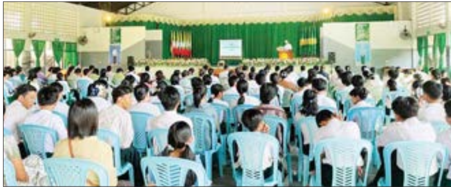
အလုံမြို့နယ် အမျိုးသားအောင်ပွဲနေ့ အခမ်းအနားကို ဒီဇင်ဘာ ၇ ရက် နံနက် ၉ နာရီက အထက်(၄)၌ ကျင်းပရာ မြို့နယ် စီမံအုပ်ချုပ်ရေးအဖွဲ့ဥက္ကဋ္ဌဦးဆန်းထွန်းက နိုင်ငံတော် စီမံအုပ်ချုပ်ရေးကောင်စီဥက္ကဋ္ဌ နိုင်ငံတော်ဝန်ကြီးချုပ် ဗိုလ်ချုပ်မှူးကြီး သတိုးမဟာသရေစည်သူ သတိုးသီရိသုဓမ္မ မင်းအောင်လှိုင်ထံမှပေးပို့လာသော သဝဏ် လွှာကို ဖတ်ကြားစဉ်။

ထို့နောက် ပဲခူးတိုင်းဒေသ ကြီး(အနောက်ပိုင်း)၊ ပြည်၊ သာယာ ဝတီနှင့် နတ်တလင်းခရိုင်အတွင်း မြို့နယ်များရှိအခြေခံပညာကျောင်း များမှ အမျိုးသားအောင်ပွဲနေ့ ဆိုင်ရာ အခြေခံပညာအထက် တန်း၊ အလယ်တန်းနှင့် မူလတန်း အဆင့် (စာစီစာကုံး၊ ကဗျာ၊ ပန်းချီ) ပြိုင်ပွဲများတွင် ပထမ၊ ဒုတိယနှင့် တတိယဆုရကျောင်း သား ကျောင်းသူများအား ခရိုင် စီမံအုပ်ချုပ်ရေး အဖွဲ့ဥက္ကဋ္ဌနှင့် တာဝန်ရှိသူများက ဂုဏ်ပြုဆုများ ချီးမြှင့်ပေးအပ်ကြောင်း သိရ သည်။ ကိုဆက်(ပြန်/ဆက်)