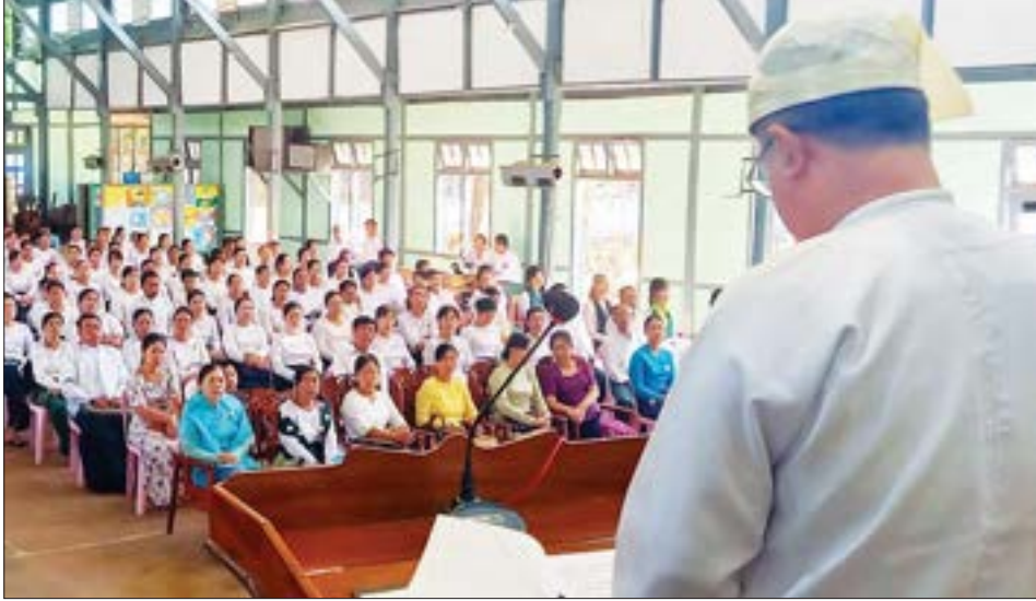
သံဖြူဇရပ်မြို့နယ်တွင် (၁၀၃)နှစ်မြောက် အမျိုးသားအောင်ပွဲနေ့အထိမ်းအမှတ် အခမ်းအနားကို ယနေ့ နံနက် ၉ နာရီက အမှတ်(၂)အခြေခံပညာအထက်တန်းကျောင်း၌ ကျင်းပရာ မြို့နယ်စီမံအုပ်ချုပ်ရေး အဖွဲ့ဥက္ကဋ္ဌ ဦးအောင်မိုးလွင် သဝဏ်လွှာဖတ်ကြားသည်။ မြို့နယ်(ပြန်/ဆက်)

နိုင်ငံတစ်ဝန်းရှိ မြို့နယ်များ၌ (၁၀၃)နှစ်မြောက် အမျိုးသားအောင်ပွဲနေ့ အထိမ်းအမှတ်အခမ်းအနားများ၊ ပြည်ထောင်စုသမ္မတမြန်မာနိုင်ငံတော် နိုင်ငံတော်စီမံအုပ်ချုပ်ရေးကောင်စီဥက္ကဋ္ဌ နိုင်ငံတော်ဝန်ကြီးချုပ် ဗိုလ်ချုပ်မှူးကြီး သတိုးမဟာသရေစည်သူ သတိုးသီရိသုဓမ္မ မင်းအောင်လှိုင်ထံမှ (၁၀၃)နှစ်မြောက် အမျိုးသားအောင်ပွဲနေ့အခမ်းအနားသို့ ပေးပို့သည့် သဝဏ်လွှာဖတ်ကြားပွဲများကို ဒီဇင်ဘာ ၇ ရက် နံနက်ပိုင်းက ကျင်းပဆောင်ရွက်နေမှု မြင်ကွင်းဓာတ်ပုံများ။