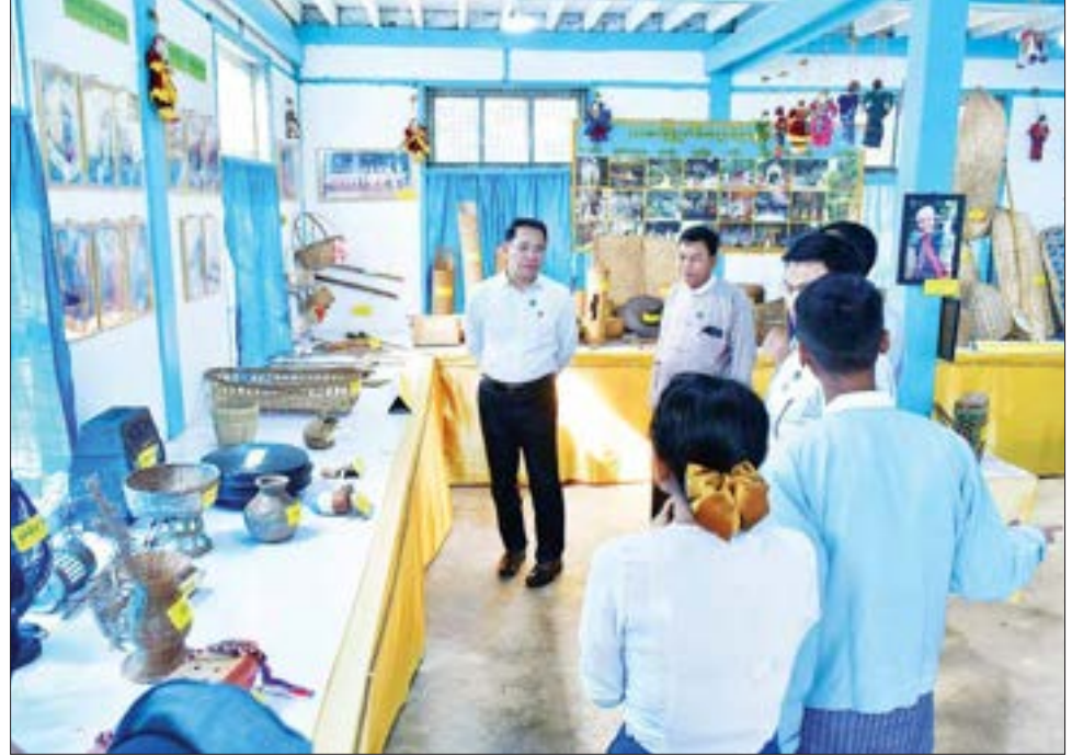
ပြည်ထောင်စုဝန်ကြီး ဦးမောင်မောင်အုန်း ဘားအံခရိုင် ပြန်ကြားရေးနှင့်ပြည်သူ့ဆက်ဆံရေးဦးစီးဌာန ရုံးရှိ ပြတိုက်ငယ်အတွင်း ခင်းကျင်းပြသထားသောပစ္စည်းများကို လှည့်လည်ကြည့်ရှုစဉ်။

ဆက်လက်၍ ပြည်ထောင်စု ဝန်ကြီးသည် မြန်မာ့အသံနှင့် ရုပ်မြင်သံကြား ထပ်ဆင့်လွှင့် စက်ရုံ (ဘားအံ) ကို ကြည့်ရှု စစ်ဆေးပြီး ဝန်ထမ်းများအား ထောက်ပံ့ငွေများ ပေးအပ်ခဲ့သည်။ သတင်းစဉ်