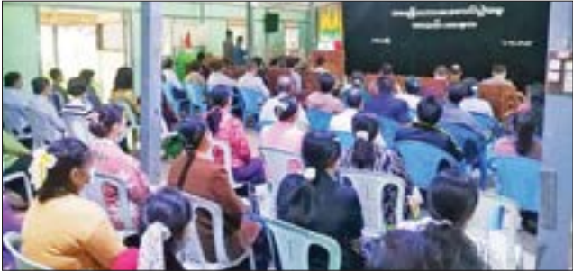
ကျောင်းသား ကျောင်းသူများကို ခရိုင်စီမံအုပ်ချုပ်ရေးအဖွဲ့ဥက္ကဋ္ဌ ဦးဆန်းမော်၊ မြို့နယ်စီမံအုပ်ချုပ်ရေးအဖွဲ့ဥက္ကဋ္ဌ ဦးမျိုးမင်းသန့်နှင့် တာဝန်ရှိသူများက ဆုချီးမြှင့်ပေးအပ်သည်။ ခရိုင် (ပြန်/ဆက်)

ယင်းမာပင် ဒီဇင်ဘာ ၇ စစ်ကိုင်းတိုင်းဒေသကြီး ယင်းမာပင်မြို့၌ (၁၀၃)နှစ်မြောက် အမျိုးသားအောင်ပွဲနေ့အခမ်းအနားကို ယနေ့နံနက်ပိုင်းက မြို့နယ်အထွေထွေအုပ်ချုပ်ရေးဦးစီးဌာန၌ ကျင်းပသည်။(ယာပုံ) ရှေးဦးစွာ ပြည်ထောင်စုသမ္မတမြန်မာနိုင်ငံတော် နိုင်ငံတော်စီမံအုပ်ချုပ်ရေးကောင်စီဥက္ကဋ္ဌ နိုင်ငံတော်ဝန်ကြီးချုပ် ဗိုလ်ချုပ်မှူးကြီး သတိုးမဟာသရေစည်သူ သတိုးသီရိသုဓမ္မ မင်းအောင်လှိုင်ထံမှ (၁၀၃)နှစ်မြောက် အမျိုးသားအောင်ပွဲနေ့ အခမ်းအနားသို့ ပေးပို့သည့် သဝဏ်လွှာကို ခရိုင်စီမံအုပ်ချုပ်ရေးအဖွဲ့ဥက္ကဋ္ဌ ဦးဆန်းမော်က ဖတ်ကြားသည်။ ထို့နောက် (၁၀၃)နှစ်မြောက် အမျိုးသားအောင်ပွဲနေ့အထိမ်းအမှတ်အလယ်တန်း၊ မူလတန်း(အဆင့်) စာစီစာကုံးပြိုင်ပွဲများတွင် ဆုရရှိသော