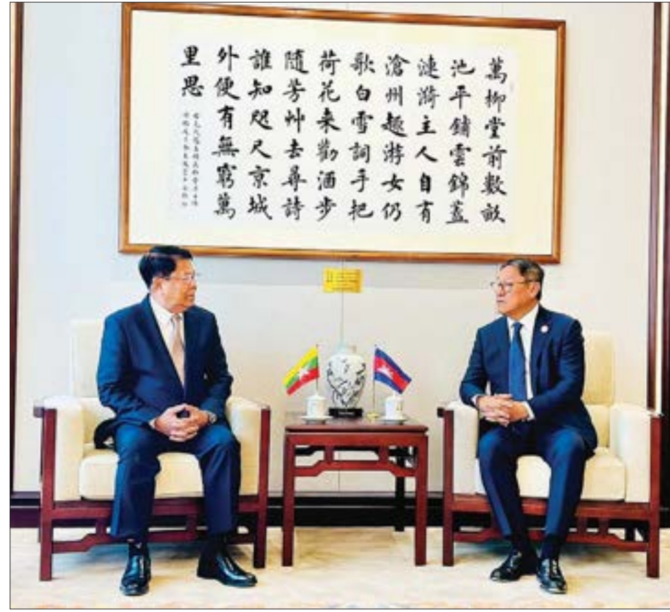
ဒုတိယဝန်ကြီးချုပ်နှင့် နိုင်ငံခြားရေးဝန်ကြီးဌာန ပြည်ထောင်စုဝန်ကြီး ဦးသန်းဆွေနှင့် ကမ္ဘောဒီးယားနိုင်ငံ ဒုတိယဝန်ကြီးချုပ်၊ နိုင်ငံခြားရေးနှင့် အပြည်ပြည်ဆိုင်ရာ ပူးပေါင်းဆောင်ရွက်ရေးဝန်ကြီးဌာန ဝန်ကြီး မစ္စတာ ဆုပ်ဂျန်ဒါ ဆိုဖီအာ တို့ တွေ့ဆုံဆွေးနွေးစဉ်။

အလားတူ ဒုတိယဝန်ကြီးချုပ်နှင့် နိုင်ငံခြားရေးဝန်ကြီးဌာန ပြည်ထောင်စုဝန်ကြီး ဦးသန်းဆွေနှင့် ထိုင်းနိုင်ငံ ဒုတိယဝန်ကြီးချုပ်နှင့် နိုင်ငံခြားရေးဝန်ကြီး မစ္စတာ ပန်ပရီ ဘာဟီဒါ နူကာရာတို့သည် ယနေ့နံနက် ၁၀ နာရီခွဲတွင် ပေကျင်းမြို့ရှိ China World ဟိုတယ်၌ တွေ့ဆုံဆွေးနွေးကြသည်။ ထိုသို့တွေ့ဆုံရာတွင် နှစ်ဖက် ဒုတိယဝန်ကြီးချုပ်နှင့် နိုင်ငံခြားရေးဝန်ကြီးတို့သည် မြန်မာ-ထိုင်း နိုင်ငံအကြား ရှိရင်းစွဲ ချစ်ကြည်ရင်းနှီးသော ဆက်ဆံရေးနှင့် နှစ်နိုင်ငံ ပူးပေါင်းဆောင်ရွက်မှု သတင်းစဉ်