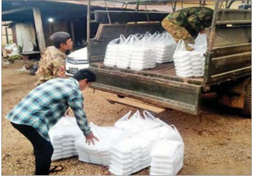
ဒံပေါက်ထမင်းဘူးများနှင့်အတူ ရဟတ်ယာဉ်များဖြင့် လိုက်လံပို့ဆောင်ပေးကြသည်။