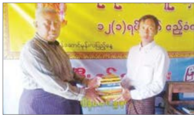
(၁၀၃) နှစ်မြောက် အမျိုးသားအောင်ပွဲနေ့ကို ဂုဏ်ပြုသောအားဖြင့် မန်းအောင်ငြိမ်းဖောင်ဒေးရှင်းမှ လှူဒါန်းသည့် မြန်မာ၊ အင်္ဂလိပ်ဘာသာ ဖြင့် ထုတ်ဝေထားသည့် ဘာသာရေးဆိုင်ရာ ဓမ္မရသစာအုပ်များကို လယ်ဝေးမြို့နယ် စာရေးဆရာအသင်းက ရသေ့ချောင်းကျေးရွာ ဘဝသစ် ကိုယ်ပိုင်စာကြည့်တိုက်၊ ပေါက်မြိုင်ကျေးရွာ အခြေခံပညာအလယ်တန်း ကျောင်းစာကြည့်တိုက်၊ ပင်းပြင်ကျေးရွာအခြေခံပညာအထက်တန်း ကျောင်းစာကြည့်တိုက်နှင့် ပြင်ဦးလွင်မြို့ မြေပုံမြို့မ မဟာစည် သာသနာ့ရိပ်သာ ဓမ္မစာကြည့်တိုက်တို့ကို ဒီဇင်ဘာ ၇ ရက်က ပေးအပ်လှူဒါန်းစဉ်။ ဇော်ဘီ