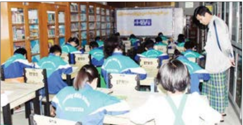
(၁၀၃)နှစ်မြောက် အမျိုးသားအောင်ပွဲနေ့အထိမ်းအမှတ် ဆေးရောင်ခြယ်၊ ပန်းချီ စကားပုံဆက်၊ ဉာဏ်စမ်းပပေးပွဲပြိုင်ပွဲနှင့် ဆုချီးမြှင့်ပေးအပ်ပွဲကို ဒီဇင်ဘာ ၇ ရက် နံနက်ပိုင်းက မြစ်ကြီးနားမြို့ လူထုအခြေပြုပဟိန္ဒာနခန်းမ၌ ကျင်းပစဉ်။ ခရိုင်(ပြန်/ဆက်)