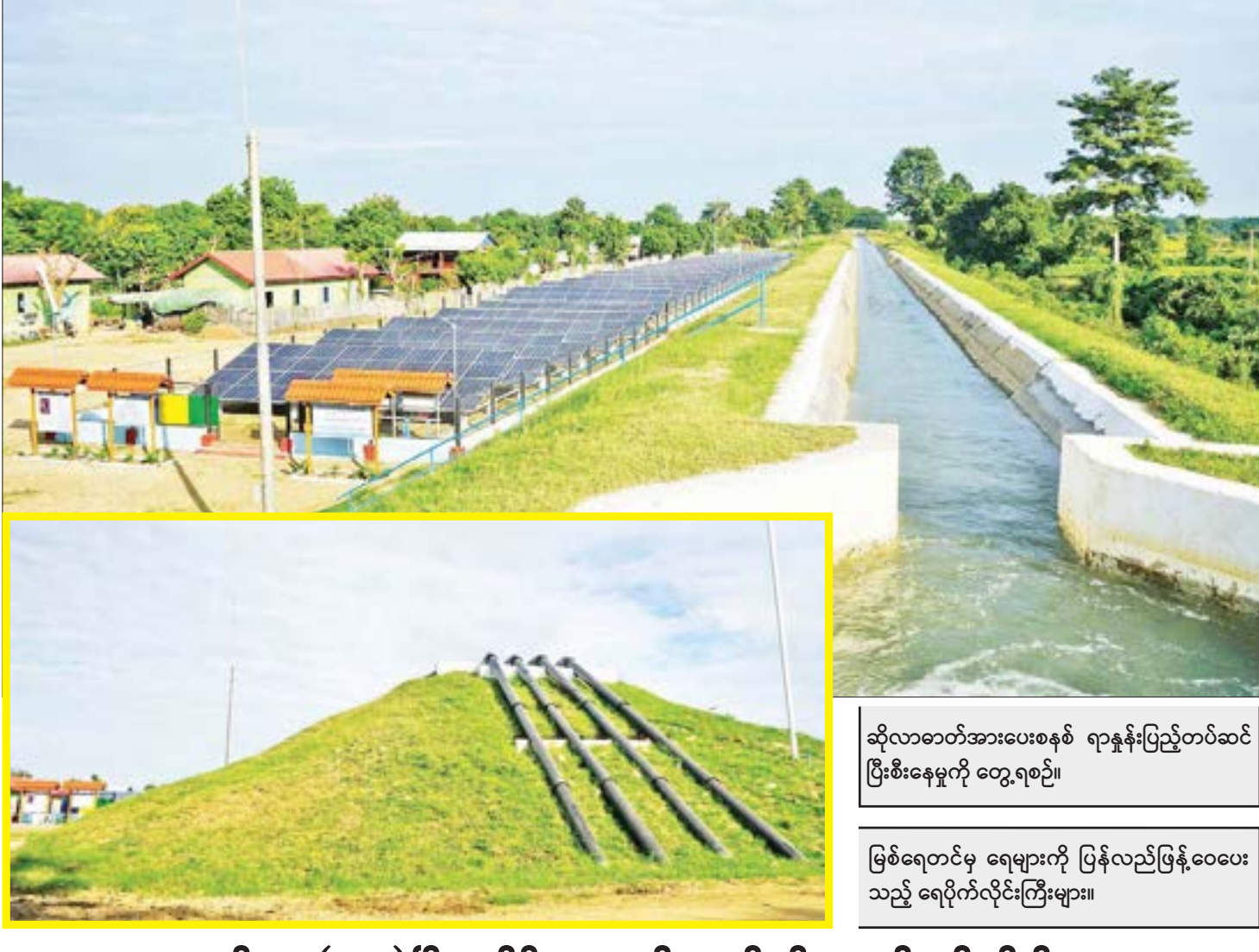
ဆိုလာဓာတ်အားပေးစနစ် ရာနှုန်းပြည့်တပ်ဆင် ပြီးစီးနေမှုကို တွေ့ရစဉ်။