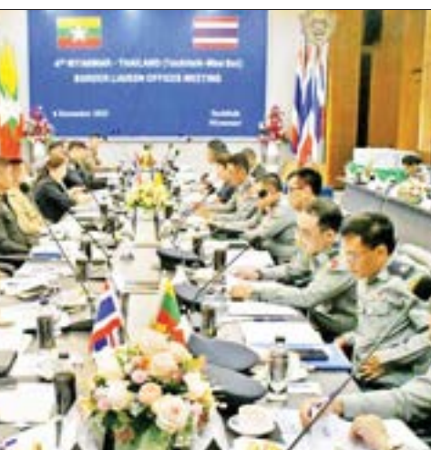
ကြိုးစားနေသဖြင့် မြန်မာ-ထိုင်းနှစ်နိုင်ငံ လူဝင်/ထွက်မှုများအပေါ် စောင့်ကြည့် စစ်ဆေး ကြပ်မတ်ရမည်ဖြစ်ကြောင်းနှင့် မြန်မာ-ထိုင်း နယ်စပ်ဒေသတည်ငြိမ် အေးချမ်းမှုကို ပျက်ပြားစေမည့်

Kidan တို့က အမှာစကားပြောကြား၍ နှစ်နိုင်ငံကိုယ်စားလှယ်များ အပြန်အလှန် မိတ်ဆက်ကာ ထိုင်းနိုင်ငံသားများအား အရေးယူဆောင်ရွက်မှု ထိုင်းနိုင်ငံသား တရားခံပြေးများ နယ်မြေအတွင်းစုံစမ်းမှု အခြေအနေများ၊ ထိုင်းနိုင်ငံသို့ တရားခံ ပြေးများ ပြန်လည်လွှဲပြောင်းပေးနိုင်မှု နှင့် ပြည်နှင့်လွှဲပြောင်းပေးမှုအခြေအနေ များ၊ နှစ်နိုင်ငံအကြောင်းကြားမှုအရ ကူညီစုံစမ်းပေးနိုင်မှု အခြေအနေများ၊ ရှမ်းပြည်နယ် (မြောက်ပိုင်း) နယ်စပ် ဒေသတွင် အကြမ်းဖက်သောင်းကျန်းသူ များ၏ အကြမ်းဖက်လုပ်ရပ်များကြောင့် ပြည်သူလူထုများ ဒုက္ခရောက်နေပြီး အကြမ်းဖက် သောင်းကျန်းသူများသည် ပြည်သူလူထုများနှင့် ရောနှောကာ မြန်မာနိုင်ငံဘက်မှ ထိုင်းနိုင်ငံဘက်သို့ လမ်းကြောင်းအမျိုးမျိုးမှ ဝင်ရောက်ရန်