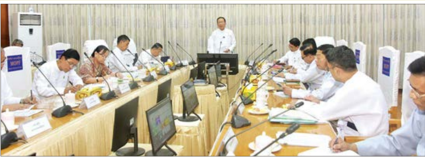
ပြည်ထောင်စုကုန်ဈေးနှုန်း တည်ငြိမ်ရေးကော်မတီဥက္ကဋ္ဌ၊ ဒုတိယဝန်ကြီးချုပ်နှင့် ပြည်ထောင်စုဝန်ကြီး ဦးဝင်းရှိန် ပြည်ထောင်စုကုန်ဈေးနှုန်းတည်ငြိမ်ရေးကော်မတီ (၂/၂၀၂၃) အစည်းအဝေးတွင် အမှာစကားပြောကြားစဉ်။

စားအုန်းဆီဖြန့်ဝေရန် လျာထားမှု၊ သတ်မှတ်သည့်နေရာသို့ အမှတ်တကယ် ရောက်ရှိမှု ရှိ/မရှိ၊ ဈေးကွက်အတွင်း အမှတ်တကယ်ဖြန့်ဖြူးရောင်းချပေးမှု ရှိ/မရှိ ကြပ်မတ်ဆောင်ရွက်ရေး၊ စားအုန်းဆီ တင်သွင်းမှုပမာဏ အပြည့်အဝဖြစ်စေရေးနှင့် ပြည်ပသို့ ဆန်တင်ပို့မည့်သူများကို သတ်မှတ်ချက်များနှင့် ကိုက်ညီမှု ရှိ/မရှိ စိစစ်ပြီးမှ လိုင်စင်ထုတ်ပေးနိုင်ရေးတို့ကို ဆွေးနွေးဆောင်ရွက်လျက်ရှိကြောင်း၊ စားသုံးဆီတင်သွင်းသို့လှောင်ဖြန့်ဖြူးခြင်းလုပ်ငန်းကြီးကြပ်ရေးကော်မတီက သက်ဆိုင်ရာ တိုင်းဒေသ