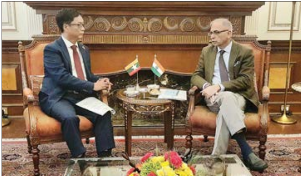
အကြား မူဝါဒရေးရာ ညှိနှိုင်းဆွေးနွေးပွဲသို့ တက်ရောက်ပြီး အိန္ဒိယပြည်ပရေးရာဝန်ကြီးဌာန နိုင်ငံခြားရေးအတွင်းဝန် မစ္စတာ ဝိနော့ မိုဟာန်ကွာထရာနှင့်အတူ ပူးတွဲသဘာပတိအဖြစ် ဆောင်ရွက်သည်။ ဆွေးနွေးပွဲတွင် မြန်မာ-အိန္ဒိယ နှစ်နိုင်ငံဆက်ဆံရေးနှင့် ပူးပေါင်းဆောင်ရွက်မှုတိုးမြှင့်ရေး၊ နှစ်နိုင်ငံနယ်နိမိတ်ဆိုင်ရာ ကိစ္စရပ်များနှင့် နယ်စပ်ဒေသ ပူးပေါင်းဆောင်ရွက်ရေး၊ လုံခြုံရေးနှင့် ကာကွယ်ရေးကဏ္ဍ ပူးပေါင်းဆောင်ရွက်မှုများ၊ အိန္ဒိယနိုင်ငံ၏ အကူအညီဖြင့် ဆောင်ရွက်လျက်ရှိသည့် စီမံကိန်းများ၏ ဖြစ်ပေါ်တိုးတက်မှု အခြေအနေများ၊

နေပြည်တော် ဒီဇင်ဘာ ၇ နိုင်ငံခြားရေးဝန်ကြီးဌာန ဒုတိယဝန်ကြီး ဦးလွင်ဦး ဦးဆောင်သော မြန်မာကိုယ်စားလှယ်အဖွဲ့သည် အကြိမ် (၂၀) မြောက် မြန်မာ-အိန္ဒိယ နှစ်နိုင်ငံ နိုင်ငံခြားရေးဝန်ကြီးဌာနများအကြား မူဝါဒရေးရာ ညှိနှိုင်းဆွေးနွေးပွဲသို့ တက်ရောက်ရန် အိန္ဒိယသမ္မတနိုင်ငံ နယူးဒေလီမြို့သို့ ဒီဇင်ဘာ ၄ ရက်မှ ၆ ရက်အထိ သွားရောက်ခဲ့ပြီး ယနေ့တွင် ရန်ကုန်မြို့သို့ ပြန်လည်ရောက်ရှိကြသည်။ ဒုတိယဝန်ကြီးသည် ဒီဇင်ဘာ ၆ ရက် ဒေသစံတော်ချိန် မွန်းတည့် ၁၂ နာရီတွင် နယူးဒေလီမြို့ရှိ ဟိုက်ဒြာဘတ် အစိုးရဧည့်ဂေဟာ၌ ကျင်းပသည့် အကြိမ် (၂၀) မြောက် မြန်မာ-အိန္ဒိယ နှစ်နိုင်ငံ နိုင်ငံခြားရေး ဝန်ကြီးဌာနများ