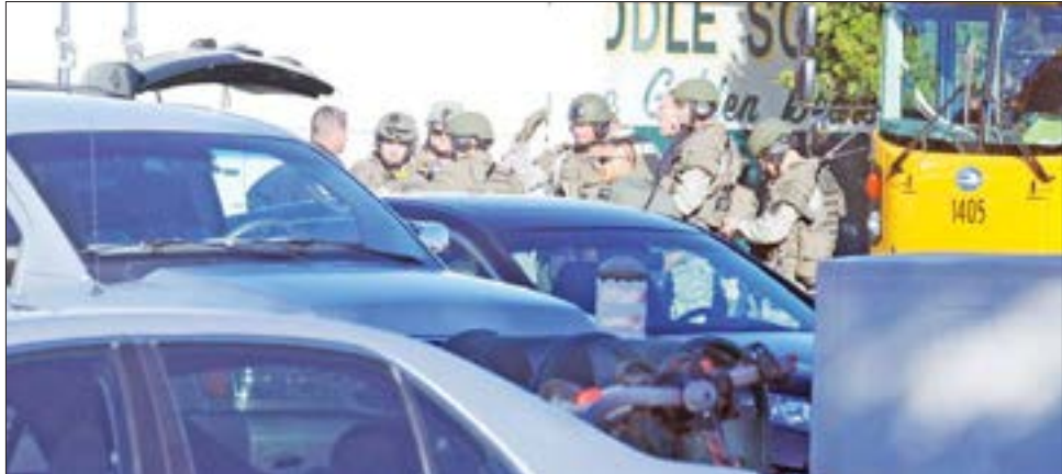
သက်ဆိုင်ရာတာဝန်ရှိသူများ အခင်းဖြစ်ပွားရာနေရာတွင် လုံခြုံရေးဆောင်ရွက်နေသည်ကို တွေ့ရစဉ်။

တက္ကသိုလ်ဝင်းအတွင်းလုံခြုံမှုရှိပြီး အတည်ပြုခဲ့သည်။ ပြီးခဲ့သည့် အောက်တိုဘာလအတွင်းကလည်း မိန်းပြည်နယ် ဘိုးလင်းကစားသည့်နေရာနှင့် အရက်ဆိုင်တို့တွင် သေနတ်ဖြင့် ပစ်ခတ်မှုကြောင့် လူ ၁၈ ဦးထက်မနည်း သေဆုံးခဲ့ရသည်။ ဒီဇင်ဘာ ၆ ရက်က တက္ကသိုလ်ဝင်းအတွင်း ကျောင်းသားများစွာရှိနေစဉ်ဖြစ်ပွားခဲ့သည့်ပစ်ခတ်မှု ဟူ၍ အမေရိကန်မီဒီယာများတွင် အကျယ်တဝင့် ဖော်ပြလျက်ရှိသည်။ အင်န်အိတ်ချ်ကေ