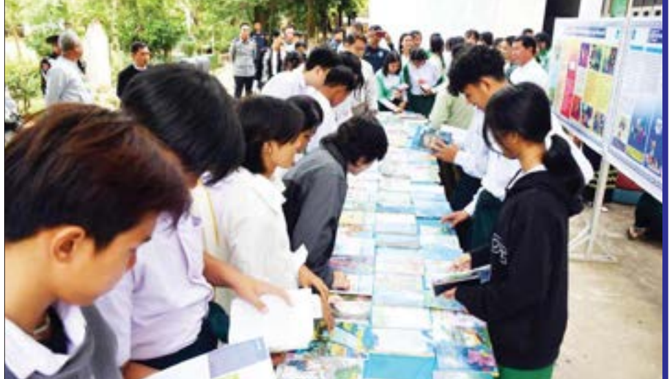
တာချီလိတ်မြို့၌ အထက(ဆန်ဆိုင်) ကျောင်းခန်းမ၌ ယနေ့နံနက် ၉ နာရီက (၁၀၃)နှစ်မြောက် အမျိုးသားအောင်ပွဲနေ့အထိမ်းအမှတ် နံရံကပ်စာစောင်နှင့်စာအုပ်စာစောင်များပြပွဲကျင်းပရာကျောင်းသား ကျောင်းသူများ စိတ်ပါဝင်စားစွာလေ့လာကြစဉ်။ ခရိုင်(ပြန်/ဆက်)