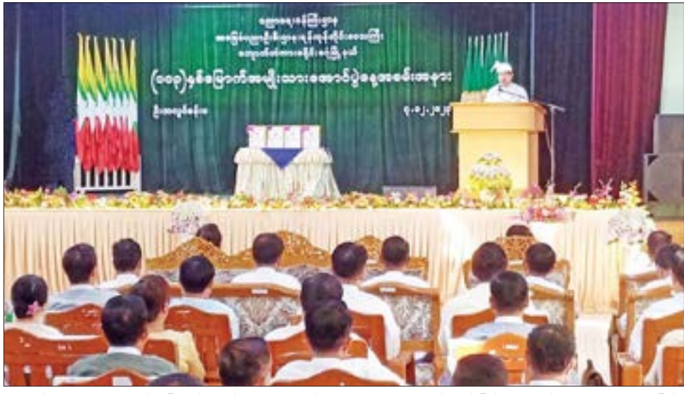
ထိုအတူ (၁၀၃) နှစ်မြောက် အမျိုးသားအောင်ပွဲ နေ့ဆွမ်းဆက်ကပ်ခြင်း၊ စတုဒိသာ ကျွေးမွေးခြင်း နေ့တွင် အထက(၂)ဒဂုံမြို့မကျောင်းသား ကျောင်းသူ ပြုလုပ်ခဲ့ကြကြောင်း သိရသည်။ ဟောင်းများက ဆရာတော်သံဃာတော်များအား အကာလင်း၊ ဓာတ်ပုံ-တင်စိုး

နိုင်ငံတော်ဝန်ကြီးချုပ် ဗိုလ်ချုပ်မှူးကြီး သတိုးမဟာ သရေစည်သူ သတိုးသီရိသုဓမ္မ မင်းအောင်လှိုင်ထံမှ ပေးပို့သော (၁၀၃) နှစ်မြောက် အမျိုးသားအောင်ပွဲနေ့ သဝဏ်လွှာကို တိုင်းဒေသကြီး ဝန်ကြီးချုပ်က ဖတ်ကြားသည်။ (ယာဝုံ) ဆက်လက်၍ (၁၀၃) နှစ်မြောက် အမျိုးသားအောင်ပွဲနေ့နှင့်ပတ်သက်၍ အထက(၂) ဒဂုံ(မြို့မ) ကျောင်း၏ ကျောင်း အကျိုးတော်ဆောင်နာယက ဗိုလ်ချုပ်စိန်ထွား(ငြိမ်း) က ရှင်းလင်းပြောကြားသည်။ ထို့နောက် (၁၀၃) နှစ်မြောက် အမျိုးသား အောင်ပွဲနေ့အထိမ်းအမှတ် အခြေခံပညာ အထက် တန်းအဆင့်၊ အလယ်တန်းအဆင့်၊ မူလတန်းအဆင့် စာစီစာကုံးပြိုင်ပွဲမှ ပထမ၊ ဒုတိယ၊ တတိယ ရရှိကြ သော ကျောင်းသား ကျောင်းသူများကို ကျောင်း အကျိုးတော်ဆောင်အဖွဲ့ ဥက္ကဋ္ဌ၊ ဒုတိယဥက္ကဋ္ဌနှင့် မြို့မကျောင်းသားဟောင်းမှ တာဝန်ရှိသူများက ဆုများပေးအပ်ချီးမြှင့်ကြသည်။