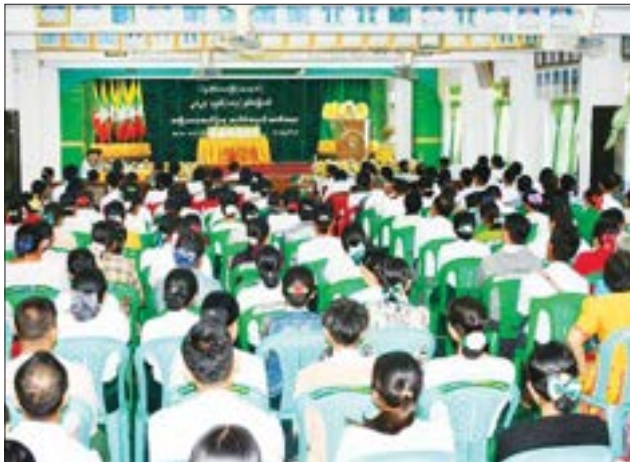
(၁၀၃)နှစ်မြောက် အမျိုးသား အောင်ပွဲနေ့အထိမ်းအမှတ်အခမ်း အနားသို့ပေးပို့သည့် သဝဏ်လွှာ

ပြည် ဒီဇင်ဘာ ၇ ၂၀၂၃ ခုနှစ် (၁၀၃) နှစ်မြောက် အမျိုးသားအောင်ပွဲနေ့ အထိမ်း အမှတ် တိုင်းဒေသကြီးအဆင့် အခမ်းအနားကို ယနေ့ နံနက် ၉ နာရီက ပြည်မြို့ အမှတ်(၁) အခြေခံပညာ အထက်တန်း ကျောင်း၌ ကျင်းပသည်။