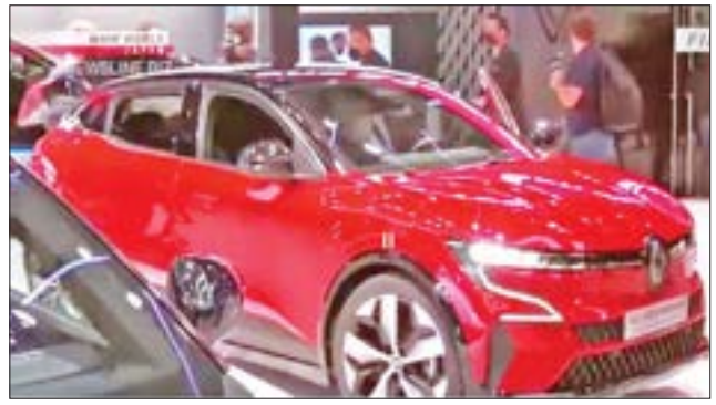
ရီနေဒာကားတစ်စီးကို တွေ့ရစဉ်။

ပါရီ ဒီဇင်ဘာ ၇ ကားကုမ္ပဏီကြီးများဖြစ်သည့် နစ်ဆန်း၊ ရီနေဒာ နှင့်မစ်ဆူဘီရီကုမ္ပဏီတို့မှ အကြီးအကဲများသည် ၎င်းတို့၏ လက်တွဲဆောင်ရွက်မှု ဆက်လက် တည်ရှိနေမည်ဟု ပြောကြားခဲ့သည်။ သတင်းစာရှင်းလင်းပွဲတွင် အပြန်အလှန်ကတိကဝတ်ပြုမှုများကို အလေးအနက်ထား ပြောကြားခဲ့ကြပြီး လျှပ်စစ်ကားထုတ်လုပ်မှုတွင် ယှဉ်ပြိုင်နိုင်စွမ်းတိုးလာစေရန် အတူတကွ လုပ်ဆောင်သွားမည်ဖြစ်ကြောင်း ပြောကြားခဲ့သည်။ ရူလိုင်လအတွင်းက နစ်ဆန်းနှင့် ရီနေဒာကုမ္ပဏီတို့သည် တစ်ဦးနှင့် တစ်ဦး အစုရှယ်ယာများပိုင်ဆိုင်မှု အပြီးသတ်နိုင်ခဲ့ပြီးနောက် ပါရီမြို့တွင် ပထမဦးဆုံးကျင်းပသည့် သတင်းစာရှင်းလင်းပွဲလည်း ဖြစ်သည်။ မော်တော်ကားထုတ်လုပ်ရေးလုပ်ငန်းတွင် အတားအဆီးများကို အတူဖြတ်ကျော်ပြီး ပိုမိုခိုင်မာသည့်အနေအထားတစ်ခုသို့ ဝင်ရောက်လာပြီဖြစ်ကြောင်း နစ်ဆန်းကုမ္ပဏီဥက္ကဋ္ဌနှင့် စီအီးအိုဖြစ်သူ အူချီဒါ မာကိုတို့က ပြောသည်။ အိန္ဒိယ၌ လျှပ်စစ်ကားများထုတ်လုပ်ရာ၌ အတူတကွလုပ်ဆောင်ရန် စဉ်းစားလျက်ရှိကြောင်း ၎င်းက ဆက်ပြောသည်။ ရီနေဒာကုမ္ပဏီ