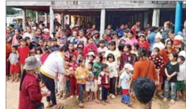
သမီး ကွန်ရက်မှ မြတ်မွန်စေတနာ လူမှုကူညီရေးအသင်းနှင့် မြို့နယ်ကြက်ခြေနီအသင်းတို့ ပူးပေါင်းကာ အသုံးအဆောင်ပစ္စည်းများကို ကူညီလှူဒါန်းခဲ့ကြောင်း သိရသည်။ စိုင်း(သီပေါ)

သီပေါ ဒီဇင်ဘာ ၇ ရမ်းပြည်နယ် (မြောက်ပိုင်း) သီပေါမြို့နယ် အနောက်ခြမ်းဒေသကျင်သီ၊ ပေါ်ကြို့၊ ဆားတွင်း၊ အုံမု၊ မန်ဟဲ၊ တွန်တီး၊ နားခဲ၊ စံဖိတ်၊ စံလိုင်၊ နားလွယ် စသည့်ကျေးရွာများမှ ယာယီတိုက်ပွဲရှောင်များသည် ဘုန်းတော်ကြီးကျောင်းများ၊ ဘာသာရေးအသင်းအဖွဲ့များရှိရာ ခိုလှုံရေးစခန်းသို့ ရောက်ရှိခိုလှုံလျက်ရှိရာ ယာယီတိုက်ပွဲရှောင်သွေးချင်းများ စားဝတ်နေရေး အခက်အခဲမရှိစေရေး လူမှုရေးအသင်းအဖွဲ့များ၊ တစ်ဦးချင်း အလှူရှင်များက ကူညီထောက်ပံ့လှူဒါန်းလျက်ရှိသည်။ ယာယီတိုက်ပွဲရှောင်များ စားသောက်ရေးနှင့် လိုအပ်သော နေရာများတွင် အသုံးပြုနိုင်ရန် ယနေ့နံနက်ပိုင်းတွင် ရန်ကုန်ရောက် (သီပေါအသင်း) မှ အလှူငွေကျပ် ၁၇ သိန်းကို နယ်စည်းမခြား ပရဟိတအသင်းမှတစ်ဆင့် လှူဒါန်းခဲ့ပြီး မြို့နယ်ရမ်းစာပေနှင့် ယဉ်ကျေးမှုအသင်းက ဆန်၊ ဆီ၊ ဆား၊ ဟင်းချက်စရာများကိုလည်းကောင်း၊ သီပေါ အမျိုး