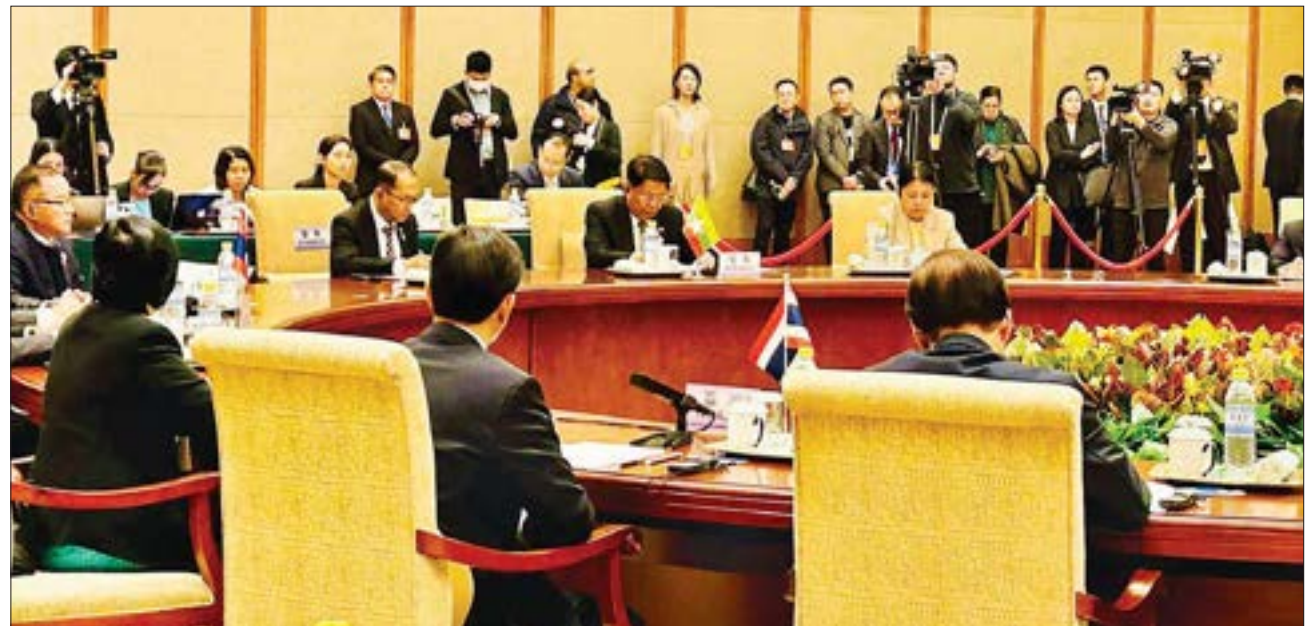
ဒုတိယဝန်ကြီးချုပ်နှင့် နိုင်ငံခြားရေးဝန်ကြီးဌာန ပြည်ထောင်စုဝန်ကြီး ဦးသန်းဆွေ (၈) ကြိမ်မြောက် မဲခေါင် - လန်ချန်း ပူးပေါင်းဆောင်ရွက်မှု နိုင်ငံခြားရေးဝန်ကြီးများ အစည်းအဝေးသို့ ပါဝင်တက်ရောက်စဉ်။

နိုင်ငံခြားရေးဝန်ကြီးဌာန ပြည်ထောင်စုဝန်ကြီး ဦးသန်းဆွေ တို့က ပူးတွဲဥက္ကဋ္ဌများအဖြစ် ဆောင်ရွက်ကြပြီး မဲခေါင် - လန်ချန်း ပူးပေါင်းဆောင်ရွက်မှု အဖွဲ့ဝင်နိုင်ငံများ ဖြစ်သော ကမ္ဘောဒီးယားနိုင်ငံ ဒုတိယဝန်ကြီးချုပ်၊ နိုင်ငံခြားရေးနှင့် အပြည်ပြည်ဆိုင်ရာ ပူးပေါင်းဆောင်ရွက်ရေးဝန်ကြီး မစ္စတာ ဆုပ်ချန်ဒါ ဆိုဖီအာ (Mr. Sok Chenda Sophea)၊ လာအိုနိုင်ငံ လာအိုပြည်သူ့တော်လှန်ရေးပါတီ ဗဟိုကော်မတီဝင်နှင့် လာအိုပြည်သူ့တော်လှန်ရေးပါတီ နိုင်ငံတကာ ဆက်ဆံရေးကော်မတီ ဥက္ကဋ္ဌ မစ္စတာ သောန်ဆာဗန် ဖုန်ဗီဟန် (Mr. Thongsavanh Phomvihane)၊ ထိုင်းနိုင်ငံ ဒုတိယဝန်ကြီးချုပ်နှင့် နိုင်ငံခြားရေးဝန်ကြီး မစ္စတာ ပန်ပရီ ဘာဟီဒါ နူကာရာ (Mr. Parnpree Bahiddha Nukara) နှင့် ဗီယက်နမ် နိုင်ငံ နိုင်ငံခြားရေးဝန်ကြီး မစ္စတာ ဗွီသန်းစွန်း (Mr. Bui Thanh Son) တို့ တက်ရောက်ကြသည်။