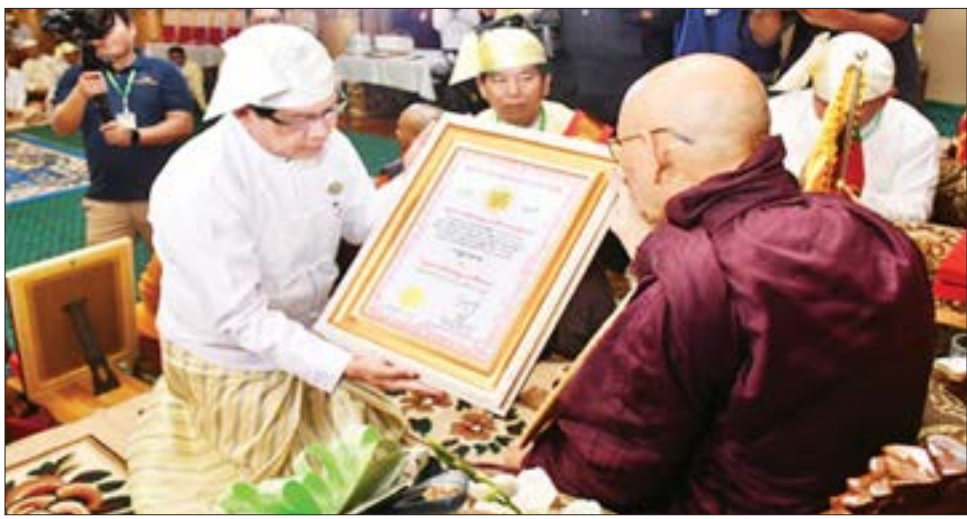
မဟာ မင်္ဂလဓမ္မဇောတိကဇေဘွဲ့ ၁၁ ပါး၊ မဟာ မင်္ဂလဓမ္မဇောတိကဇေဘွဲ့ ၁၃ ပါး၊ မင်္ဂလဓမ္မဇောတိကဇေဘွဲ့ ၃၄ ပါး၊ လူပုဂ္ဂိုလ် ၁၀၀ တို့အား မင်္ဂလာဆိုင်ရာ ဘွဲ့တံဆိပ်တော်များကို အသီးသီး ပေးအပ်ချီးမြှင့်ဆက်ကပ်ကြသည်။ ထို့နောက် ဗုဒ္ဓဘာသာနံ စိရံတိဋ္ဌတု သုံးကြိမ် ရွတ်ဆိုဘုရားကန်တော့၍ အခမ်းအနားကို အောင်မြင်စွာ ရပ်သိမ်းခဲ့ကြောင်း သတင်းစဉ်

ရွတ်ဆို၍ အောင်မောင်း ကိုးချက်တီးကာဖွင့် လှစ်သည်။ ထို့နောက် ဗုဒ္ဓဘာသာကလျာဏယုဝအသင်း ကြီး၏ ရာသက်ပန် နာယက နိုင်ငံတော်စီမံအုပ်ချုပ်ရေးကောင်စီဥက္ကဋ္ဌ နိုင်ငံတော်ဝန်ကြီးချုပ် ဗိုလ်ချုပ်မှူးကြီး သတိုးမဟာသရေစည်သူ သတိုးသီရိသုဓမ္မမင်းအောင်လှိုင် ထံမှ ပေးပို့သော သဝဏ်လွှာကို ဗုဒ္ဓဘာသာကလျာဏယုဝအသင်းကြီး၏ နာယက က ဖတ်ကြားသည်။ ထို့နောက် ဗုဒ္ဓဘာသာကလျာဏယုဝအသင်း (YMBA)(ဗဟို) ဥက္ကဋ္ဌက (၁၀၃) နှစ်မြောက် အမျိုးသားအောင်ပွဲနေ့နှင့် စပ်လျဉ်း၍ ရှင်းလင်းပြောကြားသည်။ ယင်းနောက် အင်းစိန်ရွာမပရိယတ္တိစာသင်တိုက်ကြီး၏ ဦးစီးပဓာန နာယကဆရာတော်၏ အမျိုးသားအောင်ပွဲနေ့ ဩဝါဒကို နာယက တိုင်းဒေသကြီးဝန်ကြီးချုပ်၊ တိုင်းမှူးနှင့် တာဝန်ရှိသူများက ဘွဲ့တံဆိပ်တော် ရရှိတော်မူသော အဂ္ဂ