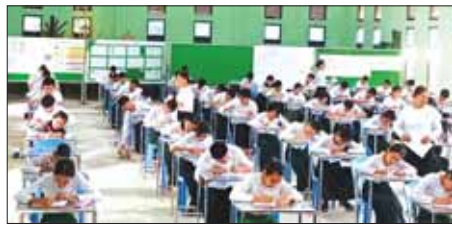
မည့် (၁၀၃) ကြိမ်မြောက် အမျိုးသားအောင်ပွဲနေ့ အထိမ်းအမှတ် အခမ်းအနားတွင် ဆုများပေးအပ်ချီးမြှင့်မည်ဖြစ်ကြောင်း သိရသည်။