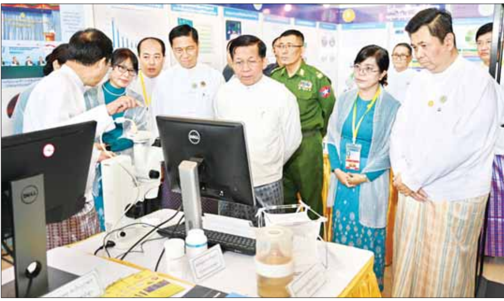
နိုင်ငံတော်စီမံအုပ်ချုပ်ရေးကောင်စီဥက္ကဋ္ဌ နိုင်ငံတော်ဝန်ကြီးချုပ် ဗိုလ်ချုပ်မှူးကြီး မင်းအောင်လှိုင် မြန်မာနိုင်ငံ ပြည်သူ့ကျန်းမာရေးပညာရပ်ဆိုင်ရာ နှီးနှော ဖလှယ်ပွဲ (၂၀၂၃) ဖွင့်ပွဲအခမ်းအနားတွင် ခင်းကျင်းပြသထားသည့် ပြခန်းများကို စိတ်ပါဝင်စားစွာ လှည့်လည်ကြည့်ရှုစဉ်။

နေပြည်တော် ဒီဇင်ဘာ ၆ မြန်မာနိုင်ငံ ပြည်သူ့ကျန်းမာရေးပညာရပ်ဆိုင်ရာ နှီးနှောဖလှယ်ပွဲ (၂၀၂၃) ဖွင့်ပွဲ အခမ်းအနားကို ယနေ့ နံနက် ၈ နာရီခွဲတွင် နေပြည်တော်ရှိ မြန်မာအပြည် ပြည်ဆိုင်ရာ ကွန်ဗင်းရှင်းဗဟိုဌာန-၂ (MICC-II) ၌ ကျင်းပရာ နိုင်ငံတော်စီမံအုပ်ချုပ်ရေးကောင်စီ ဥက္ကဋ္ဌ နိုင်ငံတော်ဝန်ကြီးချုပ် ဗိုလ်ချုပ်မှူးကြီး မင်းအောင်လှိုင် တက်ရောက်ဖွင့်လှစ်ပေးပြီး အမှာ စကားပြောကြားသည်။ အခမ်းအနားသို့ နိုင်ငံတော်စီမံအုပ်ချုပ်ရေး ကောင်စီတွင်အတွင်းရေးမှူး ဒုတိယဗိုလ်ချုပ်ကြီး ရဲဝင်းဦး၊ ကောင်စီဝင်များ၊ ပြည်ထောင်စုဝန်ကြီးများ၊ ပြည်ထောင်စုရာထူးဝန်အဖွဲ့ဥက္ကဋ္ဌ၊ နေပြည်တော် ကောင်စီဥက္ကဋ္ဌ၊ ကာကွယ်ရေးဦးစီးချုပ်ရုံးမှ တပ်မတော် အဆင့်မြင့်အရာရှိကြီးများ၊ ဒုတိယဝန်ကြီးများ၊ ဌာန ဆိုင်ရာအရာရှိကြီးများ၊ မြန်မာနိုင်ငံဆိုင်ရာ နိုင်ငံခြား သံရုံးများမှသံတမန်များ၊ ကုလသမဂ္ဂလက်အောက်ခံ အဖွဲ့အစည်းများမှ ဌာနကိုယ်စားလှယ်များ၊ အစိုးရ မဟုတ်သော အသင်း/အဖွဲ့များ၊ နိုင်ငံတကာနှင့် ပြည်တွင်းမှ ပြည်သူ့ကျန်းမာရေးပညာရှင်များ၊ ဆေး ပညာရပ်ဆိုင်ရာ ပါမောက္ခချုပ်များနှင့် ပါမောက္ခများ၊ ကျန်းမာရေးဝန်ထမ်းများနှင့် အထူးဖိတ်ကြားထား သည့် စည်သူညီတော်များ တက်ရောက်ကြသည်။ စာမျက်နှာ ၄ ကော်လံ ၁