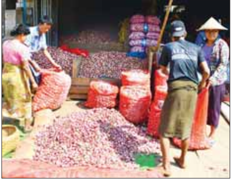
ဝန်းကျင်မှ ၃၇၀၀ ဝန်းကျင်ရှိ ကြောင်း၊ မြင်းခြံကြက်သွန်နီ အသစ်ဈေးမှာ အရည်အသွေးနှင့် အရွယ်အစားပေါ် မူတည်ပြီး မောင်အေးချမ်း

ကြက်သွန်နီ အဟောင်းကုန်၍ အသစ် စတင်ထွက်ပေါ်ချိန် ကြားကာလ၌ အမြင့်ဈေးသို့ ရောက်ရှိနေသော်လည်း လက်ရှိ ပေါက်ဈေးထက် ထပ်မံမြင့်တက်ဖွယ်မရှိနိုင်ကြောင်း မန္တလေးဈေးချိုကြို ကြက်သွန်နီပွဲရှိ ပိုင်ရှင်တစ်ဦးက ပြောသည်။