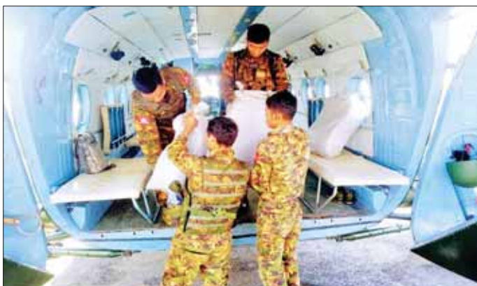
ရဟတ်ယာဉ်များဖြင့် လုံခြုံရေးတပ်ဖွဲ့ဝင်များ၏ လက်ဝယ်အရောက် လိုက်လံ ပို့ဆောင်ပေးကြသည့် စေတနာရှင်ပြည်သူများ လှူဒါန်းသည့် ဒံပေါက်ထမင်းဘူးများနှင့်အတူ ရဟန်းသံဃာများနှင့် ပြည်သူများက ရေးသားပေးပို့သည့် "တာဝန်ကိုကျေပွန်စွာ ထမ်းဆောင်နေကြတဲ့ ပြည်ချစ်တပ်မတော်သားအားလုံး ကျန်းမာပါစေ၊ ဘေးရန်အပေါင်းကင်းဝေးပါစေ၊ အမိမြေရဲ့ ရန်စွယ်ဟူသူမျှ အမြစ်ပါမကျန် တွန်းလှန်ချေမှုန်းနိုင်ပါစေ" စသည့် ဆုတောင်းမေတ္တာစာလွှာများပါရှိကြောင်း သတင်းရရှိသည်။ သတင်းစဉ်

ယနေ့တွင် စေတနာရှင်အလှူရှင် ပြည်သူများက အရှေ့မြောက်တိုင်း စစ်ဌာနချုပ်နယ်မြေအတွင်း နိုင်ငံတော်ကာကွယ်ရေးနှင့် လုံခြုံရေးတာဝန်များ ထမ်းဆောင်နေသည့် လုံခြုံရေးတပ်ဖွဲ့ဝင်များအတွက် ဒံပေါက်ထမင်းဘူးများကို ပေးအပ်လှူဒါန်းကြရာ တာဝန်ရှိသူများက လက်ခံရယူပြီး လားရှိုးမြို့မှတစ်ဆင့် တပ်မတော်မော်တော်ယာဉ်များ၊