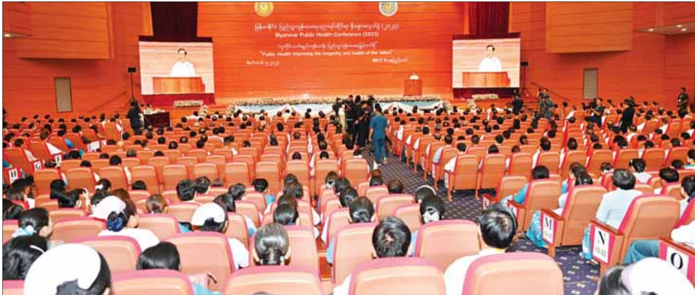
နိုင်ငံတော်စီမံအုပ်ချုပ်ရေးကောင်စီဥက္ကဋ္ဌ နိုင်ငံတော်ဝန်ကြီးချုပ် ဗိုလ်ချုပ်မှူးကြီး မင်းအောင်လှိုင် မြန်မာနိုင်ငံပြည်သူ့ကျန်းမာရေးပညာရပ်ဆိုင်ရာ နှီးနှောဖလှယ်ပွဲ(၂၀၂၃) ဖွင့်ပွဲအထိမ်းအမှတ်တွင် အမှာစကား ပြောကြားစဉ်။

ကျန်းမာရေးအတွက် ဆက်လက်ဆောင်ရွက်မည့် လုပ်ငန်းစဉ်များကိုဖော်ထုတ်ရန်၊ အနာဂတ်ပြည်သူ့ ကျန်းမာရေးကဏ္ဍတွင် ဦးဆောင်မည့်သူများအား ပြုစု ပျိုးထောင်ရန်ဆိုသည့်ရည်ရွယ်ချက်များနှင့် ကျင်းပ ပြုလုပ်ခြင်းဖြစ်သည်ကို သိရပါကြောင်း၊ အင်မတန် ကျယ်ပြန့်သည့် ကဏ္ဍတစ်ရပ်ဖြစ်ပါကြောင်း၊ ယခု နှီးနှောဖလှယ်ပွဲကြီးတွင် ပြည်တွင်းမှ ပြည်သူ့ ကျန်းမာရေးပညာရှင် ၁၈၀၀ ကျော်နှင့် နိုင်ငံတကာမှ ပြည်သူ့ကျန်းမာရေးပညာရှင် ၃၀ တို့က လူကိုယ်တိုင် နှင့် Online တွဲဖက် တက်ရောက်ဆွေးနွေးကြမည်ဟု သိရပါကြောင်း။ နိုင်ငံတော်စီမံအုပ်ချုပ်ရေး ကောင်စီအနေဖြင့် ပြည်သူ့အားလုံး၏ ကျန်းမာရေးအဆင့်အတန်း တိုးတက်မြှင့်တင်ရေးအစီအစဉ်ဆက်မပြတ်အားပေး ဆောင်ရွက်လျက်ရှိရာတွင် “လူ့အသက်ထက် အရေး ကြီးတာဝန်ထက် အရေးကြီးစွာ” ဆိုသည့်မူနှင့်အညီ “တစ်မျိုး သားလုံး သက်ရှည်ကျန်းမာရေးအတွက် ပြည်သူ့