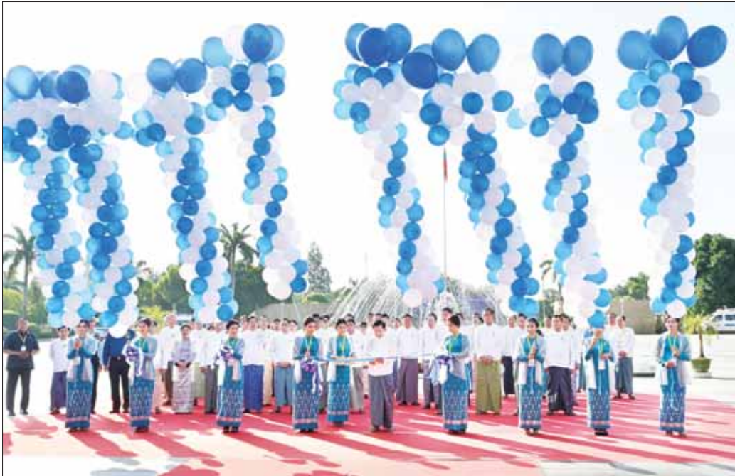
နိုင်ငံတော်စီမံအုပ်ချုပ်ရေးကောင်စီဥက္ကဋ္ဌ နိုင်ငံတော်ဝန်ကြီးချုပ် ဗိုလ်ချုပ်မှူးကြီး မင်းအောင်လှိုင် မြန်မာနိုင်ငံပြည်သူ့ကျန်းမာရေးပညာရပ်ဆိုင်ရာ နှီးနှော ဖလှယ်ပွဲ(၂၀၂၃) ဖွင့်ပွဲအထိမ်းအမှတ်မုခ်ဦးကို ဖဲကြိုးဖြတ်ဖွင့်လှစ်ပေးစဉ်။

ကျယ်ပြန့်သည့်ကဏ္ဍတစ်ရပ်ဖြစ် ထို့နောက် မြန်မာနိုင်ငံ ပြည်သူ့ကျန်းမာရေး ပညာရပ်ဆိုင်ရာ နှီးနှောဖလှယ်ပွဲ (၂၀၂၃) ဖွင့်ပွဲဒုတိယ ပိုင်းကို Plenary Hall ၌ ဆက်လက်ကျင်းပရာ နိုင်ငံတော်စီမံအုပ်ချုပ်ရေးကောင်စီဥက္ကဋ္ဌ နိုင်ငံတော် ဝန်ကြီးချုပ်က အမှာစကားပြောကြားရာတွင် ယနေ့ ကျင်းပသည့် မြန်မာနိုင်ငံ “ပြည်သူ့ကျန်းမာရေး ပညာရပ်ဆိုင်ရာ နှီးနှောဖလှယ်ပွဲ(၂၀၂၃)” ကို နိုင်ငံ တကာနှင့် ပြည်တွင်း၌ ဆောင်ရွက်နေကြသည့် ပြည်သူ့ကျန်းမာရေးစောင့်ရှောက်မှု အတွေ့အကြုံ များကို ဖလှယ်ရန်၊ နိုင်ငံတကာနှင့် ပြည်တွင်း ပြည်သူ့ကျန်းမာရေး အဖွဲ့အစည်းများအကြား ပူးပေါင်းဆောင်ရွက်မှုကွန်ရက်ကို ပိုမိုမြှင့်တင်ရန်၊ အရည်အသွေးပြည့်ဝသည့် ပြည်သူ့ကျန်းမာရေး စောင့်ရှောက်မှုများကို လွှမ်းခြုံမှုမြင့်မားစွာဖြင့် လူတိုင်းလက်လှမ်းမီ သာတူညီမျှရရှိရေး တိုးမြှင့် ဆောင်ရွက်ရန်၊ စဉ်ဆက်မပြတ်ဖွံ့ဖြိုးတိုးတက်ရေး ရည်မှန်းချက်ပန်းတိုင်(SDGs)ပါ ရည်မှန်းချက်များ နှင့် မြန်မာနိုင်ငံ၏ ရေရှည်တည်တံ့ခိုင်မြဲပြီး ဟန်ချက် ညီသောဖွံ့ဖြိုးတိုးတက်မှုစီမံကိန်း(MSDP)ပါ ရည်မှန်း ချက်များပြည့်စီရေးတွင် အဓိကကျသည့် ပြည်သူ့