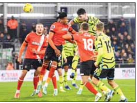
ပရီမီယာလိဂ်ပွဲစဉ် (၁၅) မှ အခြားသော ပွဲစဉ်အဖြစ် ပုစံနှင့် ဘန်လီ အသင်းတို့ ယှဉ်ပြိုင်ကစားခဲ့ရာ ပုစံ အသင်းက ဟွမ်စ်၏ တစ်လုံးတည်းသော သွင်းဂိုးဖြင့် အနိုင်ရရှိခဲ့သည်။ အောင်ဇော်

ပိုင်ဆိုင်ခဲ့သည်။ ထို့အပြင် အာဆင်နယ်အသင်းသည် ပြီးခဲ့သည့်ရာသီတွင် အသင်းအတွက် ၃၈ ပွဲပါဝင်ကစားထားသည့် ဂိုးသမား အာရ်နိုရစ်ဇေးလ်ကို ယခုနှစ်ရာသီတွင် ပွဲစဉ်အများစု အနားပေးကာ နွေရာသီတွင် ဘရန်နီဒီအသင်းမှ အငှားဖြင့် ခေါ်ယူထားသည့် ရာယာကို ယခုပွဲစဉ် အပါအဝင် ပွဲစဉ်အများပြားမှာ အဓိကထား အသုံးပြုလာသည်ကို တွေ့ရသည်။ လူတန်အသင်းအတွက် သွင်းဂိုးများကို အော့စ်ဟို၊ အဒီဘာယိုနှင့် ဘာကလေတို့က သွင်းယူပေးပြီး အာဆင်နယ်အသင်းအတွက် သွင်းဂိုးများကို မာတင်နယ်လီ၊ ဂျော့ဇွဲ၊ ဟာဗက်ဇ်နှင့် ရိုက်စီတို့က သွင်းယူပေးခဲ့သည်။ အဆိုပါနိုင်ပွဲကြောင့် အာဆင်နယ်အသင်းသည် ရမှတ် ၃၆ မှတ်ဖြင့် အမှတ်ပေးဇယားကို ဆက်လက်ဦးဆောင်လျက်ရှိသည်။ ပြိုင်ဘက် လူတန်အသင်းက ယခုပွဲရှုံးနိမ့်မှုကြောင့် ပရီမီယာလိဂ်တွင် ရှုံးပွဲ ၁၀ ပွဲအထိ ရှိလာပြီဖြစ်သည်။