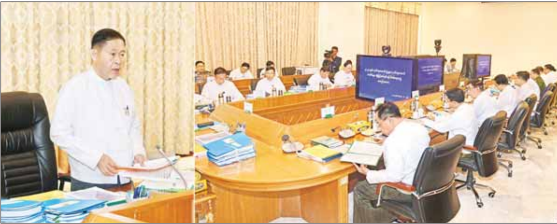
နိုင်ငံတော်စီမံအုပ်ချုပ်ရေးကောင်စီ ဒုတိယဥက္ကဋ္ဌ ဒုတိယဝန်ကြီးချုပ် ဒုတိယဗိုလ်ချုပ်မှူးကြီး စိုးဝင်း ၂၀၂၄ ခုနှစ်အတွက် ဂုဏ်ထူးဆောင်ဘွဲ့များ၊ ဂုဏ်ထူးဆောင်တံဆိပ်များ ချီးမြှင့်အပ်နှင်းရန် စိစစ်ရေးအဖွဲ့အစည်းအဝေးတွင် အမှာစကားပြောကြားစဉ်။

နေပြည်တော် ဒီဇင်ဘာ ၆ ၂၀၂၄ ခုနှစ်အတွက် ဂုဏ်ထူးဆောင်ဘွဲ့များ၊ ဂုဏ်ထူးဆောင်တံဆိပ်များ ချီးမြှင့်အပ်နှင်းရန် စိစစ်ရေးအဖွဲ့အစည်းအဝေးကို ယနေ့မွန်းလွဲ ၂ နာရီတွင် နေပြည်တော်ရှိ နိုင်ငံတော်စီမံအုပ်ချုပ်ရေးကောင်စီဥက္ကဋ္ဌနှင့် အစည်းအဝေးခန်းမ၌ ကျင်းပရာ ဂုဏ်ထူးဆောင်ဘွဲ့များ၊ ဂုဏ်ထူးဆောင်တံဆိပ်များ ချီးမြှင့်အပ်နှင်းရန် စိစစ်ရေးအဖွဲ့နာယက နိုင်ငံတော်စီမံအုပ်ချုပ်ရေးကောင်စီ ဒုတိယဥက္ကဋ္ဌ ဒုတိယဝန်ကြီးချုပ် ဒုတိယဗိုလ်ချုပ်မှူးကြီး စိုးဝင်း တက်ရောက်အမှာစကားပြောကြားသည်။