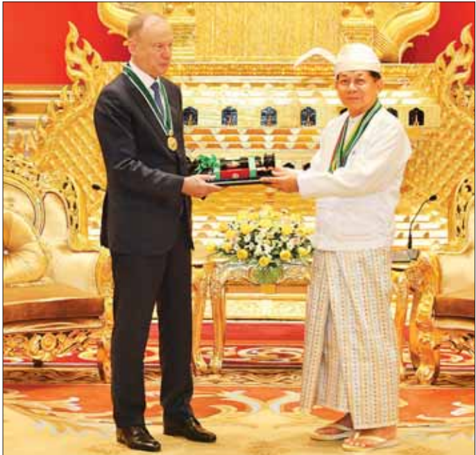
နိုင်ငံတော်စီမံအုပ်ချုပ်ရေးကောင်စီဥက္ကဋ္ဌ နိုင်ငံတော်ဝန်ကြီးချုပ် ဗိုလ်ချုပ်မှူးကြီး သတိုးမဟာသရေစည်သူ သတိုးသီရိသုဓမ္မ မင်းအောင်လှိုင် ရုရှားဖက်ဒရေးရှင်းနိုင်ငံ လုံခြုံရေးကောင်စီအတွင်းရေးမှူး Mr. Nikolai PATRUSHEV အား စွမ်းဆောင်မှုဆိုင်ရာ ဂုဏ်ထူးဆောင်ဘွဲ့ဖြစ်သည့် သရေစည်သူဘွဲ့ ချီးမြှင့်အပ်နှင်းစဉ်။

ဖက်ဒရေးရှင်းနိုင်ငံ လုံခြုံရေး နီးကပ်ခိုင်မာအောင် စွမ်းစွမ်းတစ် တည်ဆောက်နိုင်ခဲ့သောကြောင့် စွမ်းဆောင်မှုဆိုင်ရာ ဘွဲ့တံဆိပ် ရရှိခဲ့သည့် ရုရှားဖက်ဒရေးရှင်း နိုင်ငံ လုံခြုံရေးကောင်စီ အတွင်း ရေးမှူး Mr. Nikolai PATRUSHEV ထံ ဘွဲ့တံဆိပ်နှင့် အဆောင် အယောင်ကို လက်ရောက်ချီးမြှင့် အပ်နှင်းသည်။ မှတ်တမ်းတင်ဓာတ်ပုံရိုက် ထိုးနောက် နိုင်ငံတော်စီမံ အုပ်ချုပ်ရေးကောင်စီ ဥက္ကဋ္ဌ နိုင်ငံတော်ဝန်ကြီးချုပ်နှင့် ရုရှား ဖက်ဒရေးရှင်းနိုင်ငံ လုံခြုံရေး ကောင်စီ အတွင်းရေးမှူးတို့သည် တက်ရောက် လာကြသူများနှင့် အတူ စုပေါင်းမှတ်တမ်းတင် ဓာတ်ပုံရိုက်ခဲ့ကြောင်း သတင်း ရရှိသည်။ သတင်းစဉ်