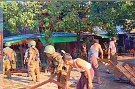
အကြမ်းဖက်သောင်းကျန်းသူများက Drone အသုံးပြု၍ Drop Bomb ချ တိုက်ခိုက်မှုကြောင့် ပုတ္တားကျွန်းမြို့၊ မြို့မဈေးမီးလောင်မှုကို တပ်မတော်သားများနှင့် ပြည်သူလူထုက ဝိုင်းဝန်းငြိမ်းသတ်နေစဉ်။