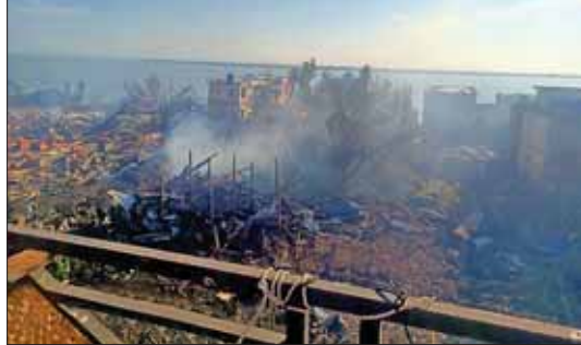
အကြမ်းဖက်သောင်းကျန်းသူများက Drone အသုံးပြု၍ Drop Bomb ချ တိုက်ခိုက်မှုကြောင့် ပေါက်တောမြို့၊ မြို့မဈေးမီးလောင်မှုကို တွေ့ရစဉ်။

စေတီပုထိုးများသည် ဘိုးဘွားများ ထားရစ်ခဲ့သည့် သမိုင်းရဲ့ အမွေအနှစ် ဖြစ်သည်။ ဒီအမွေအနှစ်တွေသည်