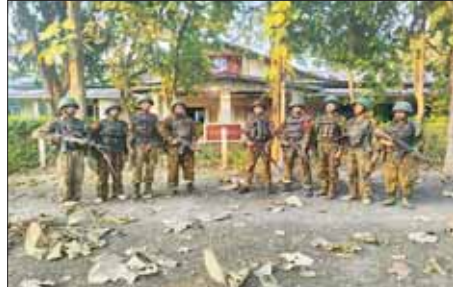
အကြမ်းဖက်သမားများ ခေတ္တထိန်းချုပ်ထားသည့် မုန်းမြို့ရှိ နယ်မြေခံ တပ်ရင်းအား တပ်မတော်စစ်ကြောင်းများက ပြန်လည်သိမ်းပိုက်ထိန်းချုပ် နိုင်ခဲ့ပြီး အရာရှိရုံးပိတ်သောရှေ့၌ တွေ့ရှိရသည့် မှတ်တမ်းဓာတ်ပုံ။

နယ်မြေခံတပ်ရင်းအား အဝေးမှ နှောင့်ယှက်ပစ်ခတ်၍ လည်း ကောင်း၊ ဆက်သွယ်ရေးလမ်း ၁၅၀၀ ခန့်ဖြင့် သိမ်းပိုက်နိုင်ခဲ့ ကြောင်းပေါ်ပေါက်သတင်းလုံခြုံရေး စခန်းအား ဝင်ရောက်တိုက်ခိုက်၍ လည်းကောင်း၊ မြို့မရဲစခန်းအား ဝင်ရောက်တိုက်ခိုက်၍ လည်း ကောင်း စစ်ကူမလာရောက်နိုင်စေ ရေး ထိန်းချုပ်နှောင့်ယှက် တိုက်ခိုက်မှုများ ပြုလုပ်ခဲ့ရာ မြို့တွင်းလုံခြုံရေး ဆောင်ရွက် သည့် တပ်မတော်စစ်ကြောင်းနှင့် ထိုတွင်တိုက်ပွဲများ ဖြစ်ပွားခဲ့ပြီး အကြမ်းဖက် သမားများသည် ထိခိုက်ဒဏ်ရာရရှိမှု များစွာဖြင့် ပြန်လည် ဆုတ်ခွာသွားခဲ့သည်။ သို့သော် အကြမ်းဖက်အားပေး တရားမဝင် မီဒီယာများအနေဖြင့် ဒီဇင်ဘာ ၃ ရက်နေ့တွင် မုန်းမြို့ရှိ တပ်ရင်းများအား လည်းကောင်း၊ သတင်းစဉ်