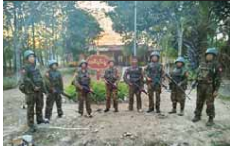
အကြမ်းဖက်သမားများ ခေတ္တထိန်းချုပ်ထားသည့် မုန်းမြို့ရှိ နယ်မြေခံ တပ်ရင်းအား တပ်မတော်စစ်ကြောင်းများက ပြန်လည်သိမ်းပိုက်ထိန်းချုပ် နိုင်ခဲ့ပြီး တပ်ရင်းရုံးရှေ့၌ တွေ့ရှိရသည့် မှတ်တမ်းဓာတ်ပုံ။