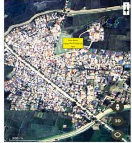
PDF အမည်ခံအကြမ်းဖက်သမားများက ရွှေဘိုမြို့နယ် ပန်းရံကျေးရွာ ရှိ မင်္ဂလာဆောင်နေအိမ်သို့ Drop Bomb များ ပစ်ခတ်တိုက်ခိုက်ခဲ့သည့် နေရာပြပုံ။

Drop Bomb များဖြင့်တိုက်ခိုက် တောင်ဘက် မီတာ ၃၀၀၀ ခန့် ထိုသို့ လုပ်ဆောင်လျက်ရှိရာ အကွာရှိ ကျောက်မြင့်ကျေးရွာ စစ်ကိုင်းတိုင်းဒေသကြီး ရွှေဘို ဘက်မှနေ၍ Drone များ အသုံးပြု မြို့နယ် ပန်းရံကျေးရွာရှိ ဦးလင်း ကာ Drop Bomb များဖြင့် ပစ်ခတ် ကိုက်ခိုက်ခဲ့သဖြင့် ဗိုလ်မှူးကျော် ပေါက်ကွဲခဲ့ရာ မင်္ဂလာဆောင်သို့ ရောက်နေသည့် အပြစ်မဲ့ဒေသခံ ပြည်သူ အမျိုးသမီးနှစ်ဦး သေဆုံး ပြီး အသက် ၇ နှစ်အရွယ် ကလေး ငယ်နှစ်ဦးအပါအဝင် စုစုပေါင်း ၁၃ ဦး ဖုံးစထိမှန် ဒဏ်ရာများ ရရှိခဲ့ကြောင်း သိရှိရသည်။ လုံခြုံရေးဆောင်ရွက် အထက်ပါဖြစ်စဉ်မှ ဒဏ်ရာ ရရှိခဲ့သူများအား ရွှေဘိုမြို့ ပြည်သူ့ဆေးရုံသို့ ပို့ဆောင် ဆေးကုသမှု ခံယူစေလျက်ရှိ ကြောင်း၊ PDF အမည်ခံ အကြမ်း ဖက် သောင်းကျန်းသူများ၏ လူမဆန်သော လုပ်ရပ်များကို ဒေသခံ ပြည်သူများအနေဖြင့် လွန်စွာ မုန်းတီးရွံ့ရှုလျက်ရှိ ကြောင်းနှင့် လုံခြုံရေးတပ်ဖွဲ့များ က နယ်မြေလုံခြုံရေးအတွက် လိုအပ်သည့် လုံခြုံရေးလုပ်ငန်း များ ဆောင်ရွက်လျက်ရှိကြောင်း သတင်းရရှိသည်။ သတင်းစဉ်