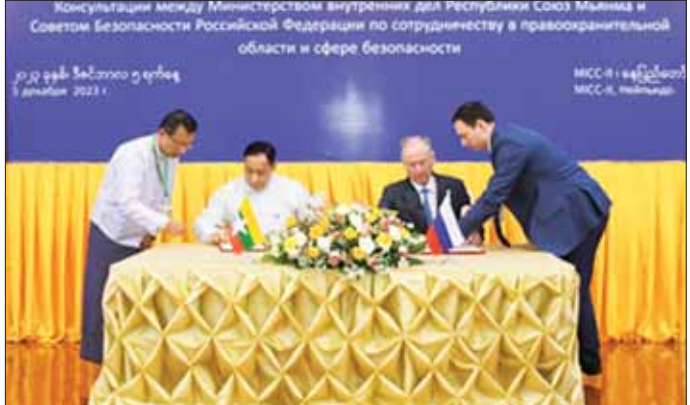
မြန်မာ-ရုရှားနှစ်နိုင်ငံ ပူးပေါင်းဆောင်ရွက်ရေးဆိုင်ရာ နားလည်မှုစာချုပ်သွာကို နိုင်ငံတော်စီမံအုပ်ချုပ်ရေးကောင်စီအဖွဲ့ဝင်၊ အမျိုးသားလုံခြုံရေးဆိုင်ရာ အကြံပေးပုဂ္ဂိုလ်၊ ပြည်ထဲရေးဝန်ကြီးဌာန ပြည်ထောင်စုဝန်ကြီး ဒုတိယဗိုလ်ချုပ်ကြီး ရာပြည့်နှင့် ရုရှားဖက်ဒရေးရှင်းနိုင်ငံ လုံခြုံရေးကောင်စီအတွင်းရေးမှူး မစ္စတာ နီကိုလိုင်ပတ်ထရူးဂျက်ဖ်တို့က လက်မှတ်ရေးထိုးကြစဉ်။

လက်မှတ်ရေးထိုး ဆွေးနွေးပွဲအပြီးတွင် မြန်မာ-ရုရှားနှစ်နိုင်ငံ ပူးပေါင်းဆောင်ရွက်ရေးဆိုင်ရာ နားလည်မှုစာချုပ်သွာကို နိုင်ငံတော်စီမံအုပ်ချုပ်ရေးကောင်စီအဖွဲ့ဝင်၊ အမျိုးသားလုံခြုံရေးဆိုင်ရာ အကြံပေးပုဂ္ဂိုလ်၊ ပြည်ထဲရေးဝန်ကြီးဌာန ပြည်ထောင်စုဝန်ကြီး ရာပြည့်နှင့် ရုရှားဖက်ဒရေးရှင်းနိုင်ငံ လုံခြုံရေးကောင်စီ အတွင်းရေးမှူး မစ္စတာ နီကိုလိုင်ပတ်ထရူးဂျက်ဖ်တို့က လက်မှတ်ရေးထိုးခဲ့ကြပြီး အမှတ်တရ လက်ဆောင်ပစ္စည်းများ အပြန်အလှန်ပေးအပ်ကြသည်။