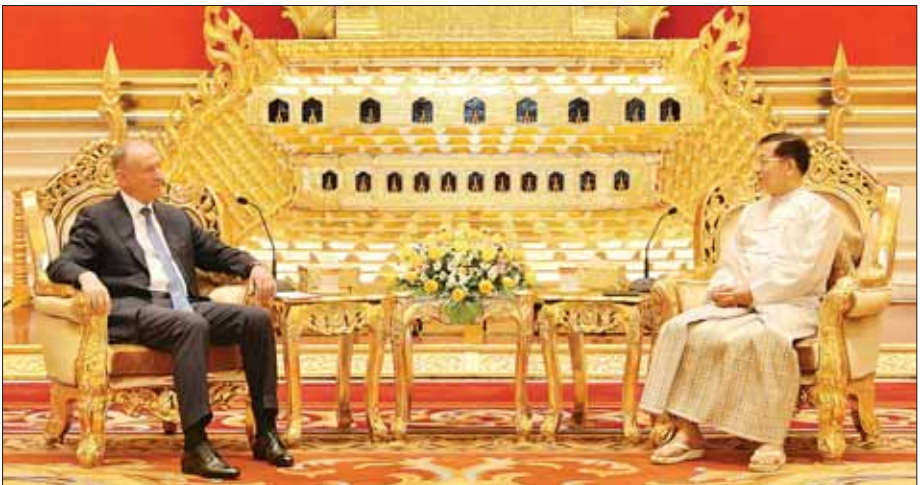
နိုင်ငံတော်စီမံအုပ်ချုပ်ရေးကောင်စီဥက္ကဋ္ဌ နိုင်ငံတော်ဝန်ကြီးချုပ် ဗိုလ်ချုပ်မှူးကြီး မင်းအောင်လှိုင်နှင့် ရုရှားဖက်ဒရေးရှင်းနိုင်ငံ လုံခြုံရေး ကောင်စီအတွင်းရေးမှူး Mr. Nikolai PATRUSHEV တို့ တွေ့ဆုံဆွေးနွေးစဉ်။

ယင်းနောက် ရုရှားဖက်ဒရေးရှင်းနိုင်ငံ လုံခြုံရေးကောင်စီအတွင်းရေး