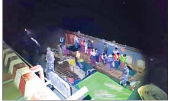
တပ်မတော်သားများက ယာယီတိုက်ပွဲရောင်ပြည့်သူများအား ကယ်ဆယ်နေရာချထားပေးမှုကို တွေ့ရစဉ်။

အန္တရာယ်ဖြစ်သည်။ ဒီဘေးကြောင့် လူ့ အဖွဲ့အစည်းများ၏ လုပ်ငန်းဆောင်တာများ ပါ ပျက်စီးစေပြီး ရခိုင်တိုင်းရင်းသားများမှာ သေနတ်သံများ၊ ယမ်းငွေ့များကြား ပြေးလွှား နေရသည့်ဘဝကို ရောက်ရှိရသည်။