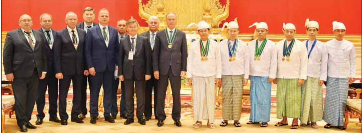
နိုင်ငံတော်စီမံအုပ်ချုပ်ရေးကောင်စီဥက္ကဋ္ဌ နိုင်ငံတော်ဝန်ကြီးချုပ် ဗိုလ်ချုပ်မှူးကြီး မင်းအောင်လှိုင်နှင့် အဖွဲ့ဝင်များ ရုရှားဖက်ဒရေးရှင်းနိုင်ငံ လုံခြုံရေးကောင်စီအတွင်းရေးမှူး Mr. Nikolai PATRUSHEV ဦးဆောင်သော အဖွဲ့နှင့်အတူ စုပေါင်းမှတ်တမ်းတင်ဓာတ်ပုံရိုက်စဉ်။