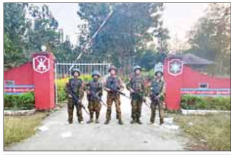
အကြမ်းဖက်သမားများ ခေတ္တထိန်းချုပ်ထားသည့် မုန်းမြို့ရှိ နယ်မြေခံ တပ်ရင်းအား တပ်မတော်စစ်ကြောင်းများက ပြန်လည်သိမ်းပိုက်ထိန်းချုပ် နိုင်ခဲ့ပြီး တပ်ရင်းအင်ဂီတီရှေ့၌ တွေ့ရှိရသည့် မှတ်တမ်းဓာတ်ပုံ။

ထို့အပြင် အကြမ်းဖက်သမား များသည် ဒီဇင်ဘာ ၃ ရက် နံနက်ပိုင်း အဆိုပါနယ်မြေခံ တပ်ရင်းအား တိုက်ခိုက်ချိန်နှင့် တစ်ပြိုင်တည်းတွင် အခြား