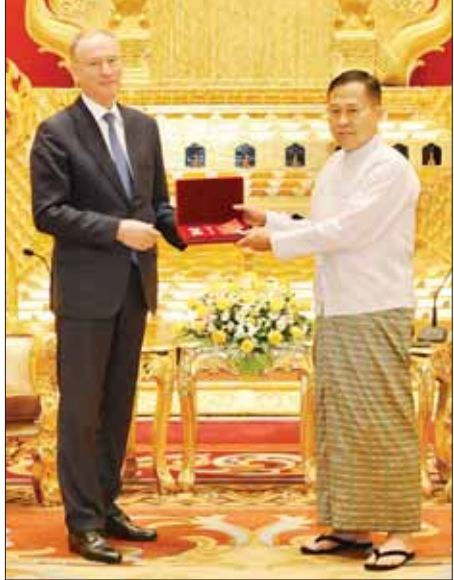
ရုရှားဖက်ဒရေးရှင်းနိုင်ငံ လုံခြုံရေးကောင်စီ အတွင်းရေးမှူး Mr. Nikolai PATRUSHEV က နိုင်ငံတော်စီမံအုပ်ချုပ်ရေးကောင်စီ ဒုတိယဥက္ကဋ္ဌ ဒုတိယဝန်ကြီးချုပ် ဒုတိယဗိုလ်ချုပ်မှူးကြီး စိုးဝင်းထံ Order of Friendship ဘွဲ့တံဆိပ်ကို လက်ရောက်အပ်နှင်းစဉ်။

မှူးက နိုင်ငံတော်စီမံအုပ်ချုပ်ရေးကောင်စီဥက္ကဋ္ဌ နိုင်ငံတော်ဝန်ကြီးချုပ် ဗိုလ်ချုပ်မှူးကြီး မင်းအောင်လှိုင်ထံ ရုရှားဖက်ဒရေးရှင်းနိုင်ငံ သမ္မတ မစ္စတာ ဗလာဒီမာပူတင်က ချီးမြှင့်အပ်နှင်းသည့် Order of Alexander Nevsky ဘွဲ့တံဆိပ်ကို လက်ရောက်အပ်နှင်းသည်။