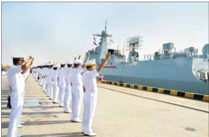
(ကျန်စစ်သား)ကို လာရောက်လေ့လာခဲ့ကြရာ တာဝန်ရှိသူများက ကြိုဆိုနှုတ်ဆက်ခဲ့ကြပြီး လိုက်လံရှင်းလင်းပြသခဲ့ကြသည်။ (ဝဲပုံ) တရုတ်ပြည်သူ့လွတ်မြောက်ရေး တပ်မတော်(ရေ)မှ စစ်ရေယာဉ်များသည် မြန်မာနိုင်ငံသို့ရောက်ရှိနေစဉ်အတွင်း ရန်ကုန်မြို့ရှိ အထင်ကရနေရာများသို့ လေ့လာလည်ပတ်ခြင်း၊ နှစ်နိုင်ငံချစ်ကြည်ရေးအားကစားပြိုင်ပွဲများ ယှဉ်ပြိုင်ကစားခြင်း၊ သန်လျင် တပ်နယ်ရှိ အခြေခံပညာအထက်တန်းကျောင်း (ဆိပ်ကြီး)၌ စာရေးကိရိယာ လှူဒါန်းခြင်းများ ဆောင်ရွက်ခဲ့ကြောင်းနှင့် တပ်မတော်(ရေ) မှ စစ်ရေယာဉ်များနှင့်အတူ ဝေဟင်ရန်၊ ရေပြင်ရန်၊ ရေအောက်ရန် ကာကွယ်ရေးလေ့ကျင့်ခန်းများ၊ ရေကြောင်းလုံခြုံရေးဆိုင်ရာ လေ့ကျင့်ခန်းများ ပူးပေါင်းဆောင်ရွက်ရန်အတွက် လေ့ကျင့်ခန်းစီရိယာသို့ ဆက်လက်ထွက်ခွာသွားကြောင်း သတင်းရရှိသည်။ သတင်းစဉ်

နေပြည်တော် ဒီဇင်ဘာ ၁ - ပြည်ထောင်စုသမ္မတမြန်မာနိုင်ငံတော်သို့ ချစ်ကြည်ရေးခရီး ရောက်ရှိနေသော တရုတ်ပြည်သူ့လွတ်မြောက်ရေးတပ်မတော်(ရေ) 44 th PLA Navy Escort Task Group (ETG) မှ စစ်ရေယာဉ်များဖြစ်သည့် ဖျက်သင်္ဘော Zi Bo နှင့် ဖရီးဂိတ်စစ်ရေယာဉ် Jिंग Zhou နှင့် ထောက်ပံ့ရေးစစ်ရေယာဉ် Qian Dao Hu တို့သည် ယနေ့နံနက်ပိုင်းတွင် ရန်ကုန်မြို့၊ သီလဝါဆိပ်ကမ်းမှ ပြန်လည်ထွက်ခွာရာ တပ်မတော်(ရေ)မှ အရာရှိကြီးများ၊ အရာရှိ၊ စစ်သည်များ၊ မြန်မာနိုင်ငံ ဆိုင်ရာ တရုတ်သံရုံးနှင့် စစ်သံရုံးမှ တာဝန်ရှိသူများ၊ မြန်မာနိုင်ငံ တရုတ်ကုန်သည်များအသင်း၊ တရုတ်-မြန်မာ ဗုဒ္ဓဘာသာအသင်းတို့က ပို့ဆောင်ပေးဆက်ကြသည်။ (ဟာပုံ) အဆိုပါ စစ်ရေယာဉ်များတွင် လိုက်ပါလာခဲ့ကြသည့် တရုတ်ပြည်သူ့လွတ်မြောက်ရေးတပ်မတော်(ရေ)မှ အရာရှိ၊ စစ်သည်များသည် နိုဝင်ဘာ ၃၀ ရက် နံနက်ပိုင်းတွင်လည်း တပ်မတော်(ရေ)မှ စစ်ရေယာဉ်