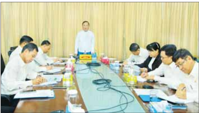
ဆောင်ရွက်ရန် ပြောကြားသည့် (အပေါ်ပုံ) ထို့နောက် တက်ရောက်လာကြသူများက စီမံအုပ်ချုပ်ရေး

အစည်းအဝေးတွင် ဒုတိယ လေ့လာရန်၊ မိမိတို့ ပြည်နယ်နှင့်ဝန်ကြီးက တာဝန်ခံညွှန်ကြားရေး တိုင်းဒေသကြီးများတွင် ကဏ္ဍမှူးများအနေဖြင့် အားကစားအလိုက် လုပ်ငန်းတိုးတက်မှု ရှိ/ကဏ္ဍ ဖွံ့ဖြိုးတိုးတက်ရေးအတွက် မရှိ ညွှန်ကြားရေးမှူးများက သုတေသနပြုလုပ်ရာတွင် တာဝန်ရှိသူများနှင့် ပေါင်းစပ်ညှိနှိုင်းဆောင်ရွက်ရန်၊ Sports Master Plan ရေးဆွဲနိုင်ရေး ပူးပေါင်းဆောင်ရွက်ရန်၊ နိုင်ငံတကာနှင့်ရင်ပေါင်တန်းပြောဆိုဆက်ဆံနိုင်စေရေး အင်္ဂလိပ်ဘာသာစကားကို