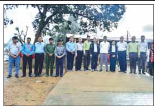
မက်မန်းမြို့နယ် မင်းရန်အောင်ကျေးရွာ အမကကျောင်းလေးသို့ ရောက်ရှိခဲ့။

မြို့သို့ နှစ်ခေါက်လေ မကတော့ပြီ။ မင်းရန်အောင်ကျေးရွာလေးဆီသို့ ယခုတစ်ခေါက် မော်ဖေဒေသ မက်မန်းခရီးစဉ်မှာ ကျွန်တော် ပထမဆုံးဝင်ဖြစ်ခဲ့သည်က မင်းရန် အောင်ကျေးရွာလေးရှိရာကဲ့သို့ ဖြစ်ပါသည်။ မိုင်းပြင်းမှ မက်မန်းသို့သွားရာကားလမ်းအတိုင်း အောင်သံလွင် ကို ကျော်ပြီး နန်းဟာနူးကျေးရွာသို့အရောက် အနောက်ဘက်ဘက်သို့ချိုးကာ အတန်ငယ်ဝင်ရသည်။ နန်းဟာနူး-ပိန်းနောင် ကူးတို့ဆိပ်သို့သွားသော ကားလမ်း ၁၄/၀ မိုင်းပေါ်တွင် တည်ရှိ၏။ ရောက်ချင်တာကြာပြီဖြစ်သော၊ ၂၀၁၈ ခုနှစ်က ဆိုလာမီး၊ ဆရာ ဆရာမ ဝန်ထမ်းအိမ်ရာ၊ ဘုန်းကြီး ကျောင်းများ ခွင့်ပြုပေးခဲ့ဖူးသော မင်းရန်အောင် ကျေးရွာလေးကို ရောက်ခဲ့ပါပြီ။ ထိုထက်ပို၍ ညွှန်းဆိုရလျှင် မင်းရန်အောင်စစ်ဆင်ရေးကြီးကို ဂုဏ်ပြုတည်ထောင်ထားသော ရွာလေးတစ်ရွာသို့ ရောက်ခွင့်ကြုံခဲ့ပြီဖြစ်၍ ကျွန်တော် ကြည့်နူး ဝမ်းသာဖြစ်ခဲ့မိပါသည်။ ရောက်တုန်းရောက်ခိုက် ကျေးရွာသူ ကျေးရွာသားများနှင့် တွေ့ဆုံ၍ ဒေသဖွံ့ဖြိုးရေးကိစ္စများ မေးမြန်းဆွေးနွေးဖြစ်ခဲ့ သည်။ မိမိတို့ဝန်ကြီးဌာန အသေးစားစက်မှု လက်မှု လုပ်ငန်းဦးစီးဌာနက ဖွင့်လှစ်သင်ကြားပေးနေသော "အသေးစားကုန်ထုတ်လုပ်ငန်းများ ဖန်တီးပေးနိုင် ရေးနှင့် ကျေးလက်နေ မိသားစုဝင်ငွေတိုးရေး" စီမံကိန်းတွင်ပါဝင်သည့် သင်တန်းတစ်မျိုးမျိုးကို လာမည့်ဘဏ္ဍာနှစ်တွင် သင်ကြားပေးရန် မှာကြားခဲ့ သည်။ ဆိုင်ကယ်ပြင်သင်တန်း၊ ဝါးလက်မှုထုတ်