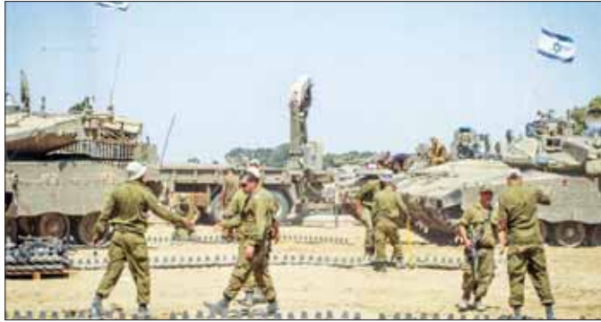
ရပ်စဲရေးကို သက်တမ်းတိုးရန် နောက်ဆုံးအချိန် ဒေသကို ပိုမိုဆိုးရွားလာစေမည်ဖြစ်သည်။ အထိ ကြိုးစားခဲ့သော်လည်း အောင်မြင်မှုအရိပ် အယောင်မတွေ့ခဲ့ပေ။ တိုက်ခိုက်မှုများ ပြန်လည်စတင်ခြင်းသည် ယခင်ကတည်းက လူသားချင်းစာနာထောက်ထားမှု အကူအညီများလိုအပ်လျက်ရှိသော ဂါဇာကမ်းခြေအင်နီအိတ်ချ်ကေ

တစ်နာရီခန့်တွင် လူမှုမီဒီယာပေါ်တွင်လည်း ပစ်ခတ်တိုက်ခိုက်မှုများ ပြန်လည်စတင်လိုက်ပြီဟု ကြေညာပြီး နာရီဝက်ခန့်အကြာတွင် အစွဲရေးလေတပ်တိုက်ခိုက်ရေး ဂျက်လေယာဉ်များသည် ဟားမားစ်တို့၏ အဓိကနေရာများကို ပစ်မှတ်ထားတိုက်ခိုက်ခဲ့ကြောင်း အစွဲရေးစစ်ဘက်က ပြောကြားခဲ့သည်။ အပစ်ရပ်စဲမှုသတ်မှတ်ရက် ကုန်ဆုံးပြီး ကြာမီအချိန်အတွင်း အစွဲရေးတို့သည် ဂါဇာမြို့ မြောက်ပိုင်းနှင့် ခန့်ယွန်းနစ်တောင်ပိုင်း အပါအဝင် နေရာအတော်များများကို လေကြောင်းတိုက်ခိုက်မှုများ လုပ်ဆောင်ခဲ့ကြောင်း၊ ဂါဇာရှိ ပြည်ထဲရေးအရာရှိများက ပြောကြားခဲ့သည်။ အပစ်ရပ်စဲမှု သဘောတူညီမှုကာလအတွင်း ဟားမားစ်တို့က အစွဲရေးနှင့် နိုင်ငံခြားသား တရားခံ ၁၀၅ ဦးကို လွှတ်ပေးခဲ့သည်။ အပြန်အလှန်အားဖြင့် အစွဲရေးတို့က ပါလက်စတိုင်း ၂၄၀ ကို လွှတ်ပေးခဲ့သည်။ ကာတာ၊ အီဂျစ်နှင့် အမေရိကန်တို့သည် အပစ်