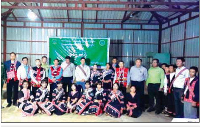
ကျွန်ဟောင်းကျေးရွာတွင် ဒေသခံလားဟူတိုင်းရင်းသားများနှင့် အမှတ်တရ။

လူသုံးကုန်ပစ္စည်းများကိုလည်း မော်ဖဒေသသို့ ပေးပို့ခဲ့သည်။ နတ်လမှ ပေးပို့သော မီးစက်များဖြင့် မက်မန်း၊ ဝိန်းနန်းနှင့် ဆွတ်တိုးတို့သည် ၁၉၉၀ ပြည့်နှစ် မတ် ၂၇ ရက်မှစတင်ကာ မီးလင်းခဲ့သည်။ ဆက်လက်၍ မော်ဖဒေသ၊ နမ့်နန်း၊ ဝမ်စလောင်း၊ တာကော်လေး၊ ရောင်အူတို့ကိုလည်း မီးလင်းသော ရွာများအဖြစ် ဖြစ်လာစေခဲ့သည်။ မော်ဖဒေသ စိုက်ပျိုးရေးလုပ်ငန်းများကို ၁၉၉၀ ပြည့်နှစ်အတွင်း နမ့်နန်းချောင်းတစ်ဝိုက် နေရာ ဖော်ထုတ်ခြင်းနှင့် မော်ဝမ်ရွာ စံပြစိုက်ခင်းတို့ဖြင့် အစပြုခဲ့သည်။ စပါးမျိုး၊ ပြောင်းမျိုး၊ မြေဩဇာ၊ ပိုးသတ်ဆေးများ ပို့ပေးခဲ့၏။ စိုက်ပျိုးရေးရုံး တစ်ရုံး၊ စိုက်ပျိုးရေးစခန်းနှစ်ခု ထားရှိပေးသည်။ လွယ်ပါ-လွယ်ဟိုလာလမ်း၊ တာကော်လေး- မက်မန်းလမ်း၊ ပွိုင့် ၆၀၂၈-ရောင်အော် - ပန်ဆန်း