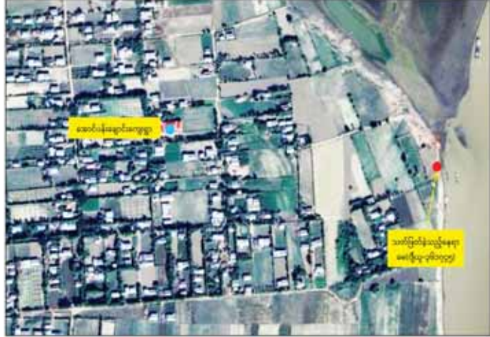
ဆရာမ ဒေါ်မာစီအား PDF အကြမ်းဖက်အဖွဲ့မှ ဖမ်းဆီးခေါ်ဆောင်သတ်ဖြတ်ခဲ့သည့် နေရာပြပုံ။