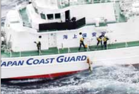
မရရှိသေးကြောင်း သိရသည်။ အဆိုပါလေယာဉ်သည် တိုကျိုရှိယိုတိုကာ လေတပ်အခြေစိုက် စခန်းပိုင်လေယာဉ်ဖြစ်သည်။ အင်နီအိတ်ချ်ကေ

ရုပ်အလောင်းကို ရှာဖွေတွေ့ရှိခဲ့သည်။ ဒီဇင်ဘာ ၁ ရက်တွင် ဂျပန်ကမ်းခြေစောင့်တပ်ဖွဲ့သည် ယာဂူရီမာလေဆိပ်မှ ၁ ဒသမ ၂ ကီလိုမီတာအကွာအထိ အသေးစိတ် ရှာဖွေမှုများ ပြုလုပ်ခဲ့ချိန် ရေအောက်အသံလိုင်း ရှာဖွေမှု ကိရိယာတစ်ခုက လေယာဉ်၏ အပျက်အစီးများ ဖြစ်မည်ဟု ယူဆရသော အရာဝတ္ထုများကို ခြေရာခံနိုင်ခဲ့သည်။ ရေငုပ်သမားများ၊ ကင်းလှည့်သင်္ဘောများ၊ ရဟတ်ယာဉ်များ အပါအဝင် ၂၄ နာရီရှာဖွေမှုတွင် နောက်ထပ် မည်သည့်သဲလွန်စမှ မရရှိသေးကြောင်း သိရသည်။ အမေရိကန် စစ်ဘက်က လည်း ပျောက်ဆုံးအမှုထမ်းများ နှင့် လေယာဉ်ကို ဆက်လက်ရှာဖွေလျက်ရှိသည်။ အဆိုပါလေယာဉ်သည် တိုကျိုရှိယိုတိုကာ လေတပ်အခြေစိုက် စခန်းပိုင်လေယာဉ်ဖြစ်သည်။ အင်နီအိတ်ချ်ကေ