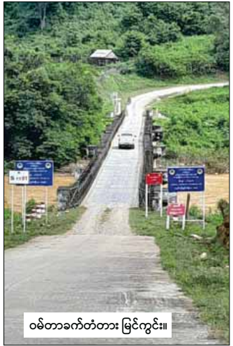
ဝမ်တာခက်တံတား မြင်ကွင်း။

▣ ညဦးပိုင်း လင်းလက်နေသော ဆိုလာမီးအလင်းရောင်လေးကို ကြည့်ရင်းက မက်မန်းမြို့လေးမှာ ၁၉၉၀ ပြည့်နှစ်မှ ယနေ့အထိ မီးစက်နှင့် နှစ်ပါးသွားကာ ၆ နာရီမှ ၉ နာရီအထိ မီးပေးနေရသည့် ၆-၉ ဘဝက မကျွတ်လွတ်နိုင် သေးသည်ကို စိတ်မကောင်းဖြစ်မိသည်။ မက်မန်းမြို့ အနောက်မြောက်ဘက် လေးမိုင်ခန့်အကွာ နမ့်နန်းချောင်းမှ ရေအားကို အသုံးပြုပြီး ရေအားလျှပ်စစ် ထုတ်နိုင်ရေး ၂၀၁၈ ခုနှစ်တွင် ကြိုးစားခဲ့ကြသေးသည်။ မအောင်မြင်ခဲ့ပါ။ ယခု ရှမ်းပြည်နယ်ဝန်ကြီးချုပ် ဦးအောင်ဇော်အေးအနေဖြင့် မက်မန်းမြို့ မီးရရှိရေးကိုစွဲအပေါ် အထူးအလေးထား ဆောင်ရွက်ပေးနေကြောင်း တွေ့ရ သည်။ ကွင်းဆင်းတိုင်းတာ လေ့လာရေးအဖွဲ့တွေ ထပ်မံစေလွှတ်ထားသည်