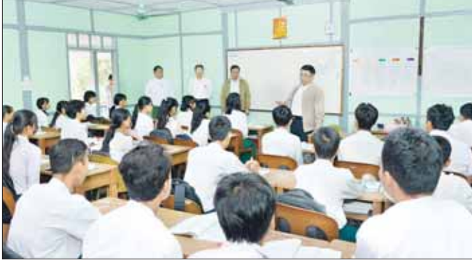
ပြည်ထောင်စုဝန်ကြီး ဒေါက်တာညွန့်ဖေသည် မန္တလေးတိုင်းဒေသကြီး ပညာရေးမှူးချုပ်၊ အခြေခံပညာဦးစီးဌာန ညွှန်ကြားရေးမှူးချုပ်၊ ဆရာအတတ်ပညာဦးစီးဌာန ညွှန်ကြားရေးမှူးချုပ်၊ မန္တလေးတိုင်းဒေသကြီး ပညာရေးမှူး၊ တာဝန်ရှိသူများနှင့်အတူ ယနေ့နံနက် ၉ နာရီတွင် အောင်မြေသာစံမြို့နယ် အမှတ်(၁၈) အခြေခံပညာ အထက်တန်းကျောင်း (နန်းတွင်း)၊ အမှတ်(၁)အခြေခံပညာ အထက်တန်းကျောင်း၊ အမှတ်(၈) အခြေခံပညာ အထက်တန်းကျောင်းနှင့် မန္တလေးပညာရေး ဒီဂရီကောလိပ်ရှိ လေ့ကျင့်ရေးအလယ်တန်းကျောင်းများကို ကြည့်ရှုစစ်ဆေးသည်။

ပညာရေးဝန်ကြီးဌာန ပြည်ထောင်စုဝန်ကြီး ဒေါက်တာညွန့်ဖေသည် အဆင့်မြင့်ပညာဦးစီးဌာန ညွှန်ကြားရေးမှူးချုပ်၊ အခြေခံပညာဦးစီးဌာန ညွှန်ကြားရေးမှူးချုပ်၊ ဆရာအတတ်ပညာဦးစီးဌာန ညွှန်ကြားရေးမှူးချုပ်၊ မန္တလေးတိုင်းဒေသကြီး ပညာရေးမှူး၊ တာဝန်ရှိသူများနှင့်အတူ ယနေ့နံနက် ၉ နာရီတွင် အောင်မြေသာစံမြို့နယ် အမှတ်(၁၈) အခြေခံပညာ အထက်တန်းကျောင်း (နန်းတွင်း)၊ အမှတ်(၁)အခြေခံပညာ အထက်တန်းကျောင်း၊ အမှတ်(၈) အခြေခံပညာ အထက်တန်းကျောင်းနှင့် မန္တလေးပညာရေး ဒီဂရီကောလိပ်ရှိ လေ့ကျင့်ရေးအလယ်တန်းကျောင်းများကို ကြည့်ရှုစစ်ဆေးသည်။