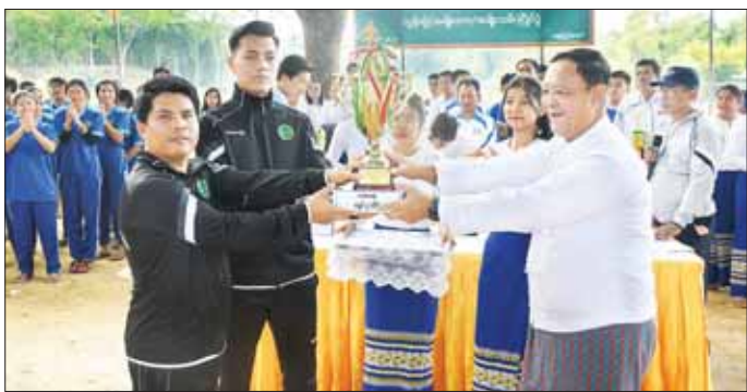
အသေးစားစက်မှုလက်မှုလုပ်ငန်းဦးစီးဌာနအသင်း၊ အသင်းတို့ကို ပြည်ထောင်စုဝန်ကြီးက ဆုပေးလှူဒါန်းရာတွင် ဝန်ထမ်းများနှင့် အသင်းဝန်ထမ်းများ ပါဝင်ယှဉ်ပြိုင်ပွဲ ပထမဆုရ ကျေးလက်ဒေသဖွံ့ဖြိုးတိုးတက်ရေးဦးစီးဌာနအသင်း၊ ပိုက်ကျော်ခြင်း ပြိုင်ပွဲပထမဆုရ ကျေးလက်လမ်းဖွံ့ဖြိုးရေးဦးစီးဌာနအသင်း၊ ဖူဆယ်ပြိုင်ပွဲ ပထမဆုရ

(၇၆)နှစ်မြောက်လွတ်လပ်ရေးနေ့အထိမ်းအမှတ် ဝန်ကြီးဌာနပေါင်းစုံ အားကစားပြိုင်ပွဲများတွင် ပါဝင်ယှဉ်ပြိုင်နိုင်ရေး၊ ဝန်ထမ်းများ စိတ်ပျော်ရွှင်စေရေးနှင့် စည်းလုံးညီညွတ်ရေးတို့ကို ရည်ရွယ်လျက် သမဝါယမနှင့် ကျေးလက်ဖွံ့ဖြိုးရေးဝန်ကြီးဌာန ဝန်ထမ်းမိသားစုများ၏ လွန်ခဲ့သောအားကစားပြိုင်ပွဲကို ယနေ့မှန်းလွဲပိုင်းတွင် ကျင်းပရာ ပြည်ထောင်စုဝန်ကြီး ဦးလှမိုး တက်ရောက်ကြည့်ရှုအားပေးသည်။