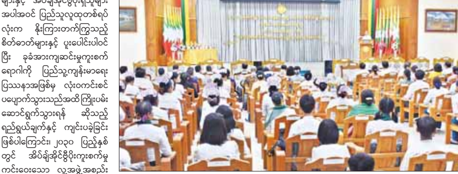
အိပ်ချ်အိုင်ဗီ/အေအိုင်ဒီအက်စ်ရောဂါ ကာကွယ်နှိမ်နင်းရေး လုပ်ငန်းများကို ဆောင်ရွက်လျက် ရှိကြောင်း၊ ယခုနှစ် ကမ္ဘာ့ခုခံအားကျဆင်းမှု ကူးစက်ရောဂါတိုက်ဖျက်ရေးနေ့ ဆောင်ပုဒ်ဖြစ်သည့် “Let Communities Lead” “အေအိုင်ဒီအက်စ်ကင်းဝေးရေး၊ ပြည်သူ့လူထု ဦးဆောင်ပေး” နှင့်အညီ အိပ်ချ်အိုင်ဗီ/အေအိုင်ဒီအက်စ် ကာကွယ်ကုသရေး ဝန်ဆောင်မှု လုပ်ငန်းများကို လူတိုင်း ညီတူညီမျှလက်လှမ်းမီ ရရှိရေးအတွက် ဦးတည်အုပ်စုဝင်များ၊ အိပ်ချ်အိုင်ဗီ/အေအိုင်ဒီအက်စ် အပါအဝင် ပြည်သူ့လူထုအားဖြင့် ဆောင်ရွက်မှသာ ၂၀၃၀ ပြည့်အထိ အိပ်ချ်အိုင်ဗီ/အေအိုင်ဒီအက်စ် ကူးစက်မှုကင်းဝေးသော လူ့အဖွဲ့အစည်းတစ်ရပ် ပေါ်ထွက်လာစေရန်ဆိုသည့် ရည်မှန်းချက်ပန်တိုင်ကို ရောက်ရှိနိုင်မည်ဖြစ်ကြောင်း ပြောကြားသည်။ ဆုများချီးမြှင့်ထိုကောက် ကမ္ဘာ့ခုခံအားကျဆင်းမှုကူးစက်ရောဂါတိုက်ဖျက်ရေးနေ့အထိမ်းအမှတ် စာစီ

၂၀၂၃ ခုနှစ် ကမ္ဘာ့ခုခံအားကျဆင်းမှု ကူးစက်ရောဂါတိုက်ဖျက်ရေးနေ့ (World AIDS Day) အထိမ်းအမှတ်အခမ်းအနားကို ယနေ့နံနက် ၉ နာရီက ကျန်းမာရေးဝန်ကြီးဌာန ရုံးအမှတ် (၄) ၌ ကျင်းပသည်။ ဆောင်ရွက်ရေးဦးစွာ ဒုတိယဝန်ကြီး ဒေါက်တာ အေးထွန်းက နှစ်စဉ် ဒီဇင်ဘာ ၁ ရက်ရောက်တိုင်း ကမ္ဘာ့ခုခံအားကျဆင်းမှု ကူးစက်ရောဂါ တိုက်ဖျက်ရေးနေ့ အထိမ်းအမှတ် အခမ်းအနားများကို ကမ္ဘာတစ်ဝန်းလုံးတွင် ကျင်းပကြပြီး အိပ်ချ်အိုင်ဗီ/အေအိုင်ဒီအက်စ်ဆိုင်ရာ ကျန်းမာရေး အသိပညာဖြန့်တင်ရန်၊ ပြည်သူ့ကျန်းမာရေး ဝန်ထမ်းများ၊ ကုလသမဂ္ဂ လက်အောက်ခံအဖွဲ့အစည်းများ၊ လူမှုရေးအသင်းအဖွဲ့များနှင့် အိပ်ချ်အိုင်ဗီ/အေအိုင်ဒီအက်စ်ဆိုင်ရာ အပါအဝင် ပြည်သူ့လူထုတစ်ရပ်လုံးက နှိုးဆော်တက်ကြွသည့် စိတ်ဓာတ်များနှင့် ဖူးပေါင်းပါဝင်ပြီး ခုခံအားကျဆင်းမှုကူးစက်ရောဂါကို ပြည်သူ့ကျန်းမာရေး ပြဿနာအဖြစ်မှ လုံးဝကင်းစင်ပပျောက်သွားသည်အထိ ကြိုးပမ်းဆောင်ရွက်သွားရန် ဆိုသည့် ရည်ရွယ်ချက်နှင့် ကျင်းပခဲ့ခြင်းဖြစ်ကြောင်း၊ ၂၀၂၃ ပြည့်နှစ်တွင် အိပ်ချ်အိုင်ဗီ/အေအိုင်ဒီအက်စ်ဆိုင်ရာ ကင်းဝေးသော လူ့အဖွဲ့အစည်းတစ်ရပ် ပေါ်ထွက်လာစေရန် ရည်ရွယ်ပြီး ကျန်းမာရေးဝန်ကြီးဌာန၏ ဦးဆောင်လမ်းညွှန်မှုဖြင့် ခုခံကျ/ကာလသားရောဂါ တိုက်ဖျက်ရေးစီမံချက်သည် ခုခံအားကျဆင်းမှု ကူးစက်ရောဂါဆိုင်ရာ အမျိုးသားမဟာဗျူဟာ စီမံကိန်း ၂၀၂၁-၂၀၂၅ နှစ်အတွက် ဦးစားပေး နည်းဗျူဟာ(၅) ရပ်နှင့်အညီ