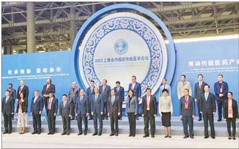
ပြည်ထောင်စုဝန်ကြီး ဒေါက်တာ သက်ခိုင်ဝင်း ၂၀၂၃ ခုနှစ် ရှန်ဟိုင်းပူးပေါင်းဆောင်ရွက်ရေး အဖွဲ့အစည်း၏ တိုင်းရင်းဆေးဖိုရမ် သို့ တက်ရောက်သည့်နိုင်ငံများမှ ကျန်းမာရေးဝန်ကြီးများ၊ ကမ္ဘာ့ကျန်းမာရေးအဖွဲ့မှ ကိုယ်စားလှယ်များနှင့် စုပေါင်းမှတ်တမ်းတင် ဓာတ်ပုံရိုက်စဉ်။

မြစ်ပါကြောင်း၊ တိုင်းရင်းဆေးပညာ ကဏ္ဍမြှင့်တင်ရန်နှင့် လူတိုင်းလက်လှမ်း မီနိုင်စေရန်အတွက် အတူတကွ ပူးပေါင်း ဆောင်ရွက်ရမည် ဖြစ်ပါကြောင်း၊ တိုင်းရင်းဆေးပညာဆိုင်ရာ မူပိုင်ခွင့်များ ကို ကာကွယ်ရန်နှင့် တိုင်းရင်းဆေးများကို တာဝန်သိသိ၊ ကျင့်ဝတ်သိကွာရှိရှိ သုံးစွဲ ကြောင်း သေချာစေရန် ဆောင်ရွက်ရမည် ဖြစ်ပါကြောင်း။ တိုင်းရင်းဆေး ထုတ်ကုန်များ၏ ဘေးကင်းမှုနှင့် အရည်အသွေးကို သေချာ စေရန်အတွက် နိုင်ငံတကာစံနှုန်းများကို လိုက်နာကာ ကုန်ကြမ်းနှင့် ဖြည့်စွက် ပစ္စည်းများအတွက် တင်သွင်းခွင့်ပြုချက် များကို ကြီးကြပ်လျက်ရှိပါကြောင်း၊ ပရေဆေးကုန်ကြမ်းများနှင့် ဆေးဖက်ဝင် အပင်များ၊ အချောထည်ထုတ်ကုန်များ အတွက် ပို့ကုန်အကြံပြုချက်များလည်း ပေးလျက်ရှိပါကြောင်း၊ ဤသို့ ဆောင် ရွက်ခြင်းအားဖြင့် နိုင်ငံသားများအား ဘေးကင်းပြီး အရည်အသွေးမြင့်သော တိုင်းရင်းဆေးရိုးရာကုထုံးများ ရရှိနိုင်စေရန် ခိုင်မာသော ကတိကဝတ်ကို အလေးပေး ဖော်ပြခြင်းဖြစ်ပါကြောင်း၊ ထို့အပြင် တိုင်းရင်းဆေးများ ထုတ်လုပ်ခြင်းနှင့် ရောင်းဝယ်ခြင်း လုပ်ငန်းစဉ်များကို ထိရောက်သောအဖွဲ့အစည်း၊ စီမံခန့်ခွဲမှု၊ စောင့်ကြည့်စစ်ဆေးခြင်းတို့ကို ခိုင်မာစေ ရန်အတွက် မြန်မာတိုင်းရင်းဆေး စံချိန် စံညွှန်း ၁၇ မျိုးနှင့် မြန်မာ့ပရေဆေးပင် ကျမ်းစာအုပ်တို့ကို ပြုစုထားပါကြောင်း၊ နိုင်ငံ၏စီးပွားရေးနှင့် လူမှုရေးဖွံ့ဖြိုး တိုးတက်မှုအတွက် ဘေးကင်းပြီး အရည် အသွေးမြင့် တိုင်းရင်းဆေးဝါးများကို