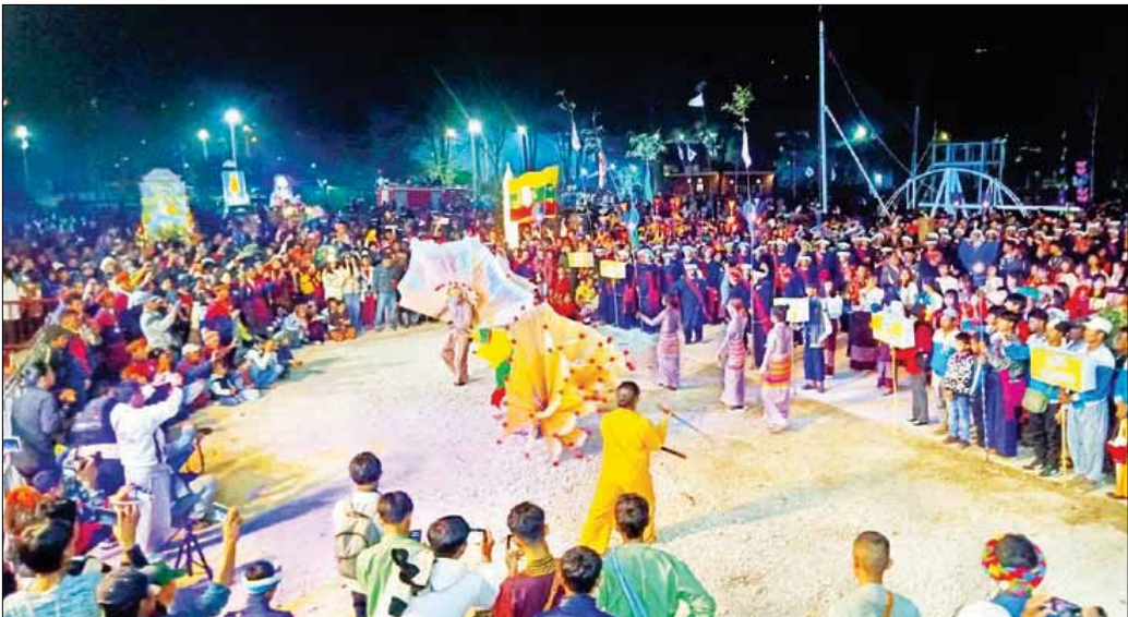
ကလေးမြို့၌ ရိုးရာမီးရှောက်တိုင်နှင့် မီးကြာစံ ထွန်းညှိပူဇော်ပွဲ စည်ကားသိုက်မြိုက်စွာကျင်းပနေမှုကို တွေ့ရစဉ်။