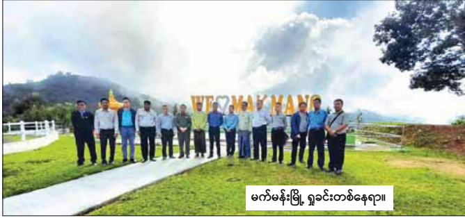
မက်မန်းမြို့ ရှုခင်းတစ်နေရာ။

မော်ဖဒေသ၏ ဖွံ့ဖြိုးရေးလုပ်ငန်းများအစ နိုင်ငံတော်အကြီးအကဲများနှင့် တပ်မတော် အကြီးအကဲများ မရောက်ဖူး၊ မသွားဖူး၊ မနေဖူး သော ဒေသဟူ၍ အလွန်ရှားပါသည်။ မော်ဖဒေသ၏ ဒုက္ခတွေကို ကောင်းစွာသိ၏။ ထို့ကြောင့် မော်ဖ ဒေသ နယ်စပ်ဖွံ့ဖြိုးရေးလုပ်ငန်းများကို ၁၉၈၉ ခုနှစ်အတွင်းမှာပင် အစပျိုးဆောင်ရွက်ပေးခဲ့သည်။ ၁၉၈၉ ခုနှစ် ဇူလိုင်လမှ စက်တင်ဘာလအထိ မော်ဖဒေသကျေးရွာအုပ်စု ၁၁ ခု၊ ကျေးရွာပေါင်း ၆၉ ရွာ၌ တစ်အိမ်တက်ဆင်း အိမ်ထောင်စုစာရင်း များ ကောက်ယူခဲ့သည်။ သက်သာဆိုင် သုံးဆိုင် ဖွင့်၍ ဆန်၊ ဆား၊ ဒန့်အိုး၊ ဒန့်ခွက်၊ ဆပ်ပြာ၊ ငါးပိ၊ ငါးခြောက်၊ အာလူး၊ ရေနံဆီ၊ ဖယောင်းတိုင်၊ လက်ဖက်ခြောက် စသည်တို့ကို ရောင်းချပေး သည်။