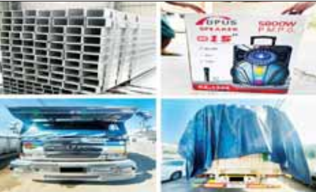
ဆောင်ရွက်လျက်ရှိသည်။ ထို့ပြင် နိုဝင်ဘာ ၂၇ ရက်တွင် ပဲခူးတိုင်းဒေသကြီးတရားမဝင် ကုန်သွယ်မှုတိုက်ဖျက်ရေးအထူးအဖွဲ့၏ စီမံခန့်ခွဲမှုဖြင့် တာဝန်ကျ ပူးပေါင်းအဖွဲ့များက စစ်ဆေးမှုများ ဆောင်ရွက်ခဲ့ရာ ပေါင်းတည်မြို့ မင်းကွက် (၃) ရပ်ကွက် ကြယ်ငါးပွင့်ဆန်စက်ရေ၌ လိုင်စင်မဲ့ JN အမျိုးအစားစက်လက်ကိုင်စက် (ခန့်မှန်းတန်ဖိုးငွေကျပ် ၁၅၀၀၀၀၀) ကို ပို့ကုန်သွင်းကုန်ဥပဒေအလည်းကောင်း၊ ပဲခူးခရိုင်နှင့် တောင်ငူခရိုင် အတွင်း၌ တရားမဝင် ကျွန်းသစ် ၀ ဒသမ ၈၇၈ တန်နှင့် အခြားသစ်

နေပြည်တော် နိုဝင်ဘာ ၂၈ တရားမဝင်ကုန်သွယ်မှုတိုက်ဖျက်ရေးဦးဆောင်ကော်မတီ၏ ကြီးကြပ် ကွပ်ကဲမှုဖြင့် တရားမဝင် ကုန်သွယ်မှုများကို ဥပဒေနှင့်အညီ ထိရောက်စွာ တားဆီးအရေးယူနိုင်ရေး ဆောင်ရွက်လျက်ရှိရာ နိုဝင်ဘာ ၂၆ ရက်တွင် ကရင်ပြည်နယ် တရားမဝင်ကုန်သွယ်မှုတိုက်ဖျက်ရေး အထူးအဖွဲ့၏ စီမံခန့်ခွဲမှုဖြင့် တာဝန်ကျပူးပေါင်းအဖွဲ့က စစ်ဆေးမှုများ ဆောင်ရွက်ခဲ့ရာ ဘားအံမြို့၊ ကမော့ကစင်ကျေးရွာအနီး၌ မြဝတီမြို့မှ ရန်ကုန်မြို့သို့ မောင်းနှင်လာသော မော်တော်ယာဉ်ယာဉ်ပစ္စည်းစီးပေါ်မှ သွင်းကုန်ကြေညာ လွှာတွင် ကြေညာထားသည်ထက် ပိုမိုထင်ဆောင်လာသည့် Golden Mountain ခရုဆီ ၁၀၀၀ ကီလိုဂရမ်၊ Lactasoy ပဲနို့ ဘူး ၃၆၀၀၀ ၊ DURO ဆိုင်ကယ်တာယာ အလုံး ၂၀၀ ၊ Polyester Fabric ၈၅၀၀ ကီလိုဂရမ်၊ GI Hollow Pipe ၁၅၀၀၀ ကီလိုဂရမ်၊ BT Speaker အလုံး ၁၀၀ အပါအဝင် ကုန်ပစ္စည်းခြောက်မျိုး (ခန့်မှန်းတန်ဖိုးငွေကျပ် ၇၃၂၀၀၀၀)နှင့် အဆိုပါပစ္စည်းများ တင်ဆောင်လာသည့် Hino Profia Truck နှစ်စီး၊ MAN Tractor Head တစ်စီး၊ Nissan Diesel Tractor Truck တစ်စီးနှင့် နောက်တွဲယာဉ်နှစ်စီး (ခန့်မှန်းတန်ဖိုးငွေကျပ် ၁၅၀၀၀၀၀)၊ စုစုပေါင်း ခန့်မှန်းတန်ဖိုးငွေကျပ် ၃၀၃၂၀၀၀၀ ကို ဖမ်းဆီးရမိခဲ့ပြီး အကောက်ခွန်လုပ်ထုံးလုပ်နည်းများနှင့်အညီ အရေးယူ