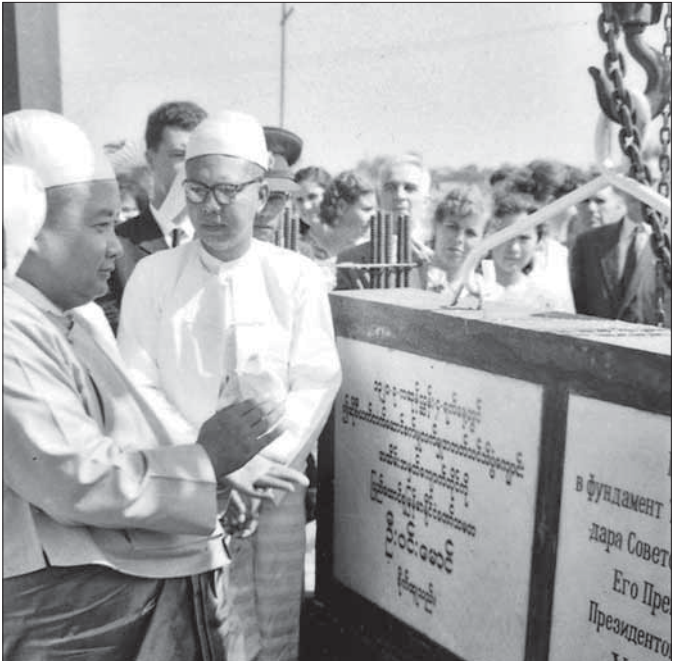
ရန်ကုန်စက်မှုတက္ကသိုလ်အား နိုင်ငံတော်သမ္မတကြီး ဦးဝင်းမောင် အုတ်မြစ်ချပေးနေစဉ်။

ဆီးဘန်းနီ ဆရာတော်၏ "သေသော်မှတည့် ဩော်ကောင်း၏" ကဗျာသည် ပါတော်မူခြင်း ကြောင့် မြန်မာလူမျိုးတို့ကို သူ့ကျွန်ဖြစ်ခြင်းထက် သေခြင်းကမြတ်သည်ဟု ဇာတိမာန်စိတ်၊ မျိုးချစ် စိတ်၊ သူ့ကျွန်မခံလိုစိတ်များဖြစ်ရန် ဆုံးမခဲ့ခြင်းဟု