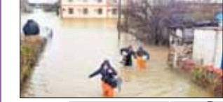
နိုင်ငံတကာသတင်း စာ ၁၃

ဟာရီကိန်းမှန်တိုင်းဝင်ရောက်တိုက်ခတ် ပြီးနောက် ခရိုင်းမီးယားဒေသခံတစ်ဦး သေဆုံးပြီး ၄၀၀၀၀၀ ကျော် လျှပ်စစ်မီး ပြတ်တောက်မှုကြုံတွေ့