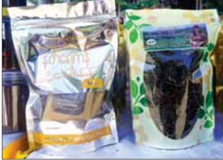
နတ်ရေကန်ကော်ဖီနှင့် လက်ဖက်ခြောက်လုပ်ငန်းမှ ထုတ်လုပ်ရောင်းချနေသည့် ထုတ်ကုန်များ။