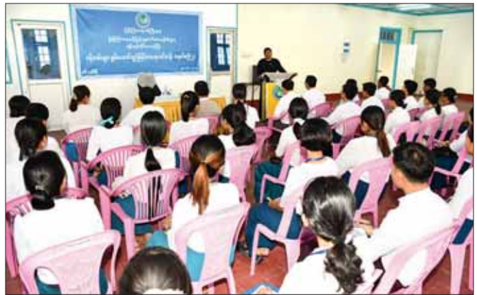
တို့အား ပြန်ကြားရေးနှင့် ပြည်သူ့ဆက်ဆံရေးဦး စီးဌာန၏လုပ်ငန်းတာဝန်များ၊ ပြည်သူ့ဆက်ဆံရေး တာဝန်၊ ရုံး၊ ရုံးလုပ်ငန်းတာဝန်များ၊ နိုင်ငံ့ဝန်ထမ်း ဥပဒေ၊ နည်းဥပဒေများ၊ ဝန်ထမ်းကျင့်ဝတ်များနှင့် စာကြည့်တိုက် ဝန်ဆောင်မှုလုပ်ငန်းများကို သက်ဆိုင်ရာတာဝန်ရှိသူများက သင်ကြားပို့ချ ပေးမည်ဖြစ်ကြောင်း သိရသည်။ အောင်မြင် (ပြန်/ဆက်)

တက်ရောက်ကြပြီး တိုင်းဒေသကြီး ဥပဒေချုပ်က ဝန်ထမ်းကောင်းမှ နိုင်ငံကောင်းမည်ဆိုသည့် စကားအတိုင်း နိုင်ငံတော်၏ ယန္တရားများ ဟန်ချက်ညီလည်ပတ်နိုင်ရန်အတွက် ဝန်ထမ်းများ စွမ်းအားနှင့် အရည်အချင်းပြည့်ဝပြီး လုပ်ငန်းပိုင်း ဆိုင်ရာ ကျွမ်းကျင်မှုနှင့် အသိအမြင်ဗဟုသုတများ ကြွယ်ဝသော စွမ်းဆောင်ရည်များ မြှင့်တင်တိုးတက် သည့်ဝန်ထမ်းကောင်းများ ဖြစ်လာစေရန်ရည်ရွယ်၍ စွမ်းရည်မြှင့်တင်ရေးသင်တန်းများကို ဖွင့်လှစ်ပို့ချပေးခြင်း ဖြစ်ကြောင်း ပြောကြားသည်။ ယင်းနောက် ပြန်ကြားရေးနှင့် ပြည်သူ့ဆက်ဆံ ရေးဦးစီးဌာန တိုင်းဒေသကြီး ညွှန်ကြားရေးမှူးက သင်တန်းဖွင့်လှစ်မှုနှင့်ပတ်သက်၍ ရှင်းလင်း ပြောကြားသည်။ အဆိုပါဝန်ထမ်းများ စွမ်းဆောင် ရည်မြှင့်တင်ရေး သင်တန်းအမှတ်စဉ်(၂) သင်တန်းကို နိုဝင်ဘာ ၂၈ ရက်မှ ၃၀ ရက်အထိ ဖွင့်လှစ်ပြီး ရန်ကုန်တိုင်းဒေသကြီးအတွင်းရှိ ပြန်ကြားရေးနှင့် ပြည်သူ့ဆက်ဆံရေးဦးစီးဌာနရုံးများမှ အမှုထမ်း ၃၀