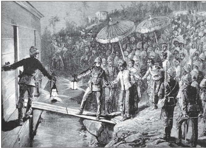
၁၈၅၅ ခုနှစ် နိုဝင်ဘာလ ၂၉ ရက်နေ့ သီပေါမင်းပါတော်မူပုံ (မန္တလေးဂေါပိနိသိကမ်း)။

ဝင်ငွေရှာဖွေခြင်းနှင့် ငွေရေးကြေးရေးစနစ်။ ကိုလိုနီခေတ်အုပ်ချုပ်မှုသည် ခေတ်မီငွေကြေးစနစ် နှင့် သတ္တုအဖွဲ့အစည်းများကို မိတ်ဆက်ပေးခဲ့ပါ သည်။ ယင်းက ကုန်သွယ်မှုနှင့် စီးပွားရေးအပြန် အလှန် ချိတ်ဆက်မှုကို ချောမွေ့စေပြီး ၎င်းသည် စီးပွားရေး၏ ဝင်ငွေရှာဖွေခြင်းကို အထောက်အကူ ဖြစ်စေရုံ မိနိုးဖလား အသက်မွေးဝမ်းကျောင်းဆိုင်ရာ အလေ့အထများကို အနှောင့်အယှက်ဖြစ်စေပါသည်။