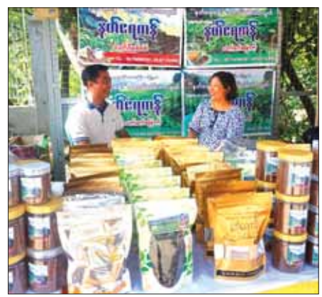
တော့ ချိုဆိမ့်၊ ခါးဆိမ့်ဆိုပြီးထုတ်လိုက်တယ်။ ကော်ဖီသီးကတော့ နိုင်ငံခြားအထိပို့တယ်။

ဖြေ။ ။ ကော်ဖီကတော့ နတ်ရေကန်တောင်ပေါ်ဒေသမှာ အမြင့် ပေ ၃၈၀၀ ကျော်မှာစိုက်တယ်။ အမီးတောင်ကြားလေးမှာ စိုက်တယ်။ ကိုယ်ပိုင်မြေနဲ့လည်းစိုက်တယ်။ ကိုယ်ပိုင်မြေကတော့ ခြောက် ဇက ရှိတယ်။ အစကတော့ ကော်ဖီသီးကိုပဲ ဝယ်ရောင်းလုပ်နေတာ။ ကော်ဖီမှုန့်ဘယ်မှာ ကြိတ်ရမှန်းလည်းမသိဘူး။ ကော်ဖီသီးကို အမှုန့် ကြိတ်ရအောင် ဘယ်လိုလုပ်ရမှန်းလည်းမသိဘူး။ ခုနှစ်နှစ် ရှစ်နှစ် လောက်ကြာမှ ပြင်ဦးလွင်မှာသွားပြီးတော့ ကော်ဖီမှုန့်ကို ကြိတ်လိုက် တာ။ ကျွန်မ နေပြည်တော်မှာ သွားပြိုင်လိုက်သေးတယ်။ ငမဲက ဒုတိယရတယ်။ ရွာငဲ့ကတော့ ပထမရတယ်။ ဒုတိယရတယ်ဆိုတော့ ငါတို့ အဆင့်မီတယ်ဆိုပြီးတော့ အထုပ်လေးတွေ ထုပ်ပြီးရောင်းတာ မရောင်းရဘူး။ အမှုန့်ဆိုတာ ပြင်ဦးလွင်မှာလည်း ပေါတာကို။ ဒါကြောင့် မရောင်းရဘူး။ နောက်ပိုင်းကျတော့ ကော်ဖီထုတ်တဲ့ နည်းပညာကို ရန်ကုန်ကိုသွားပြီး သူငယ်ချင်းတစ်ယောက် လုပ်နေတာ ကို သွားပြီးလေ့လာတယ်။ ပြင်ဦးလွင်က သူငယ်ချင်းတွေရဲ့ စက်ရုံတွေ သွားပြီး လေ့လာတယ်။ ကျွန်မတို့မကွေးဒေသမှာ အချို့ကြိုက်တာများ