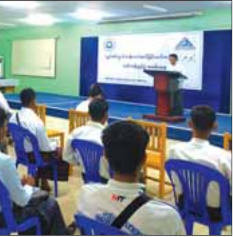
မညီ အလုပ်သမားများအတွက် လုပ်ငန်းနှင့် နည်းပြဆရာ နှစ်ဦးဖြင့် သင်တန်းသား ကျွမ်းကျင်မှုရှိသော ကျွမ်းကျင် ၂၅ ဦးအား နိုဝင်ဘာ ၂၈ ရက်မှ ဒီဇင်ဘာ ၂၂ ရက် အထိ ပို့ချပေးမည်ဖြစ်ကြောင်း သိရသည်။ မြင့်မြင့်ရီ (ပြန်/ဆက်)

သင်တန်းကို နိုင်ငံတော်၏ စက်မှုလက်မှုလုပ်ငန်းများ ဖွံ့ဖြိုးတိုးတက်ရေးကို အထောက်အကူပြုစေရန် နိုင်ငံအတွင်း လိုအပ်လျက်ရှိသော ကျွမ်းကျင်လုပ်သားများ ထုတ်ပေးနိုင်ရန်၊ အလုပ်အကိုင်အခွင့်အလမ်းများ ဖန်တီးပေးနိုင်ရန်နှင့် ပြည်ပနိုင်ငံများတွင် သွားရောက်လုပ်ကိုင်