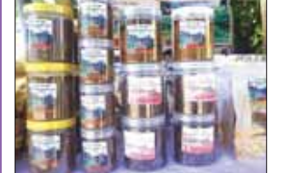
သေးငယ်လတ် စီးပွားရေးလုပ်ငန်း စာ ၁၈

နိုင်ငံတော်၏အားပေးမြှင့်တင်မှုနှင့် အတူ အောင်မြင်လာသည့် နတ်ရေကန် ကော်ဖီနှင့် လက်ဖက်ခြောက်လုပ်ငန်း