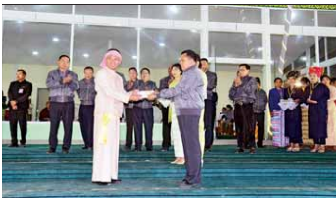
တေးဂီတအဖွဲ့၊ မီးပုံးပျံပြိုင်ပွဲတွင် မှတ်တမ်းတင် ဇာတ်ပုံရိုက်ကူးပေးခဲ့သော ဦးကျော်ကျော်ဝင်းနှင့် အဖွဲ့၊ မီးပုံးပျံပြိုင်ပွဲခြောက်ရေးအတွက် ပညာရှင် များကို ရှမ်းပြည်နယ်ဝန်ကြီးချုပ် ဦးအောင်ဇော်အေး မောင်မောင်သန်း(ပြန်/ဆက်)

တောင်ကြီး နိုဝင်ဘာ ၂၈ ၂၀၂၃ ခုနှစ် တောင်ကြီးတန်ဆောင်တိုင်ပွဲတော် ဂုဏ်ပြုဆုချီးမြှင့်ခြင်းနှင့် ပိတ်ပွဲအခမ်းအနားကို တန်ဆောင်မုန်းလပြည့်နေ့ည (နိုဝင်ဘာ ၂၇ ရက်ည) ၁၀ နာရီက တောင်ကြီးမြို့ အဝေရာဇ်ဗုံးပျံကွင်း၌ ကျင်းပသည်။ ပိတ်ပွဲအခမ်းအနားတွင် တိုင်းရင်းသားစာပေ ယဉ်ကျေးမှုအဖွဲ့များက ကြေညာပြောဆိုပြီး နိုဝင်ဘာ ၂၇ ရက်ည၏ ပြိုင်ပွဲဝင်မိန်းပုံးပျံများဖြစ်သော ညမီးကြီး ယမ်းမီး ၂၂ ပေ မီးပုံးပျံ ခြောက်လုံးနှင့် စိန်နားပန် မီးပုံးပျံ တစ်လုံး ပြိုင်ပွဲပါဝင်လွှတ်တင်ရာ ဒေသခံ ပြည်သူများ၊ ရပ်နီးရပ်ဝေးမှ ဧည့်သည်တော်များ၊ ပွဲတော်လာ ဧည့်ပရိသတ်များနှင့် ခေတ်ပေါ် တေးဂီတပိုင်းများဖြင့် ရုပ်ရှင်သရုပ်ဆောင်များ၊ ဒေသခံအဆိုတော်များဖြင့် စည်ကားသိုက်မြိုက်စွာ ပွဲတော်ကို ပါဝင်ဆင်နွှဲကြကြောင်း သိရသည်။ ဆက်လက်၍ ဂုဏ်ပြုဆုချီးမြှင့်ငွေပေး ပေးအပ်ရာ အခြေခံပညာအထက်တန်းကျောင်းမှ ကျောင်းသား ကျောင်းသူများအဖွဲ့ လေးကျောင်း၊ အကနည်းပြများ၊ အခမ်းအနားမှူး၊ လေ့ဦးတို့ကို အရှေ့ပိုင်းတိုင်း စစ်ဌာနချုပ် ဒုတိယတိုင်းမှူး၏ ဇနီး၊ ပြည်နယ်