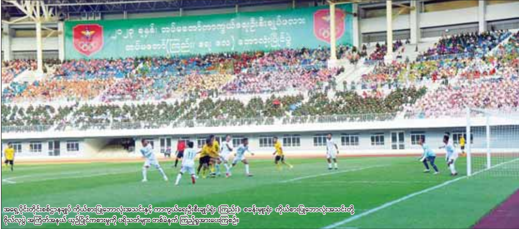
အရှေ့ပိုင်းတိုင်းစစ်ဌာနချုပ် ကိုယ်စားပြုဘောလုံးအသင်းနှင့် ကာကွယ်ရေးဦးစီးချုပ်ရုံး (ကြည်း)၊ စခန်းမှူးရုံး ကိုယ်စားပြုဘောလုံးအသင်းတို့ ဗိုလ်လှပွဲ အကြိတ်အမှတ် ယှဉ်ပြိုင်ကစားမှုကို ထိသတ်များ တစ်ဝိုက်က ကြည့်ရှုအားကြည့်ပုံ။