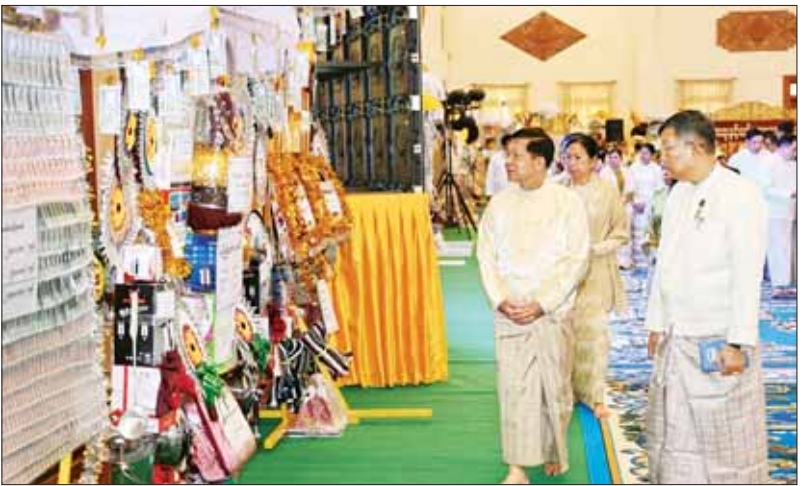
နိုင်ငံတော်စီမံအုပ်ချုပ်ရေးကောင်စီဥက္ကဋ္ဌ နိုင်ငံတော်ဝန်ကြီးချုပ် ဗိုလ်ချုပ်မှူးကြီး မင်းအောင်လှိုင်နှင့် ဧည့်ပရိသတ်အပေါင်းတို့က ကထိန်ခံ ဓမ္မဉာဏိမြို့နယ် မဟာဝိမိတာရုံကျောင်းတိုက်သို့ လှူဒါန်းရန် ခင်းကျင်းပြင်ဆင်ထားသည့် ကထိန်လျာ သင်္ကန်း၊ လှူဖွယ်ပစ္စည်းများနှင့် ပဒေသာပင်များအား လှည့်လည်ကြည့်ရှုစဉ်။

ယင်းနောက် အခမ်းအနားကို “နမတေဿ” သုံးကြိမ်ရွတ်ဆိုဘုရားကံစောင့်လှမ်းပြီး နိုင်ငံတော်စီမံအုပ်ချုပ်ရေးကောင်စီဥက္ကဋ္ဌ နိုင်ငံတော်ဝန်ကြီးချုပ်နှင့် အခမ်းအနား တက်ရောက်လာကြသည့် ဧည့်ပရိသတ်အပေါင်းတို့သည် သန့်လှူပင်မင်းကျောင်း ဆရာတော်ကြီးထံမှ ငါးပါးသီလံခံယူဆောက်တည်၍ သံဃာတော်အရှင်သုမြတ်များ ရွတ်ပွားသရဇ္ဈာယ်တော်မူသော မေတ္တာသုတ်ပရိတ်တရားတော်များကို နာယူကြသည်။