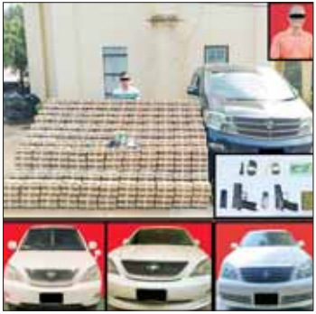
သိမ်းဆည်းရမိသည့် စိတ်ကြွေးသွပ် ဆေးပြားများ၊ လက်နက်/ဗုံးယမ်းများ။

နေပြည်တော် နိုဝင်ဘာ ၂၄ ရှမ်းပြည်နယ် (တောင်ပိုင်း) လှိုင်လင်မြို့နယ်တွင် ငွေကျပ် ၁ ဒသမ ၃၅ တီလီယံတန်ဖိုးရှိ စိတ်ကြွေးသွပ်ဆေးပြား ၄ ဒသမ ၅ သန်း ဖမ်းဆီးရမိပြီး ကွင်းဆက်အရ တောင်ကြီးမြို့တွင် ပစ္စတိုသေနတ် နှစ်လက်နှင့် လက်ပစ်ဗုံး နှစ်လုံး သိမ်းဆည်းရမိခဲ့ကြောင်း မြန်မာနိုင်ငံ ရဲတပ်ဖွဲ့မှ သိရသည်။