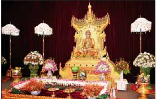
နိုင်ငံတော်စီမံအုပ်ချုပ်ရေးကောင်စီဥက္ကဋ္ဌ နိုင်ငံတော်ဝန်ကြီးချုပ် ဗိုလ်ချုပ်မှူးကြီး မင်းအောင်လှိုင် သာသနာ့မဟာဝိမာန်တော်အတွင်းရှိ ဗုဒ္ဓရုပ်ပွားတော်မြတ်အား ဖူးမြော်ကြည်ညို၍ မြသပိတ်ဆွမ်းတော်၊ ပန်း၊ ရေချမ်း၊ ဆီမီးနှင့် သစ်သီးတို့ကို ဆက်ကပ်လှူဒါန်းစဉ်။