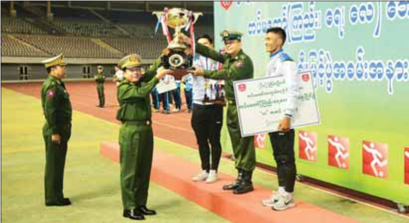
နိုင်ငံတော်စီမံအုပ်ချုပ်ရေးကောင်စီဥက္ကဋ္ဌ တပ်မတော်ကာကွယ်ရေးဦးစီးချုပ် ဗိုလ်ချုပ်မှူးကြီး မင်းအောင်လှိုင် တပ်မတော် (ကြည်း၊ ရေ၊ လေ) ဘောလုံးပြိုင်ပွဲ (က) အဆင့်ပြိုင်ပွဲတွင် ပထမဆု ဆုတံဆိပ်ခံခဲ့သည့် ကာကွယ်ရေးဦးစီးချုပ်ရုံး (ကြည်း)၊ စခန်းမှူးရုံးအသင်းကို တပ်မတော်ကာကွယ်ရေးဦးစီးချုပ်၏ တံခွန်ခိုက်ဆုပေးလား ပေးအပ်ချီးမြှင့်စဉ်။

နေပြည်တော် နိုဝင်ဘာ ၂၄ အကြိမ် (၆၀) မြောက် တပ်မတော်ကာကွယ်ရေးဦးစီးချုပ်ဖလား တပ်မတော် (ကြည်း၊ ရေ၊ လေ) ဘောလုံးပြိုင်ပွဲ ဗိုလ်လုပွဲကို ယနေ့ညနေပိုင်းတွင် နေပြည်တော်ရှိ ဇေယျာသီရိ တပ်မတော်အားကစားကွင်း၌ ကျင်းပပြုလုပ်ရာ အရှေ့ပိုင်းတိုင်း စစ်ဌာနချုပ်ကိုယ်စားပြု ဘောလုံးအသင်းနှင့် ကာကွယ်ရေးဦးစီးချုပ်ရုံး (ကြည်း) စခန်းမှူးရုံး ကိုယ်စားပြုဘောလုံးအသင်းတို့ ယှဉ်ပြိုင်ကစားကြသည်။ ပြိုင်ပွဲမစတင်မီ ဗိုလ်လုပွဲသို့ လာရောက်ကြည့်ရှုအားပေးကြသည့် နှစ်ဖက်အသင်း ဝန်ထမ်းများနှင့် အားကစားဝါသနာရှင် ဝန်ထမ်းများအား ပြည်သူ့ဆက်ဆံရေးနှင့် စိတ်ဓာတ်စစ်ဆင်ရေး ညွှန်ကြားရေးမှူးရုံး၊ ကွက်ကုမ္ပဏီအောက် မြဝတီတေးဂီတအဖွဲ့မှ တေးသံရှင်များက တေးသံသာများဖြင့် သီဆိုဖော်ပြကြသည်။