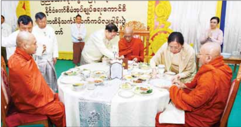
နိုင်ငံတော်စီမံအုပ်ချုပ်ရေးကောင်စီဥက္ကဋ္ဌ နိုင်ငံတော်ဝန်ကြီးချုပ် ဦးမင်းအောင်လှိုင်နှင့်စနိုး၊ ဒေါ်ကြူကြူလှ သန့်လှင်မင်းကျောင်းဆရာတော်ကြီး အဖူးပြုသည့် ဆရာတော်၊ သံဃာတော်များအား နေ့ဆွမ်းဆက်ကပ်လှူဒါန်းစဉ်။