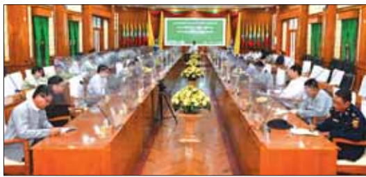
ရိုးရာကောက်သစ်စားပွဲတော် (အင်လုံအင်နန်) ပွဲတော်ကျင်းပရေး လုပ်ငန်းညှိနှိုင်းအစည်းအဝေး ကျင်းပစဉ်။

မြန်မာ့အလင်း သတင်းအချက်အလက်ဌာန နှင့် အခြားသီးနှံများ စိုက်ပျိုး ဆောင်ရွက်နိုင်ရေးကို နိုဝင်ဘာ ၂၅ ရက်က ကွင်းဆင်းစစ်ဆေး သည့်။ ပြည်နယ် ဝန်ကြီးချုပ်နှင့် အဖွဲ့ဝင်များသည် ဆောင်းသီးနှံ စိုက်ပျိုးနိုင်ရေး စိုက်ကွင်းများ အတွင်း ပြည်နယ်အစိုးရအဖွဲ့ ရန်ပုံငွေဖြင့် တူးဖော်ထားသည့် ဆိုလာရေတွင်း/ စက်ရေတွင်းများ မှစိုက်ပျိုးရေလုံလောက်စွာရရှိရေး ပင်မမြောင်း (အင်ဂျန်းနီယာဇာ နှင့် လက်ကိုင်ရေမြောင်းများ ပြန်လည်တူးဖော်နိုင်ရေးကော် မရှာ ဖြစ်ပေါ်နေသည့် အခြား သီးနှံမြေစေ့များ လုံလောက်စွာ ပြုစုပေးနိုင်ရေးမှာ ဓာတ်မြေ သြဇာ၊ သဘာဝမြေဓာတ်နှင့်