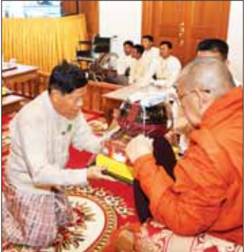
ပြည်ထောင်စုရေးကော်မတီဝန်ထမ်းများနှင့် ဥပဓိကဦးစီးဆရာတော်က ကထိန်သက်နိုးနှင့် လှူဒါန်းပစ္စည်းများ ဆက်ကပ်လှူဒါန်းစဉ်။