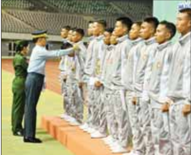
ကာကွယ်ရေးဦးစီးချုပ် (ခေလ) ဗိုလ်ချုပ်ကြီး ထွန်းအောင် (ခ) အဆင့်မြိုင်ပွဲ တွင် ပထမဆုရရှိသည့် တောင်ပိုင်းတိုင်းစစ်ဌာနချုပ်အသင်းမှ အားကစား သမားများကို တစ်ဦးချင်းဆုတံဆိပ်များ ပေးအပ်ချီးမြှင့်စဉ်။