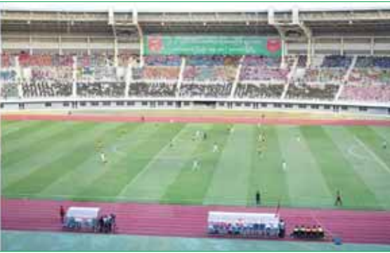
နိုင်ငံတော်စီမံအုပ်ချုပ်ရေးကောင်စီဥက္ကဋ္ဌ တပ်မတော်ကာကွယ်ရေးဦးစီးချုပ် ဗိုလ်ချုပ်မှူးကြီး မင်းအောင်လှိုင်၊ ဇနီး ဒေါ်ကြူကြူလှနှင့် တက်ရောက်လာကြသူများ အကြိမ် (၆၀) မြောက် တပ်မတော်ကာကွယ်ရေးဦးစီးချုပ်ဖလား တပ်မတော် (ကြည်း၊ ရေ၊ လေ) ဘောလုံးပြိုင်ပွဲဗိုလ်လုပွဲ ယှဉ်ပြိုင်ကစားနေမှုကို ကြည့်ရှုအားပေးကြစဉ်။