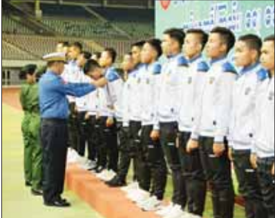
ကာကွယ်ရေးဦးစီးချုပ် (ရေ) ဗိုလ်ချုပ်ကြီး မိုးအောင် (က) အဆင့်မြိုင်ပွဲတွင် ပထမဆုရရှိသည့် ကာကွယ်ရေးဦးစီးချုပ်ရုံး (ကြည်း)၊ စခန်းမှူးရုံးအသင်းမှ အားကစားသမားများကို တစ်ဦးချင်း ဆုတံဆိပ်များ ပေးအပ်ချီးမြှင့်စဉ်။

တံခွန်စိုက်ဆုပေးပေးအပ်ချီးမြှင့် ထိုနေ့က နိုင်ငံတော်စီမံအုပ်ချုပ်ရေးကောင်စီ ဥက္ကဋ္ဌ တပ်မတော်ကာကွယ်ရေးဦးစီးချုပ် ဗိုလ်ချုပ် များကြီး မင်းအောင်လှိုင် က တစ်ဖက် (ကြည်း၊ ရေ ခေလ) ဘောလုံးပြိုင်ပွဲ (က) အဆင့်မြိုင်ပွဲတွင် ပထမဆုရရှိသည့် တောင်ပိုင်းစစ်ဌာနချုပ် အသင်းကို တစ်ဖက်ကာကွယ်ရေးဦးစီးချုပ်၏ တံခွန်စိုက်ဆုပေးပေးအပ်ချီးမြှင့်စဉ်။