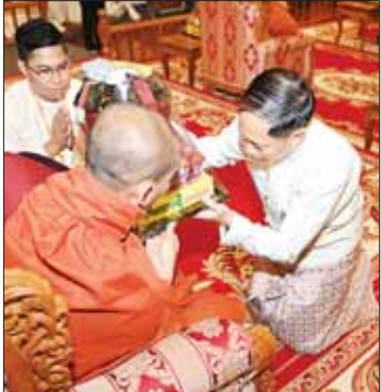
ကာကွယ်ရေးဦးစီးချုပ်(လေ) ဗိုလ်ချုပ်ကြီး ထွန်းအောင် ဆရာတော်က ကထိန်သက်နိုးနှင့် လှူဒါန်းပစ္စည်းများ ဆက်ကပ်လှူဒါန်းစဉ်။