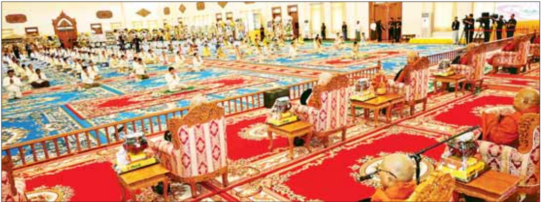
နိုင်ငံတော်စီမံအုပ်ချုပ်ရေးကောင်စီဥက္ကဋ္ဌ နိုင်ငံတော်ဝန်ကြီးချုပ် ဗိုလ်ချုပ်မှူးကြီး မင်းအောင်လှိုင်နှင့် ဧည့်ပရိသတ်အပေါင်းတို့က သန့်လှူပင်မင်းကျောင်း ဆရာတော်ကြီးထံမှ ငါးပါးသီလံခံယူ ဆောက်တည်၍ သံဃာတော်အရှင်သုမြတ်များ ရွတ်ပွားသရဇ္ဈာယ်တော်မူသော မေတ္တာသုတ်ပရိတ်တရားတော်များကို နာယူကြစဉ်။