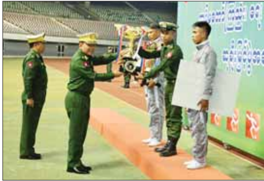
ညွှန်ကြားကွပ်ကဲရေးမှူး (ကြည်း၊ ရေ ခေလ) ဗိုလ်ချုပ်ကြီး မောင်မောင်အေး တစ်ဖက် (ကြည်း၊ ရေ ခေလ) ဘောလုံးပြိုင်ပွဲ (ခ) အဆင့်မြိုင်ပွဲတွင် ပထမဆုရရှိသော တောင်ပိုင်းတိုင်းစစ်ဌာနချုပ်အသင်းကို တစ်ဖက်ကာကွယ်ရေးဦးစီးချုပ်၏ တံခွန်စိုက်ဆုပေးပေးအပ်ချီးမြှင့်စဉ်။

ယင်းနေ့က ပွဲနှိုင်းကွပ်ကဲရေးမှူး (ကြည်း၊ ရေ