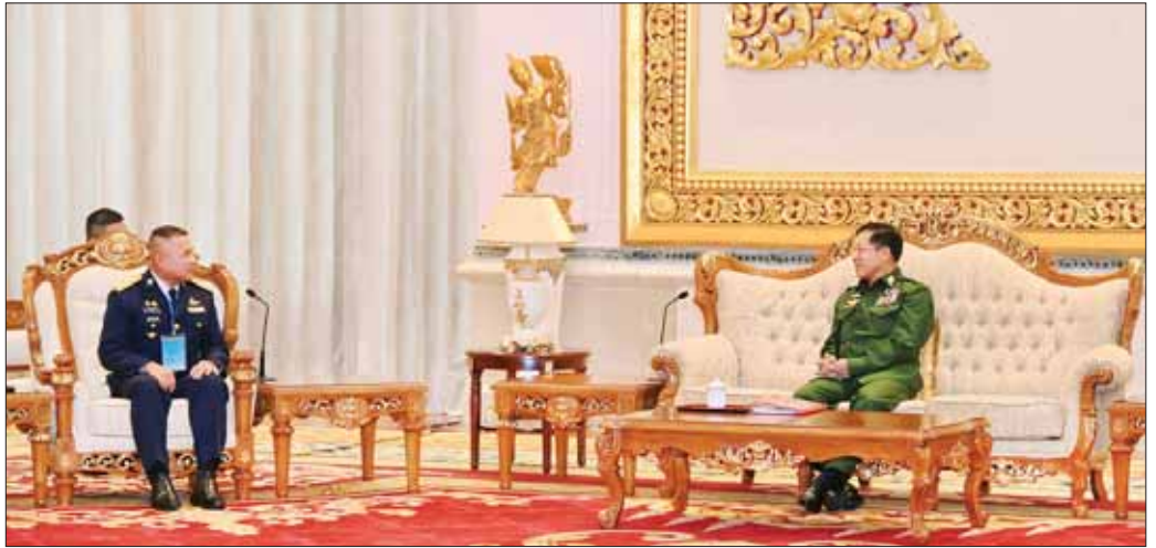
နိုင်ငံတော်စီမံအုပ်ချုပ်ရေးကောင်စီဥက္ကဋ္ဌ တပ်မတော်ကာကွယ်ရေးဦးစီးချုပ် ဗိုလ်ချုပ်မှူးကြီး မင်းအောင်လှိုင် ထိုင်းဘုရင့်လေတပ်ဦးစီးချုပ် Air Chief Marshal Punpakdee Pattanakul အား လက်ခံတွေ့ဆုံစဉ်။

တွေ့ဆုံပွဲအပြီးတွင် နိုင်ငံတော်စီမံအုပ်ချုပ်ရေးကောင်စီဥက္ကဋ္ဌ တပ်မတော်ကာကွယ်ရေးဦးစီးချုပ်နှင့် ထိုင်းဘုရင့်လေတပ်ဦးစီးချုပ်တို့သည် အမှတ်တရ လက်ဆောင်ပစ္စည်းများ အပြန်အလှန်ပေးအပ်ခဲ့ကြပြီး စုပေါင်းမှတ်တမ်းတင် ဓာတ်ပုံရိုက်ခဲ့ကြကြောင်း သတင်းရရှိသည်။ သတင်းစဉ်