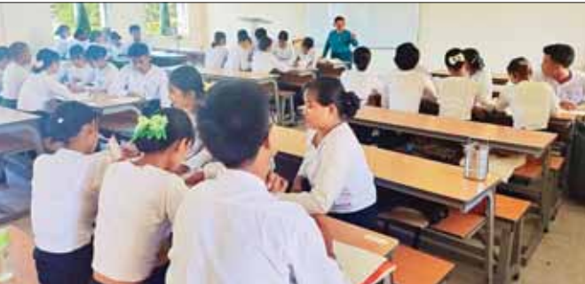
ရန်ကုန်တိုင်းဒေသကြီး လှည်းကူးပညာရေးဒီဂရီကောလိပ်တွင် ပုံမှန်သင်တန်းနှင့် ဘွဲ့ရသင်တန်းများကို နိုဝင်ဘာ ၂၃ ရက်က ဖွင့်လှစ်ရာ ကျောင်းသား ကျောင်းသူများ သင်ယူနေစဉ်။ ဥဏ်ဟိန်း