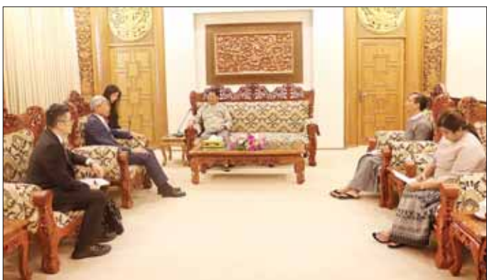
သွားရေး၊ မြန်မာ-တရုတ် နှစ်နိုင်ငံ နယ်စပ်ဒေသ တစ်လျှောက် တည်ငြိမ်အေးချမ်းရေးနှင့် တရား ဥပဒေစိုးမိုးရေးအတွက် နှစ်ဖက် ဆက်လက်ပူးပေါင်း ဆောင်ရွက် အမြင်ချင်းဖလှယ်ခဲ့ကြသည်။ သွားမည့် ကိစ္စရပ်များနှင့် စပ်လျဉ်း သတင်းစဉ်

နေပြည်တော် နိုဝင်ဘာ ၂၃ ဒုတိယဝန်ကြီးချုပ်နှင့် နိုင်ငံခြား ရေးဝန်ကြီးဌာန ပြည်ထောင်စု ဝန်ကြီး ဦးသန်းဆွေသည် မြန်မာနိုင်ငံဆိုင်ရာ တရုတ်ပြည်သူ့ သမ္မတနိုင်ငံ သံအမတ်ကြီး မစ္စတာ ချန်းဟိုင်အား ယနေ့နံနက်ပိုင်းတွင် နေပြည်တော်ရှိအဆိုပါဝန်ကြီးဌာန ၌ လက်ခံတွေ့ဆုံသည်။ (ယာပုံ) တွေ့ဆုံစဉ် မြန်မာ - တရုတ် နှစ်နိုင်ငံအကြား တည်ရှိပြီး ဖြစ်သည့် ဆွေးနွေးပေါက်ဖော် ချစ်ကြည်ရင်းနှီးမှုကို အခြေခံ၍ နှစ်နိုင်ငံဆက်ဆံရေး တိုးတက် ခိုင်မာရေး၊ အကျိုးတူ ပူးပေါင်း ဆောင်ရွက်မှုစီမံကိန်းများ ဆက် လက် အကောင်အထည်ဖော်