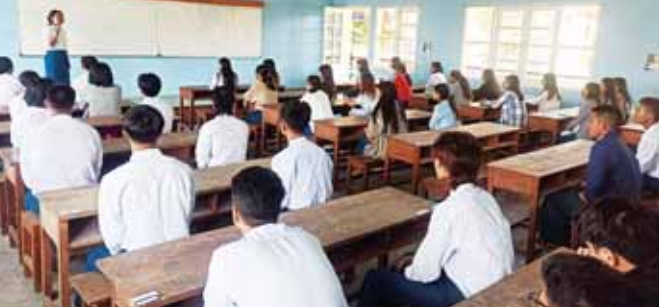
ကွန်ပျူတာတက္ကသိုလ်(ပင်လုံ)တွင် ၂၀၂၃-၂၀၂၄ ပညာသင်နှစ်အတွက် နိုဝင်ဘာ ၂၃ ရက်က သင်ခန်းစာများ စတင်သင်ကြားပေးလျက်ရှိရာ ကျောင်းသား ကျောင်းသူများ သင်ယူနေစဉ်။