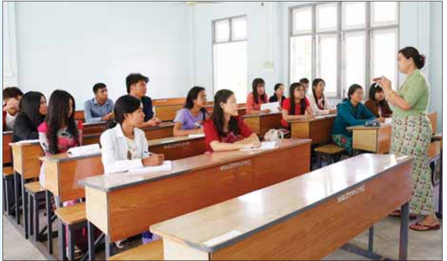
မကွေးတက္ကသိုလ် ၂၀၂၃-၂၀၂၄ ပညာသင်နှစ် စတင်ဖွင့်လှစ်သည့် သင်္ချာကျောင်းသား ကျောင်းသူများ စာသင်ကြားနေစဉ်။ (သင်တန်းများကို နိုဝင်ဘာ ၂၃ ရက်တွင် စတင်ဖွင့်လှစ်သင်ကြားလျက်ရှိရာ မကွေးတက္ကသိုလ်၌ ကျောင်းသားဦးရေ ၅၆၆ ဦး တက်ရောက်ပညာသင်ကြားလျက်ရှိသည်။)

တိုင်းဒေသကြီးနှင့် ပြည်နယ်အသီးသီးရှိ စီးပွားရေး တက္ကသိုလ်များ၊ ကွန်ပျူတာတက္ကသိုလ်များ၊ နည်းပညာတက္ကသိုလ်များ၊ တက္ကသိုလ်များ၊ ဒီဂရီကောလိပ်များ၊ ပြည်ထောင်စုတိုင်းရင်းသားလူငယ်များ စွမ်းရည်ဖွံ့ဖြိုးရေးဒီဂရီကောလိပ်၊ ပညာရေးဒီဂရီကောလိပ်တို့ကို နိုဝင်ဘာ ၂၃ ရက်တွင် စတင်ဖွင့်လှစ်လျက်ရှိရာ ကျောင်းသား ကျောင်းသူများ လေ့လာသင်ယူနေကြသည့် မြင်ကွင်းများကို စုစည်းဖော်ပြလိုက်ပါသည်။ စာတည်းအဖွဲ့