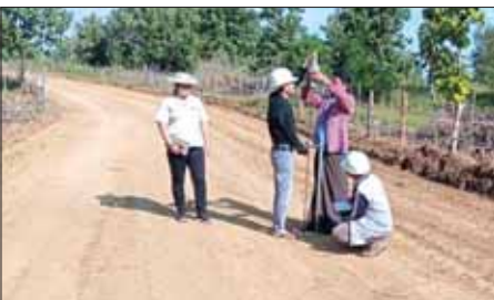
အဆင်ပြေချောမွေ့လှစေမည်ဖြစ်ပြီး ကျေးလက်နေပြည်သူများအနေဖြင့် လူမှုစီးပွားဖွံ့ဖြိုးတိုးတက်လာမည်ဖြစ်ကြောင်း မြို့နယ်ကျေးလက်လမ်း ဖွံ့ဖြိုးရေးဦးစီးဌာနမှ သိရသည်။

မင်းလှမြို့နယ်၌ ကျေးလက်လမ်းများကို လမ်းခင်းခြင်းဆောင်ရွက် ပြီးစီးပါက ကျေးလက်နေပြည်သူများ လမ်းပန်းဆက်သွယ်ရေး ပိုမို