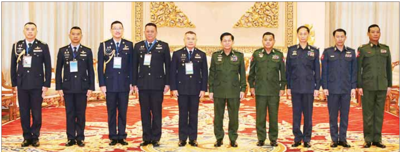
နိုင်ငံတော်စီမံအုပ်ချုပ်ရေးကောင်စီဥက္ကဋ္ဌ တပ်မတော်ကာကွယ်ရေးဦးစီးချုပ် ဗိုလ်ချုပ်မှူးကြီး မင်းအောင်လှိုင်နှင့် အဖွဲ့ဝင်များ ထိုင်းဘုရင့်လေတပ်ဦးစီးချုပ် Air Chief Marshal Punpakdee Pattanakul ဦးဆောင်သည့်ကိုယ်စားလှယ်အဖွဲ့နှင့်အတူ စုပေါင်းမှတ်တမ်းတင် ဓာတ်ပုံရိုက်စဉ်။