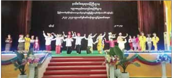
ပြည်ထောင်စုတိုင်းရင်းသားလူငယ်များ စွမ်းရည်ဖွံ့ဖြိုးရေးဒီဂရီကောလိပ်(ရန်ကုန်)၌ ၂၀၂၃-၂၀၂၄ ပညာသင်နှစ် သင်တန်းဖွင့်ပွဲနှင့် မောင်မယ်သစ်လွင်ကြိုဆိုပွဲ အခမ်းအနားကျင်းပစဉ်။