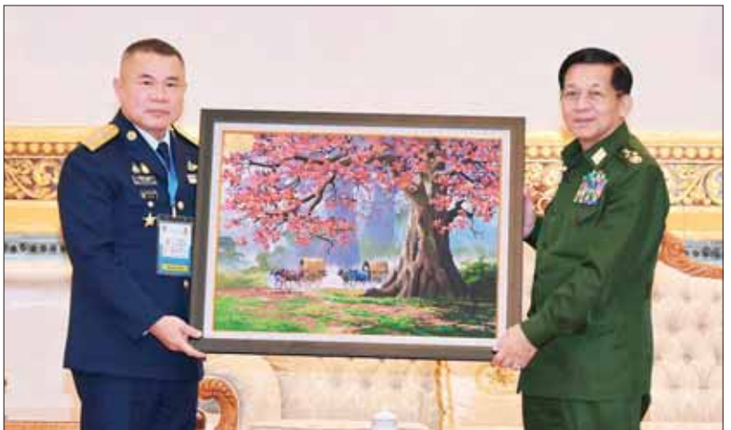
နိုင်ငံတော်စီမံအုပ်ချုပ်ရေးကောင်စီဥက္ကဋ္ဌ တပ်မတော်ကာကွယ်ရေးဦးစီးချုပ် ဗိုလ်ချုပ်မှူးကြီး မင်းအောင်လှိုင်နှင့် ထိုင်းဘုရင့်လေတပ်ဦးစီးချုပ် Air Chief Marshal Punpakdee Pattanakul တို့ အမှတ်တရ လက်ဆောင်ပစ္စည်းများ အပြန်အလှန်ပေးအပ်စဉ်။