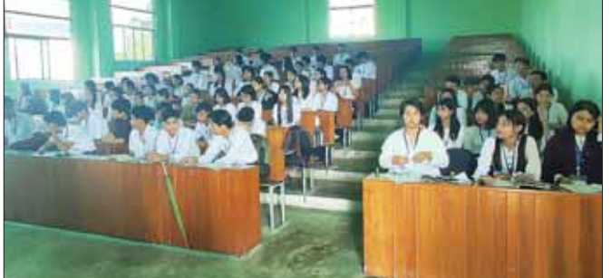
နည်းပညာတက္ကသိုလ်(မအူပင်)၌ ၂၀၂၃-၂၀၂၄ ပညာသင်နှစ် အင်ဂျင်နီယာဘွဲ့ကြိုသင်တန်းများကို နိုဝင်ဘာ ၂၃ ရက်က ဖွင့်လှစ်သင်ကြားပေးရာ ကျောင်းသား ကျောင်းသူများ သင်ယူနေစဉ်။