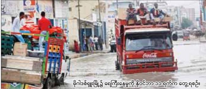
မိုဂါဒစ်ရှူးမြို့၌ ရေကြီးနေမှုကို နိုဝင်ဘာ ၁၁ ရက်က တွေ့ရစဉ်။

မိုဂါဒစ်ရှူး နိုဝင်ဘာ ၁၇ ဆိုမာလီယာနိုင်ငံတွင် အောက်တို ဘာလအစောပိုင်းမှ စတင်ကာ မိုးသည်းထန်စွာ ရွာသွန်းပြီး ရေကြီးမှုကြောင့် လူ ၅၀ ထက်မနည်း သေဆုံးလျက် ရှိသည်။ ဆိုမာလီယာနိုင်ငံသား သန်းထက်ဝက်ကျော်မှာလည်း နေရာပြောင်းရွှေ့ ခဲ့ကြောင်း နိုင်ငံ၏ အမျိုးသားဘေးအန္တရာယ် ဆိုင်ရာအေဂျင်စီက ပြောကြား သည်။ မိုးသည်းထန်စွာရွာသွန်းမှုမှ ငါးရက်ကြာပြီး မြေပြိုမှုများနှင့် ရုတ်တရက် ရေကြီးမှုတို့ဖြစ်ပေါ်