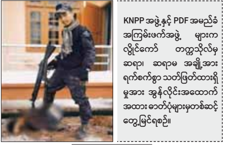
KNPP အဖွဲ့နှင့် PDF အမည်ခံ အကြမ်းဖက်အဖွဲ့ များက လွိုင်ကော် တက္ကသိုလ်မှ ဆရာ၊ ဆရာမ အချို့အား ရက်စက်စွာ သတ်ဖြတ်ထားရှိ မှုအား အွန်လိုင်းအထောက် အထား ဓာတ်ပုံများမှတစ်ဆင့် တွေ့မြင်ရစဉ်။