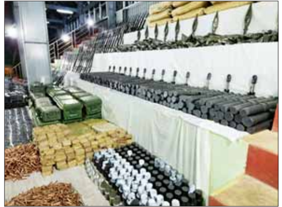
ကယားပြည်နယ်အတွင်း အဖျက်အမှောင်လုပ်ရပ်များနှင့် အကြမ်းဖက်လုပ်ရပ်များကို ကျူးလွန်လျက်ရှိသည့် KNPP အဖွဲ့နှင့် PDF အမည်ခံ အကြမ်းဖက်သမားများ ထံသို့ ပို့ဆောင်မည့် လက်နက်ခဲယမ်းများ။