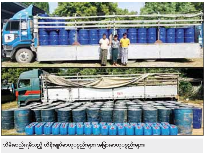
သိမ်းဆည်းရမိသည့် ထိန်းချုပ်ဓာတုပစ္စည်းများ၊ အခြားဓာတုပစ္စည်းများ။