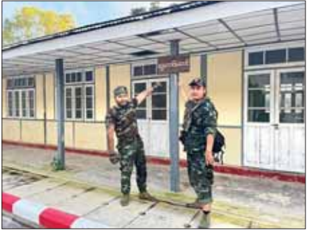
KNPP အဖွဲ့နှင့် PDF အမည်ခံအကြမ်းဖက်အဖွဲ့များက စစ်ရေး ပစ်မှတ်မဟုတ်သည့် လွိုင်ကော်တက္ကသိုလ်အတွင်း စီးနင်း ဝင်ရောက်မှုအား အွန်လိုင်းအထောက်အထား ဓာတ်ပုံများမှ တစ်ဆင့် တွေ့မြင်ရစဉ်။