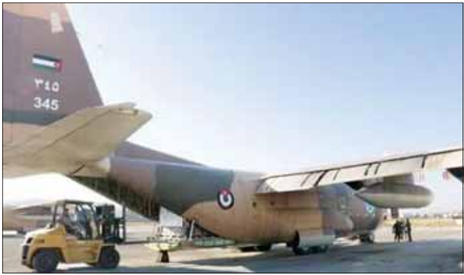
ဆေးဘက်ဆိုင်ရာ ထောက်ပံ့ရေးပစ္စည်းများ တင်ဆောင်လာသည့်လေယာဉ်ကို တွေ့ရစဉ်။