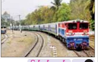
ပြည်တွင်းသတင်း စာ ၁၅

ပို့ဆောင်ရေးနှင့်ဆက်သွယ်ရေးဝန်ကြီး ဌာန၊ မြန်မာ့မီးရထားမှ တန်ဆောင်တိုင် ရုံးပိတ်ရက် ကာလအတွင်း ခရီးသွား မိဘပြည်သူများ၊ ဌာနဆိုင်ရာဝန်ထမ်း များနှင့် မိသားစုများ အဆင်ပြေစွာ ခရီးသွားလာနိုင်ရန်အတွက် အထူးရထား ခရီးစဉ်များ ပြေးဆွဲပေးသွားမည်