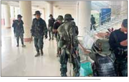
KNPP အဖွဲ့နှင့် PDF အမည်ခံအကြမ်းဖက်အဖွဲ့များက လွိုင်ကော် တက္ကသိုလ်မှ ဆရာ၊ ဆရာမများ၊ ပညာရေးဝန်ထမ်းများနှင့် ကျောင်းသား၊ ကျောင်းသူများအား အတင်းအဓမ္မ ဖမ်းဆီးခေါ်ဆောင် သွားမှုအား အွန်လိုင်းအထောက်အထား ဓာတ်ပုံများမှတစ်ဆင့် တွေ့မြင်ရစဉ်။