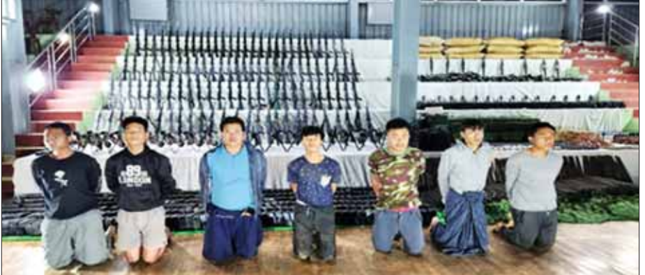
ကယားပြည်နယ်အတွင်း အဖျက်အမှောင်လုပ်ရပ်များနှင့် အကြမ်းဖက်လုပ်ရပ်များကို ကျူးလွန်လျက်ရှိသည့် KNPP အဖွဲ့နှင့် PDF အမည်ခံ အကြမ်းဖက်သမားများထံသို့ လက်နက်၊ ခဲယမ်းများပို့ဆောင်မည့် တရားခံများအား လက်နက်ခဲယမ်းများနှင့်အတူ တွေ့ရစဉ်။