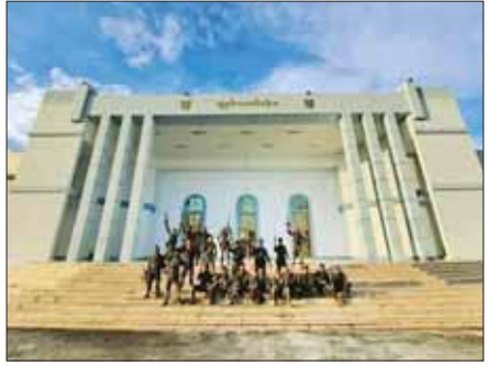
KNPP အဖွဲ့နှင့် PDF အမည်ခံအကြမ်းဖက်အဖွဲ့များက စစ်ရေး ပစ်မှတ်မဟုတ်သည့် လွိုင်ကော်တက္ကသိုလ်အတွင်း စီးနင်း ဝင်ရောက်မှုအား အွန်လိုင်းအထောက်အထား ဓာတ်ပုံများမှ တစ်ဆင့် တွေ့မြင်ရစဉ်။

နိုင်ငံတော်စီမံအုပ်ချုပ်ရေးကောင်စီ သတင်းထုတ်ပြန်ရေးအဖွဲ့