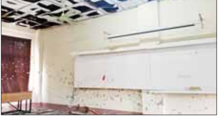
KNPP အဖွဲ့နှင့် PDF အမည်ခံအကြမ်းဖက်အဖွဲ့များက စစ်ရေး ပစ်မှတ်မဟုတ်သည့် လွိုင်ကော်တက္ကသိုလ်အတွင်း စီးနင်း ဝင်ရောက်တိုက်ခိုက်မှုကြောင့် ပညာရေးဆိုင်ရာ အဆောက်အဦများ ပျက်စီးဆုံးရှုံးမှုများအား အွန်လိုင်းအထောက်အထား ဓာတ်ပုံ များမှတစ်ဆင့် တွေ့မြင်ရစဉ်။