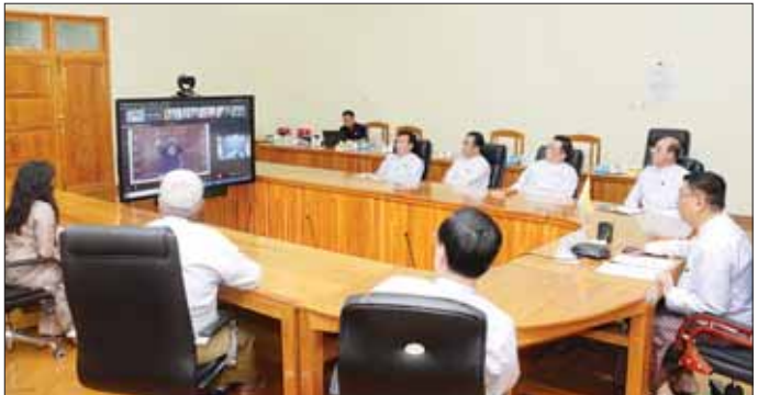
အဆိုပါ ထိပ်သီးဆွေးနွေးပွဲသို့ နိုဝင်ပေါင်း ၁၅ နိုင်ငံမှ ပညာရေးဝန်ကြီးများ၊ ဒုတိယဝန်ကြီးများ တက်ရောက်ကြပြီး ပညာရေးဖွံ့ဖြိုးတိုးတက်ရေးအတွက် စီမံခန့်ခွဲမှုများ၊ အတွေ့အကြုံများကို တင်ပြဆွေးနွေးကာ အမြင်ချင်းဖလှယ်ခဲ့ကြပြီး အိန္ဒိယနိုင်ငံ ပညာရေးဝန်ကြီးက နိဂုံးချုပ် အမှာစကားပြောကြားကာ ထိပ်သီးဆွေးနွေးပွဲကို အောင်မြင်စွာ ရုပ်သိမ်းလိုက်ကြောင်း သတင်းရရှိသည်။ သတင်းစဉ်

စီမံခန့်ခွဲရေး ဝန်ထမ်းများအား ပို့ချခဲ့ပါကြောင်း၊ နှစ်နိုင်ငံပူးပေါင်းဆောင်ရွက်ရေး ဖြင့်တင်ရန်အတွက် မြန်မာနိုင်ငံရှိ တက္ကသိုလ်များနှင့် အိန္ဒိယနိုင်ငံရှိ တက္ကသိုလ်များအကြား MoU ရေးထိုး၍ သုတေသနလုပ်ငန်းများ ပူးပေါင်းဆောင်ရွက်ရန်သဘောတူညီချက်ကို ပူးပေါင်းဆောင်ရွက်ပေးလည်း စေလွှတ်လျက်ရှိပါကြောင်း၊ ယခုကျင်းပသော ထိပ်သီးအစည်းအဝေးမှ ရရှိသော အဖိုးတန် ဆွေးနွေးချက်များကို ဒေသတွင်း ပူးပေါင်းဆောင်ရွက်မှုမှတစ်ဆင့် ရေရှည်တည်တံ့ခိုင်မြဲသော ဖွံ့ဖြိုးတိုးတက်ရေးဆီသို့ ရောက်ရှိနိုင်မည်ဟု အခိုင်အမာယုံကြည်ကြောင်း ပြောကြားသည်။