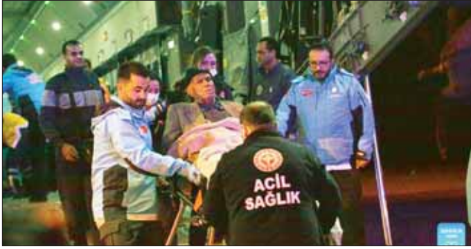
ပစ္စည်းများ ပေးပို့ခဲ့သည်ဟု သည်ဟု ၎င်းက နိုဝင်ဘာ ၁၅ ၁၂၀၀ သေဆုံးခဲ့ရသည်။ ၎င်းတို့ထဲမှ အများစုမှာ အောက်တိုဘာ ၇ ရက် ဟားမားစ်တို့၏ တိုက်ခိုက်မှုကြောင့် သေဆုံးခဲ့ခြင်း ဖြစ်သည်။ ဆင်ဟွာ

အန်ကာရာ နိုဝင်ဘာ ၁၆ ဂါဇာဒေသမှ လူနာ ၂၇ ဦးနှင့် ၎င်းတို့ကို ပြုစုစောင့်ရှောက်ပေးမည့်သူ ၁၃ ဦးတို့သည် ရာဇာနယ်စပ်တိုက်ကို ဖြတ်ကျော်ကာ အီဂျစ်နိုင်ငံမှတစ်ဆင့် တူကီယိုနိုင်ငံသို့ နိုဝင်ဘာ ၁၆ ရက်တွင် ရောက်ရှိလာပြီဖြစ်သည်။ အဆိုပါ လူနာ ၂၇ ဦးမှာ ဂါဇာမှဖြစ်ပြီး အများစုမှာ ကုသမှုအရေးပေါ် လိုအပ်နေသည့် ကင်ဆာရောဂါသည်များ ဖြစ်ကြသည်ဟု တူကီယိုနိုင်ငံ ကျန်းမာရေးဝန်ကြီး ဖာရီတင် ကိုကာ အန်ကာရာသေဆိပ်တွင် သတင်းထောက်များကို ပြောသည်။ တူကီယိုနိုင်ငံသည် ဂါဇာဒေသသို့ ဆေးပစ္စည်းများ အပါအဝင် အခြားသောထောက်ပံ့ရေး