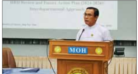
အလုပ်ရုံဆွေးနွေးပွဲတွင် ဒုတိယဝန်ကြီး ပါမောက္ခ ဒေါက်တာ အေးထွန်း အမှာစကားပြောကြားစဉ်။