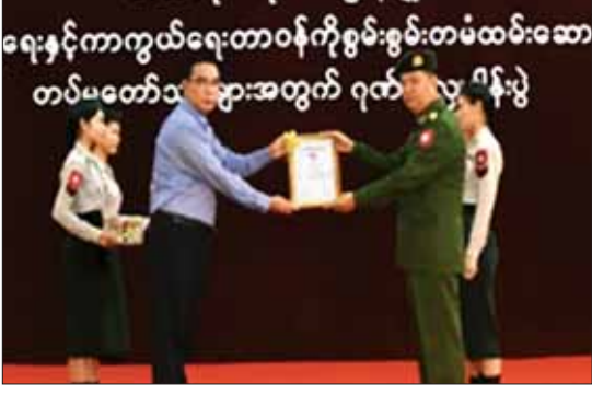
ရေနှင့်ကာကွယ်ရေးတာဝန်ကို စွမ်းစွမ်းတမ်းဆောင်လျက်ရှိသော လုံခြုံရေးတပ်ဖွဲ့ဝင်များအတွက် ဂုဏ်ပြုချီးမြှင့်ငွေများ ပေးအပ်ခြင်းပေးအပ်ကာ စုစုပေါင်းငွေကျပ် ၁၈၃၅ သိန်း ၅ သောင်း ကျော်ပေးအပ်ခြင်းဖြစ်ကြောင်း သတင်းရရှိသည်။

ထိုသို့ ပေးအပ်လျက်ရှိရာ ယနေ့တွင် လုံခြုံရေးတပ်ဖွဲ့ဝင်များအတွက် ဂုဏ်ပြုပေးအပ်ခြင်းအစဉ်အဖြစ် တောင်ပိုင်းဒေသနှင့် ပဲခူးတိုင်းဒေသကြီးအစိုးရအဖွဲ့နှင့် ဌာနဆိုင်ရာ ဝန်ထမ်းများ၊ စေတနာရှင် အလှူရှင်များက အရှေ့မြောက်တိုင်းစစ်ဌာနချုပ်နယ်မြေအတွင်း နိုင်ငံတော်ကာကွယ်ရေးနှင့် လုံခြုံရေးတာဝန်များကို စွမ်းစွမ်းတမ်းဆောင်လျက်ရှိသော ရှင် အလှူရှင်များ တက်ရောက်ကြသည်။