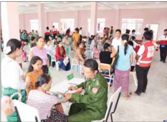
တပ်မတော် ပင်လယ်သွားဆေးရုံရေယာဉ်(သံလွင်)မှ နယ်လှည့်အထူးကုဆေးအဖွဲ့ ကျန်းမာရေးစောင့်ရှောက်မှုလုပ်ငန်းများ ဆောင်ရွက်ပေးစဉ်။

ကမ်းရိုးတန်းဒေသတစ်လျှောက်ရှိ ဒေသခံပြည်သူများအား ကျန်းမာရေးစောင့်ရှောက်မှုလုပ်ငန်းများ ဆောင်ရွက်ပေးရန်အတွက် တပ်မတော်ပင်လယ်သွားဆေးရုံရေယာဉ်(သံလွင်)နှင့်အတူ လိုက်ပါလာသည့်တပ်မတော်မှ ပါရဂူများ၊ ဆေးမှူးများ၊ သူနာပြုများနှင့် ကျန်းမာရေးဝန်ကြီးဌာနမှ ပါရဂူများ၊ ဆရာဝန်များ၊ သူနာပြုများပါဝင်သော နယ်လှည့်အထူးကုဆေးအဖွဲ့သည် ယနေ့တွင် ရခိုင်ပြည်နယ်ကျောက်ဖြူမြို့ခရိုင် ကျောက်ဖြူမြို့သို့ ရောက်ရှိကြရာ ဌာနဆိုင်ရာတာဝန်ရှိသူများ၊ ရပ်မိရပ်ဖများ၊ ဆရာ ဆရာမများ