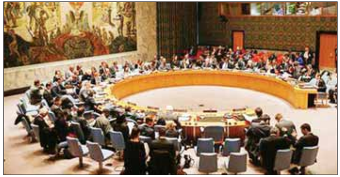
ဖြစ်ရပ်များပျံ့နှံ့လာခြင်းကို ကာကွယ်ရန်အတွက် အကောင်အထည်ဖော်ဆောင်ရွက်ရန် ကူညီသွားယခုလိုမျိုးလုပ်ငန်းစဉ်များတွင် ဆက်လက်ပါဝင်သွား မည်ဖြစ်သည်။ မည်ဖြစ်ကြောင်းနှင့် ငြိမ်းချမ်းရေးနှင့် တည်ငြိမ်ရေးကို အင်န်အိတ်ချ်ကေ

အလွန်စိုးရိမ်ပူပန်ကြောင်း ဖော်ပြထားသည်။ ဂျပန်၊ ပြင်သစ်၊ တရုတ်နိုင်ငံများပါဝင်သော အဖွဲ့ဝင် ၁၂ ဦးက ထောက်ခံပေးခဲ့ကြပြီး အမေရိကန် ပြည်ထောင်စု၊ ဗြိတိန်နှင့် ရုရှားနိုင်ငံတို့က ကြားနေခဲ့ကြသည်။ ကလေးများ၏လူသားချင်းစာနာထောက်ထားမှုအခြေအနေများ တိုးတက်ရေးကို ဦးတည်သည့် နောက်ဆုံးဥပဒေကြမ်းက နိုင်ငံများအကြား ညှိနှိုင်းဆောင်ရွက်မှုကို ဖြစ်စေခဲ့သည်။ ဂါဇာတွင် ကလေးငယ်ပေါင်း ၄၆၀၀ ကျော်သေဆုံးခဲ့ပြီးဖြစ်သည်။ ဂျပန်နိုင်ငံ၏ကုလသမဂ္ဂသမ္မတကြီး အိရှိကာနီ ကီမီဟိရိုက ထွက်ပေါ်လာသော ရလဒ်ကို ကြိုဆိုခဲ့ပြီး ကုလသမဂ္ဂလုံခြုံရေးကောင်စီသည် နောက်ဆုံးတွင် ဆောင်ရွက်နိုင်ခဲ့ပြီဟုလည်း ပြောကြားခဲ့သည်။ ကုလသမဂ္ဂလုံခြုံရေးကောင်စီသည် အကြမ်းဖက်