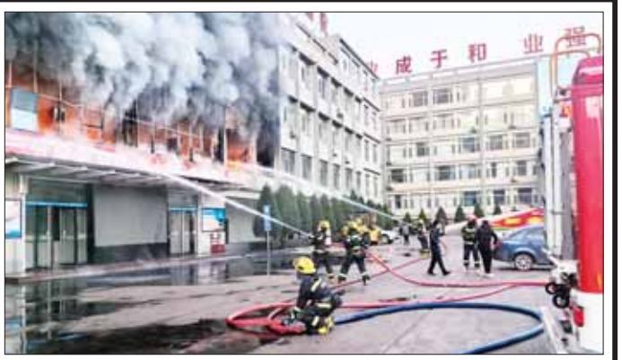
မီးငြိမ်းသတ်နိုင်ရေးကြိုးပမ်းနေကြသည့် မီးသတ်သမားများကို တွေ့ရစဉ်။

ခြင်းဖြစ်ပြီး လုပ်ငန်းများ ဆောင်ရွက်လျက်ရှိ သည်ဟု ဒေသခံအာဏာပိုင်များ က ပြောသည်။ အဆိုပါ အဆောက်အအုံ ဆေးကုသမှုများ ခံယူရန် မှာ ယုံကျီပုဂ္ဂလိကကုမ္ပဏီပိုင် အဆောက်အအုံဖြစ်သည်။ ဆင်ဟွာ