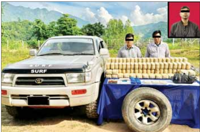
သိမ်းဆည်းရမိသည့် စိတ်ကြွေးသွပ်ဆေးပြားများနှင့်အတူ တွေ့ရစဉ်။

နေပြည်တော် နိုဝင်ဘာ ၁၆ ရှမ်းပြည်နယ် (တောင်ပိုင်း) ပင်လောင်းမြို့နယ်တွင် ငွေကျပ်သိန်း ၅၀၀၀ တန်ဖိုးရှိ စိတ်ကြွေးသွပ်ဆေးပြား ၁၀ သိန်း ဖမ်းဆီးရမိခဲ့ကြောင်း မြန်မာနိုင်ငံရဲတပ်ဖွဲ့မှ သိရသည်။