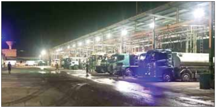
ရန်ကုန်သီလဝါဆိပ်ကမ်းရှိ စက်သုံးဆီ Terminal များတွင် ဆီတင်ယာဉ် Bowser များ ဆီဖြည့်စဉ်။

နိုင်ငံ တစ်ဝန်းရှိ စက်သုံး ဆီ အရောင်းဆိုင်အားလုံး တွင် စက်သုံးဆီ လာရောက် ဝယ်ယူမှုအခြေအနေမှာ ပိုမို ဖြန့်ဖြူးလျက်ရှိသဖြင့် အတိုင်းဖြစ်ပြီး အများပြည်သူများ မှ စက်သုံးဆီများကို အမျိုးအစား အလိုက် လိုအပ်သလို အဆင်ပြေ ချောမွေ့စွာ ဝယ်ယူ သုံးစွဲလျက်ရှိ ကြောင်း သတင်းရရှိသည်။ သတင်းစဉ်