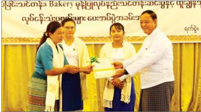
သိန်းကျော်နှင့် ညီမျှသော လုပ်ငန်းသုံးပစ္စည်း စုစုပေါင်း ငွေကျပ် ၆၂ ဒသမ ၅၇၆ သိန်း တန်ဖိုးရှိ လုပ်ငန်းသုံးပစ္စည်းများကို ပေးအပ်သွားမည့်ဖြစ်ပါ ကြောင်း၊ အလားတူ လယ်ဝေးမြို့နယ် ပေါက်မြိုင် ကျေးရွာတွင် ဖွင့်လှစ်သည့် လူသုံးကုန် ထုတ်လုပ်မှု

နေပြည်တော် နိုဝင်ဘာ ၁၆ အသေးစား စက်မှုလက်မှုလုပ်ငန်းဦးစီးဌာနက ကြီးမားဖွင့်လှစ်ခဲ့သည့် ဆပ်ပြာရည်ထုတ်လုပ်ခြင်း သင်တန်း၊ Bakery မုန့်ပြုလုပ်နည်း သင်တန်းဆင်း ပွဲနှင့် ထူးချွန်သူများ လုပ်ငန်းသုံးပစ္စည်းများပေးအပ် ပွဲအခမ်းအနားကို ယနေ့ နံနက်ပိုင်းက ပြည်ထောင်စု နယ်မြေ၊ လယ်ဝေးမြို့၊ သီရိမင်္ဂလာခရိုင်၊ ကျင်းပရာ သမဝါယမနှင့် ကျေးလက်ဖွံ့ဖြိုးရေးဝန်ကြီးဌာန ပြည်ထောင်စုဝန်ကြီးဦးလှစိုး၊ နေပြည်တော်ကောင်စီ ဥက္ကဋ္ဌ ဦးသန်းထွန်းဦး၊ ဒုတိယဝန်ကြီး ဦးမြင့်စိုး နှင့် နေပြည်တော်ကောင်စီအဖွဲ့ဝင်များ၊ အမြဲတမ်း အတွင်းဝန်နှင့် သက်ဆိုင်ရာဌာနများမှ ညွှန်ကြားရေး မှူးချုပ်များ၊ တာဝန်ရှိပုဂ္ဂိုလ်များ၊ စီမံကိန်းကော်မတီ ဝင်များ၊ သင်တန်းသား သင်တန်းသူများနှင့် ရုပ်စိရပ်ဖ များ တက်ရောက်ကြသည်။