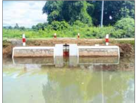
သက်မောင်(ကျောက်ဆည်)

မလိုအပ်သော မီးများကို ပိတ်ထားခြင်းဖြင့် လျှပ်စစ်ကို ချွေတာပါ။ လျှပ်စစ်ကို ချွေတာသုံးစွဲခြင်းဖြင့် မိတာခများများ ကျသင့်ခြင်းမှ ရှောင်ရှားပါ။