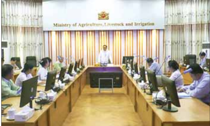
ဒုတိယဝန်ကြီး ဒေါက်တာအောင်ကြီး ပြည်ပဆွေးနွေးပွဲအတွေ့အကြုံများ ပြန်လည်ရှင်းလင်းဆွေးနွေးပွဲတွင် အမှာစကားပြောကြားစဉ်။

ဆွေးနွေးပွဲတွင် ဒုတိယ စီမံကိန်းကော်မတီအစည်းအဝေးဝန်ကြီး ဒေါက်တာအောင်ကြီးနှင့် (၂၅)ကြိမ်မြောက် ASEAN-SEAFDEC မဟာဗျူဟာ မိတ်ဖက်သက်ဆိုင်ရာ တာဝန်ရှိသူများက ငါးလုပ်ငန်း အတိုင်ပင်ခံအဖွဲ့ကဏ္ဍအလိုက် ပြည်ပဆွေးနွေးပွဲအတွေ့အကြုံများကို ရှင်းလင်းတင်ပြကြရာ ဖိလစ်ပိုင်နိုင်ငံတွင် ကျင်းပသည့် အရှေ့တောင်အာရှ ငါးလုပ်ငန်း အထောက်အပံ့ဆိုင်ရာ ဒေသတွင်းအလုပ်ရုံ ဆွေးနွေးပွဲအတွေ့အကြုံများကို လည်းကောင်း၊ ထိုင်းနိုင်ငံတွင် ကျင်းပခဲ့သည့် အာရှပစိဖိတ်နိုင်ငံများရှိ ကမ္ဘာ့တစ်ရပ်ကုန်းမာရေး