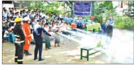
သယ်ဆောင်နည်းများ၊ သဘာဝဘေးအရေးပေါ်အခြေအနေတွင် ကိုယ့်၌ တစ်ပါးတည်းသယ်ယူရမည့် ပစ္စည်း ၁၇ မျိုး စသည်တို့ကို ရှင်းလင်းပြောကြားကာ လေ့ကျင့်မှုများ ဆောင်ရွက်ကြသည်။ တစ်ဦးလွင်

များ၊ မီးသတ်ဆေးဘူးအသုံးပြုနည်းများနှင့် သဘာဝဘေးအန္တရာယ်ဖြစ်ပွားတတ်သည့်အကြောင်းများကို ဟောပြောခဲ့ပြီး ဦးစီးအရာရှိ ဒုတိယဦးစီးမှူးနှင့် မီးငြိမ်းသတ်ကျွမ်းကျင်ဝန်ထမ်းများက ကျောင်းသားကျောင်းသူများအား မီးသတ်ဆေးဘူးလက်တွေ့ ကိုင်တွယ်ပက်ဖျန်းခြင်း၊ မီးလောင်မှုအခြေခံသဘောနှင့်ယှဉ်၍ ဝါးကစားနည်းများ၊ သဘာဝဘေးအန္တရာယ်များ မဖြစ်ပွားမီ ဖြစ်ပွားနေစဉ် ဖြစ်ပွားပြီးနောက် ဆောင်ရွက်ရမည့်နည်းလမ်းများ၊ အိမ်ရှိ ရေသန့်ဘူးများဖြင့် အရေးပေါ် အသက်ကယ်အင်္ကျီပြုလုပ်နည်း၊ အရိုးကျိုးဒဏ်ရာရရှိသူအား အိမ်တွင်ရှိသောပစ္စည်းများဖြင့် ရှေးဦးသူနာပြုစုနည်း၊ စောင့်ဖြင့် လူနာ