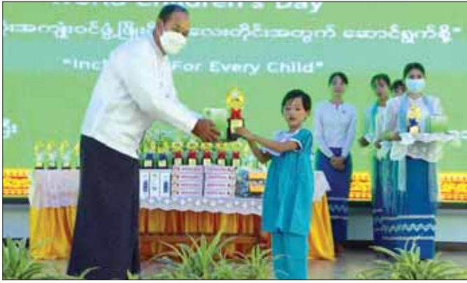
၂၀၂၂ ခုနှစ် နိုဝင်ဘာ ၂၀ ရက်က (၃၃) နှစ်မြောက် ကမ္ဘာ့ကလေးများနေ့အခမ်းအနားတွင် စစ်ကိုင်းတိုင်းဒေသကြီးဝန်ကြီးချုပ် ဦးမြတ်ကျော်က ကလေးငယ်တစ်ဦးအား ဂုဏ်ပြုဆု ချီးမြှင့်စဉ်။

ကလေးများအားလုံးအတွက် အဆိုပါ အခြေခံအခွင့်အရေးများကို ဖြည့်ဆည်းပေးခြင်းဖြင့် ကလေးများသည် ရုပ်ပိုင်းဆိုင်ရာနှင့် စိတ်ပိုင်းဆိုင်ရာ ဖွံ့ဖြိုးတိုးတက်မှုဖြစ်သည်။ ထို့အပြင် ကျန်းမာ၍ ပညာသင်ယူခွင့် ရရှိသော ကလေးများသည် ဆင်းရဲနွမ်းပါးမှု သံသရာကို ကျော်ဖြတ်နိုင်ပြီး ပြည့်စုံသော ဘဝများဆီသို့ လျှောက်လှမ်းနိုင်မည် ဖြစ်သည်။ သို့ဖြစ်၍ ကလေးများအတွက် အဆိုပါအခြေခံအခွင့်အရေးများ ရရှိစေရေး ဆောင်ရွက်ရန်မှာ နိုင်ငံတော်အစိုးရသာမက မိဘများ၊ မိသားစုဝင်များနှင့် ရပ်ရွာလူထုများအားလုံး ပူးပေါင်းပါဝင်ဆောင်ရွက်ရမည် ဖြစ်သည်။ ကလေးသူငယ်များ၏ အခွင့်အရေးများအား အပြည့်အဝဖော်ဆောင်ပေးနိုင်ရေး နှိုးဆော်ပေးရန်အတွက် နှစ်စဉ် နိုဝင်ဘာလ ၂၀ ရက်နေ့ကို ကမ္ဘာ့ကလေးများနေ့အဖြစ် သတ်မှတ်ကာ ကမ္ဘာတစ်ဝန်း ကျင်းပလေ့ ရှိပါသည်။