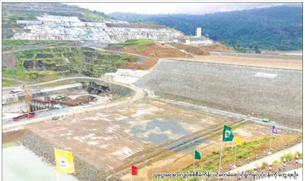
သူဌေးရေအားလျှပ်စစ်စီမံကိန်း ပင်မတပ်ဆောင်ရွက်မှုလုပ်ငန်းကို တွေ့ရစဉ်။