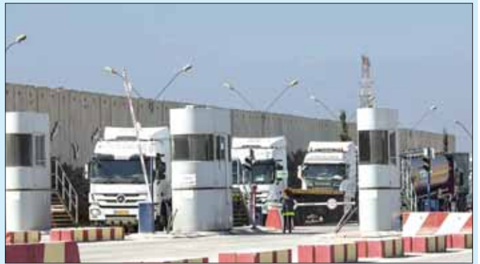
စက်သုံးဆီတင်ကားများ အီဂျစ်မှ ဂါဇာသို့ ပထမဆုံးအကြိမ် ဝင်ရောက်လာသည်ကို တွေ့ရစဉ်။

လာမည်ဟု နိုဝင်ဘာ ၁၅ ရက်တွင် ပါလက်စတိုင်းဘက်၌ လုပ်ငန်းဆောင်တာများ လုပ်ဆောင်နေသည့် အစွဲရေးအဖွဲ့အစည်းက ပြောသည်။ လူသားချင်းစာနာထောက်ထားမှုဆိုင်ရာ ပြဿနာများဖြစ်ပေါ်မှုနှင့်ပတ်သက်၍ အပြည်ပြည်ဆိုင်ရာမှ ဝေဖန်မှုများတိုးလာစဉ် လူမှုကွန်ရက်မီဒီယာပေါ်၌ ယခုလို ကြေညာခဲ့ခြင်းဖြစ်သည်။ ပါလက်စတိုင်းဒုက္ခသည်များဆိုင်ရာ ကုလသမဂ္ဂသက်သာချောင်ချိရေးနှင့် အလုပ်သမားအေဂျင်စီက စက်သုံးဆီ ပေးပို့နိုင်ရေးအတွက် မေတ္တာရပ်ခံခဲ့သည်။ ဟားမားစ်နှင့် ထိပ်တိုက်တွေ့ဆုံမှုအပြီး ပထမဦးဆုံးအကြိမ်အဖြစ် အကန့်အသတ်ဖြင့် စက်သုံးဆီ တင်သွင်းခွင့်ပေးမှု ဖြစ်လာကောင်း ဖြစ်လာနိုင်သည်ဟုလည်း သိရသည်။ အင်နီအိတ်ချ်က