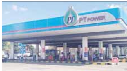
PT POWER (သာကေတ) ဆီဆိုင်။