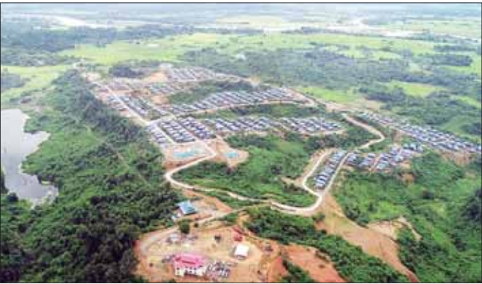
ရေဝပ်ဇရိယာအတွင်း ကျရောက်သည့် ရွှေ့ပြောင်းကျေးရွာများ ပြန်လည်နေရာချထားမှုကို တွေ့ရစဉ်။

ရခိုင်ရိုးမပေါ်မှ အစပြုပြီး ပင်လယ်ဝယ်အထိ မိုင် ၇၀ ခန့်ရှည်လျားစွာ စီးဆင်းနေသော သုဌေးချောင်းပေါ်တွင် ရေးအားလျှပ်စစ်စီမံကိန်းတစ်ခု တည်ဆောက်နိုင်ရန်အတွက် ၂၀၀၃-၂၀၀၄ ခုနှစ်ခန့်က ဂျပန်နိုင်ငံ အခြေစိုက် The Kansai အတိုင်ပင်ခံ အင်ဂျင်နီယာ