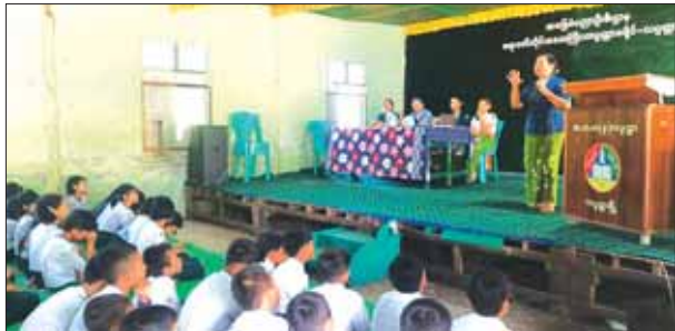
မြို့နယ် (ပြန်/ဆက်)

လပွတ္တာမြို့နယ်တွင် စည်းကမ်းမဲ့အမှိုက် စွန့်ပစ်မှုမရှိစေရေးအတွက် အသိပညာပေး ဟောပြောပွဲများကို မြို့နယ်စည်ပင်သာယာ ရေးအဖွဲ့က ဆက်လက်ဆောင်ရွက်မည်ဖြစ် ကြောင်း သိရသည်။