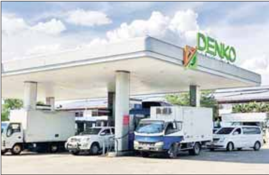
DENKO (အောင်ဆန်း) ဆီဆိုင်။

နေပြည်တော် နိုဝင်ဘာ ၁၅ အများပြည်သူမှစက်သုံးဆီများ အဆင်ပြေလုံလောက်စွာ ဝယ်ယူသုံးစွဲနိုင်ရန်အတွက် ရန်ကုန်မြို့အတွင်းရှိ စက်သုံးဆီအရောင်းဆိုင်များအား စက်သုံးဆီပြတ်လပ်မှု မရှိစေရန် စက်သုံးဆီတင်သွင်း သို့လောင်ဖြန့်ဖြူးခြင်း လုပ်ငန်းကြီးကြပ်ရေးကော်မတီအနေဖြင့် သီလဝါသို့လောင်ကန်စခန်းများမှ စက်သုံးဆီများကို ဆီသယ်ယာဉ်များဖြင့် လုံလောက်စွာ ဖြည့်တင်းဆောင်ရွက်ပေးလျက်ရှိသဖြင့် အများပြည်သူများအနေဖြင့် စက်သုံးဆီ အရောင်းဆိုင်များမှ အဆင်ပြေလွယ်ကူစွာ ဝယ်ယူအသုံးပြုလျက်ရှိပြီး အရောင်းဆိုင်များတွင် တန်းစီစောင့်ဆိုင်းဝယ်ယူရမှု လျော့နည်းသွားပါကြောင်း သတင်းရရှိသည်။