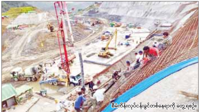
စီမံကိန်းလုပ်ငန်းခွင်တစ်နေရာကို တွေ့ရစဉ်။