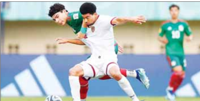
မက္ကဆီကို ယူ-၁၇ နှင့် ဗင်နီဇွဲလား ယူ-၁၇ အသင်းတို့ အကြိတ်အနယ်ယှဉ်ပြိုင်ကစားစဉ်။

အမေရိကန်နှင့် ဘာဂီနာ ဟာဆိုအသင်းပွဲစဉ်တွင် အမေရိကန် အသင်းက နှစ်ဂိုး - တစ်ဂိုးဖြင့် အနိုင်ရရှိခဲ့သည်။ အမေရိကန် အသင်းသည် အုပ်စုအဖွင့်ပွဲစဉ်တွင် စာမျက်နှာ ၁၅ ကော်လံ ၁