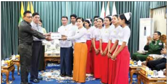
ထောက်ပံ့သည့် ဆန်အိတ် ၁၀၀ နှင့် ငွေကျပ် ၁၀ သင်တန်းသား သင်တန်းသူများက လက်ခံရယူကြသိန်းကို ပေးအပ်ရာ ကျောင်းအုပ်ဆရာမကြီးနှင့် သည်။

စစ်တွေ နိုဝင်ဘာ ၁၅ ရခိုင်ပြည်နယ်အစိုးရအဖွဲ့က သူနာပြုနှင့်သားဖွားသင်တန်းကျောင်းသို့ ဆန်အိတ် ၁၀၀ နှင့် ထောက်ပံ့ငွေများ ပေးအပ်ပွဲကို နိုဝင်ဘာ ၁၄ ရက်က ပြည်နယ်အစိုးရအဖွဲ့ရုံး၊ ပြည်နယ်ဝန်ကြီးချုပ်ဧည့်ခန်း၌ ကျင်းပသည်။ အခမ်းအနားတွင် ပြည်နယ်ဝန်ကြီးချုပ် ဦးထိန်းလင်းက သင်တန်းသား၊ သင်တန်းသူများအနေဖြင့် သင်တန်းကာလအတွင်း သင်တန်းဆရာမများ သင်ကြားပို့ချပေးသည့် သင်ခန်းစာများ၊ ဆရာဝန်ကြီးများ၏ လက်တွေ့သင်ကြား ပို့ချပေးမှုများကို စနစ်တကျလေ့လာမှတ်သားကြပြီး မိမိဒေသ၊ မိမိပြည်နယ်အတွက် အကျိုးပြုနိုင်သော သူနာပြုကောင်းများဖြစ်အောင် ကြိုးစားသင်ယူကြရန် ပြောကြားသည်။ ထို့နောက် သူနာပြုနှင့်သားဖွား သင်တန်းကျောင်း ကျောင်းအုပ်ဆရာမကြီးက သင်တန်း