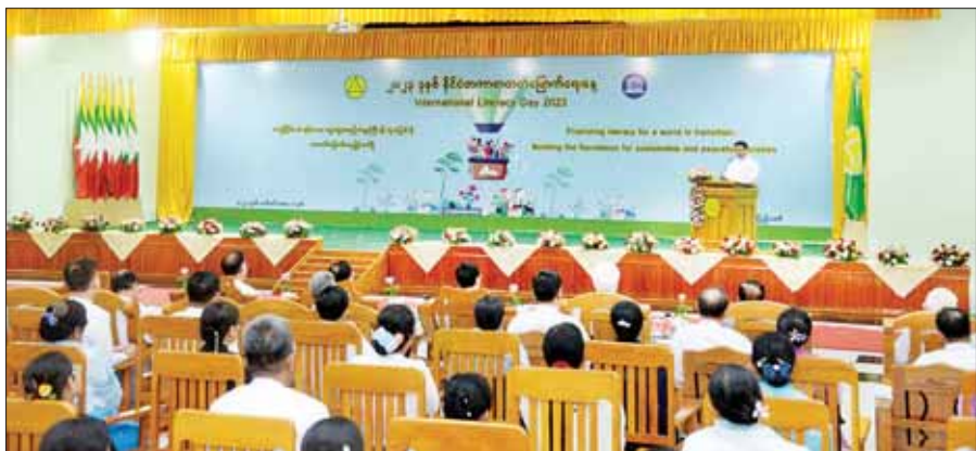
၂၀၂၃ ခုနှစ် နိုင်ငံတကာစာတတ်မြောက်ရေးအခမ်းအနားကို နေပြည်တော်ရှိ ပညာရေးဝန်ကြီးဌာန အစည်းအဝေးခန်းမ၌ စက်တင်ဘာ ၈ ရက်က ကျင်းပစဉ်။

စာတတ်မှ အကောင်းနှင့်အဆိုး၊ အကျိုးနှင့် အပြစ်တို့ကို ခွဲခြား သိမြင်နိုင်မည်။ ဖွံ့ဖြိုးဆဲအချို့ဒေသများတွင် ဆင်းရဲနွမ်းပါးမှု၊ လက်နက်ကိုင်ပဋိပက္ခများနှင့် အခြားသောအခြေအနေများကြောင့်