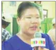
မသင်းယုနိုင်

ပေါ့။ မတတ်နိုင်တာတွေလည်း မရှိတော့ဘူး။ ရောဂါနဲ့ပတ်သက် တဲ့ စမ်းသပ်မှုတွေ ပြုလုပ်ပေး တယ်။ ခွဲစိတ်စရာရှိလည်း ခွဲစိတ် ကုသပေးတယ်။ အကုန်လုံးကောင်း ပါတယ်။ ဘာပဲဖြစ်ဖြစ် အများ အကျိုးအတွက်ကို ဒီဒါယကာကြီး တွေ ဆောင်ရွက်ပေးတယ်။ ဒါယကာ၊ ဒါယိကာမတွေရော၊ ဦးပွင်းတို့ရော မျက်စိနဲ့ပတ်သက် ရင် မျက်စိအကျိုးတရားတွေ၊ နားနဲ့ ပတ်သက်ရင် နားအကျိုးတရား တွေ ကုသမှုခံယူရတဲ့အတွက် အကုန်လုံးအတွက် ဦးပွင်းတို့ သာဓုခေါ်ပါတယ်။