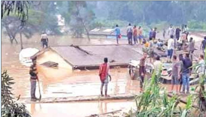
များဖြစ်သော ကင်ညာနှင့် ဆိုမာလီယာနိုင်ငံတို့တွင် များစွာ ရေဘေးဒုက္ခကြုံတွေ့မည်ဟု ခန့်မှန်းအောက်တိုဘာလမှ ဒီဇင်ဘာလအထိ မိုးများ ထားသည်။ သည်းထန်စွာ ရွာသွန်းမည်ဖြစ်ပြီး လူသန်းပေါင်း ဆင်ယူာ

အာဖရိကဦးချီဒေသနိုင်ငံများအဖြစ်တင်စားခေါ်ဝေါ်သော အိသီယိုးပီးယားနှင့် အိမ်နီးချင်းနိုင်ငံ