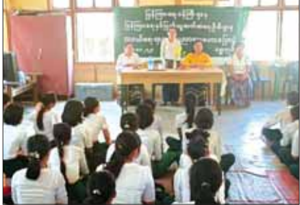
ရွှေကျင်

ကျောင်းသား ကျောင်းသူများ ဗလင်းတန်ဖွဲ့ဖြိုးတိုးတက်စေရန်၊ စာပေဟုသုတများတိုးပွားပြီး ပြင်ပဟုသုတများ စုံလင်စွာ ရရှိစေရန်၊ ပရိသတ်ရှေ့တွင် ပြောဆိုရသည့်သတ္တိများ ရှိလာစေရန်အတွက် လူငယ်စကားပိုင်းနှင့် လူငယ်ရေးရာ အသိပညာပေး ဟောပြောပွဲများကို အခြေခံပညာဦးစီးဌာန၊ ပြန်ကြားရေးနှင့်ပြည်သူ့ဆက်ဆံရေးဦးစီးဌာနနှင့် အခြားဌာနဆိုင်ရာများ ပူးပေါင်းပြီး မြို့နယ်အသီးသီး၌ ကျင်းပပေးလျက်ရှိသည်။