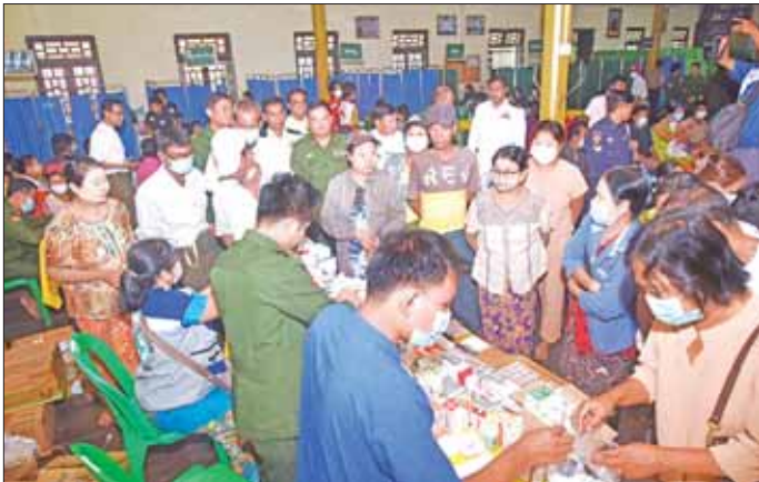
တပ်မတော်မြစ်တွင်းသွားဆေးရုံ ရေယာဉ်(ရွှေပုဇွန်)နှင့် မြစ်ရေယာဉ်(စကု)တို့မှ နယ်လှည့်အထူးကုဆေးအဖွဲ့က ပြည်မြို့ရှိ ဒေသခံပြည်သူများအား ကျန်းမာရေးစောင့်ရှောက်မှုလုပ်ငန်းများ ဆောင်ရွက်ပေးစဉ်။

ဧရာဝတီမြစ်ကြောင်း တစ်လျှောက်ရှိ ဒေသခံပြည်သူများအား ကျန်းမာရေး စောင့်ရှောက်မှု လုပ်ငန်းများ ဆောင်ရွက်ပေးရန် အတွက် တပ်မတော်မြစ်တွင်းသွားဆေးရုံ ရေယာဉ်(ရွှေပုဇွန်)၊ မြစ်ရေယာဉ်(စကု)တို့နှင့်အတူ လိုက်ပါလာသည့် တပ်မတော်မှ ပါရဂူများ၊ ဆေးမှူးများ၊ သူနာပြုများနှင့် ကျန်းမာရေးဝန်ကြီးဌာနမှ ပါရဂူများ၊ ဆရာဝန်များ၊ သူနာပြုများ ပါဝင်သော နယ်လှည့်အထူးကုဆေးအဖွဲ့သည် ယနေ့တွင် ပြည်မြို့၊ ဝိသုခရိတရာဏသီကျောင်းတိုက်၌ အခြေပြု၍ ပြည်မြို့ရှိ မြို့ပေါ် ရပ်ကွက်များနှင့် ပတ်ဝန်းကျင် ကျေးရွာများမှ ဒေသခံပြည်သူများအား ကျန်းမာရေးစောင့်ရှောက်မှု လုပ်ငန်းများ ဆောင်ရွက်ပေးသည်။