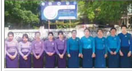
ပဲခူးတိုင်းဒေသကြီး ပေါင်းတည်မြို့နယ် အထွေထွေအုပ်ချုပ်ရေး ဦးစီးဌာနမှ ရှေ့၌ မြို့နယ်မိခင်နှင့် ကလေးစောကရောက်ရေးအသင်း နှင့် အမျိုးသမီးရေးရာအဖွဲ့တို့က ပဋိပက္ခဖြစ်စဉ် လက်နက်ကိုင် ပဋိပက္ခဖြစ်စဉ်များအတွင်း လိင်ပိုင်းဆိုင်ရာနှင့် အခြားအကြမ်းဖက်မှု များကို တိုင်ကြားနိုင်ကြောင်း ပြည်သူများသိရှိနိုင်စေရန် အသိပေး ပို့စတာကို နိုဝင်ဘာ ၁၄ ရက်က စိုက်ထူစဉ်။ သူရဲကြီး (ပြန်/ဆက်)