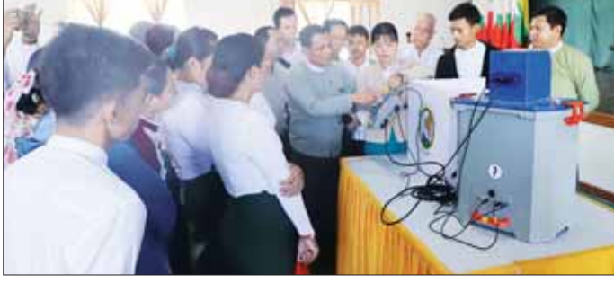
များက ရှင်းလင်းဆွေးနွေးခဲ့ကြ ပြီး မဲဆန္ဒရှင်ပြည်သူများက လက်တွေ့ စမ်းသပ်မဲပေးခဲ့ကြရာ မဲပေးစက်၏ ထိန်းချုပ်စက် (Control Unit) ကို မဲဆန္ဒရှင်များ ကိုယ်တိုင် ကိုင်တွယ်ဆောင်ရွက် ခြင်း၊ မဲပေးစက်မှ ထုတ်ပေးသည့် မဲလက်မှတ်များနှင့် မဲပုံးအတွင်းရှိ မဲလက်မှတ်များကို တိုက်ဆိုင် စစ်ဆေး၍ မဲရလဒ် မှန် မမှန် စိစစ်ခြင်းတို့ကို စနစ်တကျ ဆောင်ရွက်ခဲ့ကြသည်။

ပြည်ထောင်စု ရွေးကောက်ပွဲ ကော်မရှင်က မဲဆန္ဒရှင်ပြည်သူ များနှင့်တွေ့ဆုံ၍ မြန်မာအိလက် ထရောနစ်မဲပေးစက် (MEVM) နှင့် စပ်လျဉ်းပြီး ရှင်းလင်းပြသခြင်းနှင့် လက်တွေ့သရုပ်ပြ စမ်းသပ်မဲပေး ခြင်းများကို ယနေ့တွင် ပထမနေ့ အဖြစ် ဒက္ခိဏသီရိမြို့နယ်၌ ဒက္ခိဏသီရိမြို့နယ် အထွေထွေ အုပ်ချုပ်ရေးဦးစီးဌာန အစည်း အဝေးခန်းမတွင် ဆောင်ရွက် သည်။ (ယာပုံ)