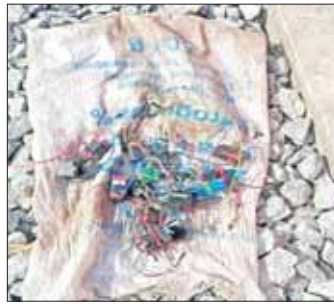
ဒိုက်ဦး-ပြန်တန်ဆာဘူတာအကြား တံတားအမှတ်(၁၁၆/A) ကို မိုင်းထောင်ဖောက်ခွဲရန် တပ်ဆင်ထားသော ယမ်းကြိုး၊ ဆက်စပ်ပစ္စည်းများနှင့် ယမ်းများ ထည့်သွင်းထားသည့် ပလတ်စတစ်ပုံး ခုနှစ်ပုံးတွေ့ရှိရမှု။

သို့ နယ်မြေဒေသမှ တာဝန်ရှိသူများ နယ်မြေခံ လုံခြုံရေးတပ်ဖွဲ့ဝင်တို့က အချိန်နှင့်တစ်ပြေးညီ နယ်မြေရှင်းလင်း စစ်ဆေးခြင်း၊ မြန်မာ့မီးရထား ဝန်ထမ်းများက လည်း ပျက်စီးသွားသောရထားလမ်းအား ပြန်လည်မွမ်းမံပြုပြင်ခြင်းတို့ကို ဆောင်ရွက်ခဲ့ပြီး ရထားသွားလာမှုကို ထိခိုက်မှုမရှိသော အစုန်လမ်းမှ ဆက်လက်စေလွှတ်ပေးခဲ့ပြီးဖြစ်ကြောင်း သိရသည်။