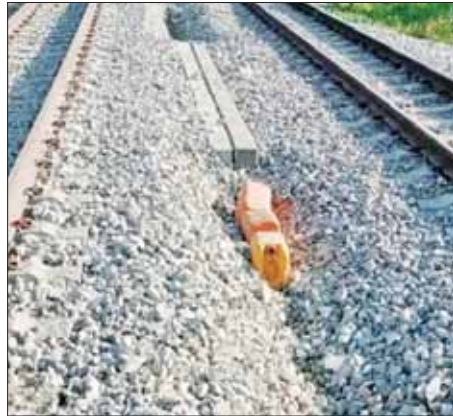
ဒိုက်ဦး-ပြန်တန်ဆာဘူတာအကြား တံတားအမှတ်(၁၁၆/A)အပေါ် ရထားသလမ်း နှစ်ခုအကြားတွဲ တွေ့ရှိရသည့် မိုင်းထောင်ထားရှိမှု။