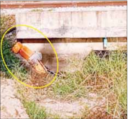
ဒိုက်ဦး - ပြန်တန်ဆာဘူတာအကြား တံတားအမှတ် (၁၁၆/A) ကို ဖောက်ခွဲဖျက်ဆီး၍ မိုင်းထောင်ထားမှု။

စက်ခေါင်း၊ တွဲများနှင့်ခရီးသည်များ၊ ကုန်စည်များထိခိုက်ပျက်စီးစေရေး၊ ပြည်သူများ အသက်အန္တရာယ်ထိခိုက်ပြီး စိတ်မချမ်းမြေ့စေရေး ရထားဖြင့်ခရီးသွားလာမှုမပြုရအောင် ခြိမ်းခြောက်ခြင်းတို့အပြင် ရန်ကုန်-မန္တလေး ရထားလမ်းအဆင့်မြှင့်တင်ရေး စီမံကိန်းလုပ်ငန်းများ အချိန်ပိုမိုကြန့်ကြာစေရေးတို့အတွက် ယုတ်မာပက်စက်သော ရည်ရွယ်ချက်များဖြင့် အကြိမ်ကြိမ် ကျူးလွန်နေကြသောကြောင့် အဆိုပါ အကြမ်းဖက်သောင်းကျန်းသူများ၏ ယုတ်မာပက်စက်မှုများအပေါ် ဒေသခံပြည်သူတစ်ရပ်လုံးက ပြင်းထန်စွာ ဆန့်ကျင်ကန့်ကွက်ရုတ်ချ လျက်ရှိကြောင်း သတင်းရရှိသည်။