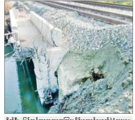
ဒိုက်ဦး - ပြန်တန်ဆာဘူတာအကြား မိုင်းထောင်ဖောက်ခွဲထားရမှုကြောင့် တံတားအမှတ်(၁၁၆/A)၏ WING WALL ကွန်ကရစ်ခွဲ ထိခိုက်ပျက်စီးမှု။

* ကျောမိုးမှ မြန်မာ့လက်ရွေးစင်အသင်း နည်းပြချုပ် ဖိုက်အွန်ဘိုင်နာသည် ဂျပန်အသင်းနှင့်ပွဲအတွက် ကစားသမား ၂၄ ဦး ခေါ်ဆောင်သွားပြီး အမာခံကစားသမား အများစု ရွေးချယ်ခံခဲ့ရသည်။ မြန်မာ့လက်ရွေးစင်အသင်းသည် နိုဝင်ဘာ ၁၄ ရက် ညပိုင်းတွင် စတင်လေ့ကျင့်ခဲ့ပြီး ဂျပန်အသင်းနှင့်ပွဲမတိုင်မီ ဂျပန်နိုင်ငံ၌ ပြင်ဆင်ချိန် နှစ်ရက်ရရှိမည်ဖြစ်သည်။ မြန်မာ့လက်ရွေးစင်အသင်းနှင့် ဂျပန်လက်ရွေးစင်အသင်းသည် နိုဝင်ဘာ ၁၆ ရက်တွင်