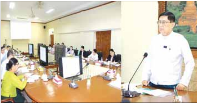
သွင်းကုန်အစားထိုးရန်နှင့် ပို့ကုန် ဖြင့်တင်ရေး၊ ဒေသထွက် ကုန်ကြမ်းများကို အခြေခံသည့် အသေးစား၊ အလတ်စားနှင့် အလတ်စား စီးပွားရေးလုပ်ငန်း များ(MSMEs)ကိုအားပေးကူညီပြီး နိုင်ငံတော်အတွက် လိုအပ်သည့် ထုတ်ကုန်များ ထုတ်လုပ်နိုင်သည့် MSME လုပ်ငန်းများသို့ ဆက်လက် ထုတ်ချေးနိုင်ရေး ဆောင်ရွက်ရ မည် ဖြစ်ပါကြောင်း၊ ထို့ကြောင့် Working Committee အဖွဲ့ဝင် များအနေဖြင့် နိုင်ငံတော်မှ ချမှတ် ထားသည့် မူဝါဒများနှင့် ညီညွတ် အကျိုးဝင်သည့် SME လုပ်ငန်းများ သို့ အတိုးနှုန်းသက်သာသည့် ချေးငွေများ ထုတ်ချေးနိုင်ရေး အတွက် ပိုင်းဝန်းဆွေးနွေးကြရန် ဖြစ်ကြောင်း ပြောကြားသည်။ ပိုင်းဝန်းအကြံပြုဆွေးနွေး ထိုနောက် ယခင်အစည်း

SME နှစ်ဆင့်ချေးငွေစီမံကိန်း အသေးစားနှင့် အလတ်စား စီးပွားရေး လုပ်ငန်းများ ဘဏ်ချေးငွေရရှိရေးလုပ်ငန်းအဖွဲ့ (Working Committee) အစည်းအဝေး အမှတ်စဉ်(၂/၂၀၂၃)ကို ယနေ့တွင် စီမံကိန်းနှင့်ဘဏ္ဍာရေးဝန်ကြီးဌာန၌ ကျင်းပသည်။