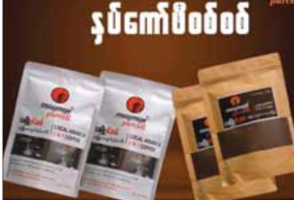
ကော်ဖီစေ့များ လှော်နေပုံနှင့် မေမြို့ပါဆယ် ကော်ဖီကုန်ချောများ။