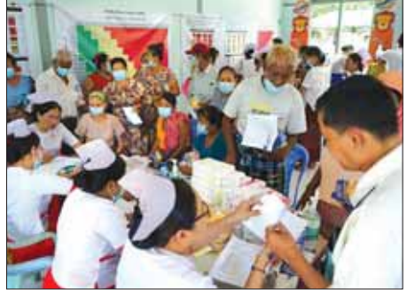
ခရိုင်(ပြန်/ဆက်)

အခမ်းအနားတွင် ခရိုင်ပြည်သူ့ဆေးရုံကြီးမှ အထွေထွေရောဂါကုသမားတော် ဦးဆောင်သည့် ကျန်းမာရေးဝန်ထမ်းများက ပြည်သူများအား ဆီးချို သွေးချိုရောဂါ အခမဲ့စစ်ဆေးကုသပေးခြင်းကို ဆောင်ရွက်ပေးခဲ့ကြပြီး ကြက်ခြေနီသူနာပြုတပ်ဖွဲ့ဝင်များ၊ လူမှုကူညီရေးပရဟိတအဖွဲ့ဝင်များက ကူညီဆောင်ရွက်ပေးကြောင်း သိရသည်။