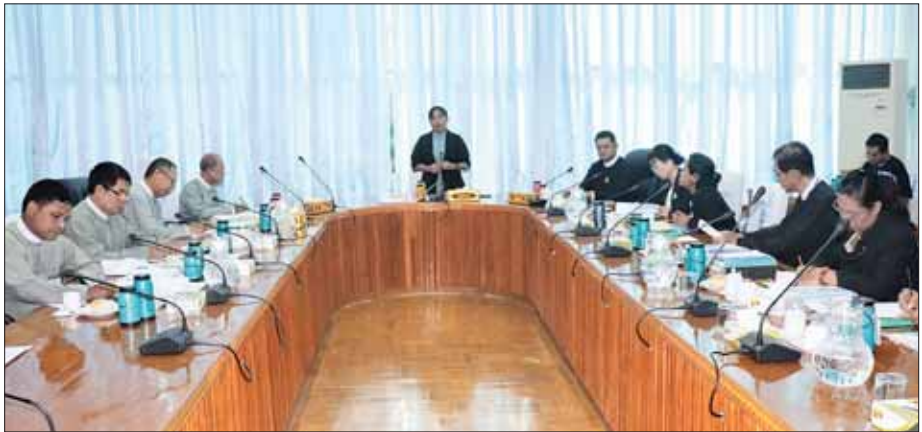
လွှတ်တော် ၃ ရပ်ဆိုင်းရာ ရွေးကောက်ပွဲဥပဒေ(မူကြမ်း)များနှင့် စပ်လျဉ်းသည့် ညှိနှိုင်းအစည်းအဝေးကျင်းပစဉ်။

အစည်းအဝေးတွင် နိုင်ငံတော်စီမံအုပ်ချုပ်ရေးကောင်စီ၏ လမ်းညွှန်ချက်နှင့်အညီ လွှတ်တော် ၃ ရပ်ဆိုင်းရာ ရွေးကောက်ပွဲဥပဒေ(မူကြမ်း) များကို အပြီးသတ် စိစစ်လေ့လာ ဆွေးနွေးကြပြီး လွှတ်တော် ၃ ရပ်ဆိုင်းရာရွေးကောက်ပွဲဥပဒေများတွင် လက်ရှိအခြေအနေများနှင့်လိုက်လျောညီထွေမှုရှိစေရေးအတွက် ပြည့်စုံစွာရန်လိုအပ်သည့် အချက်များ တွေ့ရှိသဖြင့် ပြည့်စုံစွာဆွေးနွေးခဲ့ကြပြီး ဥပဒေအသစ် ပြဋ္ဌာန်းနိုင်ရေးအတွက် အပြီးသတ် ညှိနှိုင်းဆွေးနွေးခဲ့ကြောင်း သိရသည်။ သတင်းစဉ်