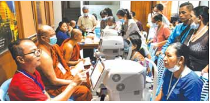
ကို အားပေးစကားပြောကြားသည်။ အကြိမ်အဖြစ် နိုဝင်ဘာ ၇ ရက်မှစ၍ ၁၃ ရက်အထိ သီတဂူစကျဒါနဆေးရုံ(ရန်ကုန်)၌ အနယ်နယ် စမ်းသပ်ကုသပေးမည်ဖြစ်ကြောင်း သိရသည်။ အရပ်ရပ်မှ မျက်စိဝေဒနာရှင်များအား တတိယ ဆန်းကျော်ဦး(ပြန်/ဆက်)

တိုင်းဒေသကြီး ဝန်ကြီးချုပ်နှင့် ဝန်ကြီးများသည် သီတဂူဆရာတော်ကြီး ဒေါက်တာ ဘဒ္ဒန္တဘင်္ဂသီသရ အား ဖူးမြော်ကြည့်ညိ၍ လှူဖွယ်ပစ္စည်းများနှင့် မျက်စိဝေဒနာရှင်များအား အခမဲ့စမ်းသပ်ခွဲစိတ်ကုသ ပေးရာတွင် လိုအပ်သည့်နေရာများ၌ အသုံးပြုနိုင်ရေး အလှူငွေများ ဆက်ကပ်လှူဒါန်းကြသည်။ ထို့နောက် တိုင်းဒေသကြီးဝန်ကြီးချုပ်နှင့်အဖွဲ့ သည် မျက်စိအထူးကုဆရာဝန်ကြီးများက စကျဒါန ဆေးရုံတွင် တပ်ဆင်ထားသည့် ခေတ်မီစမ်းသပ် စစ်ဆေးသည့် စက်သစ်ကြီးများဖြင့် မျက်စိဝေဒနာ ခံစားနေရသောပြည်သူများနှင့် အနယ်နယ်အရပ်ရပ်မှ လာရောက်ပြသသော လူနာများအား လိုအပ်သော စမ်းသပ်စစ်ဆေးမှုများပြုလုပ်ပေးပြီး ခွဲစိတ်ရန်မလို သောလူနာများအား ဆေးများ အခမဲ့ကုသပေးနေမှု အခြေအနေများကိုကြည့်ရှု၍ မျက်စိဝေဒနာရှင်များ