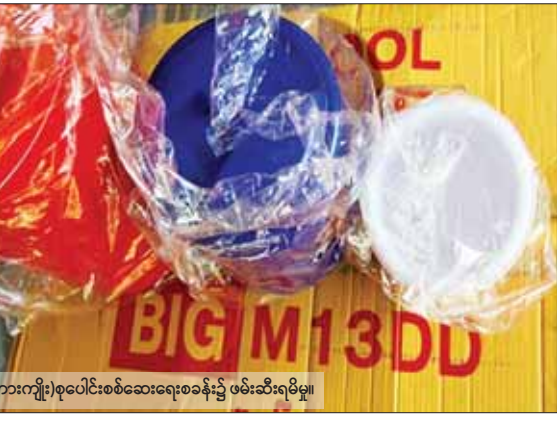
ကော့ကရိတ်(တံတားကျိုး)စုပေါင်းစစ်ဆေးရေးစခန်း၌ ဖမ်းဆီးရမိမှု။