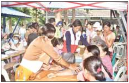
တပ်မတော်မြစ်တွင်းသွား ဆေးရုံရေယာဉ် (ရွှေပုဇွန်) ပေါ်၌ နယ်လှည့်အထူးကုဆေးအဖွဲ့က ဒေသခံများအား ကျန်းမာရေးစစ်ဆေးပေးစဉ်။

စုစုပေါင်း ၁၁၈၆ ဦးတို့ကို ရောဂါရှာဖွေစစ်ဆေးသည့် ခွဲစိတ်ကုသပေးခြင်းများ ဆောင်ရွက်ပေးပြီး ဆေးရုံတက်ရောက် ကုသရန် လိုအပ်သူ ကိုးဦးကို နီးစပ်ရာ တပ်မတော်ဆေးရုံသို့ တက်ရောက် ကုသနိုင်ရေး စီစဉ်ဆောင်ရွက်ပေးသည်။ အလားတူ တပ်မတော် မြစ်တွင်းသွား ဆေးရုံရေယာဉ် (ရွှေပုဇွန်)၊ မြစ်ရေယာဉ်(စက) တို့နှင့်အတူ လိုက်ပါလာသည့် တပ်မတော်နှင့် ကျန်းမာရေးဝန်ကြီးဌာနမှ ပါရဂူများ၊ ဆရာဝန်များ၊ သူနာပြုများ ပါဝင်သော နယ်လှည့် အထူးကုဆေးအဖွဲ့သည် ယနေ့တွင် ဧရာဝတီတိုင်းဒေသကြီး မြန်အောင်မြို့ရှိ မြို့နယ် ပြည်သူ့ဆေးရုံ၌ အခြေပြု၍ မြို့ပေါ်ရပ်ကွက်များနှင့် ပတ်ဝန်းကျင် ကျေးရွာများမှ ဒေသခံပြည်သူများအား ကျန်းမာရေး စောင့်ရှောက်မှုလုပ်ငန်းများ ဆောင်ရွက်ပေးသည်။ ထိုသို့ ဆောင်ရွက်ပေးရာတွင်