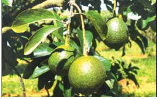
ထောပတ်ပင်ပေါ်၌ သီးနေသော ထောပတ်သီးများကို တွေ့ရစဉ်။