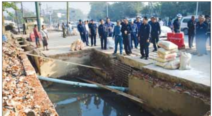
ဦးစီးဌာန မွေးမြူရေးဆိုင်ရာ သုတေသနနှင့် ဖွံ့ဖြိုးရေး ဗဟိုဌာန သို့ သွားရောက်၍ မြို့နယ်စီမံ အုပ်ချုပ်ရေးအဖွဲ့ဥက္ကဋ္ဌနှင့် မြို့နယ်

မြို့တော်ဝန်နှင့် အဖွဲ့သည် အင်းစိန်မြို့နယ် စည်ပင်သာယာရေးဝန်ကြီးဌာနမှ အဖွဲ့ဝင်များနှင့် အထူးကု ဆေးရုံကြီးဝင်းသို့ သွားရောက်၍ စည်ပင်သာယာဝန်ထမ်းများနှင့် ဆေးရုံဝန်ထမ်းများပူးပေါင်းအဖွဲ့များက စုပေါင်း သန့်ရှင်းရေး ဆောင်ရွက်နေမှုကို ကြည့်ရှုစစ်ဆေးသည်။ ထိုမှတစ်ဆင့် မြို့တော်ဝန်နှင့် အဖွဲ့သည် အင်ဂျင်နီယာဌာန (လမ်းနှင့်တံတား)မှ ဆောင်ရွက် နေသည့် အင်းစိန်မြို့နယ် စော်ဘွားကြီးကုန်း လမ်းဆုံမှ နံ့သာမြိုင်ပန်းခြံဝင်ပေါက်အထိ အရှည် ၆၂၅ ပေ၊ အကျယ် ၁၉ ပေ ရှိ ပြည်လမ်းကို ကွန်ကရစ်လမ်း