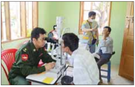
တပ်မတော်ပင်လယ်သွားဆေးရုံရေယာဉ်(သံလွင်)ပေါ်၌ နယ်လှည့်အထူးကုဆေးအဖွဲ့က ဒေသခံများအား မျက်စိစစ်ဆေးသည့် ကုသပေးစဉ်။

နေပြည်တော် နိုဝင်ဘာ ၁၀ ကမ်းရိုးတန်းဒေသ တစ်လျှောက်ရှိ ဒေသခံပြည်သူများအား ကျန်းမာရေး စောင့်ရှောက်မှုလုပ်ငန်းများ ဆောင်ရွက်ပေးရန်အတွက် တပ်မတော်ပင်လယ်သွား ဆေးရုံရေယာဉ်(သံလွင်)နှင့်အတူ လိုက်ပါလာသည့် တပ်မတော်နှင့် ကျန်းမာရေးဝန်ကြီးဌာနမှ ပါရဂူများ၊ ဆရာဝန်များ၊ သူနာပြုများ ပါဝင်သော နယ်လှည့်အထူးကုဆေးအဖွဲ့သည် ယနေ့တွင် ရောဂါတိုင်းဒေသကြီး ငပုတောမြို့နယ် ငရုတ်ကောင်းမြို့ရှိ နယ်မြေခံ တပ်မတော်ဆေးရုံ၌ အခြေပြု၍ အဆိုပါမြို့နှင့် ပတ်ဝန်းကျင် ကျေးရွာများမှ ဒေသခံပြည်သူများအား ကျန်းမာရေး စောင့်ရှောက်မှုလုပ်ငန်းများ ဆက်လက်ဆောင်ရွက်ပေးသည်။ ထိုသို့ ဆောင်ရွက်ပေးရာတွင် နယ်လှည့် အထူးကုဆေးအဖွဲ့က ဆေးကုသမှုဆိုင်ရာ ရောဂါ ၄၇ ဦး၊ ခွဲစိတ်ရောဂါ ၇၈ ဦး၊ သားဖွား/မီးယပ်ရောဂါ ၄၉ ဦး၊ ကလေးရောဂါ ၅၇ ဦး၊ အရိုးရောဂါ ၁၈ ဦး၊ နား/ နှာခေါင်း/ လည်ချောင်းရောဂါ ၇၀၊ မျက်စိရောဂါ ၂၄၉ ဦးနှင့် သွားနှင့်ဆိုင်ရာရောဂါ ၉၃ ဦး တို့ကို လိုအပ်သည့် ဆေးဝါးကုသမှုများ ဆောင်ရွက်ပေးသည်။ ထို့အပြင် အထူးကုဆေးအဖွဲ့သည် ယနေ့တွင် ဧရာဝတီတိုင်းဒေသကြီး မြန်အောင်မြို့ရှိ မြို့နယ် ပြည်သူ့ဆေးရုံ၌ အခြေပြု၍ မြို့ပေါ်ရပ်ကွက်များနှင့် ပတ်ဝန်းကျင် ကျေးရွာများမှ ဒေသခံပြည်သူများအား ကျန်းမာရေး စောင့်ရှောက်မှုလုပ်ငန်းများ ဆောင်ရွက်ပေးသည်။ ထိုသို့ ဆောင်ရွက်ပေးရာတွင်