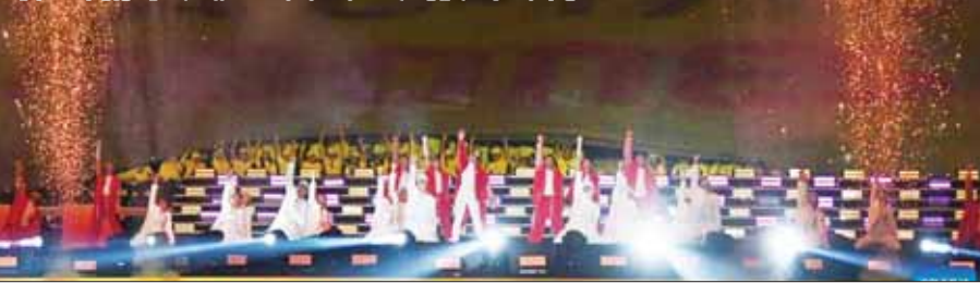
ဆူရာဘာရာမြို့၌ ယူ-၁၇ ကမ္ဘာ့ဖလားဖွင့်ပွဲအတွင်း ဖျော်ဖြေမှုများကို တွေ့ရပုံ။