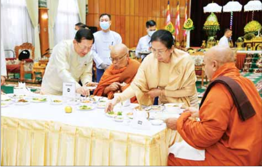
နိုင်ငံတော်စီမံအုပ်ချုပ်ရေးကောင်စီဥက္ကဋ္ဌ တပ်မတော်ကာကွယ်ရေးဦးစီးချုပ် ဗိုလ်ချုပ်မှူးကြီးမင်းအောင်လှိုင်နှင့် ဇနီး ဒေါ်ကြူကြူလှ ဆရာတော် သံဃာတော်များအား နေ့ဆွမ်းဆက်ကပ်လှူဒါန်းစဉ်။

တပ်မတော် ကာကွယ်ရေးဦးစီးချုပ်နှင့် ဇနီးတို့က နေပြည်တော်ဇေယျာသီရိမြို့နယ် ရေဆင်းကန်ဦးကျောင်းတိုက် ပဓာနနာယကအဂ္ဂမဟာပဏ္ဍိတ ဘဒ္ဒန္တဝိလာသထံ ကထိန်လှူပသကံန်းကိုလည်းကောင်း၊ ပေါက်မြိုင်ကျောင်းတိုက် ပဓာနနာယက ဆရာတော်ကြီးထံ ကထိန်သင်္ကန်းနှင့် လှူဖွယ်ပစ္စည်းများကိုလည်းကောင်း ဆက်ကပ်လှူဒါန်းသည်။ ဆက်ကပ်လှူဒါန်းဆက်လက်၍ နိုင်ငံတော်စီမံအုပ်ချုပ်ရေးကောင်စီ ဒုတိယဥက္ကဋ္ဌ ဒုတိယတပ်မတော် ကာကွယ်ရေးဦးစီးချုပ် ကာကွယ်ရေးဦးစီးချုပ် (ကြည်း)နှင့်ဇနီးတို့က ပါဠိဆရာတော်ကြီးထံ ကထိန်သင်္ကန်းနှင့် လှူဖွယ်ပစ္စည်းများကို ဆက်ကပ်လှူဒါန်းပြီး တက်ရောက်လာကြသည့် တပ်မတော်အရာရှိကြီးများနှင့် ဇနီးများက ဆရာတော်