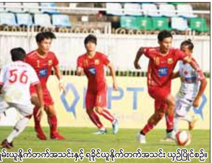
ရှမ်းယူနိုက်တက်အသင်းနှင့် ရခိုင်ယူနိုက်တက်အသင်း ယှဉ်ပြိုင်စဉ်။

ရန်ကုန် နိုဝင်ဘာ ၃ ၂၀၂၃ ရာသီ MNL အမှတ်ပေး ပြိုင်ပွဲ ပွဲစဉ် (၁၉) စတုတ္ထနေ့ကို နိုဝင်ဘာ ၃ ရက်က သုဝဏ္ဏဘိုး၌ ခုစိကိုး - တစ်ဂိုးဖြင့် အနိုင်ရခဲ့သည်။