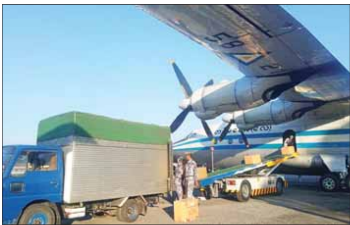
ယနေ့တွင်လည်း စေတနာရှင် စာမျက်နှာ ၁၁ ကော်လံ ၁ ၀

နေပြည်တော် နိုဝင်ဘာ ၃ မြောက်ပိုင်းတိုင်း စစ်ဌာနချုပ် နယ်မြေနှင့် အရှေ့မြောက်တိုင်း စစ်ဌာနချုပ်နယ်မြေအတွင်း နိုင်ငံတော်လုံခြုံရေးနှင့် ကာကွယ်ရေးတာဝန်များကို စွမ်းစွမ်းတမ်းတမ်းဆောင်လျက်ရှိသော လုံခြုံရေး တပ်ဖွဲ့ဝင်များအတွက် စေတနာရှင် အလှူရှင်များက အလှူငွေများ ပေးအပ်လှူဒါန်းလျက်ရှိသည့်အပြင် ဒံပေါက်ဘူးများကိုလည်း ပေးပို့လှူဒါန်းလျက်ရှိသည်။ (ယာပုံ)