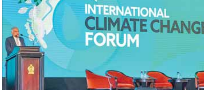
သီရိလင်္ကာသမ္မတ ဝစ်ကရီဗီဆင်ဂေး အပြည်ပြည်ဆိုင်ရာ ရာသီဥတုပြောင်းလဲမှုဆိုင်ရာ ညီလာခံတွင် မိန့်ခွန်းပြောကြားစဉ်။

ကိုလံဘို နိုဝင်ဘာ ၃ သီရိလင်္ကာသမ္မတ ရာနီးလ် ဝစ်ကရီဗီဆင်ဂေးက အလယ်ပိုင်း ကုန်းမြင့်ရှိ ကော့တံမေး ရေလျှောင်ကန် သဘာဝရင်းစရိယာကို နိုင်ငံတကာရာသီဥတုပြောင်းလဲမှုဆိုင်ရာ တက္ကသိုလ်တည်ဆောက်ရန် နေရာအဖြစ် သတ်မှတ်လိုက်ကြောင်း သမ္မတရုံးပြန်ကြားရေးဌာနက နိုဝင်ဘာ ၃ ရက်တွင် သတင်းထုတ်ပြန်သည်။ ကိုလံဘို၌ နိုဝင်ဘာ ၂ ရက်က ကျင်းပသည့် ဖိရမ်တစ်ခုတွင် ဝစ်ကရီဗီဆင်ဂေးက နိုင်ငံတကာရာသီဥတု ပြောင်းလဲမှုဆိုင်ရာ တက္ကသိုလ်သည် သီရိလင်္ကာနိုင်ငံ တစ်ခုတည်း၏ အဖွဲ့အစည်းမဟုတ်ဘဲ နိုင်ငံတကာနှင့် သက်ဆိုင်သည့် တက္ကသိုလ်တစ်ခု ဖြစ်မည်ဟု ထုတ်ပြန်ချက်တွင် ပြောကြားသည်။ သီရိလင်္ကာ၏ စီးပွားရေးပုံစံသည် ယှဉ်ပြိုင်နိုင်စွမ်းရှိမှု၊ ဒစ်ဂျစ်တယ်အသွင် ကူးပြောင်းမှု စွမ်းအင်အသွင် အကူးအပြောင်းနှင့် အစီမံခန့်ခွဲရေးအသွင် ကူးပြောင်းရေးတို့ အပေါ်တွင် တည်ဆောက်သွားမည့် ဖြစ်ကြောင်း၊ သေးငယ်သည့် နိုင်ငံအရွယ်အစားကြောင့် နေရာရခြင်းဖြင့်လေ့ရှိသည့် ဟိုက်ဒရိုဂျင်တို့အပါအဝင် ပိုလျှံနေသော အစိမ်းရောင် စွမ်းအင်ကဏ္ဍများအတွက် အကျိုးရလဒ်ကောင်းများ ရရှိနိုင်မည်ဖြစ်ကာ ၂၀၄၀ ပြည့်နှစ်တွင် ကာဗွန်ထုတ်လွှတ်မှု လုံးဝကင်းစင်ရေးကိုလည်း ရည်မှန်းထားကြောင်း သမ္မတက သုံးသပ်ပြောကြားသည်။ အဆိုပါ အစီအစဉ်ကို အကောင်အထည် ဖော်ရာတွင် ဆယ်စုနှစ် နှစ်ခုအတွင်း ရင်းနှီးမြှုပ်နှံမှု အမေရိကန်ဒေါ်လာ ဘီလီယံ ၁၀၀ ကျော် လိုအပ်မည်ဟု ခန့်မှန်းထားကြောင်း ၎င်းက ဆိုသည်။ ဆင်ဟွာ