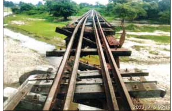
တံတားအရှည်ပေ ၃၂၀ ရှိ နန်းခွင်ချောင်း သံဘေလီရထားလမ်းကူးတံတားအား KIA အဖွဲ့က မိုင်းထောင်ဖောက်ခွဲဖျက်ဆီးခဲ့မှုကြောင့် ပျက်စီးနေသည့် မှတ်တမ်း ဓာတ်ပုံ။