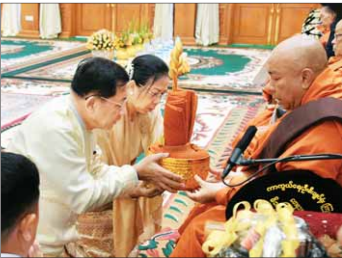
နိုင်ငံတော်စီမံအုပ်ချုပ်ရေးကောင်စီဥက္ကဋ္ဌ တပ်မတော်ကာကွယ်ရေးဦးစီးချုပ် ဗိုလ်ချုပ်မှူးကြီး မင်းအောင်လှိုင်နှင့်ဇနီး ဒေါ်ကြူကြူလှ ရေဆင်ကန်ဦးကျောင်းတိုက် ပဓာနနာယက အဂ္ဂမဟာပဏ္ဍိတ ဘဒ္ဒန္တဝိလာသ ထံ ကထိန်လျာသက်န်း ဆက်ကပ်လှူဒါန်းစဉ်။