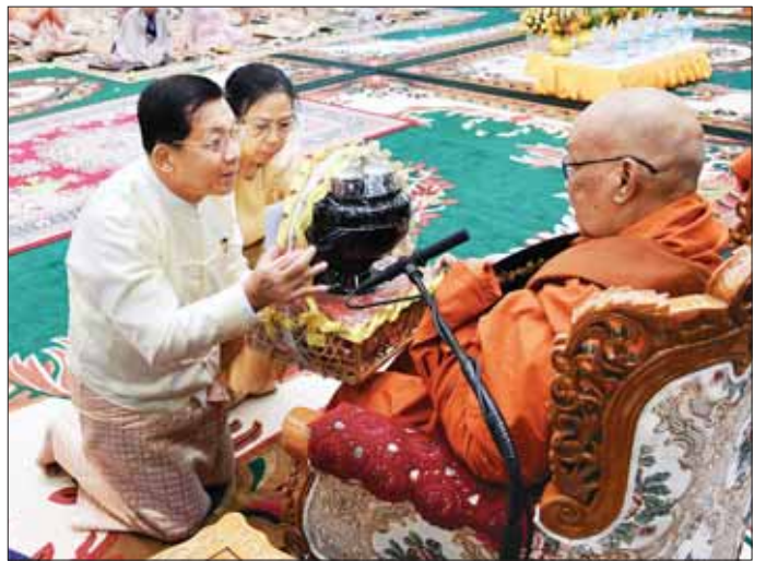
နိုင်ငံတော်စီမံအုပ်ချုပ်ရေးကောင်စီဥက္ကဋ္ဌ တပ်မတော်ကာကွယ်ရေးဦးစီးချုပ် ဗိုလ်ချုပ်မှူးကြီး မင်းအောင်လှိုင်နှင့်ဇနီး ဒေါ်ကြူကြူလှ ပေါက်ဖြိုင်ကျောင်းတိုက် ပဓာနနာယက ဆရာတော်ကြီးထံ ကထိန်သက်န်းနှင့် လှူဖွယ်ပစ္စည်းများ ဆက်ကပ်လှူဒါန်းစဉ်။