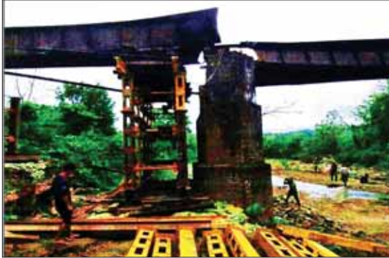
မြစ်ကြီးနား-မန္တလေးသွား မီးရထားလမ်းပေါ်မှ အရှည်ပေ ၁၂၀ ရှိ တံတားအမှတ်(၅၅၅) အား KIA အဖွဲ့က မိုင်းထောင်ဖောက်ခွဲဖျက်ဆီးခဲ့မှုကြောင့် ပျက်စီးနေသည့် မှတ်တမ်းဓာတ်ပုံ။