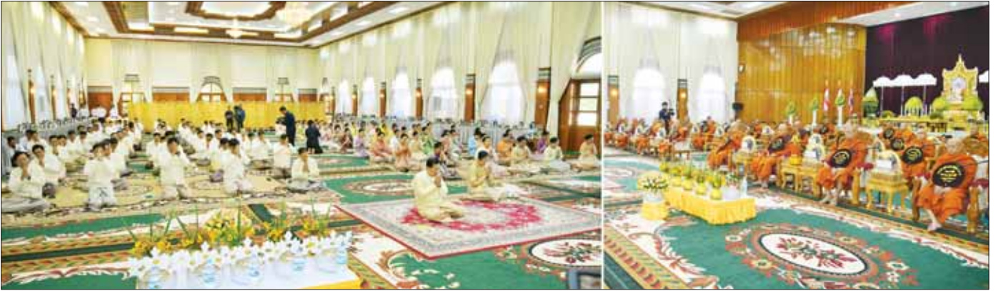
နိုင်ငံတော်စီမံအုပ်ချုပ်ရေးကောင်စီဥက္ကဋ္ဌ တပ်မတော်ကာကွယ်ရေးဦးစီးချုပ် ဗိုလ်ချုပ်မှူးကြီး မင်းအောင်လှိုင်၊ ဇနီး ဒေါ်ကြူကြူလှနှင့် ဧည့်ပရိသတ်များ ပေါက်ဖြိုင်ကျောင်းတိုက် ပဓာနနာယက ဆရာတော်ကြီးထံမှ ကိုးပါးသီလ ခံယူဆောက်တည်ကြစဉ်။