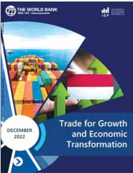
အင်ဒိုနီးရှားနိုင်ငံ၏ စီးပွားရေးအလားအလာနှင့် ပတ်သက်၍ ကမ္ဘာ့ဘဏ်က ယမန်နှစ်ဒီဇင်ဘာလက ထုတ်ဝေသည့်အစီရင်ခံစာ။

စိုက်ပျိုးရေးကဏ္ဍဖွံ့ဖြိုးရေးဆောင်ရွက်ချက်များ နိုင်ငံတော်အဆင့် စိုက်ပျိုးရေးမူဝါဒအနေဖြင့် ဗဟိုအစိုးရ၏ အစည်းအဝေးအဖြစ် အမျိုးသားရေးဆိုင်ရာ ဖွံ့ဖြိုးရေးအစီအစဉ် ပြဋ္ဌာန်းချက်များ ချမှတ်ဆောင်ရွက်ခဲ့ပြီး ဒေသတစ်ခုစီ၏ ဒေသဆိုင်ရာ