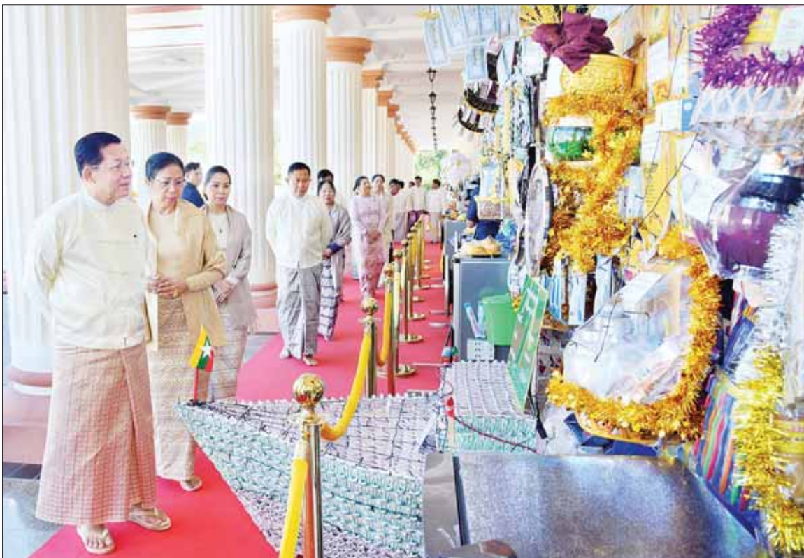
နိုင်ငံတော်စီမံအုပ်ချုပ်ရေးကောင်စီဥက္ကဋ္ဌ တပ်မတော်ကာကွယ်ရေးဦးစီးချုပ် ဗိုလ်ချုပ်မှူးကြီး မင်းအောင်လှိုင်နှင့်ဇနီး ဒေါ်ကြူကြူလှတို့ ဘုန်းတော်ကြီးကျောင်းအသီးသီးသို့ လှူဒါန်းရန် ခင်းကျင်းပြင်ဆင်ထားသည့် လှူဖွယ်ပစ္စည်းများနှင့် ပဒေသာပင်များအား လှည့်လည်ကြည့်ရှုကြစဉ်။

နေပြည်တော် နိုဝင်ဘာ ၃ ကာကွယ်ရေး ဦးစီးချုပ်ရုံး (ကြည်း၊ ရေ၊ လေ) မိသားစုများ၏ တေရသမအကြိမ်၊ (၁၃) ကြိမ်မြောက် မဟာဘုံကထိန်အလှူတော် မင်္ဂလာအခမ်းအနားကို ယနေ့ နံနက်ပိုင်းတွင် ကာကွယ်ရေးဦးစီးချုပ်ရုံး (ကြည်း) အနော်ရထာခန်းမ၌ ကျင်းပပြုလုပ်ရာ နိုင်ငံတော်စီမံအုပ်ချုပ်ရေးကောင်စီဥက္ကဋ္ဌ တပ်မတော်ကာကွယ်ရေးဦးစီးချုပ် ဗိုလ်ချုပ်မှူးကြီး မင်းအောင်လှိုင်နှင့်ဇနီး ဒေါ်ကြူကြူလှတို့ တက်ရောက်၍ ကထိန်လျာသက်နန်းနှင့် လှူဖွယ်ပစ္စည်းများ ဆက်ကပ်လှူဒါန်းသည်။ အဆိုပါ အခမ်းအနားသို့ ဥပုတသန္တီစေတီတော်ဂေါပကအဖွဲ့ ဩဝါဒါစရိယဆရာတော် နေပြည်တော်လယ်ဝေးမြို့ ပေါက်မြိုင်ကျောင်းတိုက် ပဓာနနယက အဘိဓမ္မဟာရဋ္ဌဂုဏ် ဘဒ္ဒန္တဇနိန္ဒာ ပျဉ်းမနားမြို့ ပါဠိတက္ကသိုလ် မင်္ဂလာဇေယျ ကျောင်းတိုက် ပဓာနနယက အဂ္ဂမဟာပဏ္ဍိတ၊ အဂ္ဂမဟာသဒ္ဓမ္မ ဇောတိကဓမ္မ ဘဒ္ဒန္တဝိမလဗုဒ္ဓိ ဆရာတော်ကြီးများ အမျိုးပြုသည့် ပင့်ဖိတ်ထားသော ဒေသခံဆရာတော်ကြီး စာမျက်နှာ ၃ ကော်လံ ၁ *