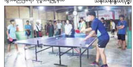
ဇေယျာ(ပြန်/ဆက်)

ဆက်လက်၍ အသက် ၁၈ နှစ် အောက် မြို့နယ်အဆင့် ကျောင်း ပေါင်းစုံ ကျောင်းသားအားကစား ပွဲတော်အတွက် လူရွေးပွဲများကို နိုဝင်ဘာ ၆ ရက်မှ ၈ ရက်အထိ အ.ထ.က (၃) ၌ ကြက်တောင်၊ ပိုက်ကျော်ခြင်း၊ ဘော်လီဘော၊ ဘတ်စကက်ဘော၊ ပြေးခုန်ပစ် အားကစားနည်းများဖြင့် ကျင်းပ သွားမည်ဖြစ်ရာ ပုဗ္ဗသီရိမြို့နယ် အတွင်းရှိ အခြေခံပညာအထက် တန်းကျောင်းများ၊ အလယ်တန်း ကျောင်းများ၊ ကိုယ်ပိုင်ကျောင်း များနှင့် ဘုန်းတော်ကြီးသင် ပညာရေးကျောင်းများတွင် တက် ရောက်နေသည့် အားကစား ဝါသနာရှင်ကျောင်းသားကျောင်းသူ များ ဝင်ရောက်ရွေးချယ်ခံ၍ ယှဉ်ပြိုင်သွားမည် ဖြစ်ကြောင်း သိရသည်။