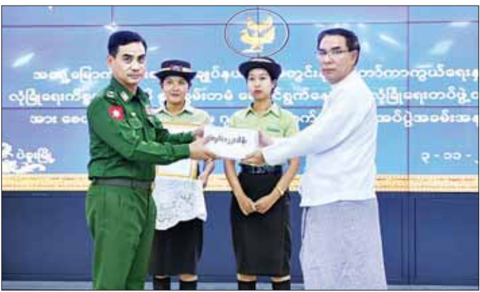
ကြသူများဖြစ်ပြီး ပြည်သူ့အကျိုးပြုလုပ်ငန်းများတွင်လည်း ရှေ့ဆုံးမှ ပါဝင်ဆောင်ရွက်နေသူများပင်ဖြစ်ကြောင်း၊ အရှေ့မြောက်တိုင်းစစ်ဌာနချုပ် နယ်မြေအတွင်း နိုင်ငံတော်ကာကွယ်ရေးနှင့် လုံခြုံရေးကိစ္စများကို စွမ်းစွမ်းတမံဆောင်ရွက်နေသော လုံခြုံရေး တပ်ဖွဲ့ဝင်များကို ဂုဏ်ပြုသည့်အနေဖြင့် ဒေသခံပြည်သူများက အပြန်အလှန်ကျေးဇူးတရားနားလည်ပြီး ထောက်ပံ့ငွေများ လာရောက်ပေးအပ်မှုအပေါ် အထူးဝမ်းမြောက်ဝမ်းသာ ကျေးဇူးတင်ရှိပါကြောင်း ပြောကြားသည်။

ပဲခူး နိုဝင်ဘာ ၃ ပဲခူးတိုင်းဒေသကြီးအစိုးရအဖွဲ့ရုံး တော်ဝင်ဟံသာအစည်းအဝေးခန်းမ၌ နိုဝင်ဘာ ၃ ရက် မွန်းလွဲပိုင်းက အရှေ့မြောက်တိုင်းစစ်ဌာနချုပ် နယ်မြေအတွင်း နိုင်ငံတော်ကာကွယ်ရေးနှင့် လုံခြုံရေးကိစ္စများကို စွမ်းစွမ်းတမံဆောင်ရွက်နေသော လုံခြုံရေးတပ်ဖွဲ့ဝင်များအား စေတနာရှင်ပြည်သူများက ကူညီထောက်ပံ့သည့် အလှူငွေပေးအပ်ပွဲအခမ်းအနား ကျင်းပသည်။ ရှေးဦးစွာ တိုင်းဒေသကြီးဝန်ကြီးချုပ် ဦးမျိုးဆွေဝင်းက မကြာသေးမီက ပဲခူးမြို့တွင် ဖြစ်ပွားခဲ့သည့် ရေကြီးမှုဖြစ်စဉ်တွင် တပ်မတော်သားများ၊ ရတပ်ဖွဲ့ဝင်များက နေ့ညမပြတ် ကူညီကယ်ဆယ်ရေးလုပ်ငန်းများတွင် ရှေ့ဆုံးမှပါဝင်ဆောင်ရွက်ခဲ့သလို ပြန်လည်ထူထောင်ရေးလုပ်ငန်းများတွင်လည်း အင်ပြည့်အားပြည့်ဆောင်ရွက်ပေးခဲ့သည်ကို အားလုံးအသိပင်ဖြစ်ကြောင်း၊ နိုင်ငံတော်ကာကွယ်ရေးလုပ်ငန်းများကို ဆောင်ရွက်နေသည့် လုံခြုံရေးတပ်ဖွဲ့ဝင်များသည် ဒိုတာဝန်အရေးသုံးပါးကို ဦးထိပ်ပန်ဆင်ပြီး မိမိတို့၏ အသက်ကို ပဓာနမထားဘဲ တာဝန်ထမ်းဆောင်နေ