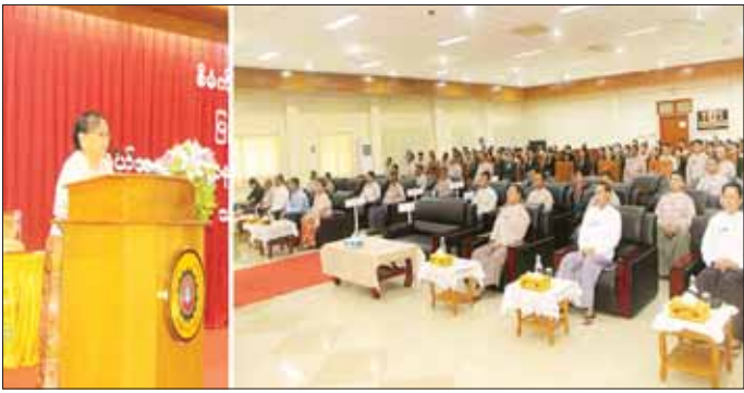
အဆိုပါသင်တန်းကို နိုင်ငံ တော်အတွက် ရသင့်ရထိုက်သည့် အခွန်ငွေများ လျော့နည်း လွတ်ကင်းမှု မရှိဘဲ ဥပဒေနှင့်အညီ အပြည့်အဝ ကောက်ခံရရှိနိုင်ရေး အတွက် အခွန်ဝန်ထမ်းများ၏ လုပ်ငန်းစွမ်းဆောင်ရည် မြှင့်တင် ပေးရန် ရည်ရွယ်ချက်ဖြင့် ဖွင့်လှစ် ခဲ့ခြင်းဖြစ်ပြီး သင်တန်းသား/ သင်တန်းသူ စုစုပေါင်း ၈၁ ဦးကို ရက်သတ္တ ရှစ်ပတ်ကြာ သင်ကြား ပို့ချခဲ့ကြောင်း သတင်းရရှိသည်။ သတင်းစဉ်

သင်တန်းဆင်းပွဲသို့ စီမံကိန်း နှင့် ဘဏ္ဍာရေးဝန်ကြီးဌာန ဒုတိယ ဝန်ကြီး ဒေါ်သန်းသန်းလင်း၊ ဌာန ဆိုင်ရာ အကြီးအကဲများ၊ သင်တန်း နည်းပြများနှင့် အရာထမ်း/အမှု ထမ်းများ တက်ရောက်ကြသည်။ အခမ်းအနားတွင် ဒုတိယ ဝန်ကြီးက ပြည်တွင်းအခွန်များ ဦးစီးဌာနသည် digital taxation စနစ်သို့ အသွင်ကူးပြောင်းနိုင် ရေးကို ကြိုးပမ်းအကောင်အထည် ဖော်လျက်ရှိကြောင်း၊ ဝန်ထမ်းများ အနေဖြင့် ပြောင်းလဲတိုးတက်လာ သည့် နည်းပညာများနှင့်အညီ လိုက်ပါ ဆောင်ရွက်နိုင်ရေး ကြိုးပမ်းကြရန်လိုကြောင်း၊ မိမိတို့ တာဝန်ကျရာ နေရာတွင် နိုင်ငံ ဝန်ထမ်း ဥပဒေ၊ နည်းဥပဒေ၊ စည်းမျဉ်း စည်းကမ်းများနှင့်အညီ လိုက်နာ ဆောင်ရွက်ကြရန်လို ကြောင်း ပြောကြားသည်။ ထို့နောက် ဒုတိယဝန်ကြီးက သင်တန်းတွင် ပထမ၊ ဒုတိယနှင့် တတိယဆင့်ရရှိသည့် သင်တန်းသူ များကို ဆုများ ချီးမြှင့်ပြီး သင်တန်းဆင်း အောင်လက်မှတ် များ ပေးအပ်သည်။