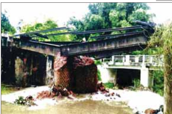
KIA အဖွဲ့က မိုင်းထောင်ဖောက်ခွဲဖျက်ဆီးခဲ့သည့် တံတားအရှည်ပေ ၄၀ ရှိ နန်းသာယာ ရထားလမ်းကူးတံတား မှတ်တမ်းဓာတ်ပုံ။