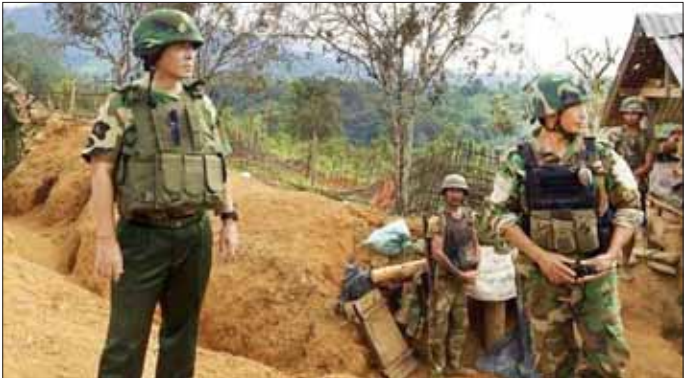
တပ်စုအဆင့် နယ်မြေလုံခြုံရေးဆောင်ရွက်နေသည့် တပ်မတော်၏ စခန်းငယ်တစ်ခုအား အင်အားအလုံး အရင်းဖြင့် အလစ်အဇိုက် ဝင်ရောက်တိုက်ခိုက်ခဲ့ပြီး KIA အဖွဲ့မှ ဒုတိယဥက္ကဋ္ဌဖြစ်သူ ဝှစ်မော်ကိုယ်တိုင် လာရောက်ကြည့်ရှုခဲ့သည့် မှတ်တမ်းဓာတ်ပုံ။

ရေးအပေါ် များစွာထိခိုက်ဆုံးရှုံး မှုများ ဖြစ်ပေါ်စေခဲ့သည်။ ထို့အပြင် တပ်မတော်အနေ ဖြင့် ငြိမ်းချမ်းရေးညှိနှိုင်းဆဲ ကာလအတွင်း တစ်စခန်းများအား တိုက်ခိုက်ခြင်းများ မပြုလုပ်ရန် အကြိမ်ကြိမ် ဆက်သွယ်အသိပေး ပြောကြားခဲ့သော်လည်း KIA အနေဖြင့် တပ်မတော်၏ တပ်စု အဆင့် နယ်မြေလုံခြုံရေးဆောင် ရွက်နေသည့် စခန်းငယ်များကို လည်း သာလွန်အင်အားအသုံးပြု ၍ အလစ်အဇိုက်တိုက်ခိုက်ခြင်း များ ဆောင်ရွက်ခဲ့ပြီး အဆိုပါ တပ်စခန်းများသို့ KIA အဖွဲ့မှ ဒုတိယဥက္ကဋ္ဌဖြစ်သူ ဝှစ်မော် ကိုယ်တိုင် သွားရောက်ကြည့်ရှု