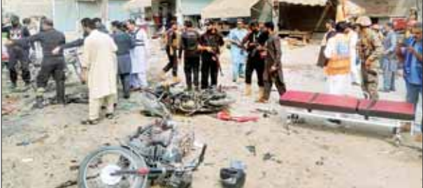
အဆိုပါဒေသရှိ မျက်မြင်သက်သေများ၏ ပြောကြားချက်အရ ပေါက်ကွဲမှုအပြီး

အစ္စလာမာဘတ် နိုဝင်ဘာ ၃ ပါကစ္စတန်နိုင်ငံအနောက်မြောက်ပိုင်း နိုင်ငံပတ်ထွန်ခါ ပြည်နယ်တွင် အောက်တိုဘာ ၃ ရက်က ရဲကားတစ်စီးအနီး ပေါက်ကွဲမှုဖြစ်ပွားခဲ့ရာ ငါးဦးသေဆုံးပြီး ၂၂ ဦးဒဏ်ရာရရှိခဲ့သည်ဟု ရဲများနှင့် အစိုးရအရာရှိများက ပြောသည်။ ဒဏ်ရာရရှိသူများကို နီးစပ်ရာဆေးရုံသို့ ပို့ဆောင်ပေးခဲ့ပြီး ၎င်းတို့ထဲမှ အချို့မှာစိုးရိမ်ရသည့်အခြေအနေရှိသည်ဟု ဆေးရုံသတင်း အရင်းမြစ်များက ပြောသည်။ ခရိုင်အတွင်း မသိရသေးချေ။ ဆင်ဟွာ