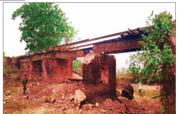
အရှည်ပေ ၂၀ ရှိ တဝက်ချောင်းကူး ကွန်ကရစ်တံတား(ရထားလမ်း)အား KIA အဖွဲ့က မိုင်းထောင်ဖောက်ခွဲဖျက်ဆီးခဲ့မှုကြောင့် ပျက်စီးနေသည့် မှတ်တမ်းဓာတ်ပုံ။

ပစ်ခတ်တိုက်ခိုက်ခြင်းများ ဆောင် ရွက်ခဲ့သည်။ ထိုသို့ စစ်ရေးနှင့်မသက်ဆိုင် သော ဒေသခံပြည်သူများနှင့် ခရီး သွားပြည်သူများ အသုံးပြုသွား လာလျက်ရှိသော ရထားလမ်း၊ ကားလမ်းနှင့် တံတားများအား ဖောက်ခွဲ ဖျက်ဆီးခဲ့မှုကြောင့် တိုင်းရင်းသား ပြည်သူလူထု၏ သွားလာရေးကို အခက်အခဲဖြစ် ပေါ်စေပြီး ဒေသဖွံ့ဖြိုးတိုးတက်