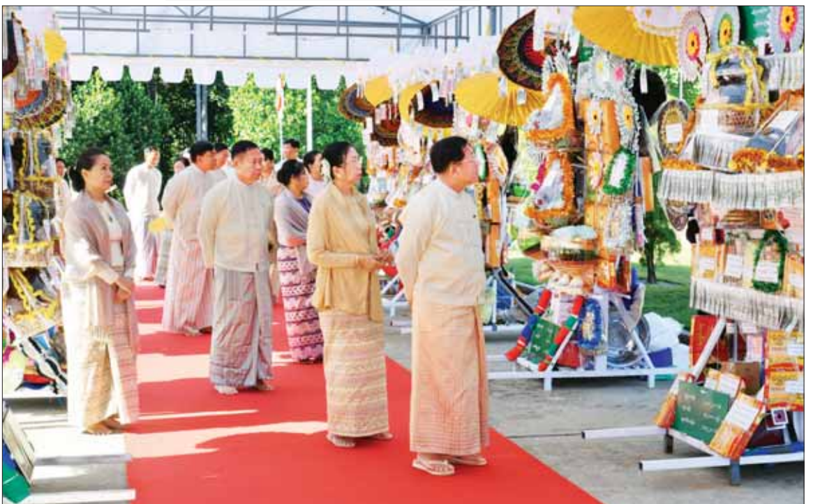
နိုင်ငံတော်စီမံအုပ်ချုပ်ရေးကောင်စီဥက္ကဋ္ဌ တပ်မတော်ကာကွယ်ရေးဦးစီးချုပ် ဗိုလ်ချုပ်မှူးကြီး မင်းအောင်လှိုင်နှင့်ဇနီး ဒေါ်ကြူကြူလှတို့ ဘုန်းတော်ကြီးကျောင်းအသီးသီးသို့ လှူဒါန်းရန် ခင်းကျင်းပြင်ဆင်ထားသည့် လှူဖွယ်ပစ္စည်းများနှင့် ပဒေသာပင်များအား လှည့်လည်ကြည့်ရှုကြစဉ်။

ဦးစွာ နိုင်ငံတော်စီမံအုပ်ချုပ်ရေးကောင်စီဥက္ကဋ္ဌ တပ်မတော်ကာကွယ်ရေးဦးစီးချုပ်၊ ဇနီးနှင့် ဧည့်ပရိသတ်များသည် ဘုန်းတော်ကြီးကျောင်းအသီးသီးသို့ လှူဒါန်းရန် ခင်းကျင်းပြင်ဆင်ထားသည့် ကထိန်လျာသက်န်း၊ လှူဖွယ်ပစ္စည်းများနှင့် ပဒေသာပင်များအား လှည့်လည်ကြည့်ရှုကြသည်။ ထို့နောက် နိုင်ငံတော် စီမံအုပ်ချုပ်ရေးကောင်စီ ဥက္ကဋ္ဌ စာမျက်နှာ ၄ သို့