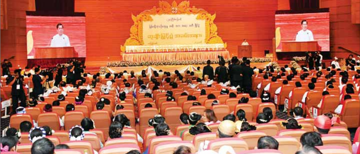
နိုင်ငံတော်စီမံအုပ်ချုပ်ရေးကောင်စီဥက္ကဋ္ဌ နိုင်ငံတော်ဝန်ကြီးချုပ် ဗိုလ်ချုပ်မှူးကြီး မင်းအောင်လှိုင် (၂၄)ကြိမ်မြောက် မြန်မာ့ရိုးရာယဉ်ကျေးမှု အဆို၊ အက၊ အရေး၊ အတီးပြိုင်ပွဲ ဆုချီးမြှင့်ပွဲ အခမ်းအနားတွင် အမှာစကားပြောကြားစဉ်။