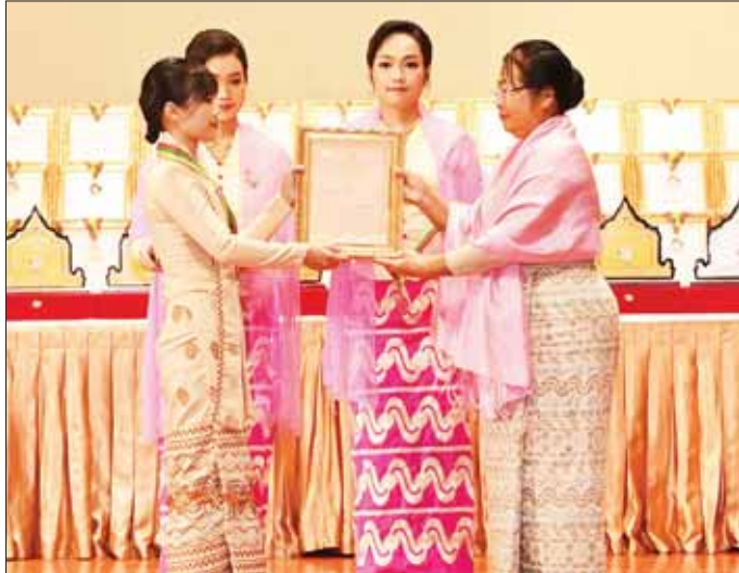
နိုင်ငံတော်စီမံအုပ်ချုပ်ရေးကောင်စီ ဒုတိယဥက္ကဋ္ဌ ဒုတိယဝန်ကြီးချုပ်၏ ဇနီး ဒေါ်သန်းသန်းနွယ် မဟာဂီတ အဆိုပြိုင်ပွဲ အခြေခံပညာအဆင့် (၁၅-၂၀)အဆင့်တွင် ဆုရရှိသူ တစ်ဦးအား ဂုဏ်ပြုမှတ်တမ်းလွှာ ပေးအပ်ချီးမြှင့်စဉ်။