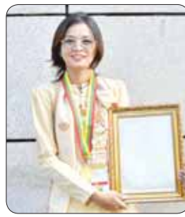
မဝေဝေထွန်း