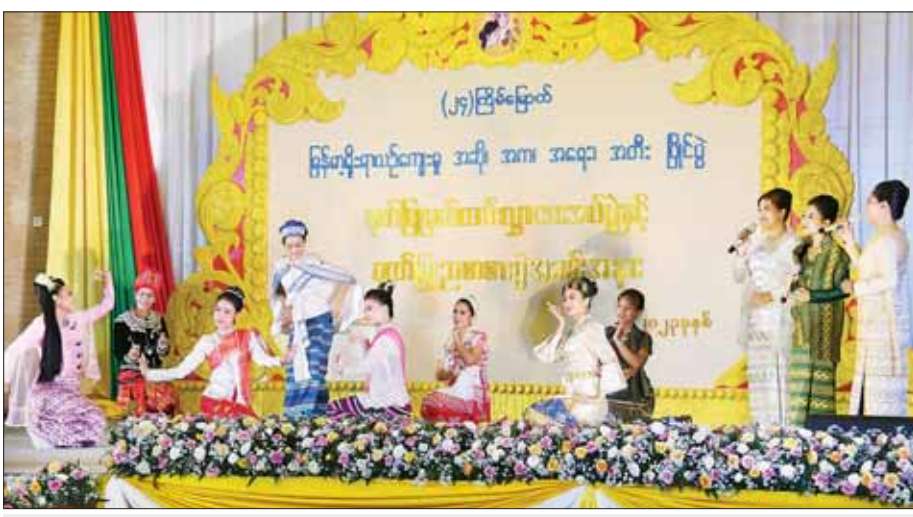
ဂုဏ်ပြုမှတ်တမ်းလွှာပေးအပ်ပွဲနှင့် ဂုဏ်ပြုညစာစားပွဲအခမ်းအနားတွင် သာသနာရေးနှင့် ယဉ်ကျေးမှုဝန်ကြီးဌာန အနုပညာဦးစီးဌာနမှ အနုပညာရှင်များ ဖျော်ဖြေကြစဉ်။

ယနေ့အချိန် ကာလတွင် နည်းပညာ ဖွံ့ဖြိုးတိုးတက်လာမှု နှင့်အတူ အနောက်နိုင်ငံများ အပါအဝင် တိုင်းတစ်ပါးယဉ်ကျေး မှုများသည် မိမိတို့နိုင်ငံငယ်များ အပေါ် ထိုးဖောက်ဝင်ရောက်လာ နေပါကြောင်း၊ မိမိတို့ နိုင်ငံသူ စာမျက်နှာ ၉ သို့