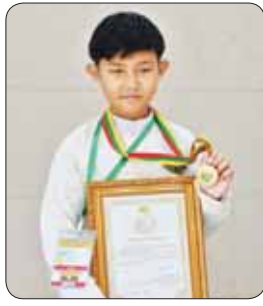
မောင်နောနောအောင်