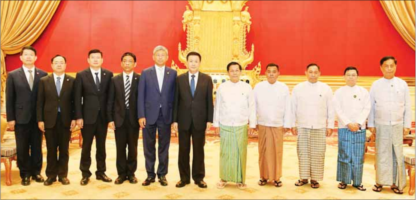
နိုင်ငံတော်စီမံအုပ်ချုပ်ရေးကောင်စီဥက္ကဋ္ဌ နိုင်ငံတော်ဝန်ကြီးချုပ် ဗိုလ်ချုပ်မှူးကြီး မင်းအောင်လှိုင်နှင့်အဖွဲ့ဝင်များ တရုတ်ပြည်သူ့သမ္မတနိုင်ငံ ကွန်မြူနစ်ပါတီဗဟိုကော်မတီ၏ အတွင်းရေးမှူးချုပ်ရုံး အဖွဲ့ဝင်၊ နိုင်ငံတော်ကောင်စီဝင်နှင့် ပြည်သူ့လုံခြုံရေးဝန်ကြီး H.E. Mr. Wang Xiaohong ဦးဆောင်သော ကိုယ်စားလှယ်အဖွဲ့နှင့်အတူ စုပေါင်းမှတ်တမ်းတင်ဓာတ်ပုံရိုက်စဉ်။

❖ နှစ်နိုင်ငံအကြား ချစ်ကြည်ရင်းနှီးမှုနှင့် သံတမန်ဆက်ဆံမှုများ တိုးတက်ကောင်းမွန်လျက်ရှိသည့် အခြေအနေများ၊ မြန်မာနိုင်ငံ၏ အရှေ့မြောက်ပိုင်းဒေသတွင် MNDA အစိုးရအဖွဲ့များက နယ်မြေတည်ငြိမ်အေးချမ်းမှုပျက်ပြားစေရန် ရည်ရွယ်၍ လုံခြုံရေးစခန်းများအား တိုက်ခိုက်မှုများဆောင်ရွက်လာသည့် အခြေအနေများ၊ လောက်ကိုင်ဒေသတွင် ကိုယ်ကျိုးစီးပွားအတွက် အွန်လိုင်းလောင်းကစားများ၊ ဆက်သွယ်ရေး လိမ်လည်မှုများ၊ မူးယစ်ဆေးဝါး ထုတ်လုပ်မှုနှင့် ရောင်းဝယ်မှုများ ဆောင်ရွက်နေမှုများအား နှစ်နိုင်ငံပူးပေါင်း၍ ဖော်ထုတ်ရေးယူ ဆောင်ရွက်သွားမည့် အခြေအနေများ အမြင်ချင်းပလှယ်ဆွေးနွေး