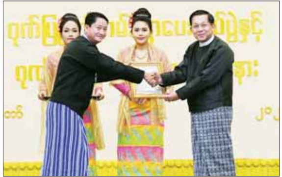
နိုင်ငံတော်စီမံအုပ်ချုပ်ရေးကောင်စီဥက္ကဋ္ဌ နိုင်ငံတော်ဝန်ကြီးချုပ် ဗိုလ်ချုပ်မှူးကြီး မင်းအောင်လှိုင် တိုင်းဒေသကြီးနှင့် ပြည်နယ်များမှ အုပ်ချုပ်သူများအား ဂုဏ်ပြုမှတ်တမ်းလွှာပေးအပ်ချီးမြှင့်စဉ်။

ဆက်လက်ပြီး ပိုင်းဝန်းကြီးပမ်း ဆောင်ရွက်ကြပါဟု အလေးအနက်ထား ပန်ကြားလိုကြောင်း ပြောကြားသည်။ ပေးအပ်ချီးမြှင့် ယင်းနောက် နိုင်ငံတော်စီမံအုပ်ချုပ်ရေးကောင်စီ ဥက္ကဋ္ဌ နိုင်ငံတော်ဝန်ကြီးချုပ်က အဆိုအကဲဖြတ်လုပ်ငန်းအဖွဲ့ကိုယ်စား ဥက္ကဋ္ဌ ဒေါ်သင်းသင်းမြတ်၊ အကဲအဖြတ် လုပ်ငန်းအဖွဲ့ကိုယ်စား ဥက္ကဋ္ဌ ဦးအောင်တင်ဝင်း၊ အရေးအကဲဖြတ်လုပ်ငန်းအဖွဲ့ ကိုယ်စား ဥက္ကဋ္ဌ ဦးမောင်မောင်လတ်နှင့် အတီးအကဲဖြတ် လုပ်ငန်းအဖွဲ့