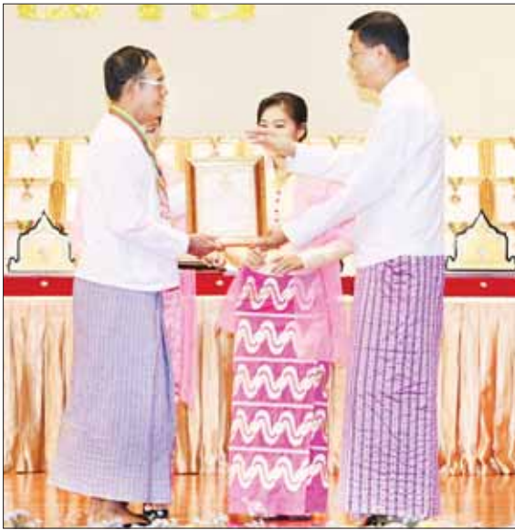
နိုင်ငံတော်စီမံအုပ်ချုပ်ရေးကောင်စီအဖွဲ့ဝင် ဗိုလ်ချုပ်ကြီး မြထွန်းဦး မဟာဂီတ အဆိုပြိုင်ပွဲ ဝါသနာရှင်အဆင့်(ပထမတန်း)ပြိုင်ပွဲ၌ ဆုရရှိသူ တစ်ဦးအား ဂုဏ်ပြုမှတ်တမ်းလွှာ ပေးအပ်စဉ်။

ကာယဗလ၊ ဉာဏဗလ၊ စာရိတ္တဗလ၊ မိတ္တဗလ၊ ဘောဂဗလ ဆိုသည့် ဗလငါးတန်နှင့် ပြည့်စုံနေရန်အတွက် ပြုစုပေးထောင်ရာတွင် ရိုးရာယဉ်ကျေးမှု ဓလေ့ထုံးတမ်းများကို အခြေခံသည့် အနုပညာရပ်များသည် အခြေခံကျသည့် အခန်းကဏ္ဍတွင် ပါဝင်လျက်ရှိသည်ကို ထပ်ဆင့်ပြောကြားလိုပါကြောင်း။ ထို့ပြင် မြန်မာ့ဂီတ၊ မြန်မာ့အကနှင့် မြန်မာ့ရိုးရာယဉ်ကျေးမှု