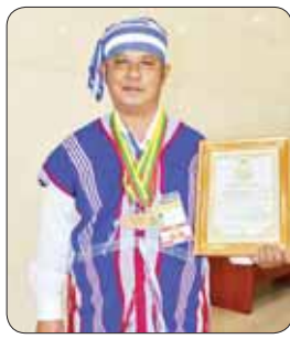
ဦးဟိန်းရာဇာ