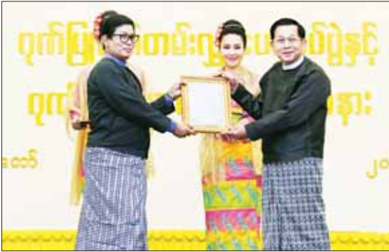
နိုင်ငံတော်စီမံအုပ်ချုပ်ရေးကောင်စီဥက္ကဋ္ဌ နိုင်ငံတော်ဝန်ကြီးချုပ် ဗိုလ်ချုပ်မှူးကြီး မင်းအောင်လှိုင် အတီးအကဲဖြတ် လုပ်ငန်းအဖွဲ့ကိုယ်စား ဥက္ကဋ္ဌ ဦးအောင်ကိုန်း အား ဂုဏ်ပြုမှတ်တမ်းလွှာ ပေးအပ်ချီးမြှင့်စဉ်။

အလေးအနက်ထားသည့် အန္တရာယ် ရှိရုံမဟုတ်ဘဲ ကြီးမားအပြင် မျိုးဆက်သစ်လူငယ် မောင်မယ်များအနေဖြင့် ယခု ပြိုင်ပွဲကြီးမှရရှိသည့် အောင်မြင်မှုများနှင့်အတူ အမျိုးသားရေးစိတ်ဓာတ် လက္ခဏာများ မပျောက်ပျက်အောင် ထိန်းသိမ်းစောင့်ရှောက်ရေး၊ အတူတကွ ပြိုင်ပွဲဝင်ခဲ့ကြသည့် တိုင်းရင်းသားအစည်းအရုံးများအား အချင်းချင်းချစ်ကြည် ရင်းနှီးမှုကို ပိုမိုခိုင်မြဲစေရေး၊ မိမိယဉ်ကျေးမှု မိမိဝေလေထုံးစံမှမသိမိမိနိုင်ငံနှင့် မိမိလူမျိုးတို့၏ နိုင်ငံသားများအပေါ် ချစ်ခင်မြတ်နိုးစိတ်များကို လက်ဆင့်ကမ်း သယ်ဆောင်သွားကြရေးအတွက်