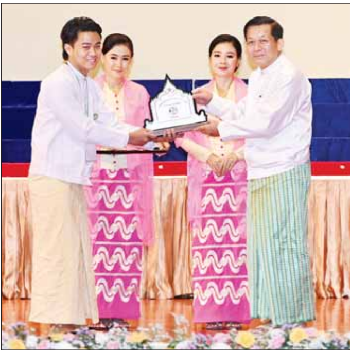
နိုင်ငံတော်စီမံအုပ်ချုပ်ရေးကောင်စီဥက္ကဋ္ဌ နိုင်ငံတော်ဝန်ကြီးချုပ် ဗိုလ်ချုပ်မှူးကြီး မင်းအောင်လှိုင် ဇာတိမာန်ကြီးပြိုင်ပွဲ ဝါသနာရှင်အဆင့် (ပထမတန်း) ပြိုင်ပွဲတွင် ဒုတိယဆုရရှိသည့် ရန်ကုန်တိုင်းဒေသကြီး ကိုယ်စားပြု မဟော်သဇာတော်တော်ကြီးအဖွဲ့ကို ဂုဏ်ပြုဆုတံဆိပ်ပေးအပ်ချီးမြှင့်စဉ်။

၌ ဗဟိုအဆင့် ပြိုင်ပွဲဝင်အင်အား သည် ကြိုတင်မျှော်မှန်းထားသည် ထက် ပိုမိုပြီး ယှဉ်ပြိုင်နိုင်ခဲ့သည် ကို တွေ့ရှိခဲ့ရပါကြောင်း။ အဆိုပါ ကာလသည် ကိုဗစ်-၁၉ ရောဂါ၏ အငွေ့အသက်များ ကျန်ရှိနေဆဲ အချိန်အခါဖြစ်သော်လည်း မူလ မျှော်မှန်းထားသည်ထက် ပိုမို သာလွန်သည့် ပြိုင်ပွဲဝင်အင်အား များနှင့် ကျင်းပနိုင်ခဲ့ခြင်းဖြစ်ပါ ကြောင်း။ အဆိုပါ အချက်ကို လေ့လာ ထောက်ရှုခြင်းအားဖြင့် အဆို၊ အက၊ အရေး၊ အတီးပြိုင်ပွဲ ကြီးကို အကြောင်းကြောင်းကြောင့် ရပ်နားထားခဲ့ရသော်လည်း ယခု ပြိုင်ပွဲကြီးကို အလေးထား မျှော်လင့်ကြသည့် သမ္မာရင်ဝါရင့် ပညာရှင်ကြီးများနှင့် မျိုးဆက်သစ် အနုပညာရှင် မြောက်မြားစွာရှိနေ ကြသည်ကို တွေ့ရှိနိုင်ပါကြောင်း။ ၂၀၂၂ ခုနှစ်တွင် (၂၃)ကြိမ်မြောက် အဖြစ် ကျင်းပပြီးစီးသွားခဲ့သည့် ပြိုင်ပွဲကြီးတွင် ဗဟိုအဆင့်ပြိုင်ပွဲ ဝင် အင်အားသည် ၁၈၃၈ ဦး ရှိခဲ့ပါ ကြောင်း။ ယခုနှစ် (၂၄) ကြိမ် မြောက် ဗဟိုအဆင့်တွင် ပြိုင်ပွဲဝင် အင်အား ၂၃၀၆ ဦးရှိသည့်အတွက် စာမျက်နှာ ၆ သို့