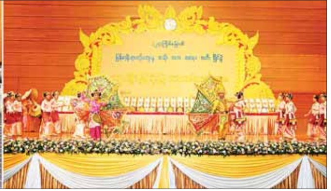
နိုင်ငံတော်စီမံအုပ်ချုပ်ရေးကောင်စီဥက္ကဋ္ဌ နိုင်ငံတော်ဝန်ကြီးချုပ် ဗိုလ်ချုပ်မှူးကြီး မင်းအောင်လှိုင်နှင့် ဇနီး ဒေါ်ကြူကြူလှနှင့် အဖွဲ့ဝင်များ ရှမ်းတိုင်းရင်းသားရိုးရာအကအဖွဲ့က ရှမ်းရိုးရာအကဖြင့် စုပေါင်းကပြ ဖျော်ဖြေတင်ဆက်မှုကို ကြည့်ရှုအားပေးကြစဉ်။

စာမျက်နှာ ၄ မှ ဇာတိမာန်နှင့် မျိုးချစ်စိတ်များ အစဉ်ထာဝရ ရှင်သန်နိုးကြား ထက်မြက်နေစေရန် စသည့် ရည်ရွယ်ချက်များနှင့် မြန်မာ့ရိုးရာ ယဉ်ကျေးမှု အဆို၊ အက၊ အရေး၊ အတီးပြိုင်ပွဲကြီးများကို ၁၉၉၃ ခုနှစ်မှစတင်ပြီး ၂၀၁၆ ခုနှစ်အထိ (၂၂)ကြိမ်တိုင် ကျင်းပခဲ့ပါကြောင်း။ မင်္ဂလာရွှေကျင်းပနိုင်ခဲ့ ထို့နောက် ငါးနှစ်ကျော်ကာလ ရပ်တန့်ခဲ့ရသည့် မြန်မာ့ရိုးရာ ယဉ်ကျေးမှု အဆို၊ အက၊ အရေး၊ အတီးပြိုင်ပွဲကြီးကို နိုင်ငံတော်စီမံ အုပ်ချုပ်ရေးကောင်စီ အစိုးရ လက်ထက် ၂၀၂၂ ခုနှစ်တွင် (၂၃) ကြိမ်မြောက် ပြိုင်ပွဲကြီးအဖြစ် ပြန်လည်စတင် ကျင်းပခဲ့ပါ ကြောင်း။ ယခုနှစ်ဆိုပါက ဒုတိယ မြောက်အဆင့်ဖြင့် (၂၄)ကြိမ်အဖြစ် အောင်မြင်စွာကျင်းပခဲ့ပြီး ဖြစ်ပါ ကြောင်း။ ထို့ကြောင့် ယခုလို ကောင်းမြတ်သည့် အချိန်အခါ သမယတွင် ဆုချီးမြှင့်ပွဲ အခမ်း အနားကို မင်္ဂလာရွှေကျင်းပနိုင် ခဲ့ခြင်း ဖြစ်ပါကြောင်း။ ၂၀၂၂ ခုနှစ်တွင် (၂၃) ကြိမ် မြောက်အဖြစ် ပြန်လည်ကျင်းပရာ