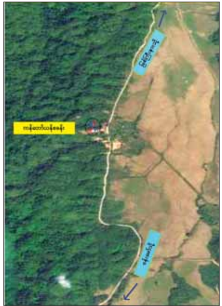
KIA နှင့် ပူးပေါင်းအင်အားစုများ အင်အားအလုံးအရင်းဖြင့် လာရောက်တိုက်ခိုက်ခဲ့သည့် ကန်တော်ယန်လုံခြုံရေးစခန်း နေရာပြပုံ

အဆိုပါနေရာသည် နယ်စပ်နှင့် နီးကပ်သည့်နေရာဖြစ်၍ အိမ်နီးချင်း နိုင်ငံသို့ မလွှဲမသွားသော ဆောင်ရွက်ရမည့်ကိစ္စရပ်အား ကြိုတင်အသိပေးဆောင်ရွက်ခြင်းအပြင် ထိန်းထိန်းသိမ်းသိမ်းဖြင့် ကန်သတ်တုံ့ပြန်တိုက်ခိုက်ခြင်းများ ဆောင်ရွက်ခဲ့သည်။ ဆက်လက်၍လည်း ပြည်သူ့လူထုနှင့်ပတ်သက်၍ နေ့စဉ်ယူကိစ္စထိပါးစေသော အကြမ်းဖက်လုပ်ရပ်များ ထပ်မံဆောင်ရွက်လာပါက လိုအပ်သောပြန်လည်တုံ့ပြန်မှုများ ဆောင်ရွက်သွားမည်ဖြစ်ကြောင်း သတင်းရရှိသည်။ သတင်းစဉ်