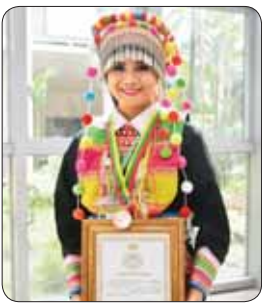
မဇော်မဆီး