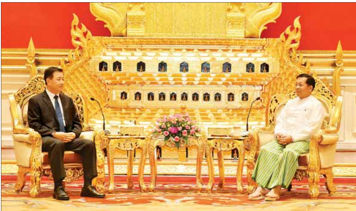
နိုင်ငံတော်စီမံအုပ်ချုပ်ရေးကောင်စီဥက္ကဋ္ဌ နိုင်ငံတော်ဝန်ကြီးချုပ် ဗိုလ်ချုပ်မှူးကြီး မင်းအောင်လှိုင် တရုတ်ပြည်သူ့သမ္မတနိုင်ငံ ကွန်မြူနစ်ပါတီဗဟိုကော်မတီ၏ အတွင်းရေးမှူးချုပ်ရုံး အဖွဲ့ဝင်၊ နိုင်ငံတော်ကောင်စီဝင်နှင့် ပြည်သူ့လုံခြုံရေးဝန်ကြီး H.E. Mr. Wang Xiaohong အား လက်ခံတွေ့ဆုံပွဲ။

နေပြည်တော် အောက်တိုဘာ ၃၁ နိုင်ငံတော် စီမံအုပ်ချုပ်ရေး ကောင်စီဥက္ကဋ္ဌ နိုင်ငံတော် ဝန်ကြီးချုပ် ဗိုလ်ချုပ်မှူးကြီး မင်းအောင်လှိုင်သည် တရုတ် ပြည်သူ့သမ္မတနိုင်ငံ ကွန်မြူနစ် ပါတီဗဟိုကော်မတီ၏ အတွင်းရေး မှူးချုပ်ရုံး အဖွဲ့ဝင်၊ နိုင်ငံတော် ကောင်စီဝင်နှင့် ပြည်သူ့လုံခြုံရေး ဝန်ကြီး H.E. Mr. Wang Xiaohong ဦးဆောင်သော ကိုယ်စားလှယ် အဖွဲ့ကို ယနေ့နံနက်ပိုင်းတွင် နေပြည်တော်ရှိ နိုင်ငံတော်စီမံ အုပ်ချုပ်ရေးကောင်စီ ဥက္ကဋ္ဌရုံး သံတမန်ဆောင် ဧည့်ခန်းမ၌ လက်ခံတွေ့ဆုံသည်။ အဆိုပါတွေ့ဆုံပွဲ၌ နိုင်ငံတော် စီမံအုပ်ချုပ်ရေးကောင်စီ ဥက္ကဋ္ဌ နိုင်ငံတော်ဝန်ကြီးချုပ်နှင့် အတူ ကောင်စီတွဲဖက်အတွင်းရေးမှူး ဒုတိယဗိုလ်ချုပ်ကြီး ရဲဝင်းဦး၊ ကောင်စီဝင်နှင့် ပြည်ထဲရေး ဝန်ကြီးဌာန ပြည်ထောင်စု ဝန်ကြီး ဒုတိယဗိုလ်ချုပ်ကြီး ရာပြည့် လူဝင်မှုကြီးကြပ်ရေးနှင့် စောမျက်နှာ ၃ ကော်လံ ၁ ခု