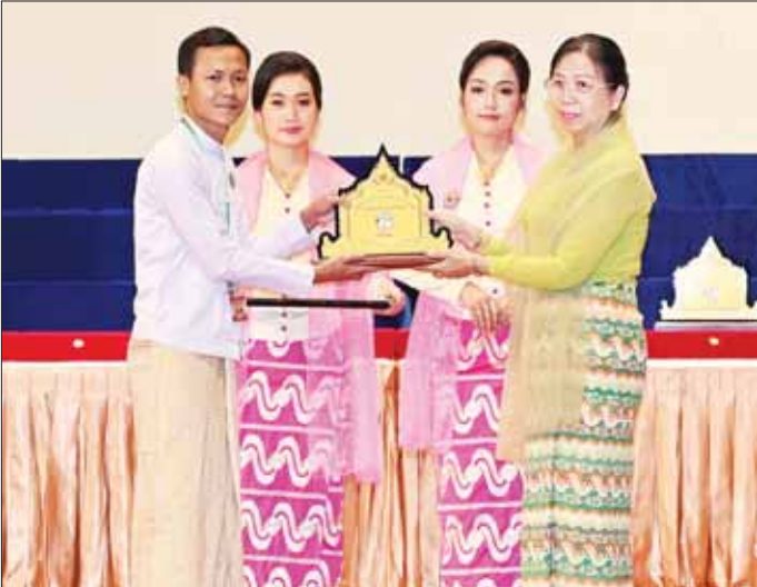
နိုင်ငံတော်စီမံအုပ်ချုပ်ရေးကောင်စီဥက္ကဋ္ဌ နိုင်ငံတော်ဝန်ကြီးချုပ်၏ ဇနီး ဒေါ်ကြူကြူလှ ရုပ်စုံသဘင် အဖွဲ့အလိုက်ပြိုင်ပွဲ ဝါသနာရှင်အဆင့် (ပထမတန်း) ပြိုင်ပွဲတွင် ပထမဆုရရှိသည့် ရန်ကုန်တိုင်းဒေသကြီး ကိုယ်စားပြု တော်ဝင်ရုပ်စုံအဆင့်မြင့်သဘင်အဖွဲ့အား ဂုဏ်ပြုဆုတံဆိပ် ပေးအပ်ချီးမြှင့်စဉ်။

“ယနေ့ အချိန်အခါတွင် နိုင်ငံတော် စီမံအုပ်ချုပ် ရေးကောင်စီအစိုးရအနေ ဖြင့် အနာဂတ် နိုင်ငံတော် အတွက် တည်ငြိမ်အေးချမ်း မှု တိုင်းရင်းသား အချင်း ချင်း ချစ်ကြည်သွေးစည်းမှု နိုင်ငံသားများ၏လူမှုစီးပွား ဖွံ့ဖြိုးတိုးတက်ရေးတို့ကို ဘက်ပေါင်းစုံက ကြိုးပမ်း ဆောင်ရွက်လျက်ရှိ။ နိုင်ငံ တော်၏ သားကောင်း ရတနာ၊ သမီးကောင်း ရတနာ မျိုးဆက်သစ်များ ဖြစ်လာစေရန် ပြုစု ပျိုးထောင်ပေးလျက်ရှိ”