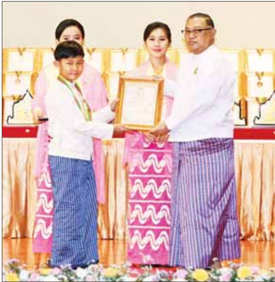
နိုင်ငံတော်စီမံအုပ်ချုပ်ရေးကောင်စီအဖွဲ့ဝင် ဦးဝဏ္ဏမောင်လွင် မဟာဂီတ အဆိုပြိုင်ပွဲ အခြေခံပညာအဆင့်(အသက် ၁၅နှစ်မှ ၂၀နှစ်အတွင်း) ပြိုင်ပွဲ၌ ဆုရရှိသူ တစ်ဦးအား ဂုဏ်ပြုမှတ်တမ်းလွှာ ပေးအပ်စဉ်။

အနုပညာရပ်များ ဆက်လက် ထွန်းကား ပြန့်ပွားလာသည်နှင့်အမျှ လူငယ်များ၏ စိတ်ပိုင်းနှင့်ဆိုင်ရာများတွင် အမျိုးသားရေးလမ်းကြောင်းမှန်အတိုင်း ဖွံ့ဖြိုးတိုးတက်စေရေး အတွက် အထောက်အကူပြုနိုင်မည်ဖြစ်ပြီး အမျိုးသားရေး ကိုယ်စီစွမ်းအားများ မြင့်မားလာမည်ဖြစ်သည်ကို ပြောကြားလိုပါကြောင်း။