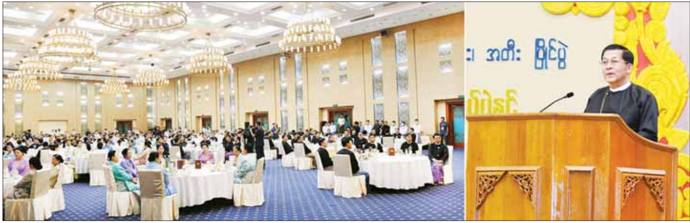
နိုင်ငံတော်စီမံအုပ်ချုပ်ရေးကောင်စီဥက္ကဋ္ဌ နိုင်ငံတော်ဝန်ကြီးချုပ် ဗိုလ်ချုပ်မှူးကြီး မင်းအောင်လှိုင် (၂၄) ကြိမ်မြောက် မြန်မာ့ရိုးရာယဉ်ကျေးမှု အဆို၊ အက၊ အရေး၊ အတီးပြိုင်ပွဲ ဂုဏ်ပြုမှတ်တမ်းလွှာပေးအပ်ပွဲနှင့် ဂုဏ်ပြုညစာစားပွဲအခမ်းအနားတွင် ဂုဏ်ပြုအမှာစကားပြောကြားစဉ်။