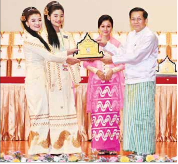
နိုင်ငံတော်စီမံအုပ်ချုပ်ရေးကောင်စီဥက္ကဋ္ဌ နိုင်ငံတော်ဝန်ကြီးချုပ် ဗိုလ်ချုပ်မှူးကြီး မင်းအောင်လှိုင် မန္တလေးတိုင်းဒေသကြီးမှ ယဉ်ကျေးမှုအကအဖွဲ့ကို ဂုဏ်ပြုဆုပေးအပ်ချီးမြှင့်စဉ်။

တိုင်းရင်းသားညီအစ်ကို မောင်နှမ များ၊ တိုင်းဒေသကြီးနှင့် ပြည်နယ် များမှ ရိုးရာယဉ်ကျေးမှုအက အဖွဲ့များနှင့် တာဝန်ရှိသူများ တက်ရောက်ကြသည်။ ဦးစွာ နိုင်ငံတော်စီမံအုပ်ချုပ် ရေးကောင်စီဥက္ကဋ္ဌ နိုင်ငံတော် ဝန်ကြီးချုပ်က အမှာစကား ပြောကြားရာတွင် (၂၄) ကြိမ် မြောက် မြန်မာ့ရိုးရာယဉ်ကျေးမှု အဆို၊ အက၊ အရေး၊ အတီးပြိုင်ပွဲ ကြီးကို မူလထားရှိသည့် ရည်မှန်း ချက်အတိုင်း ခမ်းခမ်းနားနား တည်ထည်ဝါဝါ ပြည့်ပြည့်စုံစုံဖြင့် အောင်မြင်စွာ ကျင်းပပြီးစီးခဲ့ပြီဖြစ် ပါကြောင်း၊ အမျိုးသားယဉ်ကျေး မှု အမွေအနှစ်များကို ထိန်းသိမ်း စောင့်ရှောက် မြှင့်တင်ခြင်းဖြင့် တိုင်းရင်းသားညီအစ်ကို မောင်နှမ များအကြား သွေးစည်းချစ်ကြည်မှု ပိုမိုရရှိအောင် ကြိုးစားနိုင်ကြပါ စေကြောင်းနှင့် ရရှိပြီးဖြစ်သည့် ချစ်ကြည်ရင်းနှီးမှုကို အခြေခံပြီး အမျိုးဂုဏ်၊ ဇာတိဂုဏ်၊ နိုင်ငံ့ဂုဏ် ကို မြှင့်မားအောင် ကြိုးပမ်း စွမ်းဆောင်နိုင်သူများဖြစ်ကြပါစေ ကြောင်း ဆုမွန်ကောင်းတောင်း ရင်း နှုတ်ခွန်းဆက်သပါကြောင်း။ အလွန်နက်နဲ သိမ်မွေ့ပြီး အဆင့်အတန်း မြင့်မားလှသည့် မြန်မာ့ရိုးရာယဉ်ကျေးမှု အနုပညာ ရပ်များကို ဖော်ထုတ်ထိန်းသိမ်း ခြင်းနှင့်အတူ မျိုးဆက်သစ်လူငယ် မောင်မယ်များအကြားတွင် ရိုးရာ ယဉ်ကျေးမှုကို မြတ်နိုးလေးစား လာကြစေရန်၊ မိမိနိုင်ငံ မိမိလူမျိုး ၏ အကျိုးစီးပွားကို ကာကွယ် စောင့်ရှောက် မြှင့်တင်လိုသည့် စာမျက်နှာ ၅ သို့