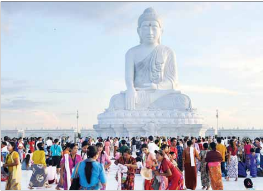
မာရဝိဇယဗုဒ္ဓရုပ်ပွားတော်မြတ်ကြီးသို့ အနယ်နယ်အရပ်ရပ်မှ လာရောက်ဖူးမြော်ကြည်ညိုကြသည့် ရဟန်း၊ ရှင်လူဘုရားဖူးပြည်သူများအား တွေ့ရစဉ်။

ယင်းနောက် ယာယီရှင်းလင်း ဆောင်ရွက် ဘုရားဂေါပကအဖွဲ့မှ တာဝန်ရှိသူတစ်ဦးက မာရဝိဇယ ရုပ်ပွားတော်မြတ်ကြီး နှင့် သာသနိက အဆောက်အအုံများ တည်ထား ကိုးကွယ်မှုဆိုင်ရာ