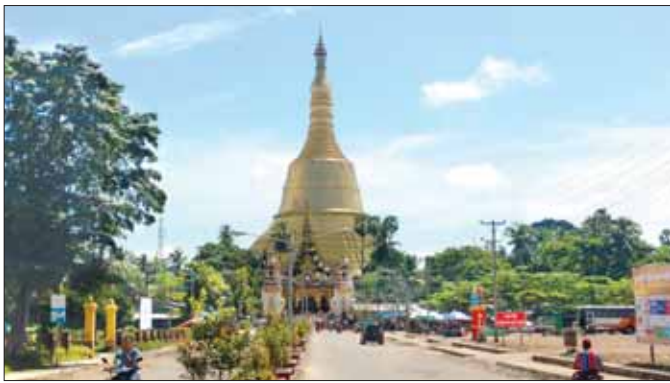
ရွှေမော်ခေတ်စေတီမြတ်ကြီး

“ဟံသာဝတီခေတ် လူမှုဘဝတွေကို ဒီခုံးလမ်းကြောင်းနဲ့ တာတိုင်ဘုရားတွေက တစ်ဆင့် လေ့လာကြည့်လိုလည်း ရပါတယ်။ ဒါပေမယ့် ခေတ်ကာလက ရွေ့လျားလာတာကြာပြီဖြစ်တဲ့ အတွက် ထင်ထင်ရှားရှားရှိတဲ့ အရာတွေလည်း ရှိသလို သေချာအောင်ထပ်ပြီး ဆန်းစစ်ဖို့လိုတဲ့ အရာတွေလည်း ရှိပါတယ်။ ဒီခုံးလမ်းကြောင်းနဲ့ တာတိုင်ဘုရားတွေကို တစ်မတော်က တာဝန်ရှိသူတွေ၊ တာဝန်ခိုင်ရာဌာနတွေက တာဝန်ရှိသူတို့ ပူးပေါင်းပြီး အခုနှစ် မေလတုန်းက ကွင်းဆင်း သုတေသနပြုလုပ်ခဲ့ကြပါတယ်” ဟု ပဲခူးတိုင်းဒေသကြီး ရှေးဟောင်းသုတေသနနှင့် အမျိုးသား