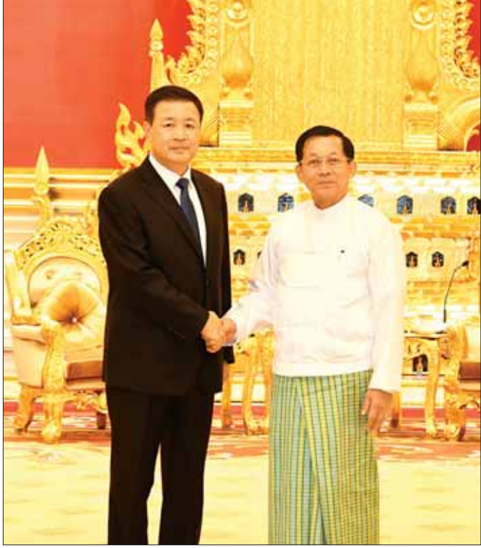
နိုင်ငံတော်စီမံအုပ်ချုပ်ရေးကောင်စီဥက္ကဋ္ဌ နိုင်ငံတော်ဝန်ကြီးချုပ် ဗိုလ်ချုပ်မှူးကြီး မင်းအောင်လှိုင် တရုတ်ပြည်သူ့သမ္မတနိုင်ငံ ကွန်မြူနစ်ပါတီဗဟိုကော်မတီ၏ အတွင်းရေးမှူးချုပ်ရုံး အဖွဲ့ဝင်၊ နိုင်ငံတော်ကောင်စီဝင်နှင့် ပြည်သူ့လုံခြုံရေးဝန်ကြီး H.E. Mr. Wang Xiaohong အား ရင်းရင်းနှီးနှီးနှုတ်ဆက်စဉ်။

ဆွေးနွေး ရှမ်းပြည်နယ် မြောက်ပိုင်းဒေသသည် မြန်မာနိုင်ငံ လွတ်လပ်ရေး ရရှိပြီးချိန်ကတည်းက တိုင်းရင်းသားအဖွဲ့များ ချင်းအားဖြင့်ဖြစ်ပေါ်ကာ တိုင်းရင်းသား လက်နက်ကိုင်ပဋိပက္ခများဖြစ်ပေါ်ခဲ့မှု၊ အချို့တိုင်းရင်းသား လက်နက်ကိုင်အဖွဲ့များအနေဖြင့် အဆိုပါဒေသအတွင်း မူးယစ်ဆေးဝါးများ ထုတ်လုပ်ရောင်းချလျက်ရှိမှု၊ ကိုးကန့်ဒေသအတွင်း “ဖန်” / “ရန်” အဖွဲ့တို့ အရေးအခင်း ဖြစ်ပွားခဲ့မှု၊ “ပယ်” အဖွဲ့အား တာဝန်ပေးအပ်ခဲ့မှု၊ အာဏာရလိုမှု၊ လက်နက်ခဲယမ်းများ ထုတ်လုပ်နေမှု၊ လက်နက်ခဲယမ်းများ ဝင်ရောက်မှုများကြောင့် ဒေသတွင်းနှင့် နယ်စပ်ဒေသ တည်ငြိမ်အေးချမ်းရေးကို ထိခိုက်ပျက်စီးစေလျက်ရှိမှု၊ နယ်စပ်ဒေသတွင် တရားမဝင်အွန်လိုင်းလောင်းကစားမှုများနှင့် ဆက်သွယ်ရေး လိမ်လည်မှုများ