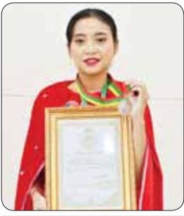
မအေးမြတ်မွန်