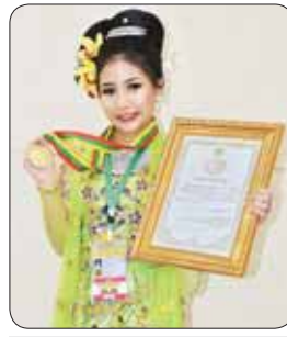
မဆောင်းလင်းနွယ်