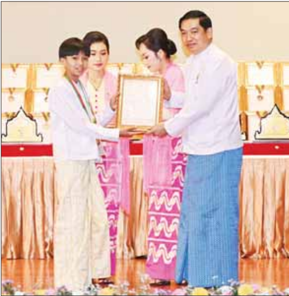
နိုင်ငံတော်စီမံအုပ်ချုပ်ရေးကောင်စီအဖွဲ့ဝင် ဒုတိယဗိုလ်ချုပ်ကြီး ညိုစော မဟာဂီတ အဆိုပြိုင်ပွဲ အခြေခံပညာအဆင့်(အသက် ၁၅နှစ်မှ ၂၀နှစ်အတွင်း) ပြိုင်ပွဲ၌ ဆုရရှိသူ တစ်ဦးအား ဂုဏ်ပြုမှတ်တမ်းလွှာ ပေးအပ်စဉ်။