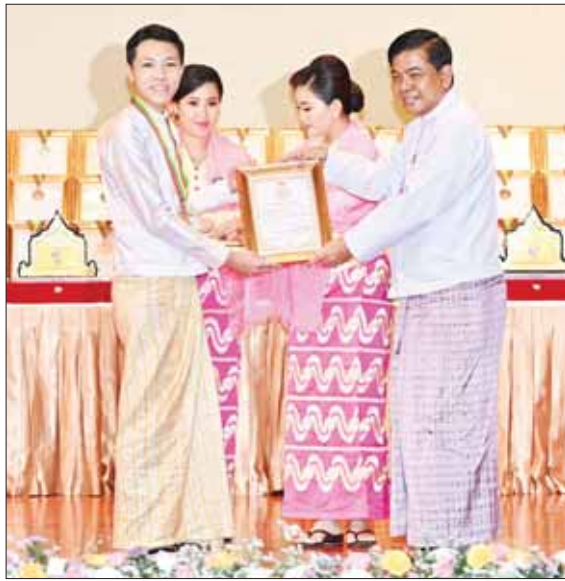
နိုင်ငံတော်စီမံအုပ်ချုပ်ရေးကောင်စီအဖွဲ့ဝင် ဗိုလ်ချုပ်ကြီး မောင်မောင်အေး မဟာဂီတ အဆိုပြိုင်ပွဲ ဝါသနာရှင်အဆင့်(ဒုတိယတန်း)ပြိုင်ပွဲ၌ ဆုရရှိသူ တစ်ဦးအား ဂုဏ်ပြုမှတ်တမ်းလွှာ ပေးအပ်စဉ်။