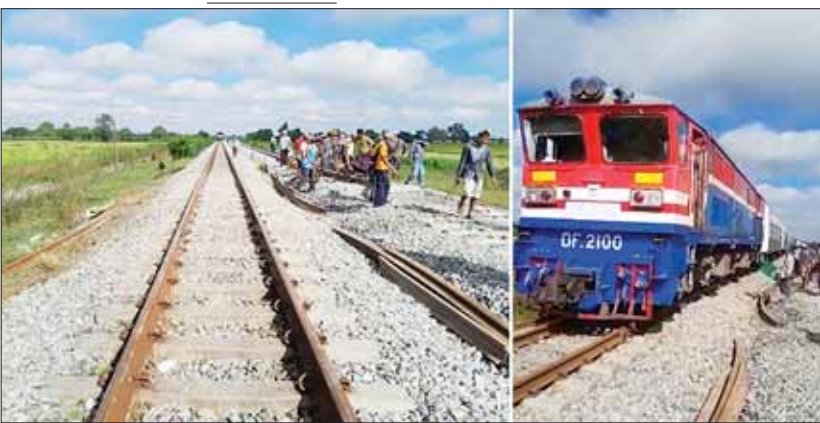
ရထားလမ်းအား ပြန်လည်ပြုပြင်ပြီး၍ လူစီးအမြန်ရထားများ ပုံမှန်ပြန်လည်ပြေးဆွဲနေသည်ကို တွေ့ရစဉ်။

ရွာသားကြီး ခရီးစဉ်ပြေးဆွဲလျက်ရှိသည့် ကုန်သေတ္တာရထား နှစ်စင်းတိုက်လည်း ပြန်တန်ဆာဘူတာနှင့် အိမ်ခြေလေးဆယ် ဘူတာတို့၌ ခေတ္တရပ်နားထားခဲ့ရသည်။ ပုံမှန်ပြန်လည်ပြေးဆွဲ ဖြစ်စဉ်ဖြစ်ပွားရာနေရာသို့ ဌာန ဆိုင်ရာ တာဝန်ရှိသူများ၊ လုံခြုံရေး တပ်ဖွဲ့ဝင်များက အချိန်နှင့်တစ်ပြေးညီ သွားရောက်စစ်ဆေးခြင်း၊ မြန်မာ့မီးရထား ဝန်ထမ်းများကလည်း ပျက်စီးသွားသော ရထားလမ်းအား ပြန်လည်မွမ်းမံပြုပြင် ခြင်းတို့ကို ဆောင်ရွက်ခဲ့ရာ နံနက် ၈ နာရီ ခန့်တွင် ပြီးစီးခဲ့သဖြင့် ခေတ္တရပ်နားထား ရသော ရထားများ ပုံမှန်ပြန်လည်ပြေးဆွဲ လျက်ရှိသည်။