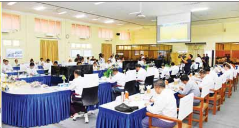
နိုင်ငံတော်စီမံအုပ်ချုပ်ရေးကောင်စီ ဒုတိယဥက္ကဋ္ဌ ဒုတိယဝန်ကြီးချုပ် ဒုတိယဗိုလ်ချုပ်မှူးကြီး စိုးဝင်း အသေးစား၊ အငယ်စားနှင့် အလတ်စားစီးပွားရေးလုပ်ငန်းများ ဖွံ့ဖြိုးတိုးတက်ရေး လုပ်ငန်းကော်မတီအစည်းအဝေး (၂/ ၂၀၂၃) တွင် အမှာစကားပြောကြားစဉ်။

နေပြည်တော် အောက်တိုဘာ ၂၅ အသေးစား၊ အငယ်စားနှင့် အလတ်စား စီးပွားရေးလုပ်ငန်းများ ဖွံ့ဖြိုး တိုးတက်ရေးလုပ်ငန်းကော်မတီ အစည်းအဝေး (၂/၂၀၂၃) ကို ယနေ့ မွန်းလွဲပိုင်းတွင် နေပြည်တော်ရှိ စက်မှုဝန်ကြီးဌာန အစည်းအဝေး ခန်းမ၌ ကျင်းပရာ အသေးစား၊ အငယ်စားနှင့် အလတ်စား စီးပွား ရေးလုပ်ငန်းများ ဖွံ့ဖြိုးတိုးတက် ရေး လုပ်ငန်းကော်မတီဥက္ကဋ္ဌ နိုင်ငံ တော် စီမံအုပ်ချုပ်ရေးကောင်စီ ဒုတိယဥက္ကဋ္ဌ ဒုတိယဝန်ကြီးချုပ် ဒုတိယဗိုလ်ချုပ်မှူးကြီး စိုးဝင်း တက်ရောက် အမှာစကား ပြောကြားသည်။ စာမျက်နှာ ၅ ကော်လံ ၁ ❖