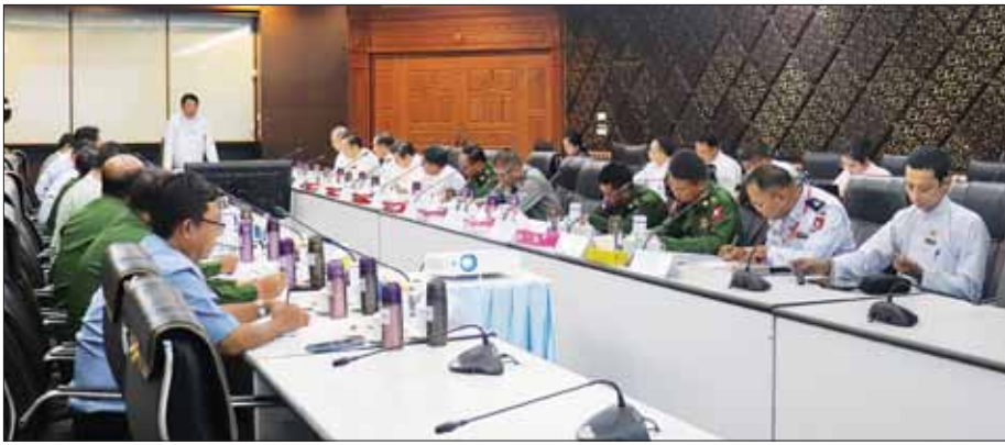
ဝန်ကြီးဌာန၊ လုပ်ငန်းအဖွဲ့များမှ ဝန်ကြီးက အဖွဲ့အစည်းအဝေးတွင် ဒုတိယ ဝန်ကြီးချုပ်နှင့် ပြည်ထောင်စု များမှ တာဝန်ရှိသူများ တက် ရောက်ခဲ့ကြသည်။ အစည်းအဝေးတွင် ဒုတိယ ဝန်ကြီးချုပ်နှင့် ပြည်ထောင်စု အဖွဲ့အစည်းအဝေးသို့ တက်ရောက် လာကြသူများ (၇၆) နှစ်မြောက် လွတ်လပ်ရေးနေ့ ညွှန်ပွဲနှင့် ညစာစားပွဲအောင်မြင်စွာ ကျင်းပ

နေပြည်တော် အောက်တိုဘာ ၂၅ ၂၀၂၄ ခုနှစ် (၇၆) နှစ်မြောက် လွတ်လပ်ရေး နေ့ ညွှန်ပွဲနှင့် ညစာစားပွဲ အခမ်းအနား အောင်မြင်စွာ ကျင်းပနိုင်ရေး အတွက် လွတ်လပ်ရေးနေ့ ညွှန်ပွဲ ပွဲနှင့် ညစာစားပွဲ ကျင်းပရေး ဆပ်ကော်မတီ ပထမအကြိမ် ညှိနှိုင်းအစည်းအဝေးကို ယနေ့ မုန်လုံ ၃ နာရီတွင် နိုင်ငံခြားရေး ဝန်ကြီးဌာန၌ ကျင်းပသည်။ အစည်းအဝေးကို လွတ်လပ် ရေးနေ့ ညွှန်ပွဲနှင့် ညစာစားပွဲ ကျင်းပရေး ဆပ်ကော်မတီဥက္ကဋ္ဌ ဒုတိယဝန်ကြီးချုပ်နှင့် နိုင်ငံခြား ရေးဝန်ကြီးဌာန ပြည်ထောင်စု ဝန်ကြီးဦးသန်းဆွေဆပ်ကော်မတီ