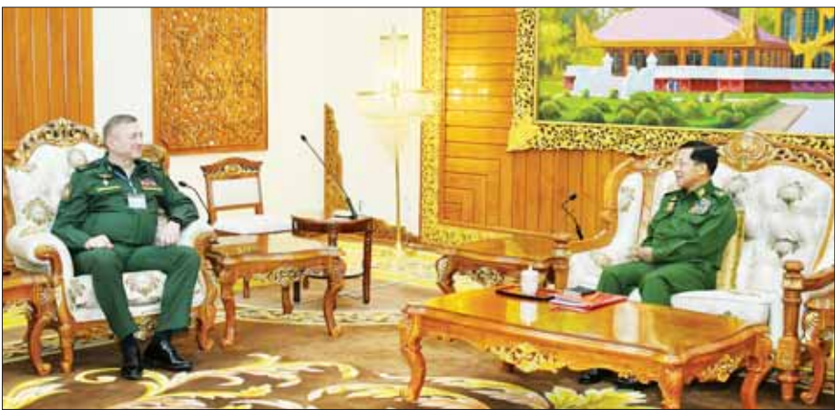
နိုင်ငံတော်စီမံအုပ်ချုပ်ရေးကောင်စီဥက္ကဋ္ဌ တပ်မတော်ကာကွယ်ရေးဦးစီးချုပ် ဗိုလ်ချုပ်မှူးကြီး မင်းအောင်လှိုင် ရုရှားဖက်ဒရေးရှင်းနိုင်ငံ စစ်ဘက်ဆိုင်ရာတက္ကသိုလ် ကျောင်းအုပ်ကြီး ဒုတိယဗိုလ်ချုပ်ကြီး အီဂေါမီ ရှူသ်ကင် (Lieutenant General Igor MISHUTKIN) အား လက်ခံတွေ့ဆုံသည်။

မိမိတို့ ကိုယ်စားလှယ်အဖွဲ့အား လိုက်လံလှုံ့ဆွေးဆွေးစွာ ကြိုဆိုသည့် အတွက် အထူးပင် ကျေးဇူးတင်ရှိပါကြောင်း၊ မိမိတို့ ရုရှားဖက်ဒရေးရှင်းနိုင်ငံ စစ်ဘက်ဆိုင်ရာတက္ကသိုလ်မှ အဆွေတော် နိုင်ငံတော်စီမံအုပ်ချုပ်ရေးကောင်စီဥက္ကဋ္ဌ တပ်မတော်ကာကွယ်ရေးဦးစီးချုပ်အား နှစ်နိုင်ငံ တပ်မတော်နှစ်ရပ်အကြား ဆက်ဆံရေး တိုးတက်ခိုင်မာအောင် ဆောင်ရွက်နိုင်မှု၊ စစ်ဘက်နည်းပညာဆိုင်ရာ ဖွံ့ဖြိုးတိုးတက်စေရေး ပူးပေါင်းဆောင်ရွက်မှု၊ ပညာတော်သင် သင်တန်းသားများ စေလွှတ်ခြင်းဖြင့် နှစ်နိုင်ငံ တပ်မတော်နှင့် အစိုးရနှစ်ရပ်အကြား ချစ်ကြည်ရင်းနှီးမှုကို တိုးတက်ခိုင်မာအောင် စွမ်းဆောင်နိုင်မှုတို့ကြောင့် ရုရှားဖက်ဒရေးရှင်းနိုင်ငံ စစ်ဘက်ဆိုင်ရာတက္ကသိုလ် (Military University of Defence Ministry) ၏ “ဂုဏ်ထူးဆောင် ပါမောက္ခ” ဘွဲ့ (Honorary Professor of the Russian Military University) ကို ရုရှားဖက်ဒရေးရှင်းနိုင်ငံ၊ စစ်ဘက်ဆိုင်ရာတက္ကသိုလ်မှ ဘုတ်အဖွဲ့များ၏ ဆုံးဖြတ်ချက်အရ ၂၀၂၁ ခုနှစ်၊ ဇွန်လ ၂၃ ရက်တွင် ချီးမြှင့်