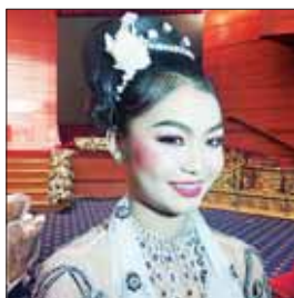
မနန်းနန္ဒာချမ်းမြေ့