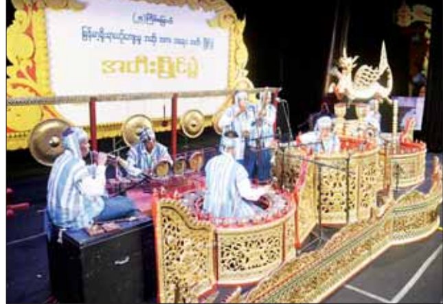
ဝါသနာရှင်အဆင့် (ပထမတန်း) အမျိုးသား ဆိုင်းရိုင်းကြီးအဖွဲ့လိုက်အတီးပြိုင်ပွဲတွင် ကရင် ပြည်နယ်အဖွဲ့၏ မြိုင်မြိုင်ဆိုင်ဆိုင် ယဉ်ပြိုင်တီးဝါးတော်မူ။

အဆာပြေအစားအစာဆိုင်၊ ဆံသဆိုင်၊ အလှပြင်ဆိုင်နှင့်ဗဟုသုတရေးရာ စာအုပ် ဆိုင်များကိုလည်း ဖွင့်လှစ်ရောင်းချပေး လျက်ရှိသည်။