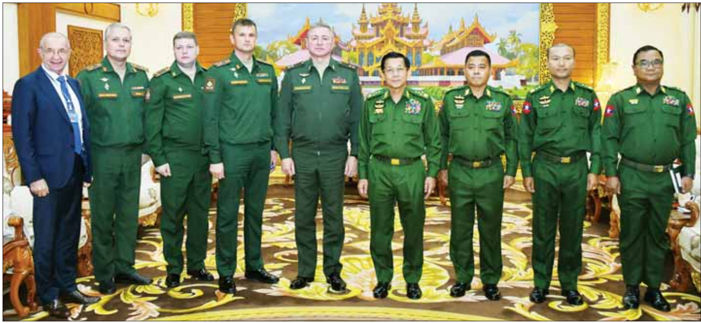
နိုင်ငံတော်စီမံအုပ်ချုပ်ရေးကောင်စီဥက္ကဋ္ဌ တပ်မတော်ကာကွယ်ရေးဦးစီးချုပ် ဗိုလ်ချုပ်မှူးကြီး မင်းအောင်လှိုင်နှင့် အဖွဲ့ဝင်များ ရုရှားဖက်ဒရေးရှင်းနိုင်ငံ စစ်ဘက်ဆိုင်ရာတက္ကသိုလ် ကျောင်းအုပ်ကြီး ဒုတိယဗိုလ်ချုပ်ကြီး အီဂေါမီ ရှူသ်ကင် (Lieutenant General Igor MISHUTKIN) ဦးဆောင်သောအဖွဲ့နှင့်အတူ စုပေါင်းမှတ်တမ်းတင် ဓာတ်ပုံရိုက်စဉ်။