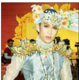
မောင်လင်းညီညီခန့်