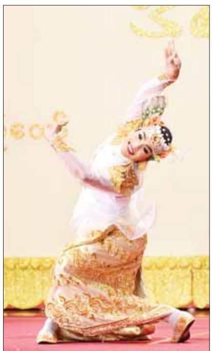
ဝါသနာရှင်အဆင့်(ဒုတိယတန်း) အမျိုးသား အကပြိုင်ပွဲတွင် မန္တလေးတိုင်းဒေသကြီးမှ ပြိုင်ပွဲဝင်၏ ကပြယှဉ်ပြိုင်ပွဲပာနီ။