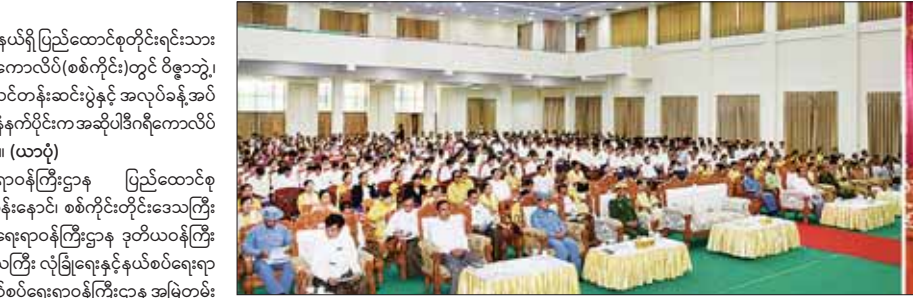
လူငယ်များ ထဲထဲဝင်ဝင်ပိုင်ဆိုင်ရရှိနိုင်စေရန်နှင့် ထူးချွန်ထက်မြက် သော လူ့စွမ်းအားအရင်းအမြစ်များ မွေးထုတ်ပေးနိုင်ရေးအတွက် ပြည်ထောင်စုတိုင်းရင်းသားလူမျိုးများ ဖွံ့ဖြိုးရေးတက္ကသိုလ် (စစ်ကိုင်း) နှင့် ပြည်ထောင်စုတိုင်းရင်းသားလူငယ်များ စွမ်းရည်ဖွံ့ဖြိုးရေး ဒီဂရီ ကောလိပ်(ရန်ကုန်၊ စစ်ကိုင်း)တို့ကို တည်ထောင်ဖွင့်လှစ်သင်ကြား ပေးလျက်ရှိပါကြောင်း၊ ပြည်ထောင်စုတိုင်းရင်းသားလူငယ်များ စွမ်းရည် ဖွံ့ဖြိုးရေး ဒီဂရီကောလိပ်(စစ်ကိုင်း) ကို စတင်ဖွင့်လှစ်သည့်အချိန်မှ ယနေ့ထိ ဝိဇ္ဇာဘွဲ့ ၄၂၁ ဦး၊ သိပ္ပံဘွဲ့ ၇၇၄ ဦး၊ B-Tech ဘွဲ့ ၂၅ ဦး၊ အင်ဂျင် နီယာဒီပလိုမာ ၇၁၈ ဦး စုစုပေါင်း တိုင်းရင်းသားလူငယ် ၂၀၅၂ ဦးတို့ကို ပြုစုပေးပို့ပေးနိုင်ခဲ့ပြီး ၎င်းတို့အနက်မှ မဟာဝိဇ္ဇာဘွဲ့ ၇၈ ဦး၊ မဟာသိပ္ပံဘွဲ့ ၁၈၁ ဦး၊ BE ၇၁၂ ဦး၊ ME ၂၂ ဦး၊ B-Teach ၂၀၇ ဦး၊ ရန်ပုံငွေဖြစ်ပကြောင်း၊ သင်တန်းဆင်းမောင်တို့ မယ်တို့အနေဖြင့် အဆိုပါ အောင်မြင်မှုများကို အတူယူကြီးစားအားထုတ်သွားကြရန် တိုက်တွန်း မှာကြားလိုကြောင်း။

နေပြည်တော် အောက်တိုဘာ ၂၅ စစ်ကိုင်းတိုင်းဒေသကြီး စစ်ကိုင်းမြို့နယ်ရှိ ပြည်ထောင်စုတိုင်းရင်းသား လူငယ်များ စွမ်းရည်ဖွံ့ဖြိုးရေးဒီဂရီကောလိပ်(စစ်ကိုင်း)တွင် ဝိဇ္ဇာဘွဲ့၊ သိပ္ပံဘွဲ့ သင်တန်းအမှတ်စဉ် (၁၆) သင်တန်းဆင်းပွဲနှင့် အလုပ်ခန့်အပ် လွှာပေးအပ်ပွဲအခမ်းအနားကို ယနေ့နံနက်ပိုင်းက အဆိုပါဒီဂရီကောလိပ် တွင် နှင်းသင်္ဘောခန်းမ၌ ကျင်းပသည်။ (ယာဝု) အခမ်းအနားသို့ နယ်စပ်ရေးရာဝန်ကြီးဌာန ပြည်ထောင်စု ဝန်ကြီး ဒုတိယဗိုလ်ချုပ်ကြီး ထွန်းထွန်းနောင်၊ စစ်ကိုင်းတိုင်းဒေသကြီး ဝန်ကြီးချုပ် ဦးမြတ်ကျော်၊ နယ်စပ်ရေးရာဝန်ကြီးဌာန ဒုတိယဝန်ကြီး ဗိုလ်ချုပ်ကြီးသန်း၊ စစ်ကိုင်းတိုင်းဒေသကြီး လုံခြုံရေးနှင့်နယ်စပ်ရေးရာ ဝန်ကြီး ဗိုလ်မှူးကြီး ဝင်းတင်စိုး၊ နယ်စပ်ရေးရာဝန်ကြီးဌာန အမြဲတမ်း အတွင်းဝန်နှင့် ဌာနဆိုင်ရာအကြီးအကဲများ၊ အထူးဖိတ်ကြားထားသော ဧည့်သည်တော်များ၊ အလုပ်ခန့်အပ်လွှာပေးအပ်ပွဲ ဝန်ကြီးဌာနများမှ ကိုယ်စားလှယ်များ၊ ပြည်ထောင်စုတိုင်းရင်းသားလူငယ်များ စွမ်းရည် ဖွံ့ဖြိုးရေးဒီဂရီကောလိပ် (စစ်ကိုင်း)ကျောင်းအုပ်ကြီး၊ ဒုတိယကျောင်းအုပ် ကြီး၊ ညွှန်ကြားရေးမှူးများ၊ ပါမောက္ခ/ဌာနမှူးများ၊ ဆရာ ဆရာမများ၊ ဝန်ထမ်းများ၊ ကျောင်းသား ကျောင်းသူများနှင့် ၎င်းတို့၏ မိဘဆွေမျိုး များ တက်ရောက်ခဲ့ကြသည်။