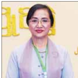
အေးခိုင်ဝါ