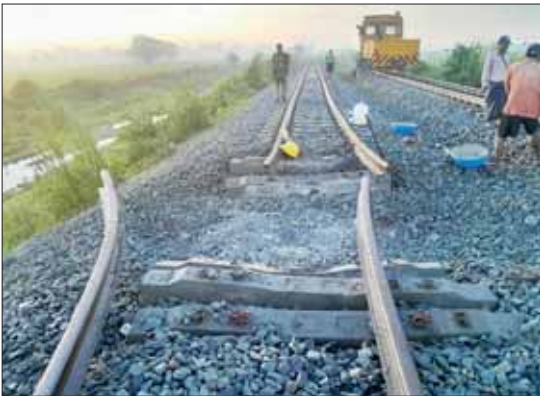
PDF အမည်ခံအကြမ်းဖက်သမားများ မိုင်ထောင်ဖောက်ခွဲမှုကြောင့် ပျက်စီးခဲ့သည့် သူဌေးကုန်းနှင့် ပိန်းလုပ် ဘူတာအကြား ရထားလမ်း။

နေပြည်တော် အောက်တိုဘာ ၂၅ ပို့ဆောင်ရေးနှင့် ဆက်သွယ်ရေးဝန်ကြီး ဌာန၊ မြန်မာ့မီးရထားအနေဖြင့် အများ ပြည်သူရုံးပိတ်ရက်နှင့် ကျောင်းပိတ်ရက် များဖြစ်သည့် သီတင်းကျွတ်ပွဲတော် ကာလအတွင်း ရထားစီးခရီးသွားပြည်သူ များ အဆင်ပြေစွာ သွားလာနိုင်ရေး အတွက် ပုံမှန်ပြေးဆွဲလျက်ရှိသည့် ရထား များအပြင် ရန်ကုန် - နေပြည်တော်၊ ရန်ကုန် - မန္တလေး၊ ရန်ကုန်-ပြည်နှင့် ရန်ကုန်-ပုဂံ အထူးရထားများကို ပြေးဆွဲ ပေးသွားမည်ဖြစ်ကြောင်း သတင်း ထုတ်ပြန်ခဲ့ပြီးဖြစ်သည်။