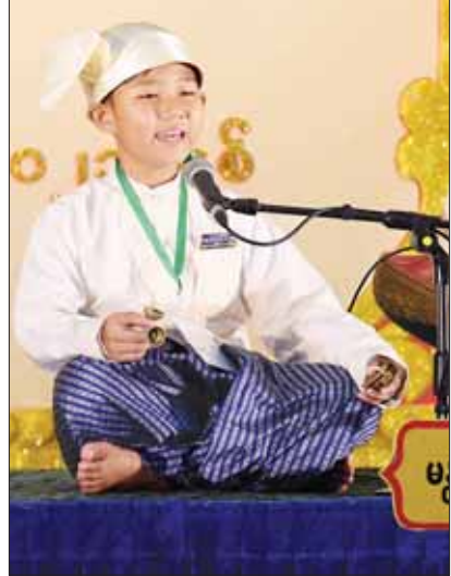
အခြေခံပညာအဆင့် (အသက် ၁၀ နှစ်မှ ၁၅ နှစ်အတွင်း) အမျိုးသား မဟာဂီတတေးသီချင်းပြိုင်ပွဲတွင် မန္တလေးတိုင်း ဒေသကြီးမှ ပြိုင်ပွဲဝင်၏ သီဆိုယှဉ်ပြိုင်ပွဲ။