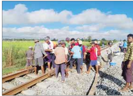
PDF အမည်ခံအကြမ်းဖက်သမားများ မိုင်ခွဲဖျက်ဆီးမှုကြောင့် ပျက်စီးသွားသည့် ရထားလမ်းအား မြန်မာ့မီးရထားဝန်ထမ်းများက ပြန်လည်ပြင်ဆင်နေစဉ်။

မြန်မာ့မီးရထားအနေဖြင့် နေ့စဉ် လူစီးရထားများ၊ ကုန်ရထားများကို ပုံမှန် ပြေးဆွဲလျက်ရှိရာတွင် အောက်တိုဘာ ၂၄ ရက် ည ၁ နာရီ မိနစ် ၅၀ ခန့်တွင် ရန်ကုန်-မန္တလေး ရထားလမ်းပိုင်း၊ ပဲခူးတိုင်းဒေသကြီး ကျောက်တံခါးမြို့နယ် သူဌေးကုန်းဘူတာနှင့် ပိန်းလုပ်ဘူတာ အကြား မိုင်တိုင်အမှတ်၊ ၁၀၄/၀-၁ ကြား တံတားအမှတ် (၁၄၆) နှင့် (၁၄၇) အနီး၌ ရထားလမ်းများအား PDF အမည်ခံ အကြမ်းဖက်သမားများက မိုင်ခွဲဖျက်ဆီး မှုကို ထပ်မံကျူးလွန်ခဲ့သဖြင့် ရထား ပြေးဆွဲနေသော အဆန်ရထားလမ်းနှင့် ပြန်လည်အဆင့်မြှင့် တင်ဆောက်နေ သော အစုန်ရထားလမ်းတို့တွင် တပ်ဆင် ထားသည့် သံလမ်းသစ်များ တစ်ပေခွဲစီ ခန့် ပြတ်တောက်၍ လေးပေခန့် ကွေးကောက်ပျက်စီးခြင်းနှင့် ကွန်ကရစ် ဇလီဖားတုံးများ ပျက်စီးခဲ့သည်။