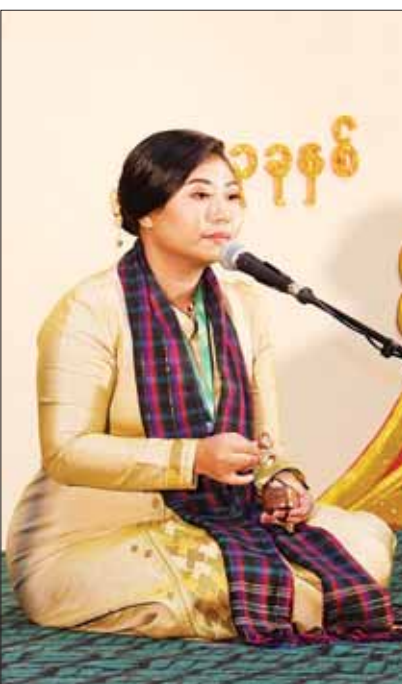
ဝါသနာရှင်အဆင့် (ပထမတန်း) အမျိုးသမီး ကာလပေါ်တေး သီချင်းပြိုင်ပွဲတွင် ကချင်ပြည်နယ်မှ ပြိုင်ပွဲဝင်၏ သီဆိုယှဉ်ပြိုင်မှု။

ဆိုးစည်အတီးပြိုင်ပွဲကို အမျိုးသားစာကြည့်တိုက်(နေပြည်တော်)ရှိ ဝန်ဇင်းမင်းရာဇာဓိပတိကျင်းပရာ ဝါသနာရှင်အဆင့် (ပထမတန်း) အမျိုးသားပြိုင်ပွဲတွင် မွန်ပြည်နယ်၊ ကရင်ပြည်နယ်၊ ပဲခူးတိုင်းဒေသကြီး၊ စစ်ကိုင်းတိုင်းဒေသကြီး၊ မန္တလေးတိုင်းဒေသကြီး၊ ဧရာဝတီတိုင်းဒေသကြီးနှင့် မကွေးတိုင်းဒေသကြီးတို့မှ ပြိုင်ပွဲဝင်များကလည်းကောင်း၊ အခြေခံပညာအဆင့် (အသက် ၁၅ နှစ်မှ ၂၀ နှစ်အတွင်း) အမျိုးသားပြိုင်ပွဲတွင် ရှမ်းပြည်နယ်၊ ရန်ကုန်တိုင်းဒေသကြီး၊ ပဲခူးတိုင်းဒေသကြီး၊ မန္တလေးတိုင်းဒေသကြီး၊ စစ်ကိုင်းတိုင်းဒေသကြီး၊ ဧရာဝတီတိုင်းဒေသကြီးနှင့် မကွေးတိုင်းဒေသကြီးတို့မှ ပြိုင်ပွဲဝင်များက လည်းကောင်း၊ ဝါသနာရှင်အဆင့် (ဒုတိယတန်း) အမျိုး