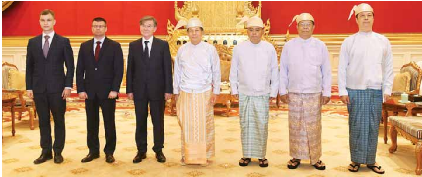
နိုင်ငံတော်စီမံအုပ်ချုပ်ရေးကောင်စီဥက္ကဋ္ဌ နိုင်ငံတော်ဝန်ကြီးချုပ် ဗိုလ်ချုပ်မှူးကြီး မင်းအောင်လှိုင်နှင့် အဖွဲ့ဝင်များ မြန်မာနိုင်ငံဆိုင်ရာ ရုရှားဖက်ဒရေရှင်းနိုင်ငံ သံအမတ်ကြီး H.E. Mr. Iskander Azizov အဖွဲ့နှင့် စုပေါင်းမှတ်တမ်းတင် ဓာတ်ပုံရိုက်စဉ်။