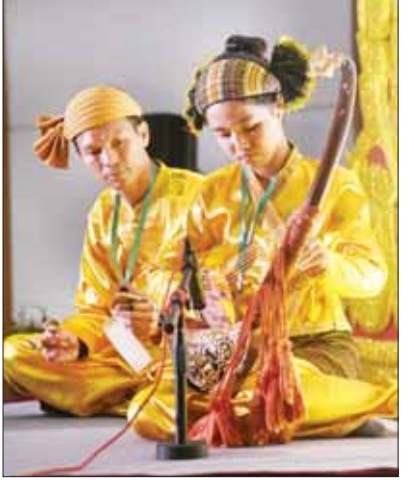
အခြေခံပညာအဆင့် (အသက် ၁၅ နှစ်မှ ၂၀ နှစ်အတွင်း) စောင်းအတီးပြိုင်ပွဲတွင် ရှမ်းပြည်နယ်မှ ပြိုင်ပွဲဝင်၏ ယှဉ်ပြိုင် တီးခတ်ပွဲ။