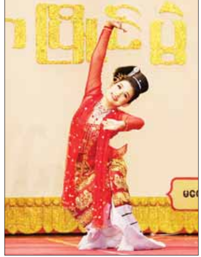
အဆင့်မြင့်ပညာအဆင့် အမျိုးသမီး အကပြိုင်ပွဲတွင် မကွေးတိုင်းဒေသကြီးမှ ပြိုင်ပွဲဝင်၏ ကပြယှဉ်ပြိုင်ပွဲ။

ခွဲကျင်းပရာ ဝါသနာရှင်အဆင့် (ဒုတိယ တန်း) အမျိုးသမီးပြိုင်ပွဲတွင် စစ်ကိုင်း တိုင်းဒေသကြီး၊ မကွေးတိုင်းဒေသကြီး၊ တနင်္သာရီတိုင်းဒေသကြီး၊ ပဲခူးတိုင်းဒေသ ကြီး၊ ကယားပြည်နယ်၊ ကရင်ပြည်နယ်၊ ရှမ်းပြည်နယ်၊ ကချင်ပြည်နယ်၊ မန္တလေး တိုင်းဒေသကြီး၊ ဧရာဝတီတိုင်းဒေသကြီး၊ ရခိုင်ပြည်နယ်၊ မွန်ပြည်နယ်နှင့် ရန်ကုန် တိုင်းဒေသကြီးတို့မှ ပြိုင်ပွဲဝင်များက “သောင်းရွှေလယ်” (ယိုးဒယား) သီချင်း ဖြင့် လည်းကောင်း၊ အခြေခံပညာအဆင့် (အသက် ၁၀ နှစ်မှ ၁၅ နှစ်အတွင်း) အမျိုးသားပြိုင်ပွဲတွင် ရှမ်းပြည်နယ်၊ ပဲခူး တိုင်းဒေသကြီး၊ ရန်ကုန်တိုင်းဒေသကြီး၊ ကချင်ပြည်နယ်၊ ဧရာဝတီတိုင်းဒေသကြီး၊ မကွေးတိုင်းဒေသကြီး၊ မန္တလေးတိုင်း ဒေသကြီး၊ ကရင်ပြည်နယ်၊ တနင်္သာရီတိုင်း ဒေသကြီး၊ ချင်းပြည်နယ်၊ စစ်ကိုင်းတိုင်း ဒေသကြီးနှင့် မွန်ပြည်နယ်တို့မှ ပြိုင်ပွဲဝင် များက “ဇေယျာအောင်သံ” (ပတ်ပျိုး) သီချင်းဖြင့် လည်းကောင်း ယှဉ်ပြိုင်