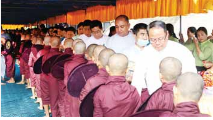
အားပေးပြီး ဆွမ်းဆန်စိမ်းလောင်းလှူပွဲသို့ ကြွရောက် သို့လည်း သုံးရက်တိုင်တိုင် ဆွမ်းဆန်တော်အလှူခံ ချီးမြှင့်တော်မူသော ဆရာတော်၊ သံဃာတော်၊ ကြွရောက်ချီးမြှင့်ခဲ့ကြကြောင်း သိရသည်။ သာမဏေ၊ သီလရှင်များသည် မြို့ပေါ်ရပ်ကွက်များ စောမျိုးမင်းသိန်း(ပြန်/ဆက်)

ဆွမ်းဆန်တော်အလှူခံ ထိုသို့ ဆွမ်းဆန်တော်လောင်းလှူနေမှုအား ပြည်နယ်ဝန်ကြီးချုပ်နှင့်အဖွဲ့က လှည့်လည်ကြည့်ရှု