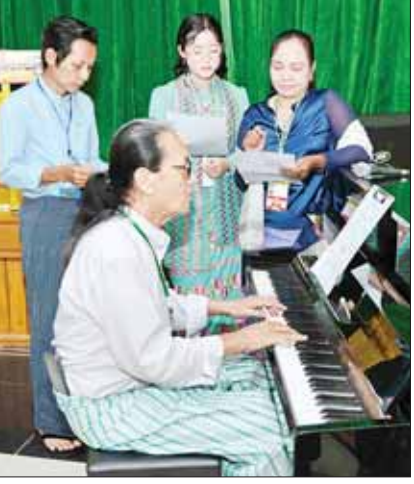
အခြေခံပညာအဆင့် (အသက် ၁၅ နှစ်မှ ၂၀ နှစ်အတွင်း) အရေးပြိုင်ပွဲတွင် ရန်ကုန်တိုင်းဒေသကြီးမှ ပြိုင်ပွဲဝင်၏ သီချင်း သံစဉ် ထည့်သွင်းလေ့ကျင့်သီဆိုပွဲ။

တိုင်းဒေသကြီး၊ ကရင်ပြည်နယ်၊ စစ်ကိုင်း တိုင်းဒေသကြီး၊ ပဲခူးတိုင်းဒေသကြီး၊ ကချင်ပြည်နယ်၊ တနင်္သာရီတိုင်းဒေသကြီး၊ ရှမ်းပြည်နယ်၊ မန္တလေးတိုင်းဒေသကြီး၊ ရန်ကုန်တိုင်းဒေသကြီး၊ မွန်ပြည်နယ်၊ ရခိုင်ပြည်နယ်၊ ကယားပြည်နယ်နှင့် မကွေးတိုင်းဒေသကြီးတို့မှ ပြိုင်ပွဲဝင်များ က “လူချွန်လူကောင်း” သီချင်းဖြင့် လည်း ကောင်း၊ ဝါသနာရှင်အဆင့်(ပထမတန်း) အမျိုးသမီးပြိုင်ပွဲတွင် ဧရာဝတီတိုင်းဒေသ ကြီး၊ ရန်ကုန်တိုင်းဒေသကြီး၊ ပဲခူးတိုင်း ဒေသကြီး၊ ရခိုင်ပြည်နယ်၊ စစ်ကိုင်းတိုင်း ဒေသကြီး၊ မန္တလေးတိုင်းဒေသကြီး၊ မကွေးတိုင်းဒေသကြီးနှင့် ကချင်ပြည်နယ် တို့မှ ပြိုင်ပွဲဝင်များက “ပျံသန်းရမည့်နေ့” သီချင်းဖြင့်လည်းကောင်း၊ အဆင့်မြင့် ပညာအဆင့် အမျိုးသားပြိုင်ပွဲတွင် စစ်ကိုင်းတိုင်းဒေသကြီး၊ ရှမ်းပြည်နယ်၊ မန္တလေးတိုင်းဒေသကြီး၊ မွန်ပြည်နယ်၊ ရခိုင်ပြည်နယ်၊ ရန်ကုန်တိုင်းဒေသကြီး၊ ဧရာဝတီတိုင်းဒေသကြီး၊ ကချင်ပြည်နယ်၊