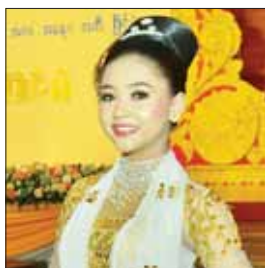
မနန်းထက်ထက်အောင်