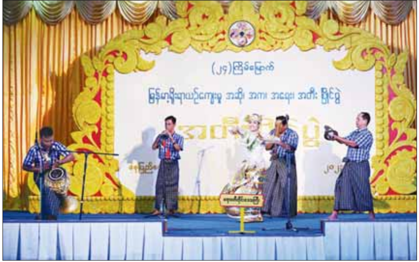
ဝါသနာရှင်အဆင့် (ပထမတန်း) အမျိုးသား ဆိုးစည်အတီးပြိုင်ပွဲတွင် ဧရာဝတီတိုင်းဒေသကြီးအဖွဲ့၏ တီးမှုတ်ယှဉ်ပြိုင်မှု။

ဒေသကြီးနှင့် ရခိုင်ပြည်နယ်တို့မှ ပြိုင်ပွဲဝင်များက “ကန္တာတောခြေ” (ယိုးဒယား) သီချင်းဖြင့်လည်းကောင်း တီးခတ်ယှဉ်ပြိုင်ကြသည်။