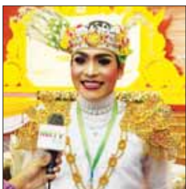
မောင်တိုးပွားအောင်