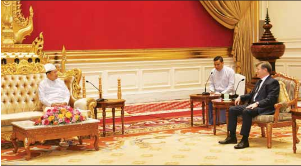
နိုင်ငံတော်စီမံအုပ်ချုပ်ရေးကောင်စီဥက္ကဋ္ဌ နိုင်ငံတော်ဝန်ကြီးချုပ် ဗိုလ်ချုပ်မှူးကြီး မင်းအောင်လှိုင်နှင့် မြန်မာနိုင်ငံဆိုင်ရာ ရုရှားဖက်ဒရေရှင်းနိုင်ငံ သံအမတ်ကြီး H.E. Mr. Iskander Azizov တို့ ရင်းရင်းနှီးနှီး တွေ့ဆုံဆွေးနွေးစဉ်။

တွေ့ဆုံပွဲအပြီးတွင် နိုင်ငံတော်စီမံအုပ်ချုပ်ရေး ကောင်စီဥက္ကဋ္ဌ နိုင်ငံတော်ဝန်ကြီးချုပ်နှင့် မြန်မာ နိုင်ငံဆိုင်ရာ ရုရှားဖက်ဒရေရှင်းနိုင်ငံ သံအမတ်ကြီး တို့သည် စုပေါင်းမှတ်တမ်းတင် ဓာတ်ပုံရိုက်ကြသည်။ အဆိုပါ သံအမတ်ခန့်အပ်လွှာ ပေးအပ်ပွဲသို့ ကောင်စီတွဲဖက် အတွင်းရေးမှူး ဒုတိယဗိုလ်ချုပ် ကြီး ရဲဝင်းဦး၊ ဒုတိယဝန်ကြီးချုပ်နှင့် နိုင်ငံခြားရေး ဝန်ကြီးဌာန ပြည်ထောင်စုဝန်ကြီး ဦးသန်းဆွေနှင့် သံတမန်ရေးရာဦးစီးဌာန ညွှန်ကြားရေးမှူးချုပ် ဦးဝဏ္ဏဟန်တို့ တက်ရောက်ခဲ့ကြောင်း သတင်း ရရှိသည်။ သတင်းစဉ်