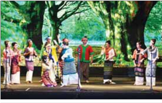
ပြည်ထောင်စုအဆင့်ပုဂ္ဂိုလ်များ ဇာတ်တော်ကြီးအဖွဲ့လိုက် ဝါသနာရှင်အဆင့် (ပထမတန်း) ပြိုင်ပွဲ မဟော်သမာဇာတ်တော်ကြီးတွင် ရန်ကုန်တိုင်းဒေသကြီး ကိုယ်စားပြု မဟော်သမာဇာတ်တော်ကြီးအဖွဲ့၏ ဆို၊ ငို၊ ပြော ရသမြောက်ယှဉ်ပြိုင်ပွဲကို ကြည့်ရှုအေးပေးစဉ်။

ယနေ့တွင် “မဟာဂီတ”တေးသီချင်း အဆိုပြိုင်ပွဲကို မြန်မာအပြည်ပြည်ဆိုင်ရာ ကွန်ဗင်းရှင်း ဗဟိုဌာန (၂) Banquet Hall