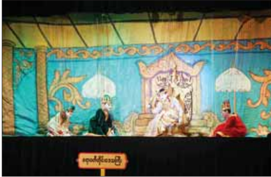
ပြည်ထောင်စုအဆင့်ပုဂံတိုင်းဒေသကြီးများ ရုပ်စုံသဘင်အဖွဲ့လိုက် ဝါသနာရှင်အဆင့် (ပထမတန်း) ပြိုင်ပွဲတွင် “ပညာရွှေအိုး” ဇာတ်တော်ကြီးဖြင့် ဧရာဝတီတိုင်းဒေသကြီး ကိုယ်စားပြု ဧရာလှိုင်းရုပ်စုံသဘင်အဖွဲ့၏ တင်ဆက်ကပြယှဉ်ပြိုင်နေမှုကို ကြည့်ရှုအားပေးစဉ်။

ဝါသနာရှင်အဆင့်(ဒုတိယတန်း) အမျိုးသားပြိုင်ပွဲတွင် ပဲခူးတိုင်းဒေသကြီး၊ ရန်ကုန်တိုင်းဒေသကြီး၊ ကချင်ပြည်နယ်၊ မကွေးတိုင်းဒေသကြီး၊ မန္တလေးတိုင်းဒေသကြီး၊ စစ်ကိုင်းတိုင်းဒေသကြီး၊ ဧရာဝတီတိုင်းဒေသကြီးနှင့် မွန်ပြည်နယ်တို့မှ ပြိုင်ပွဲဝင်များက “ဒီပီအေအိမ်”(ပတ်ပျိုး) သီချင်းဖြင့် လည်းကောင်း၊ ဝါသနာရှင်အဆင့်(ဒုတိယတန်း) အမျိုးသမီးပြိုင်ပွဲတွင် ရန်ကုန်တိုင်းဒေသကြီးနှင့် တနင်္သာရီတိုင်းဒေသကြီးတို့မှ ပြိုင်ပွဲဝင်များက “နန်းသီရိဋ္ဌ”(ယိုးဒယား) သီချင်းဖြင့် လည်းကောင်း၊ အခြေခံပညာအဆင့် (အသက် ၁၀ နှစ်မှ ၁၅ နှစ်အတွင်း) အမျိုးသားပြိုင်ပွဲတွင် ရန်ကုန်တိုင်းဒေသကြီး၊ ဧရာဝတီတိုင်းဒေသကြီး၊ ကရင်ပြည်နယ်၊ ပဲခူးတိုင်းဒေသကြီး၊ မွန်ပြည်နယ်၊ မန္တလေးတိုင်းဒေသကြီး၊ ကချင်ပြည်နယ်၊ မကွေးတိုင်းဒေသကြီး၊ ရှမ်းပြည်နယ်၊ စစ်ကိုင်းတိုင်း