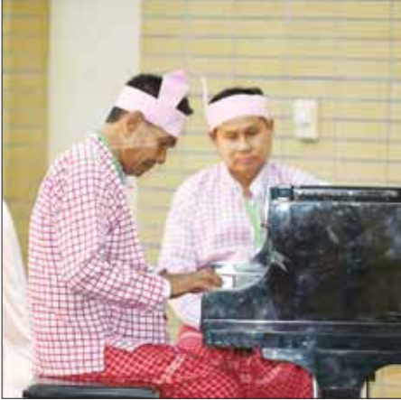
ဝါသနာရှင်အဆင့် (ဒုတိယတန်း) အမျိုးသား စန္ဒရားအတီးပြိုင်ပွဲတွင် မွန်ပြည်နယ်မှ ပြိုင်ပွဲဝင်၏ ဝါးတံယဉ်ပြိုင်ပွဲ။

(၂၄) ကြိမ်မြောက် မြန်မာ့ရိုးရာ ယဉ်ကျေးမှု အဆို၊ အက၊ အရေး၊ အတီး ပြိုင်ပွဲကျင်းပရေးလုပ်ငန်းများနှင့် ပြိုင်ပွဲ ဝင်များ အဆင်ပြေချောမွေ့စေရေးအတွက် အထောက်အကူပြုဆောင်ရွက်ပေးမှုများကို ဖွဲ့စည်း၍ ပြိုင်ပွဲဝင်များ၊ နည်းပြများနှင့် အုပ်ချုပ်သူများ၏ သွားလာရေး၊ တည်းခို နေထိုင်ရေး၊ စည်းခံကျွေးမွေးရေး၊ ကျန်းမာ ရေး၊ ပြိုင်ပွဲနှင့်သက်ဆိုင်သည့် သတင်း အချက်အလက်ရရှိရေးနှင့် လုံခြုံရေးဆိုင်ရာ ကိစ္စရပ်များကို ဖြည့်ဆည်းဆောင်ရွက်ပေး လျက်ရှိသည့်အပြင် လူသားကျန်ပစ္စည်းဆိုင်ရာ