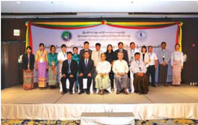
မြန်မာနိုင်ငံမဟာဗျူဟာနှင့် နိုင်ငံတကာလေ့လာရေးအဖွဲ့နှင့် တရုတ်ပြည်သူ့သမ္မတနိုင်ငံ ယူနန်တက္ကသိုလ်ရှိ မြန်မာ့ရေးရာလေ့လာရေးဌာနတို့ပူးပေါင်း၍ စာတမ်းဖတ်ပွဲတစ်ရပ်ကို ၂၀၂၃ ခုနှစ် စက်တင်ဘာ ၂၀ ရက်တွင် ရန်ကုန်မြို့ရှိ Lotte Hotel ၌ ကျင်းပစဉ်။

သုတေသနစာတမ်းဖတ်ပွဲ ပြုလုပ်ခြင်း မြန်မာနိုင်ငံမဟာဗျူဟာနှင့် နိုင်ငံတကာလေ့လာရေး အဖွဲ့ (Myanmar Institute of Strategic and International Studies-MISIS) နှင့် တရုတ်ပြည်သူ့သမ္မတနိုင်ငံ ယူနန်တက္ကသိုလ်ရှိ မြန်မာ့ရေးရာလေ့လာရေးဌာနတို့ပူးပေါင်း၍ မြန်မာနိုင်ငံနှင့် တရုတ်နိုင်ငံတို့မှ သုတေသနပညာရှင်များ အကြား စာတမ်းဖတ်ပွဲတစ်ရပ်ကို ၂၀၂၃ ခုနှစ် စက်တင်ဘာလ ၂၀ ရက်နေ့တွင် ရန်ကုန်မြို့၊ Lotte Hotel ၌ လူကိုယ်တိုင်ဖြင့်လည်းကောင်း၊ အွန်လိုင်း စနစ်ဖြင့်လည်းကောင်း ပါဝင်သည့် Hybrid Format ဖြင့် ကျင်းပခဲ့ပါသည်။ စာတမ်းဖတ်ပွဲတွင် ပြည်ထောင်စုအစိုးရအဖွဲ့ရုံး ဝန်ကြီးဌာန(၂) ပြည်ထောင်စုဝန်ကြီး ဦးကိုကိုလှိုင် တက်ရောက်၍ အဖွင့်အမှာစကား ပြောကြားခဲ့ပါသည်။