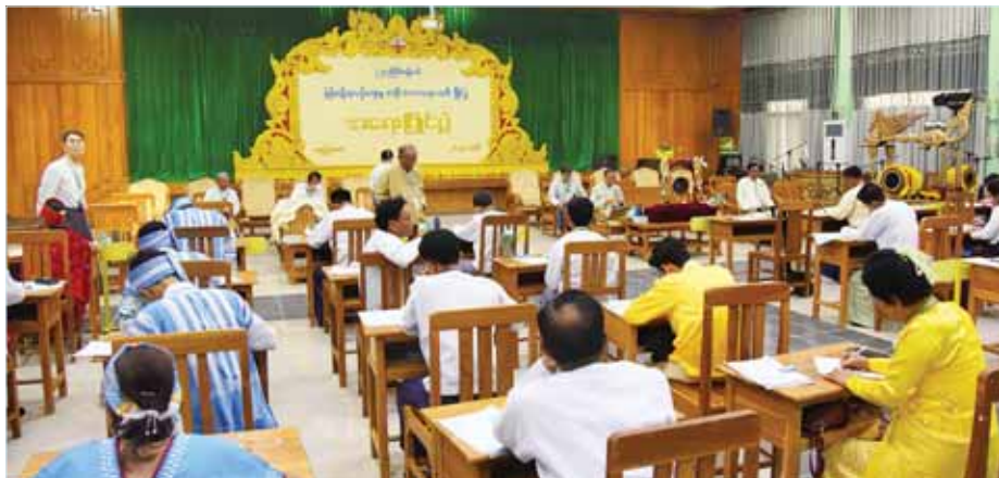
အရေးပြိုင်ပွဲတွင် ပြိုင်ပွဲဝင်များ ၀ါ၀င်ယှဉ်ပြိုင်နေမှုကို တွေ့ရစဉ်။

လာရောက်ကြည့်ရှု အားပေးခဲ့ကြသည်။ အမျိုးသားယဉ်ကျေးမှု အမွေအနှစ်များ၊ မြန်မာ့ရိုးရာ အနုပညာရပ်များကို တိမ်ကောပပျောက်ခြင်း မရှိစေရန်အတွက် နိုင်ငံတော်နှင့် နိုင်ငံသားများ၏ ရေရှည်အကျိုးကို ရည်ရွယ်ပြီး မြန်မာ့ရိုးရာယဉ်ကျေးမှု အဆို၊ အက၊ အရေး၊ အတီးပြိုင်ပွဲကြီးကို ၁၉၉၃ ခုနှစ်က စတင်ကျင်းပခဲ့ရာ ယခုဆိုလျှင် (၂၄) ကြိမ်တိုင် ရောက်ရှိခဲ့ပြီဖြစ်သည်။ မြန်မာ့ရိုးရာ ယဉ်ကျေးမှု အဆို၊ အက၊ အရေး၊ အတီးပြိုင်ပွဲကြီးသည် နိုင်ငံတော်က ဖော်ဆောင်လျက်ရှိသည့် တိုင်းရင်းသားအချင်းချင်း သွေးစည်းညီညွတ်မှုကို အထောက်အကူပြုခြင်း၊ အမျိုးသားယဉ်ကျေးမှု အမွေအနှစ်များ မပျောက်ပျက်စေရေးကို အထောက်အကူပြုခြင်း၊