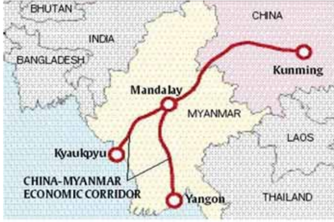
တရုတ်-မြန်မာစီးပွားရေးစင်္ကြံနေရာပြမြေပုံ။