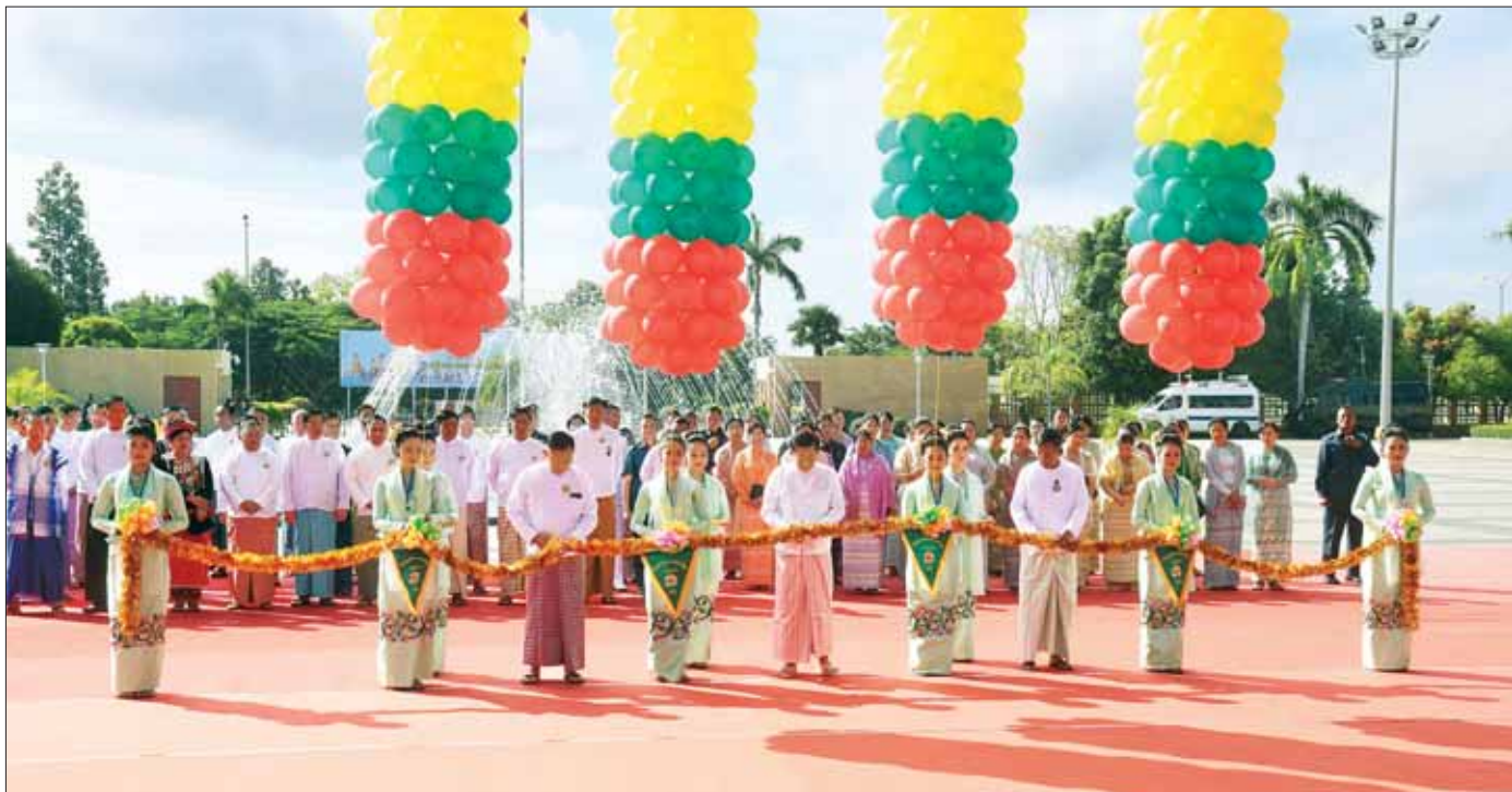
နိုင်ငံတော်စီမံအုပ်ချုပ်ရေးကောင်စီဥက္ကဋ္ဌ နိုင်ငံတော်ဝန်ကြီးချုပ် ဗိုလ်ချုပ်မှူးကြီး မင်းအောင်လှိုင်၊ နိုင်ငံတော်စီမံအုပ်ချုပ်ရေးကောင်စီ ဒုတိယဥက္ကဋ္ဌ ဒုတိယဝန်ကြီးချုပ် ဒုတိယဗိုလ်ချုပ်မှူးကြီး စိုးဝင်းနှင့် ပြည်ထောင်စုဝန်ကြီး ဦးတင်ဦးလွင်တို့က (၂၄) ကြိမ်မြောက် မြန်မာ့ရိုးရာယဉ်ကျေးမှု အဆို၊ အက၊ အရေး၊ အတီး ပြိုင်ပွဲ ဖွင့်ပွဲအခမ်းအနားဆိုင်းဘုတ်ကို ဖဲကြိုးဖြတ်ဖွင့်လှစ်ပေးကြစဉ်။