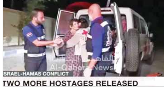
လွှတ်ပေးခဲ့သည်။ သံတမန်များက လူသားချင်း စာနာထောက်ထားမှု အဖြစ် နောက်ထပ်ဓားစာခံများကို ပိုလွှတ်ပေးရန် တောင်းဆိုခဲ့ကြသည်။ နောက်ထပ် အကူအညီပေးရေးယာဉ် ၅၀ ကျော်သည် ဓားစာခံရိက္ခာ၊ ရေနှင့် ဆေးဘက်ဆိုင်ရာထောက်ပံ့ရေး ပစ္စည်းများ တင်ဆောင်လျက် အီဂျစ်နယ်စပ်ကို ဖြတ်ကျော်ပြီး ဂါဇာသို့ စနေနေ့မှ တနင်္လာနေ့အထိ ဝင်ရောက်လာခဲ့သည်။ သို့သော်လည်း ကုလသမဂ္ဂအရာရှိများက ဒေသခံများအတွက် လိုအပ်ချက်များကို ဖြည့်ဆည်းပေးရန် တစ်နေ့လျှင် ကုန်တင်ယာဉ် ၁၀၀ ခန့်လိုအပ်ကြောင်း ပြောသည်။ အင်န်အိတ်ချ်က

ဟားမားစ် စစ်သွေးကြွများသည် အောက်တိုဘာ ၂၃ ရက်က နောက်ထပ် ဓားစာခံ နှစ်ဦးကို လွှတ်ပေးလိုက်သည်။ အစ္စရေး အမျိုးသမီး နှစ်ဦးကို လွှတ်ပေးခဲ့ကြောင်း ၎င်းတို့က လူမှုမီဒီယာပေါ်တွင် ထုတ်ပြန်ဖော်ပြခဲ့သည်။ အီဂျစ်နှင့် ကာတာမှ အစိုးရအရာရှိများသည် ဓားစာခံများ လွှတ်ပေးရန် ညှိနှိုင်းခဲ့ခြင်းဖြစ်ကြောင်း ၎င်းတို့က ပြောသည်။ အပြည်ပြည်ဆိုင်ရာ ကြက်ခြေနီကော်မတီမှ အရာရှိများက ဓားစာခံများကို ဂါဇာမှ ကယ်ထုတ်ရန် ကူညီခဲ့သည်။ စစ်သွေးကြွများသည် နောက်ထပ် ဓားစာခံ ၂၀၀ ကျော်ကို ဖမ်းဆီးခဲ့သည်။ လွန်ခဲ့သော သောကြာနေ့က နောက်ထပ်အမေရိကန်အမျိုးသမီး ဓားစာခံနှစ်ဦးကို