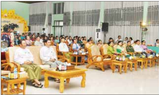
နိုင်ငံတော်စီမံအုပ်ချုပ်ရေးကောင်စီအဖွဲ့ဝင်နှင့်တာဝန်ရှိသူများ၊ ဧည့်ပရိသတ်များ ရုပ်စုံသဘင်အဖွဲ့လိုက် ကိုယ်စားပြု မန္တလေးတိုင်းဒေသကြီးအဖွဲ့ဝင်များနှင့် ဝါသနာရှင်အဆင့် (ပထမတန်း) ပြိုင်ပွဲတွင် မန္တလေးတိုင်းဒေသကြီး

ဒိုးပတ်အတီး ပြိုင်ပွဲကို အမျိုးသား စာကြည့်တိုက် (နေပြည်တော်)ရှိ ဝန်ဇင်းမင်းရာဇာ ခန်းမ၌ ကျင်းပရာ ဝါသနာရှင် အဆင့် (ဒုတိယတန်း) အမျိုးသား ပြိုင်ပွဲတွင် မန္တလေးတိုင်းဒေသကြီး၊ မကွေးတိုင်းဒေသကြီး၊ စစ်ကိုင်းတိုင်းဒေသကြီး၊ ကရင်ပြည်နယ်၊ မွန်ပြည်နယ်၊ ဧရာဝတီတိုင်းဒေသကြီး၊ ရန်ကုန်တိုင်းဒေသကြီးနှင့် ပဲခူးတိုင်းဒေသကြီးတို့မှ ပြိုင်ပွဲဝင်များက လည်းကောင်း၊ အဆင့်မြင့်ပညာအဆင့် အမျိုးသားပြိုင်ပွဲတွင် တနင်္သာရီတိုင်းဒေသကြီး၊ ကယားပြည်နယ်၊ မန္တလေးတိုင်းဒေသကြီးနှင့် ရန်ကုန်တိုင်းဒေသကြီးတို့မှ ပြိုင်ပွဲဝင်များကလည်းကောင်း၊ ဝါသနာရှင်အဆင့် (ပထမတန်း) အမျိုးသား ပြိုင်ပွဲတွင် ဧရာဝတီတိုင်းဒေသကြီး၊ ရန်ကုန်တိုင်းဒေသကြီး၊ မန္တလေးတိုင်းဒေသကြီး၊ ပဲခူးတိုင်းဒေသကြီး၊ မွန်ပြည်နယ်နှင့် ကရင်ပြည်နယ်တို့မှ ပြိုင်ပွဲဝင်များကလည်းကောင်း၊ အခြေခံပညာအဆင့် (အသက် ၁၅ နှစ်မှ ၂၀ နှစ်အတွင်း) အမျိုးသားပြိုင်ပွဲတွင် ကချင်ပြည်နယ်၊ ကယားပြည်နယ်၊ စစ်ကိုင်းတိုင်းဒေသကြီး၊ ပဲခူးတိုင်းဒေသကြီး၊ မကွေးတိုင်းဒေသကြီး၊