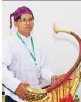
မောင်ချမ်းမင်းနိုင်