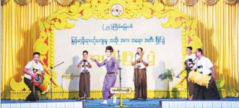
ဝါသနာရှင်အဆင့် (ပထမတန်း) ဒိုးပတ် (အတီး) ပြိုင်ပွဲတွင် ဧရာဝတီတိုင်းဒေသကြီးမှ ပြိုင်ပွဲဝင်များ၏ ယှဉ်ပြိုင်မှု။