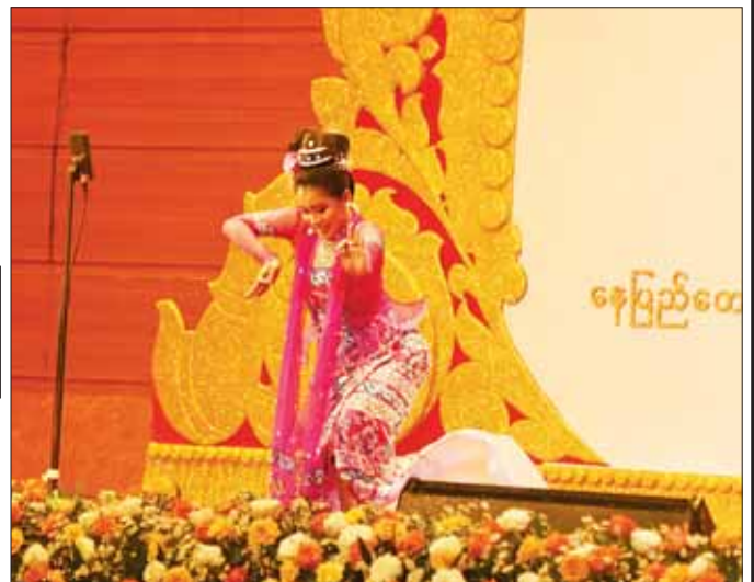
ဝါသနာရှင်အဆင့်(ပထမတန်း) အမျိုးသမီး အကပြိုင်ပွဲတွင် ကရင်ပြည်နယ်မှ မဆုရိပိုင်အောင် ၏ ကပြယှဉ်ပြိုင်ဟန်။