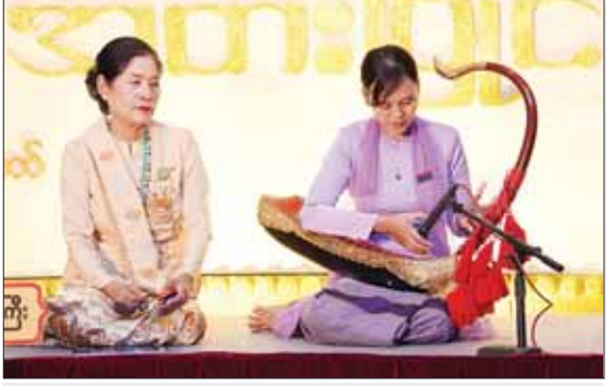
ဝါသနာရှင်အဆင့် (ပထမတန်း) အမျိုးသမီး အတီး (စောင်း) ပြိုင်ပွဲတွင် တနင်္သာရီတိုင်း ဒေသကြီးမှ ပြိုင်ပွဲဝင်၏ ယှဉ်ပြိုင်တီးခတ်မှု။