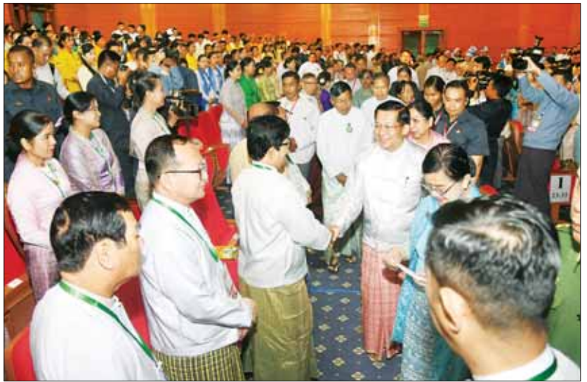
နိုင်ငံတော်စီမံအုပ်ချုပ်ရေးကောင်စီဥက္ကဋ္ဌ နိုင်ငံတော်ဝန်ကြီးချုပ်ဗိုလ်ချုပ်မှူးကြီး မင်းအောင်လှိုင်နှင့်ဇနီး ဒေါ်ကြူကြူလှတို့ အကဲဖြတ်ပညာရှင်များကို ရင်းရင်းနှီးနှီး လိုက်လံနှုတ်ဆက်စဉ်။

ညီအစ်ကိုမောင်နှမများနှင့် တာဝန်ရှိသူများ တက်ရောက်ကြသည်။ ဖဲကြီးဖြတ်ဖွင့်လှစ် ဦးစွာ နိုင်ငံတော်စီမံအုပ်ချုပ်ရေးကောင်စီဥက္ကဋ္ဌ နိုင်ငံတော်ဝန်ကြီးချုပ်ဗိုလ်ချုပ်မှူးကြီး မင်းအောင်လှိုင်၊ ပြိုင်ပွဲကျင်းပရေးဦးစီးကော်မတီ နာယက နိုင်ငံတော်စီမံအုပ်ချုပ်ရေးကောင်စီဒုတိယဥက္ကဋ္ဌ ဒုတိယဝန်ကြီးချုပ် ဒုတိယဗိုလ်ချုပ်မှူးကြီး စိုးဝင်းနှင့် ပြိုင်ပွဲကျင်းပရေးဦးစီးကော်မတီဥက္ကဋ္ဌသာသနာရေးနှင့် ယဉ်ကျေးမှုဝန်ကြီးဌာန ပြည်ထောင်စုဝန်ကြီး ဦးတင်ဦးလွင်တို့က (၂၄) ကြိမ်မြောက် မြန်မာ့ရိုးရာယဉ်ကျေးမှု အဆို၊ အက၊ အရေး၊ အတီး ပြိုင်ပွဲ ဖွင့်ပွဲအခမ်းအနား ဆိုင်းဘုတ်ကို ဖဲကြီးဖြတ်ဖွင့်လှစ်ပေးကြသည်။ အဖွင့်အမှာစကားပြောကြား ထိုနောက် နိုင်ငံတော်စီမံအုပ်ချုပ်ရေးကောင်စီဥက္ကဋ္ဌ နိုင်ငံတော်ဝန်ကြီးချုပ်က အဖွင့်အမှာစကား ပြောကြားရာတွင် ကမ္ဘာ့နိုင်ငံအသီးသီး၌ရှိကြသည့် လူမျိုး