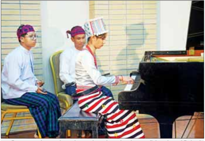
အခြေခံပညာအဆင့် (အသက် ၁၀ နှစ်မှ ၁၅ နှစ်အတွင်း) အမျိုးသမီး စန္ဒရားပြိုင်ပွဲတွင် ကချင်ပြည်နယ် မှ မဆောင်ရနံ့ ယှဉ်ပြိုင်တီးခတ်မှုကို တွေ့ရစဉ်။