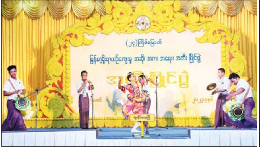
ဝါသနာရှင်(ဒုတိယတန်း) ခိုးပတ်အတီးပြိုင်ပွဲတွင် ပဲခူးတိုင်းဒေသကြီးမှ ပြိုင်ပွဲဝင်များ၏ ယှဉ်ပြိုင်မှု။