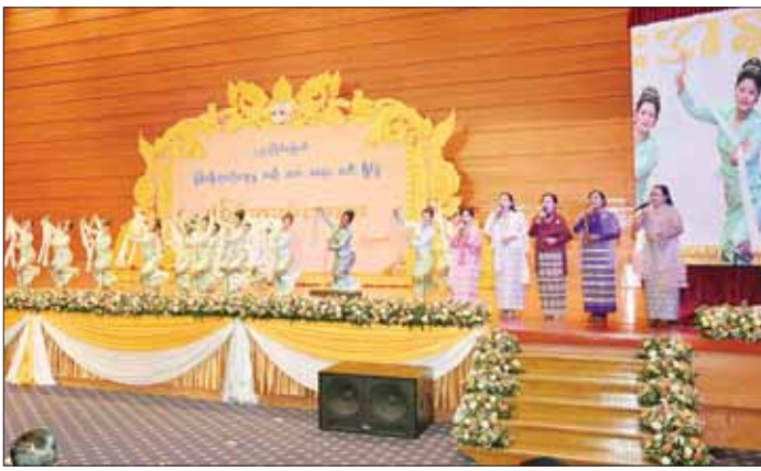
နိုင်ငံတော်စီမံအုပ်ချုပ်ရေးကောင်စီဥက္ကဋ္ဌ နိုင်ငံတော်ဝန်ကြီးချုပ်ဗိုလ်ချုပ်မှူးကြီး မင်းအောင်လှိုင်နှင့်ဇနီး ဒေါ်ကြူကြူလှနှင့်အဖွဲ့ဝင်များ “ထိန်းသိမ်းစို့လေ ရိုးရာအမွေ” ဖွင့်ပွဲ ဂုဏ်ပြုတေးသီချင်းဖြင့် ဖျော်ဖြေတင်ဆက်မှုကို ကြည့်ရှုအားပေးကြစဉ်။

စာမျက်နှာ ၃ မှ အမျိုးသားရေးစိတ်ဓာတ် ခိုင်မြဲအောင် ဖော်ထုတ်ထိန်းသိမ်း မြှင့်တင်လျက်ရှိနေကြသည့်ကို တွေ့မြင်ကြရမည်ဖြစ်ပါကြောင်း။ မြန်မာနိုင်ငံအနေဖြင့်လည်း မြန်မာနိုင်ငံနှင့် မြန်မာလူမျိုးတို့၏ ကောင်းမြတ်သည့် ဂုဏ်ဒြပ်နှင့် အစဉ်အလာ၊ အမျိုးသားရေးစံနှုန်းများကို ကမ္ဘာတည်သရွေ့ အမွေအနှစ်များကို ရည်မှန်းပြီး အမျိုးသားယဉ်ကျေးမှု အမွေအနှစ်များ ဖော်ထုတ် ထိန်းသိမ်းမြှင့်တင်ရေးလုပ်ငန်းများကို နိုင်ငံတော်က အလေးထား ကြိုးပမ်းဆောင်ရွက်ပေးလျက် ရှိပါကြောင်း၊ ထိုကဲ့သို့ အမျိုးသားယဉ်ကျေးမှု အမွေအနှစ်များ ဖော်ထုတ်ထိန်းသိမ်း မြှင့်တင်ရေးလုပ်ငန်းများအနက် မြန်မာ့ရိုးရာယဉ်ကျေးမှု အဆို၊ အက၊ အရေး၊ အတီးပြိုင်ပွဲကြီးများ ကျင်းပခြင်းသည်လည်း တစ်မျိုးသားလုံး ပါဝင်ဆောင်ရွက်ကြသည့် အဆင့်အမြင့်ဆုံး အမျိုးသားရေးအားထုတ်မှုတစ်ရပ်ဖြစ်သည်ဟု ပြောကြားလိုပါကြောင်း။