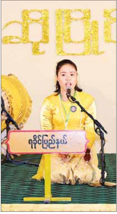
အခြေခံပညာအဆင့် (အသက် ၁၀ နှစ်မှ ၁၅ နှစ်အတွင်း) အမျိုးသမီး ကာလပေါ် တေးသီချင်းပြိုင်ပွဲတွင် ရခိုင်ပြည်နယ်မှ မပန်သခင်ကို သီဆိုယှဉ်ပြိုင်စဉ်။