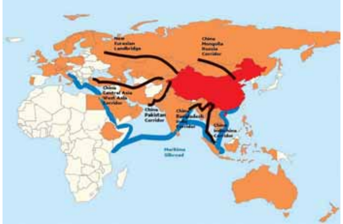
ခေတ်သစ်ပိုးလမ်းမကြီးမြေပုံ။

“မြန်မာနိုင်ငံသည် ပထဝီအနေအထားအရ ရပ်ဝန်းနှင့် ပိုးလမ်းမစီမံကိန်း တွင် မဟာဗျူဟာကျသည့်နေရာ၌တည်ရှိပြီး တရုတ်- အင်ဒိုချိုင်းနား ကျွန်းဆွယ် စီးပွားရေးစင်္ကြံနှင့် ဘင်္ဂလားဒေ့ရှ်-တရုတ်-အိန္ဒိယ-မြန်မာ စီးပွားရေးစင်္ကြံအစိတ်အပိုင်းများတွင် ပါဝင်လျက်ရှိပါသည်။ မြန်မာနိုင်ငံ သည် BRI အကောင်အထည်ဖော်ဆောင်မှု အစီအစဉ်များတွင် ပါဝင်လျက်ရှိပြီး တရုတ်-မြန်မာ စီးပွားရေးစင်္ကြံ (China-Myanmar Economic Corridor-CMEC) ပူးတွဲတည်ထောင်ရေး နားလည်မှု စာချုပ်လွှာတွင်လည်း လက်မှတ်ရေးထိုးပြီးဖြစ်”