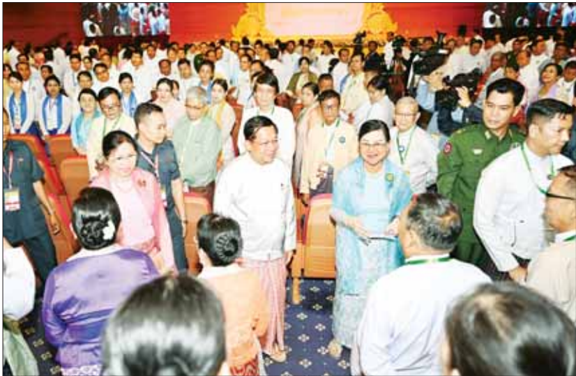
နိုင်ငံတော်စီမံအုပ်ချုပ်ရေးကောင်စီဥက္ကဋ္ဌ နိုင်ငံတော်ဝန်ကြီးချုပ်ဗိုလ်ချုပ်မှူးကြီး မင်းအောင်လှိုင်နှင့်ဇနီး ဒေါ်ကြူကြူလှတို့ အကဲဖြတ်ပညာရှင်များကို ရင်းရင်းနှီးနှီး လိုက်လံနှုတ်ဆက်စဉ်။

ကိုယ်ပိုင်ထုံးစံလေ့များနှင့် မြန်မာ့မူမြန်မာ့ဟန်စစ်စစ်များကို ရှေးမြန်မာဘိုးဘွားအစဉ်အဆက်က ဖန်တီးပုံဖော်တည်ဆောက် ထိန်းသိမ်းလာခဲ့ကြသည်မှာ နှစ်ပေါင်းထောင်ချီ ကြာခဲ့ပြီဖြစ်ပါကြောင်း။ မြန်မာ့ရေးဟောင်း ဖြူပြန့်ငင်များမှ တွေ့ရှိခဲ့ရသည့် စိတ်ပိုင်းဆိုင်ရာ၊ ရုပ်ပိုင်းဆိုင်ရာ ယဉ်ကျေးမှုအမွေအနှစ်အထောက်အထားများ၊ စာပေအထောက်အထားများနှင့် အိမ်နီးချင်းနိုင်ငံများ၏ ခေတ်ပြိုင်မှတ်တမ်းများအရ မြန်မာလူမျိုးများသည် ရှည်လျားသည့် သမိုင်းကြောင်း တစ်လျှောက်တွင် ဘာသာတရားဆိုင်ရာ အဆုံးအမများ၊ အဆင့်အတန်းမြင့်မားသည့် ယဉ်ကျေးမှုထုံးစံလေ့များ၊ သိမ်မွေ့နက်နဲသည့် အနုသုခုမပညာရပ်များနှင့် ကိုယ်ပိုင်အမျိုးသား ယဉ်ကျေးမှုကို ခြေခြေမြစ်မြစ်ထူထောင်ခဲ့ကြပြီး အမျိုးမျိုးနှင့် ဖော်ထုတ်ထိန်းသိမ်းမြှင့်တင်