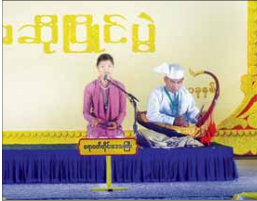
(၂၄) ကြိမ်မြောက် မြန်မာ့ရိုးရာယဉ်ကျေးမှု အဆို၊ အက၊ အရေး၊ အတီး ပြိုင်ပွဲ အဆင့်မြင့်ပညာ (၁၅-၂၀)အဆင့် မဟာဂီတတေးသီချင်းအဆိုပြိုင်ပွဲတွင် ဧရာဝတီ တိုင်းဒေသကြီးကိုယ်စားပြု ပြိုင်ပွဲဝင်တစ်ဦး သီဆိုယှဉ်ပြိုင်စဉ်။

မြန်မာ့ယဉ်ကျေးမှုသမိုင်းကို လေ့လာ ကြည့်လျှင် မြန်မာဂီတသည် လွန်ခဲ့သော နှစ်ပေါင်း ၁၅၀၀ ကျော်ခန့်မှစ၍ ဖြစ်ပေါ်ခဲ့ သည်ဟု ယူဆနိုင်သည်။ ခရစ်နှစ် ၈၀၂ ခု ခန့်က ရေးခဲ့သည့် တရုတ်လူမျိုးတို့၏ မှတ်တမ်းတစ်စောင်အရ မြန်မာ့တူရိယာ နှင့် သီချင်းတို့သည် ထိုခေတ်တွင် ပြေပြစ်ကောင်းမွန်နေပြီ ဖြစ်ကြောင်း သိရသည်။