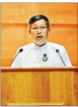
ပြည်ထောင်စုဝန်ကြီး ဦးတင်ဦးလွင်

ဆောင်ရွက်ထားရှိမှုများနှင့် ပတ်သက်၍ ရှင်းလင်းတင်ပြသည်။ ထို့နောက် အနုပညာရှင်များက ဂီတစာဆိုအလင်္ကာတော်များစွာ ဦးမောင်မောင်လတ် ရေးစပ်သီကုံးထားသော “ထိန်းသိမ်းစို့လေ ရိုးရာအမွေ” ဖွင့်ပွဲ ဂုဏ်ပြုတေးသီချင်းဖြင့် ဖျော်ဖြေတင်ဆက်ကြသည်။