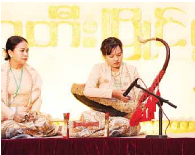
ဝါသနာရှင်အဆင့်(ပထမတန်း) အမျိုးသမီး စောင်းအတီးပြိုင်ပွဲတွင် ရန်ကုန်တိုင်းဒေသကြီးမှ ပြိုင်ပွဲဝင်၏ ယှဉ်ပြိုင်တီးခတ်မှု။