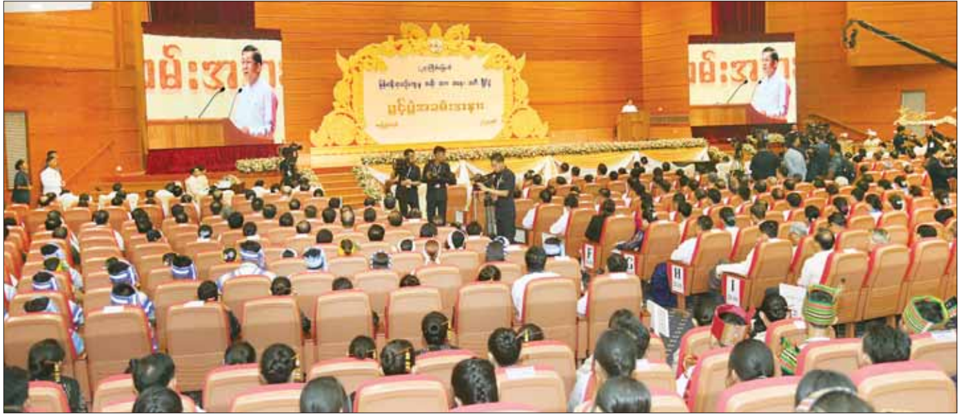
နိုင်ငံတော်စီမံအုပ်ချုပ်ရေးကောင်စီဥက္ကဋ္ဌ နိုင်ငံတော်ဝန်ကြီးချုပ်ဗိုလ်ချုပ်မှူးကြီး မင်းအောင်လှိုင် (၂၄) ကြိမ်မြောက် မြန်မာ့ရိုးရာယဉ်ကျေးမှု အဆို၊ အက၊ အရေး၊ အတီးပြိုင်ပွဲ ဖွင့်ပွဲအခမ်းအနားတွင် အမှာစကား ပြောကြားစဉ်။

❖ ရှေ့ဖုံးမှ အခမ်းအနားသို့ နိုင်ငံတော်စီမံအုပ်ချုပ်ရေးကောင်စီဥက္ကဋ္ဌ နိုင်ငံတော်ဝန်ကြီးချုပ်၏ဇနီး ဒေါ်ကြူကြူလှ၊ နိုင်ငံတော်စီမံအုပ်ချုပ်ရေး ကောင်စီ ဒုတိယဥက္ကဋ္ဌ ဒုတိယဝန်ကြီးချုပ် ဒုတိယဗိုလ်ချုပ်မှူးကြီးစိုးဝင်းနှင့်ဇနီး ဒေါ်သန်းသန်းနွယ်၊ ကောင်စီတွဲဖက်အတွင်းရေးမှူးနှင့် ဇနီး၊ ကောင်စီဝင်များနှင့်ဇနီးများ၊ ပြည်ထောင်စုအဆင့် ပုဂ္ဂိုလ်များ၊ ပြည်ထောင်စုဝန်ကြီးများ၊ နေပြည်တော်ကောင်စီဥက္ကဋ္ဌ၊ ကာကွယ်ရေးဦးစီးချုပ်ရုံးမှ အဆင့်မြင့် တပ်မတော်အရာရှိကြီးများ၊ နေပြည်တော်တိုင်းစစ်ဌာနချုပ် တိုင်းမှူး၊ ဒုတိယဝန်ကြီးများ၊ ပြိုင်ပွဲကျင်းပရေးဦးစီးကော်မတီ၊ လုပ်ငန်းကော်မတီနှင့် ဆက်စပ်တို့မှ ကော်မတီဝင်များ၊ တိုင်းဒေသကြီးနှင့် ပြည်နယ်ဝန်ကြီးများ၊ အကဲဖြတ်ပညာရှင်ကြီးများ၊ ကြီးကြပ်အုပ်ချုပ်သူများ၊ နည်းပြများ၊ အထောက်အကူပြုများ၊ တိုင်းဒေသကြီးနှင့် ပြည်နယ်များမှ ပြိုင်ပွဲဝင်တိုင်းရင်းသား