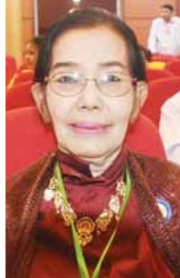
တက္ကသိုလ်လုံလုံ

တန်ဖိုးထားရမှာ ဖြစ်ပါတယ်။ ကိုယ့် တိုင်းပြည်ကို ချစ်ရင်၊ ကိုယ့်လူမျိုးကို ချစ်ရင်၊ ကိုယ့်အမျိုးသားဂီတနဲ့ ကိုယ့် အမျိုးသားရေးဆို ဂါ၊ ရေး၊ တီးကို ဘာလို့ မချစ်နိုင်ရမှာလဲ ဆိုတဲ့စကားကို ကျွန်ုပ် ဆရာက ပြောခဲ့ပါတယ်။ ကိုယ့်တိုင်းပြည် ကို ချစ်သလို ကိုယ့်ရိုးရာယဉ်ကျေးမှုကို လည်း ဘာလို့ မချစ်နိုင်ရမှာလဲဆိုတဲ့ စကားလေးတစ်ခွန်းကို ကျွန်ုပ်တို့အသုံး စွဲအောင် မှတ်ထားပါတယ်။ ကိုယ့်လိုပဲ တခြားသူတွေကိုလည်း ဒီစကားလေးကို မှတ်သားစေချင်ပါတယ်။ ဒေါက်တာအောင်နေမျိုး (ရှမ်းပြည်နယ်အဖွဲ့ခေါင်းဆောင်) ကျွန်တော်တို့ ရှမ်းပြည်နယ် အက အဖွဲ့အနေနဲ့ကတော့ ဖျော်ဖြေရေးအက