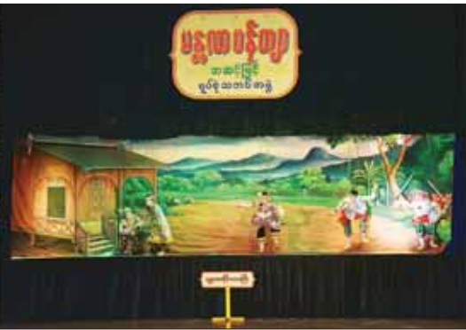
ဝါသနာရှင်အဆင့် (ပထမတန်း) ပြိုင်ပွဲတွင် မန္တလေးတိုင်းဒေသကြီး

မန္တလေးတိုင်းဒေသကြီး၊ ရန်ကုန်တိုင်းဒေသကြီးနှင့် ဧရာဝတီတိုင်းဒေသကြီးတို့မှ ပြိုင်ပွဲဝင်များက မြူးကြဲမြိုင်ဆိုင်စွာ တီးခတ်ယှဉ်ပြိုင်ကြသည်။ ဆိုင်းအဖွဲ့အလိုက် အတီးပြိုင်ပွဲကို သာသနာရေးနှင့် ယဉ်ကျေးမှု ဝန်ကြီးဌာနရှိ (လေ့ကျင့်ရေးဇာတိရုံ)၌ ကျင်းပရာ အဆင့်မြင့်ပညာအဆင့် အမျိုးသားပြိုင်ပွဲတွင် ရန်ကုန်တိုင်းဒေသကြီး၊ တနင်္သာရီတိုင်းဒေသကြီးနှင့် မန္တလေးတိုင်းဒေသကြီးတို့မှ ပြိုင်ပွဲဝင်များကလည်းကောင်း၊ အဆင့်မြင့်ပညာအဆင့်