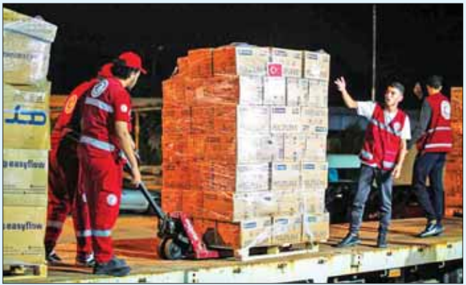
ပေးရေး လေယာဉ် ၂၅ စင်း မြောက်ပိုင်းဆိုင်နိုင်အယ်လ်အာရစ်လေဆိပ်သို့ ရောက်ရှိခဲ့ကြောင်း ကြေညာခဲ့သည်။ ဂျော်ဒန်၊ အာရပ်စော်ဘွားများ ပြည်ထောင်စု၊ ရုရှား၊ တူကီယံ၊ ဘရာဇီးနှင့် တူလာသမဂ္ဂအဖွဲ့အဖွဲ့များမှ လူသားချင်းဆိုင်ရာ အကူအညီပေးရေးပစ္စည်းများတင်ဆောင်ထားသော လေယာဉ်များသည် အောက်တိုဘာ ၁၂ ရက်က တာဝန်ပေးပို့နေခဲ့ကြောင်း သိရသည်။ အောက်တိုဘာ ၇ ရက်တွင် ဟားမားစ်နှင့် အစ္စရေးတို့ တစ်ဖက်နှင့် တစ်ဖက် အပြန်အလှန် တိုက်ခိုက်ချိန်မှစကာ ယခုအချိန်အထိ နှစ်ဖက်စလုံး သေဆုံးသူ ၆၀၀၀ ကျော်ရှိလာပြီဖြစ်သည်။ ဆင်ဟွာ

၂၃ ရက်က ပြောကြားခဲ့သည်။ ထို့အတူ နောက်ထပ် ကူညီထောက်ပံ့ရေးပစ္စည်းများ ထပ်မံတင်ဆောင်ထားသည့် လေယာဉ်နှစ်စင်းကိုလည်း ထပ်မံစေလွှတ်သွားမည်ဖြစ်ကြောင်း ပြောခဲ့သည်။ အဆိုပါလေယာဉ်တွင် ဆရာဝန် ၂၀ ပါဝင်သည့် ဆေးဘက်ဆိုင်ရာအသင်းတစ်သင်းလည်း လိုက်ပါလာမည်ဖြစ်ကြောင်း ၎င်းက လူမှုမီဒီယာပလက်ဖောင်းတစ်ခုဖြစ်သော အိတ်စ်တွင် ဖော်ပြခဲ့သည်။ ယင်းနေ့ အစောပိုင်းကလည်း အီဂျစ်ကြက်ခြေနီအသင်းကနောက်ထပ်အကူအညီပေးရေးယာဉ်တန်းကို ပါလက်စတိုင်းကြက်ခြေနီအသင်းသို့ စေလွှတ်ခဲ့ကြောင်း ပြောခဲ့သည်။ ပါလက်စတိုင်း ကြက်ခြေနီအသင်းကလည်း ၎င်းတို့သည် လူသားချင်းဆိုင်ရာကူညီထောက်ပံ့ရေးပစ္စည်းများတင်ဆောင်လာသော ကုန်တင်ကား ၂၀ ပါ တတိယယာဉ်တန်းကို လက်ခံခဲ့ကြောင်း ပြောခဲ့သည်။ ယင်းနေ့ အစောပိုင်းကလည်း မြောက်ပိုင်း ဆိုင်နိုင်အစိုးရအဖွဲ့က အကူအညီ