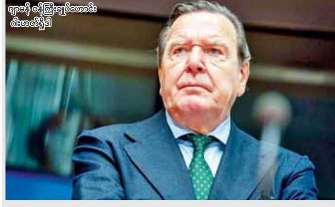
ဂျာမနီ ဝန်ကြီးချုပ်ဖရဲဒေါ့စ် ဂါးဟတ်ရှိုဒါ

တွေ့ရှိခဲ့ကြောင်း၊ အမြန်ရထား၏ ရထားတွဲအတော် များများ တိမ်းမှောက်ကုန်သောကြောင့် လူပေါင်း ၁၀၀ ကျော် ဒဏ်ရာရရှိခဲ့ကြောင်းနှင့် သေဆုံးသူ ဦးရေမှာ သိသိသာသာဆက်လက်ဖြင့်တက်မည် အရေးကို စိုးရိမ်မကင်းဖြစ်နေကြောင်း ၎င်းက ဆက်လက်ပြောသည်။ ဒဏ်ရာရရှိခဲ့သော ခရီးသည် များကို နီးစပ်ရာ ဆေးရုံသို့ ပို့ဆောင်ခဲ့ကြောင်း ၎င်းက ဆက်လက်ပြောကြားသည်။ စေတနာရှင် ကူညီပေးသူများနှင့် သိသိသာသာ များအပါအဝင် ဒေသခံရာကျော်သည် ရထားပျက်များ ကြားပိတ်မိနေသူများကို ကယ်ဆယ်ရန် ကြိုးစား ဆောင်ရွက်နေကြသည်။ ဆင်ဟာ