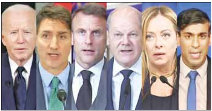
အမေရိကန်သမ္မတ ဂျိုးဘိုင်းဒင်နှင့် အနောက်နိုင်ငံ ခေါင်းဆောင်များ။

တွေ့ဆုံဆွေးနွေးပြီးနောက် ထုတ်ပြန်လိုက် သောပူးတွဲကြေညာချက်တွင်ခေါင်းဆောင်များသည် အစ္စရေးကို ထောက်ခံကြောင်းနှင့် အကြမ်းဖက်မှုကို မိမိကိုယ်တိုင် ကာကွယ်ရန် အခွင့်အရေးရှိကြောင်း ပြောကြားလိုက်သည်။ ဟားမားစ်တို့၏ကြေညာချက်များကို တိုက်ခိုက် ရာတွင် ဂါဇာကမ်းမြောင်းဒေသရှိ ဒေသခံများ အတွက် ထိခိုက်မှုအနည်းဆုံးဖြစ်စေရန် တောင်းဆို လိုက်သည်။ စားစာခံများကို ချက်ချင်းလွှတ်ပေးရန်နှင့် ဂါဇာ မှ ထွက်ခွာရန် ဆန္ဒရှိသော မိမိတို့နိုင်ငံသားများ နှင့်လည်း အနီးကပ်ညှိနှိုင်းဆောင်ရွက်ရန်လည်း ကမ္ဘာ့ခေါင်းဆောင်များက တိုက်တွန်းထားသည်။ အင်န်အိတ်ချ်က