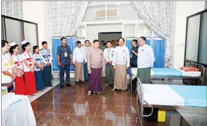
နိုင်ငံတော်စီမံအုပ်ချုပ်ရေးကောင်စီ ဒုတိယဥက္ကဋ္ဌ ဒုတိယဝန်ကြီးချုပ် ဒုတိယဗိုလ်ချုပ်မှူးကြီး စိုးဝင်း ကျန်းမာရေးနှင့် ဆေးအကာအကွယ်ပေးရေးအဖွဲ့များ စုဖွဲ့ပြင်ဆင်ဆောင်ရွက်ထားရှိမှုများကို ကြည့်ရှုစစ်ဆေးစဉ်။