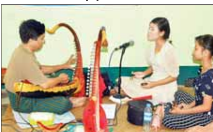
(၂၄) ကြိမ်မြောက် မြန်မာ့ရိုးရာယဉ်ကျေးမှု အဆို၊ အက၊ အရေး၊ အတီးပြိုင်ပွဲတွင် မဟာဂီတ အဆင့်မြင့်သီချင်းဆိုပြိုင်ပွဲ၌ ပါဝင်ယှဉ်ပြိုင်မည့် ပဲခူးတိုင်းဒေသကြီးမှ ပြိုင်ပွဲဝင်၏ သီဆိုလေ့ကျင့်မှုကို တွေ့ရစဉ်။

စာပေ၊ ဂီတ၊ သဘင်၊ ရုပ်ရှင် အနုပညာရှင်တို့သည် အနုပညာ