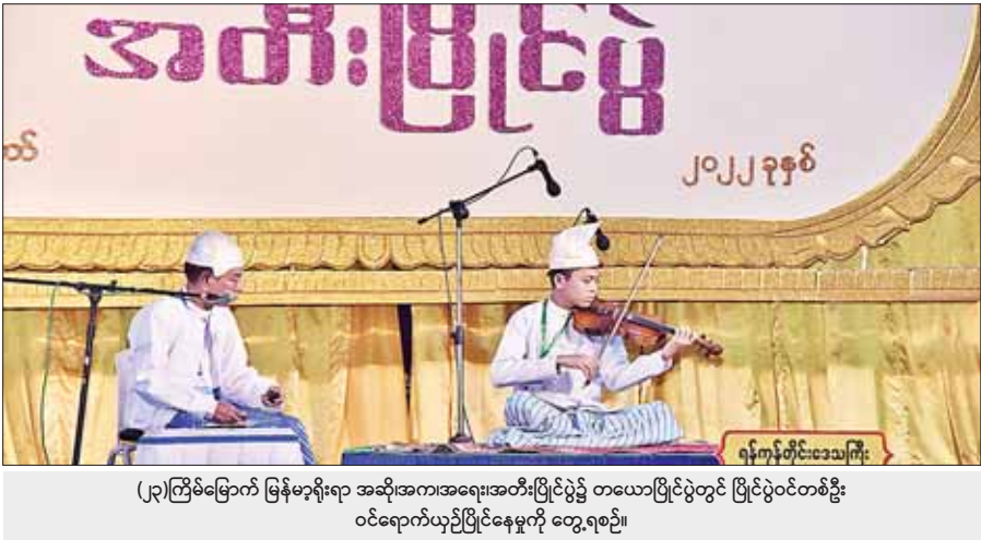
(၂၃)ကြိမ်မြောက် မြန်မာ့ရိုးရာ အဆိုအကအရေးအတီးပြိုင်ပွဲ၌ တယောပြိုင်ပွဲတွင် ပြိုင်ပွဲဝင်တစ်ဦး ဝင်ရောက်ယှဉ်ပြိုင်နေမှုကို တွေ့ရစဉ်။

ထိန်းသိမ်းကာကွယ်စောင့်ရှောက်မှုနှင့် ယဉ်ကျေးမှုအမွေနှင့် ယနေ့လူငယ် ယဉ်ကျေးမှုအမွေဟူသည် အရေးကြီးလှပါသည်။ အထူးသဖြင့် ကျွန်တော်တို့နေထိုင်ရာ မြန်မာနိုင်ငံတော်ကြီးအတွက်ကား ပို၍ အရေးကြီးပြီး ပိုပြီးသတိထားစရာအချက်များလည်း ရှိနေသည်။ မတူကွဲပြားသော ယဉ်ကျေးမှုများနှင့်အတူ တိုင်းရင်းသားလူမျိုး ၁၀၀ ကျော်မှာ သူ့အစဉ်အလာကောင်းများနှင့်သူ ရှင်သန်မြဲယဉ်ကျေးမှုစနစ်များ ကိုယ်စီရှိပြီးဖြစ်သည်။ မတူကွဲပြားသော်လည်း ခြားနားချက်နည်းပြီး သဘောသဘာဝနှင့် ဂုဏ်ရည်အားဖြင့် နီးစပ်မှုရှိကြကာ