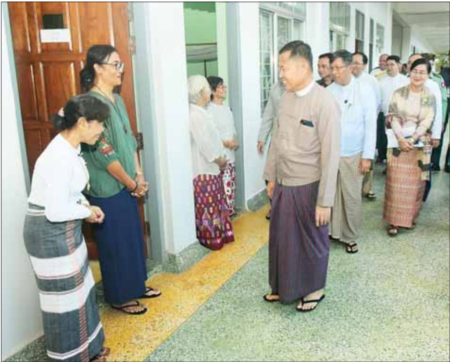
နိုင်ငံတော်စီမံအုပ်ချုပ်ရေးကောင်စီ ဒုတိယဥက္ကဋ္ဌ ဒုတိယဝန်ကြီးချုပ် ဒုတိယဗိုလ်ချုပ်မှူးကြီး စိုးဝင်း အကဲဖြတ်ပေးပွဲ ဝါရင့်အနုပညာရှင်ကြီးများအား ရင်းရင်းနှီးနှီး နှုတ်ဆက်အားပေးစကား ပြောကြားစဉ်။