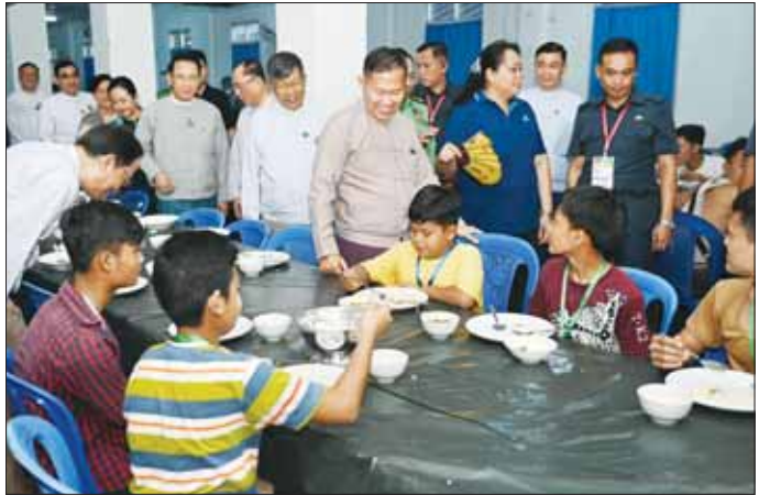
နိုင်ငံတော်စီမံအုပ်ချုပ်ရေးကောင်စီ ဒုတိယဥက္ကဋ္ဌ ဒုတိယဝန်ကြီးချုပ် ဒုတိယဗိုလ်ချုပ်မှူးကြီး စိုးဝင်း ပြိုင်ပွဲဝင်ကလေးများ စားသောက်နေမှုကို လိုက်လံကြည့်ရှုအားပေးစဉ်။