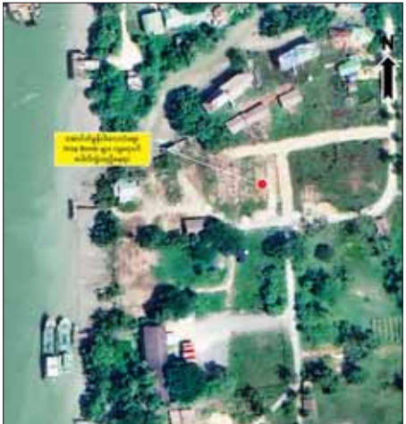
ထားဝယ်မြို့ ကြက်စားပြင်ရပ်ကွက် ကမ်းနားလမ်း အောင်တံခွန် ငါးလေလံဈေးအတွင်းသို့ Drop Bomb များ ကျရောက်ပေါက်ကွဲခဲ့သည့်နေရာပြပုံ

အများပြည်သူများ အထိတ်တလန့်ဖြစ်စေရန် ရည်ရွယ်ချက်ဖြင့် ဒေသခံပြည်သူများ အေးချမ်းစွာ ဈေးရောင်း/ဈေးဝယ် ပြုလုပ်နေသည့် ဈေးအတွင်းသို့ Drop ဗုံးများ ပစ်ချတိုက်ခိုက်ခဲ့သည့် PDF အမည်ခံ အကြမ်းဖက်သမားများအား အမြန်ဆုံးဖမ်းဆီးရမိရေး လုံခြုံရေး တပ်ဖွဲ့ဝင်များက လိုအပ်သည့် လုံခြုံရေးလုပ်ငန်းများ ဆောင်ရွက်လျက်ရှိကြောင်း သတင်းရရှိသည်။ သတင်းစဉ်