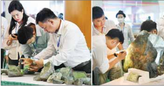
ယနေ့ပြပွဲတွင် ကျောက်မျက်အတွဲ ၁၆၀ ကို ပြည်တွင်း၊ ပြည်ပ ရတနာကုန်သည်များကို အိတ်ဖွင့်တင်ဒါစနစ်ဖြင့် ရောင်းချပေးခဲ့ရာ ကျောက်မျက်အတွဲ ၇၃ တွဲ ရောင်းချကြောင်း ကြေညာသည်။ ပြပွဲ ပစ္စည်းအတွဲ ရောင်းချမည့် ကျောက်စိမ်းအတွဲပေါင်း ၇၅၀ ကို ပြည်တွင်း၊ ပြည်ပ ရတနာကုန်သည်များက ကြည့်ရှုစစ်ဆေးကြပြီး ဈေးနှုန်းတင်သွင်းလွှာများကို တင်ဒါပုံစံဖြင့် ရောင်းချပေးခဲ့သည်။

နေပြည်တော် အောက်တိုဘာ ၂၃ ၂၀၂၃ ခုနှစ် နှစ်လယ် မြန်မာ့ကျောက်မျက်ရတနာပြပွဲ စတင်နေ့ကို နေပြည်တော်ရှိ မဏိရတနာကျောက်စိမ်းခန်းမ၌ ဆက်လက်ကျင်းပသည်။