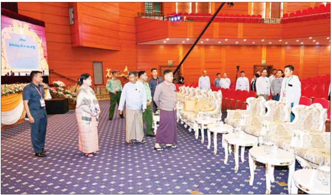
နိုင်ငံတော်စီမံအုပ်ချုပ်ရေးကောင်စီ ဒုတိယဥက္ကဋ္ဌ ဒုတိယဝန်ကြီးချုပ် ဒုတိယဗိုလ်ချုပ်မှူးကြီး စိုးဝင်း မြန်မာအပြည်ပြည်ဆိုင်ရာ ကွန်ဗင်းရှင်းဗဟိုဌာန-၂ (MICC-2) ၌ (၂၄) ကြိမ်မြောက် မြန်မာ့ရိုးရာယဉ်ကျေးမှု အဆို၊ အက၊ အရေး၊ အတီး ပြိုင်ပွဲကျင်းပနိုင်ရေးအတွက် ကြိုတင်ပြင်ဆင်ဆောင်ရွက်ထားရှိမှု အခြေအနေများ ကြည့်ရှုစစ်ဆေးစဉ်။

နေပြည်တော် အောက်တိုဘာ ၂၃ (၂၄) ကြိမ်မြောက် မြန်မာ့ရိုးရာ ယဉ်ကျေးမှု အဆို၊ အက၊ အရေး၊ အတီး ပြိုင်ပွဲကျင်းပရေး ဦးစီး ကော်မတီနာယက နိုင်ငံတော်စီမံ အုပ်ချုပ်ရေးကောင်စီ ဒုတိယ ဥက္ကဋ္ဌ ဒုတိယဝန်ကြီးချုပ် ဒုတိယ ဗိုလ်ချုပ်မှူးကြီး စိုးဝင်းသည် ယနေ့ညနေပိုင်းတွင် (၂၄) ကြိမ် မြောက် မြန်မာ့ရိုးရာယဉ်ကျေးမှု အဆို၊ အက၊ အရေး၊ အတီး ပြိုင်ပွဲ အောင်မြင်စွာ ကျင်းပနိုင်ရေး ပြင်ဆင် ဆောင်ရွက်ထားရှိမှု အခြေအနေများကို လိုက်လံ ကြည့်ရှုစစ်ဆေးသည်။ ဦးစွာ နိုင်ငံတော်စီမံအုပ်ချုပ် ရေးကောင်စီ ဒုတိယဥက္ကဋ္ဌ ဒုတိယ ဝန်ကြီးချုပ် ဒုတိယဗိုလ်ချုပ်မှူး ကြီး စိုးဝင်းသည် ပြည်ထောင်စု ဝန်ကြီးများ၊ နေပြည်တော် ကောင်စီဥက္ကဋ္ဌ၊ နေပြည်တော် တိုင်းစစ်ဌာနချုပ်တိုင်းမှူး၊ ဒုတိယ ဝန်ကြီးများနှင့် တာဝန်ရှိသူများ လိုက်ပါ၍ နေပြည်တော်ရှိ မြန်မာ အပြည်ပြည်ဆိုင်ရာ ကွန်ဗင်းရှင်း စာမျက်နှာ ၃ ကော်လံ ၁