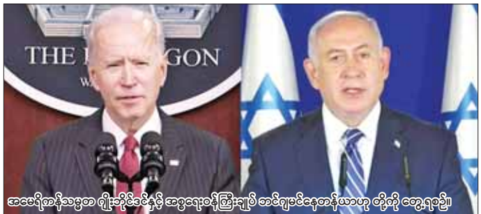
အမေရိကန်သမ္မတ ဂျိုးဘိုင်းဒင်နှင့် UN အစည်းအဝေးဝန်ကြီးချုပ် အင်ဂျစ်မင်နေတန်ယာဟု တို့ကို တွေ့ရစဉ်။