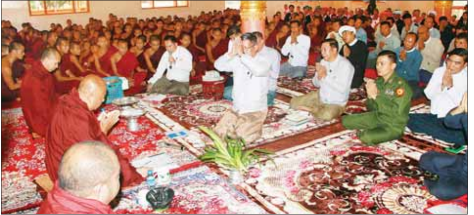
လျှောက်ထားပြီး ဩဝါဒခံယူ သည်။ ပုဒ္ဓတက္ကသိုလ်ပါမောက္ခချုပ် OXFORD ဆရာတော် ဒေါက်တာ ဘဒ္ဒန္တဓမ္မသာမိက သာသနာတော် ဆိုင်ရာ ပုဒ္ဓတက္ကသိုလ်များကို နိုင်ငံတော် သံဃမဟာနာယက အဖွဲ့က Registration Procedureအကောင်အထည်ဖော် ဆောင်ရွက်နေသည်ကို ကြားသိရ ပြီး သာသနာရေးနှင့် ယဉ်ကျေးမှု ဝန်ကြီးဌာနအနေဖြင့် အောင်မြင် အောင် အကောင်အထည်ဖော် ဆောင်ရွက်ပေးရန် မေတ္တာရပ်ခံ မိန့်ကြားခဲ့ကြောင်း သတင်းရရှိ သတင်းစဉ်

ယင်းနောက် ပြည်ထောင်စု ရှမ်းပြည်နယ် တောင်ကြီးမြို့ ဝန်ကြီးသည် နောင်တောင်း ပုဒ္ဓတက္ကသိုလ် ပါမောက္ခချုပ် ဘုန်းတော်ကြီးသင် ပညာရေး OXFORD ဆရာတော် ဒေါက်တာ ကျောင်းသား ကျောင်းသူများနှင့် ဘဒ္ဒန္တဓမ္မသာမိ သီတင်းသုံးရာ တွေ့ဆုံ၍ အမှာစကားပြောကြား ကျောင်းတိုက်သို့ သွားရောက်၍ ဝါဆိုသင်္ဂါးနှင့် လှူဖွယ်ဝတ္ထု ပစ္စည်းများ ဆက်ကပ်လှူဒါန်းကာ ဝန်ကြီးနှင့် တာဝန်ရှိသူများသည် သာသနာရေး ဆိုင်ရာများ