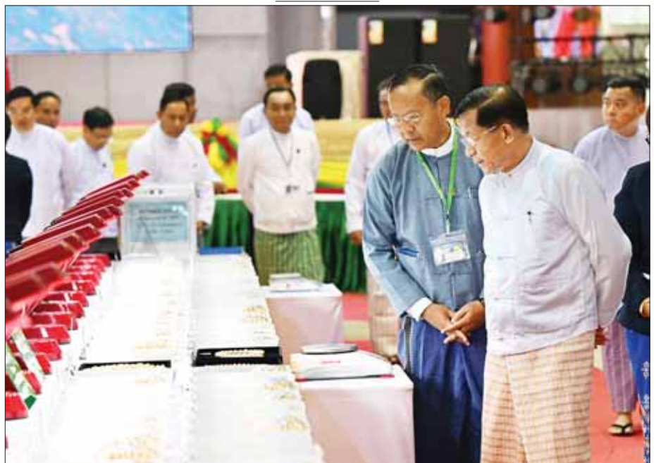
နိုင်ငံတော်စီမံအုပ်ချုပ်ရေးကောင်စီဥက္ကဋ္ဌ နိုင်ငံတော်ဝန်ကြီးချုပ် ဗိုလ်ချုပ်မှူးကြီး မင်းအောင်လှိုင် ၂၀၂၃ ခုနှစ်၊ နှစ်လယ် မြန်မာ့ကျောက်မျက်ရတနာပြပွဲ၌ ရောင်းချရန် ပြသထားသော ပုလဲအတွဲများကို ကြည့်ရှုစစ်ဆေးစဉ်။

နိုင်ငံတော်အတွက် နိုင်ငံခြားဝင်ငွေရရှိရန်နှင့် နိုင်ငံသားများအတွက် စီးပွားရေးအကျိုးဖြစ်ထွန်းမှုများ ရရှိနိုင်စေရန်အတွက် တူးဖော် ထုတ်လုပ်ထားသည့် ကျောက်မျက်ရတနာများကို စာမျက်နှာ ၄ သို့