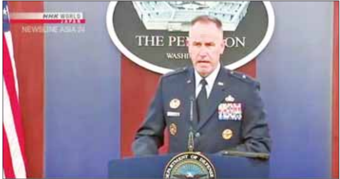
ပင်တဂွန် သတင်းပြန်ကြားရေးအတွင်းဝန် ပက်ထရစ် ရိုင်းဒါ ရှင်းလင်းပြောကြားစဉ်။