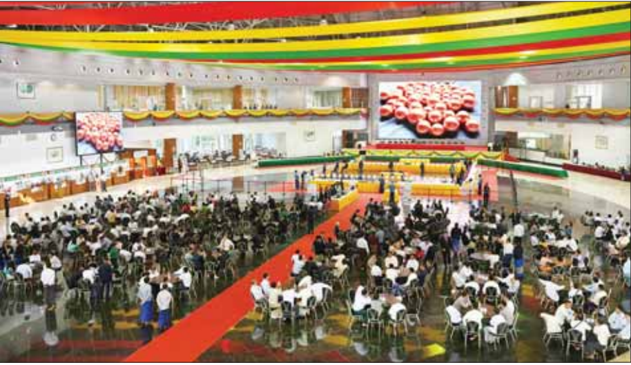
၂၀၂၃ ခုနှစ်၊ နှစ်လယ် မြန်မာ့ကျောက်မျက်ရတနာပြပွဲ ဖွင့်ပွဲအခမ်းအနား ကျင်းပမှုကို တွေ့ရစဉ်။

(အေ)နှင့်(ဘီ)ဖြင့်လည်းကောင်း၊ MSME လုပ်ငန်းရှင်များကို အားပေးမြှင့်တင်ရန်အတွက် အုပ်စု(စီ)ဖြင့်လည်းကောင်း သတ်မှတ်ထားသည်။ ပေးချေဝယ်ယူရမည့် ကျောက်စိမ်းအတွဲ ၅၀၀ ပါဝင်သည့် အုပ်စု(အေ)ကို အမေရိကန်ဒေါ်လာဖြင့် ကြမ်းခင်းဈေးသတ်မှတ်ထားပြီး ပြည်ပရတနာကုန်သည်များသာမက ပြည်တွင်းရတနာကုန်သည်များပါအမေရိကန်ဒေါ်လာ၊ ယူရိုငွေ၊ ယွမ်ငွေ၊ ထိုင်းဘတ်ငွေ စသည့်နိုင်ငံခြားငွေဖြင့် ပေးချေဝယ်ယူရမည်ဖြစ်သည်။ ကျောက်စိမ်းအတွဲ ၁၇၃၃ တွဲ ပါဝင်သည့် အုပ်စု(ဘီ)ကို အမေရိကန်ဒေါ်လာဖြင့် ကြမ်းခင်းဈေး သတ်မှတ်ထားပြီး ပြည်ပရတနာကုန်သည်များ အနေဖြင့် နိုင်ငံခြားငွေဖြင့် လည်းကောင်း၊ ပြည်တွင်းရတနာကုန်သည်များ အနေဖြင့် ကျပ်ငွေ (သို့မဟုတ်) နိုင်ငံခြားငွေဖြင့် လည်းကောင်း ပေးချေဝယ်ယူနိုင်မည်ဖြစ်သည်။