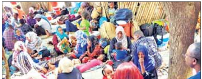
ယိုးပီးယား လူသားချင်းစာနာ ထောက်ထားမှုဆိုင်ရာ ကိစ္စရပ် အောက်တိုဘာလအထိ ရန်ပုံငွေ ၃၀ ရာခိုင်နှုန်းသာ ထောက်ပံ့ ပေးထားသည်ဟု ကုလသမဂ္ဂ လူသားချင်း စာနာထောက်ထား မှုဆိုင်ရာ ညှိနှိုင်းရေးမှူးရုံးက ပြောသည်။ အိသီယိုးပီးယားတွင် လက်ရှိဖြစ်ပေါ်နေသည့် အခြေ အနေများကို ဖြေရှင်းရန်အတွက် နောက်ထပ်ရန်ပုံငွေများ လိုအပ် လျက်ရှိသည်ဟု UNOCHA က ပြောသည်။ ဆင်ဟွာ

ဖနောင့်ပင် အောက်တိုဘာ ၂၀ မဲခေါင်မြစ်ရေလျှံမှုနှင့် ရုတ်တရက် ရေကြီးမှုများကြောင့် ကမ္ဘော ဒီးယားနိုင်ငံရှိ ပြည်နယ်နှင့် မြို့ပေါင်း ၂၀ ခန့်တွင် ရေကြီးမှု ဒဏ်ခံစားရပြီး လူခြောက်ဦး ထပ်မံဆုံးရှုံးခဲ့သည်ဟု အစွဲရောက်သည့် ပြောရေး အမျိုးသားသဘာဝဘေးအန္တရာယ် ကော်မတီ(NCDM) မှ ပြောရေး ဆိုခွင့်ရှိသူက အောက်တိုဘာ ၂၀ ရက်တွင် ပြောသည်။ မိသားစုပေါင်း ၂၉၄၈၉ ဦးခန့် စံစားရပြီး ၂၀၂၃ ခုနှစ် ဦးခန့်ကို ဘေးလွတ်ရာသို့ ပြောင်းရွှေ့ပေးခဲ့ရသည်ဟု ပြောရေး ဆိုခွင့်ရှိသူ ဆောက်က ကိုလ်မိုနီ က ပြောသည်။ ရေကြီးမှုကြောင့် ခြောက်ဦး သေဆုံးကာ ခြောက်ဦးဒဏ်ရာ ရရှိခဲ့သည်ဟု ၎င်းကပြောသည်။ ဩဂုတ်လနှင့် အောက်တိုဘာလ တို့တွင် တိုင်းပြည်အတွင်း ရေကြီး မှုဖြစ်ပေါ်လေ့ရှိပြီး စပါးစိုက်သည့် မြေဟက်တာပေါင်း ၂၂၇၃၃ ဟက်တာ ရေလွှမ်းခဲ့ရသည်။ ယခုနှစ် ဧန်နိုလီရီယု စက်တင်ဘာလအထိ မိုးကြိုးပစ် မှုကြောင့် ၇၃ ဦး သေဆုံး ကာ မုန်တိုင်းကြောင့် ကိုဦး သေဆုံးခဲ့သည်ဟု ၎င်းက ဆက် ပြောသည်။ ဆင်ဟွာ