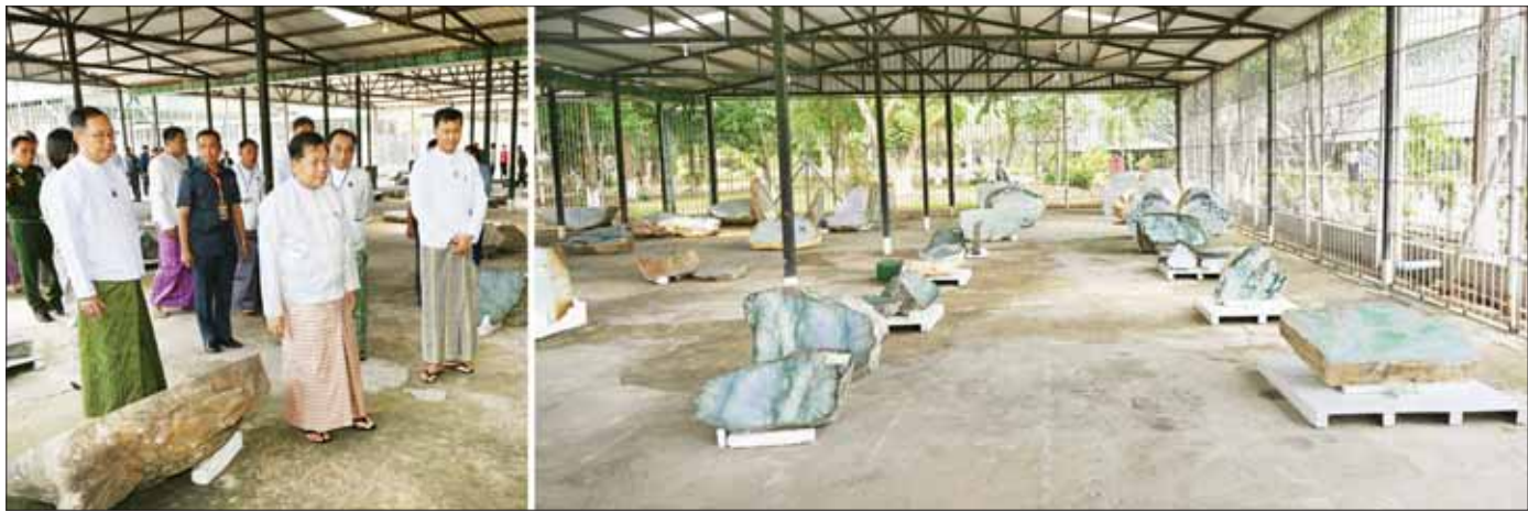
နိုင်ငံတော်စီမံအုပ်ချုပ်ရေးကောင်စီဥက္ကဋ္ဌ နိုင်ငံတော်ဝန်ကြီးချုပ် ဗိုလ်ချုပ်မှူးကြီး မင်းအောင်လှိုင် ခန်းမအပြင်ဘက်တွင် ခင်းကျင်းပြသထားသည့် ကျောက်စိမ်းရိုင်းအတွဲများကို ကြည့်ရှုစစ်ဆေးစဉ်။

စာမျက်နှာ ၃ မှ ရောင်းချနိုင်မည့် မြန်မာ့ကျောက်မျက်ရတနာပြပွဲများကို ၁၉၆၄ ခုနှစ်မှ စတင်၍ ကျင်းပခဲ့သည်။ ယခုရတနာပြပွဲတွင် ပုလဲအတွဲပေါင်း ၃၀၀၊ ကျောက်မျက်အတွဲပေါင်း ၁၆၀ နှင့် ကျောက်စိမ်းအတွဲပေါင်း ၄၀၂၅ တွဲတို့ကို အိတ်ဖွင့်တင်ခါစနစ်ဖြင့် ရောင်းချပေးသွားမည်ဖြစ်ပြီး ပုလဲအတွဲနှင့် ကျောက်မျက်အတွဲတို့ကို အမေရိကန်ဒေါ်လာဖြင့် ကြမ်းခင်းဈေးသတ်မှတ်ထားကာ ဝယ်ယူခွင့်ရရှိသည့် ပြည်ပရတနာကုန်သည်များအနေဖြင့် အမေရိကန်ဒေါ်လာ၊ ယူရိုငွေ၊ ယွမ်ငွေ၊ ထိုင်းဘတ်ငွေ တို့ဖြင့်လည်းကောင်း၊ ပြည်တွင်းရတနာကုန်သည်များ အနေဖြင့် ကျပ်ငွေဖြင့်လည်းကောင်း ပေးချေဝယ်ယူနိုင်မည်ဖြစ်သည်။ အုပ်စု(၃)စု ခွဲခြားထား ကျောက်စိမ်း အတွဲများ ရောင်းချရာတွင် အုပ်စု(၃)စုခွဲခြားထားပြီး နိုင်ငံခြားငွေရရှိရန်အတွက် ကျောက်စိမ်းအတွဲအုပ်စု