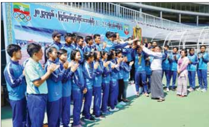
ဤနေရာက ပြည်ထောင်စုဝန်ကြီးသည် အဖွဲ့ဝင်များနှင့်အတူ ၂၀၂၃ ခုနှစ် အသက်(၂၅)နှစ်အောက် ပြည်နယ်နှင့်တိုင်းဒေသကြီး ပြေးခုန်ပစ်ပြိုင်ပွဲ ဗိုလ်လုပွဲနှင့် ဆုချီးမြှင့်ခြင်းအခမ်းအနားသို့ တက်ရောက်သည်။

နေပြည်တော် အောက်တိုဘာ ၂၀ အားကစားနှင့်လူငယ်ရေးရာဝန်ကြီးဌာန အားကစားနှင့် ကာယပညာဦးစီးဌာနနှင့် မြန်မာနိုင်ငံရေကူးအဖွဲ့ချုပ်တို့ ပူးပေါင်းဖွင့်လှစ်သည့် ရေကူးဒိုင်ဗွမ်းမံသင်တန်းဖွင့်ပွဲအခမ်းအနားကို ယနေ့နံနက် ၉ နာရီခွဲတွင် နေပြည်တော် အားကစားလေ့ကျင့်ရေးစခန်း (Gold Camp)ရှိ Multipurpose Hall ဌာန ကျင်းပပြီး အားကစားနှင့်လူငယ်ရေးရာဝန်ကြီးဌာန ပြည်ထောင်စုဝန်ကြီးဦးမင်းသိန်းဇံ က အမှာစကားပြောကြားသည်။