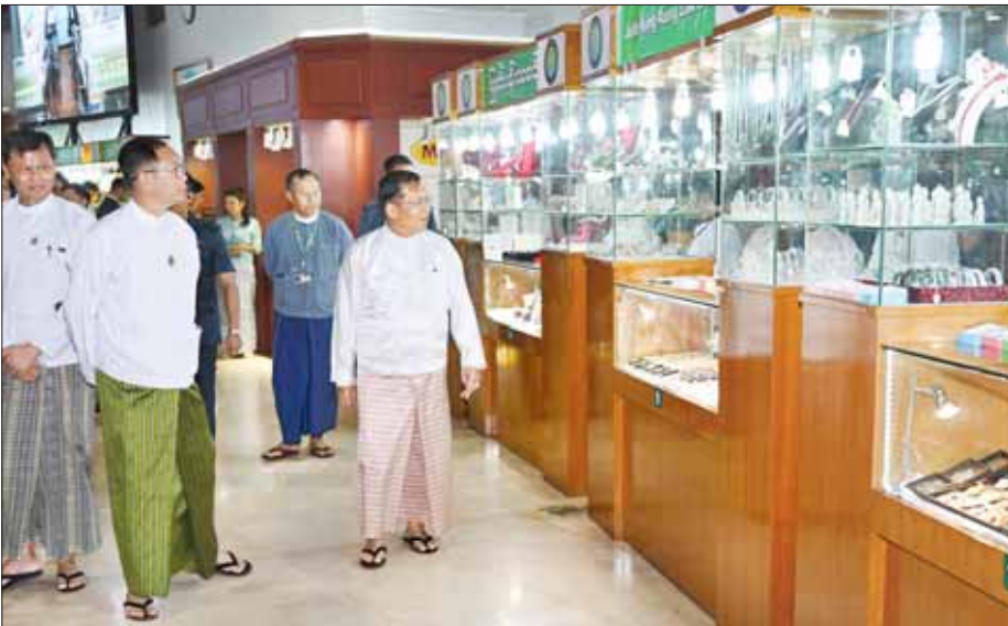
နိုင်ငံတော်စီမံအုပ်ချုပ်ရေးကောင်စီဥက္ကဋ္ဌ နိုင်ငံတော်ဝန်ကြီးချုပ် ဗိုလ်ချုပ်မှူးကြီး မင်းအောင်လှိုင် ပုဂ္ဂလိက ကျောက်မျက်ရတနာအချောထည်အရောင်းပြခန်းများ ဖွင့်လှစ်ရောင်းချမှုကို ကြည့်ရှုအားပေးစဉ်။

❖ ယခုရတနာပြပွဲတွင် ပုလဲအတွဲပေါင်း ၃၀၀၊ ကျောက်မျက်အတွဲပေါင်း ၁၆၀ နှင့် ကျောက်စိမ်းအတွဲပေါင်း ၄၀ ၂၅ တွဲတို့ကို အိတ်ဖွင့်တင်ဒါ စနစ်ဖြင့် ရောင်းချပေးသွားမည် ❖ ပုလဲအတွဲနှင့် ကျောက်မျက်အတွဲတို့ကို အမေရိကန်ဒေါ်လာဖြင့် ကြမ်းခင်းဈေးသတ်မှတ်ထားကာ ဝယ်ယူခွင့်ရရှိသည့် ပြည်ပရတနာကုန်သည်များအနေဖြင့် အမေရိကန်ဒေါ်လာ၊ ယူရိုငွေ၊ ယွမ်ငွေ၊ ထိုင်းဘတ်ငွေတို့ဖြင့်လည်းကောင်း၊ ပြည်တွင်းရတနာကုန်သည်များအနေဖြင့် ကျပ်ငွေဖြင့်လည်းကောင်း ပေးချေဝယ်ယူနိုင်မည်ဖြစ်