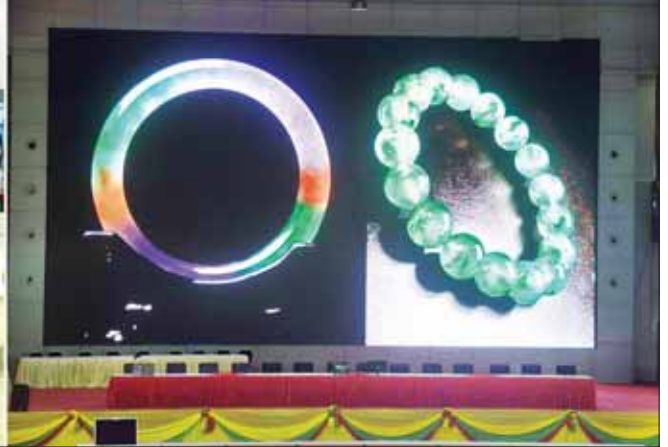
နိုင်ငံတော်စီမံအုပ်ချုပ်ရေးကောင်စီဥက္ကဋ္ဌ နိုင်ငံတော်ဝန်ကြီးချုပ် ဗိုလ်ချုပ်မှူးကြီး မင်းအောင်လှိုင်နှင့် အခမ်းအနားတက်ရောက်လာကြသူများ ကျောက်မျက်ရတနာပစ္စည်းများ ထုတ်လုပ်ရောင်းချမှုနှင့် ၂၀၂၃ ခုနှစ်၊ နှစ်လယ် မြန်မာ့ကျောက်မျက်ရတနာပြပွဲအခမ်းအနားကျင်းပနိုင်ရေး ပြင်ဆင်ဆောင်ရွက်ခဲ့မှု ဗီဒီယိုမှတ်တမ်းကို ကြည့်ရှုကြစဉ်။