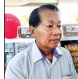
ဦးသိန်းအောင်