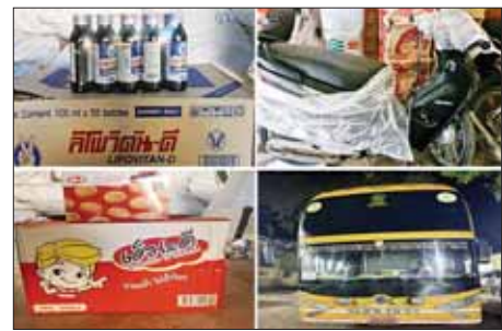
ကရင်ပြည်နယ်၌ ဖမ်းဆီးရမိမှု။

မောင်းနှင်လာသော မော်တော်ယာဉ် သုံးစီးပေါ်မှ တရားဝင်စာရွက်စာတမ်း အထောက်အထား တင်ပြနိုင်ခြင်းမရှိသည့် တရားဝင်ထုတ်လုပ်စာတမ်းမဲ့ကားလိပ် ကီလိုဂရမ် ၄၅၀၊ မာလာခေါက်ဆွဲအိတ် ကီလိုဂရမ် ၁၆၀၊ အစားအသောက်အစုံချောင်း/အပြား ၁၅၀ ကီလိုဂရမ်၊ Maurya Beer ဘူး ၂၄၀၀ အပါအဝင် ကုန်ပစ္စည်းကုန်ပစ္စည်း (ခန့်မှန်းတန်ဖိုးငွေကျပ် ၈၇၀၀၀၀)နှင့် အဆိုပါပစ္စည်းများ တင်ဆောင်လာသည့် Isuzu Bighorn တစ်စီး၊ Station Wagon တစ်စီးနှင့် Mitsubishi Pajero တစ်စီး (ခန့်မှန်းတန်ဖိုးငွေကျပ် ၂၇၀၀၀၀၀) စုစုပေါင်း ခန့်မှန်းတန်ဖိုးငွေကျပ် ၃၅၇၀၀၀၀ ကို ဖမ်းဆီးရမိခဲ့ပြီး အကောက်ခွန်လုပ်ထုံးလုပ်နည်းများနှင့်အညီ အရေးယူဆောင်ရွက်လျက်ရှိသည်။ ထို့အတူ အောက်တိုဘာ ၁၈ ရက်က ရှမ်းပြည်နယ်တရားမဝင်ကုန်သွယ်မှုတိုက်ဖျက်ရေးအဖွဲ့၏ စီမံခန့်ခွဲမှုဖြင့် တာဝန်ကျ ပူးပေါင်းအဖွဲ့က စစ်ဆေးမှုများဆောင်ရွက်ရာတွင် မူဆယ်မြို့ ဆင်ဖြူစစ်ဆေးရေးဂိတ်အကျော် လမ်းဘေးတစ်နေရာ၌ စုပုံထားသော အကောက်ခွန်ပစ္စည်းများဖြစ်သည့် ကားအပိုပစ္စည်း (Engine Cooling Radiator) သုံးခုအပါအဝင် ကုန်ပစ္စည်း ၂၆ မျိုး စုစုပေါင်း ခန့်မှန်းတန်ဖိုးငွေကျပ် ၁၀၀၈၀၀၀ ကို ဖမ်းဆီးရမိခဲ့ပြီး အကောက်ခွန်လုပ်ထုံးလုပ်နည်းများနှင့်အညီ အရေးယူဆောင်ရွက်လျက်ရှိသည်။