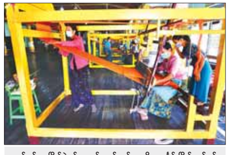
ယမန်နှစ်က ပြိုင်ပွဲဝင်အသင်းတစ်သင်း မသိုးသက်န်းပြိုင်ရက်စဉ်။

အဆိုပါမသိုးသက်န်းပြိုင်ရက် ပူဇော်ပွဲနှင့်အတူ မြို့နယ်အတွင်းရှိ ကျောင်းတိုက်များမှ ပင့်သံဃာ တော်များအား ဆွမ်းသပိတ်များ ချမ်းသာ (မိတ္တီလာ)