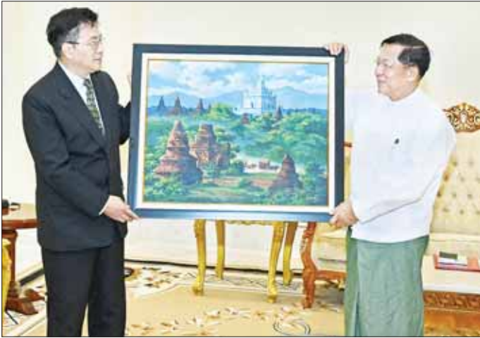
နိုင်ငံတော်စီမံအုပ်ချုပ်ရေးကောင်စီဥက္ကဋ္ဌ နိုင်ငံတော်ဝန်ကြီးချုပ် ဗိုလ်ချုပ်မှူးကြီး မင်းအောင်လှိုင် တရုတ်နိုင်ငံခြားရေးဝန်ကြီးဌာန အာရှရေးရာ အထူးကိုယ်စားလှယ် Mr. Deng Xijun အား အမှတ်တရလက်ဆောင်ပစ္စည်းပေးအပ်စဉ်။

နိုင်ငံတော်အစိုးရနှင့် တပ်မတော်မှ NCA လမ်းကြောင်းပေါ်မှခိုင်မာစွာရပ်တည်၍ ကြိုးပမ်းဆောင်ရွက်လျက်ရှိသကဲ့သို့ တရုတ်နိုင်ငံမှလည်း ကူညီဆောင်ရွက်ပေးလျက်ရှိမှုအခြေအနေ၊ တရုတ်နိုင်ငံအနေဖြင့် မြန်မာနိုင်ငံ၏ ငြိမ်းချမ်းရေးလုပ်ငန်းစဉ်အပေါ် ခိုင်မာစွာရပ်တည်ထောက်ခံလျက်ရှိသည့်အခြေအနေနှင့် နိုင်ငံပြုကြံ့ခမည်လုပ်ဆောင်မှုများကို လက်ခံမှုမရှိသည့်အခြေအနေ၊ မြန်မာနိုင်ငံအနေဖြင့်လည်း တရုတ်နိုင်ငံနှင့် နယ်စပ်ဒေသတည်ငြိမ်ရေးနှင့် ဖွံ့ဖြိုးတိုးတက်ရေးကို အလေးထားဆောင်ရွက်သွားမည့်အခြေအနေ၊ မြန်မာနိုင်ငံနယ်စပ်ဒေသများတွင် အခြေပြု၍ အိမ်နီးချင်းနိုင်ငံများ၏ အကျိုးစီးပွားကို ထိခိုက်စေမည့်လုပ်ဆောင်ချက်များကို လက်ခံသင့်မှုမရှိသည့် အခြေအနေ၊ အချို့တိုင်းရင်းသားလက်နက်ကိုင်အဖွဲ့များအနေဖြင့် ငြိမ်းချမ်းရေးဆောင်ရွက်ရာတွင် NCA စာချုပ်ကဲ့သို့ခိုင်မာမှု၊ တရားဝင်မှုရှိသည့် စာချုပ်ချုပ်ဆိုနိုင်ခြင်းမရှိဘဲ သဘောတူညီချက်များ၊ ကတိကဝတ်များဖြင့်သာ ဆောင်ရွက်ခဲ့ကြမှုအခြေအနေနှင့် ခိုင်မာလေးနက်တရားဝင်မှုရှိသည့် NCA လမ်းကြောင်းအပေါ် လျှောက်လှမ်းပြီး ထာဝရ