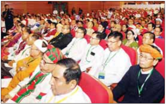
တစ်နိုင်ငံလုံးပစ်ခတ်တိုက်ခိုက်မှုရပ်စဲရေးသဘောတူစာချုပ် (NCA) (၈)နှစ်မြောက် နှစ်ပတ်လည်နေ့အခမ်းအနားသို့ တက်ရောက်ကြသူများ။