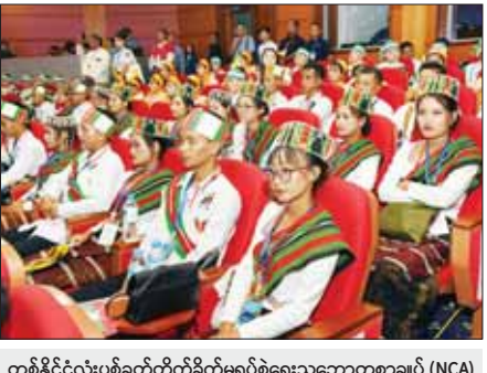
တစ်နိုင်ငံလုံးပစ်ခတ်တိုက်ခိုက်မှုရပ်စဲရေးသဘောတူစာချုပ် (NCA) (၈)နှစ်မြောက် နှစ်ပတ်လည်နေ့အခမ်းအနားသို့ တက်ရောက်ကြသူများ။