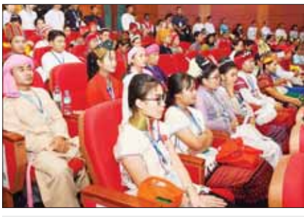
တစ်နိုင်ငံလုံးပစ်ခတ်တိုက်ခိုက်မှုရပ်စဲရေးသဘောတူစာချုပ် (NCA) (၈)နှစ်မြောက် နှစ်ပတ်လည်နေ့အခမ်းအနားသို့ တက်ရောက်ကြသူများ။