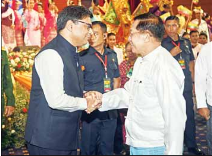
နိုင်ငံတော်စီမံအုပ်ချုပ်ရေးကောင်စီဥက္ကဋ္ဌ နိုင်ငံတော်ဝန်ကြီးချုပ် အမျိုးသားစည်းလုံးညီညွတ်ရေးနှင့် ငြိမ်းချမ်းရေးဖော်ဆောင်မှုဗဟိုကော်မတီဥက္ကဋ္ဌ တပ်မတော်ကာကွယ်ရေးဦးစီးချုပ် ဗိုလ်ချုပ်မှူးကြီး မင်းအောင်လှိုင် အခမ်းအနားတက်ရောက်လာကြသူများအား ရင်းရင်းနှီးနှီး နှုတ်ဆက်စဉ်။