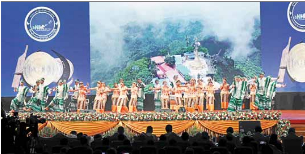
ကရင်ပြည်နယ်မှ တိုင်းရင်းသား၊ တိုင်းရင်းသားများက “ငြိမ်းချမ်းဝေသာ ပြည်မြန်မာ” တေးသီချင်းဖြင့် သရုပ်ဖော်ကပြဖျော်ဖြေတင်ဆက်ကြစဉ်။

တစ်နိုင်ငံလုံး ပစ်ခတ်တိုက်ခိုက်မှုရပ်စဲရေးသဘောတူစာချုပ်(NCA)ကို ၂၀၁၅ ခုနှစ် အောက်တိုဘာ ၁၅ ရက်တွင် အစိုးရ၊ လွှတ်တော်၊ တပ်မတော်နှင့် တိုင်းရင်းသားလက်နက်ကိုင်အဖွဲ့ ၈ ဖွဲ့တို့က ကုလသမဂ္ဂအုပ်အဝင် နိုင်ငံတကာသံတမန်များနှင့်