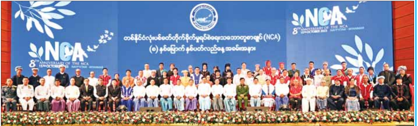
နိုင်ငံတော်စီမံအုပ်ချုပ်ရေးကောင်စီဥက္ကဋ္ဌ နိုင်ငံတော်ဝန်ကြီးချုပ် အမျိုးသားစည်းလုံးညီညွတ်ရေးနှင့် ငြိမ်းချမ်းရေးဖော်ဆောင်မှုဗဟိုကော်မတီဥက္ကဋ္ဌ တပ်မတော်ကာကွယ်ရေးဦးစီးချုပ် ဗိုလ်ချုပ်မှူးကြီး မင်းအောင်လှိုင်နှင့် အဖွဲ့ဝင်များ NCA-S-EAO တိုင်းရင်းသားလက်နက်ကိုင်အဖွဲ့အစည်းများမှ ပုဂ္ဂိုလ်များ၊ ဂုဏ်ထူးဆောင်ဘွဲ့ ချီးမြှင့်ခံရသည့် ငြိမ်းချမ်းရေးအကျိုးတော်ဆောင်များ၊ အိမ်နီးချင်းနိုင်ငံများ၏ အထူးကိုယ်စားလှယ်များ၊ EAO အထောက်အကူပြုမှုများနှင့်အတူ စုပေါင်းမှတ်တမ်းတင် ဓာတ်ပုံရိုက်စဉ်။