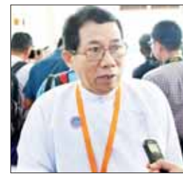
ဒေါက်တာအေးမောင်