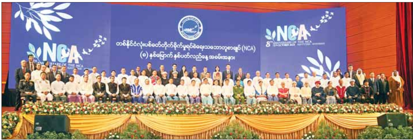
နိုင်ငံတော်စီမံအုပ်ချုပ်ရေးကောင်စီဥက္ကဋ္ဌ နိုင်ငံတော်ဝန်ကြီးချုပ် အမျိုးသားစည်းလုံးညီညွတ်ရေးနှင့် ငြိမ်းချမ်းရေးဖော်ဆောင်မှုဗဟိုကော်မတီဥက္ကဋ္ဌ တပ်မတော်ကာကွယ်ရေးဦးစီးချုပ် ဗိုလ်ချုပ်မှူးကြီး မင်းအောင်လှိုင်နှင့် အဖွဲ့ဝင်များ နိုင်ငံတော်စီမံအုပ်ချုပ်ရေးကောင်စီအဖွဲ့ဝင်များ၊ ပြည်ထောင်စုဝန်ကြီးများ၊ မြန်မာနိုင်ငံအခြေစိုက် သံရုံးများမှ သံတမန်များနှင့်အတူ စုပေါင်းမှတ်တမ်းတင်ဓာတ်ပုံရိုက်စဉ်။