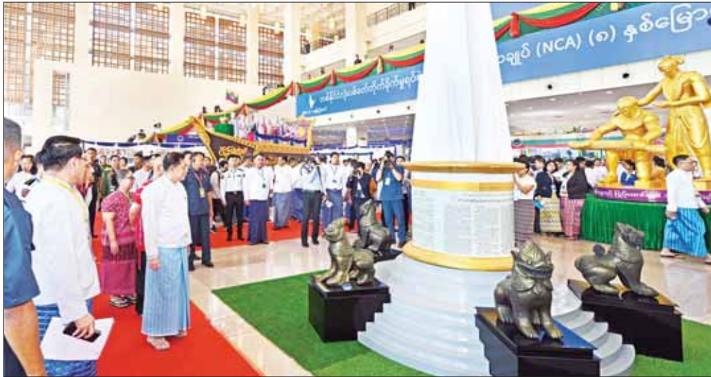
နိုင်ငံတော်စီမံအုပ်ချုပ်ရေးကောင်စီဥက္ကဋ္ဌ နိုင်ငံတော်ဝန်ကြီးချုပ် အမျိုးသားစည်းလုံးညီညွတ်ရေးနှင့် ငြိမ်းချမ်းရေးဖော်ဆောင်မှုဗဟိုကော်မတီဥက္ကဋ္ဌ တပ်မတော် ကာကွယ်ရေးဦးစီးချုပ် ဗိုလ်ချုပ်မှူးကြီး မင်းအောင်လှိုင်နှင့် ဧည့်သည်တော်များ တစ်နိုင်ငံလုံး ပစ်ခတ်တိုက်ခိုက်မှုရပ်စဲရေးသဘောတူစာချုပ် (NCA) (၈)နှစ်မြောက် နှစ်ပတ်လည်နေ့အထိမ်းအမှတ် ပြခန်းကို ကြည့်ရှုစဉ်။

ကော်မတီဥက္ကဋ္ဌနှင့် အခမ်းအနားသို့ တက်ရောက်လာ သည့် ဧည့်သည်တော်များသည် (MICC-II) Lobby ဌာန ခင်းကျင်းပြသထားသည့် တစ်နိုင်ငံလုံး ပစ်ခတ် တိုက်ခိုက်မှုရပ်စဲရေး သဘောတူစာချုပ် (NCA) (၈)နှစ်မြောက် နှစ်ပတ်လည်နေ့ အထိမ်းအမှတ် သတင်းစာများက ပြောသော ငြိမ်းချမ်းရေးသမိုင်း မှတ်တမ်းပြခန်း၊ ငြိမ်းချမ်းရေးကြိုးပမ်းမှုမှတ်တမ်း ဓာတ်ပုံများပြခန်း၊ နယ်စပ်ရေးရာဝန်ကြီးဌာနပြခန်း၊ တိုင်းရင်းသားလူမျိုးများရေးရာဝန်ကြီးဌာန ပြခန်း၊ မြန်မာ့အသံနှင့် ရုပ်မြင်သံကြား၏ တိုင်းရင်းသား လူမျိုးများ ရုပ်သံလိုင်းနှင့် မြန်မာ့အသံရေဒီယိုတို့မှ တိုင်းရင်းသားဘာသာများဖြင့် ထုတ်လွှင့်မှုသရုပ်ပြ ပြခန်း၊ ပြည်ထောင်စုအလှူ ထာဝရမှတ်တမ်းဓာတ်ပုံ များ ပြခန်းများကို လှည့်လည်ကြည့်ရှုကြသည်။