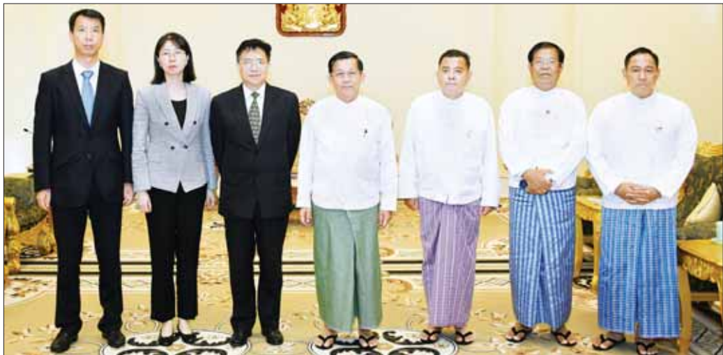
နိုင်ငံတော်စီမံအုပ်ချုပ်ရေးကောင်စီဥက္ကဋ္ဌ နိုင်ငံတော်ဝန်ကြီးချုပ် ဗိုလ်ချုပ်မှူးကြီး မင်းအောင်လှိုင်နှင့် အဖွဲ့ဝင်များ တရုတ်နိုင်ငံခြားရေးဝန်ကြီးဌာန အာရှရေးရာ အထူးကိုယ်စားလှယ် Mr. Deng Xijun ဦးဆောင်သည့် ကိုယ်စားလှယ်အဖွဲ့နှင့်အတူ စုပေါင်းမှတ်တမ်းတင်ဓာတ်ပုံရိုက်စဉ်။

ငြိမ်းချမ်းရေးတည်ဆောက်ကြရန် တိုက်တွန်းဆောင်ရွက်လျက်ရှိမှုအခြေအနေများ၊ တပ်မတော်အနေဖြင့် ပါတီစုံဒီမိုကရေစီလမ်းကြောင်းပေါ်တွင် လျှောက်လှမ်းမှုအပေါ် ခိုင်မာစွာရပ်တည်ဆောင်ရွက်လျက်ရှိမှုအခြေအနေ၊ အွန်လိုင်းလောင်းကစားမှုများနှင့် အွန်လိုင်းလိမ်လည်မှုများ ပပျောက်စေရေးနှစ်နိုင်ငံပူးပေါင်းဆောင်ရွက်သွားမည့်ကိစ္စရပ်များ၊ နှစ်နိုင်ငံပူးပေါင်းဆောင်ရွက်မှုများ ဆက်လက်တိုးမြှင့်ဆောင်ရွက်သွားမည့်ကိစ္စရပ်များ၊ ရခိုင်ပြည်နယ်အတွင်းရှိ နေရပ်စွန့်ခွာသူများ ပြန်လည်လက်ခံရေးနှင့် ပတ်သက်၍ ဆောင်ရွက်လျက်ရှိမှုအခြေအနေများနှင့် ပတ်သက်ပြီး ရင်းနှီးပွင့်လင်းစွာဖြင့် အမြင်ချင်းဖလှယ်ဆွေးနွေးခဲ့ကြသည်။ စုပေါင်းမှတ်တမ်းတင် ဓာတ်ပုံရိုက် တွေ့ဆုံပွဲအပြီးတွင် နိုင်ငံတော်စီမံအုပ်ချုပ်ရေးကောင်စီဥက္ကဋ္ဌ နိုင်ငံတော်ဝန်ကြီးချုပ်က တရုတ်နိုင်ငံခြားရေးဝန်ကြီးဌာန အာရှရေးရာ အထူးကိုယ်စားလှယ်ထံ အမှတ်တရလက်ဆောင်ပစ္စည်းပေးအပ်ခဲ့ပြီး စုပေါင်းမှတ်တမ်းတင် ဓာတ်ပုံရိုက်ခဲ့ကြကြောင်း သတင်းရရှိသည်။ သတင်းစဉ်