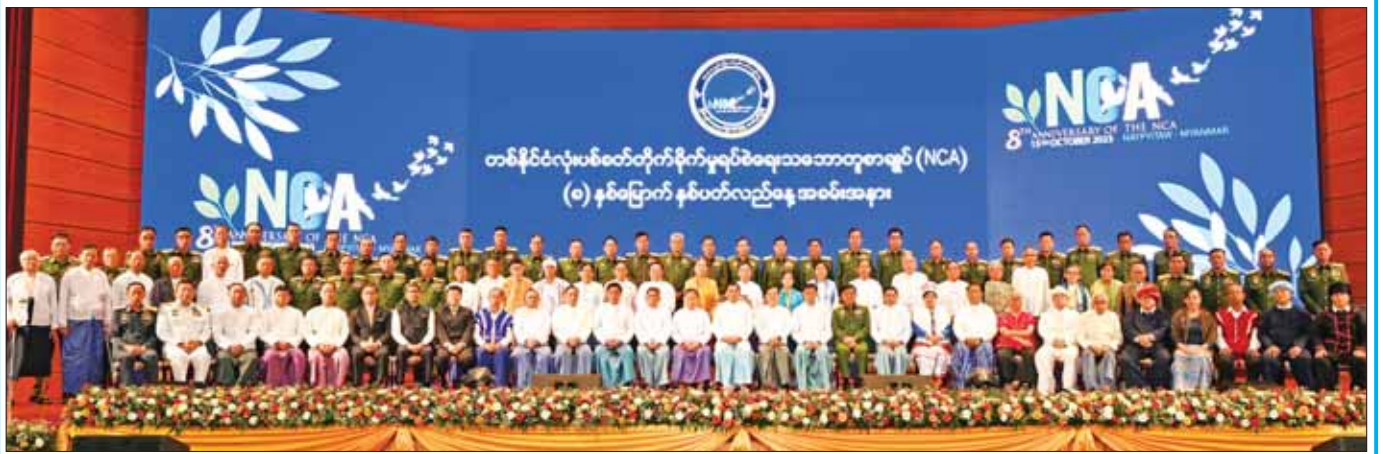
နိုင်ငံတော်စီမံအုပ်ချုပ်ရေးကောင်စီဥက္ကဋ္ဌ နိုင်ငံတော်ဝန်ကြီးချုပ် အမျိုးသားစည်းလုံးညီညွတ်ရေးနှင့် ငြိမ်းချမ်းရေးဖော်ဆောင်မှုဗဟိုကော်မတီဥက္ကဋ္ဌ တပ်မတော်ကာကွယ်ရေးဦးစီးချုပ် ဗိုလ်ချုပ်မှူးကြီး မင်းအောင်လှိုင်နှင့် အဖွဲ့ဝင်များ ပြည်ထောင်စုအဆင့် အဖွဲ့အစည်းများ၊ ကော်မတီ၊ ကော်မရှင်များမှ ပုဂ္ဂိုလ်များ၊ တပ်မတော်အရာရှိ ကြီးများ၊ အမျိုးသားစည်းလုံးညီညွတ်ရေးနှင့် ငြိမ်းချမ်းရေးဖော်ဆောင်မှု လုပ်ငန်းကော်မတီနှင့် ညှိနှိုင်းရေးကော်မတီတို့မှ ကော်မတီဝင်များ၊ နိုင်ငံတော်စီမံအုပ်ချုပ်ရေးကောင်စီ ဗဟိုအကြံပေးအဖွဲ့ဝင်များ၊ နိုင်ငံတော်စီမံအုပ်ချုပ်ရေးကောင်စီဥက္ကဋ္ဌ၏ အကြံပေးအဖွဲ့ဝင်များနှင့်အတူ စုပေါင်းမှတ်တမ်းတင် ဓာတ်ပုံရိုက်စဉ်။