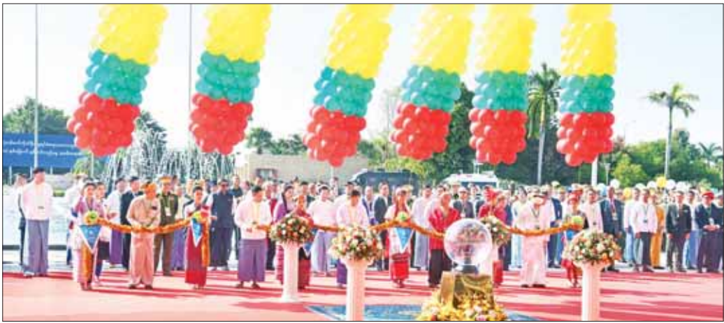
နိုင်ငံတော်စီမံအုပ်ချုပ်ရေးကောင်စီ ဒုတိယဥက္ကဋ္ဌ ဒုတိယဝန်ကြီးချုပ် ဒုတိယဗိုလ်ချုပ်မှူးကြီး စိုးဝင်း၊ နိုင်ငံတော်စီမံအုပ်ချုပ်ရေးကောင်စီအဖွဲ့ဝင်၊ ပြည်ထောင်စု ဝန်ကြီး အမျိုးသားစည်းလုံးညီညွတ်ရေးနှင့် ငြိမ်းချမ်းရေးဖော်ဆောင်မှု ညှိနှိုင်းရေးကော်မတီဥက္ကဋ္ဌ ဒုတိယဗိုလ်ချုပ်ကြီး ရာပြည့်၊ တိုင်းရင်းသားခေါင်းဆောင်များ ဖြစ်သည့် စောမူတူးစေးဖိုး၊ ဗိုလ်ချုပ်ကြီး ယွက်စစ်နှင့် ပစ်ခတ်တိုက်ခိုက်မှုရပ်စဲရေးဆိုင်ရာ ပူးတွဲစောင့်ကြည့်ရေးကော်မတီ (JMC) မှ ကိုယ်စားလှယ် စိုင်းမျိုးသန့်တို့ တိုင်းရင်းသားများနှင့်အတူ NCA (၈)နှစ်မြောက် နှစ်ပတ်လည်နေ့အခမ်းအနားကို ဖဲကြိုးဖြတ်ဖွင့်လှစ်ပေးစဉ်။

ထို့နောက် နိုင်ငံတော်စီမံအုပ်ချုပ်ရေးကောင်စီ ဥက္ကဋ္ဌ နိုင်ငံတော်ဝန်ကြီးချုပ် အမျိုးသားစည်းလုံး ညီညွတ်ရေးနှင့် ငြိမ်းချမ်းရေးဖော်ဆောင်မှု ဗဟို