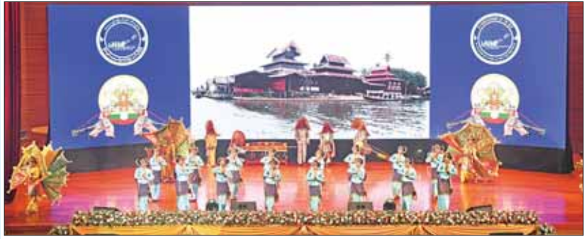
ရှမ်းပြည်နယ်မှ တိုင်းရင်းသား/ တိုင်းရင်းသူများက “ရှမ်းတောင်တန်းအလှနှင့် ရှမ်းတို့ရိုးရာအက” တေးသီချင်းဖြင့် သရုပ်ဖော် ကပြဖျော်ဖြေ တင်ဆက်ကြစဉ်။