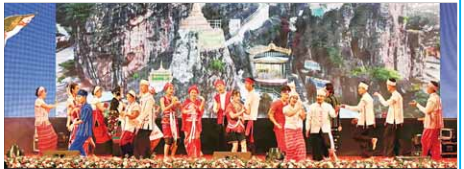
ကယားပြည်နယ်မှ တိုင်းရင်းသား/ တိုင်းရင်းသူများက “ကယားတို့၏ သဘာဝအလှနှင့် စုပေါင်းအက” တေးသီချင်းဖြင့် သရုပ်ဖော် ကပြ ဖျော်ဖြေတင်ဆက်ကြစဉ်။