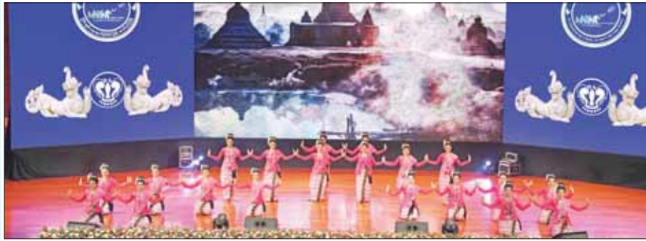
ရခိုင်ပြည်နယ်မှ တိုင်းရင်းသူများက “လည်စောင်လာပါ ပြည်စညာ” တေးသီချင်းဖြင့် သရုပ်ဖော် ကပြဖျော်ဖြေတင်ဆက်ကြစဉ်။