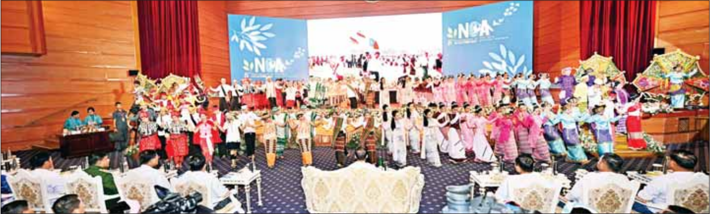
ပြန်ကြားရေးဝန်ကြီးဌာန မြန်မာ့အသံနှင့် ရုပ်မြင်သံကြား၊ သာသနာရေးနှင့် ယဉ်ကျေးမှုဝန်ကြီးဌာန အနုပညာဦးစီးဌာနတို့မှ အကအဖွဲ့များနှင့် တိုင်းရင်းသားရိုးရာအကအဖွဲ့များ စုပေါင်း၍ “သွေးရင်းများပီပီ” တေးသီချင်းဖြင့် သရုပ်ဖော်ကပြဖျော်ဖြေတင်ဆက်ကြစဉ်။