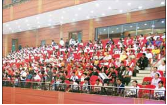
တစ်နိုင်ငံလုံးပစ်ခတ်တိုက်ခိုက်မှုရပ်စဲရေးသဘောတူစာချုပ် (NCA) (၈)နှစ်မြောက် နှစ်ပတ်လည်နေ့အခမ်းအနားသို့ တက်ရောက်ကြသူများ။