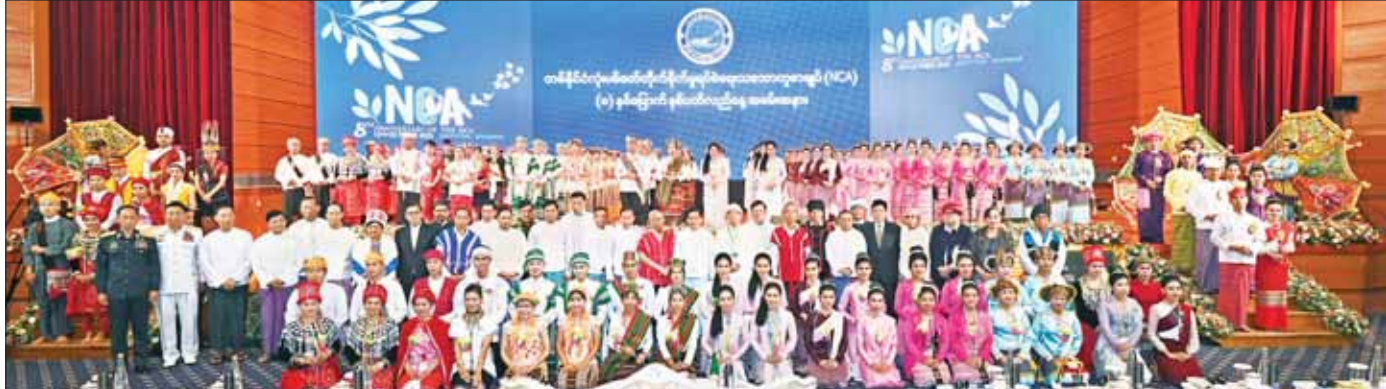
နိုင်ငံတော်စီမံအုပ်ချုပ်ရေးကောင်စီဥက္ကဋ္ဌ နိုင်ငံတော်ဝန်ကြီးချုပ် အမျိုးသားစည်းလုံးညီညွတ်ရေးနှင့် ငြိမ်းချမ်းရေးဖော်ဆောင်မှုဗဟိုကော်မတီဥက္ကဋ္ဌ တပ်မတော်ကာကွယ်ရေးဦးစီးချုပ် ဗိုလ်ချုပ်မှူးကြီး မင်းအောင်လှိုင် ပြန်ကြားရေးဝန်ကြီးဌာန မြန်မာ့အသံနှင့်ရုပ်မြင်သံကြား၊ သာသနာရေးနှင့် ယဉ်ကျေးမှုဝန်ကြီးဌာန အနုပညာဦးစီးဌာနတို့မှ အကအဖွဲ့များနှင့် တိုင်းရင်းသားအကအဖွဲ့များနှင့်အတူ စုပေါင်းမှတ်တမ်းတင် ဓာတ်ပုံရိုက်စဉ်။

ညီညွတ်ရေးနှင့် ငြိမ်းချမ်းရေးဖော်ဆောင်မှု ဗဟိုကော်မတီဥက္ကဋ္ဌ၏ လမ်းညွှန်ချက်ဖြင့် ယနေ့တွင် ကျရောက်သည့် တစ်နိုင်ငံလုံး ပစ်ခတ်တိုက်ခိုက်မှုရပ်စဲရေး သဘောတူစာချုပ် (NCA) (၈)နှစ်မြောက်နှစ်ပတ်လည်နေ့ အခမ်းအနားအား နိုင်ငံတော်အဆင့်ခမ်းနားထည့်ဝါစွာဖြင့် ကျင်းပပြုလုပ်ခဲ့ခြင်းဖြစ်ကြောင်း သတင်းရရှိသည်။ သတင်းစဉ်