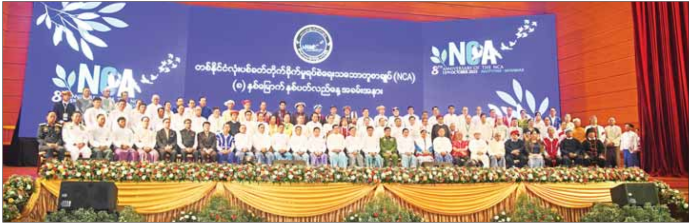
နိုင်ငံတော်စီမံအုပ်ချုပ်ရေးကောင်စီဥက္ကဋ္ဌ နိုင်ငံတော်ဝန်ကြီးချုပ် အမျိုးသားစည်းလုံးညီညွတ်ရေးနှင့် ငြိမ်းချမ်းရေးဖော်ဆောင်မှုဗဟိုကော်မတီဥက္ကဋ္ဌ တပ်မတော်ကာကွယ်ရေးဦးစီးချုပ် ဗိုလ်ချုပ်မှူးကြီး မင်းအောင်လှိုင်နှင့် အဖွဲ့ဝင်များ နိုင်ငံရေးပါတီများမှ ဥက္ကဋ္ဌများနှင့် ကိုယ်စားလှယ်များ၊ အစိုးရဘက်မှ NCA လက်မှတ်ရေးထိုးထားသူများ၊ ပြည်တွင်းအသိသက်သေများ၊ ငြိမ်းချမ်းရေးလုပ်ငန်းစဉ်များတွင် ပါဝင်ဆောင်ရွက်ခဲ့သူများနှင့်အတူ စုပေါင်းမှတ်တမ်းတင်ဓာတ်ပုံရိုက်စဉ်။