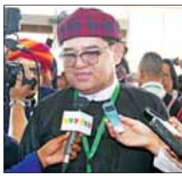
ဦးခက်ထိန်နန်