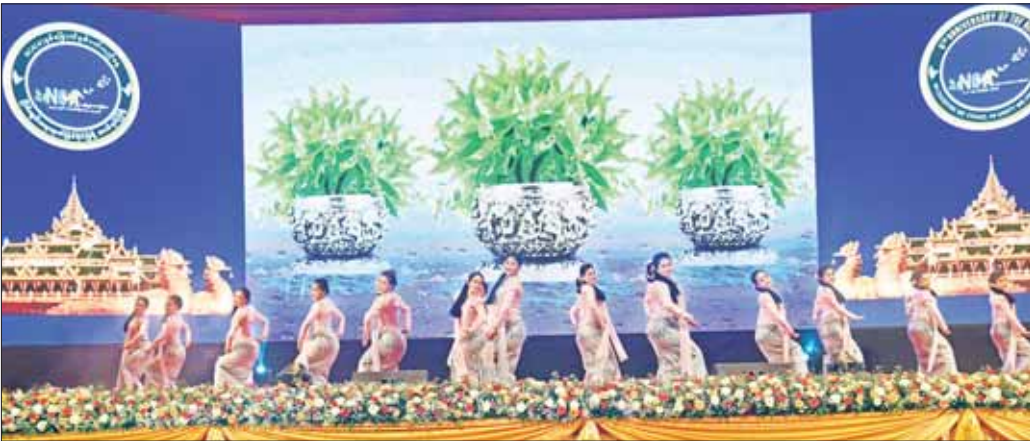
သာသနာရေးနှင့် ယဉ်ကျေးမှုဝန်ကြီးဌာန သာသနာရေးဦးစီးဌာနမှ အနုပညာရှင်များက “အ အက္ခရာ အောင်ပါစေ” တေးသီချင်းဖြင့် သရုပ်ဖော်ကပြဖျော်ဖြေတင်ဆက်ကြစဉ်။

လည်းကောင်း၊ ဗွန်ပြည်နယ်၊ ရခိုင်ပြည်နယ်နှင့် ရှမ်းပြည်နယ်တို့မှ တိုင်းရင်းသား/တိုင်းရင်းသူများက “ဝန်းရံကြမည် အမိမြန်ပြည်” “လည်စောင် လာပါပြည်စည်” “ရှမ်းတောင်တန်းအလှနှင့် ရှမ်းတို့ရိုးရာအက” တေးသီချင်းတို့ဖြင့်လည်းကောင်း၊ ပြန်ကြားရေးဝန်ကြီးဌာန မြန်မာ့အသံနှင့် ရုပ်မြင်သံကြား၊ သာသနာရေးနှင့် ယဉ်ကျေးမှုဝန်ကြီးဌာန၊ အနုပညာဦးစီးဌာနတို့မှ အကအဖွဲ့များနှင့် တိုင်းရင်းသားရိုးရာအကအဖွဲ့များ စုပေါင်း၍ “သွေးရင်းများပီပီ” တေးသီချင်းဖြင့် လည်းကောင်း သရုပ်ဖော်ကပြဖျော်ဖြေတင်ဆက်ကြသည်။