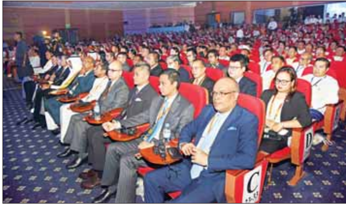
တစ်နိုင်ငံလုံး ပစ်ခတ်တိုက်ခိုက်မှုရပ်စဲရေး သဘောတူစာချုပ် (NCA) (၈)နှစ်မြောက် နှစ်ပတ်လည်နေ့အခမ်းအနားသို့ တက်ရောက်လာသည့် နိုင်ငံတကာအဖွဲ့အစည်းများမှ ကိုယ်စားလှယ်များ၊ နိုင်ငံရေးပါတီများမှ ဥက္ကဋ္ဌများနှင့် ကိုယ်စားလှယ်များ၊ တိုင်းရင်းသားလက်နက်ကိုင်အဖွဲ့အစည်းများမှ ကိုယ်စားလှယ်များအား တွေ့ရစဉ်။

တပ်မတော်၏ ငြိမ်းချမ်းရေးကြိုးပမ်းမှု၊ နိုင်ငံတော် စီမံအုပ်ချုပ်ရေးကောင်စီ၏ အမျိုးသားရေးမြှော်မှန်း ချက်များနှင့် နိုင်ငံရေးမြှော်မှန်းချက်များ ချမှတ် အကောင်အထည်ဖော်လျက်ရှိမှု စသည်တို့နှင့် ပတ်သက်၍ ကဏ္ဍအလိုက် ပြည့်ပြည့်စုံစုံ ထည့်သွင်း ပြောကြားသည်။ (နိုင်ငံတော်စီမံအုပ်ချုပ်ရေး ကောင်စီဥက္ကဋ္ဌ နိုင်ငံတော်ဝန်ကြီးချုပ်၏မိန့်ခွန်းကို စာမျက်နှာ - ၉၊ ၁၀၊ ၁၁ တို့တွင် သီးခြားဖော်ပြထား ပါသည်။) စာမျက်နှာ ၆ သို့