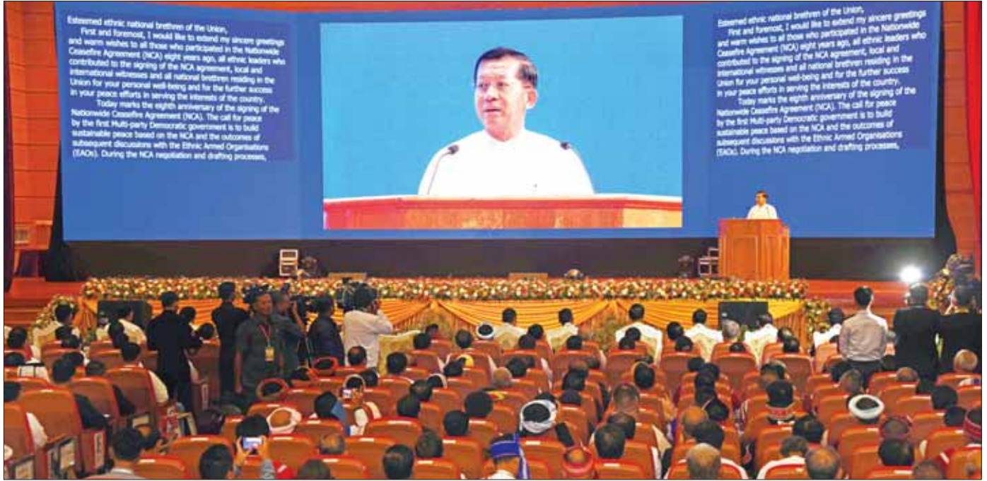
နိုင်ငံတော်စီမံအုပ်ချုပ်ရေးကောင်စီဥက္ကဋ္ဌ နိုင်ငံတော်ဝန်ကြီးချုပ် အမျိုးသားစည်းလုံးညီညွတ်ရေးနှင့် ငြိမ်းချမ်းရေးဖော်ဆောင်မှုဗဟိုကော်မတီဥက္ကဋ္ဌ တပ်မတော်ကာကွယ်ရေးဦးစီးချုပ် ဗိုလ်ချုပ်မှူးကြီး မင်းအောင်လှိုင် တစ်နိုင်ငံလုံး ပစ်ခတ်တိုက်ခိုက်မှုရပ်စဲရေး သဘောတူစာချုပ် (NCA) (၈)နှစ်မြောက် နှစ်ပတ်လည်နေ့ဆိုင်ရာ မိန့်ခွန်းပြောကြားစဉ်။