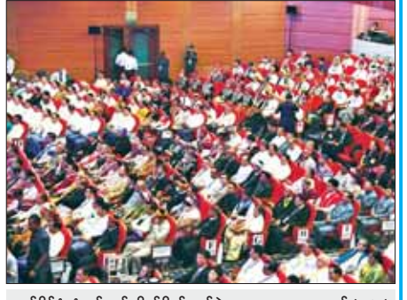
တစ်နိုင်ငံလုံးပစ်ခတ်တိုက်ခိုက်မှုရပ်စဲရေးသဘောတူစာချုပ် (NCA) (၈)နှစ်မြောက် နှစ်ပတ်လည်နေ့အခမ်းအနားသို့ တက်ရောက်ကြသူများ။