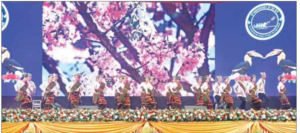
ချင်းပြည်နယ်မှ တိုင်းရင်းသား၊ တိုင်းရင်းသူများက “စည်းလုံးခြင်း” တေးသီချင်းဖြင့် သရုပ်ဖော်ကပြဖျော်ဖြေတင်ဆက်ကြစဉ်။

ထို့နောက် နိုင်ငံတော်စီမံအုပ်ချုပ်ရေးကောင်စီ ဥက္ကဋ္ဌ နိုင်ငံတော်ဝန်ကြီးချုပ် အမျိုးသားစည်းလုံးညီညွတ်ရေးနှင့် ငြိမ်းချမ်းရေးဖော်ဆောင်မှု ဗဟိုကော်မတီဥက္ကဋ္ဌ နိုင်ငံတော်စီမံအုပ်ချုပ်ရေးကောင်စီ ဒုတိယဥက္ကဋ္ဌ ဒုတိယဝန်ကြီးချုပ်၊ ကောင်စီအတွင်းရေးမှူး၊ တွဲဖက်အတွင်းရေးမှူးနှင့် ကောင်စီအဖွဲ့ဝင်များသည် NCA-S-EAO တိုင်းရင်းသားလက်နက်ကိုင်အဖွဲ့အစည်းများမှပုဂ္ဂိုလ်များ၊ ဂုဏ်ထူးဆောင်ဘွဲ့ချီးမြှင့်ခံရသည့် ငြိမ်းချမ်းရေးအကျိုးတော်ဆောင်များ၊ အိမ်နီးချင်းနိုင်ငံများ၏ အထူးကိုယ်စားလှယ်များ၊ EAO အထောက်အကူပြုများနှင့် လည်းကောင်း၊ နိုင်ငံတော်စီမံအုပ်ချုပ်ရေးကောင်စီ အဖွဲ့ဝင်များ၊ ပြည်ထောင်စုဝန်ကြီးများ၊ မြန်မာနိုင်ငံ အခြေစိုက်သံရုံးများမှသံတမန်များနှင့်လည်းကောင်း၊ နိုင်ငံရေးပါတီများမှ ဥက္ကဋ္ဌများနှင့် ကိုယ်စားလှယ်များ၊ အစိုးရဘက်မှ NCA လက်မှတ်ရေးထိုးထားသူများ၊ ပြည်တွင်းအသိသက်သေများ၊ ငြိမ်းချမ်းရေးလုပ်ငန်းစဉ်များ