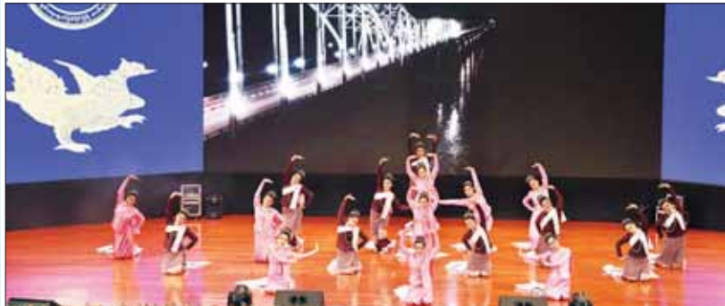
မွန်ပြည်နယ်မှ တိုင်းရင်းသူများက “ဝန်းရံကြမည် အမိမြန်ပြည်” တေးသီချင်းဖြင့် သရုပ်ဖော် ကပြဖျော်ဖြေတင်ဆက်ကြစဉ်။