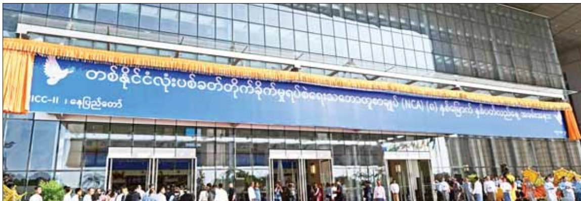
နိုင်ငံတော် စီမံအုပ်ချုပ်ရေးကောင်စီဥက္ကဋ္ဌ နိုင်ငံတော်ဝန်ကြီးချုပ် အမျိုးသားစည်းလုံးညီညွတ်ရေးနှင့် ငြိမ်းချမ်းရေးဖော်ဆောင်မှု ဗဟိုကော်မတီဥက္ကဋ္ဌ တပ်မတော်ကာကွယ်ရေးဦးစီးချုပ် ဗိုလ်ချုပ်မှူးကြီး မင်းအောင်လှိုင် တစ်နိုင်ငံလုံးပစ်ခတ်တိုက်ခိုက်မှု ရပ်စဲရေးသဘောတူစာချုပ် (NCA) (၈)နှစ်မြောက် နှစ်ပတ်လည်နေ့အခမ်းအနား ဆိုင်းဘုတ်ကို စက်ခလုတ်နှိပ် ဖွင့်လှစ်ပေးစဉ်။

နိုင်ငံတော်စီမံအုပ်ချုပ်ရေးကောင်စီဥက္ကဋ္ဌ နိုင်ငံတော်ဝန်ကြီးချုပ် အမျိုးသားစည်းလုံးညီညွတ်ရေးနှင့် ငြိမ်းချမ်းရေး ဖော်ဆောင်မှုဗဟိုကော်မတီဥက္ကဋ္ဌ တပ်မတော်ကာကွယ်ရေးဦးစီးချုပ် ဗိုလ်ချုပ်မှူးကြီး မင်းအောင်လှိုင် မိန့်ခွန်းပြောကြား