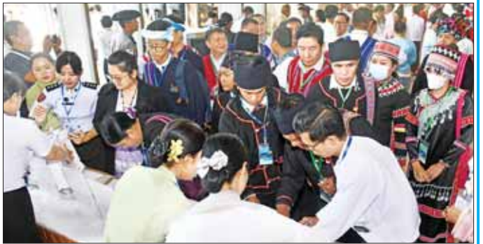
တစ်နိုင်ငံလုံးပစ်ခတ်တိုက်ခိုက်မှုရပ်စဲရေးသဘောတူစာချုပ် (NCA) (၈)နှစ်မြောက် နှစ်ပတ်လည်နေ့အခမ်းအနားသို့ တက်ရောက်ကြသူများ။