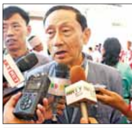
ဦးမြင့်လွင်