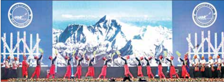
ကချင်ပြည်နယ်မှ တိုင်းရင်းသား/ တိုင်းရင်းသူများက “ပြည်ထောင်စုရဲ့ မြောက်ဘက်ဆီသို့ အလည်လာပါ” တေးသီချင်းဖြင့် သရုပ်ဖော် ကပြ ဖျော်ဖြေတင်ဆက်ကြစဉ်။