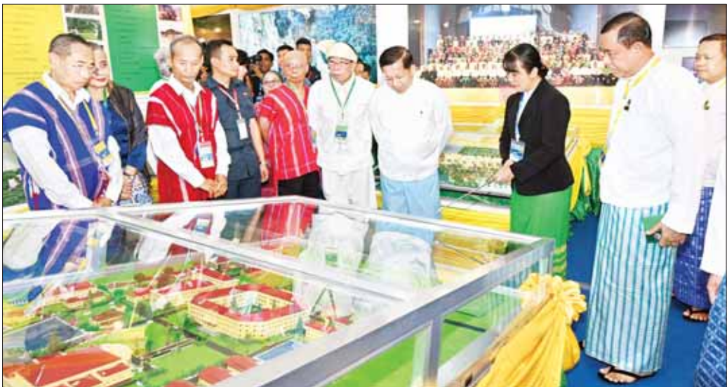
နိုင်ငံတော်စီမံအုပ်ချုပ်ရေးကောင်စီဥက္ကဋ္ဌ နိုင်ငံတော်ဝန်ကြီးချုပ် အမျိုးသားစည်းလုံးညီညွတ်ရေးနှင့် ငြိမ်းချမ်းရေးဖော်ဆောင်မှုဗဟိုကော်မတီဥက္ကဋ္ဌ တပ်မတော် ကာကွယ်ရေးဦးစီးချုပ် ဗိုလ်ချုပ်မှူးကြီး မင်းအောင်လှိုင်နှင့် ဧည့်သည်တော်များ တစ်နိုင်ငံလုံးပစ်ခတ်တိုက်ခိုက်မှုရပ်စဲရေးသဘောတူစာချုပ်(NCA) (၈)နှစ်မြောက် နှစ်ပတ်လည်နေ့အထိမ်းအမှတ်ပြခန်းကို ကြည့်ရှုစဉ်။

ဦးစွာ နိုင်ငံတော်စီမံအုပ်ချုပ်ရေးကောင်စီ ဒုတိယ ဥက္ကဋ္ဌ ဒုတိယဝန်ကြီးချုပ် ဒုတိယဗိုလ်ချုပ်မှူးကြီး စိုးဝင်း၊ နိုင်ငံတော်စီမံအုပ်ချုပ်ရေးကောင်စီအဖွဲ့ဝင်၊ ပြည်ထောင်စုဝန်ကြီးအမျိုးသားစည်းလုံးညီညွတ်ရေး နှင့် ငြိမ်းချမ်းရေးဖော်ဆောင်မှု ညှိနှိုင်းရေးကော်မတီ