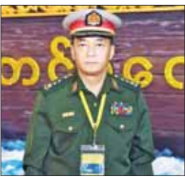
ဗိုလ်မှူးကြီး ဝဏ္ဏအောင်

NCA လက်မှတ်ရေးထိုးပြီးနောက်မှာ NCA မှာပါတဲ့ ပြဌာန်းချက်တွေအတိုင်း တစ်နိုင်ငံလုံး ပစ်ခတ်တိုက်ခိုက်မှုရပ်စဲရေး သဘောတူစာချုပ် အကောင်အထည်ဖော်ဆောင်ရွက်ဆိုင်ရာ ညှိနှိုင်းအစည်းအဝေး (JICM) ကို ကျင်းပခဲ့ပြီး ပြည်ထောင်စု ငြိမ်းချမ်းရေးဆွေးနွေးမှု ပူးတွဲကော်မတီ (UPDJC) နဲ့ ပစ်ခတ်တိုက်ခိုက်မှုရပ်စဲရေးဆိုင်ရာ ပူးတွဲစောင့်ကြည့်ကော်မတီ (JMC) တို့ကို ဖွဲ့စည်းခဲ့ပြီး ကော်မတီ (JMC) တို့ကို ဖွဲ့စည်းခဲ့ပြီး (TOR) တွေ အလိုက် လုပ်ငန်းလမ်းညွှန် (၆) အတွက် လုပ်ထုံးလုပ်နည်း (SOP) တွေနဲ့ နိုင်ငံရေး