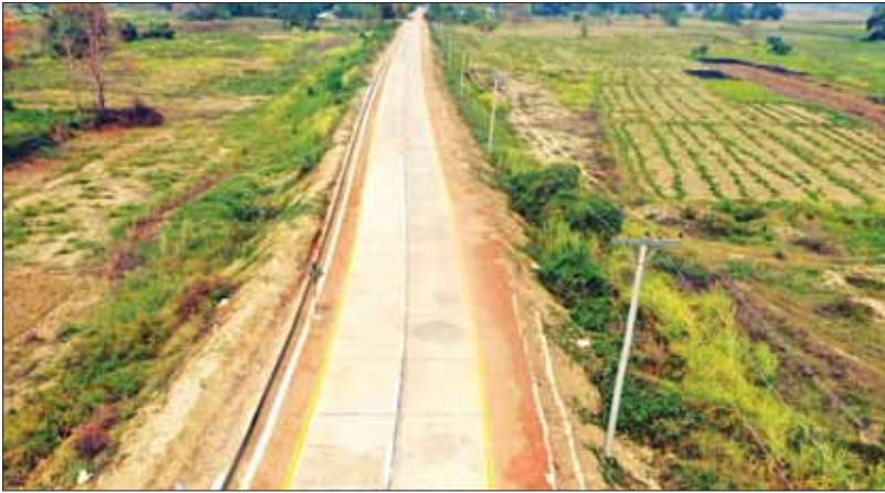
လက်ဝဲဘက်-မိုးညို-နတ်တလင်းလမ်းမှ မိုးညိုနှင့် နတ်တလင်းကြား လမ်းပိုင်းတစ်ခုခုပေါ်

လက်ဝဲဘက်- မိုးညို - နတ်တလင်း လမ်းပိုင်း၏ မိုးညိုမြို့နယ်အပိုင်းတွင် ရော့ဘီမြစ်ရေတိုးဝင်ရာ ရေနက်ကွင်း များ၊ အင်းအိုင်များက လမ်း၏ တစ်ဖက် တစ်ချက်စီတွင် တစ်ဆက်တစ်စပ်တည်း တည်ရှိနေသည်။ ရေတိုးပြီးတင်ကျန်ရစ် သည့် နန်းတင်မြေများ၊ ရွှံ့နွံအင်းအိုင် များက မိုးညိုဒေသ စိုက်ပျိုးရေးအတွက်၊ ငါးလုပ်ငန်းအတွက် များစွာအထောက် အကူပြုနေပြီး ဒေသမှ သီးနှံနှင့် ရေထွက် ကုန်များစွာ ထွက်ရှိသည်။ သို့သော် ဒေသထွက်သီးနှံနှင့် ရေထွက်ကုန် များစွာကို ဈေးကွက်အတွင်း နေ့ချင်း ရောက် ရောင်းချနိုင်ရန် ခက်ခဲသည့် အခြေအနေရှိခဲ့သည်။