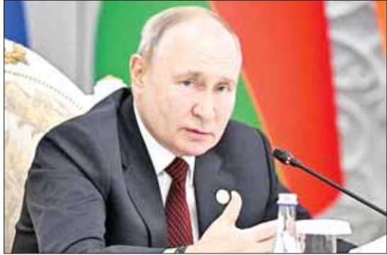
လွတ်လပ်သော ဓနသဟာယနိုင်ငံများအဖွဲ့၏ ထိပ်သီးအစည်းအဝေးပွဲသို့ ရုရှားသမ္မတ ဗလာဒီမာပူတင် တက်ရောက်စဉ်။

ဘစ်ရှ်ကက် အောက်တိုဘာ ၁၄ ကာဂျစ္စတစ်နိုင်ငံ၌ အောက်တိုဘာ ၁၃ လွတ်လပ်သော ဓနသဟာယနိုင်ငံများ ရက်က ကျင်းပပြီးနောက် အဖွဲ့ဝင်နိုင်ငံ အဖွဲ့၏ ထိပ်သီးအစည်းအဝေးကို များအကြား အပြန်အလှန်ဆက်ဆံရေး