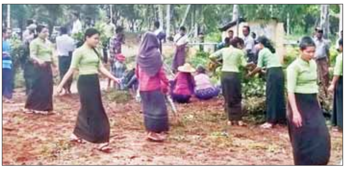
မကွေးမြို့ သင်ကြားရေးဆေးရုံကြီး အတွင်း သန့်ရှင်းသပ်ရပ်မှုရှိစေရေး ဌာနဆိုင်ရာများ စုပေါင်းသန့်ရှင်းရေးဆောင်ရွက်နေစဉ်။

ရှိစေရေး ဌာနဆိုင်ရာများ စုပေါင်း ချီ သန့်ရှင်းရေးဆောင်ရွက်သည်။ အဆိုပါ စုပေါင်းသန့်ရှင်း ရေးပြုလုပ်ခြင်းကို ဌာနဆိုင်ရာ ဝန်ထမ်းများ၊ လူမှုရေးအသင်းအဖွဲ့ များ စုစုပေါင်းအင်အား ၂၃၀ ခန့် ဖြင့် ဆောင်ရွက်ခဲ့သည်။ ထို့အတူ တိုင်းဒေသကြီး အတွင်းရှိ မြို့နယ်အသီးသီး တွင် မြို့ရွာသန့်ရှင်းသာယာ လှပစေရေး ဘုရားစေတီပုထိုး များ၊ ရုံးဌာနအဆောက်အအုံများ