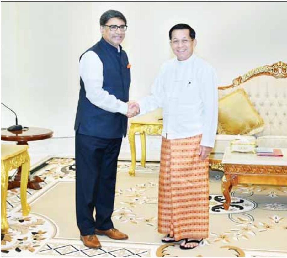
စာမျက်နှာ ၃ ကော်လံ ၁ ❁

နေပြည်တော် အောက်တိုဘာ ၁၄ နိုင်ငံတော်စီမံအုပ်ချုပ်ရေးကောင်စီဥက္ကဋ္ဌ နိုင်ငံတော်ဝန်ကြီးချုပ် ဗိုလ်ချုပ်မှူးကြီး မင်းအောင်လှိုင်နှင့် အောက်တိုဘာ ၁၅ ရက်နေ့တွင် ကျင်းပမည့် တစ်နိုင်ငံလုံး ပစ်ခတ်တိုက်ခိုက်မှုရပ်စဲရေးသဘောတူ စာချုပ် (NCA) (၈) နှစ်မြောက် နှစ်ပတ်လည်နေ့ အခမ်းအနားသို့ တက်ရောက်ရန်ရောက်ရှိနေသည့် အိန္ဒိယနိုင်ငံ ဒုတိယအမျိုးသား လုံခြုံရေးဆိုင်ရာအကြံပေးပုဂ္ဂိုလ် H.E. Mr. Vikram Misri ဦးဆောင်သော ကိုယ်စားလှယ်အဖွဲ့က ယနေ့မွန်းလွဲပိုင်းတွင် နေပြည်တော်ရှိ နိုင်ငံတော်စီမံအုပ်ချုပ်ရေးကောင်စီဥက္ကဋ္ဌရုံး ဧည့်ခန်းမဆောင်၌ လာရောက်ဂါရဝပြု တွေ့ဆုံသည်။