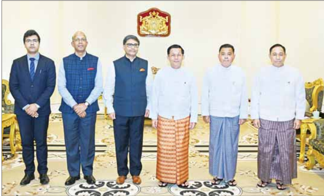
နိုင်ငံတော်စီမံအုပ်ချုပ်ရေးကောင်စီဥက္ကဋ္ဌ နိုင်ငံတော်ဝန်ကြီးချုပ် ဗိုလ်ချုပ်မှူးကြီး မင်းအောင်လှိုင်နှင့်အဖွဲ့ အိန္ဒိယနိုင်ငံ ဒုတိယအမျိုးသားလုံခြုံရေးဆိုင်ရာ အကြံပေးပုဂ္ဂိုလ် H.E. Mr. Vikram Misri ဦးဆောင်သော ကိုယ်စားလှယ်အဖွဲ့နှင့်အတူ စုပေါင်းမှတ်တမ်းတင်ဓာတ်ပုံရိုက်စဉ်။