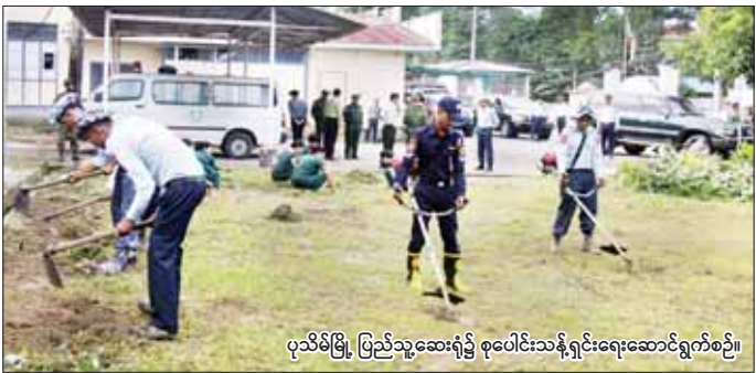
ပုသိမ်မြို့၊ ပြည်သူ့ဆေးရုံ၌ စုပေါင်းသန့်ရှင်းရေးဆောင်ရွက်စဉ်။

နေပြည်တော် အောက်တိုဘာ ၁၄ ယခုအချိန်အခါတွင် နိုင်ငံတော်စီမံအုပ်ချုပ်ရေး ကောင်စီ၏ ဦးဆောင်မှုနှင့်အတူ နိုင်ငံတစ်ဝန်းလုံး ၌ တပ်မတော်သားများ၊ ဌာနဆိုင်ရာအဖွဲ့အစည်းများ၊ ဒေသခံပြည်သူအားလုံးတို့က နိုင်ငံတော်ဖွံ့ဖြိုး တိုးတက်ရေးလုပ်ငန်းများကို ညီညွတ်ညွတ်ဖြင့် ဆောင်ရွက်လျက်ရှိကြပြီး အပတ်စဉ် နေ့နေ့တိုင်း တွင်လည်း မိမိတို့၏ မြို့၊ ရွာများရှိ ဆေးရုံ၊ ဆေးခန်း များ၌ ခြင်း၊ ယင် ပေါက်ပွားမှုမရှိစေရေးနှင့် ဆေးရုံ တက်ရောက်ကုသနေသော လူနာများအား လေကောင်း လေသန့် ရရှိစေရန် ချွံနွယ်၊ ပေါင်းမြက်များ ခုတ်ထွင် ရှင်းလင်းခြင်းများကို အားတက်သရော ဆောင်ရွက် လျက်ရှိသည်။