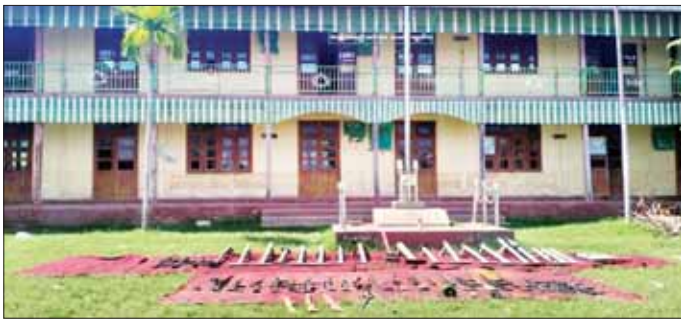
တန်းကျောင်း၌ ခို့အောင်းနေထိုင် ပြီး လက်နက်၊ ခဲယမ်းများ သိုဝှက် သိမ်းဆည်းထားကြောင်း သိရှိရ သဖြင့် လုံခြုံရေးတပ်ဖွဲ့ဝင်များက ယနေ့နံနက်ပိုင်းတွင် လိုအပ်သည့် နယ်မြေလုံခြုံရေး လုပ်ငန်းများ ဆောင်ရွက်ခဲ့ရာ နန်းဦးကျေးရွာရှိ အခြေခံပညာ အထက်တန်း ကျောင်းအတွင်းမှ PDF အမည်ခံ

နေပြည်တော် အောက်တိုဘာ ၁၄ နယ်မြေတည်ငြိမ်အေးချမ်းမှုကို ဖျက်ပြားစေသော လုပ်ရပ်များနှင့် အကြမ်းဖက် လုပ်ဆောင်မှုများကို လက်ခံနိုင်ခြင်းမရှိသည့် ဒေသခံ ပြည်သူ့အချို့၏ လျှို့ဝှက် ဆက်သွယ် သတင်းပေးပို့မှုအရ NUG CRPH တို့၏ ဆက်သွယ် ညွှန်ကြားမှုဖြင့် မကွေးတိုင်းဒေသ ကြီးအတွင်း အဖျက်အမှောင့် လုပ်ငန်းများ လုပ်ဆောင်နေသည့် PDF အမည်ခံအကြမ်းဖက်သမား များသည် ရေစကြိုမြို့နယ် နန်းဦး ကျေးရွာရှိ အခြေခံပညာ အထက်