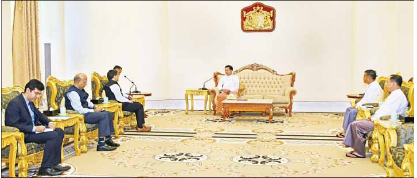
နိုင်ငံတော်စီမံအုပ်ချုပ်ရေးကောင်စီဥက္ကဋ္ဌ နိုင်ငံတော်ဝန်ကြီးချုပ် ဗိုလ်ချုပ်မှူးကြီး မင်းအောင်လှိုင် ထံ အိန္ဒိယနိုင်ငံ ဒုတိယအမျိုးသားလုံခြုံရေးဆိုင်ရာအကြံပေးပုဂ္ဂိုလ် H.E. Mr. Vikram Misri ဦးဆောင်သော ကိုယ်စားလှယ်အဖွဲ့ လာရောက်ဂရုပြုတွေ့ဆုံစဉ်။