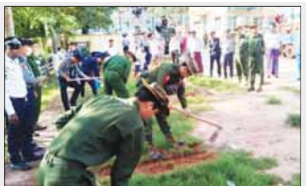
ကရင်ပြည်နယ် မြဝတီခရိုင် ခုတင်၂၀၀ဆံ့ ပြည်သူ့ဆေးရုံကြီးဝင်း၌ သန့်ရှင်းသာယာလှပစေရေး အောက်တိုဘာ ၁၄ ရက် နံနက်ပိုင်းက တပ်မတော်သားများ၊ ဌာနဆိုင်ရာဝန်ထမ်းများ၊ မြို့နယ်ကြက်ခြေနီ တပ်ဖွဲ့ဝင်များ စုပေါင်းသန့်ရှင်းရေးဆောင်ရွက်ကြရာ သင်္ဃန်း ညီနောင်အခြေချ စစ်ဗျူဟာမှ စစ်ဗျူဟာမှူး ဗိုလ်မှူးကြီး ထွန်းထွန်း လတ်၊ ခရိုင်စီမံအုပ်ချုပ်ရေးအဖွဲ့မှ အဖွဲ့ဝင် (၁) ဒုတိယဗိုလ်မှူးကြီး နိုင်ဝင်းနှင့် အဖွဲ့ဝင်များ ကြည့်ရှုအားပေးစဉ်။ ဇေဖြူဝင်း(ပြန်/ဆက်)

အား သွားရောက်တွေ့ဆုံအားပေးပြီးထောက်ပံ့ ပစ္စည်းများ ပေးအပ်ကြောင်း သိရသည်။ ခရိုင် (ပြန်/ဆက်)