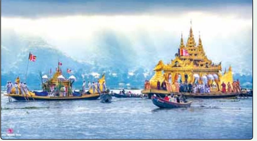
ငယ်ချောင်းကျောင်းမှ ကြေးစားကျောင်းသို့ အင်းလေးဖောင်တော်ဦးဘုရား ဒေသစာရီလှည့်လည်ကြချီတော်မူလာသည့် မြင်ကွင်းကို ကိုဗစ်-၁၉ မဖြစ်ပွားမီကာလက တွေ့ရစဉ်။

“အင်းလေးဖောင်တော်ဦးမြတ်စွာဘုရား ရုပ်ရှင်တော်မြတ်လေးဆူကို သီတင်းကျွတ်လဆန်း ၁ ရက် (အောက်တိုဘာ ၁၅ ရက်) မှ သီတင်းကျွတ်လပြည့်ကျော် ၃ ရက် (နိုဝင်ဘာ ၁ ရက်) အထိ ၁၈ ရက်ကြာအောင် အင်းလေးဒေသအတွင်း လှည့်လည်ကြချီအပူဇော်ခံမှာ ဖြစ်ပါတယ်။ သီတင်းကျွတ်လဆန်း ၁ ရက် (အောက်တိုဘာ ၁၅ ရက်) နံနက်ပိုင်းမှာ အင်းလေးဒေသ နမ့်ဟူးရွာရှိ ရတနာစံကျောင်းတော်ကြီးမှ ဒေသစာရီ စတင်လှည့်လည်ကြချီအပူဇော်ခံပွဲ အခမ်းအနားကို ကျင်းပမှာ ဖြစ်ပါတယ်”