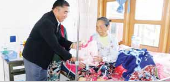
များ ပေးအပ်သည်။ ဆက်လက်၍ ပြည်နယ်ဝန်ကြီးချုပ်က ဟားခါးပြည်သူ့ဆေးရုံကြီး၌ အတွင်းလူနာ အဖြစ် ဆေးကုသမှုခံယူနေသော လူနာများ

ဟားခါး အောက်တိုဘာ ၁၅ ချင်းပြည်နယ်ဝန်ကြီးချုပ် ဒေါက်တာ ဝန်ဆွန်း ထန်၊ ပြည်နယ်ဝန်ကြီးများနှင့် စစ်ဗျူဟာ အခြေချ (ဟားခါး) မှ စစ်ဗျူဟာမှူး ဗိုလ်မှူးကြီး ဟိန်းထက်အောင်တို့သည် ဟားခါးမြို့ရှိ ဌာနဆိုင်ရာဝန်ထမ်းများပူးပေါင်း၍ အောက်တို ဘာ ၁၄ ရက် နံနက်ပိုင်းက ဟားခါးပြည်သူ့ ဆေးရုံကြီး၌ စုပေါင်းသန့်ရှင်းရေး ဆောင်ရွက် နေမှုကို သွားရောက်ကြည့်ရှုသည်။ ထို့နောက် ပြည်နယ်ဝန်ကြီးချုပ်နှင့်အဖွဲ့ ဝင်များသည် ဟားခါးပြည်သူ့ဆေးရုံအုပ်ကြီး၊ ကျန်းမာရေးဝန်ထမ်းများနှင့် ဆေးရုံကြီး တွင် တွဲဖက်တာဝန်ထမ်းဆောင်နေကြသော တပ်မတော်ဆရာဝန်ကြီးများအား တွေ့ဆုံ အားပေးစကားပြောကြားပြီး ထောက်ပံ့ပစ္စည်း