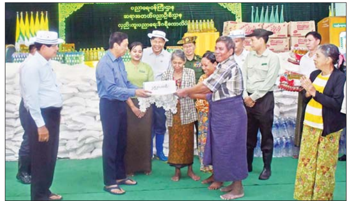
ရေလျှံဖြစ်ပေါ်နေမှုအခြေအနေ၊ ကူညီကယ်ဆယ်ရေးလုပ်ငန်းများ ဆောင်ရွက်နေမှုအခြေအနေများကို ဆွေးနွေးသည်။ ယာယီခိုလှုံ့လျက်ရှိ ထိုနောက်ပြည်ထောင်စုဝန်ကြီးက ပညာအားမာန် ခန်းမအတွင်း ယာယီလာရောက်ခိုလှုံ့လျက်ရှိကြသော ရေဘေးရှောင်အိမ်ထောင်စု ၂၄၆၉ စုမှ ရေဘေးသင့် ပြည်သူ ၁၂၀၀ အတွက် စုစုပေါင်းဆန်ရိက္ခာဖိုးငွေကျပ် ၂၅၂၀၀၀၀ ထောက်ပံ့ပေးအပ်သည်။ (အပေါ်ပုံ) သတင်းစဉ်

ပြီး ပညာမှန်ပရိယတ္တိစာသင်တိုက် ရေဘေးရှောင်ကယ်ဆယ်ရေးစခန်းရှိ အိမ်ထောင်စု ၂၄၅ စုမှ လူဦးရေ ၁၀၉၉ ဦးအတွက် ဆန်ရိက္ခာဖိုးထောက်ပံ့ပေးပေးခဲ့ပြီး ၂၃၀၇၉၀၀ နှင့် ဆောက်လုပ်ရေးအတွက် အာဟာရမုန့်များပေးပေးပြီး အားပေးစကားပြောကြားသည်။ ထောက်ပံ့ပေးအပ်ပဲခူးမြို့၌ ယနေ့အထိ ရေဘေးရှောင်ကယ်ဆယ်ရေးစခန်း ၄၁ ခုမှ ရေဘေးသင့် အိမ်ထောင်စု ၄၆၀၀ စု၊ လူဦးရေ ၁၉၀၀၉၉ ဦးအတွက် စုစုပေါင်းဆန်ရိက္ခာဖိုး ထောက်ပံ့ပေးပေးခဲ့ပြီး ၂၃၉၂၁၅၀၀ နှင့် ဆောက်လုပ်ရေးအတွက် ထောက်ပံ့ပေးအပ်ပြီးဖြစ်သည်။ ဆက်လက်၍ ပြည်ထောင်စုဝန်ကြီးသည် ရန်ကုန်တိုင်းဒေသကြီး ဝန်ကြီးချုပ် ဦးစိုးသိန်း၊ တိုင်းဒေသကြီးအစိုးရအဖွဲ့ဝင် ဝန်ကြီးများ၊ တာဝန်ရှိသူများနှင့် လှည်းကူးပညာရေး ဒီဂရီကောလိပ်တွင် တွေ့ဆုံ၍ ငမိုးရိပ်ချောင်းမြေကြက်မွန်နှင့် မိုးသည်းထန်စွာ ရွာသွန်းမှုတို့ကြောင့် လှည်းကူးမြို့၌ ရေကြီး