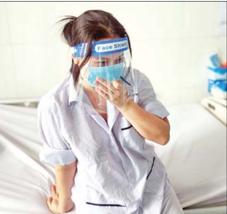
ဗီယက်နမ်နိုင်ငံ၌ မျောက်ကျောက်ရောဂါ ကူးစက်ဖြစ်ပွားသူတစ်ဦး။

ရောဂါကူးစက် ဖြစ်ပွားသူ အားလုံးကို သီးသန့်ခွဲခြားထားကြောင်း၊ ဒေသအာဏာပိုင်များ အနေဖြင့် ရောဂါဖြစ်ပွားမှုကို ဆောလျင်စွာ သိရှိနိုင်ရန်အလို့ငှာ ကြီးကြပ်ကွပ်ကဲမှုအားကောင်းစေရေး လုပ်ဆောင်လျက်ရှိပြီး လူနာများကိုလည်း အချိန်မီကုသမှု