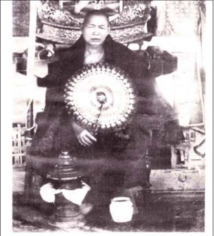
မန်လည်ဆရာတော်ဘုရားကြီး ပုံတော်

မြန်မာစာပုံနှိပ်သမိုင်းတွင် ရေးရေးပေမူများကို နောင်တွင် စာရွက် နှင့် ရေးကူးပုံနှိပ်ကြခြင်းဖြစ်သည်။ ထိုခေတ်ကာလအချိန်တွင် စက္ကူ စာရွက်များပေါ်နေပေပြီ။ ဆရာတော်သည် ဤမဟာသုတကာရီ လင်္ကာသစ်ကျမ်းကြီးကို မိမိလက်ရေးဖြင့် နမောတသမုစတင်၍ နိဂုံးအဆုံးတိုင် ဗလာစာအုပ်ပေါ်တွင် ရေးသားတော်မူခဲ့ပေသည်။