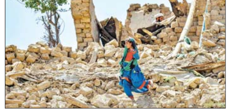
ဟိုရတ်သို့ စေလွှတ်ခဲ့ကြောင်း တာလီဘန်အရာရှိများက ပြောကြားခဲ့သည်။

အာဖဂန်နစ္စတန်နိုင်ငံ၌ အင်အားပြင်းငလျင်များလှုပ်ခဲ့ပြီး လူထောင်ပေါင်းများစွာ သေဆုံးပြီးနောက် သုံးရက်ကြာသည့်တိုင် ကယ်ဆယ်ရှာဖွေရေးလုပ်ငန်းများကို ဆက်လက် လုပ်ဆောင်လျက်ရှိသည်။