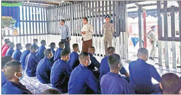
စစ်ဆေးတွေ့ရှိချက်နှင့် အကြံပြုချက်များကို မြန်မာနိုင်ငံ အမျိုးသားလူ့အခွင့်အရေးကော်မရှင်မှ အရေးယူဆောင်ရွက်ပေးနိုင်ရေးအတွက် သက်ဆိုင်သိရသည်။ ရာသို့ အကြံပြုပေးပို့သွားမည့် ဖြစ်ကြောင်း သတင်းစဉ်

ထို့နောက် အကျဉ်းထောင်ကို ကြည့်ရှုစစ်ဆေးစဉ် အကျဉ်းသား၊ အကျဉ်းသူ၊ အချုပ်သား၊ အချုပ်သူများ၏ အိပ်ဆောင်များ၊ ဆေးခန်း၊ စာကြည့်တိုက်၊ စားဖိုကြီး၊ ရိက္ခာဂိုဒေါင်၊ ရေသန့်စက်၊ သုံးရေကန်များ၊ အတွင်း၊ အပြင် မိလ္လာများ သန့်ရှင်းမှု ရှိ မရှိ တို့ကို ကြည့်ရှုစစ်ဆေးသည်။ ယင်းနောက် အကျဉ်းသား၊ အကျဉ်းသူ၊ အချုပ်သား၊ အချုပ်သူများ လေ့လာဖတ်ရှုနိုင်ရန်အတွက် ဗဟုသုတရဖွယ်ရာ စာအုပ်စာပေများကို ကော်မရှင်က လှူဒါန်းခဲ့ရာ မအူပင်အကျဉ်းထောင် တာဝန်ခံအရာရှိက လက်ခံရယူသည်။ ကြည့်ရှုစစ်ဆေးရေးအဖွဲ့၏ ခရီးစဉ်အတွင်း