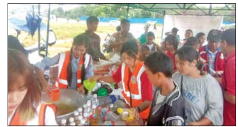
အမှန်တကယ်အခက်အခဲရှိနေတဲ့ အသက်ကြီးပိုင်းတွေ၊ မသန်စွမ်းဖြစ်နေသူတွေနဲ့ ဆင်းရဲနွမ်းပါးသူတွေကို စာရင်းကောက်ယူပြီးမှ လှူဒါန်းပေးခဲ့တာပါ။ လိုအပ်တဲ့နေရာတွေမှာ ပိုင်းဝန်းကူညီဆောင်ရွက်ပေးဖို့အတွက်လည်း လူမှုကူညီရေးအသင်းတွေကို အကူအညီတောင်းရတာဖြစ်ပါတယ်။ နောက်ထပ်လည်း အတတ်နိုင်ဆုံး လှူဒါန်းပေးနိုင်အောင် ကြိုးစားသွားမှာပါ”ဟု ပြောကြားသည်။