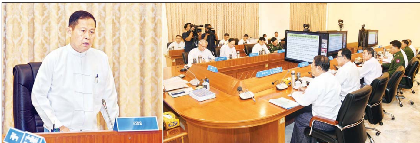
နိုင်ငံတော်စီမံအုပ်ချုပ်ရေးကောင်စီဒုတိယဥက္ကဋ္ဌ ဒုတိယဝန်ကြီးချုပ် ဒုတိယဗိုလ်ချုပ်မှူးကြီး စိုးဝင်း ၂၀၂၄ ခုနှစ်၊ (၇၆) နှစ်မြောက် လွတ်လပ်ရေးနေ့ ကျင်းပရေးဗဟိုကော်မတီ ပထမအကြိမ် ညှိနှိုင်းအစည်းအဝေးတွင် အမှာစကားပြောကြားစဉ်။