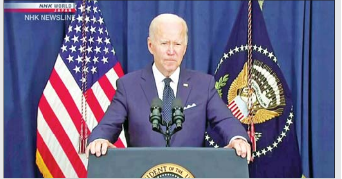
နိုင်ငံသား ၃၀၀၀၀ ကျော်ရှိကြောင်း သိရသည်။ အာဂျင်တီးနား နိုင်ငံခြားရေးဝန်ကြီးဌာနကလည်း အစ္စရေးနိုင်ငံတောင်ပိုင်းတွင် နေထိုင်သည့် ပြောကြားသည်။ အာဂျင်တီးနားအမျိုးသားတစ်ဦးလည်း ဟားမားစ်၏ တိုက်ခိုက်မှုအတွင်း သေဆုံးကြောင်း အတည်ပြုအင်န်အိတ်ချ်ကေ

ဖိလစ်ပိုင်နိုင်ငံသား ခုနစ်ဦး ပျောက်ဆုံးဖိလစ်ပိုင် နိုင်ငံခြားရေးဝန်ကြီးဌာနကလည်း အစ္စရေးနိုင်ငံ၌ နေထိုင်သည့် ဖိလစ်ပိုင်နိုင်ငံသား ခုနစ်ဦးလည်း ပျောက်ဆုံးနေကြောင်း အောက်တိုဘာ ၉ ရက်တွင် ပြောသည်။ ထို့ပြင် ဖိလစ်ပိုင် အစိုးရ၏ ထုတ်ပြန်ချက်အရ ရွှေ့ပြောင်းလုပ်သားများအပါအဝင် အစ္စရေး၌ နေထိုင်သည့် ဖိလစ်ပိုင်